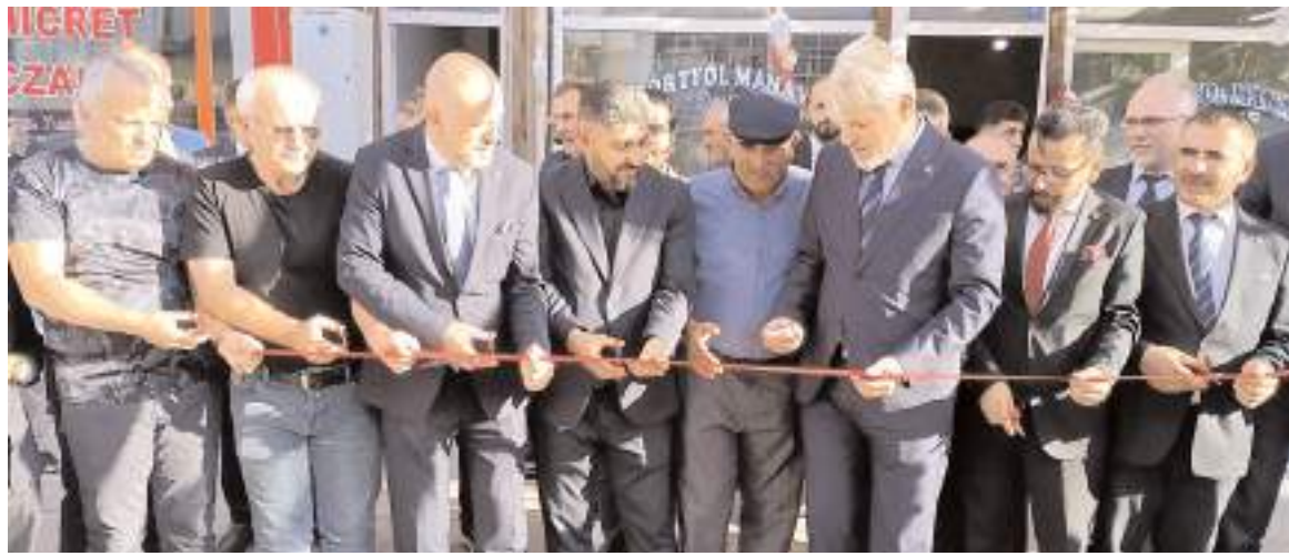
Yapılan duanın ardından açılış kurdelesi kesildi.