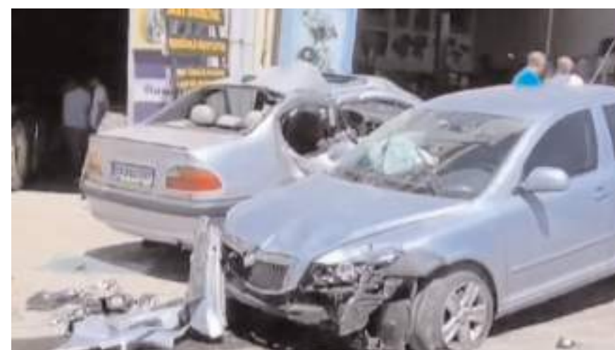
Olay Küçük Sanayi Sitesi'nde meydana geldi.

Kazada yaralanan sürücü, sağlık ekiplerince Hitit Üniversitesi Erol Olçok Eğitim ve Araştır-