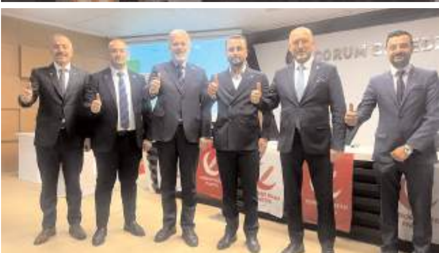
Partiye yeni katılanlara rozetleri takıldı.