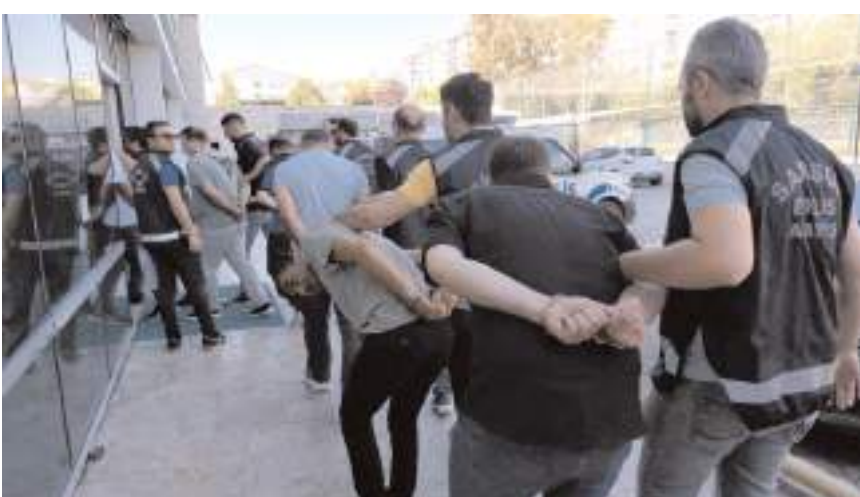
Adliye sevk edilen 4 kişi tutuklanırken, 13 kişi ise adli kontrol şartıyla serbest bırakıldı.

Edinilen bilgiye göre, Samsun Cumhuriyet Başsavcılığı koordinesinde Samsun Emniyet Müdürlüğü Asayiş Şube Müdürlüğü ekiplerince eş zamanlı operasyon düzenlendi. Farklı marka ve modeldeki yanı sıra, yakalamalı/hacizli ve enkaz altından çıkarılan ağır hasarlı araçların, motor ve şase numaraları ile orijinal özelliklerini değiştirerek; Bulgaristan'dan getirilen gümrük kaçağı ve piyasa