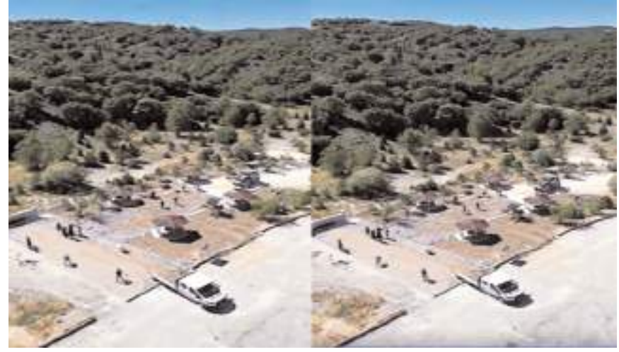
Proje toplam 500 m2 alanda hayata geçiriliyor.

Toplam 500 m2 alanda yapılan çalışma kapsamında 4 adet kamerye, 2 adet piknik masası, Şehit Anıtı, çevre düzenlemesi ve çeşme kaplama işi yapılıyor. Koparan mevkinde oluşturulacak mini dinlenme alanının 15 Temmuz'a kadar tamamlanarak açılması bekleniyor.