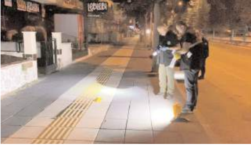
Polis ekipleri olay yerinde inceleme yaptı.

Olay, Buharaevler Mahallesi Doktor Sadık Ahmet Caddesi'nde meydana geldi. Edinilen bilgiye göre, kız meselesi yüzünden daha önce aralarında husumet bulunan S.D. (16), B.D. (16) ve A.D. (17) ile G.T. (28), G.T. (19) arasında tartışma çıktı. Tartışmanın büyümesi üzerine çıkan kavgada taraflar üzerlerinde bulundurduğu bıçaklarla bir birlerini