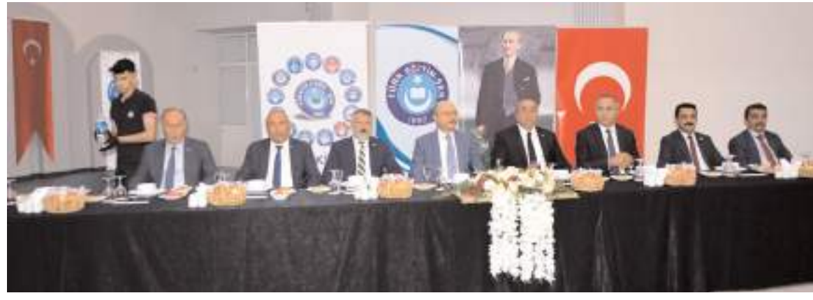
Merkez ilçede yetkili sendika olan Türk Eğitim Sen, 'Yetki Şöleni' düzenledi.

MHP Çorum Milletvekili Vahit Kayıncı ise, "Dava arkadaşlarımızın haklı olduğu davada hakına el uzatanın elini, dil uzatanın dilini koparırım. Bu can bu bedende kaldığı müddetçe Türk milliyetçileri ve vatan sevdalıları olarak aynı çizideyiz. Teşkilatlarımızdan gelen her türlü problemleri gücümüz yettiğince taşıyıp, haklarını savunabilmek için elimizden gelen her şeyi yapacağız." şeklinde konuştu.