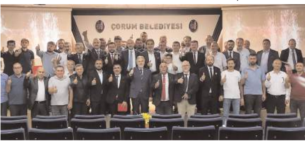
Toplantının sonunda toplu hatıra fotoğrafı çekildi.