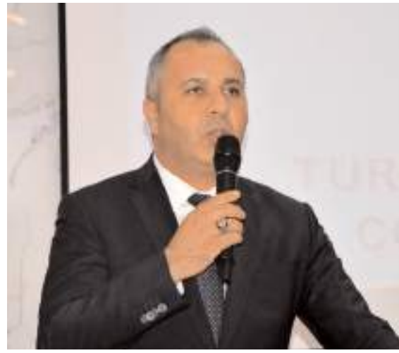
MHP İl Başkanı Mehmet İhsan Çıplak