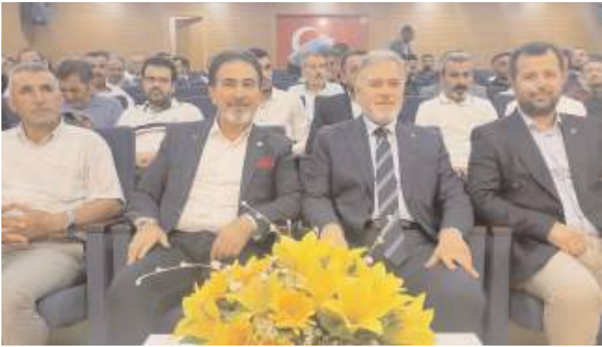
Yeniden Refah Partisi İl Teşkilatının divan toplantısı yapıldı.