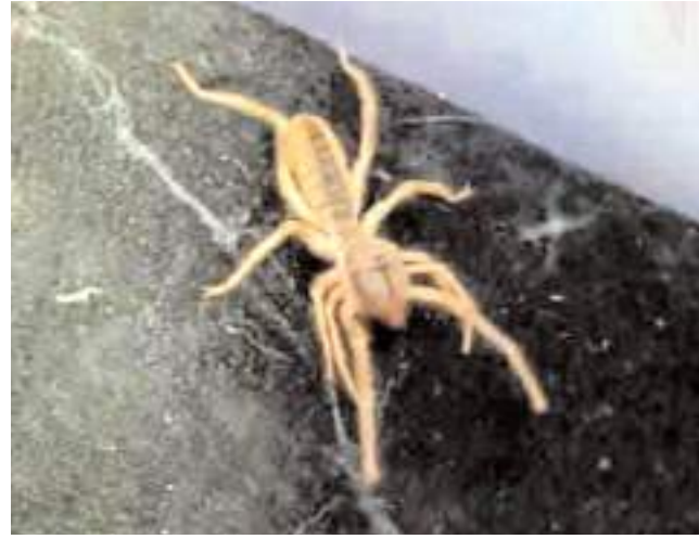
'Sarı kız örümceği' 13 santimetreye kadar uzunluğa ulaşabiliyor.

Sungurlu'da güçlü zehre sahip olan, bir metre yükseğe kadar zıplayabilen ve akrep avlayabilen 'sarıkız' cinsi örümcek tekrar görüldü.