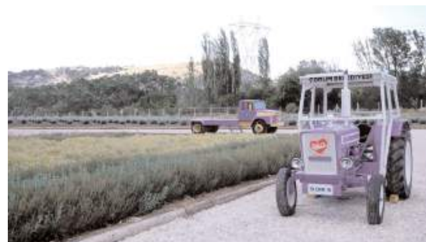
Lavanta Bahçesi, Cumartesi günü açılacak.