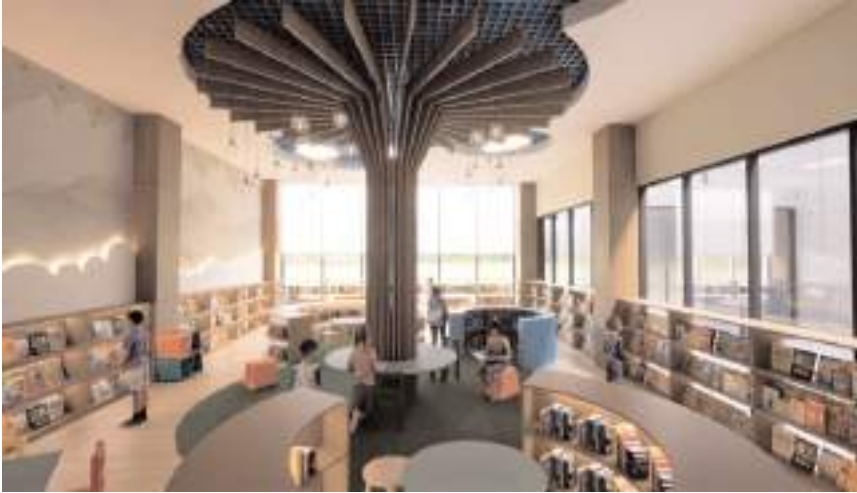
Merkezde çok sayıda bölüm bulunuyor.