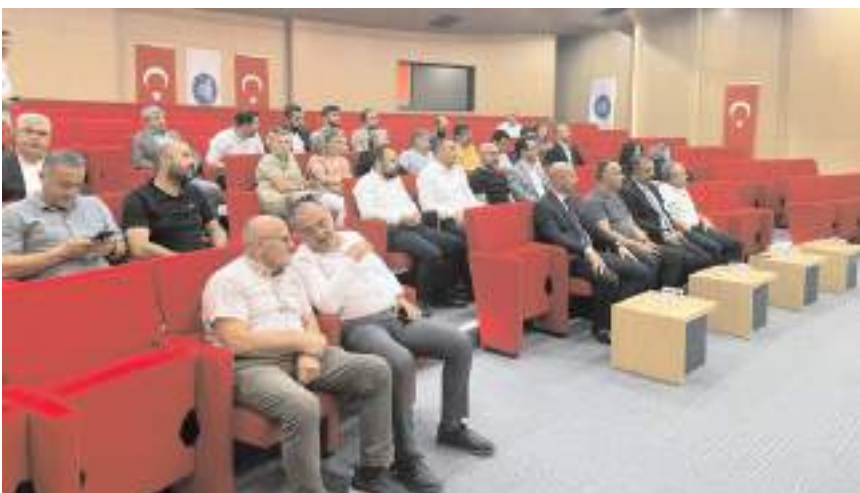
Kent Konseyi'nin Olağan Genel Kurul Toplantısı, Çorum Belediye Konferans Salonu'nda yapıldı.