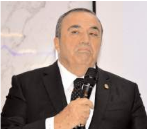
MHP Çorum Milletvekili ve Genel Sekreter Yardımcısı Vahit Kayıncı