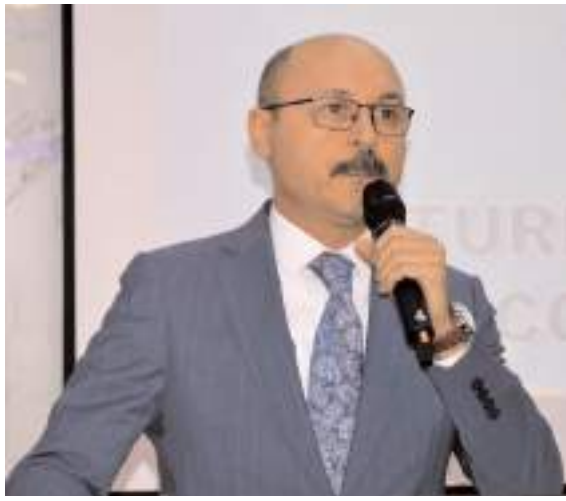
Türk Eğitim Sen Genel Başkanı Talip Geylan