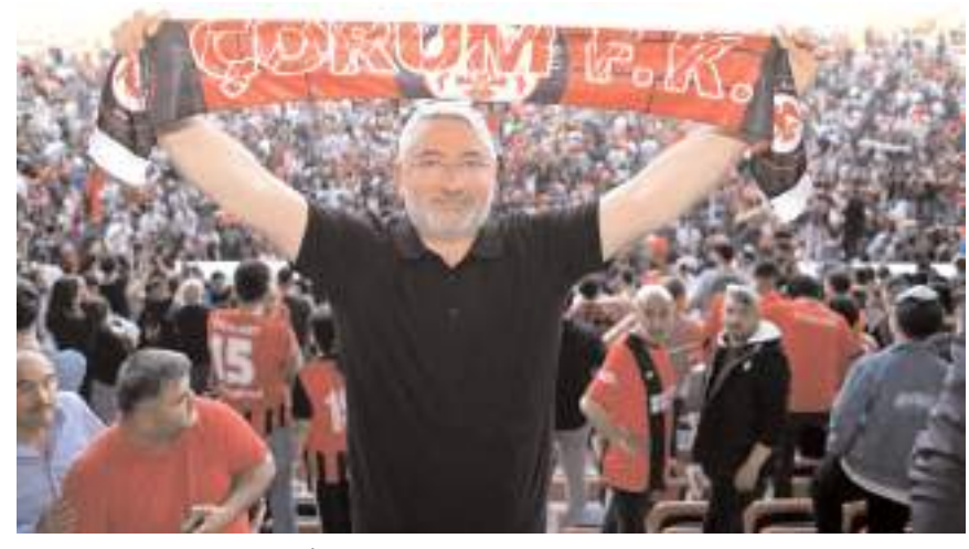
Belediye Başkanı Dr. Halil İbrahim Aşgın tüm Çorumluları kulübe destek vermeye çağırıyor

Çorum FK için birlik ve beraberlik çağrısı da yapan Aşgın "Şehrimizin tüm dinamikleriyle, taraftarıyla, iş dünyasıyla, STK'larıyla, siyasilereyle, bürokratiyle el ele verelim. Hedefimiz Süper Lig olsun. Bu yolda kulübümüzü yalnız bırakmayalım. Çorum FK'nın başarısı tüm şehrimizin başarısıdır. Çorum FK bizim en önemli markalarımızdan birisidir. Bu markamızı en yükseğe çıkarmak için, haydi Çorum, el ele hep birlikte Süper Lig'e" şeklinde konuştu.