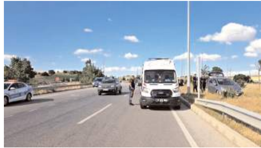
Kaza Çorum-Samsun kara yolu 10. kilometrede meydana geldi.

Kazada, uzman çavuş olduğu öğrenilen sürücü ile araçta bulunan eşi Gamze T. (28) ve 5 yaşındaki oğlu Kerem Asaf T. yaralandı.