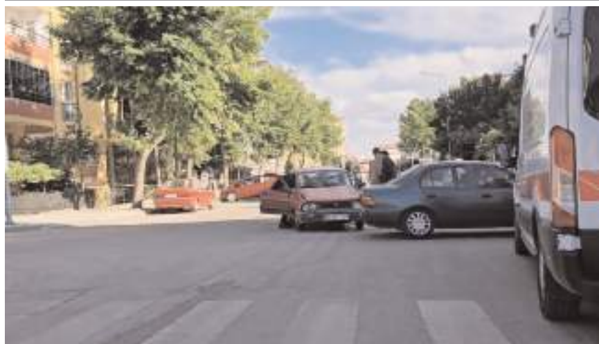
Kaza Ulukavak Mahallesi Alparslan Türkeş Caddesi'nde meydana geldi.

Çorum'da iki aracın çarpıştığı trafik kazasında 1 kişi yaralandı.