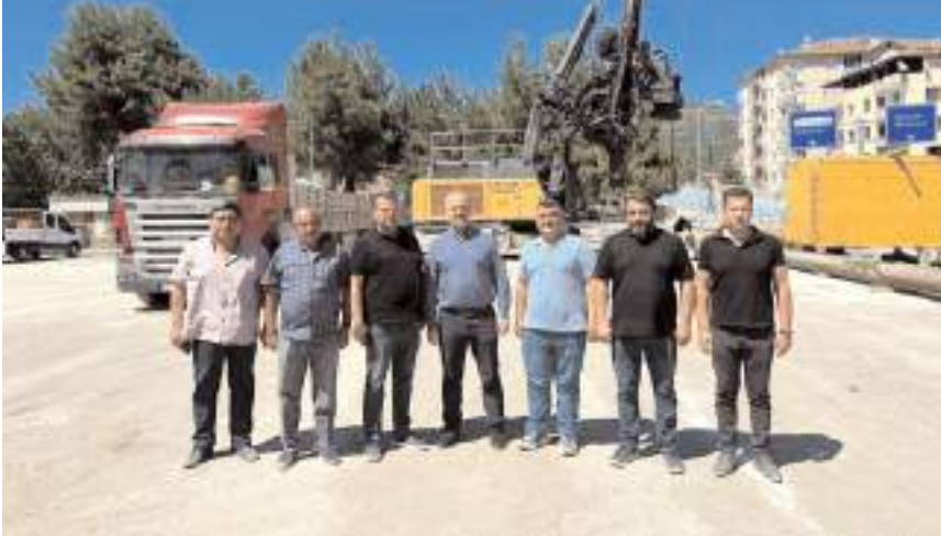
Şehit Şenay Aybüke Yalçın Kütüphanesi ve Kongre Merkezinin çalışmaları başladı.