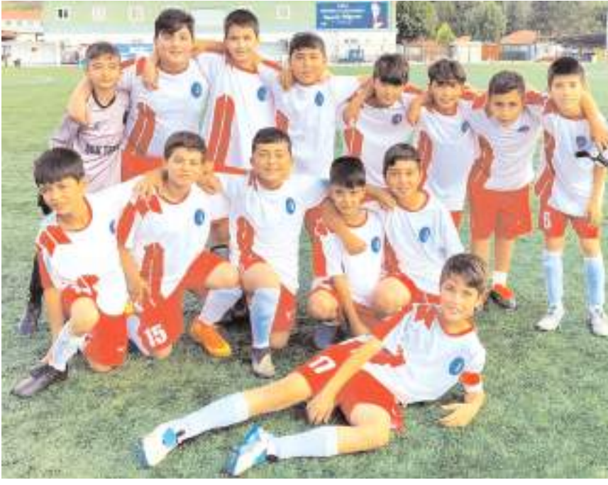
Hattuşaspor penaltılarda kazanarak yarı finale yükselmeyi başardı

U 11'de yarı final maçları 5 Temmuz cuma günü oynanacak. Saat 16.30'da Çorum Anadolu FK ile HE Kültürspor ilk finalist olmak için mücadele edecek. Saat 18'de ise Hattuşa Gençlikspor ile yarın oynanacak Vefa Gençlikspor-1907 Gençlikspor maçının galibi diğer yarı finalistini belirleyecek.