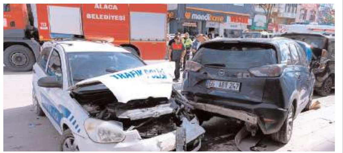
Kaza, Alaca'da Zile Caddesi'nde meydana geldi.

Gözaltına alınan 30 şüpheliden 13'ü ifadelerinin ardından serbest bırakılırken, sorguları tamamlanan 17 kişi de bugün Samsun Adliyesine sevk edildi. Nöbetçi mahkemeye ifade veren 4 kişi mahkemeye tutuklanarak Samsun T Tipi kapalı Cezaevine gönderilirken, 13 kişi ise adli kontrol şartıyla serbest bırakıldı. (İHA)