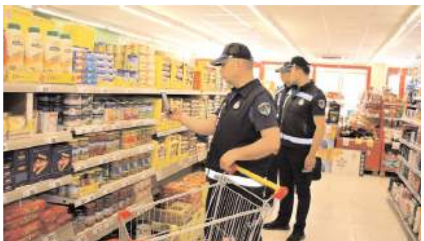
Ekipler ürünlerin etiketlerini kontrol etti.

Denetimler kapsamında raf fiyatı ile kasa fiyatı arasında farklılık olup olmadığını, ürünlerin gramajını ve son kullanma tarihlerini inceleyen ekipler, hijyen kurallarına uygunluk konusunda da işletme sahiplerine uyarılarda bulunuyor. (İHA)