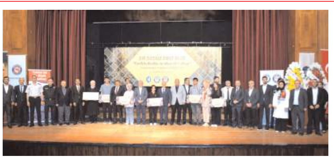
Ödül töreninin sonunda toplu hatıra fotoğrafı çekildi.