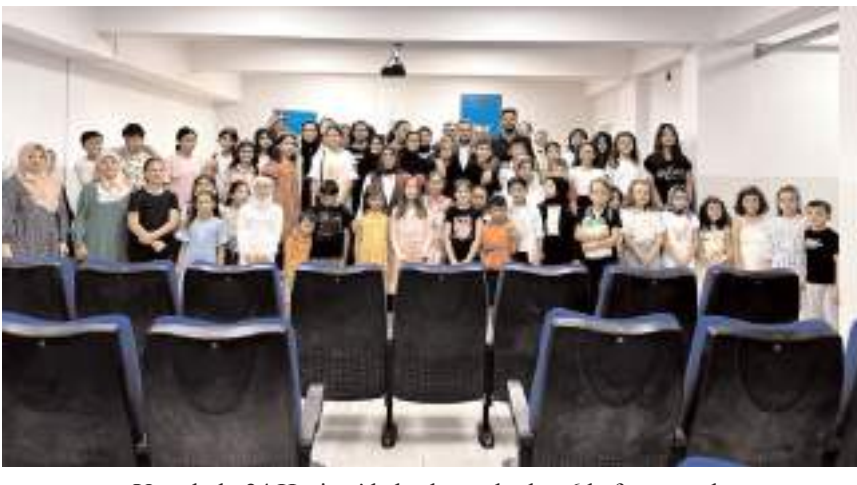
Yaz okulu 24 Haziran'da başlayacak olup 6 hafta sürecek.