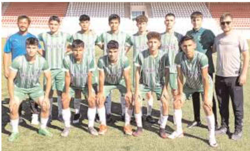
Mimar Sinan U 17 takımı Bolu grup merkezinde yarı final için mücadele edecek

10 Haziran pazarı günü yapılacak teknik toplantıda altı takım üçerli iki gruba ayrılacak ve tek devreli maçlar sonunda gruplarında ilk sırayı alan takımlar 14 Haziran'da yarı final grubuna yükselmek için finalde karşılaşacaklar.