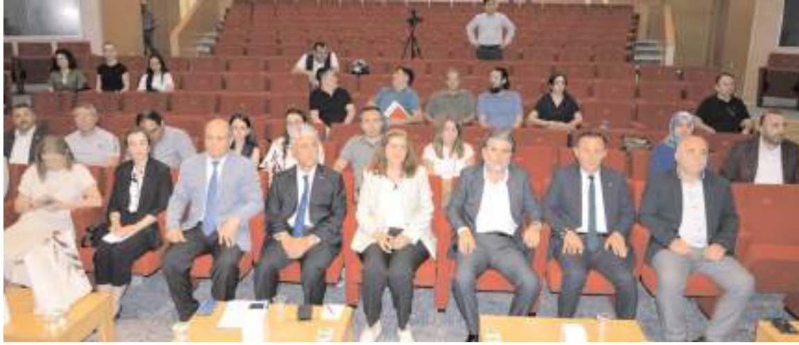
Panel MYO Yerleşkesi Ethem Erkoç Konferans Salonunda yapıldı.