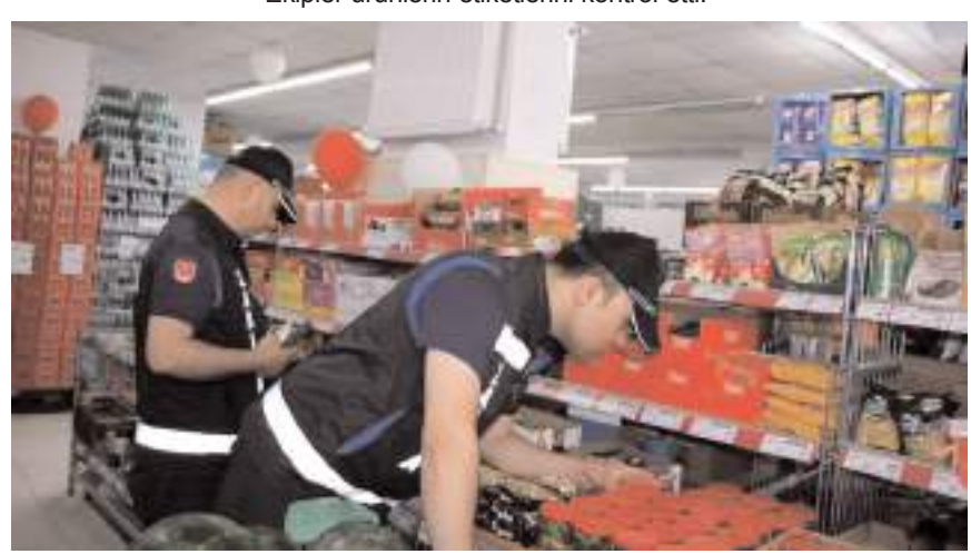
Zabıta ekipleri ürünlerin son kullanma tarihlerini kontrol etti.