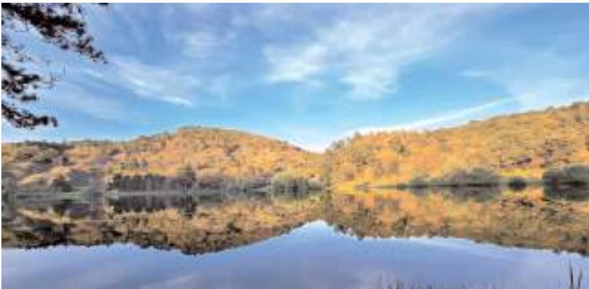
Hacılarhanı göleti, manzara, doğa yürüyüşleri, kamp ve piknik gibi aktiviteler için ideal bir ortam sunuyor.