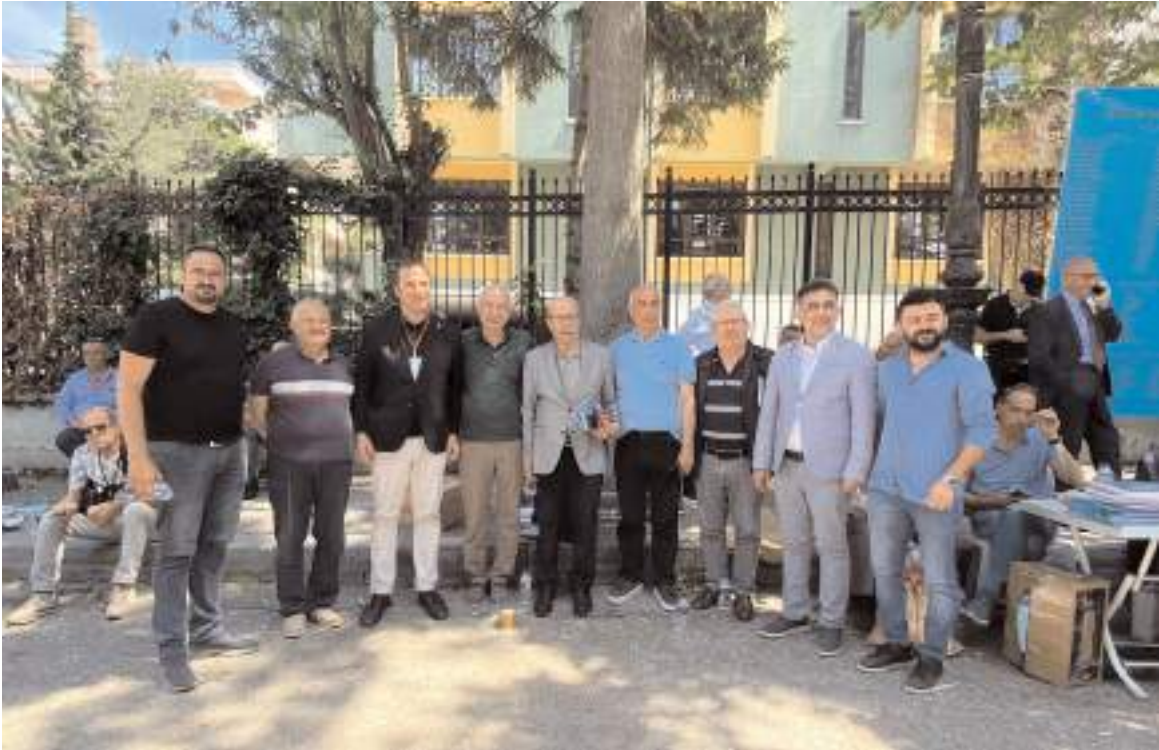
Genel kurula katılan Çorum ADD heyeti...

ÖZGÜN BESİCİLİK Büyükbaş kurbanlık satışlarımız başlamıştır. Veteriner hekim kontrolünde ve hijyenik şartlarda kesim ve pay yapılır. Tel: 0 532 707 47 24 Adres: Güveçli (Maza) Köyü ÇORUM