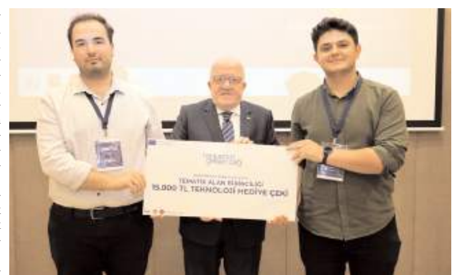
Derece elde eden takımları ödülleri verildi.