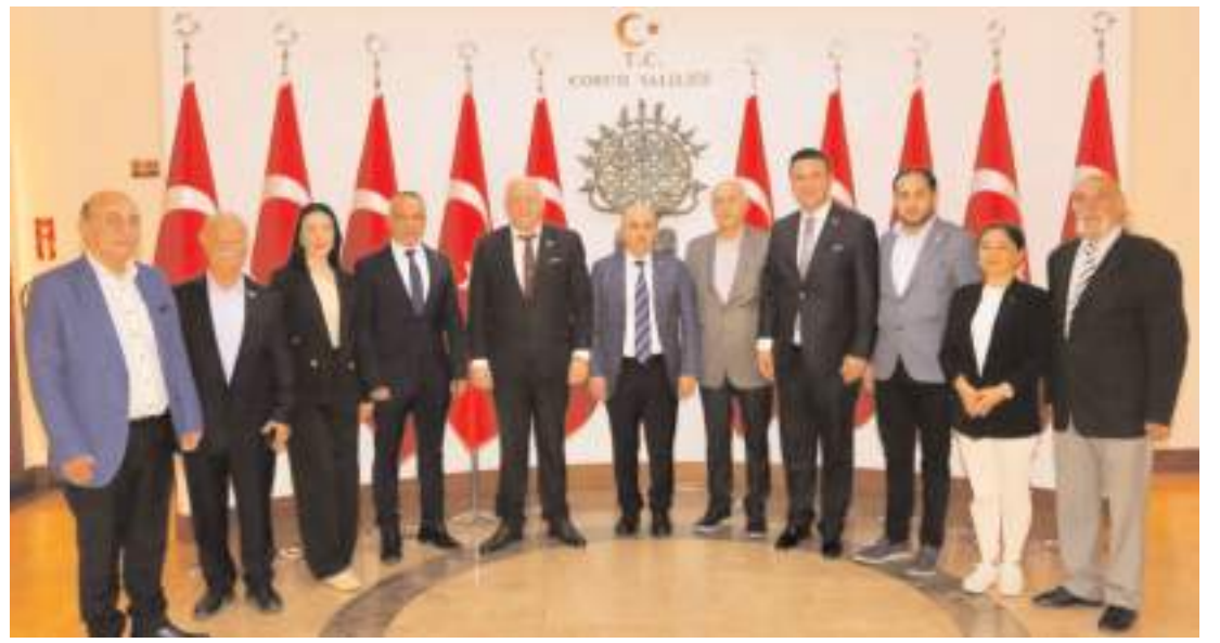
Dünya Çorumlular Konfederasyonu yönetimi Vali Doç. Dr. Zülkif Dağlı'yı ziyaret etti.

"Paşa" adını verdiği kurbanlığın 3 yaşında olduğunu belirten Kaya, "Kurbanlığımız üç yaşında. Bir yıl anne sütü beslendi. Vücut gelişimi için de bir yılda merada otladı. Son bir yıldır da ahırda besliyoruz. Kurbanlığımızı biraz yonca, sanayi yemi ve arpa ezmesi ile besledik. Çiftliğimizin gözdesi olduğu için çocuklar da biraz daha fazla ilgi gösteriyor. Kurbanlığımız 1 ton ağırlığında. Bu ağırlık da az değil. 1 tonluk bir kurbanlık yetiştirmek de kolay değil. Sosyal medyada falan görüyoruz, 'benim danam şu kiloda' diye paylaşımlar yapıyor. Tartı burada, kurbanlığımız 1 ton" diye konuştu. (İHA)