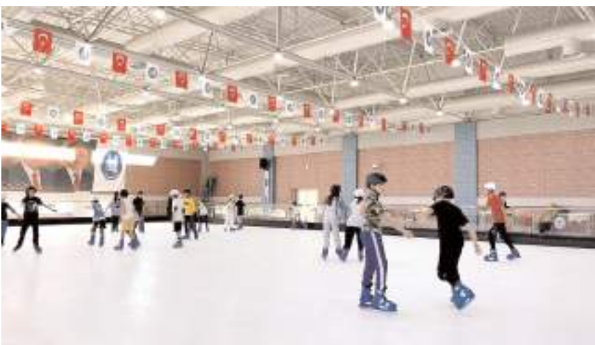
Yaz okulunda çeşitli sportif faaliyetler yapılacaktır.