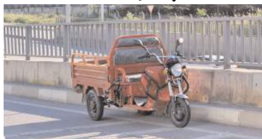
Kaza Burun Çiftlik Kavşağı'nda meydana geldi.

Yaralılar, sağlık ekiplerince Hitit Üniversitesi Erol Olçok Eğitim ve Araştırma Hastanesine kaldırıldı.(AA)