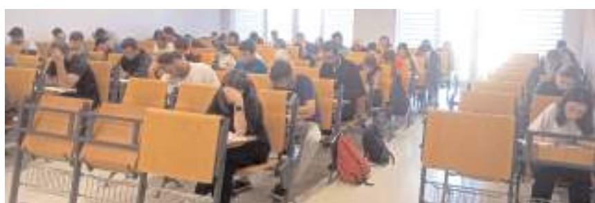
Seminer sonunda kursiyerler yazılı sınavdan geçtiler

120 kursiyer katıldığı Çocuk Atletizm Semineri Hitit Üniversitesi Spor Bilimleri Fakültesi spor salonu, ve sahasında yapıldı.