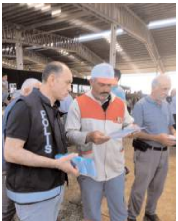
Polis ekipleri Hayvan Pazarında broşür dağıttı.

köylerin bir çoğunda filtrasyon yok bazı köylerde klorlama cihazları var. Bu su depolarını çok ihmal ediyoruz. Su depolarını Özel İdare yada şahıslar olarak yapıyor ama kontrolleri yapılmıyor. 70'li yıllarda yapılan su depoları var. Köylerimizin temiz içme suyuna kavuşması için Özel İdare olarak daha çok çalışma yapmalıyız. Köylerimizin bir çoğunda sular kuyulardan elde ediliyor." ifadelerini kullandı.