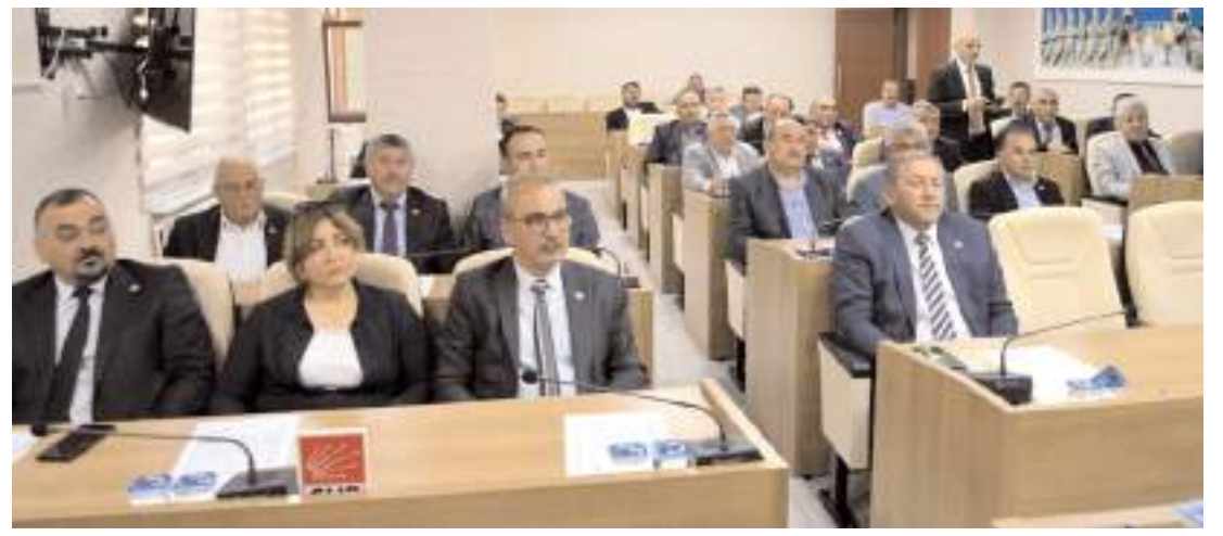
Toplantıda gündem maddeleri görüşülerek karara bağlandı.