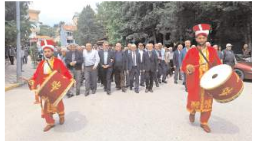
Mehteran eşliğinde Redif kışlasına yürüyüş yapıldı.