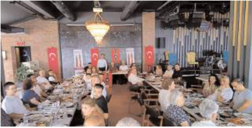
Buluşma Atatürk Parkında bulunan Hayal Kahvesinde yapıldı.

Çorum'u anlatan, tanıtan ve Antalya ile ortak yönlerini öne çıkararak medya araçları üretmeye dönük çalışmalarını da yapmaya başlamış bulunuyoruz" ifadelerini kullandı. (Haber Merkezi)