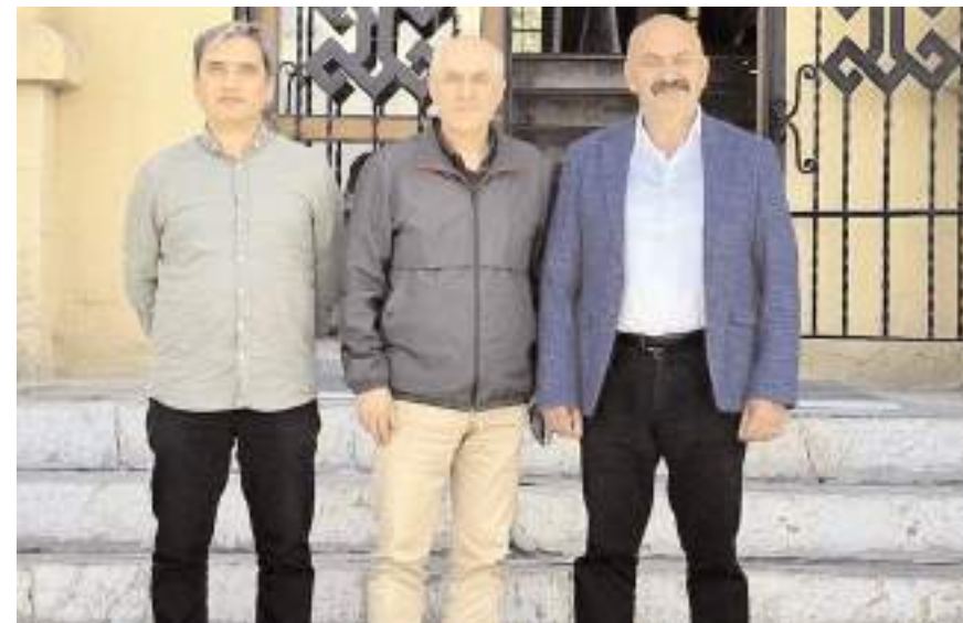
Toplantıda Yükderesi Göleti sulama kanallarının sit alanında kalan bölümleri konuşuldu.

Yükderesi Göleti proje ihalesinin gerçekleştirildiğini kaydeden Başkan İsbir, "Baraj yapım ihalesi aşamasına gelmiştir. Göletimiz sit alanı dışında ancak yaklaşık 5100 dönüm araziye sulayacak sulama kanallarımız kısmen 3. derece sit alanı içerisinde kalmaktadır. Yapım ihalesi aşamasına geçebilmemiz için Kültür ve Tabiat Varlıklarını Koruma Kurulu tarafından alınan