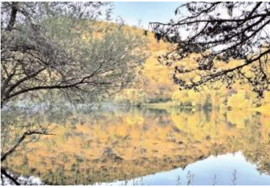
Hacılarhanı göleti, Sungurlu İlçe merkezine 30 kilometre mesafede bulunuyor.

Ziyaretçiler, göl kenarında piknik yaptıktan sonra patika yollardan yürüyerek, ağaç yaprakları nedeniyle neredeyse güneşin toprağa değmediği ormanı keşfetme imkanı buluyor. (İHA)