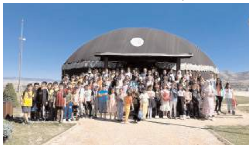
Dersler hafta içi her gün 30'er dakikalık 4 ders şeklinde programlandı.