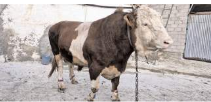
Paşa, son bir yıldır ahırda özel olarak besleniyor.

"Yetiştirdiğimiz hayvanlar ailenin bir ferdi"