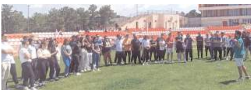
Çocuk Atletizm Eğitim seminerine katılan kursiyerler sahada uygulamalı derste