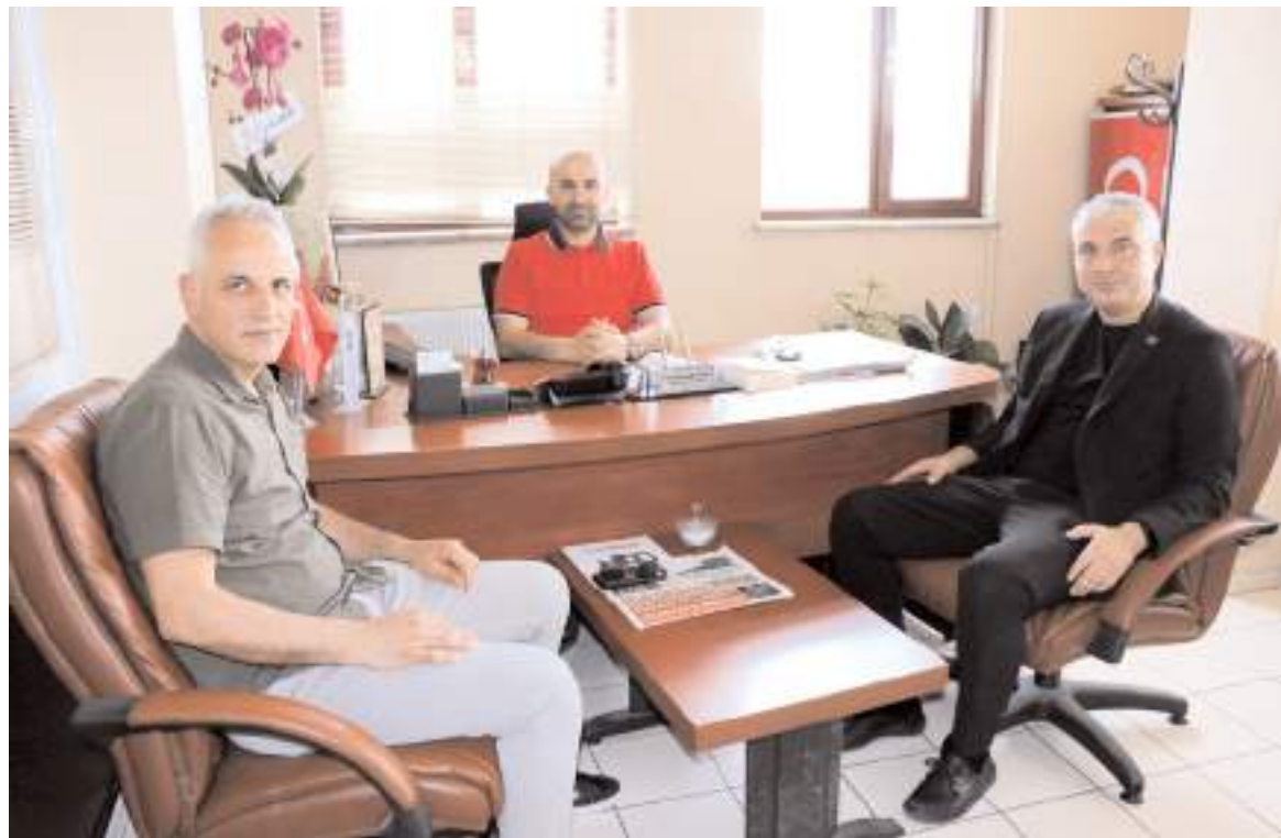
Ziyarette basın üzerine sohbet edildi.