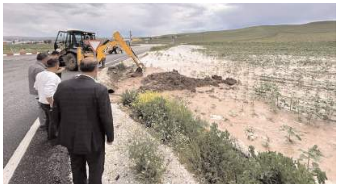
Alaca Belediye Başkanı Şerif Arslan taşkın yaşanan bölgelerde incelemelerde bulundu.