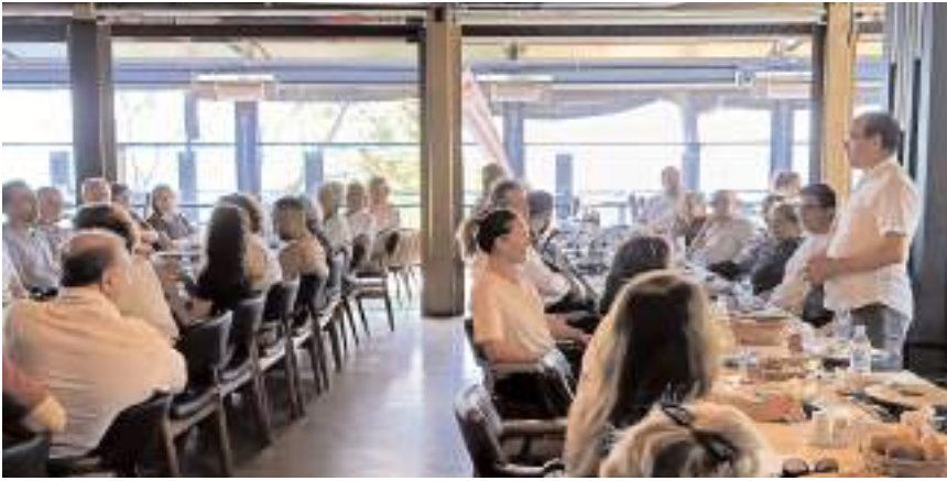
Konferansa katılım yüksek oldu.