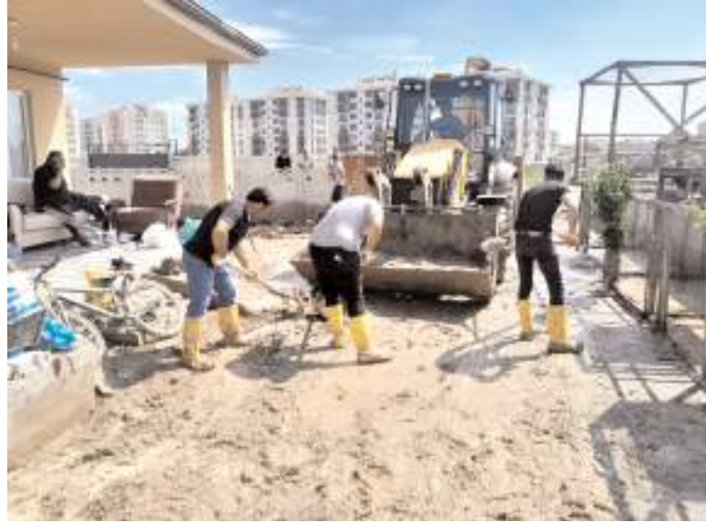
Belediye ekipleri su basan yerlerde balçık temizliği yapıyor.

Alaca'da, son birkaç gündür etkili olan yağış ve sonrasında oluşan selin verdiği zararları gidermek için belediye ekipleri aralıksız çalışıyor. İlçede selin etkili olduğu bölgelerde temizlik çalışmaları yürüten ekipler, zarar gören vatandaşların yaralarını sarmaya çalışıyor.