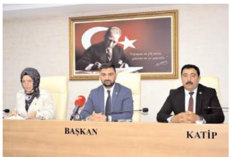
Toplantı Meclis Başkanı Muhammed Fatih Temur'un başkanlığında yapıldı.

Temur'un konuşmasının ardından konu oy birliğiyle Gençlik ve Spor Komisyonu'na havale edildi.