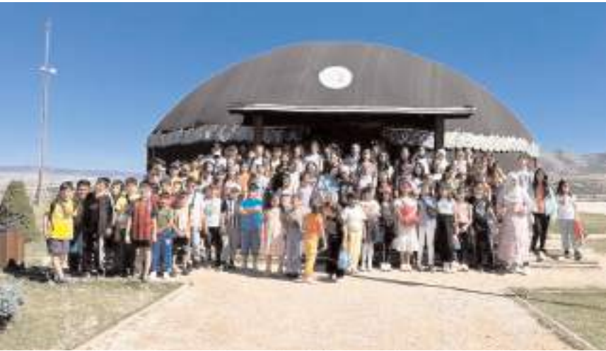
Dersler hafta içi her gün 30'ar dakikalık 4 ders şeklinde programlandı.