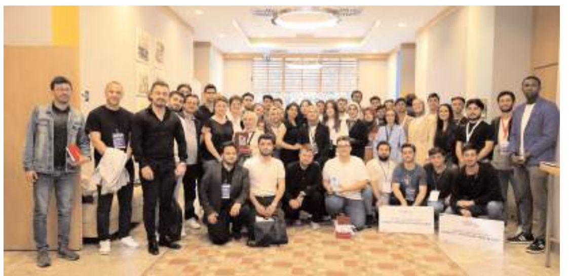
Yarışma Samsun Üniversitesi ve Samsun Ticaret ve Sanayi Odası tarafından düzenlendi.