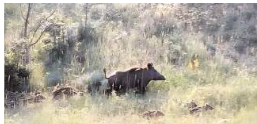
Vatandaşlar domuzları cep telefonu ile görüntüledi.

Osmancık'da Zeytin Deresi mevkiinde domuz sürüsü kameralara yansıdı. Ekili arazilerden geçen domuzlar arazilere zarar verirken, bir vatandaşın cep telefonu ile kaydedtiği görüntülerde annesi ile birlikte hareket eden yavru domuzlar ise dikkat çekti. (İHA)