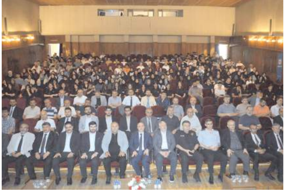
Yarışmanın ödül töreni ve konferans Devlet Tiyatro Salonunda gerçekleştirildi.

Bu muazzam tablonun ortaya çıkmasında en büyük pay sahibi olan başta adanmış öğretmenlerimize, projenin başlangıç aşamasında bugüne kadar destekleriyle çalışmalarımıza güç katan Sayın Valimize, kitapları temin ederek öğrencilerimizle buluşturan Sayın Belediye Başkanımıza, projemizin sorunsuz bir