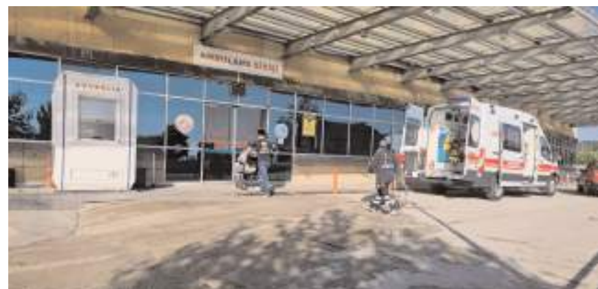
Yaralılar hastanede tedavi altına alındı.