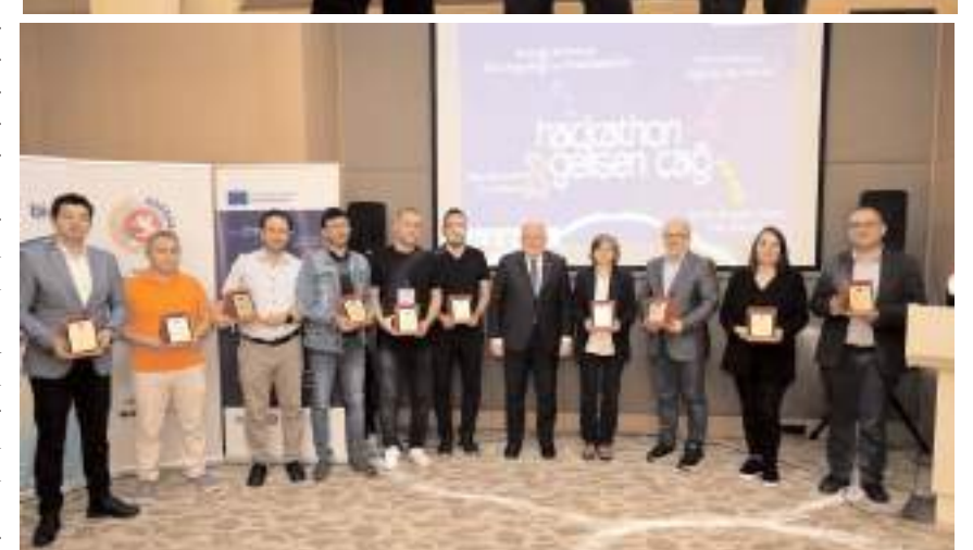
Yarışmaya toplam 21 takım ve 54 öğrenci katıldı.