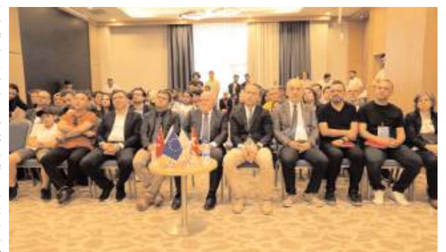
Program Samsun Üniversitesi Balıca Kampüsü Nuri Demirağ Konferans Salonu'nda yapıldı.