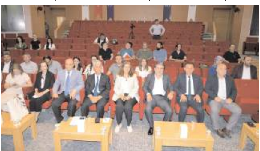
Panel MYO Yerleşkesi Ethem Erkoç Konferans Salonunda yapıldı.