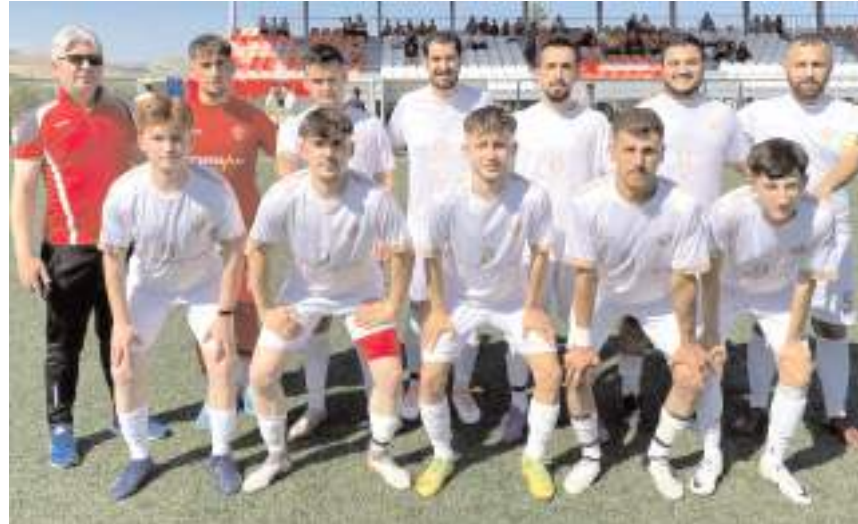
Osmancıkücü deplasmanda kazanarak yoluna kayıpsız devam etti