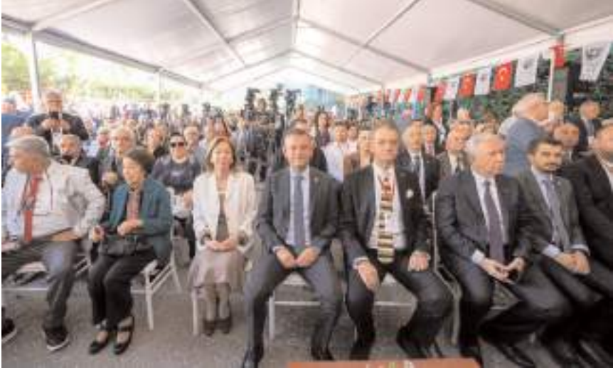
Genel kurul ADD Genel Merkezi Prof. Dr. Muammer Aksoy Yerleşkesi bahçesinde yapıldı.