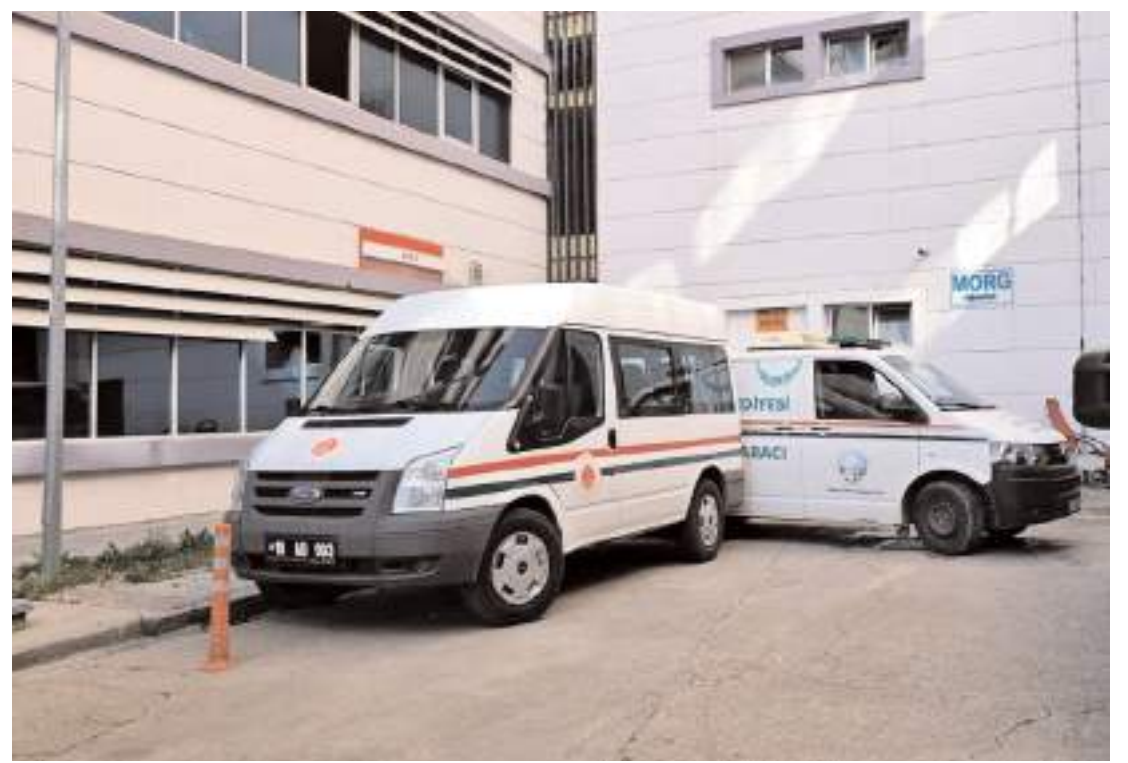
Yaşlı kadının cenazesi otopsi için morga konuldu.