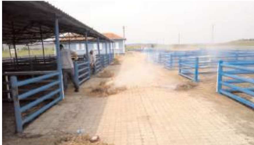
Belediye hayvan pazarlarında kapsamlı bir temizlik çalışması başlatıldı.