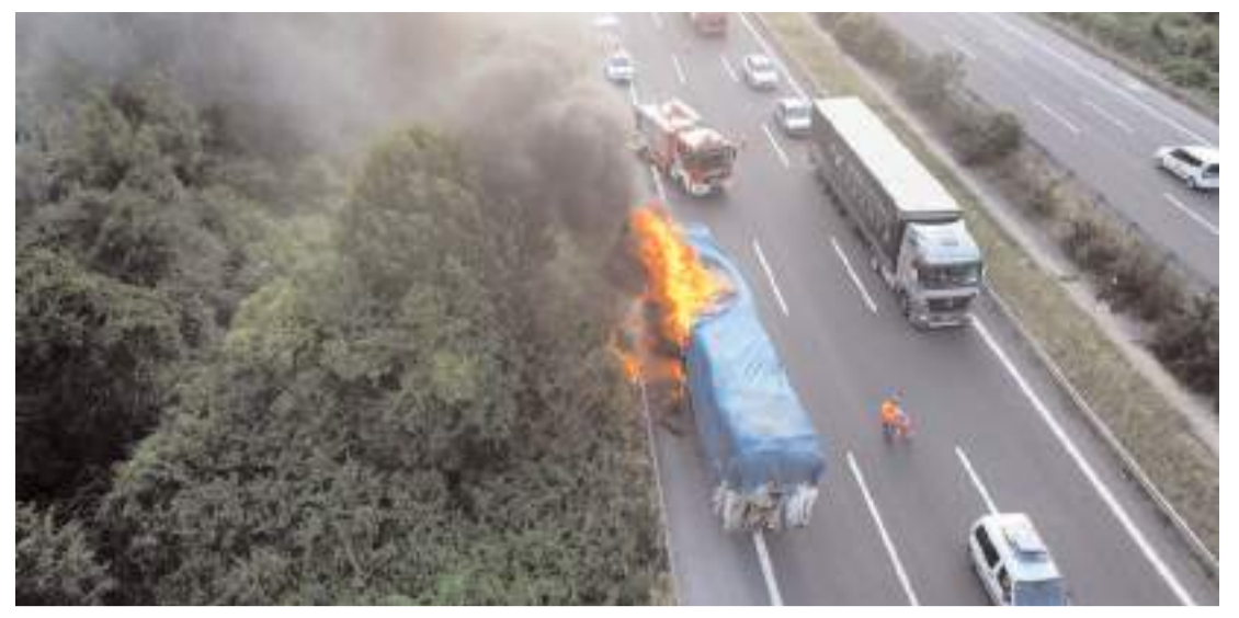
Olay Anadolu Otoyolu Bataklığı mevkiinde meydana geldi.

di. Yakınları tarafından Mecitözü Devlet Hastanesi'ne götürülen Muharrem G, müdahalenin ardından Hitit Üniversitesi Erol Olçok Eğitim ve Araştırma Hastanesi'ne sevk edildi.(AA)