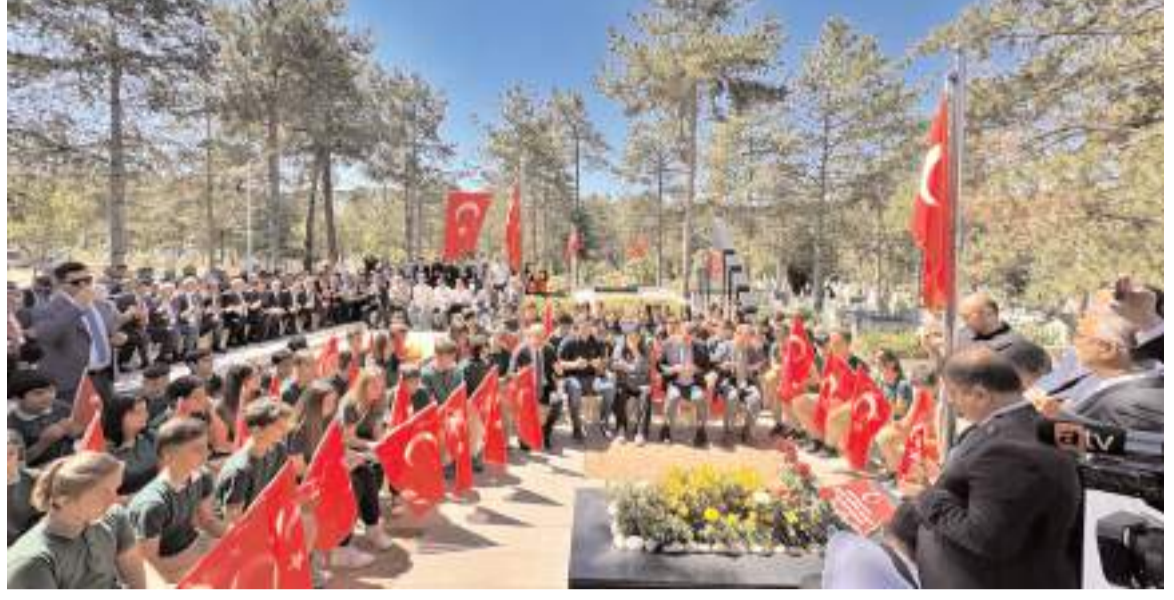
Anma törenine protokol üyeleri ile çok sayıda öğrenci katıldı.