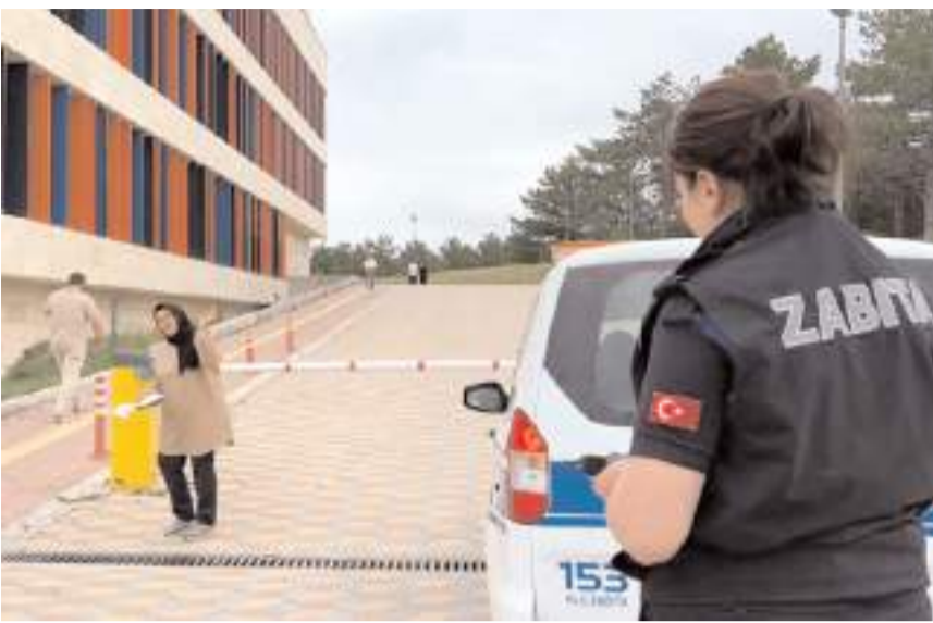
Zabıta Müdürlüğü ekipleri, YKS'ye geç kalan üniversite adaylarının yardımına koştu.