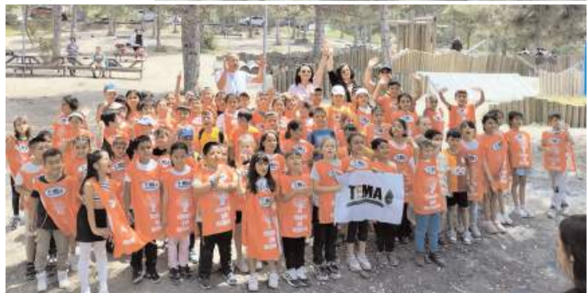
Öğrenciler günün anısına hatıra fotoğrafı çektiler.