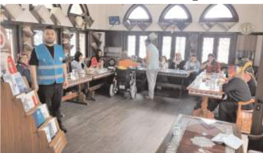
Okullara yakın yerlerdeki cami ve Kur'an kursları sınavı giren öğrencilerin ailelerini ağırladı.