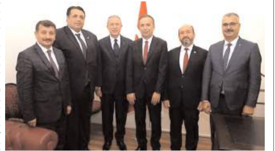
Çorum heyeti Kasım 2019'da Hulusi Akar'la görüşme yapmıştı.