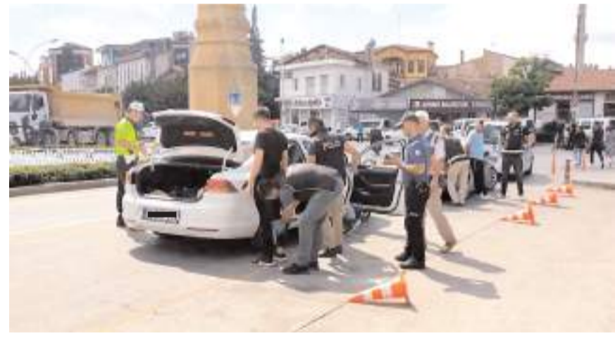
2 bin 643 şahsın GBT kontrolü yapıldı.

Yapılan uygulamalar sırasında haklarında çeşitli mahkemeler tarafından arama kararı bulunan 7 şahıs yakalanırken, 7 ruhsatsız tabanca, 4 tüfek, 4 kuru sıkı tabanca, 7 kesici ve delici alet olmak üzere toplam 22 adet