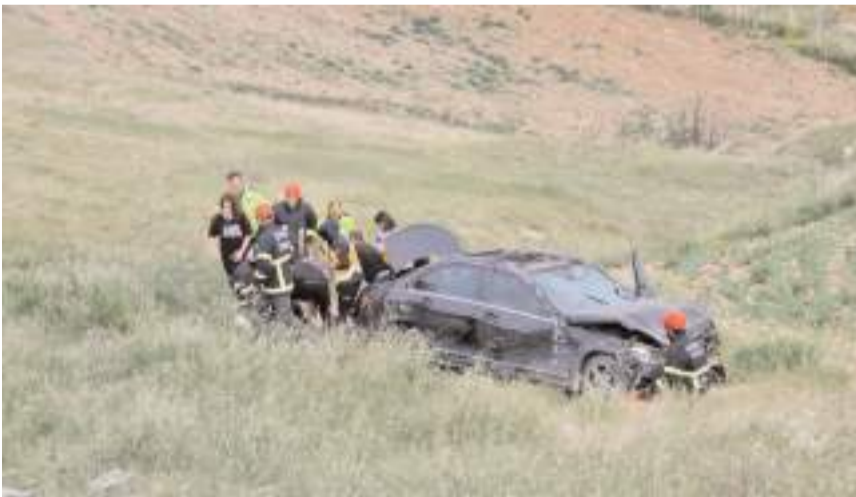
Kaza Çamlık Caddesi'nde meydana geldi.

Hastanesi'ne kaldırılan yaralılar tedavi altına alındı.(AA)