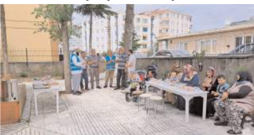
Öğrencilerin ailelerine ikramlarda bulunuldu.

Çorum İl Müftülüğüne bağlı cami ve Kur'an kursları YKS'ye giren öğrencilerin velilerini misafir etti.