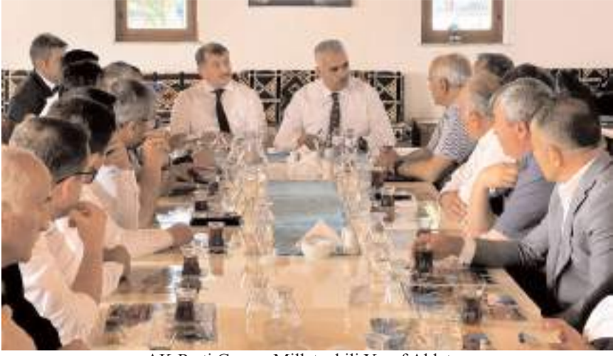
AK Parti Çorum Milletvekili Yusuf Ahlatcı, belediye ve ilçe başkanları ile toplantı yaptı.