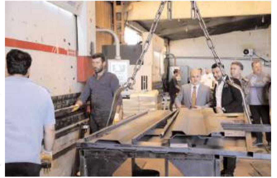
Vali Dağlı işletmeleri gezerek faaliyetleri hakkında bilgi aldı.

sinde çalışmalar sürdürdüklerini ifade etti.