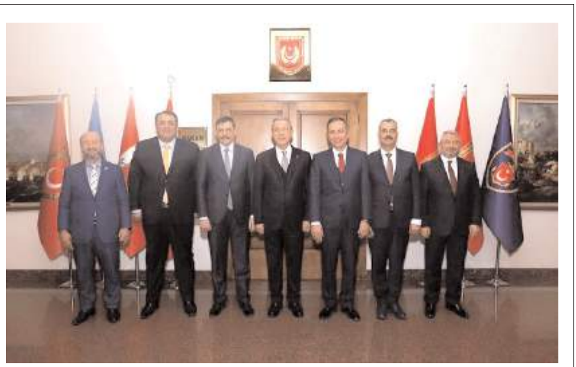
Çorum heyeti Mart 2019'da Hulusi Akar'la görüşme yapmıştı.

Hükümlerini, Hazine ve Maliye Bakanı yürüteceği btebliğ, yayım tarihinde yürürlüğe girdi.