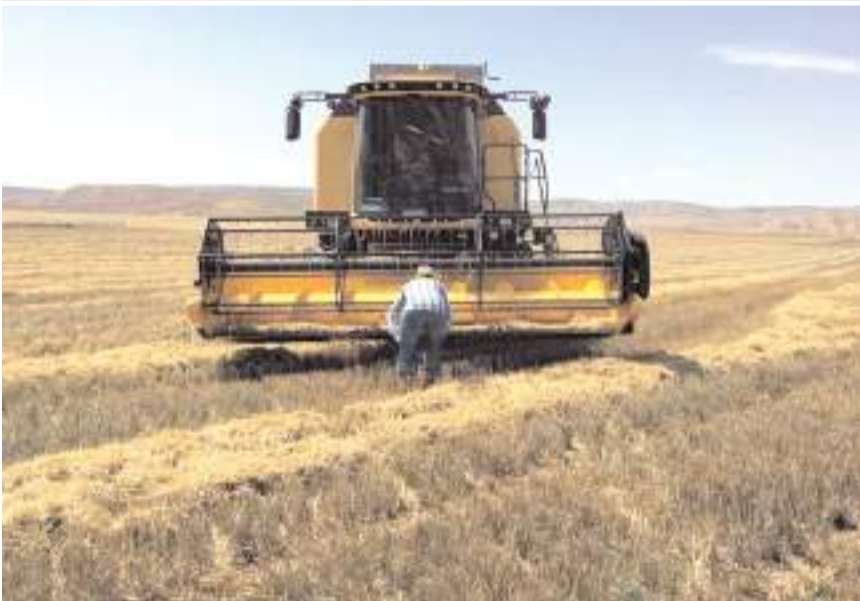
Denetimler hububat hasadında dane kaybını en aza indirmek amacıyla yapılıyor.