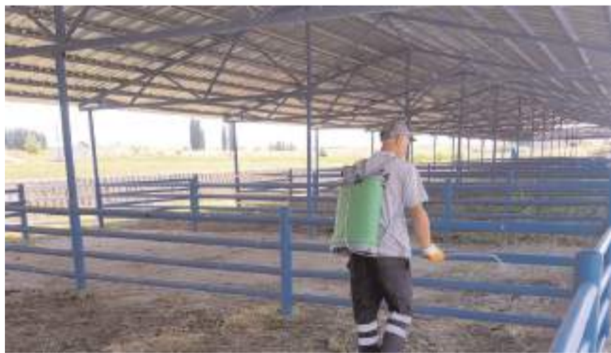
Hayvan pazarlarında ilaçlama yapılıyor.

Alaca Belediyesi'ne bağlı ekipler, yaklaşan Kurban Bayramı öncesi ilçede kurulan hayvan pazarlarında kapsamlı bir temizlik çalışması başlattı.