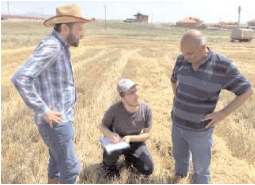
İlçe Tarım ve Orman Müdürlüğü ekipleri, ilçeye bağlı köylerde biçerdöver kontrolleri gerçekleştirdi.

Sungurlu'da, çiftçilerin bir yıllık emeklerinin zayı olmasının için biçerdöver kontrolleri başladı.