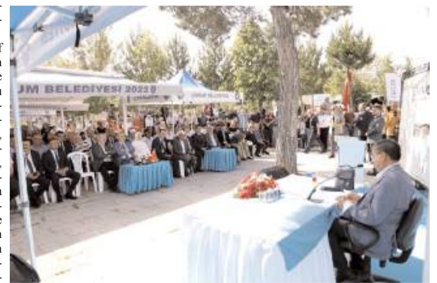
Programda Yazar Hayati İnanç söyleşi yaptı.