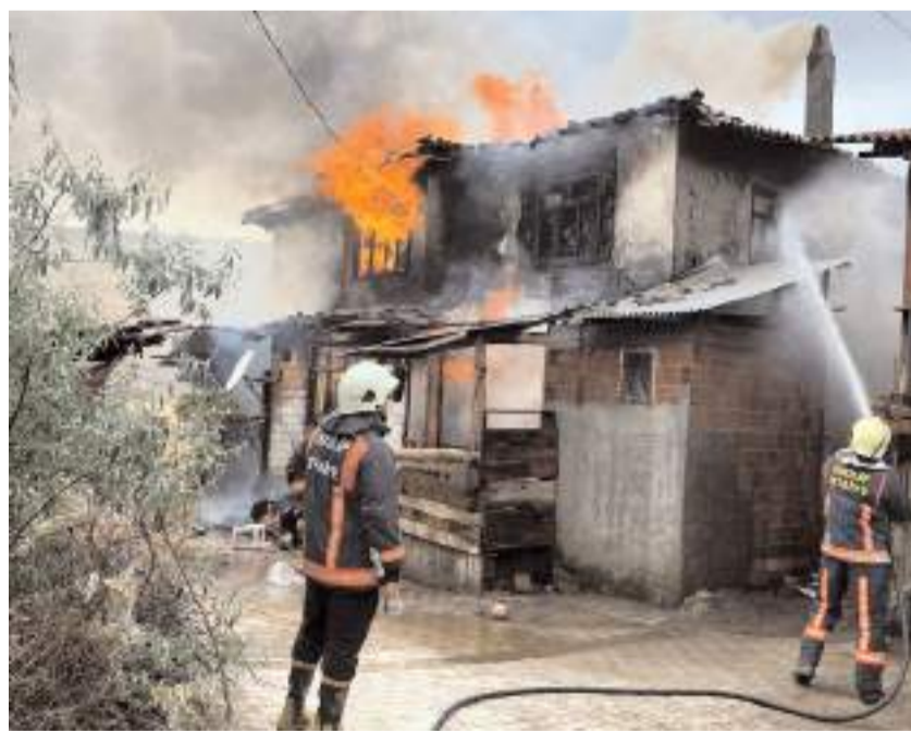
Olay Kamişığı köyünde meydana geldi.

İskilip'te çıkan yangında, bir ev kullanılmaz hale geldi.