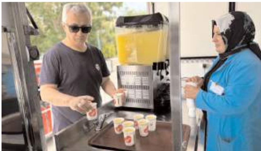
Öğrencilere ve velilere limonata ve dondurma ikram edildi.

Sosyal belediyeçilik anlayışıyla çalışmalarını sürdüren Çorum Belediyesi, Yüksek Öğretim Kurumları sınavında da ailelerin yanındaydı. Mobil ikram aracı ile okul önlerinde bekleyen velilere limonata ikram edildi. Ayrıca sınavların yapıldığı okulları gezen belediye ekipleri çocuklarının sınavdan çıkmasını bekleyen velilere dondurma ikramında bulundu. (Haber Merkezi)