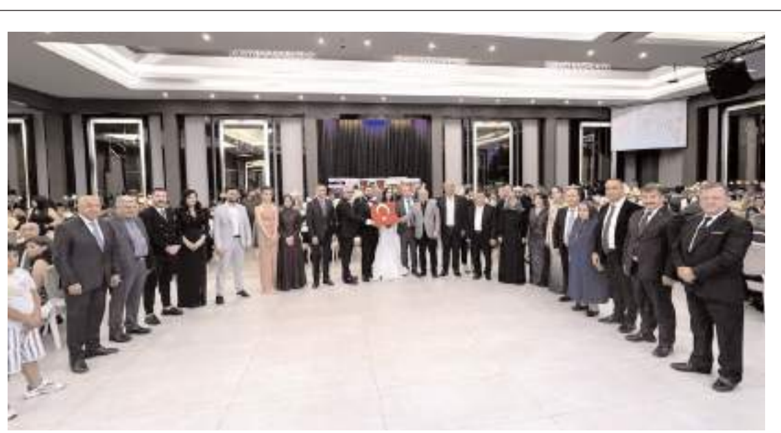
Düğün Yıldız Park Düğün Salonu'nda yapıldı.

Çetinkaya, Dodurga Belediyesi olarak hayvan pazarında önlemlerini aldıklarını belirterek, "Vatandaşlarımızın bayram öncesi alışverişlerini sağlıklı bir ortamda yapabilmelerini sağlıyoruz. Ekiplerimiz, ilçe genelinde denetimlere devam ettirecek." dedi. (AA)