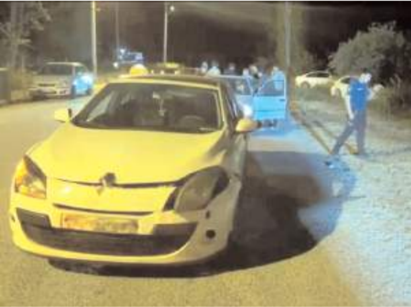
Kaza Buharaevler Mahallesi Bişkek Caddesinde meydana geldi.

Çorum'da iki otomobilin çarpıştığı kazada 7 kişi yaralandı.