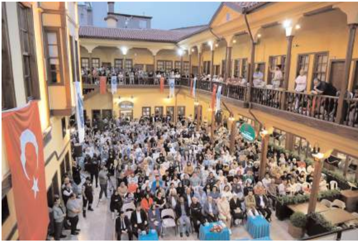
Velipaşa Hanında yapılan programa ilgi yüksek oldu.