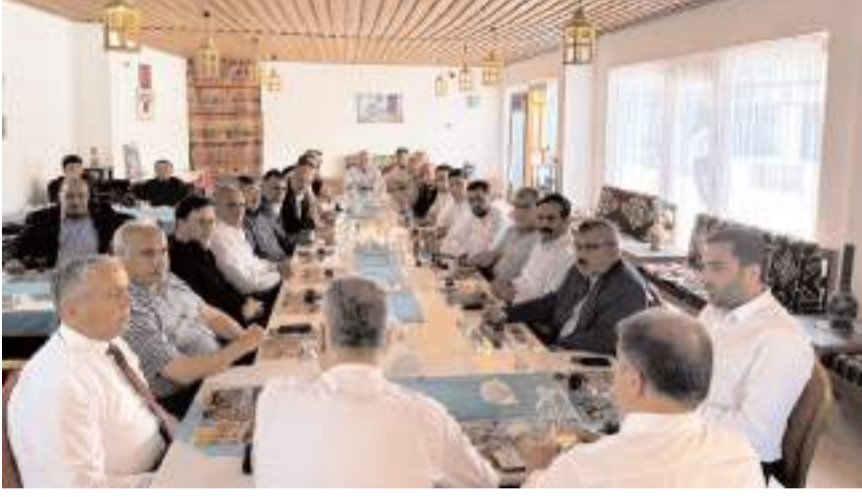
Toplantıda çalışmalar istişare edildi.