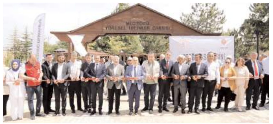
Yöresel ürünler ve vakıflar sergisinin açılış kurdelesini protokol üyeleri kesti.