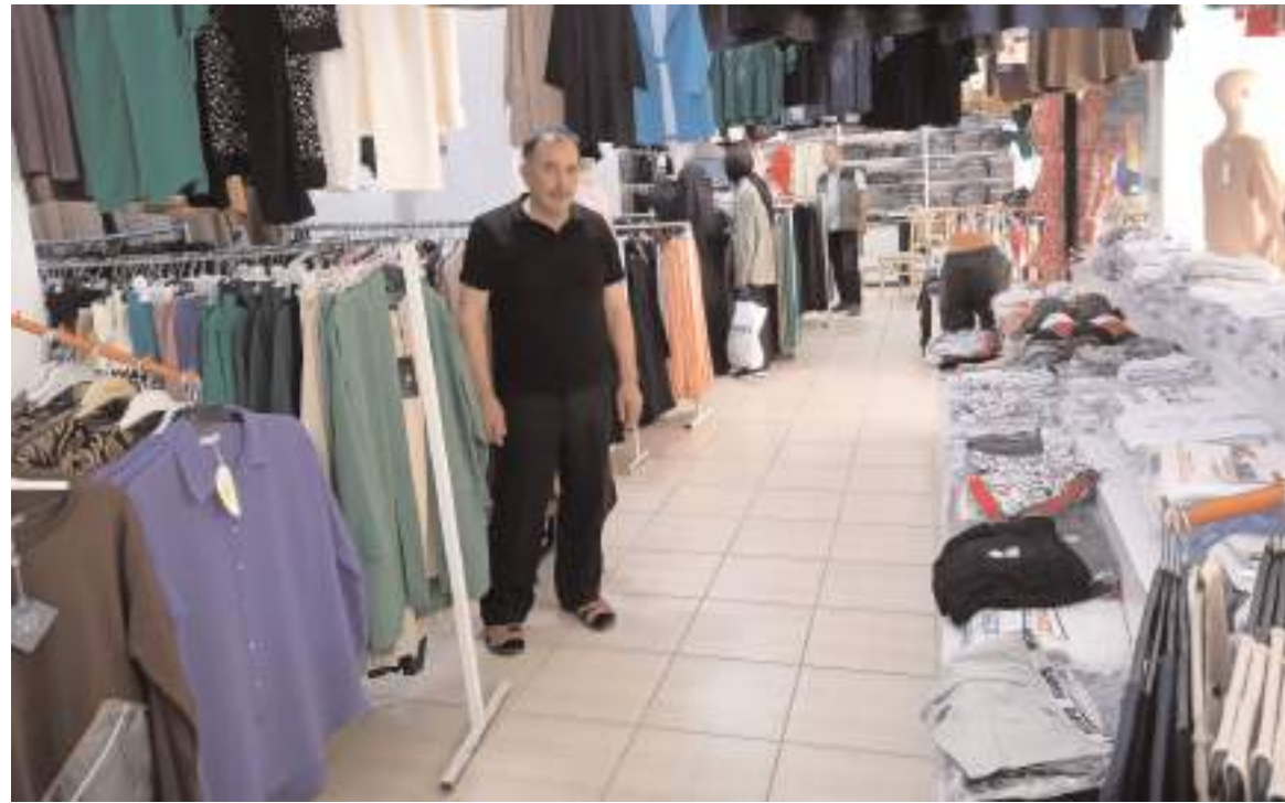
Sündüs Butik, bayrama özel ürünleri Çorum halkının hizmetinde.