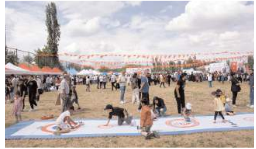
Geleneksel çocuk oyunları ilgi çekti.