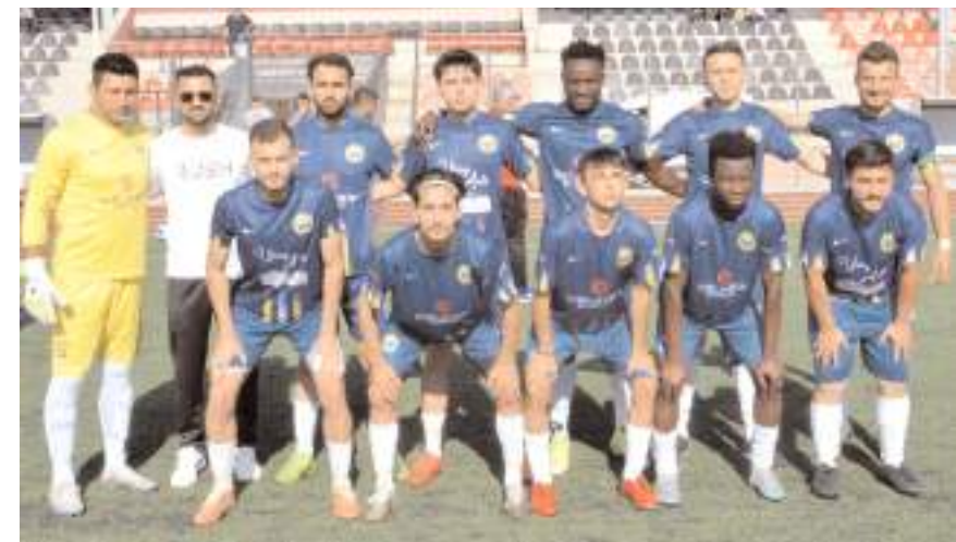
Alacagücüspor bugün kazanarak 1. küme için avantajını korumak istiyor

Mecitözü Gençlerbirliği - Alacagücüspor Osmancıkücüspor - Mecitözüspor