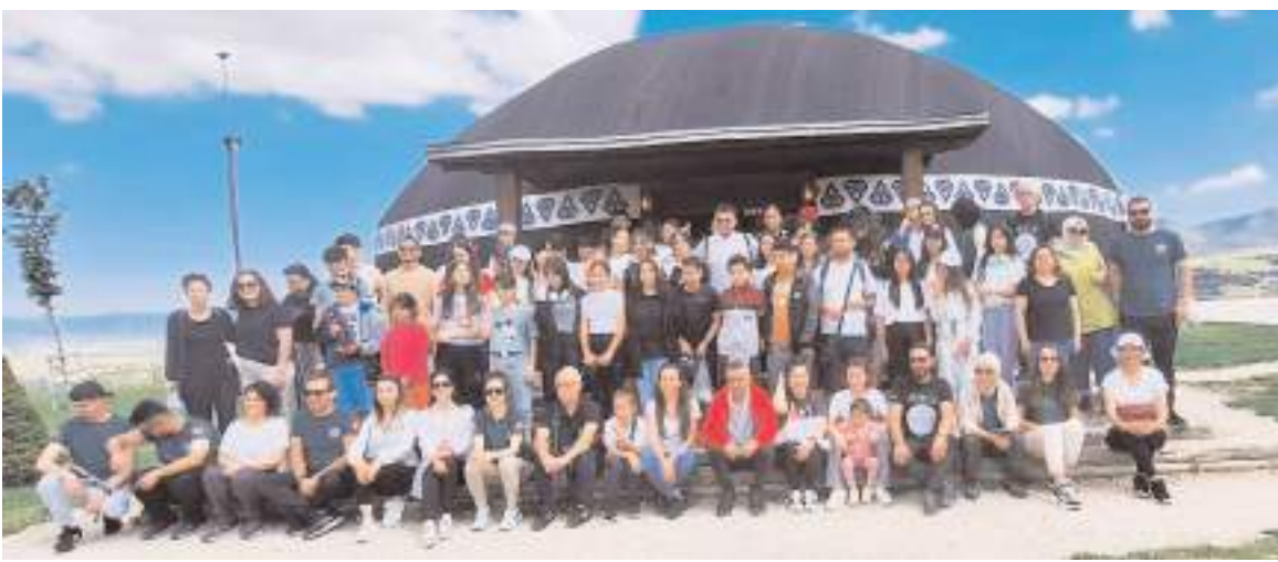
Öğrenciler Pazar günü Çorum Obası'nda kahvaltı yaptı.

Bakan Yumaklı, Konya Ovası 1,2,3 Sulamaları İkmal (11.820 ha sulama), Çorum Koçhisar Sulaması 2. Kısım (4.267 ha sulama), Samsun 19 Mayıs Barajı Sulaması (7.693 ha sulama) Diyarbakır Silvan Kuruçay Barajı Sulaması (5.030 ha sulama) ve Kayseri Bünyan Elbaşı-Karadayı Sulaması (5.402 ha sulama) projelerinin bu yıl içinde tamamlanacağını kaydetti. (İHA)