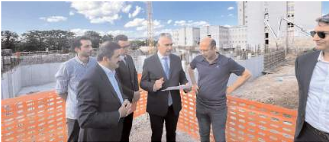
AK Parti Çorum Milletvekili Yusuf Ahlatcı, hastane inşaatında incelemede bulundu.