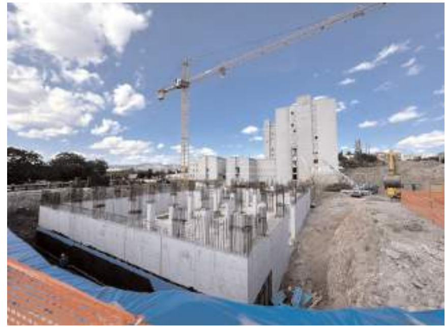
Hastane 730 milyon bedelle ihale edildi.