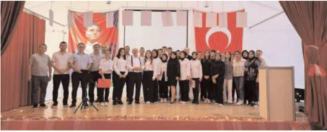
Programın sonunda öğrenciler ve öğretmenleri hatıra fotoğrafı çekindiler.