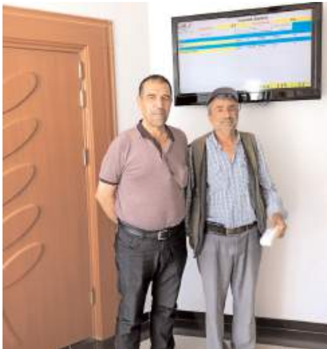
Hasat edilen ilk buğday Sungurlu Ticaret Borsası'nda satıldı.