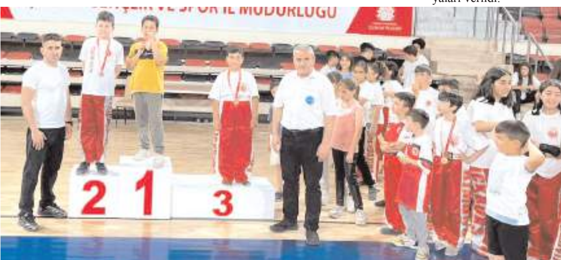
Kick Boks il birinciliğinde dereceye giren sporcular ödül töreninde görüntüleri