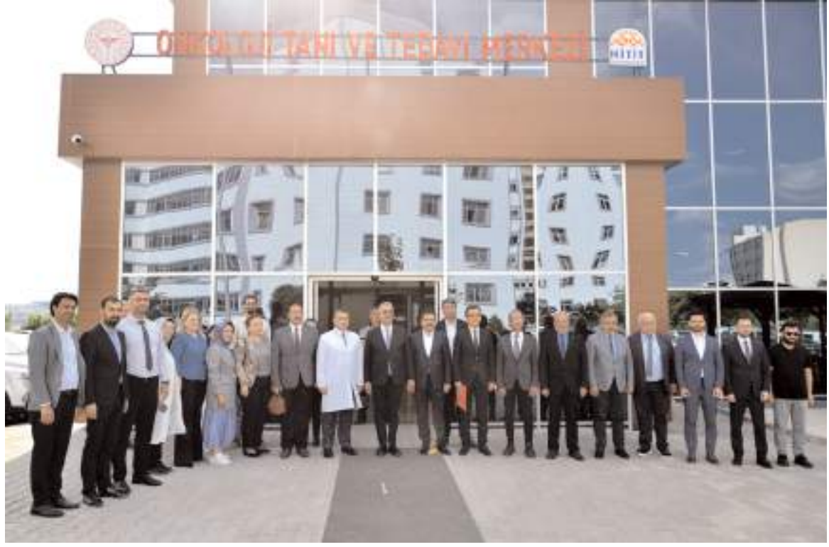
Ziyaretin ardından toplu hatıra fotoğrafı çekildi.

Onkoloji Tanı ve Tedavi Merkezi'nin 11 Mart'ta tüm birimleri ile hizmet vermeye başladığını anlatan Ahlatcı, "LINAC cihazında günlük 38-40 hastaya radyoterapi uygulanıyor. Bugüne kadar bin 269 hastaya hizmet verilmiştir. PET/CT cihazı ile günlük 10 hastaya çekim gerçekleştiriliyor. Bugüne kadar 617 çekim gerçekleştirilmiştir. Merkezde ayrıca 11 bin 887 kemoterapi seans, 910 radyoterapi seans sayısı, 11 bin sintigrafi görüntüleme sayısına ulaşıldı. Burada verilen sağlık hizmetlerine baktığımızda bölgemiz için ne kadar önemli bir