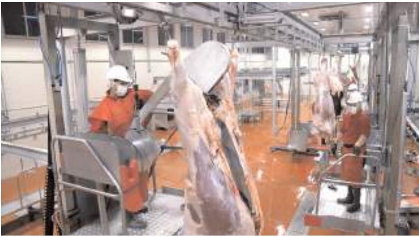
Bu yıl da 8 bölgede kesim yapılacaktır.

Gülübey Mahallesi Mevlana Camii Yanı, İskilip Yolu 4. km. Çorum Belediyesi Hayvan Pazarı" (Haber Merkezi)