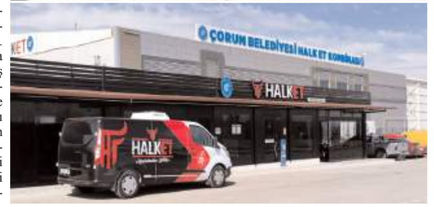
Kurbanlıklarını alan vatandaşlar Online Randevu Sistemine kayıt yaptırarak, Halk Et Kombinasında kesimlerini yaptırabiliyorlar.