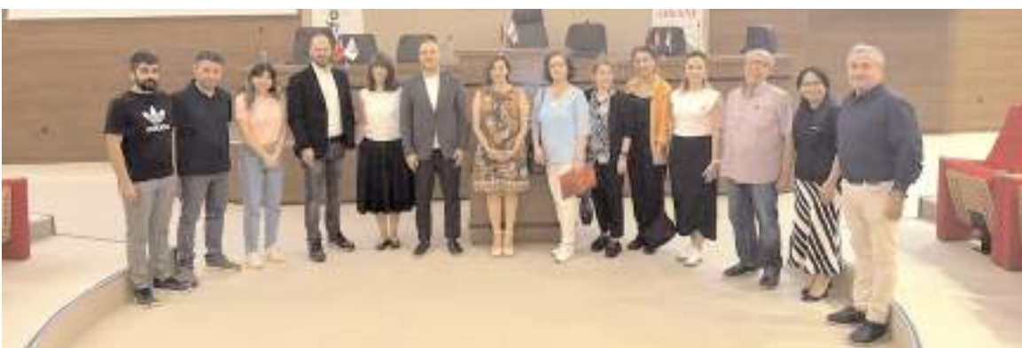
Program Çorum Ticaret ve Sanayi Odası konferans salonunda yapıldı.