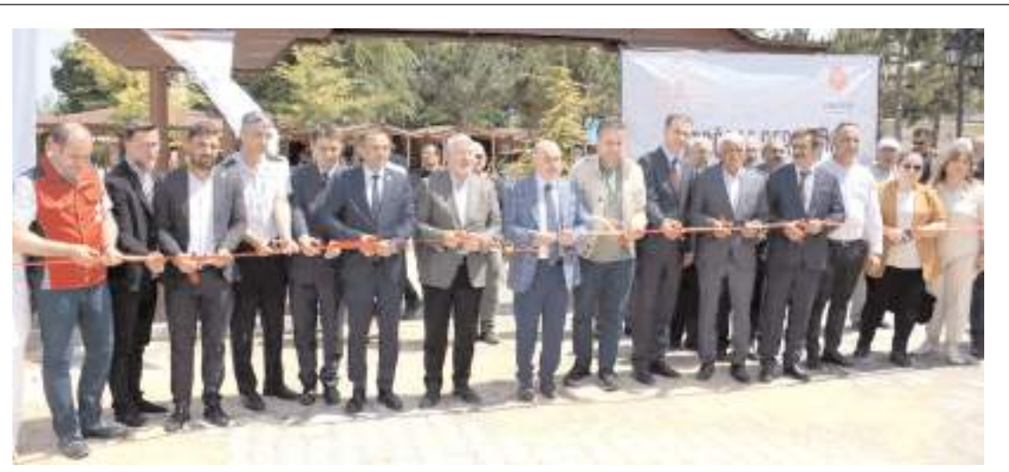
3 gün boyunca çok sayıda etkinlik yapıldı.