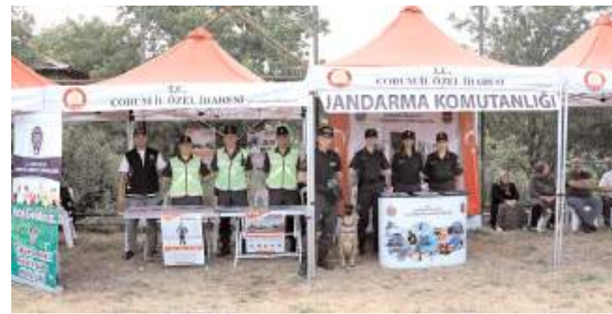
Stantta jandarmanın faaliyetleri hakkında bilgi verildi.

Öğrencilerde, jandarma tarafından kurulan standta yoğun ilgi göstererek ilerde jandarma olmak istediklerini belirttiler. (Haber Merkezi)