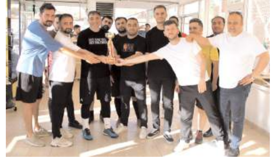
İkinci olan The Last Dance takımının kupasını Baro Başkanı Turan Kalıpcı verdi