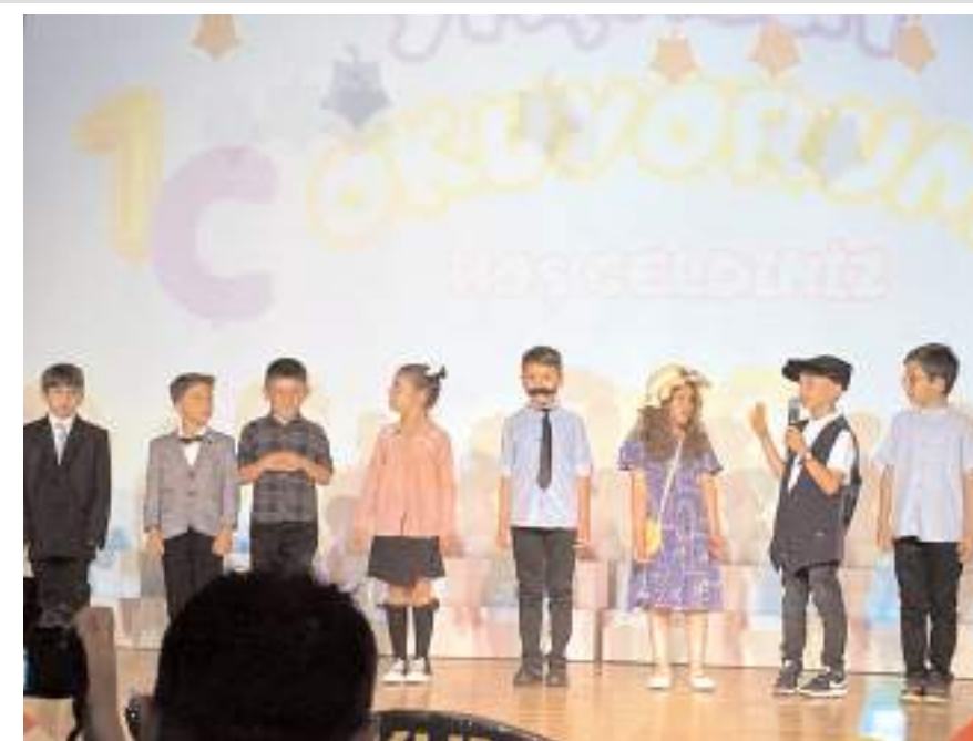
Program Çorum Belediyesi Buhara Kültür Merkezinde yapıldı.

Öğrencilerin dans ritim ve drama gösterileri davetlilerden bol bol alkış alırken yoğun geçen bir süreçten sonra okuma yazma öğrenmenin sevincini ve coşkusunu aileleriyle birlikte yaşayan öğrenciler güzel bir gün geçirdiler. (Haber Merkezi)