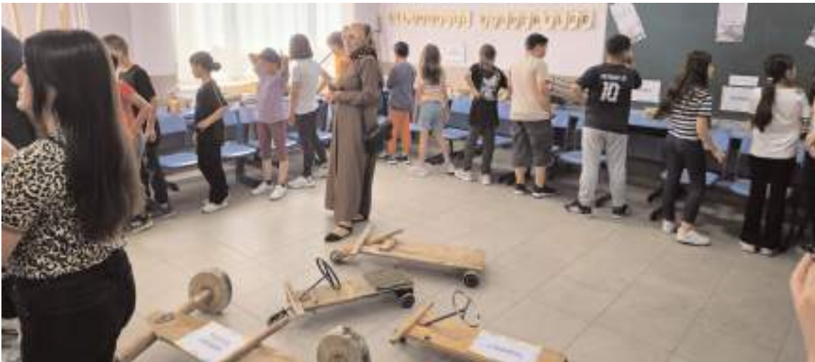
Sergide Bayat ve bölgesinde geçmişte çocukların kullandıkları oyuncaklar yer aldı.