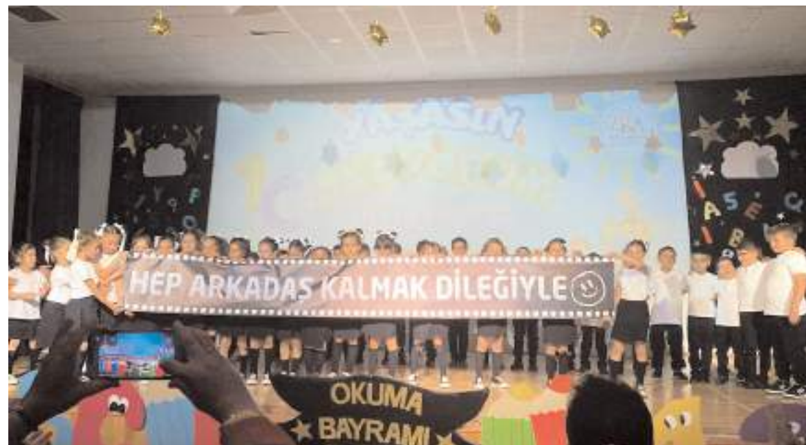
Program hatıra fotoğrafı çekinilmesi ile sona erdi.