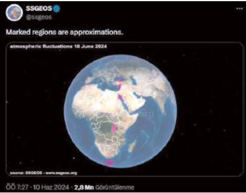
Solar System Geometry Survey (SSGEOS) sosyal medyada uluslararası deprem uyarısı yayımladı.