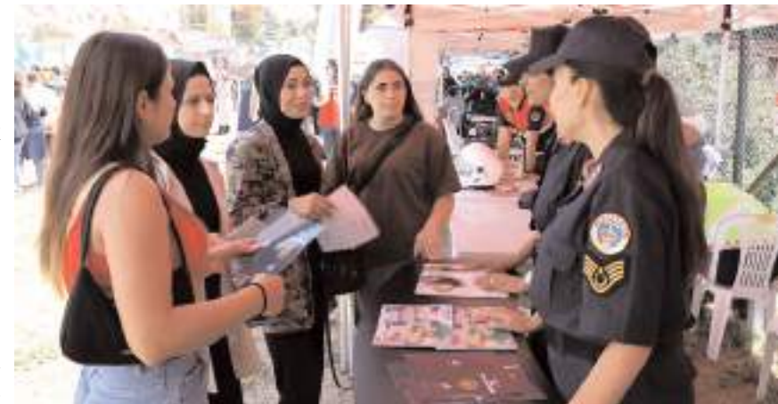
İl Jandarma Komutanlığı, "Elvan Çelebi Kültür, Sanat, Spor ve Anma Etkinliklerinde" stant açtı.

Kadınlara ise Elektronik Kelepçe ve Kadın Destek Uygulaması (KADES) hakkında bilgiler verildi.