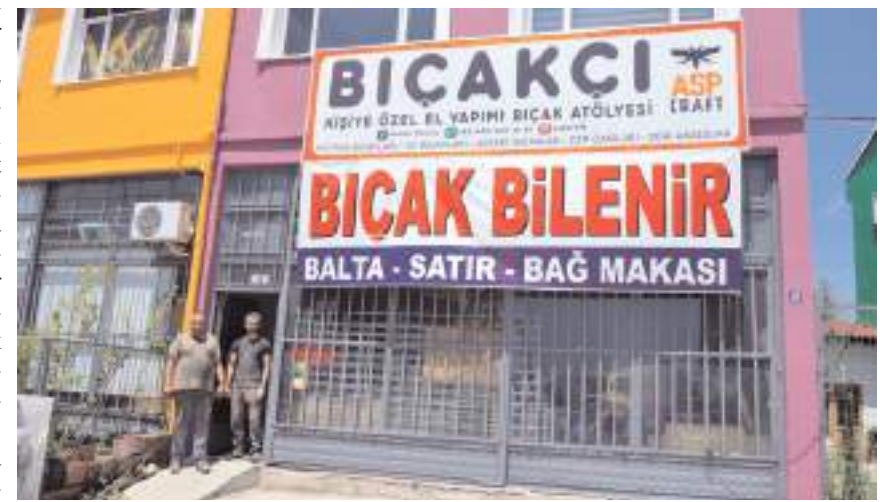
ASP Bıçakçılık AHL Park AVM karşısında faaliyet gösteriyor.

Poyraz, Cuma gününe kadar sipariş alabildiklerini ifade ederek "0 (530) 990 84 19 nolu sipariş hattından Türkiye'nin dört bir yanına ürün gönderiyoruz. Kurban Bayramı'nın öncesinde, müşterilerimizin en kaliteli bıçaklarla kurbanlarını kesebilmesi ve kurbanların en az acıyla muhatap kalmaları için özel üretim bıçaklarımızla, önemli bir sorumluluğa imza atıyor olmanın gururunu yaşıyoruz." dedi.