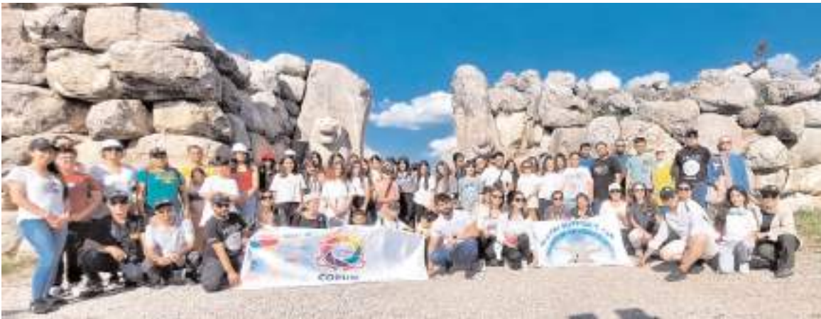
Öğrenciler Çorum'un tarihi ve turistik yerlerini gezdiler.