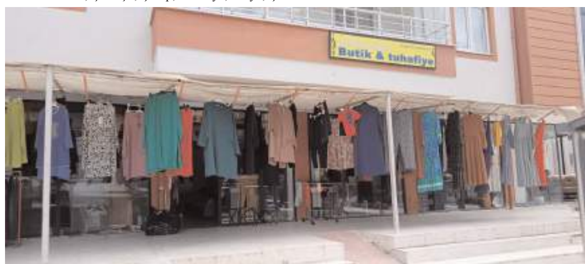
Sündüs Butik, Ulukavak Mahallesi Adnan Özejder Caddesi numara 7 adresinde hizmet veriyor.