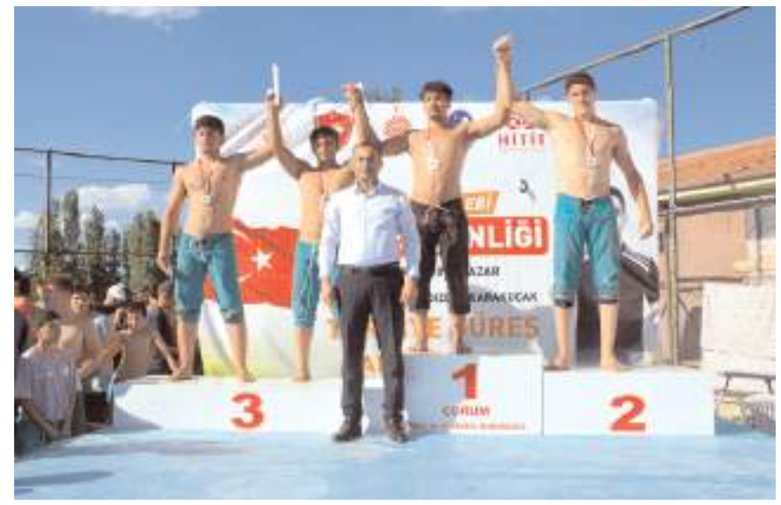
Yarışmalarda derece elde edenlere çeşitli ödüller verildi.