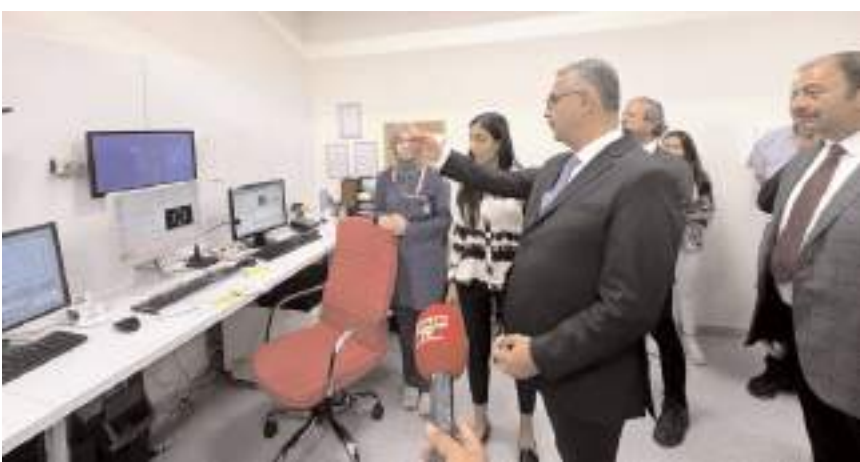
Milletvekili Yusuf Ahlatcı, ziyaretinde vatandaşlarla sohbet etti.

AK Parti Çorum Milletvekili Yusuf Ahlatcı, sağlık alanında yapılan yatırımlarla birlikte Çorum'un sağlıkta bölgede yıldız olacağını açıkladı.