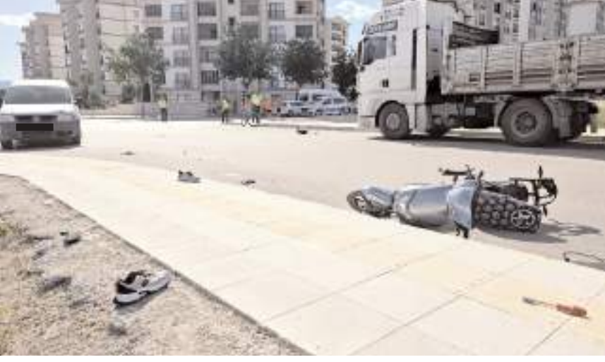
Kaza Kunduzhan Mahallesi Aşık Paşa Sokak'ta meydana geldi.