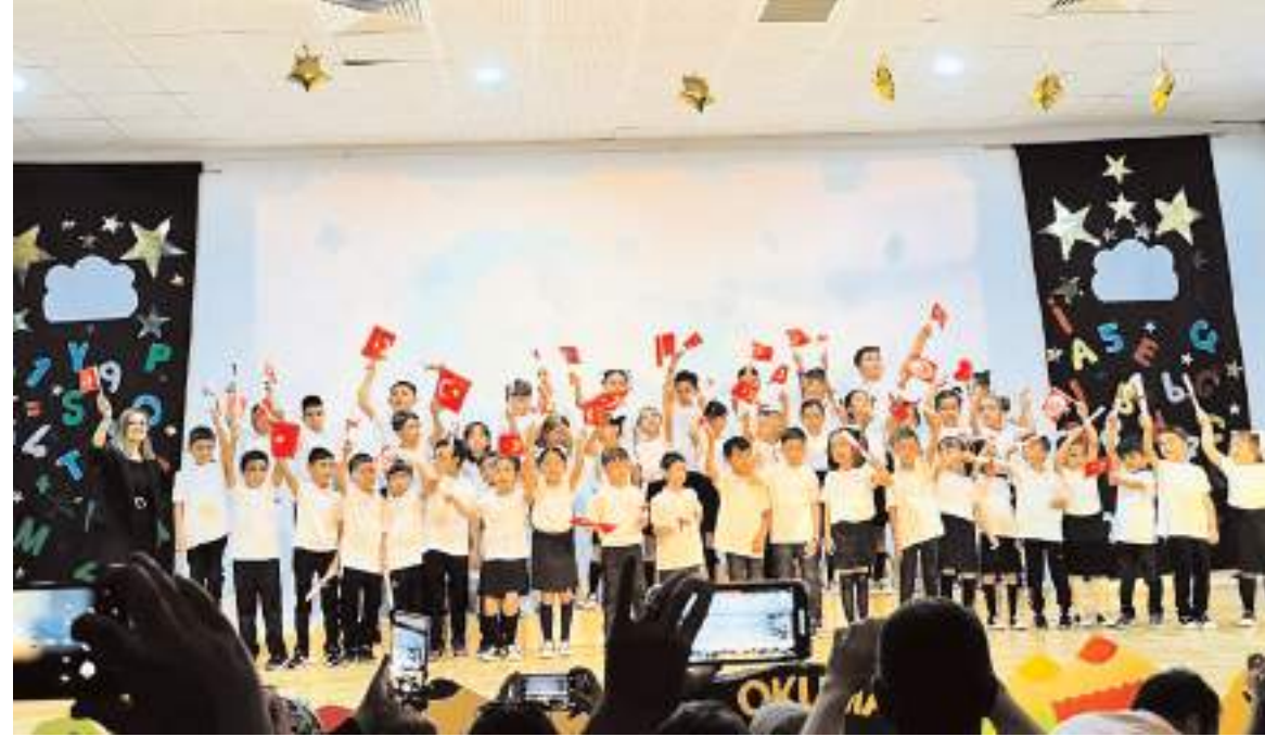
Öğrenciler yaptıkları gösterileri sundular.

Çiftin yüzüklerini Başkan İsbir ve aile büyükleri birlikte takarak genç çifte mutluluklar dilediler. (Haber Merkezi)