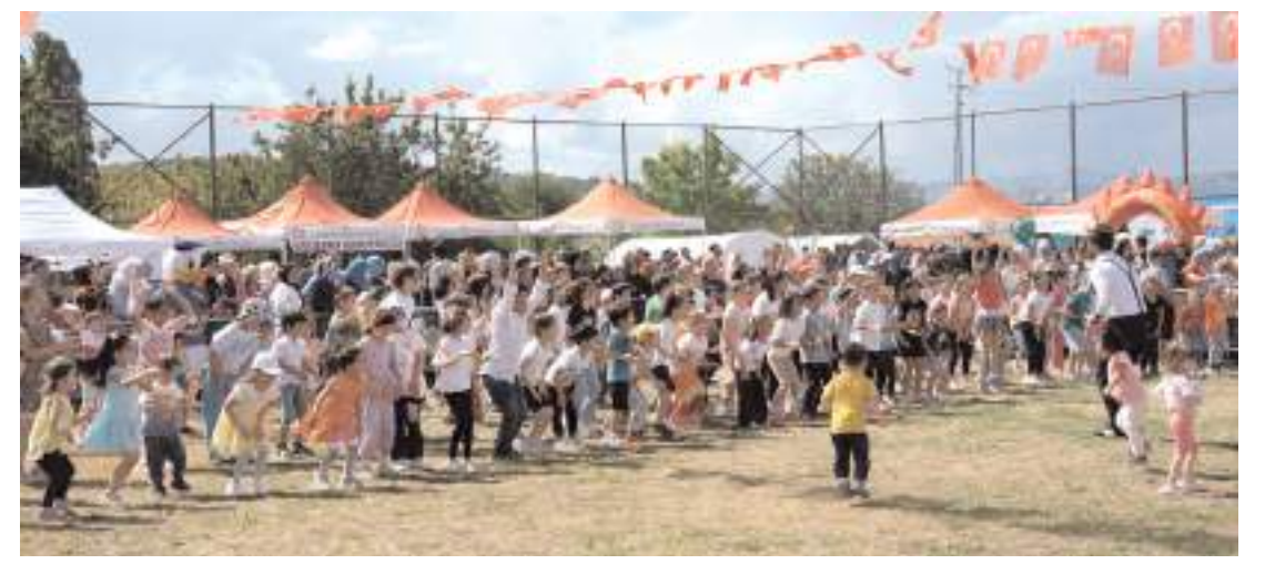
Etkinlikler kapsamında yapılan yarışmalarda çocuklar gönüllülerince eğlendiler.

Çorum Mecitözü ilçesine bağlı Elvançeşmeli köyünde düzenlenen "Geleneksel Elvan Çelebi Kültür, Sanat, Spor ve Anma Etkinlikleri"nin sona erdi.