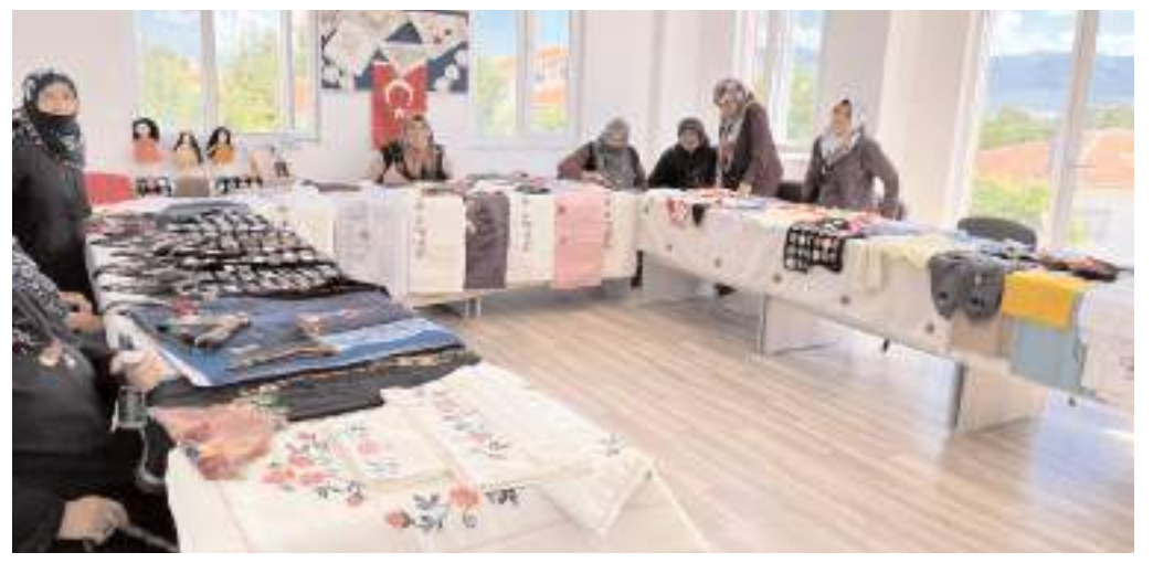
Sergide kursiyerlerin yaptıkları ürünler görücüye çıktı.