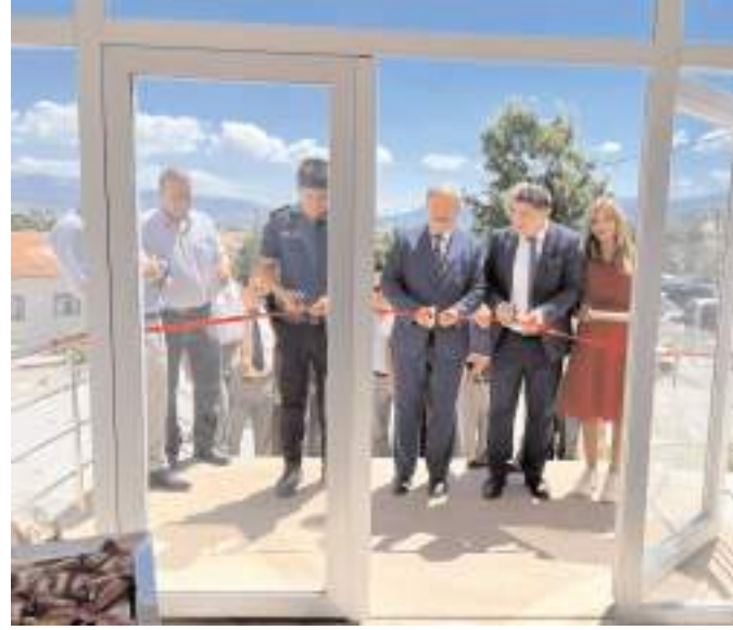
Açılış kurdelesini ilçe protokolü kesti.

Laçın Halk Eğitim Merkezinde (HEM) yıl boyu üretilen ürünler, yıl sonu sergisi ile vatandaşların beğenisine sunuldu.