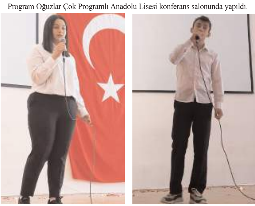
Öğrenciler çok sayıda şiiri seslendirdi.

Şiir dinletisi, öğrenci ve öğretmenler ile protokol üyelerinin toplu hatıra fotoğrafı çekilmesiyle sona erdi. (Haber Merkezi)