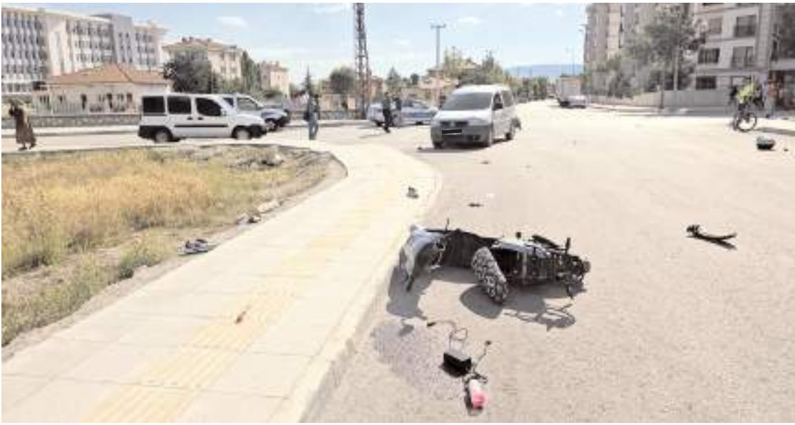
Kazada yaralanan motosiklet sürücü yapılan tüm müdahalelere rağmen hayatını kaybetti.