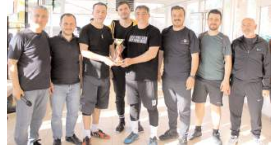
Dördüncü İhtiyar Heyeti takımının kupasını Cumhuriyet Başsavcısı Ahmet Bektaş verdi