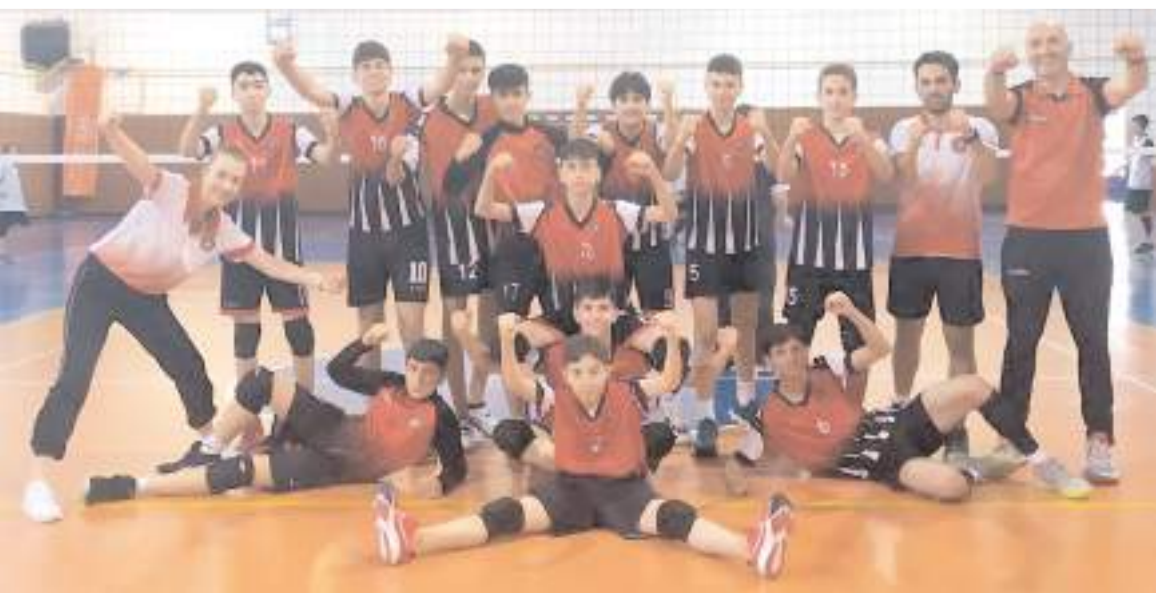
Çorum Belediyespor midi erkek takımı grupta ikinci maçında kazanarak ikinci tura yükselmeyi garantiledi

Çorum Belediyespor ikinci tur maçında F grubundan ikinci çıkan Altekmaspor ile saat 15.30'da Damat Ferit Paşa Spor salonunda karşılaşacak.