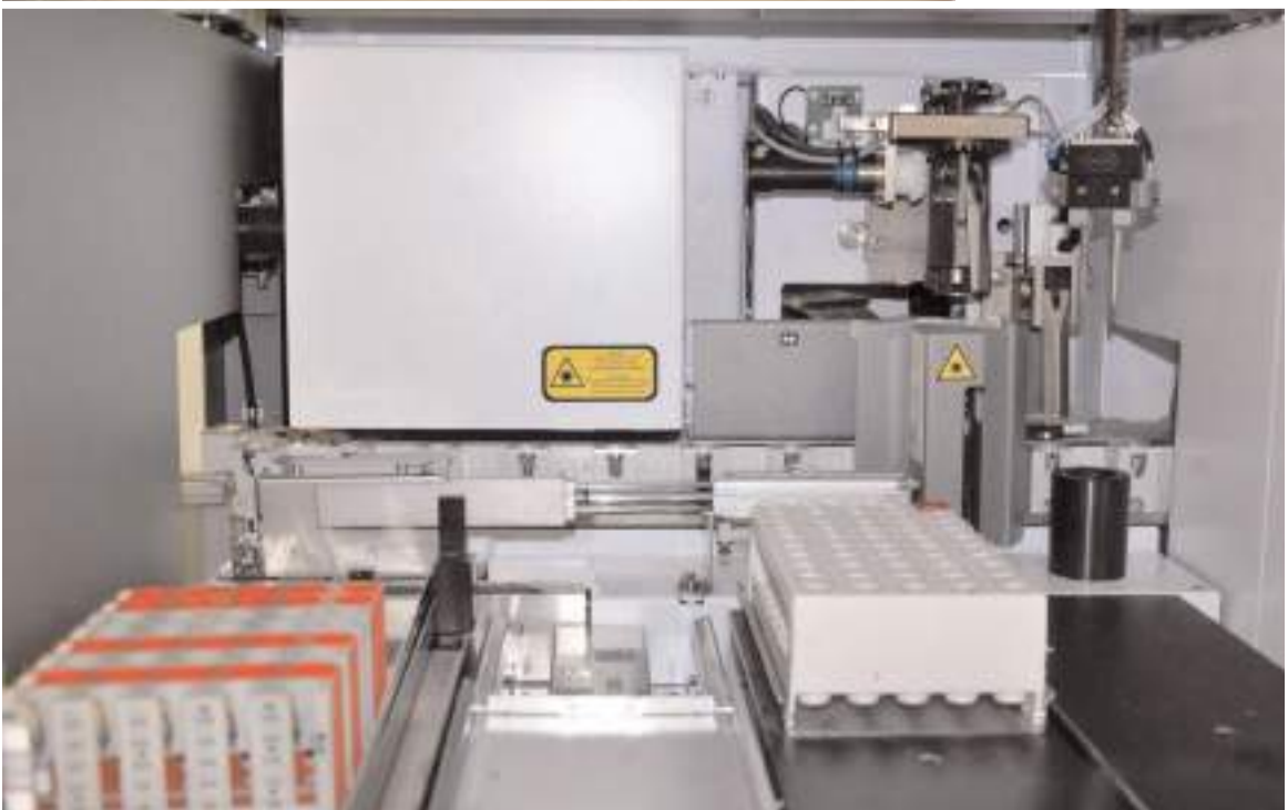
Cihazla daha az personel ile daha hızlı, doğru ve güvenilir laboratuvar hizmeti sunulacak.