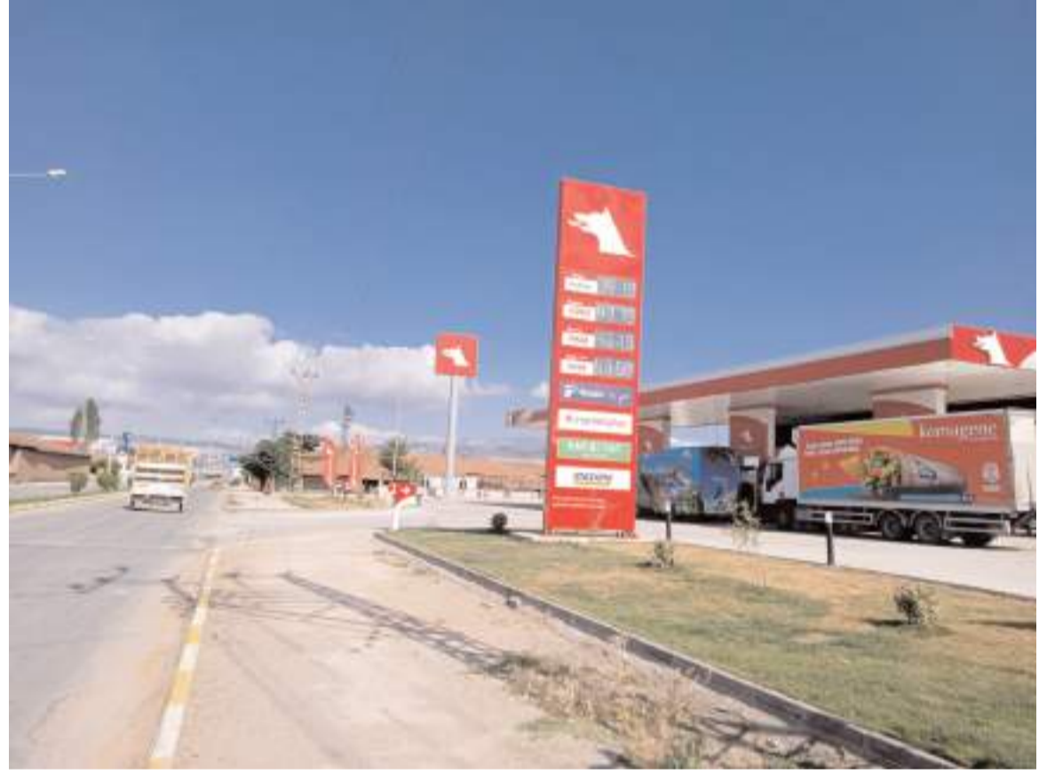
Özsaraçoğlu Petrol, 30 yıldır İskilip Caddesi numara 42'de hizmet veriyor.

İstasyonda modern hijyenik lavabolarının yanı sıra cam suyu, motor yağı gibi araç ürünleri ile araç şarj cihazları gibi aksesuar ürünlerinin de satışını yaptıklarını belirten