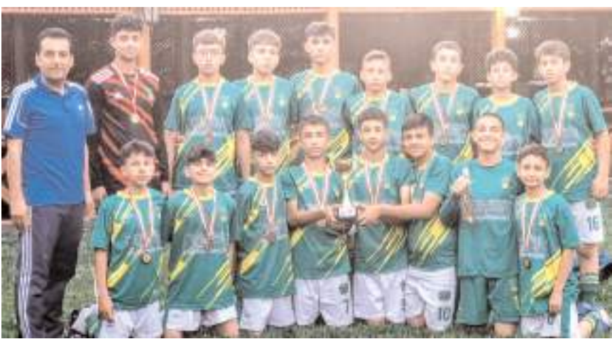
Kapadokya turnuvasında mücadele eden İskilipspor takımı ödül töreni sonrasında