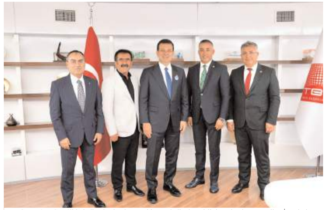
Çorum'un CHP'li belediye başkanları Türkiye Belediyeler Birliği Başkanlığına seçilen İstanbul Büyükşehir Belediye Başkanı Ekrem İmamoğlu'nu ziyaret etti.

Bakanlığı tarafından düzenli olarak denetlenen, ruhsatlı ve güvenilir ürünlerin satışa sunulduğu yerlerdir. Eczacılar, bu ürünler hakkında en doğru bilgiyi verebilecek, eğitilmiş ve yetkin sağlık profesyonelleridir. Size en uygun ürünleri, doğru dozlarda ve güvenli bir şekilde kullanmanızı sağlarlar. Ankara Eczacı Odası'nın "İnternete değil, eczacınıza güvenin" konusunu ilgili yaptığı bu çalışma, Türk Eczacıları Birliği'nin gücünü ve etkisini artırmakta, mesleğimizin önemini bir kez daha gözler önüne sermektedir. Bu tür çalışmaların devamını 56 Bölge Eczacı Odamızdan da beklediğimizi belirtmek isteriz. Hep birlikte, mesleğimizin değerini ve toplum sağlığındaki rolümüzü daha da güçlendirebiliriz. Sağlığınız için internete değil, eczacınıza güvenin. Eczaneler, sağlıklı yaşamın ve güvenli ürün kullanımının garantisidir. Eczacınıza danışarak, sağlığınızı riske atmadan, güvenli ve etkili ürünleri kullanabilirsiniz. Unutmayın ki, sağlık en değerli hazinemizdir ve onu korumak için en güvenilir yol, eczacınıza başvurmaktır. Sağlıklı günler dileriz" diyerek açıklamasını tamamladı. (Haber Merkezi)