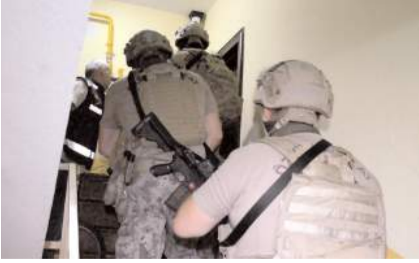
Operasyonunda 30 kişi gözaltına alındı.