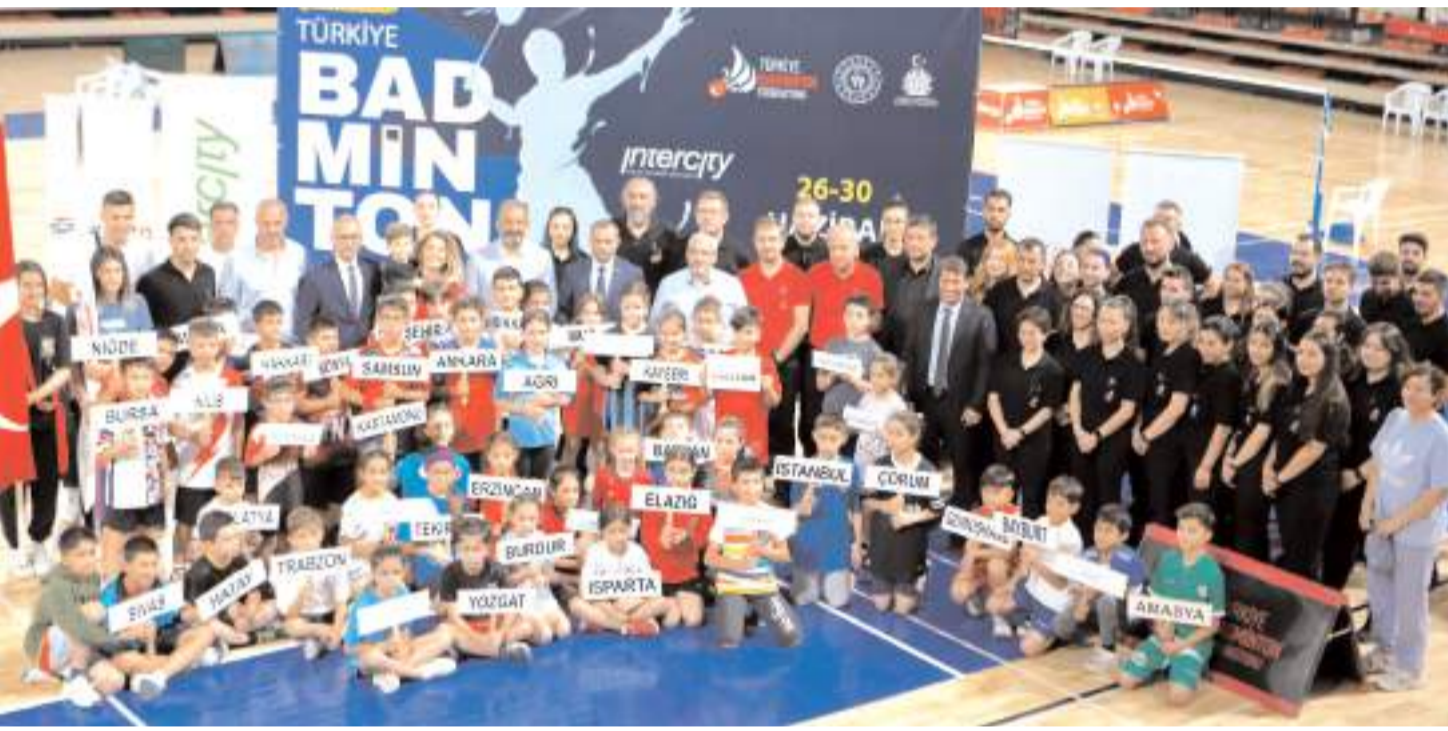
Türkiye Şampiyonası açılış törenine katılan illerin sporcuları, protokol üyeleri ve hakemler toplu halde