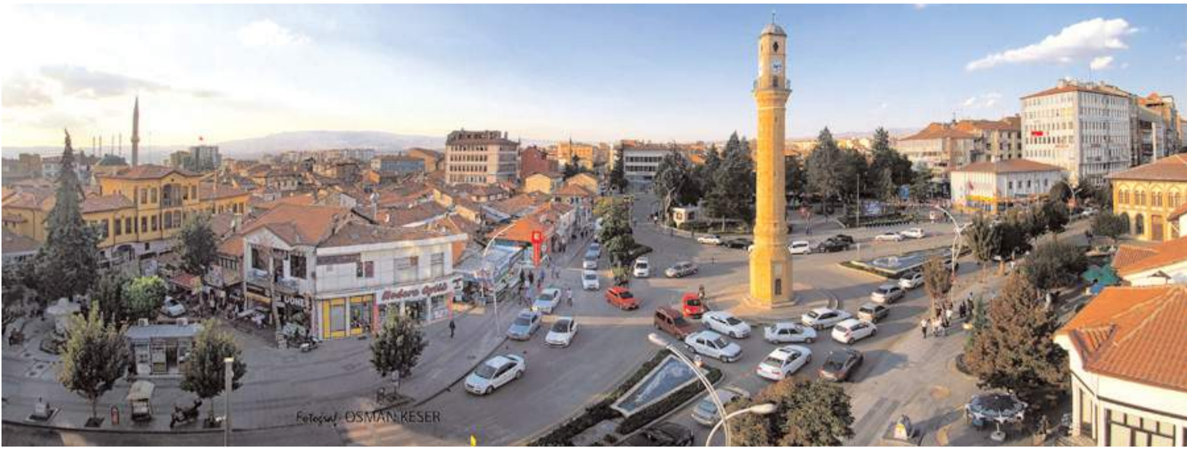
"İlk Evim Arsa" projesinde 2 yıl geçmesine rağmen arsalarna kavuşamayan hak sahipleri projenin akıbetini merak ediyor.