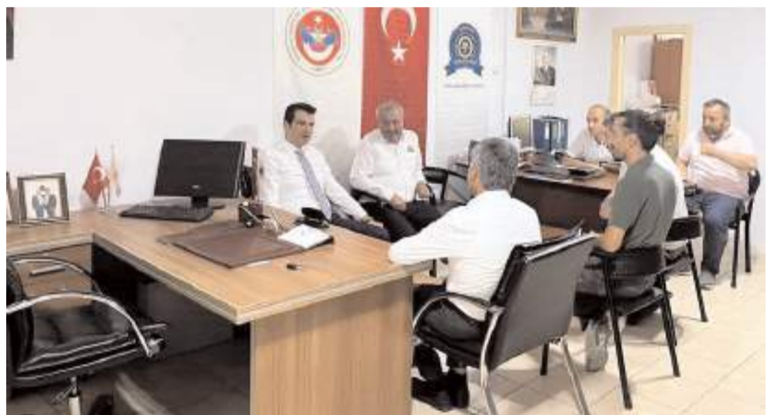
Oda başkanları Kaymakam Mutlu Köksal'a ziyaretinden dolayı teşekkür ettiler.