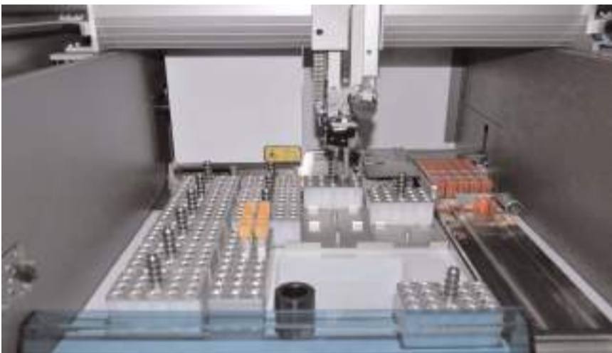
Cihaz saatte 700 tüp işleme kapasitesine sahip.