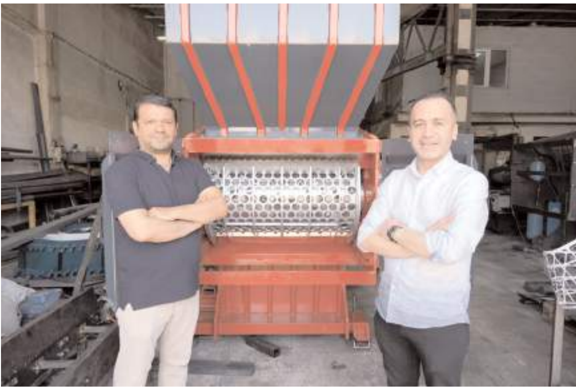
Hitit Üniversitesi'nce yürütülen araştırma-geliştirme projesi kapsamında üniversite-sanayi işbirliği modeliyle tamamen yerli ve milli imkânlarla ambalaj atıklarının geri dönüşümünü sağlayacak makine geliştiriliyor.