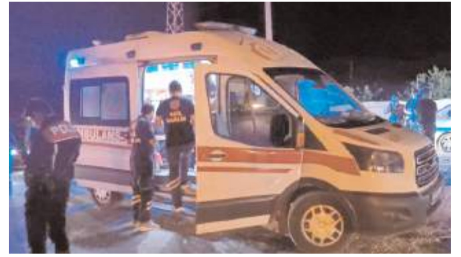
Yaralıları ilk müdahale 112 acil sağlık ekipleri tarafından yapıldı.