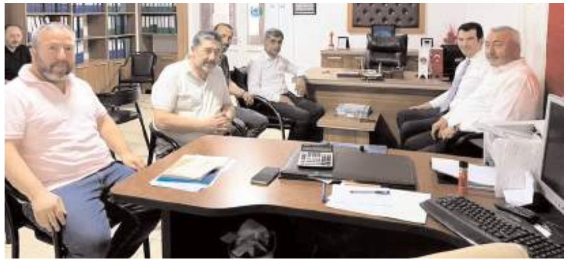
Kaymakam Mutlu Köksal, esnaf odalarının başkanları ile görüştü.