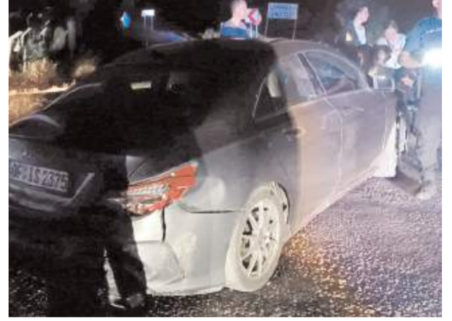
Kazada araçlarda maddi hasar meydana geldi.

Kaza ile ilgili başlatılan soruşturma sürüyor.