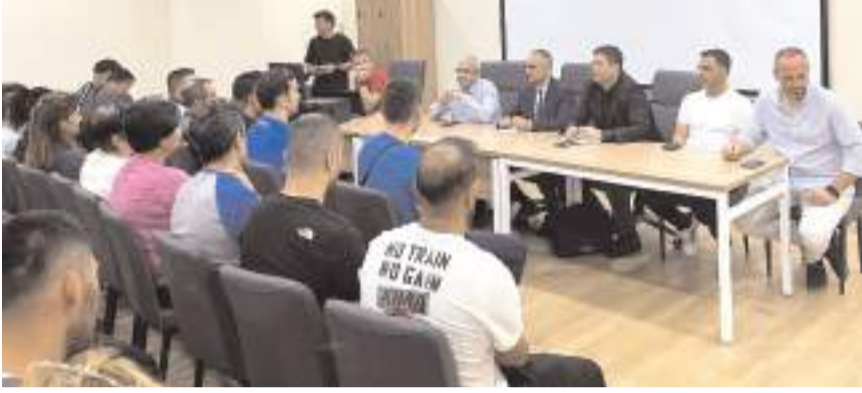
Türkiye Şampiyonasının teknik toplantısına Federasyon temsilcileri ve kulüpler katıldı

ganizasyonun sporcular ve Çorum için hayırlı olmasını temenni etti. Türkiye Şampiyonasında Osmanlıcık ve Çorum'dan toplam 22 sporcu madalya mücadelesi veriyor.