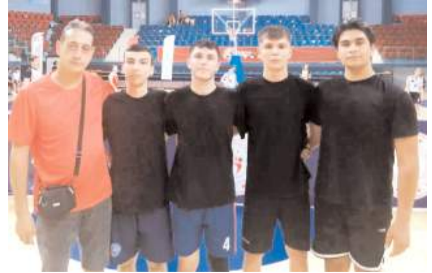
Çorum 3x3 Basketbol takımı Düzce'de grup maçlarını çifte galibiyet ile başladı

mücadele ediyor. 23 takımın altışarlı üç grupta mücadele ettiği bölge birinciliğinde Çorum B grubunda Ordu, Amasya, Düzce, Trabzon ve Amasya ile yer aldı. Çorum 3x3 Basketbol takımı ilk maçında Amasya'yı 6-4 yenerek iyi başlangıç yaptığı grupta ikinci maçında ise Trabzon önünde 10-4 galip geldi ve iddialı bir başlangıç yaptı. Grup maçları sonunda birinci olan takımlar Türkiye finallerinde mücadele etmeye hak kazanacaklar.