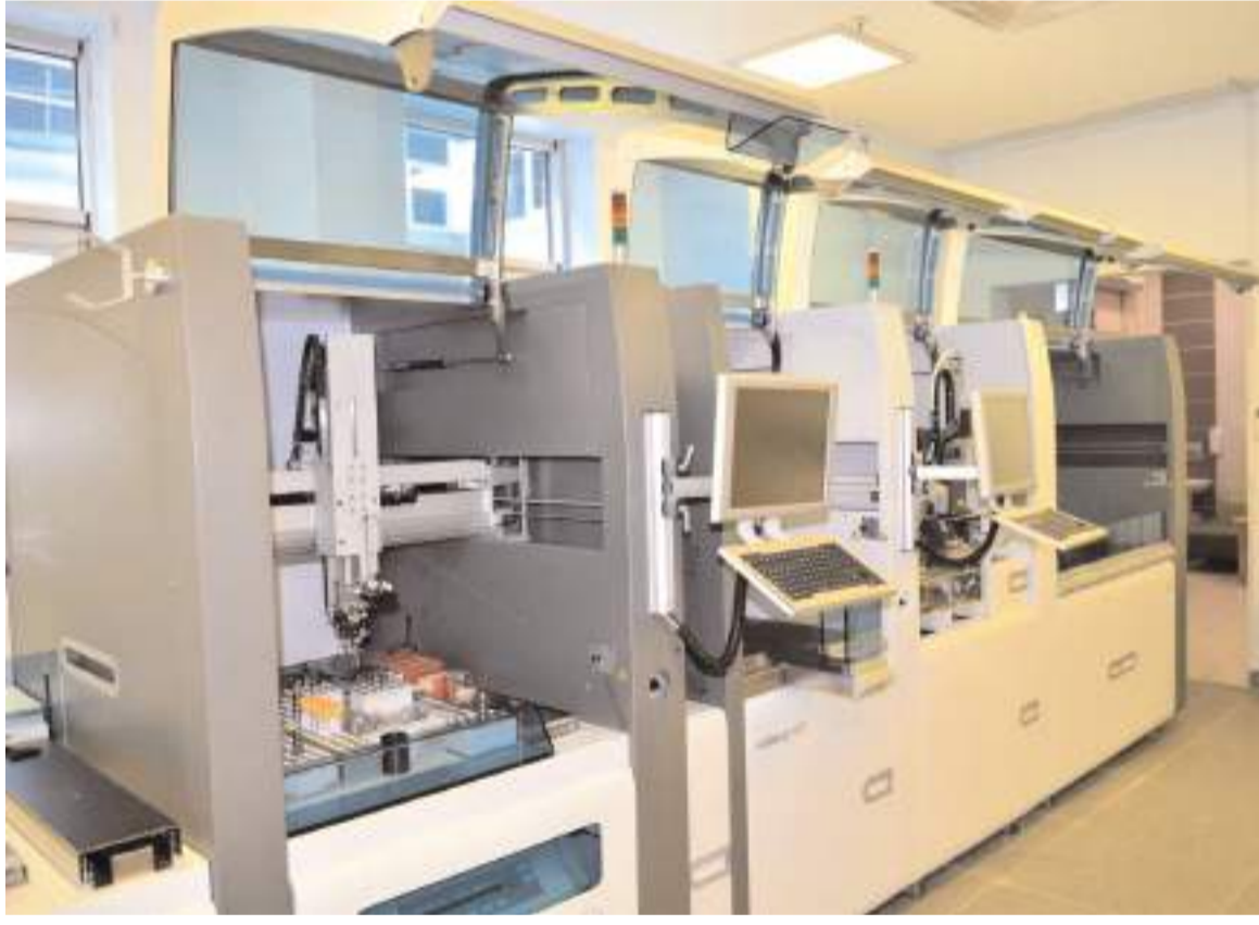
Cihazla daha az personel ile daha hızlı, doğru ve güvenilir laboratuvar hizmeti sunulacak.