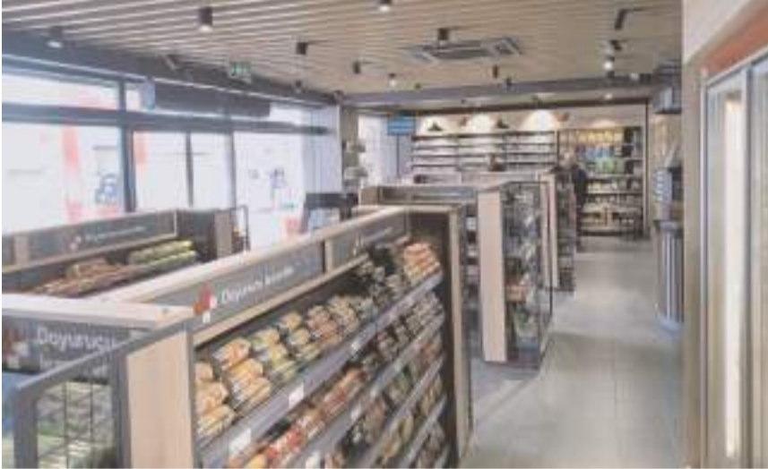
İstasyonda market bölümünde bulunuyor.