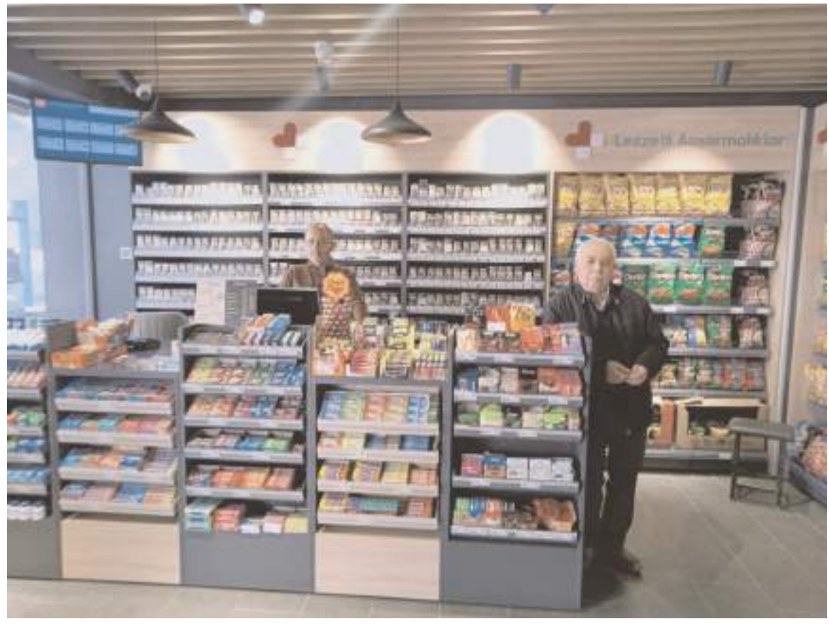
Özsaraçoğlu Petrol eski yerinde yeni yüzüyle faaliyetlerine devam ediyor.