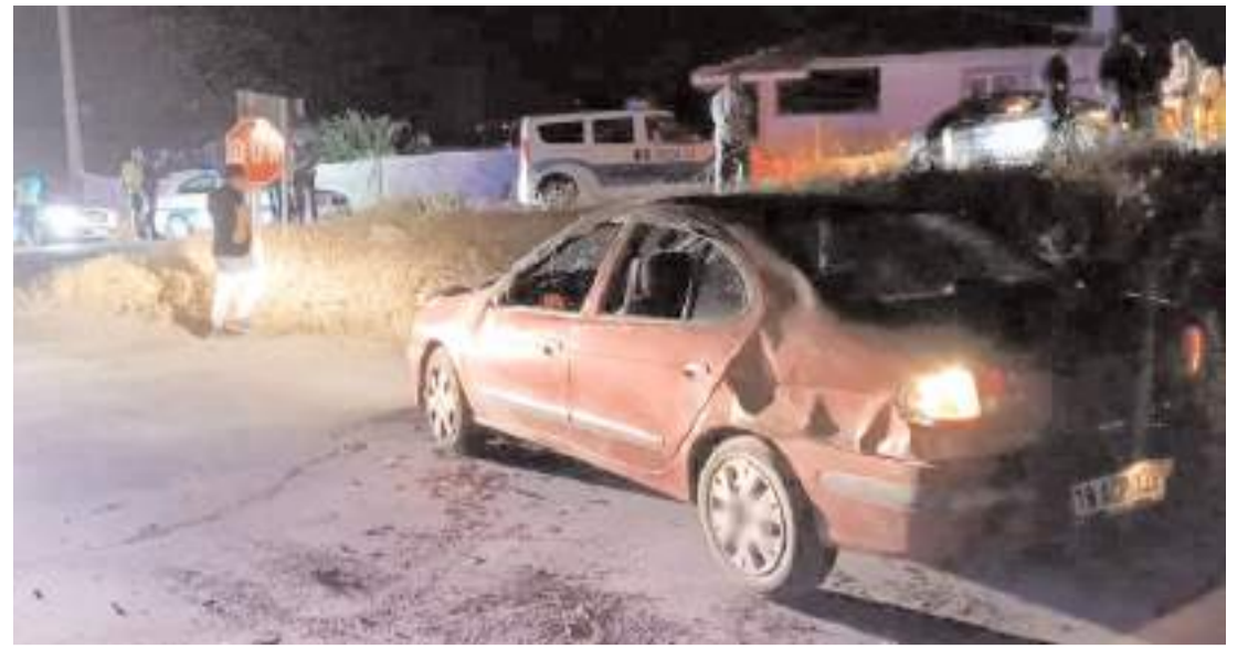
Kaza, Eskişehir köyü yolunda meydana geldi.

Gözaltına alınan 30 şüpheli hakkında "nitelikli dolandırıcılık, resmi belgede sahtecilik ve kaçakçılık" suçlarından soruşturma başlatıldı. (İHA)