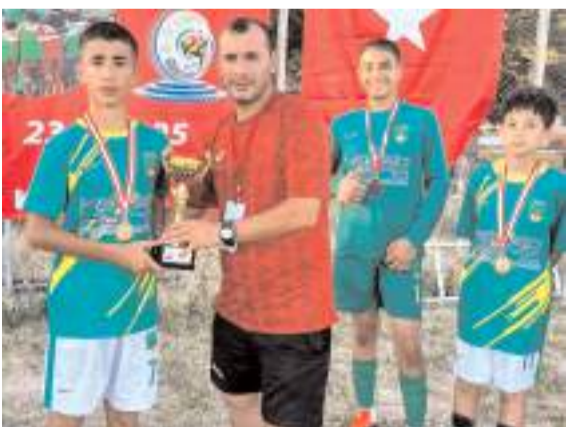
Kapadokya turnuvasında mücadele eden İskilipspor takımı centilmen takım ödülünü alırken