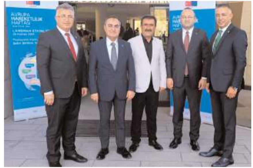
Başkanlar belediyelerin eksikleri ve taleplerini Ekrem İmamoğlu'na iletti.

Oğuzlar Belediye Başkanı Mustafa Cebeci ile birlikte Türkiye Belediyeler Birliği Başkanlığına seçilen İstanbul Büyükşehir Belediye Başkanı Ekrem İmamoğlu'nu ziyaret etti.