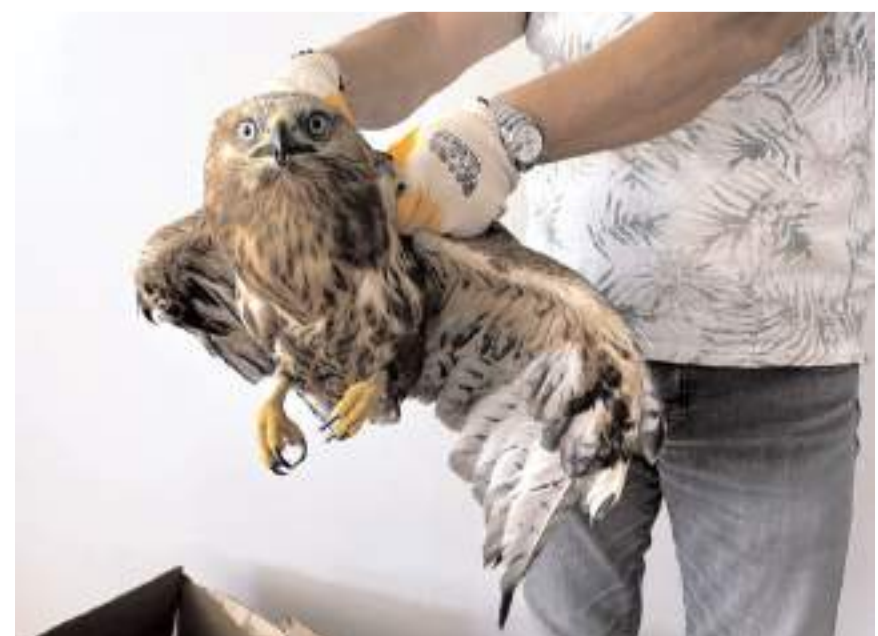
Yaralı şahin, Çorum Milli Parklar Müdürlüğü ekiplerine tedavi için teslim edildi.

Yaralı kızıl şahinin tedavisinin ardından doğal yaşam alanına bırakılacağı bildirildi. (Haber Merkezi)