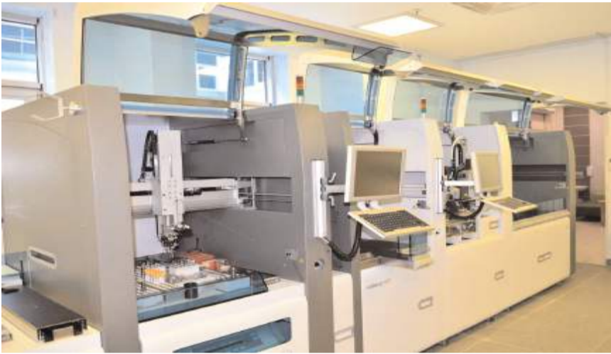
Yeni alınan cihaz, Erol Olçok Eğitim ve Araştırma Hastanesi'nde kullanılmaya başlandı.

Çalışılan test sayısı ve çeşitliliği fazla olan hastaneler için hastanın aynı günde laboratuvar test sonuçlarını alarak ve ilgili klinisyenle görüşerek primer tedavisinin başlaması için bu tip otomatize ve robotik sistemler hastaneler için lüks olmaktan çıkmış, artık günümüz ihtiyaçları için bir gereklilik haline gelmiştir. Çok yakın zamanda yapay zekanın laboratuvarlarda kullanılması ve bu tip cihazlara entegre edilmesi gündeme gelecektir. Hizmetin sağlanması ve sürdürülmesinde büyük bir özveri ile çalışan hastanemiz biyokimya uzmanlarına, laboratuvar çalışanlarına, laboratuvarın tasarlanması, alt yapı süreci, kurulumu ve işler hale gelmesi cihazların temin edilmesi aşamalarında katkı ve destek sağlayan herkese teşekkür ederiz. Hastanemizde güncel bilgi ve teknolojiye uygun iyileştirici faaliyetler devam edecektir" bilgilerine yer verildi. (Haber Merkezi)