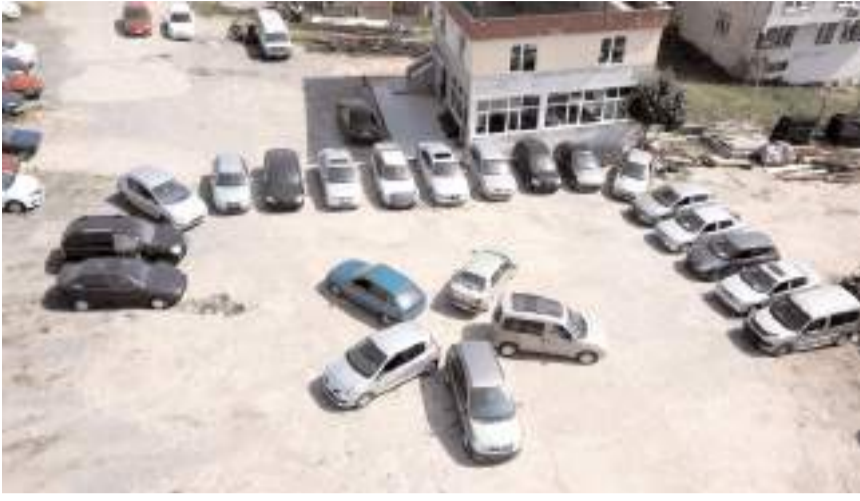
Operasyonda çok sayıda araç ele geçirildi.