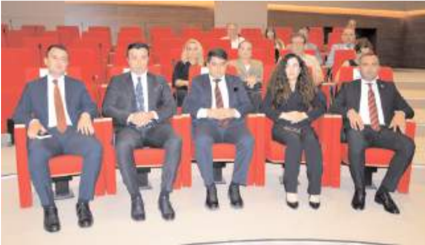
Program Çorum Ticaret ve Sanayi Odasında yapıldı.

tarhinde açıkladığı Avrupa Yeşil Mutabakatı (AYM) ile 2050 yılında iklim-nötr ilk kıta olma hedefini ortaya koymuştur. AB, bu hedefe ulaşmak için yeni bir büyüme stratejisi benimseyeceğini ve tüm politikalarını iklim değişikliği ekseninde yeniden şekillendireceğini açıklamıştır. Sanayiden finansmana, enerjiden ulaşıma ve binalardan tarıma uzanan bir dizi alanda AB politikalarında kapsamlı değişiklikler öngören Yeşil Mutabakat, Tek Pazar'ın tesisinden bu yana AB'nin en büyük girişimlerinden birisidir. Bu kapsamda, AB'nin iklim, enerji, arazi kullanımı, ulaşım ve vergilendirme politikalarının 2030 yılına kadar