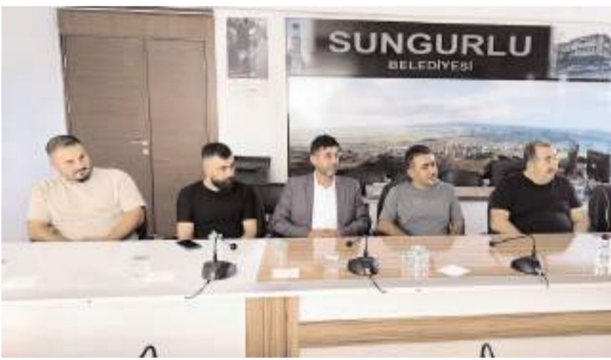
Toplantıda ekmeğin fiyatı ile ilgili karar alındı.