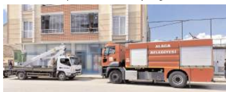
İtfaiye ekipleri, çıkan yangını büyümeden kontrol altına alarak söndürdü.