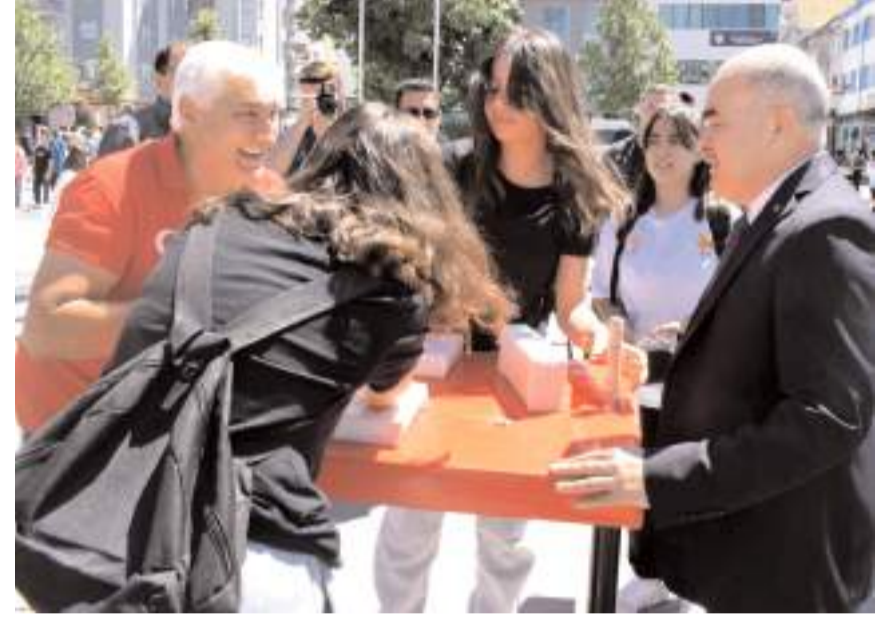
Vali Zülkif Dağlı Bilek Güreşi yapan gençlerin müsabakasını izledi

rinden kayıt yaptırmaya şartı ile birlikte sporcu sayısında gerçekçi rakamlar ortaya çıkacak. Veliler çocuklarını E devlet üzerinden istedikleri branşlara kayıt yaptırabilecekler. Çalışmaların yaz boyunca devam edeceği ve burda yetenekli görülen isimlerin lisansa edileceği belirtildi.