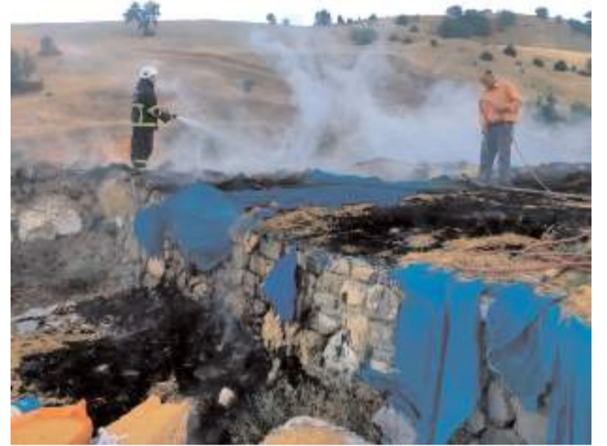
Yangın büyümeden itfaiye ekipleri tarafından söndürüldü.

Osmancık Belediyesi itfaiye ekiplerince vatandaşların yardımıyla söndürülen yangın sonucu depo bölümündeki bir miktar saman ve park halindeki kamyonet yandı. (AA)