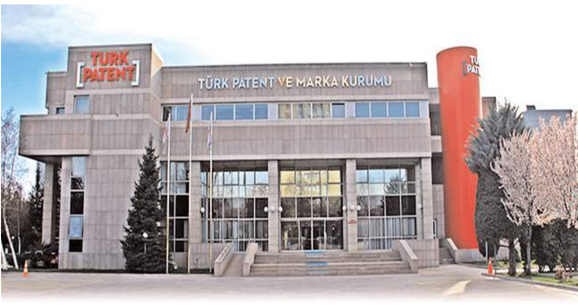
Marka başvurusunun en yüksek olduğu iller arasında Çorum'da bulunuyor.

Balıkesir, Manisa, Hatay, Şanlıurfa, Trabzon, Çanakkale, Kahramanmaraş, Diyarbakır, Ordu, Malatya, Mardin, Afyon, Isparta, Rize, Elazığ, Nevşehir, Sivas, Aksaray, Düzce, Çorum, Yalova, Kütahya, Kırklareli, Batman, Bolu, Erzurum, Edirne olarak bildirildi. (Haber Merkezi)