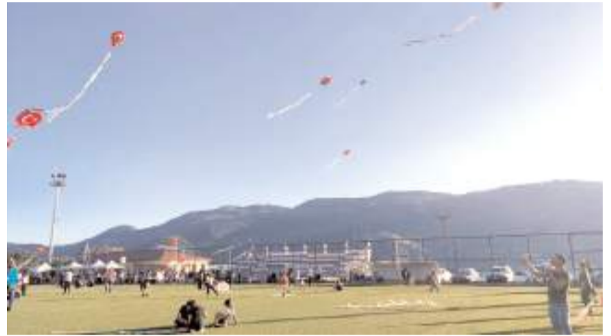
Şenlikte çocuklar ile aileleri neşeli anlar geçirdi.

Etkinlikte ayrıca, hayırseverlerin katkılarıyla öğrencilere ve ailelerine yemek