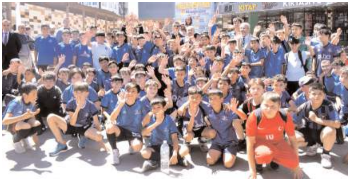
Futbol branşında çalışmalara katılan sporcular tören sonunda protokol üyeleri ile birlikte toplu halde