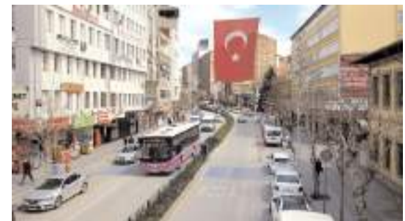
Çorum'da trafiğe kayıtlı araç sayısı mayıs ayında 203 bin 141'e yükseldi.