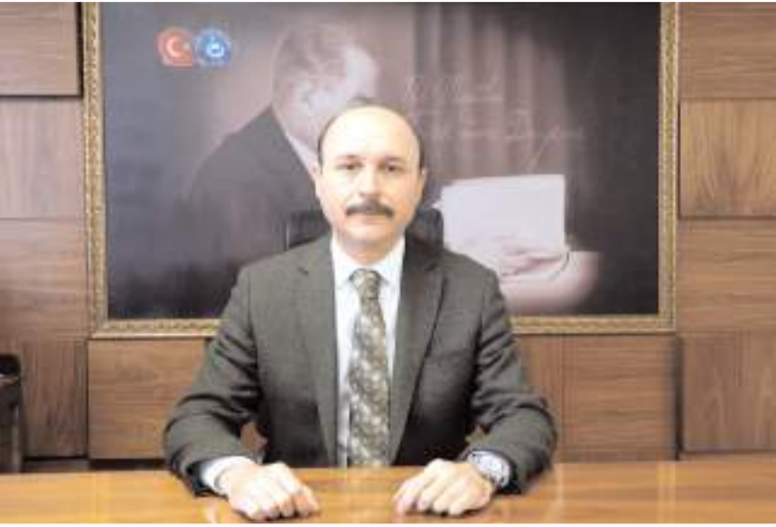
Türk Eğitim-Sen Genel Başkanı hemşehrimiz Talip Geylan

Talip Geylan, Çorum ziyaretinde 29 Haziran Cumartesi günü saat 18.00'de Hitit Mesleki ve Teknik Anadolu Lisesi'nde şube yönetim kurulları, ilçe temsilcileri ve iş yeri temsilcileri ile istişare toplantısı yapacak.