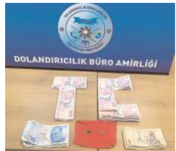
Dolandırıcının üzerinden çıkanlara el konuldu.