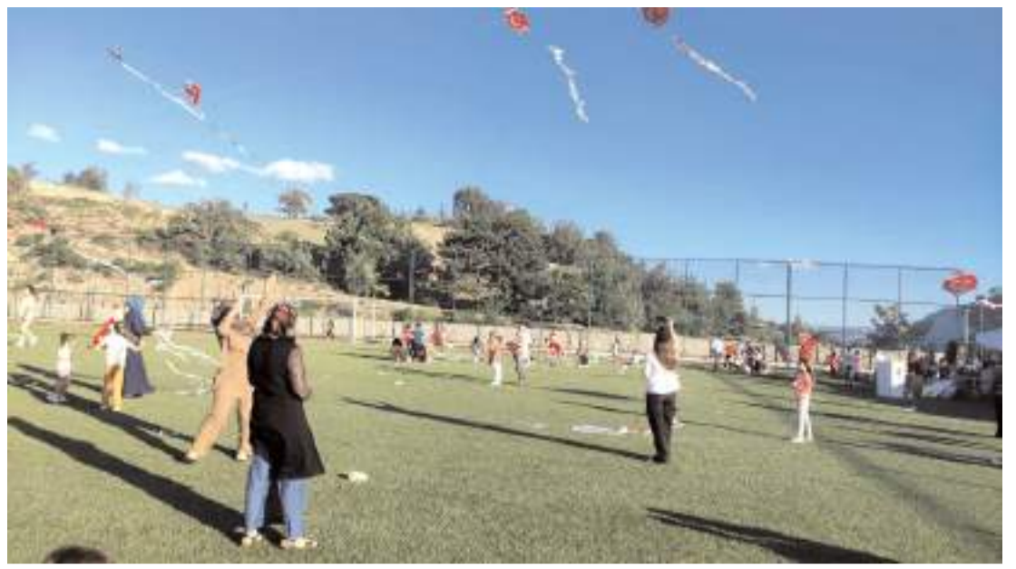
Şenlik Oğuzlar İlçe Stadı'nda yapıldı.