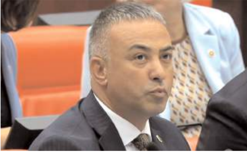
CHP Çorum Milletvekili Mehmet Tahtasız

■ CHP Çorum Milletvekili Mehmet Tahtasız, TBMM Genel Kurulu'nda yaptığı bir dakikalık konuşmada AK Parti iktidarının Çorum karnesini açıkladı.