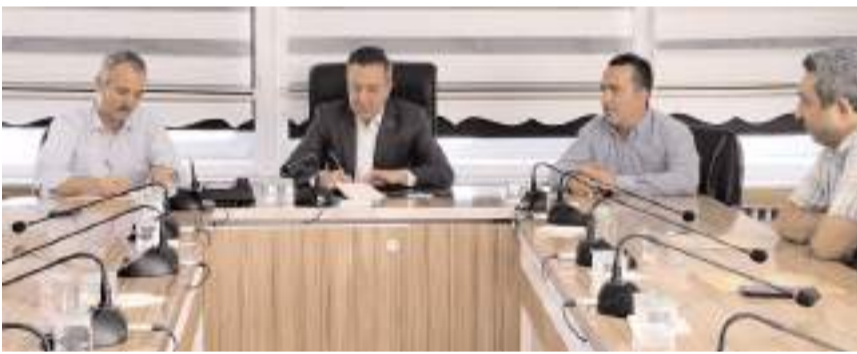
Sungurlu Belediye Başkanı Muhsin Dere, fırıncılarla bir toplantı gerçekleştirdi.