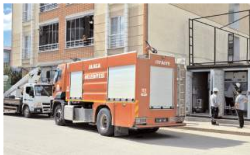
Olay Zile Caddesi üzerinde meydana geldi.

Edinilen bilgilere göre, Zile Caddesi üzerindeki Alaca Mesleki ve Teknik Eğitim Merkezi Anadolu Teknik Lisesi yanında bulunan trafo merkezinde henüz bilinmeyen bir sebepten dolayı yangın çıktı. Trafodan alevler yükseldiğini gören vatandaşlar konuyu itfaiyeye haber verdi. İhbar üzerine belirtilen adrese gelen itfaiye ekipleri, çıkan yangını büyümeden kontrol altına alarak söndürdü. (İHA)