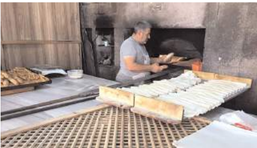
Ekmeğin tekrar 200 gram olarak üretilecek ve 8 liradan satılacak.

Sungurlu'da Kurban Bayramı nedeniyle 300 grama yükseltile ve 12 liradan satılan ekmeğin yarından itibaren eski gramajı ve fiyatına dönüyor.