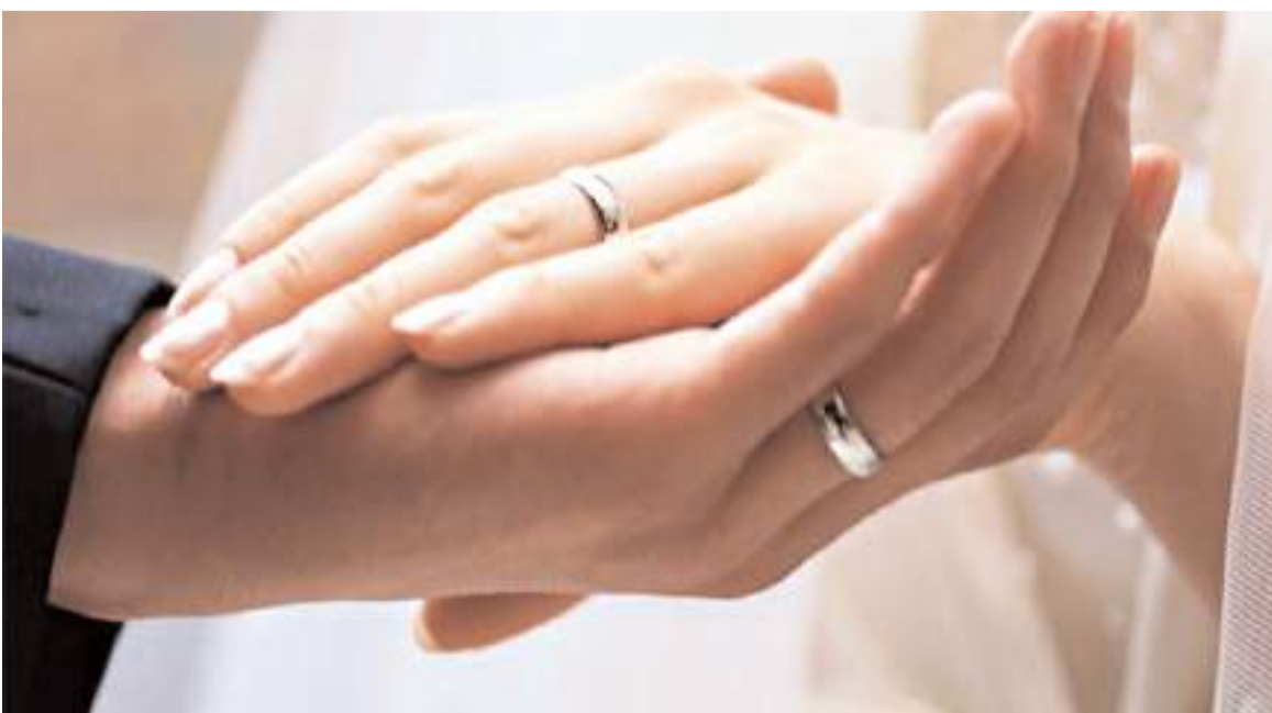
Türk vatandaşlığı almak için evlenenlerin önüne geçebilmek amacıyla, evlenmek isteyen kişilerin ülkede kalış hakkı olması zorunluluğu getirildi.

Yazıda şu ifadeler yer verildi: "Kamu düzeninin sağlanması ve düzensiz göç ile etkin mücadele edilebilmesi amacıyla bir Türk ile bir yabancı veya iki yabancı evlenme işlemlerinde yabancı uyrukluların geçerli pasaportu veya pasaport yerine geçen belge ile birlikte ülkemizde yasal kalış hakkının olması halinde evlenme müracaatının alınması ve durumu, ilinizdeki tüm evlendirme memurluklarına duyurulması." (Haber Merkezi)