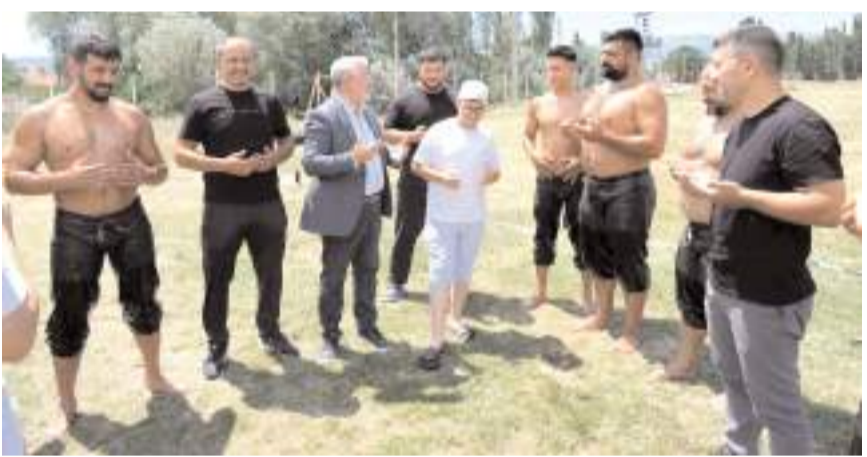
Kırkpınar güreşlerine hazırlanan pehlivanların ziyareti sırasında dua edildi

sında yapılacak olan tarihi Kırkpınar Güreşlerinde Çorum'u en güzel şekilde temsil edeceklerine inanıyorum ve şimdiden başarılar diliyorum. Ziyaret sonunda Kırkpınar'da güreşecek pehlivanlar için yapılan dua ile Çorum'a madalya ve kupa gelmesi diledi.