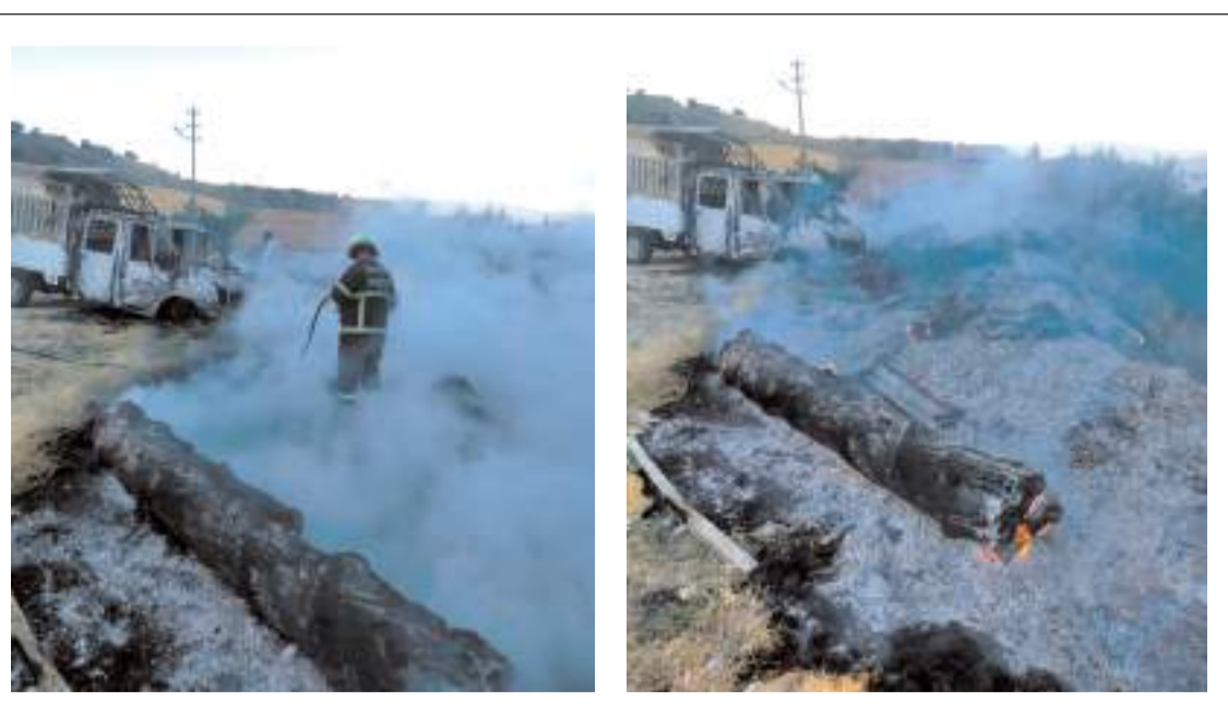
Danişment köyünde gerçekleşen olayda maddi hasar meydana geldi.