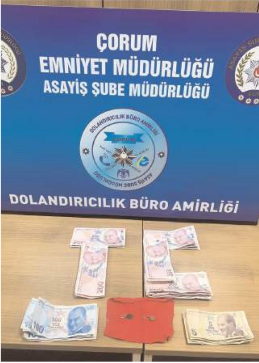
Dolandırıcının üzerinden çıkanlara el konuldu.

Çorum'da kendisini jandarma personeli olarak tanıtan ve yaşlı kadını dolandıran şahıs polis ekipleri tarafından kısıkrak yakalandı.