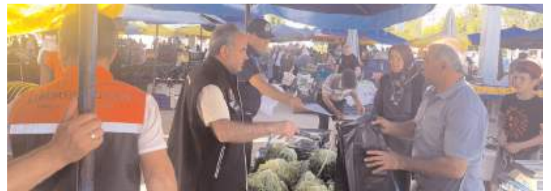
Semt pazarlarında oluşan kirliliği önlemek için pazar esnafı temizlik konusunda uyarıldı.

Başkan Yardımcısı Candan ayrıca, semt pazarlarının çalışma saatlerine de düzenleme getirdiklerini belirterek, "Semt pazarlarımız 08.00 ile 20.00 saatleri arasında alışverişlere açık olacaktır. Vatandaşlarımızın bu saatler arasında pazar yerlerine gelmelerini, esnafımızın da saat 20.00'den sonra temizlik çalışmalarını yapabilmemiz için tezgâhlarını kapatmalarını rica ederiz" dedi. (Haber Merkezi)