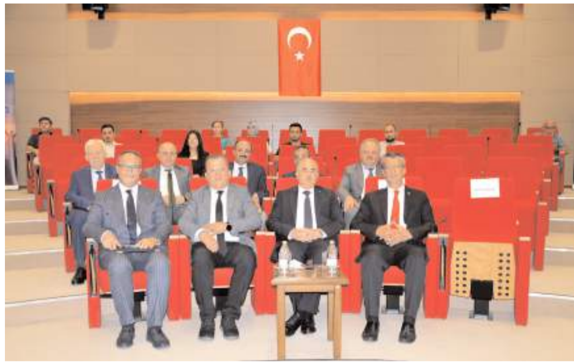
Programa protokol üyeleri de katıldı.