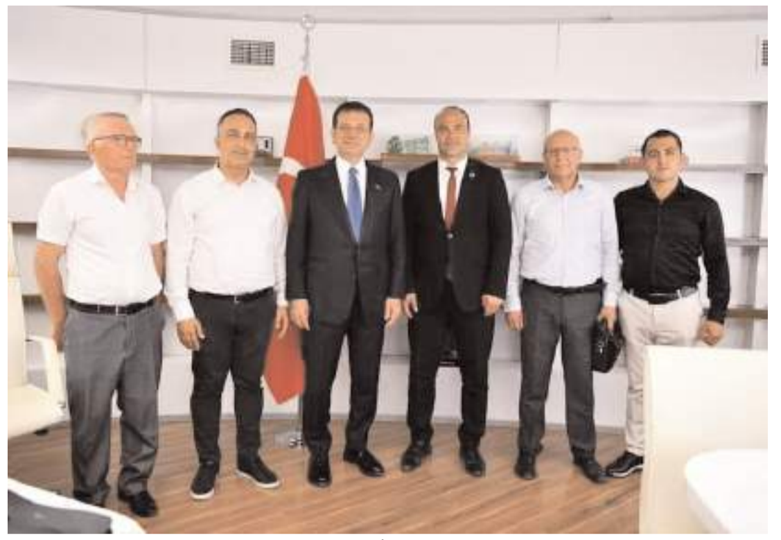
Çorum CHP heyeti, Kargı İlçesi ve Aşdağul Beldesi'nin ihtiyaçları olan konuları İmamoğlu'na aktararak destek istedi.

"Adana 15, Adıyaman 5, Afyonkarahisar 6, Ağrı 4, Amasya 3, Ankara 36, Antalya 17, Artvin 2, Aydın 8, Balıkesir 9, Bilecik 2, Bingöl 3, Bitlis 3, Bolu 3, Burdur 3, Bursa 21, Çanakkale 4, Çankırı 2, Çorum 4, Denizli 7, Diyarbakır 12, Edirne 4, Elazığ 5, Erzincan 2, Erzurum 6, Eskişehir 7, Gaziantep 14, Giresun 4, Gümüşhane 2, Hakkari 3, Hatay 10, Isparta 4, Mersin 13, İstanbul 96, İzmir 28, Kars 3, Kastamonu 3, Kayseri 10, Kırklareli 3, Kırşehir 2, Kocaeli 14, Konya 15, Kütahya 4, Malatya 6, Manisa 10, Kahramanmaraş 8, Mardin 6, Muğla 7, Muş 3, Nevşehir 3, Niğde 3, Ordu 6, Rize 3, Sakarya 8, Samsun 9, Siirt 3, Sinop 2, Sivas 5, Tekirdağ 8, Tokat 5, Trabzon 6, Tunceli 2, Şanlıurfa 14, Uşak 3, Van 8, Yozgat 4, Zonguldak 5, Aksaray 4, Bayburt 2, Karaman 3, Kırıkkale 3, Batman 5, Şırnak 4, Bartın 2, Ardahan 2, Iğdır 2, Yalova 3, Karabük 3, Kilis 2, Osmaniye 4 ve Düzce 3." (Haber Merkezi)