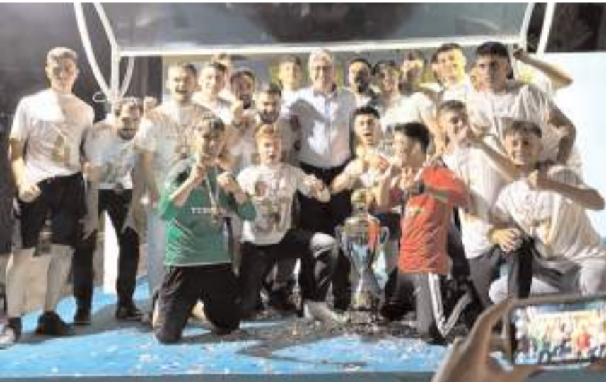
Şampiyon olan Osmancık'ın takımı kupa töreni sonrasında toplu halde