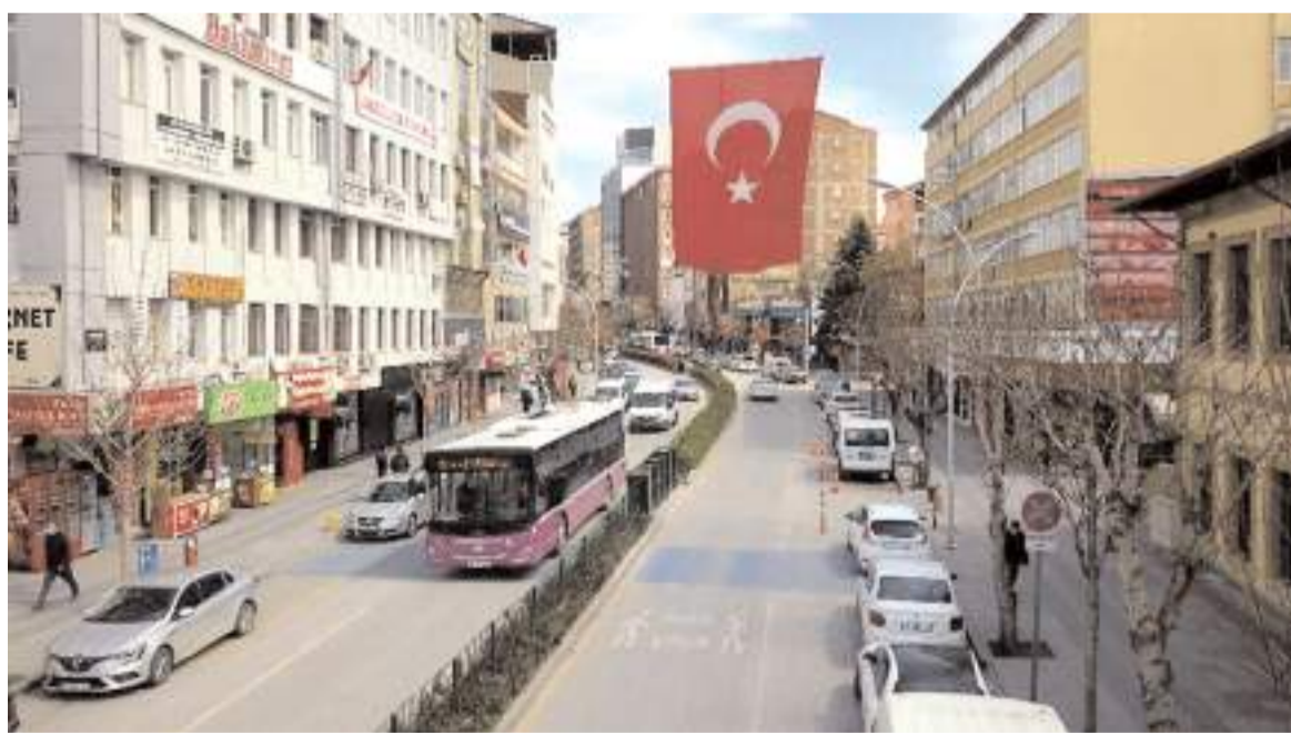
Çorum'da trafiğe kayıtlı araç sayısı mayıs ayında 203 bin 141'e yükseldi.

sıfır. İnşaat hâlinde çürüyen polis meslek yüksekokulu işinden sıfır. Çürümeye terk edilen Yatılı Bölge Okullardan sıfır. Yirmi iki yıldır bitmeyen Osmançık yolu ve Kırkdilim Tüneli'nden sıfır. Karneniz sıfırlarla dolu, 2023 yılında ara karne veren Çorum halkı size 2028 yılında tasdiknamenizi vereceği günü bekliyor." (Haber Merkezi)