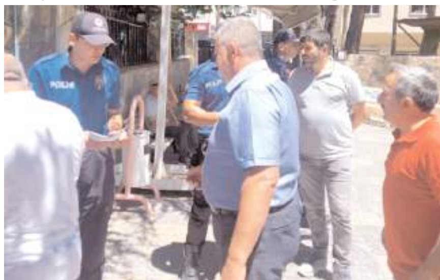
Cuma namazından çıkan vatandaşlara uyuşturucu kullanımının zararlarını anlatan broşürler dağıtıldı.

Mecitözü ilçesinde vatandaşlar, uyuşturucu bağımlılığı hakkında bilgilendirildi.