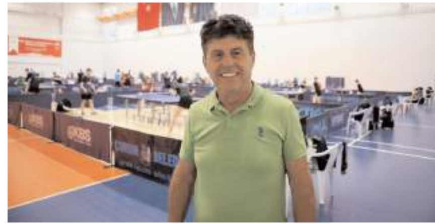
Türkiye Masa Tenisi Federasyonu Başkanı Oktay Çimen

"Buna paralel olarak, Türkiye'de masa tenisi her yerde oynanabilen bir spor dalı. Dedeyle torunun, aneyle kızının oynayabileceği, ileriki yaşlarda da bu