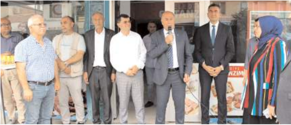
Alaca Belediye Başkanı Şerif Arslan, açılışta konuşma yaptı.