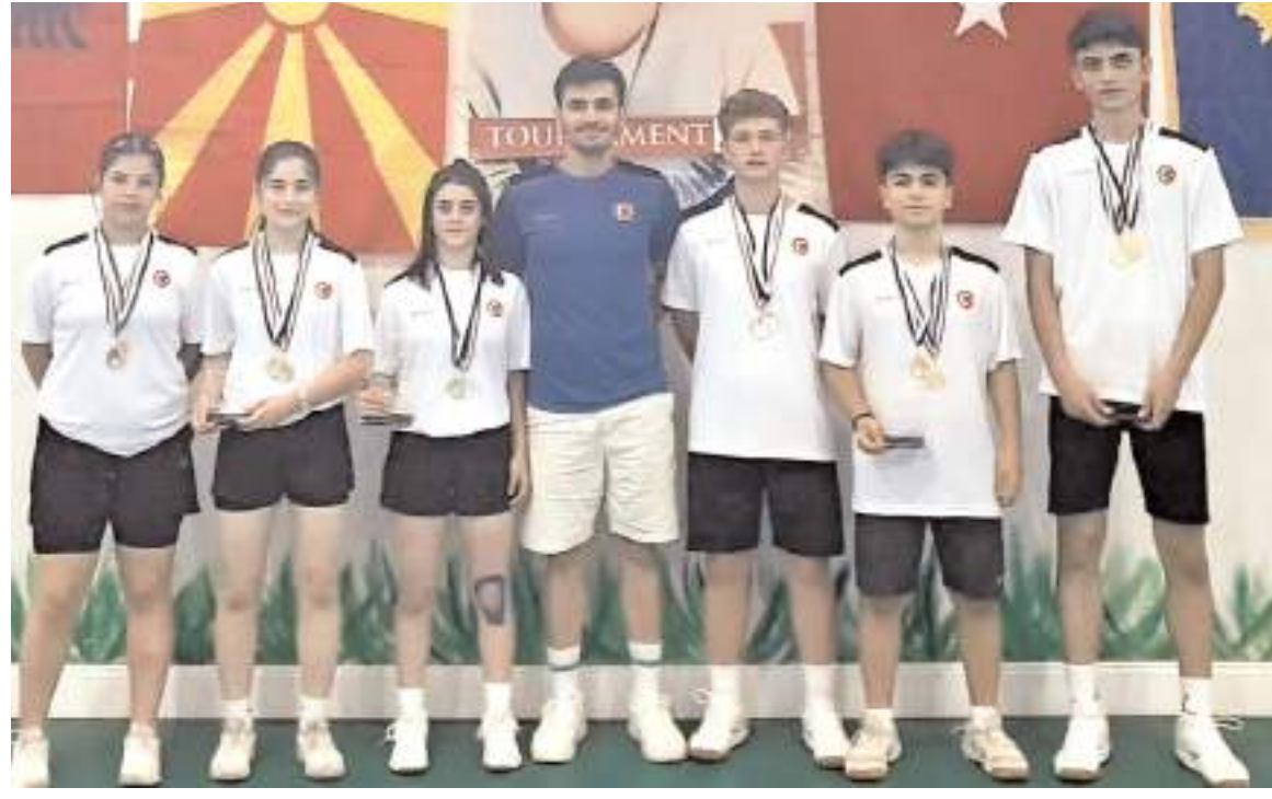
Arnavutluk'ta yapılan turnuvada madalya kazanan sporcular ödül töreni sonrasında toplu halde görülüyor