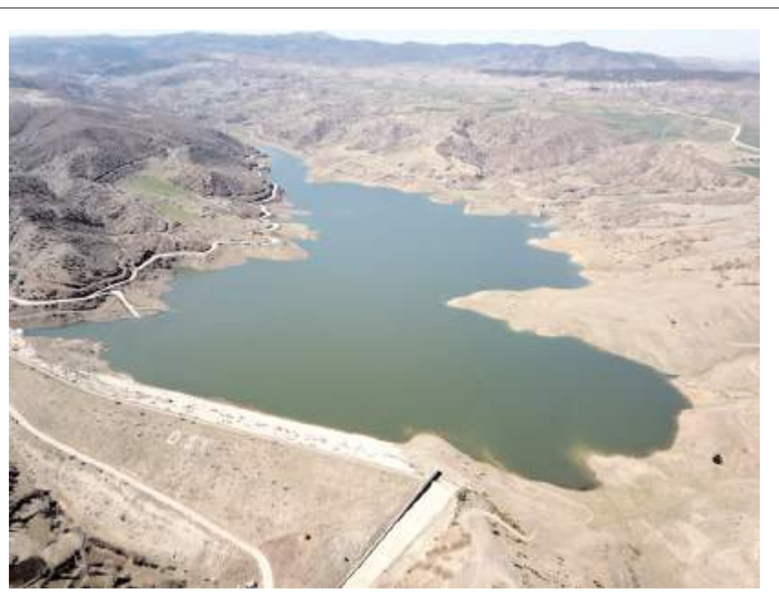
Günlük su tüketimi 75.673 m3 ile son 5 yılın rekor seviyesine ulaştı.

"Mekânımız dar ama gönlümüz geniş" diyen Cıdık, "Ev yapımı lezzetli gözleme çeşitlerimiz, katmer ve poçalarını tatmak isteyen vatandaşlarımızı yeni işyerimize bekliyoruz" dedi.