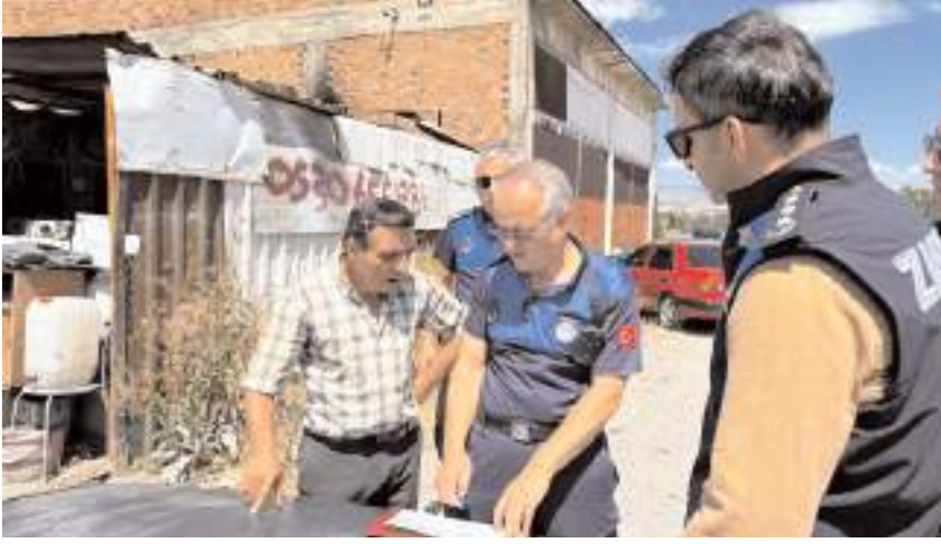
20 hurdacıdan 15'inin taşınma işlemi tamamlandı.

Çorum Belediyesi Zabıta Müdürlüğü'nden yapılan açıklamada, 20 hurdacıdan 15'inin tahliye işleminin gerçekleştirildiği belirtilerek, "Taşınmaları uygun dükkân bulamayan 5 işyerine de 15 gün ek süre verildi. Bu süre içerisinde kalan 5 iş yerinin de tahliyesi sağlanacaktır. Çevre ve görüntü kirliliği oluşturan ve zaman zaman yangın olaylarına sebep olan bu işyerlerinin uygun