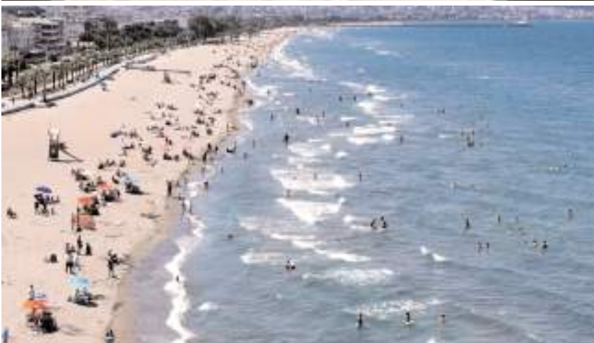
Karadeniz'de boğulanlar arasında ilk sıralarda Çorumlular var.