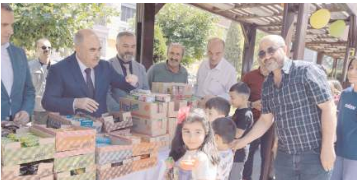
Törene katılanlara ikramlarda bulundu.