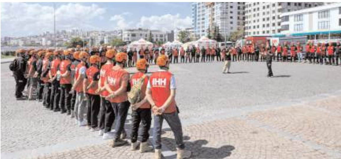
Samsun'da yapılan tatbikata 11 ilden 120 personel katıldı.

İHH Afet Yönetimi Başkanlığı Samsun'da 11 ilden 120 personelin yer aldığı geniş çaplı arama kurtarma tatbikatı düzenledi. Tatbikata Çorum İHH Arama Kurtarma ekibi de katıldı.