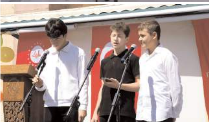
Törende öğrenciler ilahiler söylediler.