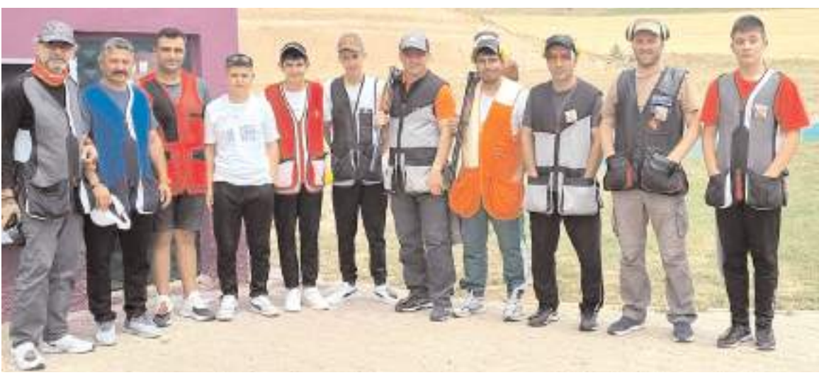
Sivas'ta mücadele eden Çorum Atıcıları müsabakalar öncesinde toplu halde görüldü