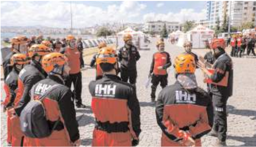
Tatbikatta suda arama kurtarma, doğada arama kurtarma ve kentsel arama kurtarma senaryoları uygulandı.