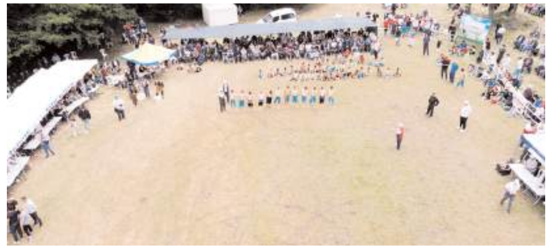
Çamiçi Yaylası Er Meydanı'nda altıncısı düzenlenen güreşlere 1000'den fazla sporcu katıldı.

denle bir anıt dikilmesini talep ediyoruz. Bizler her şeyin iyi olmasını isteyen insanlarız. Kardeşlikten, sevgiden, eşitlikten, hoşgörüden başka gücü olmayan insanlarız. Kardeşliğin, barışın mahalleden, sokaktan başla-