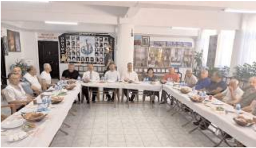
Basın açıklaması Hacı Bektaş Vakfı'nda gerçekleştirildi.