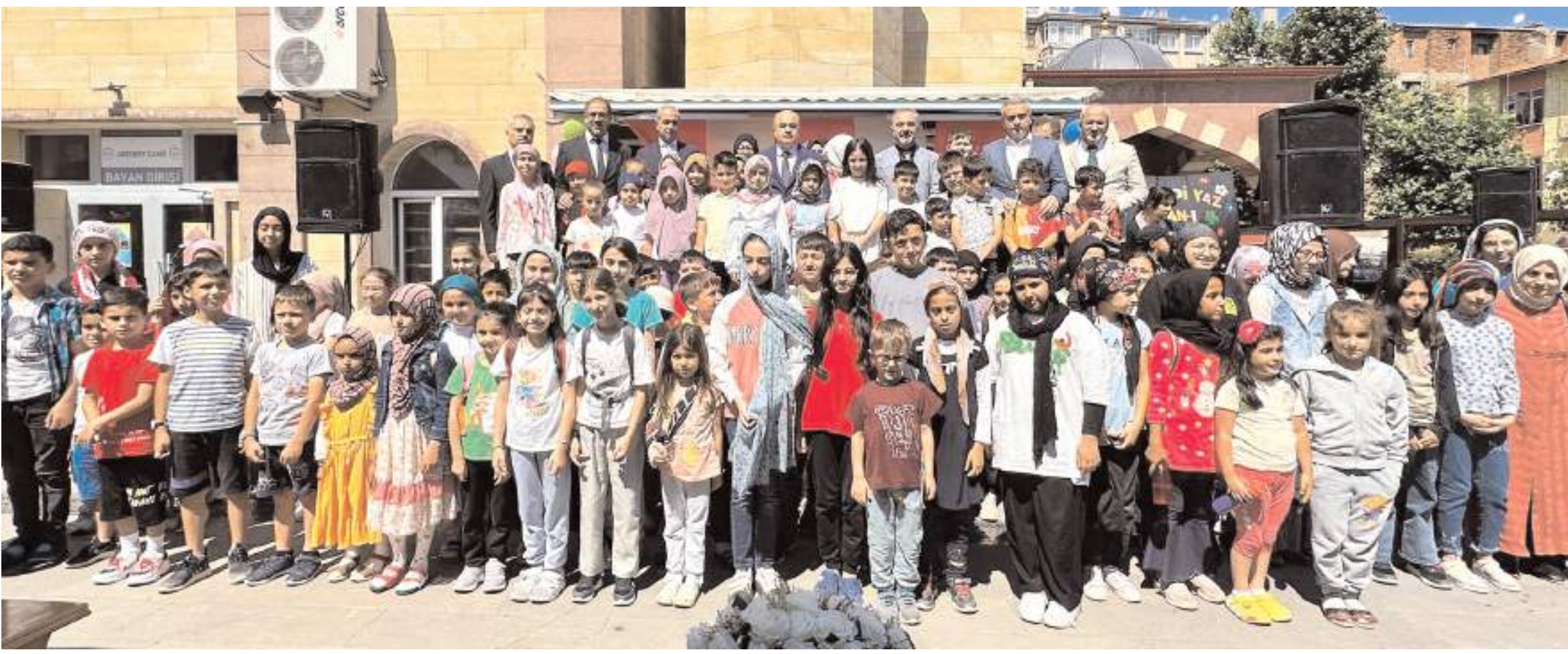
Yaz Kur'an kurslarının eğitim-öğretime başlaması nedeniyle Abdibey Camii'nde tören düzenlendi.