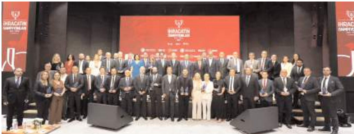
Çimento, Cam, Seramik ve Toprak Ürünleri İhracatçıları Birliği (ÇCSİB), 2023 yılı ihracat şampiyonları ödülleri düzenlenen törende aldı.