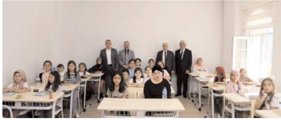
Bu yıl 813 camide 1177 öğretici görev yapacak.