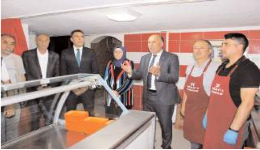
Alaca Belediyesi Et Tanzim Mağazası Ankara Caddesi'nde açıldı.