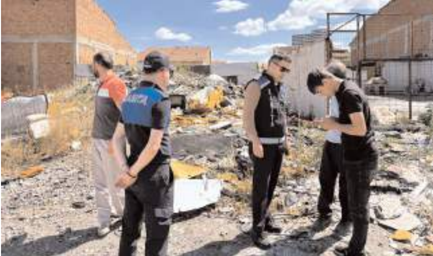
Taşınmaları uygun dükkân bulamayan 5 işyerine 15 gün ek süre verildi.