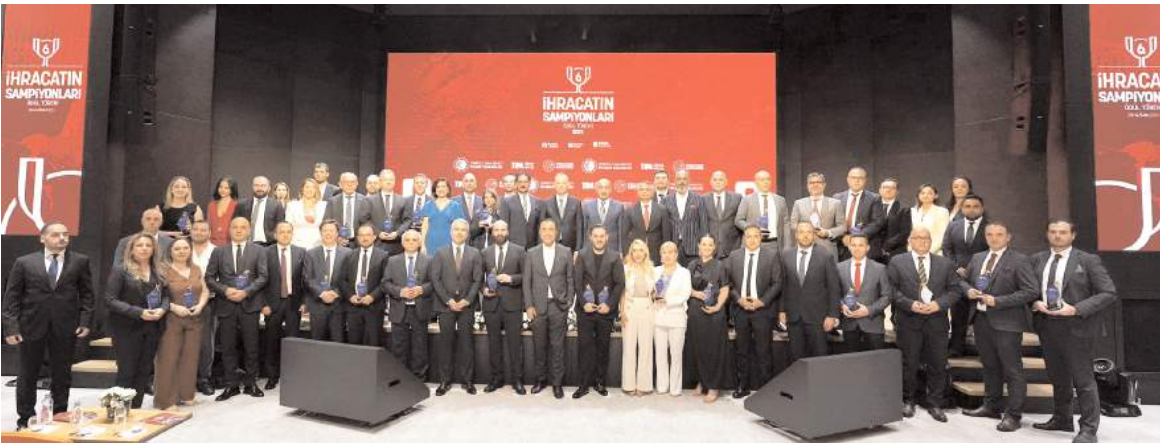
Çimento, Cam, Seramik ve Toprak Ürünleri İhracatçıları Birliği (ÇCSİB), 2023 yılı ihracat şampiyonları ödülleri düzenlenen törende aldı.