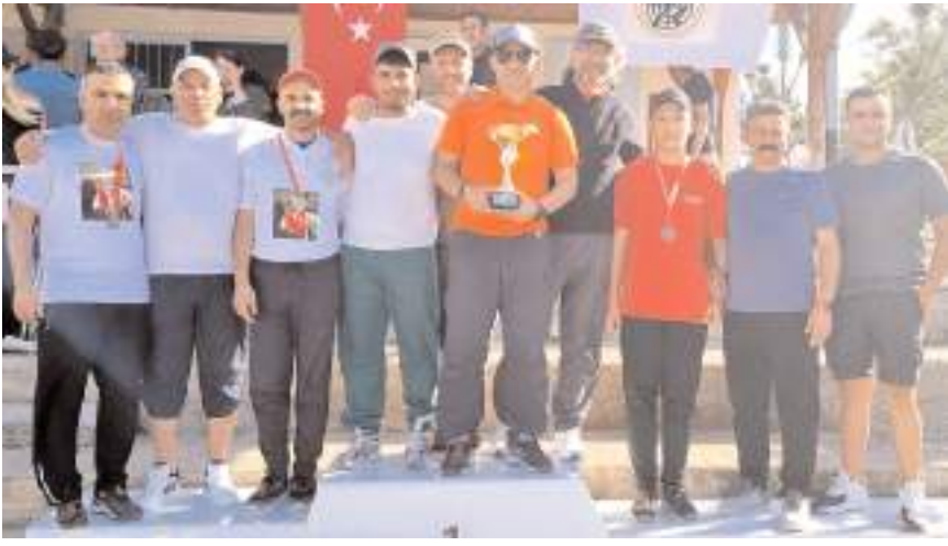
Büyük erkeklerde ikinci olan Çorum takımı diğer illerin takımları ile kürsüde