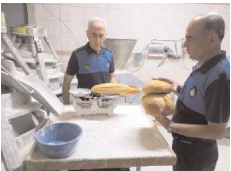
Zabıta ekipleri ekmek ve pidelerin gramajlarını kontrol etti.

Üretilen ekmek ve pidelerin gramajını kontrol eden ekipler, ayrıca fırınları hijyen açısından da denetledi. Açıklamada, denetimlerin belli aralıklarla devam edeceği vurgulandı.(AA)