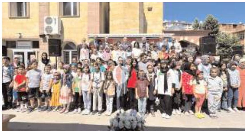
Yaz Kur'an Kurslarının eğitim-öğretime başlaması nedeniyle Abdibey Camii'nde tören düzenlendi.