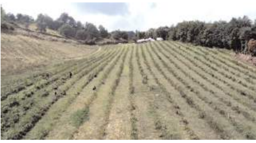
Laçın, Mecitözü ve merkez köylerinde 100-150 dekar alanda aronya yetiştiriciliği yapılıyor.