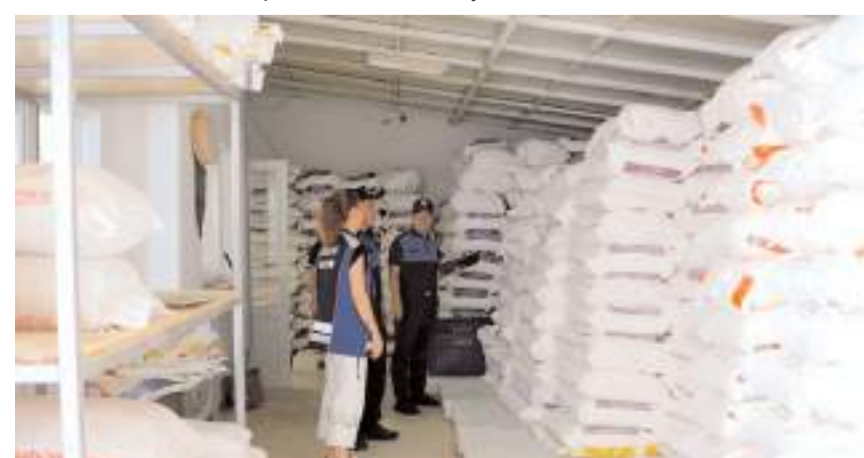
Zabita ekipleri fırınların depolarında incelemede bulundu.