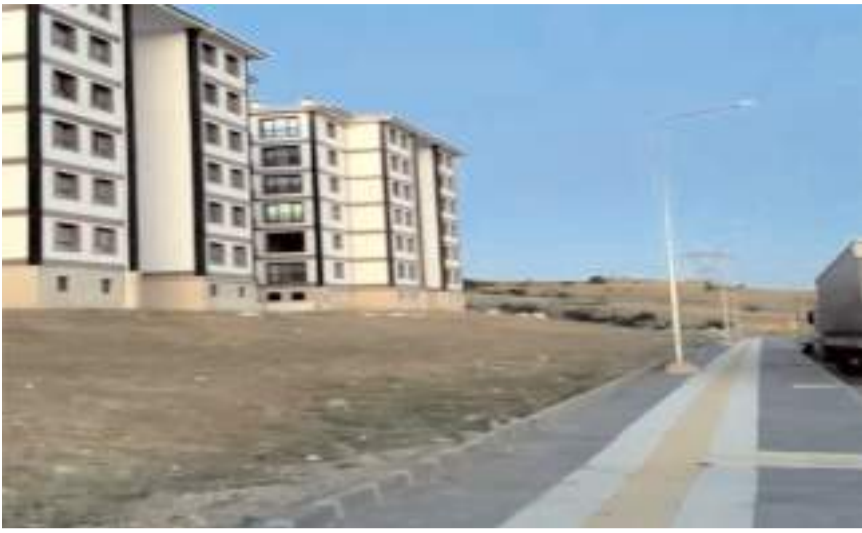
Aydınlatma lambalarının yanmaması bölgeyi karanlıkta bırakıyor.

TOKİ sakinleri Çorum Belediyesi'nin Silmkent yolunda alt yapı çalışmalarını tamamladığı güzergâhta asfalta başlamasını istiyor. Bölge halkı ulaşımında sorun yaşadıklarını vurguluyor. (Haber Merkezi)