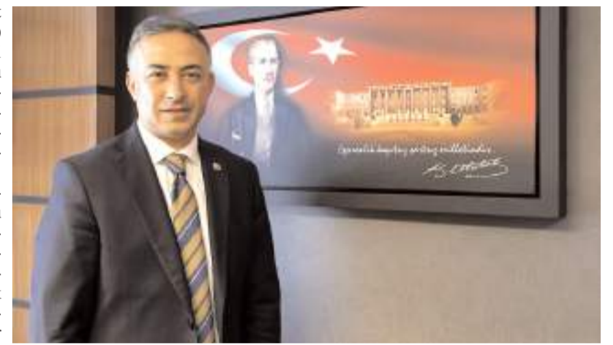
CHP Çorum Milletvekili Mehmet Tahtasız

"Alevi, Sünni, Çerkez, Kürt, göçmen meden kardeşçe yaşadığımız memleketim Çorum'da yaşanan katliamın acısı hâlâ içimizde. İnsanlarımız o günü düşündüğü zaman bugün bile uykuları kaçıyor. Dış güçlerin kirli maşaları olan, bindirilmiş kitalar tarafından başlatılan olaylarda aralarında 57 canımız vahşice katledildi, yüzlerce hemşehrimiz