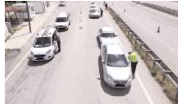
Denetimlerde 68 bin 413 araç kontrol edildi.