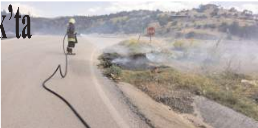
Olay D100 kara yolu Öbektaş köyü yakınlarında meydana geldi.

Osmancık Belediyesi itfaiye ekiplerince söndürülen yangın nedeniyle yaklaşık 2 dekar alandaki otlar yandı. (AA)