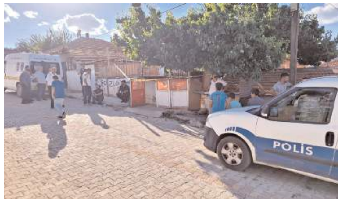
Olay Sungurlu'da Bahçelievler Mahallesi'nde meydana geldi.