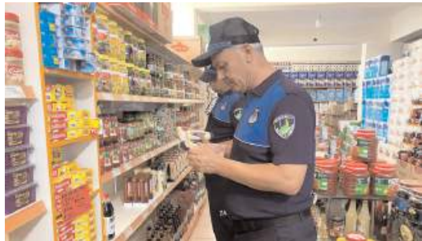
Zabıta ekipleri ürünlerin raf ve kasa fiyatlarını karşılaştırdı.