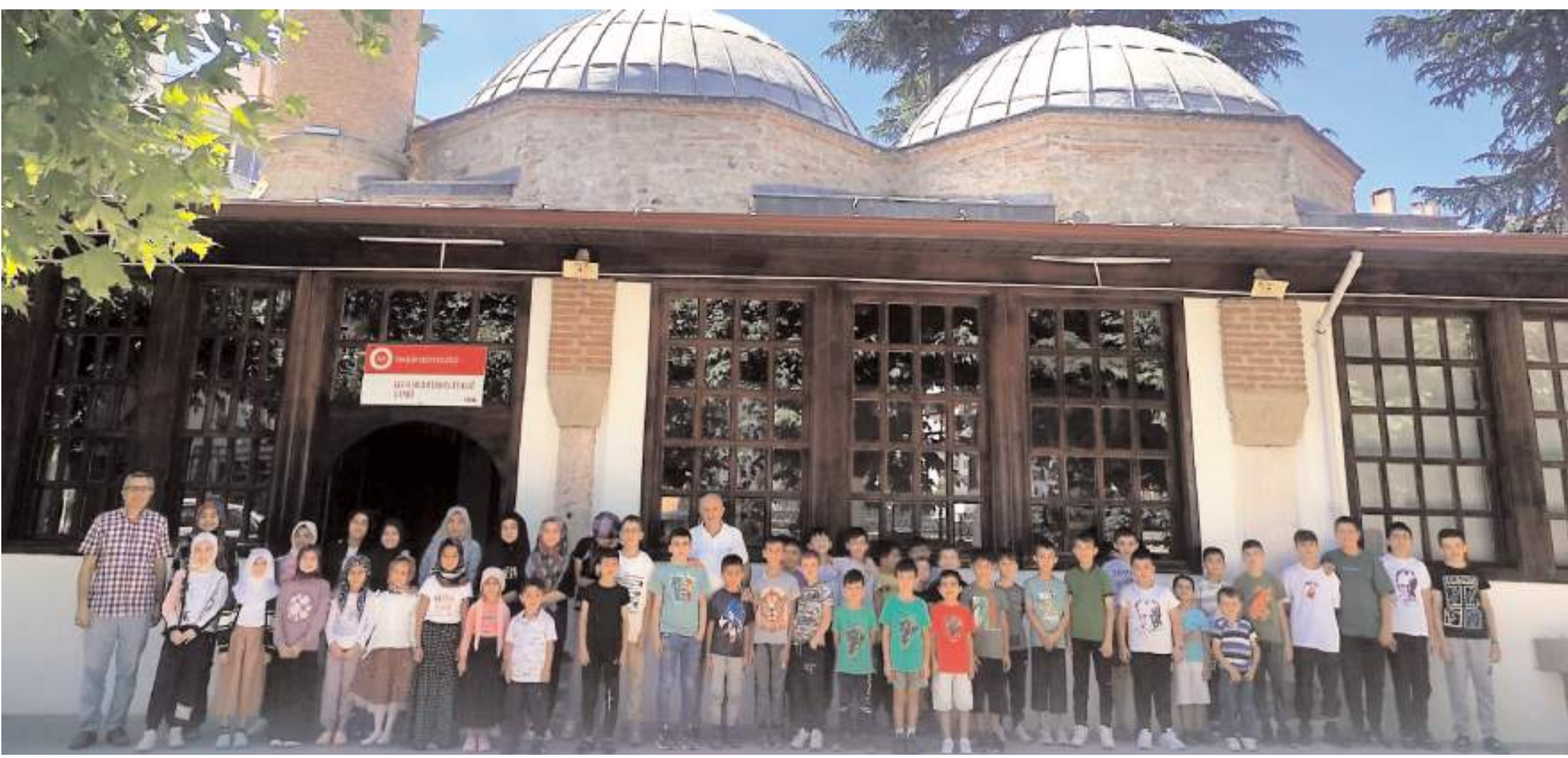
Yaz Kur'an kurslarına ilgi yüksek oldu.