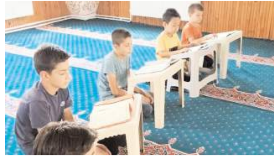
Kurslarda Kur'an-ı Kerim ve dini bilgiler öğretiliyor.

tamayacakları bir hatıraları olsun" diyerek öğrencileri kurslara davet etti. (İHA)