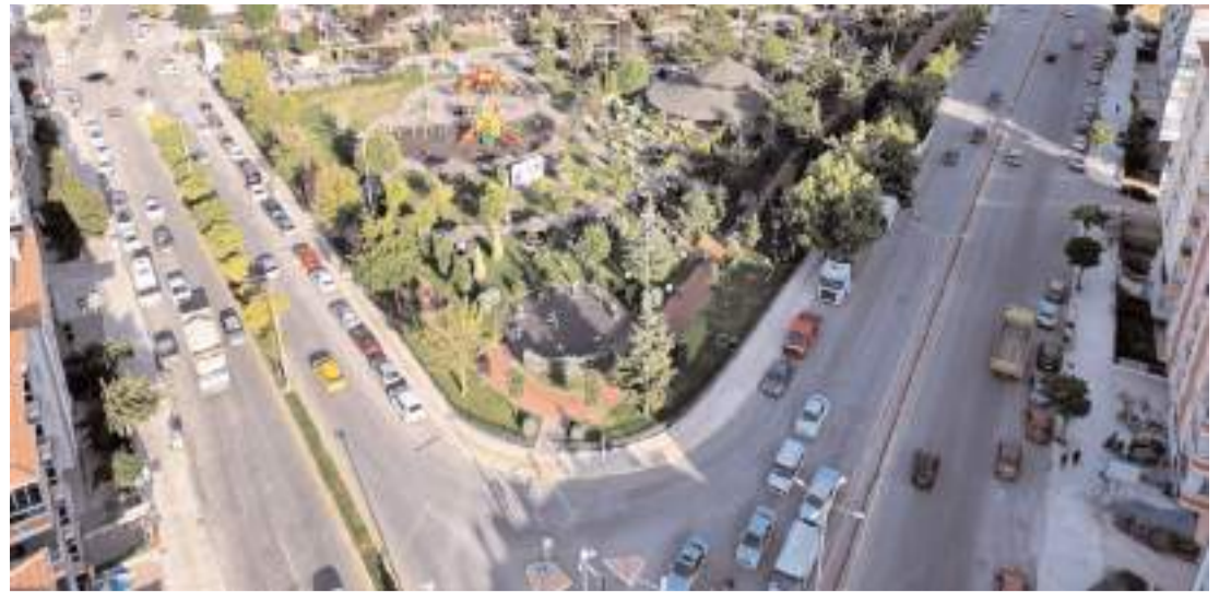
Program Gülabibey Mahallesi Rüstem Eren Parkı'nda yapılacak.