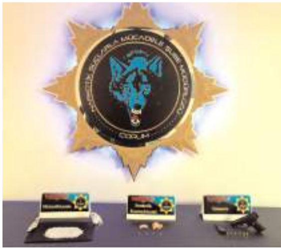
Operasyonda 3 bin 350 gram skunk, 180 gram sentetik kannabinoid hammaddesi ele geçirildi.

Adliyeye sevk edilen 8 şahıs da tutuklanarak cezaevine teslim edildi. (İHA)