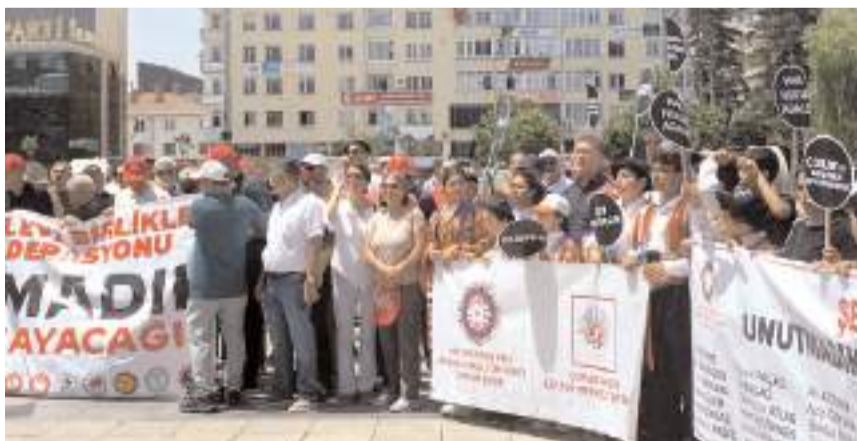
Anma programında konuşmalar yapıldı.