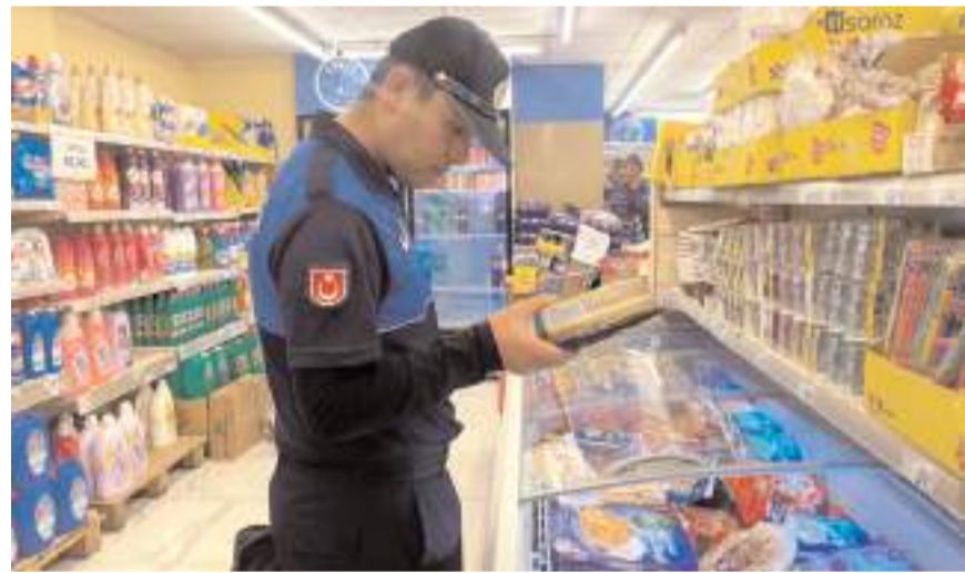
Zabıta ekipleri ürünlerin son kullanma tarihlerini kontrol etti.

Konuyla ilgili yapılan açıklamada halk sağlığı ve tüketicilerin haklarının korunması amacıyla zabıta ekipleri tarafından yapılan denetimlerin periyodik aralıklarla ve devam edeceği belirtildi. (Haber Merkezi)