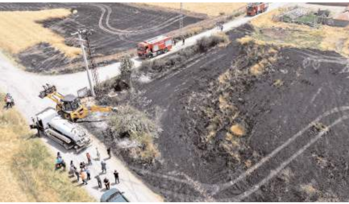
Yangında 31 dönüm ekili arazi ile 600 saman balyası ve meyvelik kül oldu.