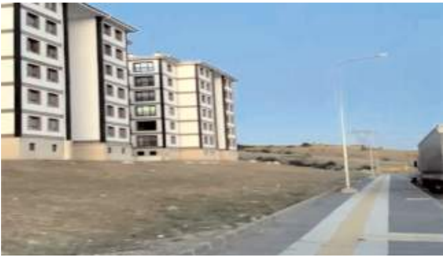
Aydınlatma lambalarının yanmaması bölgeyi karanlıkta bırakıyor.

■ Silmkent TOKİ konutları ikamet eden vatandaşlar yanmayan aydınlatmalar ve asfaltlanmayan yollar nedeniyle sorun yaşıyorlar. * HABERİ'4'DE