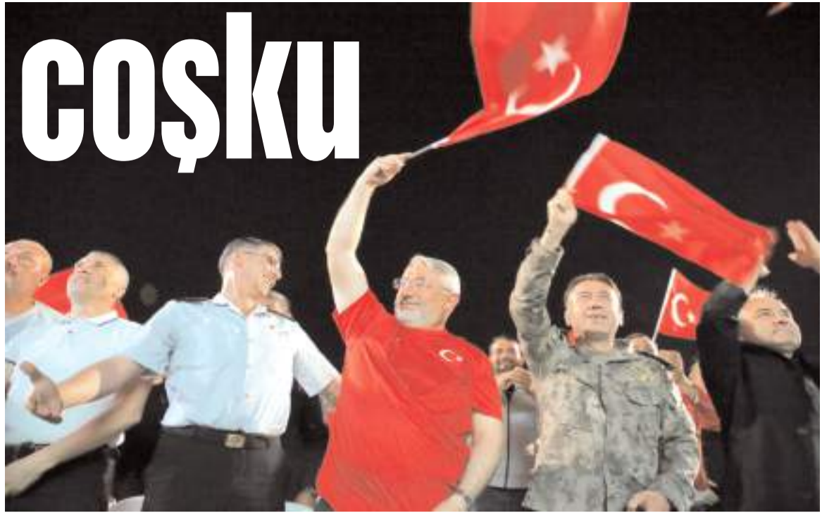
Maçın ardından vatandaşlar ile birlikte protokol üyeleride Kadeş Meydanında galibiyet sevincini yaşadılar