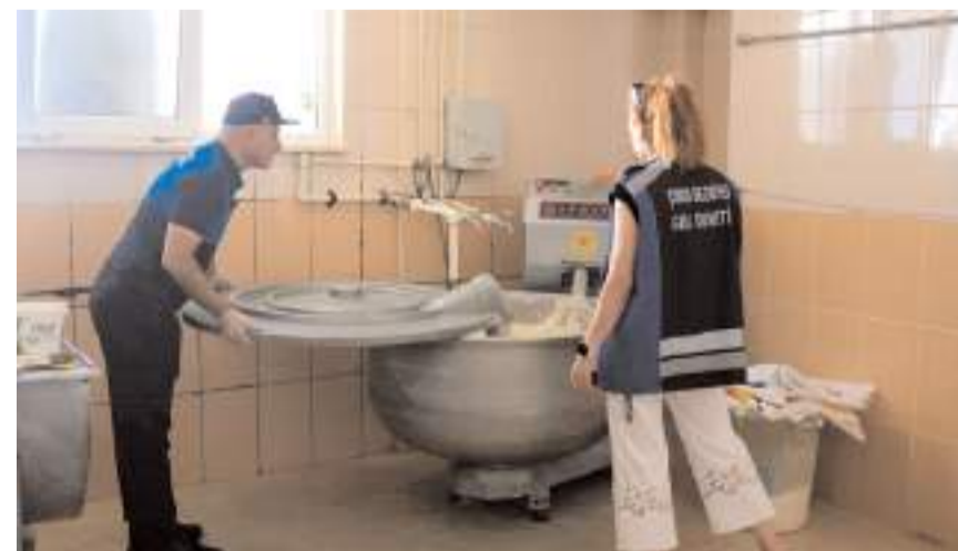
Ekipler fırınların üretim yerlerini denetledi.

Zabita Müdürlüğü'nden yapılan açıklamada, "Denetimlerimizin amacı, tüketicilerin sağlıklı ve güvenilir şekilde ekmek ve unlu mamuller tüketmelerini sağlamak ve işletmelerin yasal düzenlemelere uygun olarak faaliyet göstermelerini sağlamaktır" denildi. (Haber Merkezi)