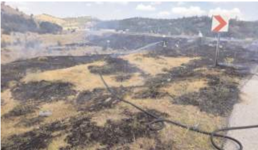
İtfaiye ekipleri yangını büyümeden söndürdü.