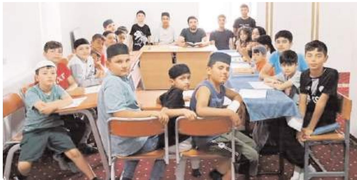
Yaz Kur'an kurslarına ilgi yüksek.