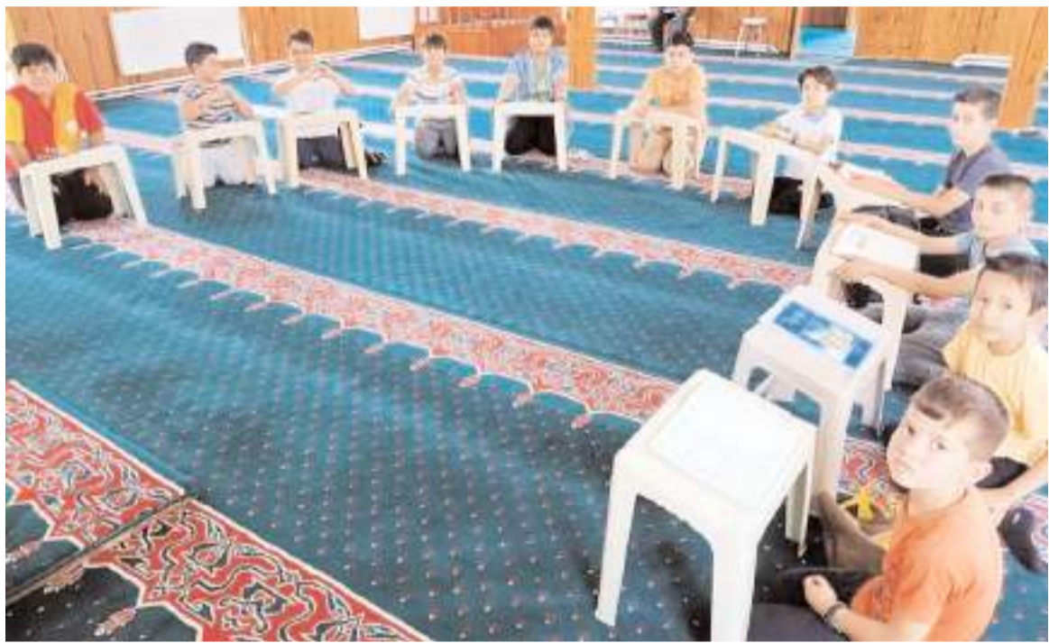
Yaz Kur'an Kursları bu yıl 1 Temmuz 2024 tarihi itibarıyla Sungurlu'da da başladı.

Minik Emine Sare Kahraman'ın cenazesi bugün öğle namazına müteakip Akşemseddin Camii'nde kılınacak cenaze namazının ardından Çiftlik Mezarlığı'nda toprağa verilecek.