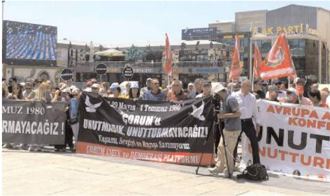
Anma töreni Kadeş Barış Meydanında yapıldı.