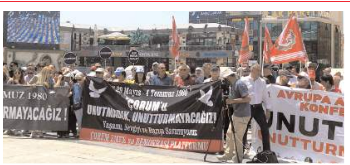
Anma töreni Kadeş Barış Meydanında yapıldı.

■ Silmkent TOKİ konutları ikamet eden vatandaşlar yanmayan aydınlatmalar ve asfaltlanmayan yollar nedeniyle sorun yaşıyorlar. * HABERİ'4'DE