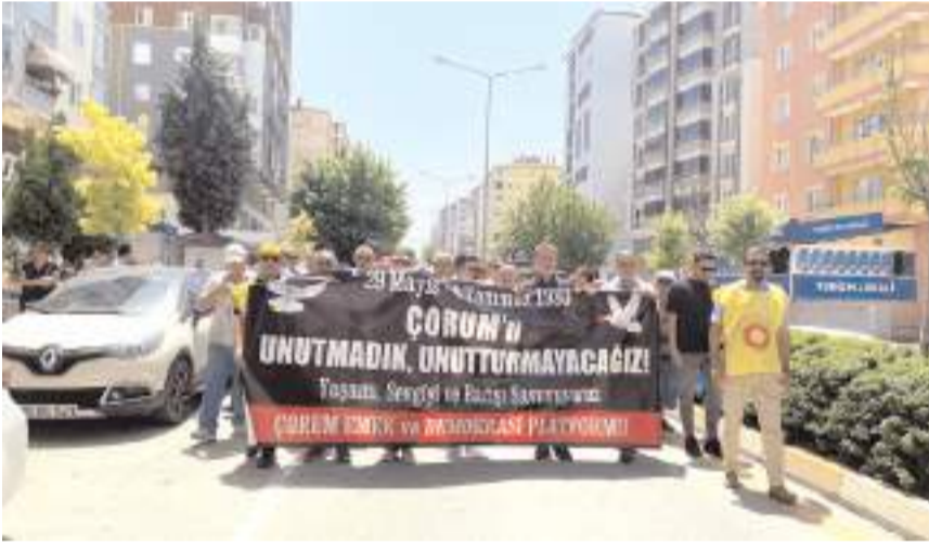
Çorum Hacı Bektaş Veli Anadolu Kültür Vakfı'nda toplanan katılımcılar, Bahabey Caddesi'nden Kadeş Barış Meydanı'na yürüdü.

Programa CHP Çorum Milletvekili Mehmet Tahtasız, Bursa Milletvekili Orhan Sarıbal, Avrupa Alevi Birlikleri Onursal Başkanı Turgut Öker'in yanı sıra yurt içi ve dışındaki dernek ve konfederasyonların yöneticileri katıldı. (AA)