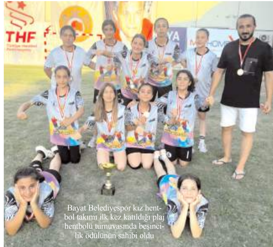
Bayat Belediyespor kız hentbol takımı ilk kez katıldığı plaj hentbolü turnuvasında beşincilik ödülünün sahibi oldu

memnun olduğunu söyledi. İlk kez Play Hentbol Turnuvasında mücadele eden sporcularının tecrübeli rakipleri önündeki başarısının gurur verici olduğunu belirterek çalışmaya devam edeceklerini söyledi.