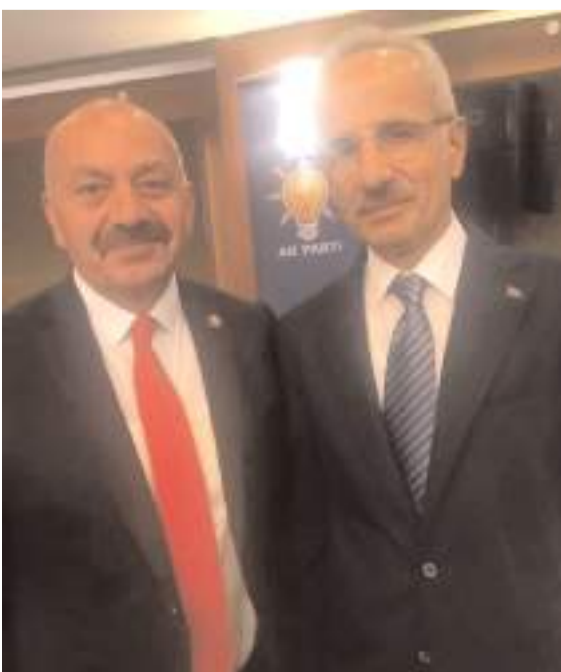
Ortaköy Belediye Başkanı Taner İsbir, Ulaştırma ve Altyapı Bakanı Abdulkadir Uraloğlu ve Tarım ve Orman Bakanı İbrahim Yumaklı ile görüştü.