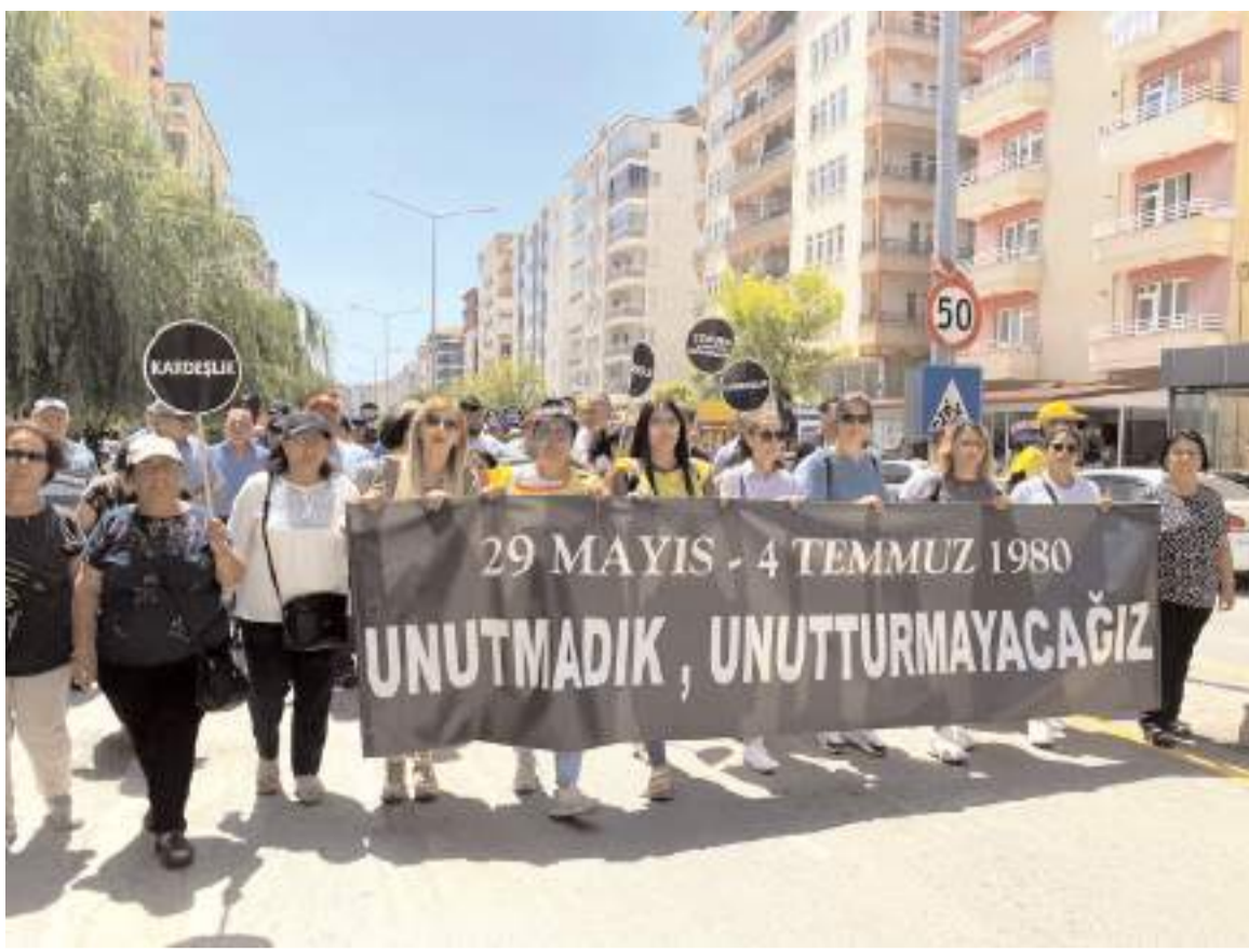
Çorum'da, 1980 yılında yaşanan olaylarda hayatını kaybedenler düzenlenen programda anıldı.