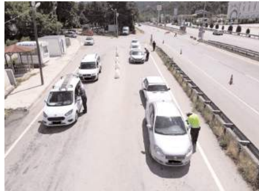
Denetimlerde 68 bin 413 araç kontrol edildi.

Emniyet Müdürlüğü Trafik Denetleme Şube Müdürlüğü ekipleri tarafından, il genelinde emniyet ve asayiş sağlamak, huzur ve sükunu temin etmek amacıyla yürütülen çalışmalar kapsamında, 1-30 Haziran tarihleri arasında, saygısızca araç kullanarak toplumun huzur ve sükununu bozan, gürültü çıkaran modifiyeli araçlar başta olmak üzere alkollü ve sürücü belgesiz araç kullananlar ve diğer trafik kurallarını ihlal eden sürücülere yönelik yapılan uygulamalar sonunda 68 bin 413 araç kontrol edilirken, 20 bin 954 araç ve sürücüsüne toplam 41 milyon 522 bin 429 TL ceza işlem uygulandı. Denetimlerde ayrıca 308 araca teknik değişiklikten (abartı/gürültü, modifiye, cam filmi vb.), 166 araç sürücüsüne alkollü araç kullanmak veya alkol cihazını üfleme reddetmekten, 489 araç sürücüsüne sürücü belgesiz araç kullanmaktan, 763 araç sürücüsüne emniyet kemeri takmamaktan işlem yapıldı. Uygulamalarda 7 bin 803 motosiklet kontrol edilirken, bin 21 motosiklet sürücüsüne işlem yapıldı. 233 araç sürücüsüne seyir halinde cep telefonu kullanmaktan, 121 okul servisi denetlenmiş 49 servis sürücüsüne fazla yolcu taşımak vb. ihlallerden, 7 araç sürücüsüne drift atmaktan, bin 206 araç sürücüsüne hatalı parktan işlem yapılırken 480 araç trafikten men edildi.