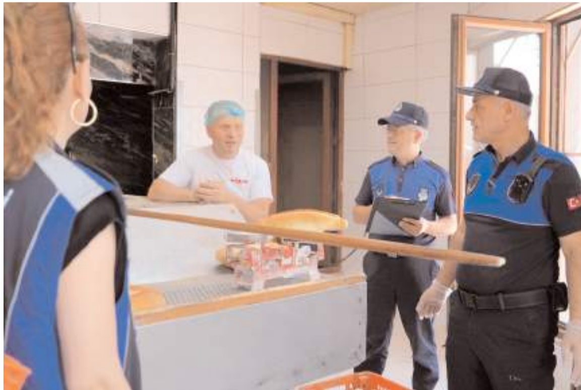
Zabita Müdürlüğü ekipleri, fırınlara yönelik gramaj ve hijyen denetimlerini sürdürüyor.