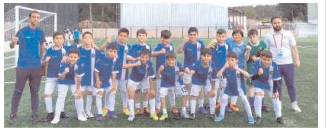
Çorum Anadolu FK U 11 takımı bugün Kültürspor önünde finale yükselmek için mücadele edecek