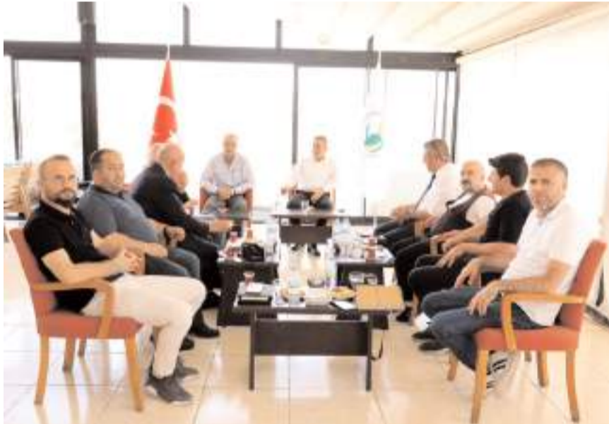
Sungurlu Belediye Başkanı Muhsin Dere, basın mensuplarıyla bir araya geldi.