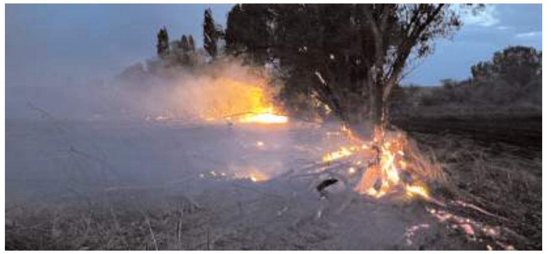
Rüzgarın da etkisiyle yangın bir anda büyüdü.

YEDAŞ'ın kendi bünyesinde oluşturduğu sistemler kapsamında, oluşan tüm arızalar anlık olarak izlenebiliyor. Orta gerilim şebeke modeli sayesinde elektrik şebekesi alt yapısı takip edilerek, uzaktan müdahale edilebilecek noktalarda hızlı aksiyonlar alınıyor. Merkezi operatör ekibinin yanı sıra, YEDAŞ bünyesinde görev alan tüm çalışanlar da şebeke üzerindeki kesintileri takip edebiliyor ve şebeke analiz raporlarına ulaşabiliyor. Tüm şirket tarafından sahiplenilen bu teknoloji ile müşteri memnuniyeti ön planda tutuluyor. (İHA)