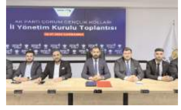
AK Parti Çorum Gençlik Kolları yeni yönetimi çalışmalarına başladı.