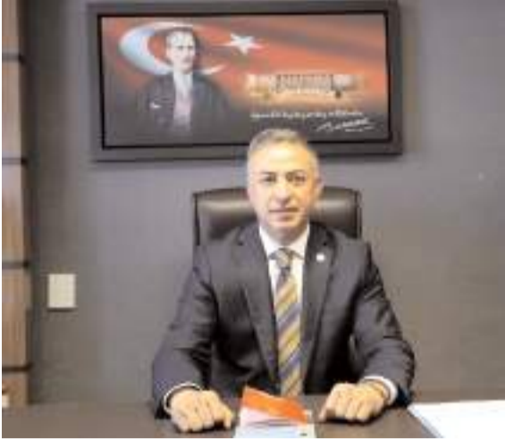
Milletvekili Mehmet Tahtasız

Konuyu yetkili mercilere ilettiklerini dile getiren köylüler, "Aylardır dilekçeler yazdık Sungurlu kaymakamlığına ve karayollarına bir türlü cevap alamadık. Siyasilere kapılarını açındırdık ama buradan da bir sonuç çıkmadı. 20'nin üzerinde köyün ilçe ile bağlantısını sağlayan yolumuz