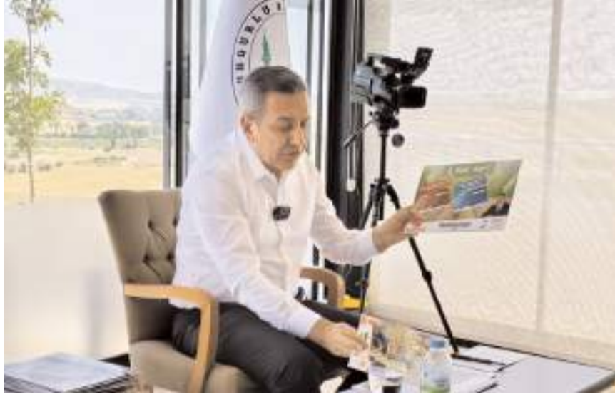
Sungurlu Belediye Başkanı Muhsin Dere, görev geldikleri 3 aylık süreyi değerlendirdi.

Belediyeye artık huzurun geldiğini, ihalelerin şeffaf bir şekilde gerçekleştiğini belirten Dere, ilçe halkına hizmet etmek için günün 12 saati çalıştıklarını kaydetti. (Haber Merkezi)