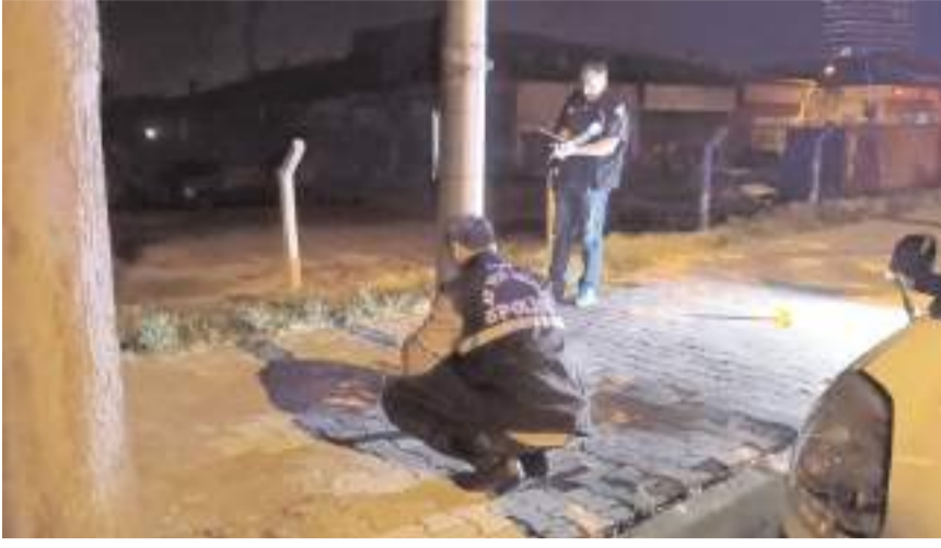
Olay, İnönü Caddesi üzerinde meydana geldi.