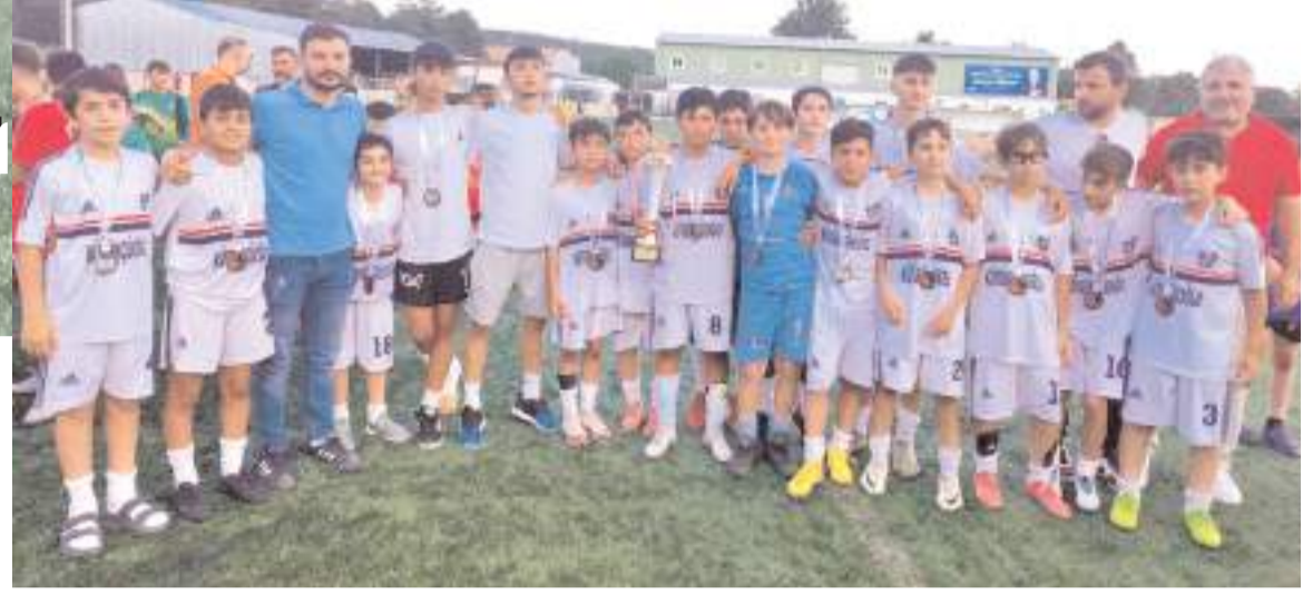
U 12 liginde şampiyon olan Vefaspor'un kupasını ASKF Başkanı Ferhat Arıcı verdi

Ertoprak U 12 liginde üçüncülük kupası Mimar Sinanspor'un.. Çorum İdman Yurdu ile üçüncülük maçına çıkan Mimar Sinanspor rakibi önünde ilk yarısını Berat ve Çınar'ın attığı gollerle 2-0 önde tamamlayan Mimar Sinan ikinci yarıda Gökтуğ'un golü ile maçtan 3-0 galip ayrılarak üçüncülük kupasının sahibi oldu. Çorum İdman Yurdu ise dördüncülük kupasını aldı.