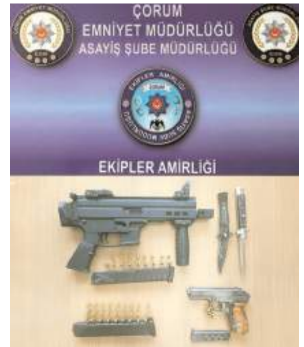
Polis yaptığı aramada silahlar ele geçirdi.

■ Çorum'da bir kadın caddede yürürken bıçaklı saldırıya uğradı. * HABERİ'3'DE