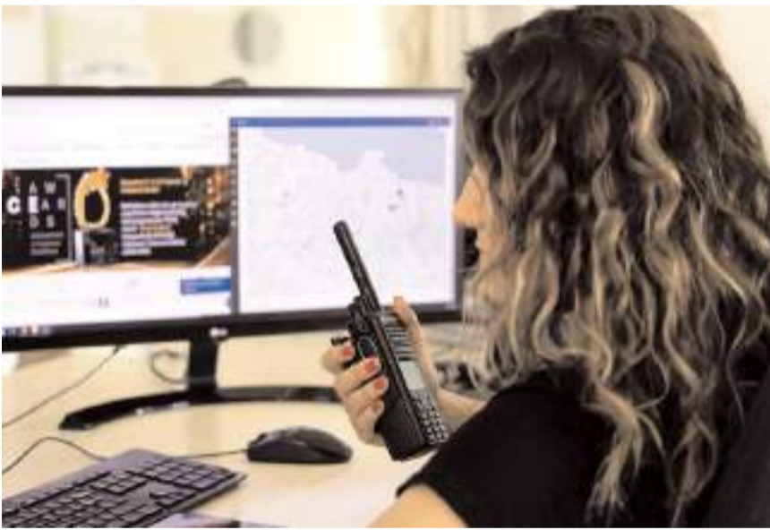
SCADA teknolojisi ile şebekenin yüzde 98'i uzaktan izlenebiliyor.

YEDAŞ, 2021 yılında kuruluşlarını yapmaya başladığı SCADA (Merkezi Uzaktan Kontrol ve Veri İzleme Sistemi) ile, elektrik dağıtım şebekelerinin uzaktan yönetilmesinde Türkiye'de öncü dağıtım şirketleri arasında yer alıyor. İlk günden bu yana sürekli güncellemeler yaparak, geliştirilen teknoloji sayesinde şu anda şebekenin yüzde 98'ini uzaktan kontrol edebiliyor.