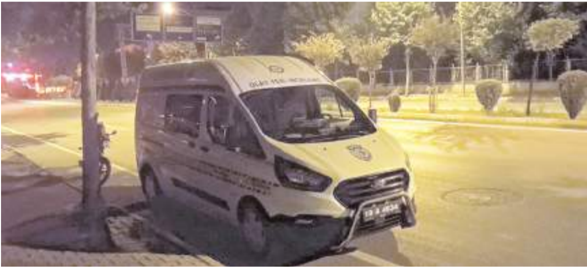
Polis ekipleri olay yerinde inceleme yaptı.

Çorum'da bir kadın caddede yürürken bıçaklı saldırıya uğradı.