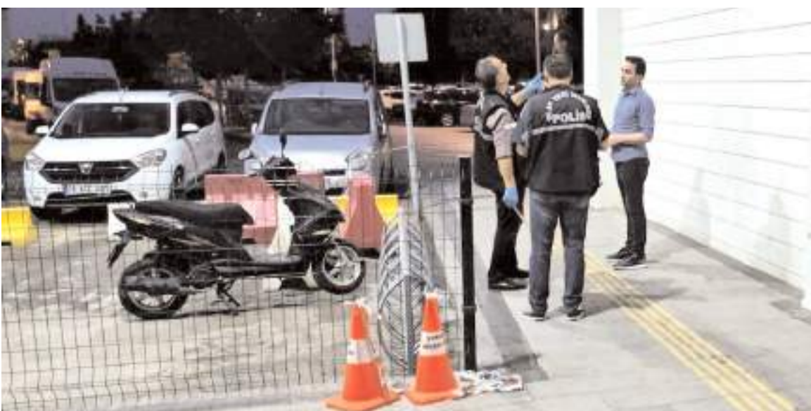
Olay Otobüs Terminalinde meydana geldi.

Şüphelinin üzerinde yapılan aramada, tüfek, çok sayıda fişek ve 2 bıçak ele geçirildi.(AA)