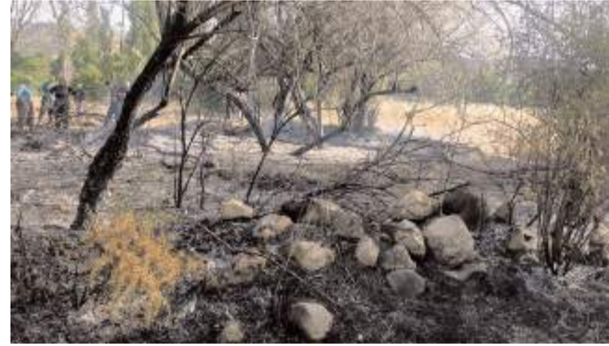
Yangın, Osmancık'a bağlı Akören Köyü, Çay yolu mevkiinde çıktı.

Köy sakinlerini korkutan örtü yangınında çeşitli türden ağaçlar da zarar gördü. (İHA)