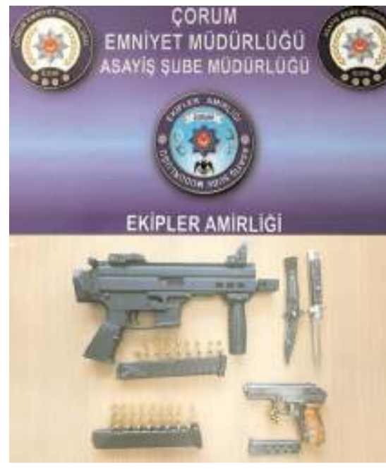
Polis yaptığı aramada silahlar ele geçirdi.

Olayla ilgili başlatılan soruşturma sürüyor. (İHA)