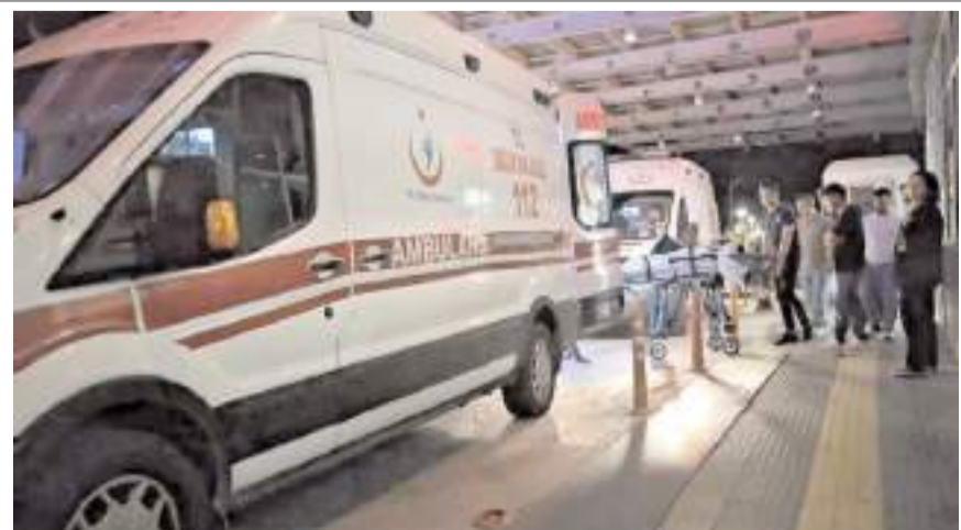
Yaralıları Hitit Üniversitesi Erol Olçok Eğitim ve Araştırma Hastanesi'nde tedavi altına alındı.

ekiplerince yapılan müdahalenin ardından Hitit Üniversitesi Erol Olçok