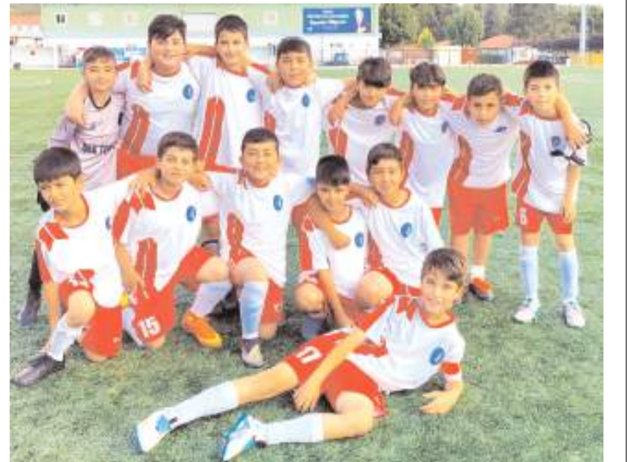
Hattuşaspor U 11 takımı final için bugün Vefaspor önünde final bileti arayacak

Bugün oynanacak maçları kazanan takımlar 9 Temmuz salı günü saat 17.30'da finalde kaybedenler ise saat 16'da üçüncülük dördüncülük ma-