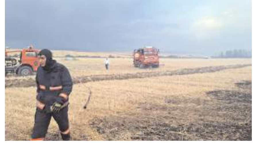
İtfaiye ekipleri yangını büyümeden söndürdü.