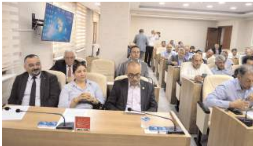
Toplantıda gündem maddeleri görüşülerek karara bağlandı.