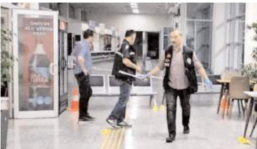
Polis ekipleri olay yerinde inceleme yaptı.

Çorum Şehirlerarası Otobüs Terminali'nde çıkan kavgada 1 kişi silahla vurularak yaralandı.