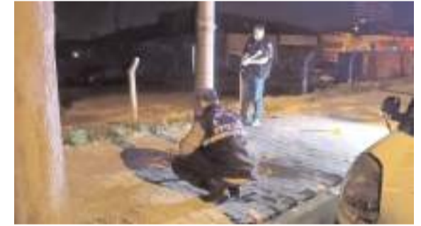
Olay, İnönü Caddesi üzerinde meydana geldi.