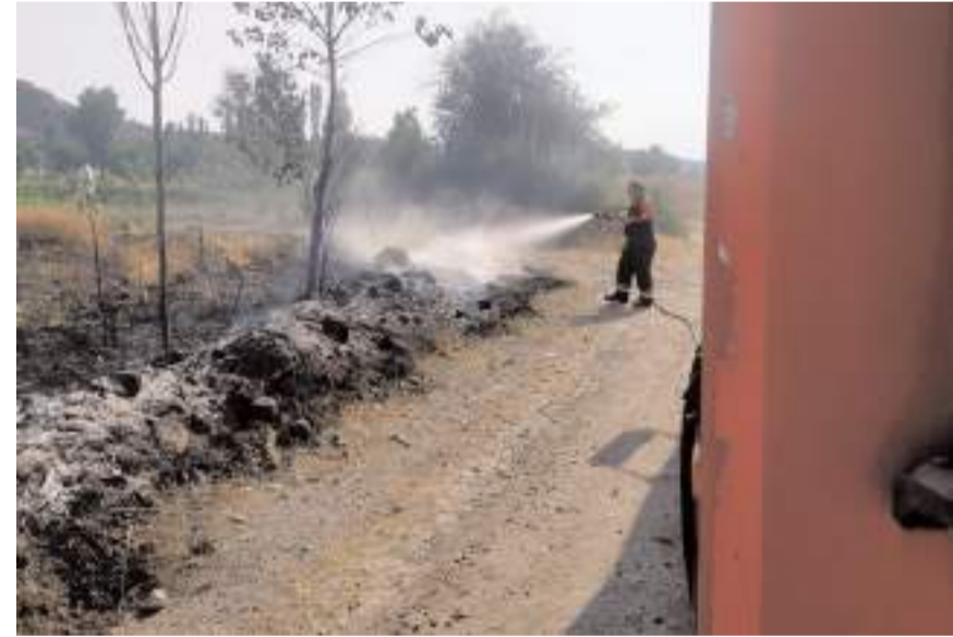
İtfaiye ekipleri yangını büyümeden söndürdü.