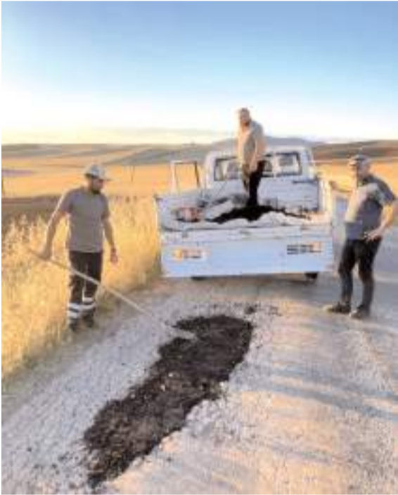
Köylüler aralarında topladıkları paraları ile asfalt satın alıp çukurları kapatmaya başladılar.