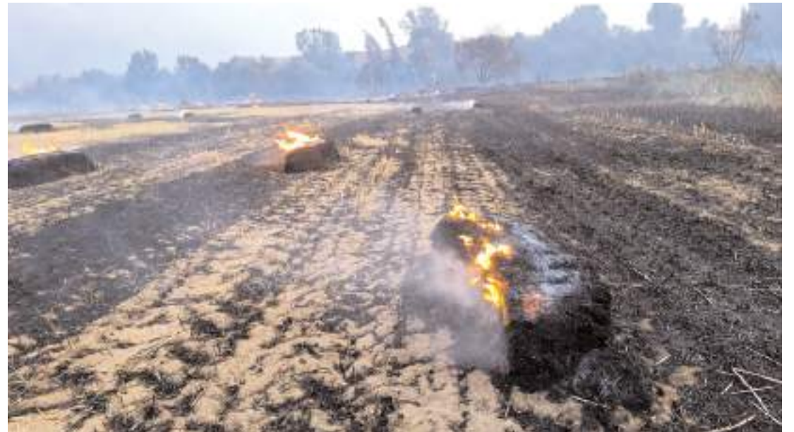
Yangında tarlada bulunan saman balyaları kül oldu.