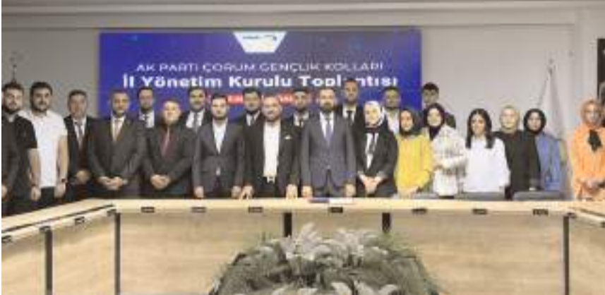
Toplantının ardından toplu hatıra fotoğrafı çekildi.

yeni yönetim kurulu ile ilk toplantısını yaptı. Toplantıda, gençlerin sosyal, kültürel ve siyasi katılımını artırmak amacıyla planlanan projeler ve etkinlikler masaya yatırıldı.