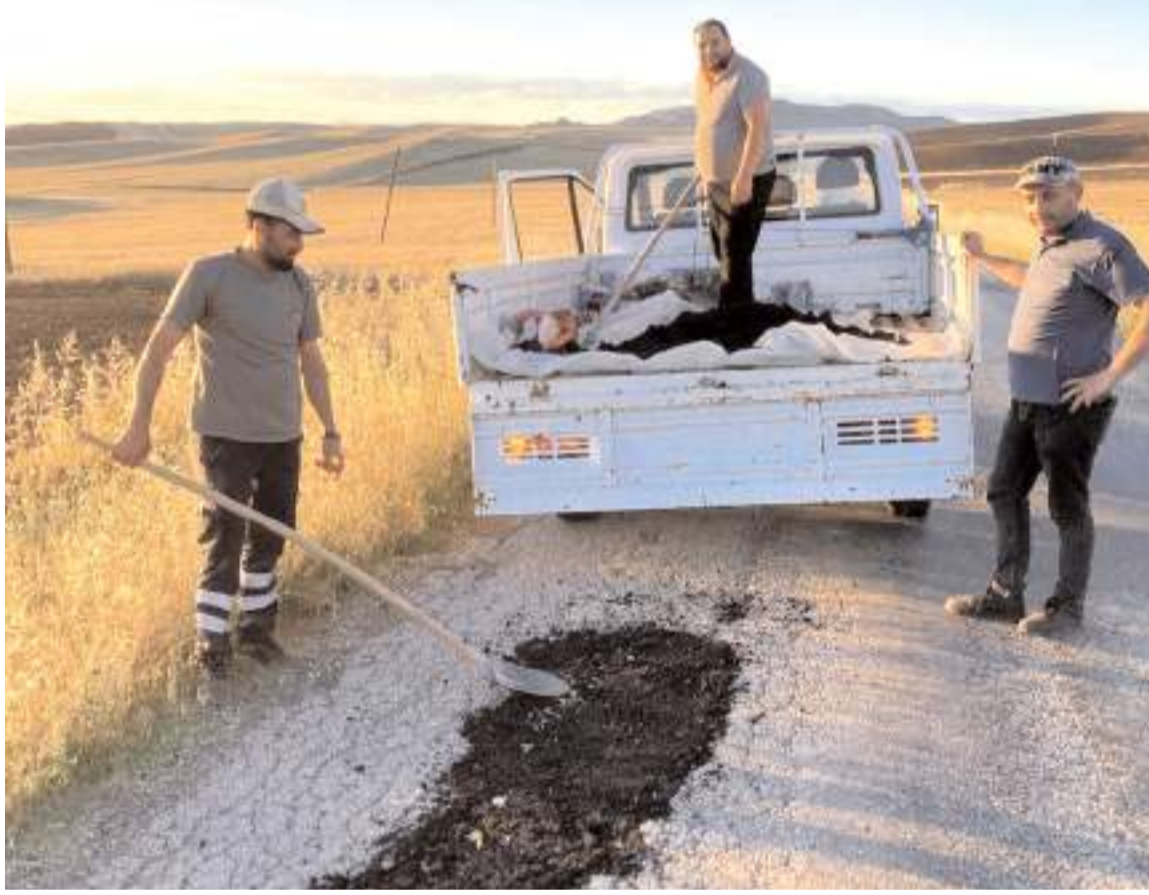
Köylüler aralarında topladıkları paraları ile asfalt satın alıp çukurları kapatmaya başladılar.

■ Sungurlu'ya bağlı 20'den fazla köyün kullandığı bağlantı yolundaki çukurları köylüler kendi aralarında para toplayarak kapatmaya çalıştı. * HABERİ'4'DE