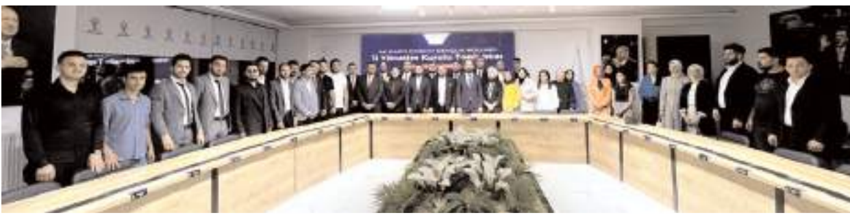
AK Parti Çorum Gençlik Kolları yeni yönetimi çalışmalarına başladı.