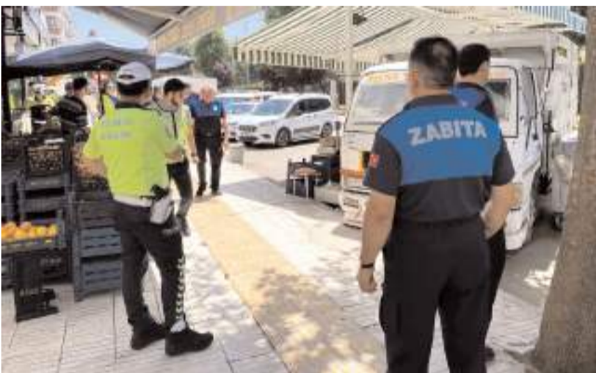
Zabıta Müdürlüğü ekipleri kaldırım ve yol işgallerine yönelik çalışmalarını sürdürüyor.