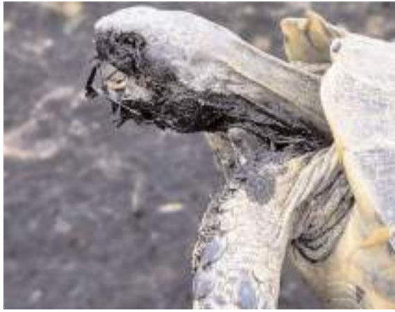
Alevler arasında kalan kaplumbağa son anda kurtarıldı.