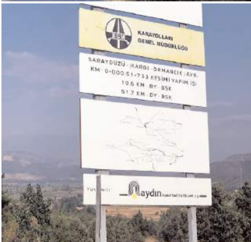
10 yıl önce inşaatı başlayan yol bitirilmeyi bekliyor.

Kargı'da 10 yıl önce yapımına başlanılan yolun bir kısmının tamamlanmamış olması tepkiye neden olurken, birçok ölümlü kazanın yaşandığı Yeşilköy-Dereköy çıkışına ise dönel kavşak isteniyor.