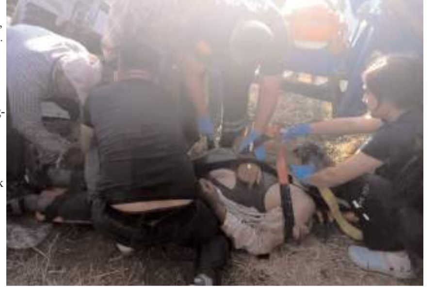
Yaralılara ilk müdahaleyi 112 acil sağlık ekipleri yaptı.