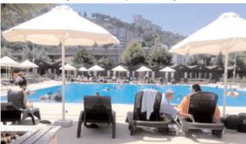
Dernek üyeleri Samsun'da güzel bir gün geçirdiler.