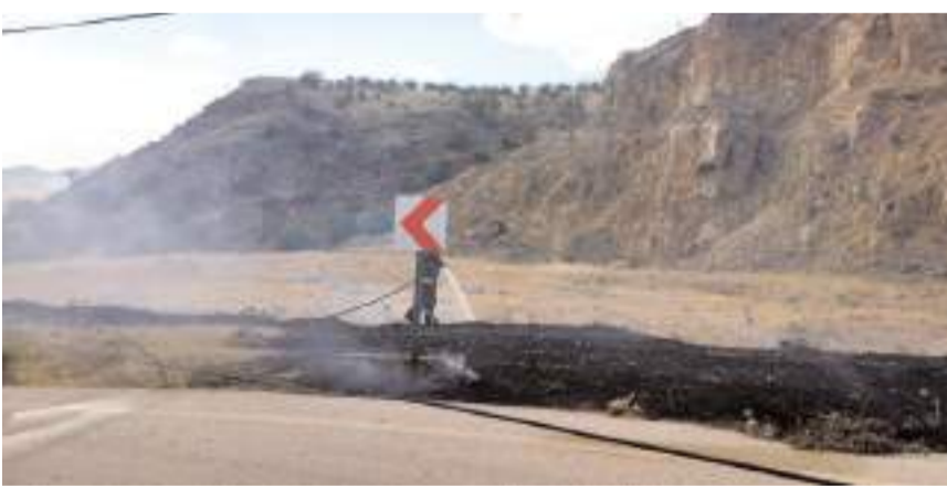
Yangın büyümeden söndürüldü.