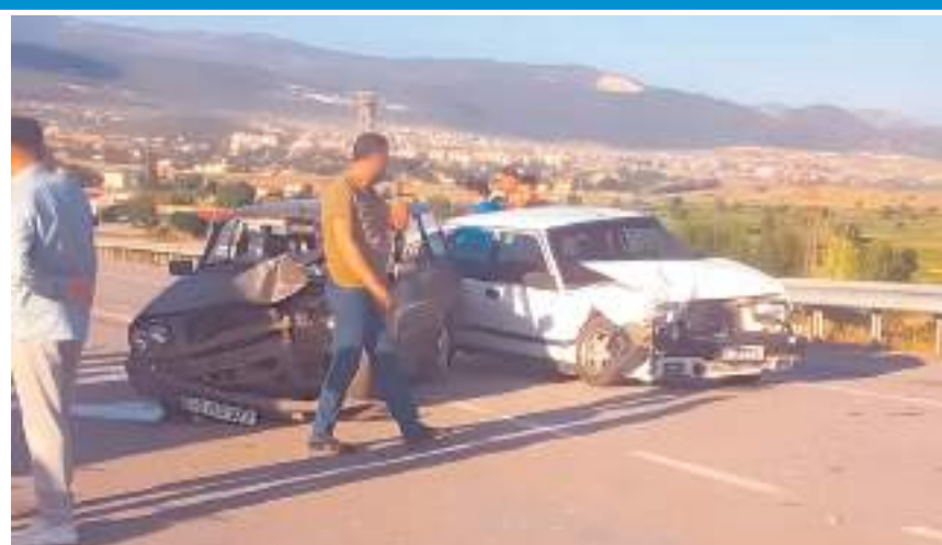
Yarım kalan yolda sürekli trafik kazası oluyor.