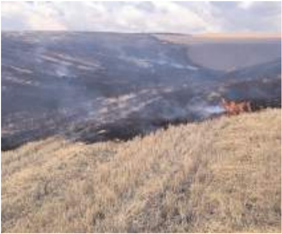
Yangın Manastır eteklerinde çıktı.

Merhumun cenazesi bugün öğle namazına müteakiben Akşemseddin Cami'nde kılınacak cenaze namazının ardından Hıdırlık'ta toprağa verilecek.