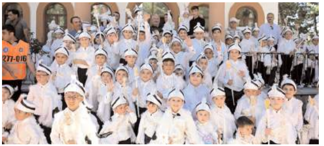
Sünnet şöleni saat 15.00'de Saat Kulesi önünden sünnet konvoyu ile başlayacak.

Edinilen bilgilere göre, Manastır eteklerinde belirlenemeyen nedenlerle anız yangını çıktı. Yangını fark eden vatandaşlar itfaiye ekiplerine haber verdi. Kısa sürede olay yerine giden Sungurlu Belediyesi itfaiye ekipleri yangını kontrol altına alarak söndürdü. Yangın sonrasında yapılan kontrollerde yerde, yanan bir kaplumbağa bulundu. Yangından etkilenen kaplumbağa gerekli müdahale yapıldıktan sonra ekipler tarafından doğaya bırakıldı. (İHA)