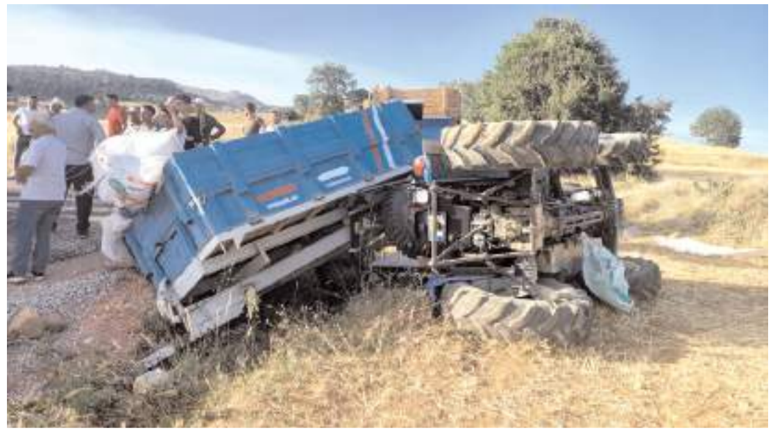
Kaza, Osmancık'a bağlı Yukarı Danişment köyü yolunda meydana geldi.

Kazayla ilgili başlatılan soruşturma sürüyor. (İHA)