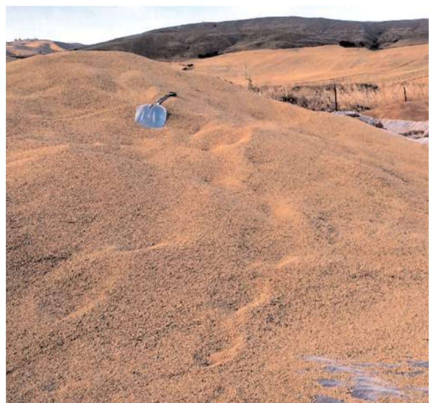
TMO, İskilip'te buğday alımına başladı.