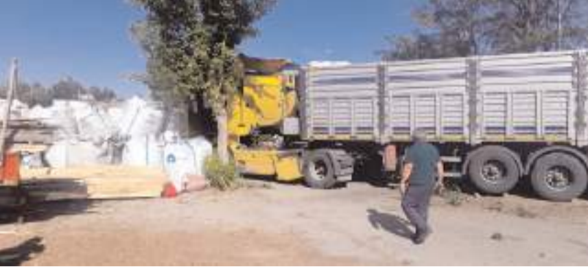
Kaza, Sungurlu-Çorum karayolu Sanayi sitesi girişinde meydana geldi.