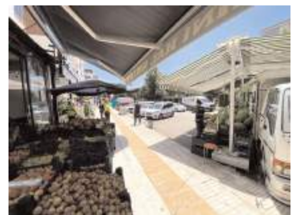
Esnafı kaldırım ve yol işgallerine karşı uyarılıyor.