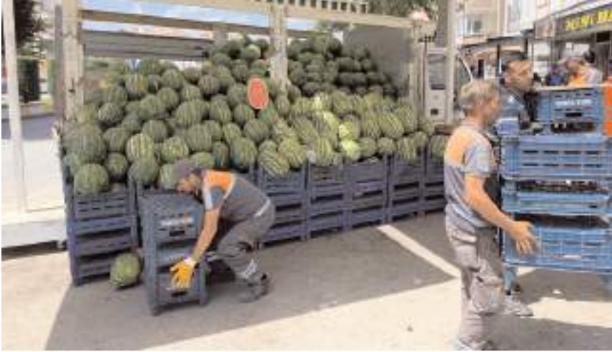
Esnaflar kaldırım ve yol işgallerine karşı uyarılıyor.

Çorum Belediyesi Zabıta Müdürlüğü ekipleri kaldırım ve yol işgallerine yönelik çalışmalarını sürdürüyor. Uyarılara rağmen işgalden vazgeçmeyen bir işyerinin malzemeleri Belediye ekipleri tarafından kaldırılarak cezai işlem uygulandı.