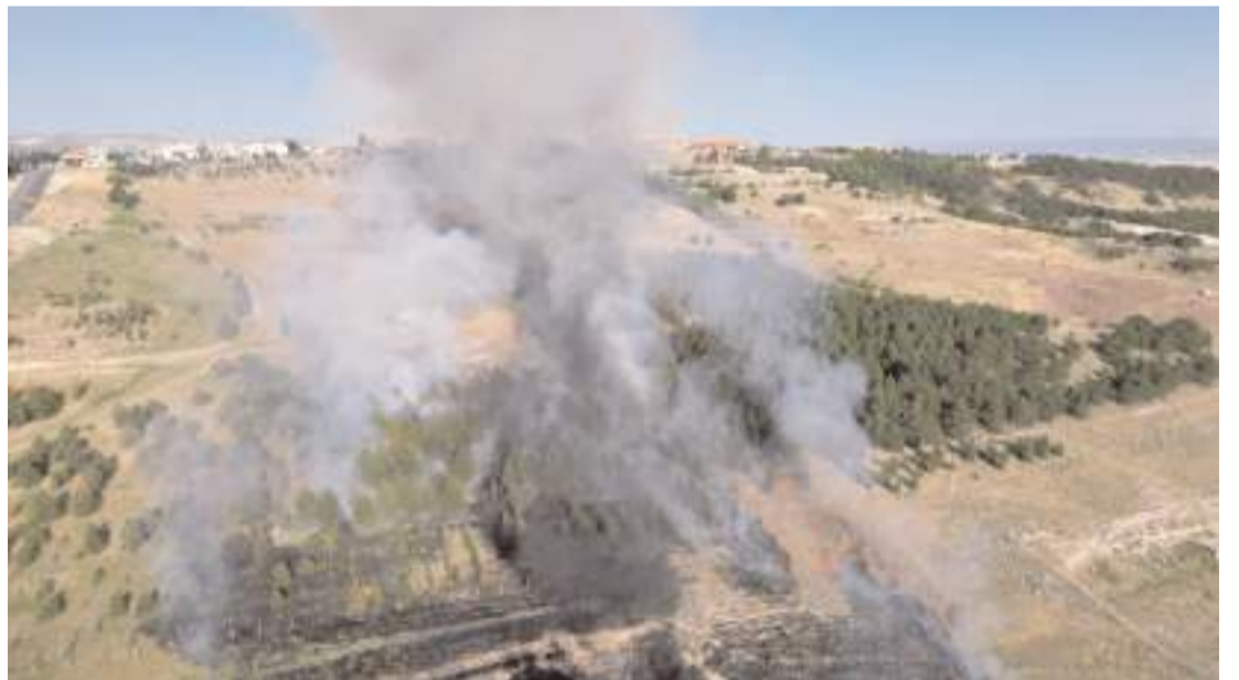
Kısa sürede büyüyen yangın, 6 Şubat Deprem Şehitleri Hatıra Ormanı'na sıçradı.