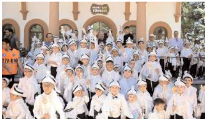
Sunnet şöleni saat 15.00'de Saat Kulesi önünden sunnet konvoyu ile başlayacak.

■ Çorum Belediyesi'nin her yıl geleneksel olarak düzenlediği sunnet şöleni 6 Temmuz Cumartesi günü yapılacak.