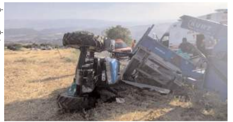
Kazada traktörde maddi hasar meydana geldi.