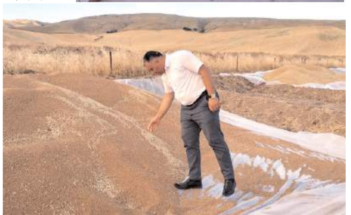
Rekoltenin geçen yıla göre düşük olduğu belirtildi.