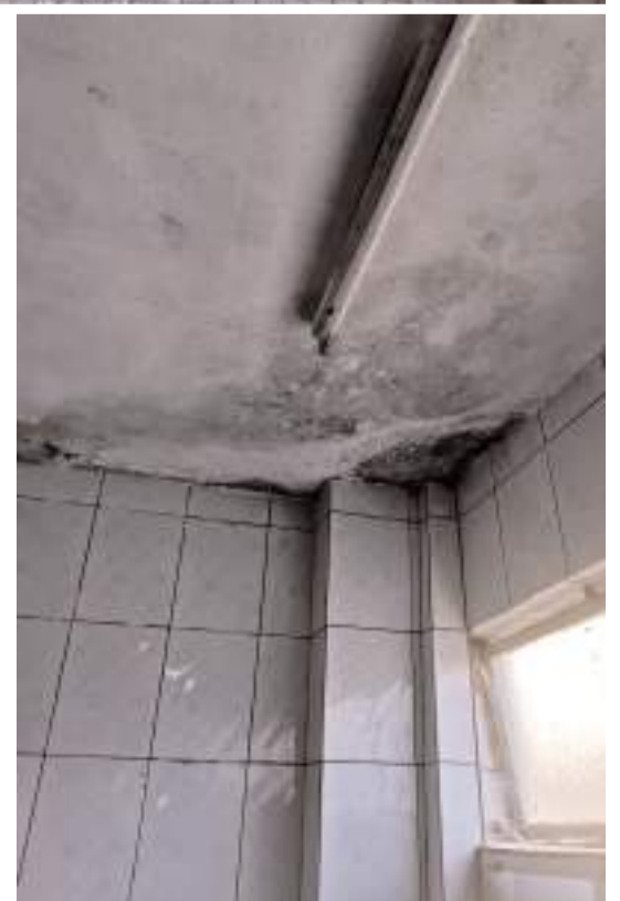
Vatandaşlar turistik bir yerin tuvaletlerinin daha güzel olmasını istiyor.