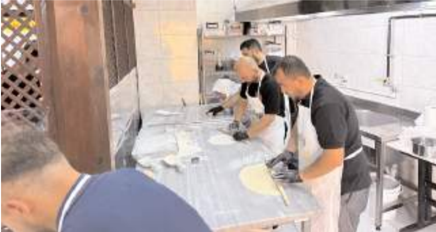
Veli Paşa Hanı'nda kurulan mutfak atölyesinde Çorum Has Baklavası, Çorum Su Böreği, coğrafi işaret tescilli Çorum Kuru Mantısı, Çorum Şekerlemesi yapılıyor.