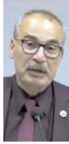
CHP Grup Başkanvekili Saadettin Akgül