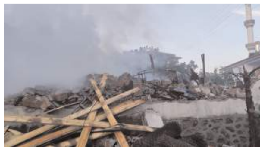
Yangında 1 ev kullanılamaz hale geldi, 2 evde hasar meydana geldi.