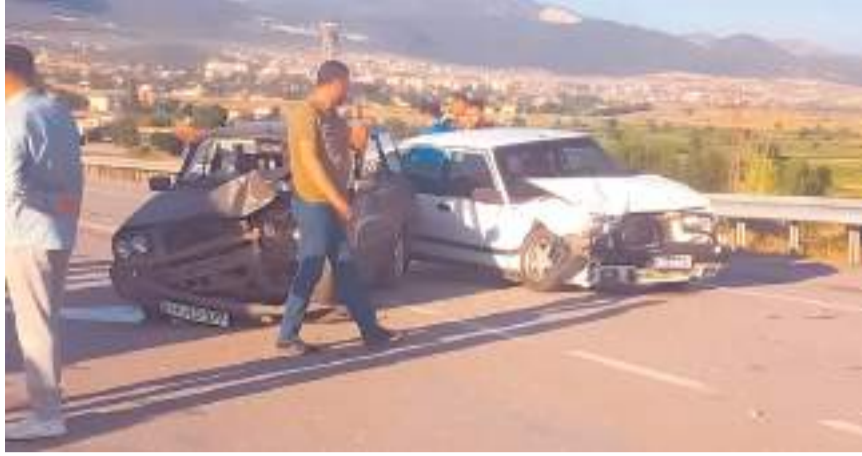
Yarım kalan yolda sürekli trafik kazası oluyor.