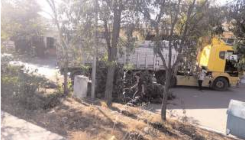
Kazada maddi hasar meydana geldi.