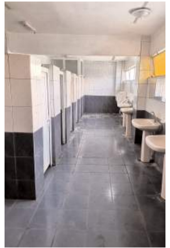
Vatandaşlar tuvaletlerin bakımsız haline tepki gösteriyor.