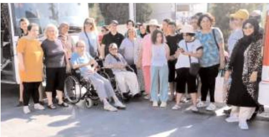
Çorum Engelsiz Yaşam Derneği, Samsun Engelli Eğitim ve Rehabilitasyon Merkezine gitti.