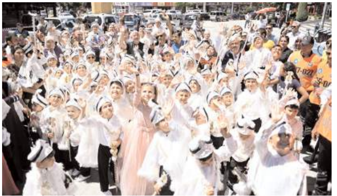
Saat 17.00'de Hürriyet Meydanı'nda çocuklara için etkinlikler gerçekleştirilecek.