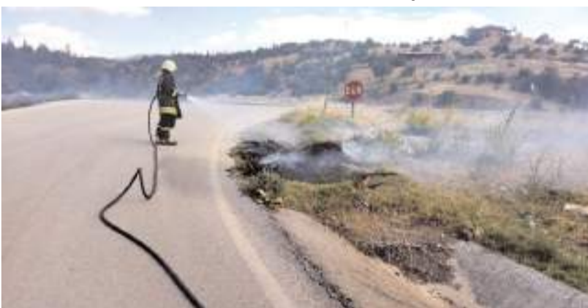
Yangına itfaiye ekipleri müdahale etti.