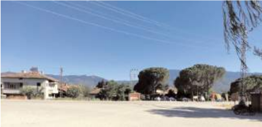
Vatandaşlar yolda yola trafik işaretleri, trafik lambası, dönel kavşak veya güvenlik kamerası gibi tedbirler alınmasını istiyor.