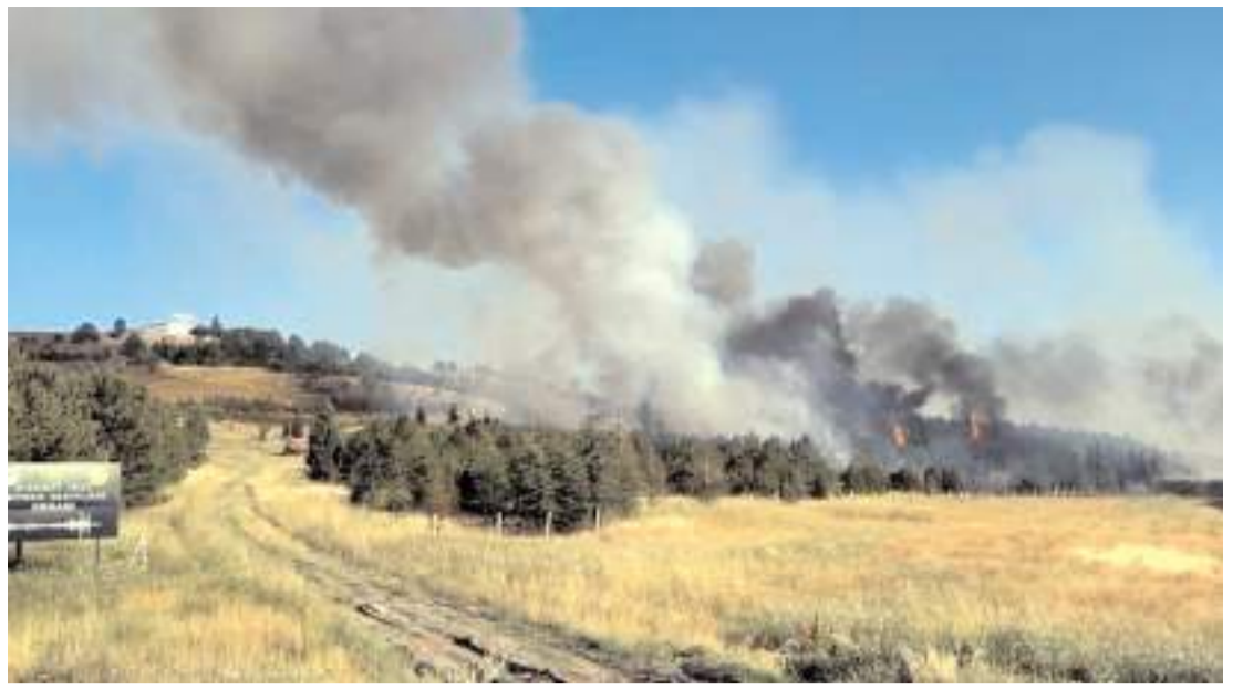
Yangın Ankara Yolu 3. Cadde'de bulunan alanda çıktı.

Edinilen bilgilere göre, Samsun-İstanbul D-100 karayolu kenarında otların tutuşması sonucu yangın çıktı. Ağızsu-yu Köyü-Çayır Köyü- Öbektaş Köyü grup yolu ayrımı Tavukpini mevkinde çıkan yangın, itfaiye ve jandarma ekiplerine bildirildi. Bölgeye gelen Osmancık Belediyesi İtfaiye ekipleri 4 dekarlık alanda etkili olan yangını çamlık alana sıçramadan kontrol altına alarak söndürdü. (İHA)