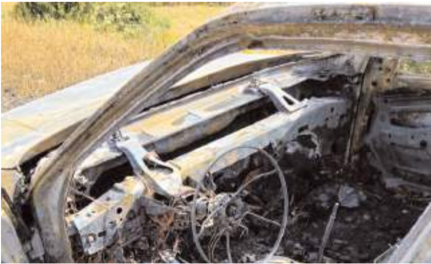
Olayda araç hurdaya döndü.