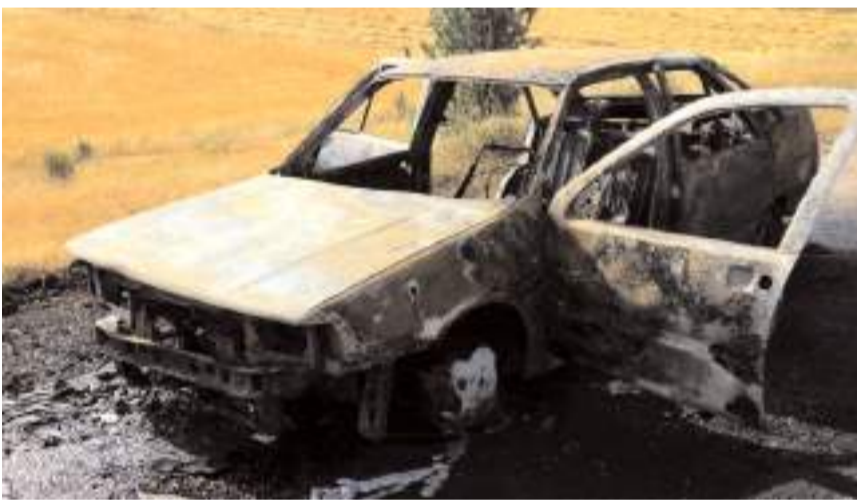
Olay Altıntaş köyü yolunda meydana geldi.