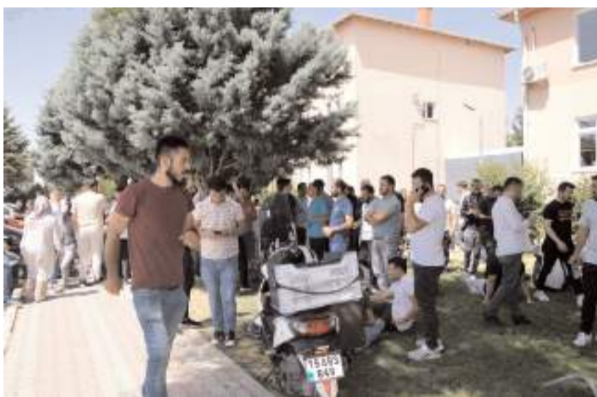
Başvuru yapan adaylar için mülakat yapıldı.

İl Özel İdare'si'ne 6 temizlik işçisi, 3 konkasör 4 pick up şoförü, 2 vidanjör yardımcı elemanı, 1 boru kaynak elemanı, 2 ekskavator operatörü, 15 kamyon şoförü, 1 torna kaynak ustası, 1 oto elektrik ustası, 4 motor ve mekanik ustası, 1 fren ustası, 4 tır şoförü, 1 dozer operatörü, 1 kanal kazıcı operatörü, 4 açıcı, 3 greyder operatörü, 3 lastikli yükleyici operatörü, 1 inşaat mühendisi olmak üzere 57 kişi alınacak.