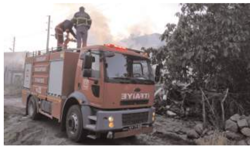
Yangın büyümeden itfaiye ekipleri tarafından söndürüldü.

İskilip ve Oğuzlar belediyeleri itfaiye ekiplerince vatandaşların da yardımıyla söndürülen yangında 1 ev kullanılamaz hale geldi, 2 evde hasar oluştu.(AA)