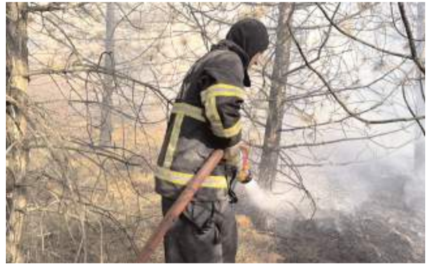
İtfaiye ekipleri yangını büyümeden söndürdü.

Yaklaşık 2 dekar ağaçlık alanın etkilendiği bölgede soğutma çalışmaları sürüyor.(AA)