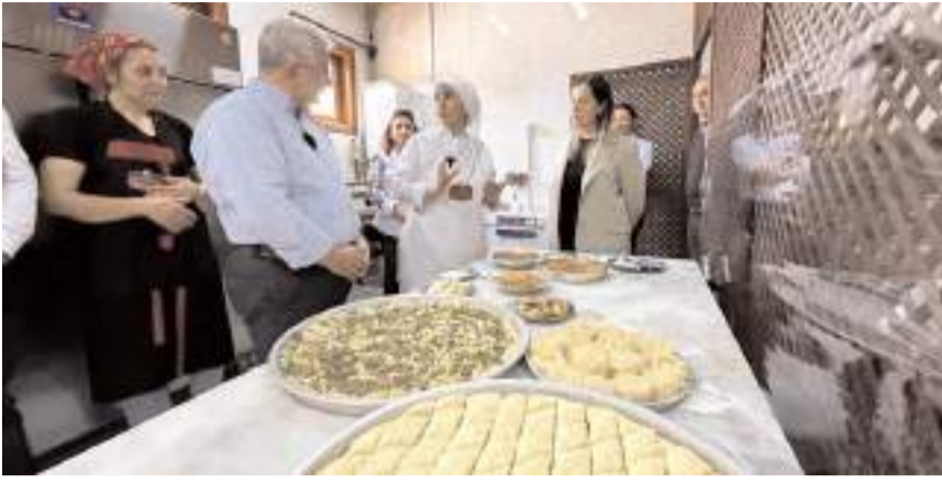
OKA, Çorum Belediyesi'nin uygulayıcısı olduğu "Çorum Belediyesi İşim Gücüm Üretim Projesi"ne destek veriyor.