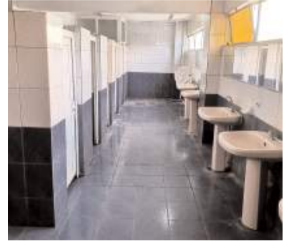
Vatandaşlar tuvaletlerin bakımsız haline tepki gösteriyor.