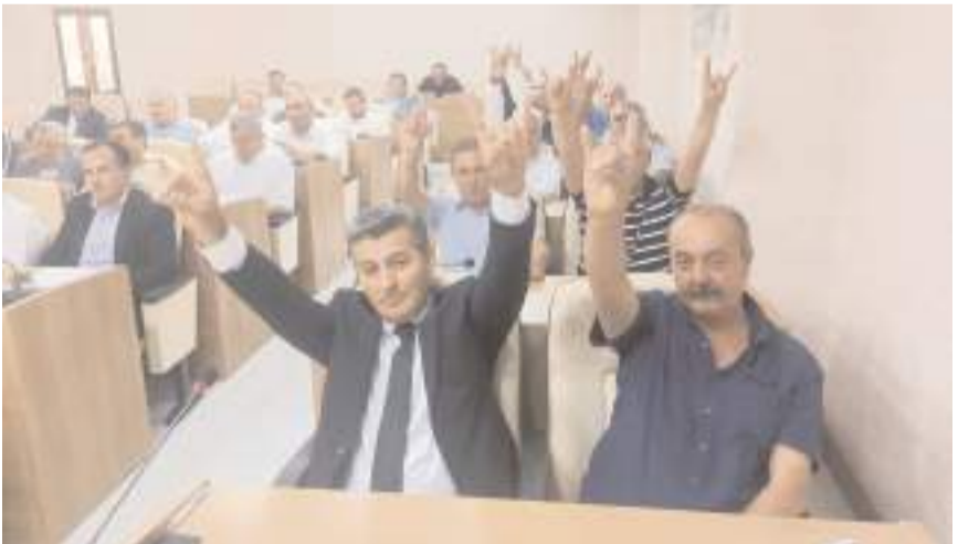
Meclis üyeleri Bozkurt işaretini yaptılar.