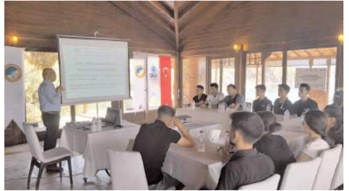
Altınkoz Sosyal Tesisleri'nde görevli 20 personele yönelik uygulanan eğitim verildi.

Projesi kapsamında kurulan mutfak atölyesi, geçen günlerde lansmanı yapılan AnadoludakilerPlatformunda, birikim mutfağının örnekleri arasında gösterilen altı kulaklı kuru mantının yaşatılmasına, doğru tekniklerle gelecek kuşaklara aktarılmasına da aracılık ediyor. (İHA)