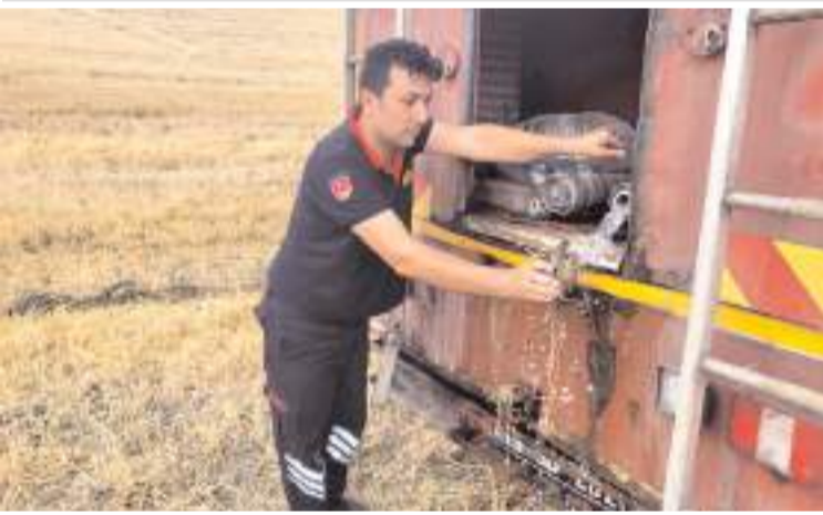
İtfaiye ekipleri kaplumbağaya su verdi.

Sungurlu'da çıkan anız yangınında yanmak üzere olan kaplumbağa itfaiye ekipleri tarafından kurtarıldı.