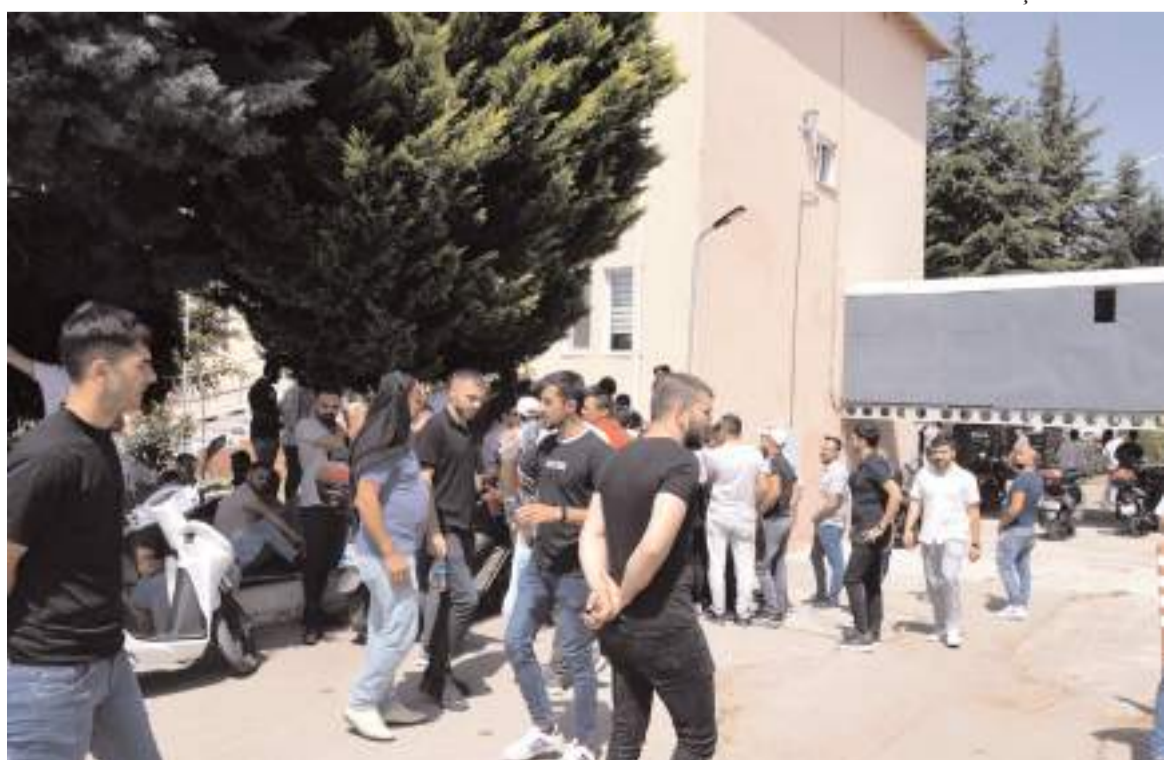
İki gün boyunca İl Özel İdaresinde yoğunluk yaşandı.