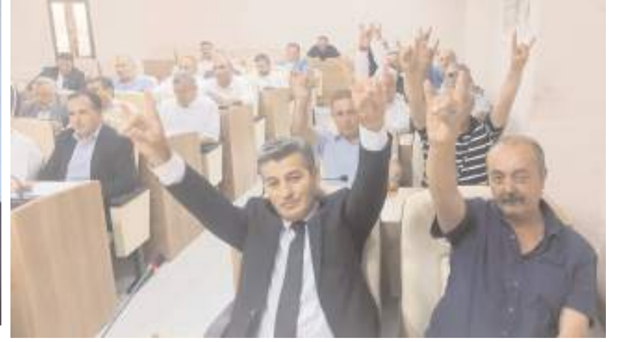
Meclis üyeleri Bozkurt işareti yaptılar.