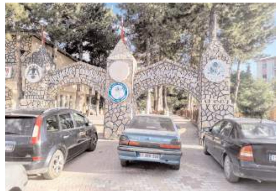
Cemal Boyacı Parkı güzelliğiyle dikkat çekiyor.

İlçe sakinleri bir an önce yetkililer tarafından duruma el atılarak tuvaletlerin turistik bir ilçeye yakışacak hale getirilmesini istedikleri.