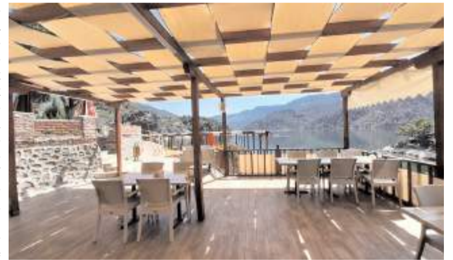
OKA "Oğuzlar Belediyesi Turizm Çalışanlarını Eğitiyor" başlıklı projeyi hayata geçirdi.

OKA Turizmin Geliştirilmesine Yönelik Teknik Destek Programına başvurular devam ediyor. Program ile ilgili sorular marka@oka.org.tr adresine iletililebilir veya 03624312400 nolu telefonda ulaşılabılır. (İHA)