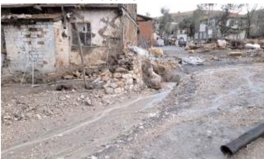
Şiddetli yağış köylerde de etkili oldu.