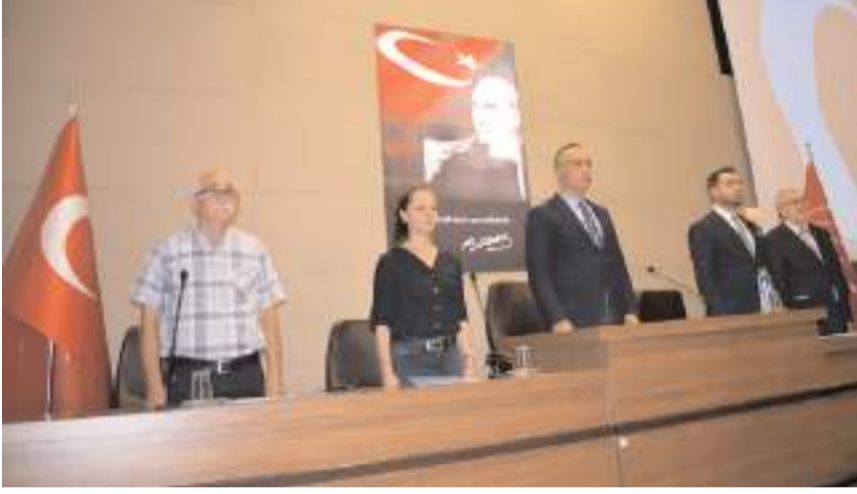
Cumhuriyet Halk Partisi, İl Danışma Kurulu Toplantısı yapıldı.