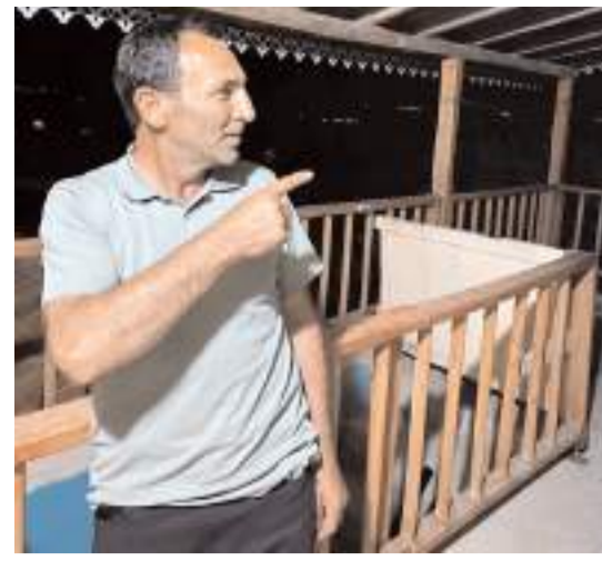
Göktaşını gören vatandaşlar heyecanlandılar.

Düşme sonucu kanat ve gövde bölgelerinden yaralanan leylek, öldü.(AA)