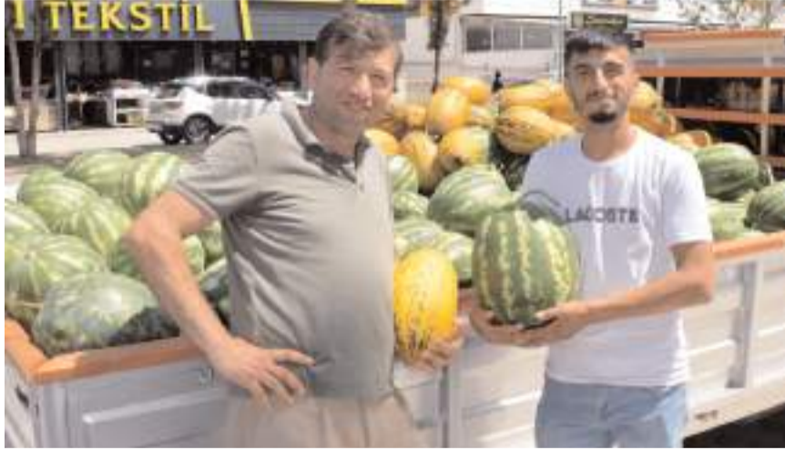
Kardeşler Manavı iki şubesiyle hizmet veriyor.