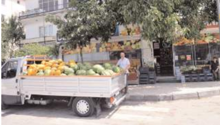
Kardeşler Manavı-2 Alaeddin Cami karşısında bulunuyor.