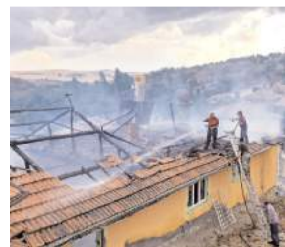
Olay Evcı köyünde meydana geldi.