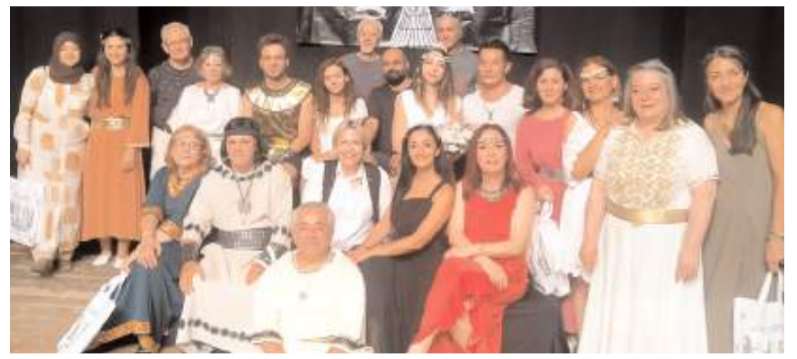
Oyun Devlet Tiyatro Salonunda sahnelendi.

Metal Tel Örgü Mür. Tel: 0 532 768 23 79