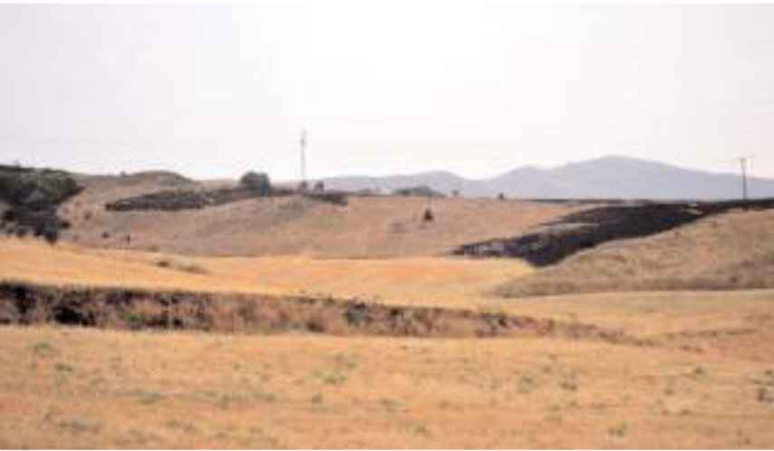
Yangın yaklaşık 5 dekar alanda etkili oldu.