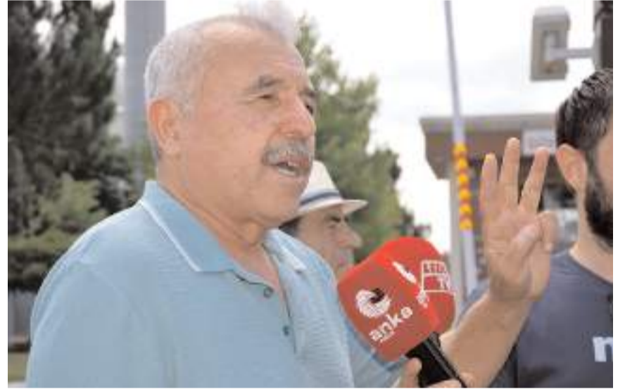
Basın açıklamasında vatandaşlarda konuştu.