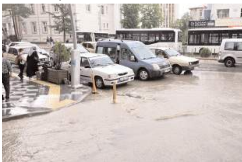
Sağanak Sungurlu'da trafiği olumsuz etkiledi.

Sungurlu'da etkili olan sağanak yağış, hayatı olumsuz etkiledi.