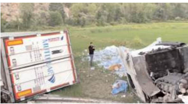
Kazalar, İstanbul Samsun D-100 Karayolu Beygircioğlu köyü mevkiinde meydana geldi.

kontrol edilen bin 212 araçtan 62 araca 784 bin 931 TL idari para cezası uygulandı, 2 araç trafikten men edildi. (İHA)