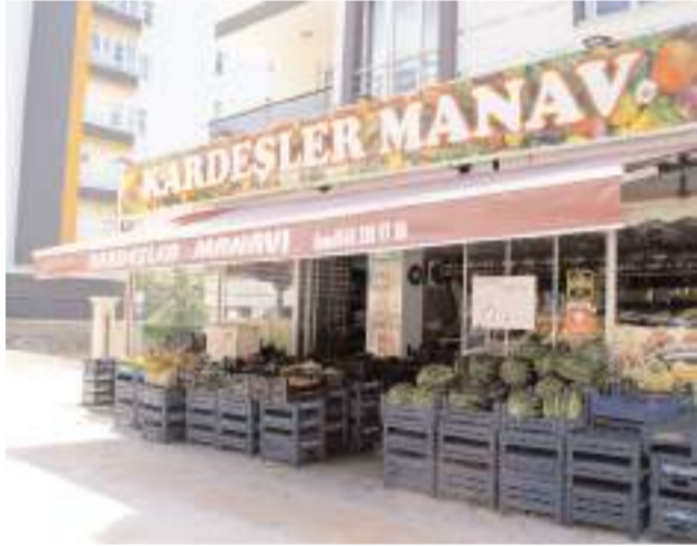
Kardeşler Manavı-1 Cemilbey Caddesi'nde faaliyet gösteriyor.