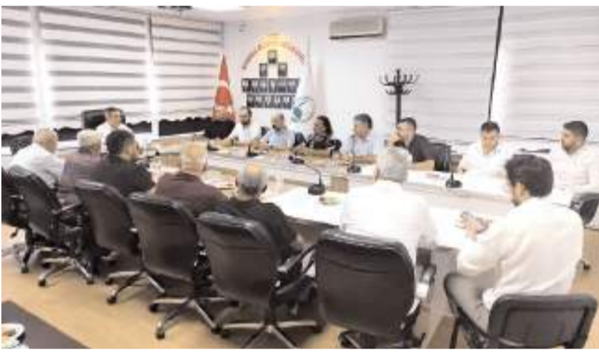
İlçede savunma sanayi yatırımlarının tamamlanmasıyla birlikte nüfusun 25-30 bin civarında artması bekleniyor.