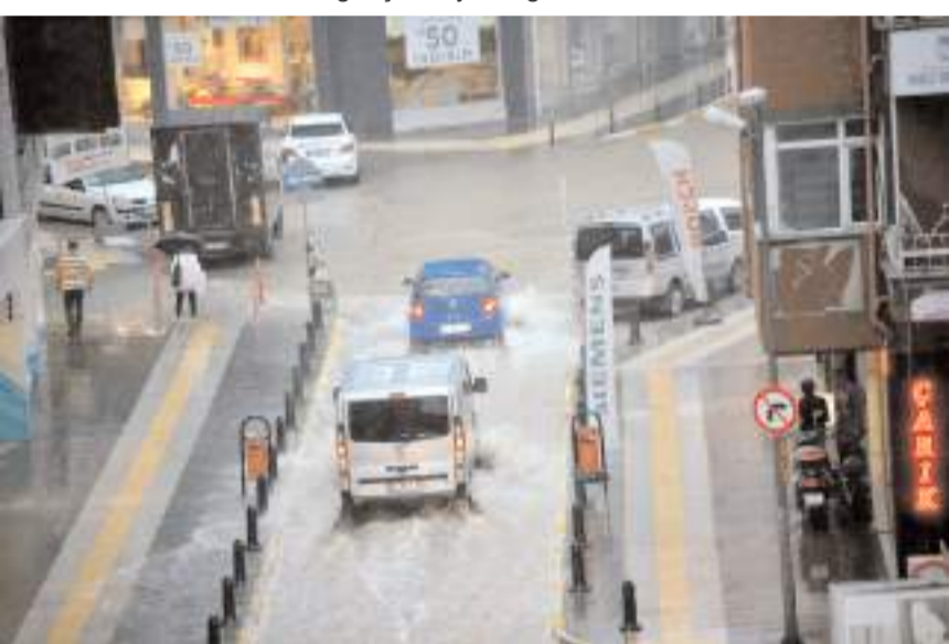
Sağanak yağış trafiği olumsuz etkiledi.