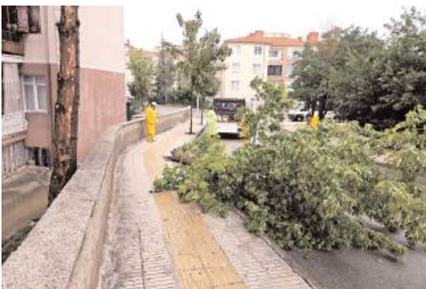
Rüzgar çok sayıda ağacı devirdi.