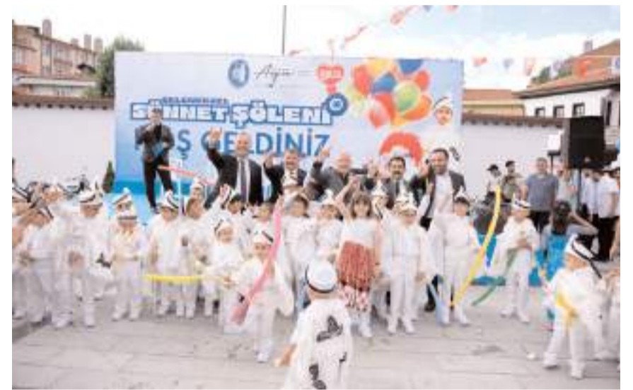
Sünnet Şöleni Tarihi Kent Meydanında yapıldı.

Sünnet şöleni, Türk Halk Müziği konseri ile sona erdi.