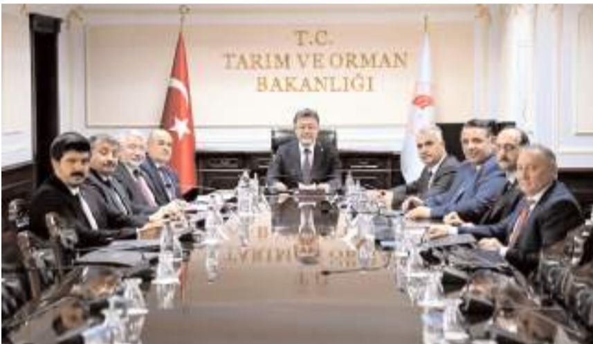
Çorum heyeti, Tarım ve Orman Bakanı İbrahim Yumaklı'yı ziyaret etti.