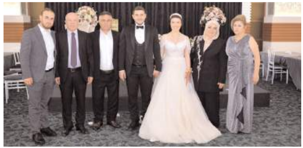
Düğüne çok sayıda davetli katıldı.

HAKİMİYET genç çifti kutlar ömür boyu mutluluklar diler.