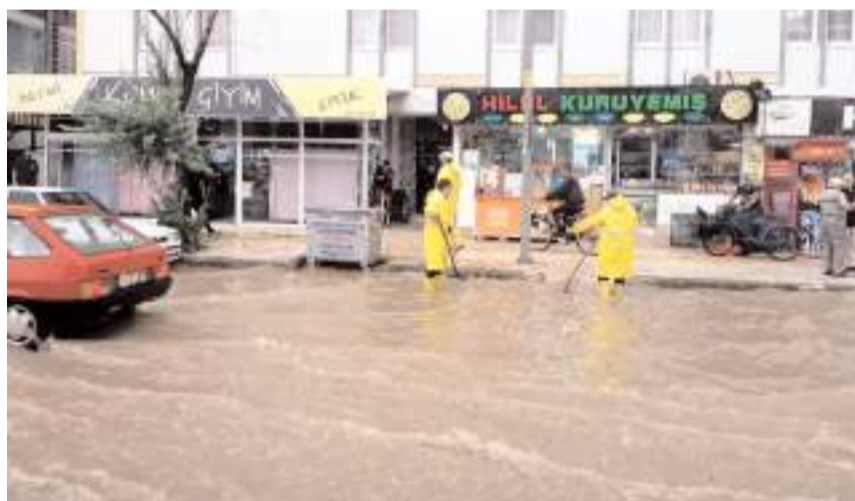
Belediye ekipleri tıkanan giderleri açmak için çalıştı.

■ Çorum'da etkili olan sağanak ve dolu hayatı olumsuz etkiledi. İl merkezi ve ilçelerde sağanağın yanı sıra bazı bölgelerde dolu da etkili oldu.