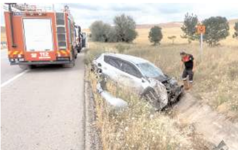
Kaza, Sungurlu-Kırıkkale karayolunun 25. kilometresinde meydana geldi.

Kaza ile ilgili olarak başlatılan incelemenin devam ettiği öğrenildi. (İHA)