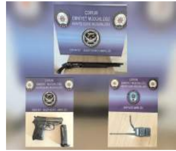
Denetimlerde çok sayıda ateşli silah ele geçirildi.