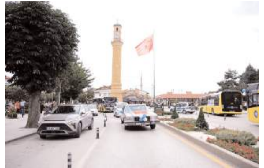
Sünnet konvoyu şehir turu attı.