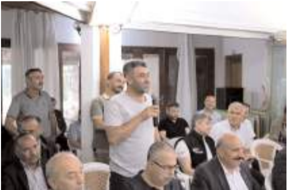
Gülábibey Mahallesi sakinleri sorun ve taleplerini dile getirdi.