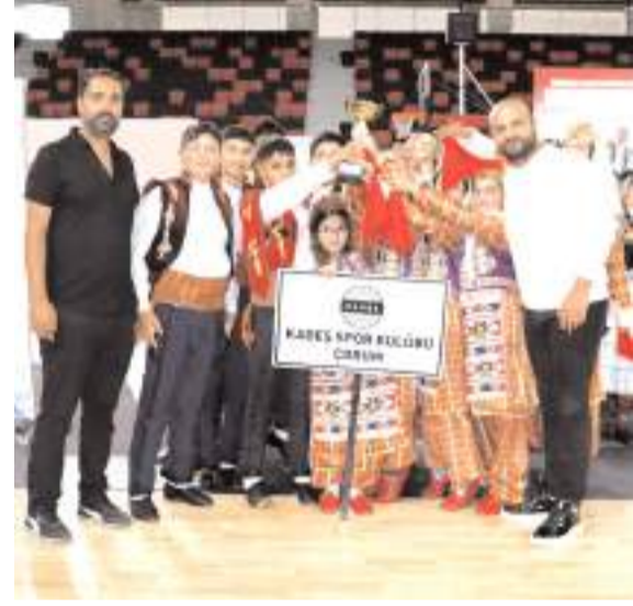
Çorum Kadeş Halk Oyunları yıldızlar kategorisinde iki dalda birden ikincilik ödülünün sahibi oldu

Yapılan gösteriler sonunda kategorilerinde dereceye giren takımlara kupaları verildi.