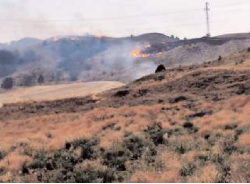
Alevler ormanlık alana sıçramadan söndürüldü.

Yıldırımın düşme anı, cep telefonu kamerasıyla kaydedildi.