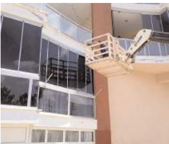
Balkon camına sıkışan güvercini fark eden vatandaşlar durumu itfaiyeye bildirdi.

Kurtarılan güvercin itfaiye personeli tarafından doğaya salındı. (İHA)