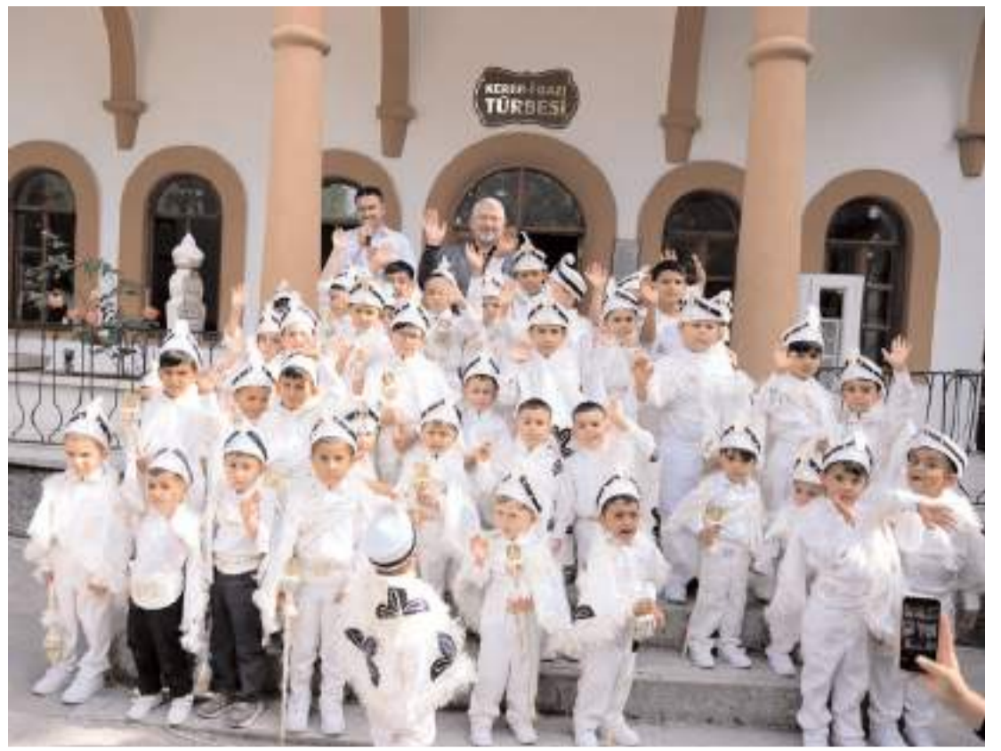
Çocuklar ilk olarak Hıdırlık'a giderek dua ettiler.