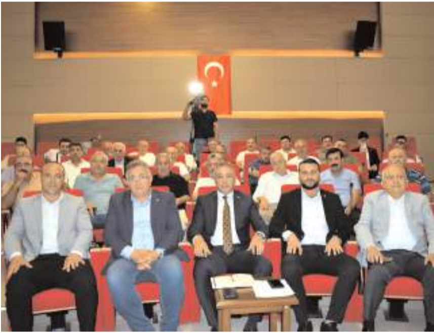
Toplantı Ticaret ve Sanayi Odası Toplantı Salonu'nda yapıldı.