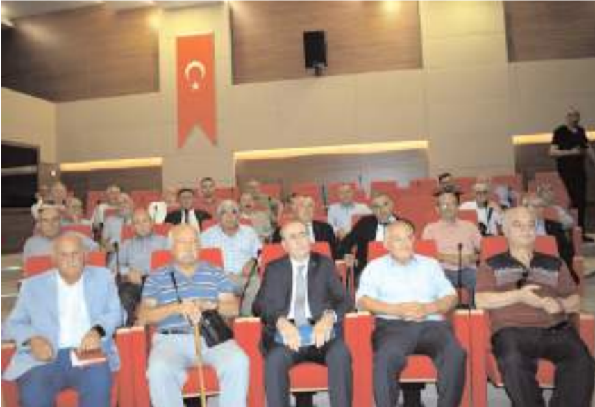
Toplantıda parti çalışmaları, sorunlar ve üyelerin talepleri görüşüldü.