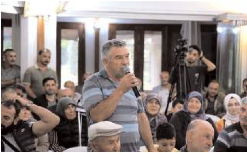
Vatandaşlar toplantıda sorunlarını dile getirdi.