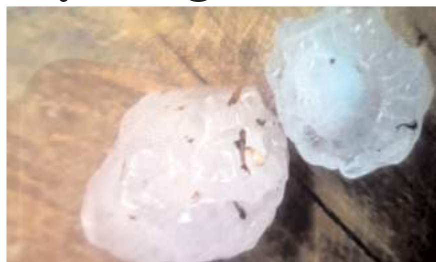
Ceviz büyüklüğündeki dolu hasara neden oldu.

İlçede öğleden sonra etkili olan sağanak ve dolu yağışı hayatı olumsuz etkiledi. İlçe merkezinde gök gürültülü sağanak yağış etkili olurken bazı bölgelerde ise ceviz büyüklüğünde dolu yağdı. Çiftlikler Mahallesinde sera naylonlarını delen ceviz büyüklüğündeki dolu, ağaç yapraklarını ve cevizleri de yere serdi. Bazı dolu tanelerinin ise cevizden de büyük olduğu görüldü. (İHA)