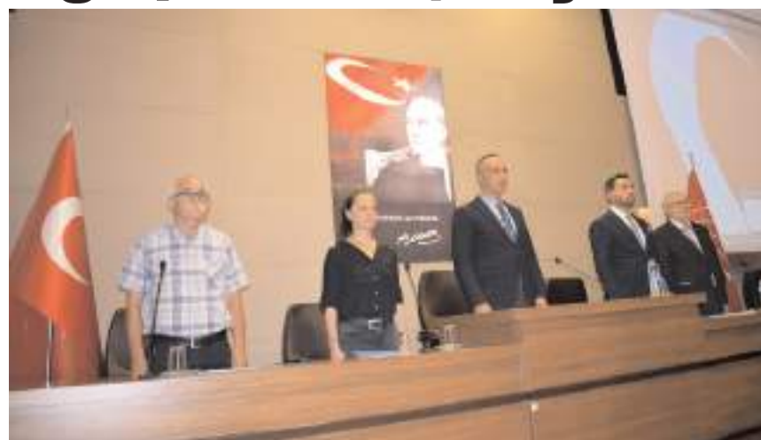
Cumhuriyet Halk Partisi, İl Danışma Kurulu Toplantısı yapıldı.