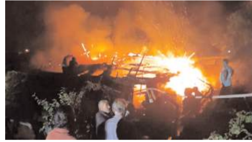
Olay Kozveran köyünde meydana geldi.

Yangın itfaiye ekipleri ve vatandaşlarca kontrol altına alınırken, yangında samanlık ve ahır zarar gördü.