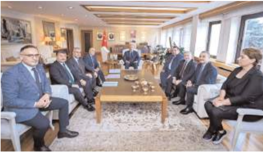
Çorum heyeti, Kültür ve Turizm Bakanı Mehmet Nuri Ersoy'u ziyaret etti.

Ahlatcı, "Çorum'unuz için el birliğiyle gayret gösterip, çalışmalarımızı hızla sürdürmeye devam edeceğiz. Vatandaşlarımıza hizmet üretmeye devam etmek için taleplerimizin takipçisi olacağız" ifadelerini kullandı. (Haber Merkezi)