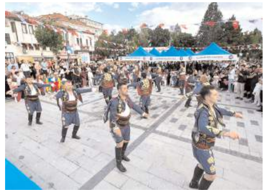
Şölende halk oyunları gösterileri gerçekleştirildi.