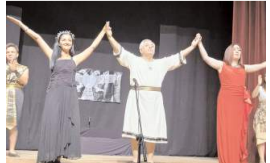
Oyunu Arkadaş Sanat Akademisi sahneliyor.