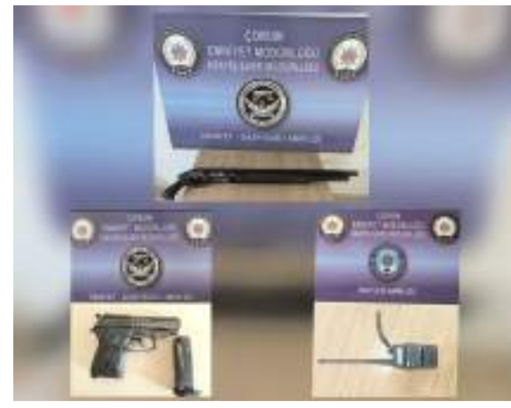
Denetimlerde çok sayıda ateşli silah ele geçirildi.