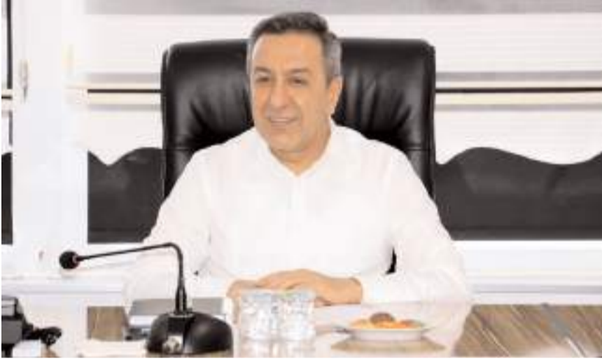
Sungurlu Belediye Başkanı Muhsin Dere