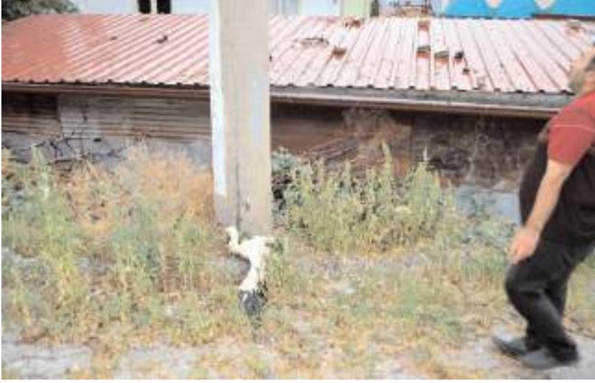
Vatandaşlar yavru leylediğin öldüğünü tespit etti.