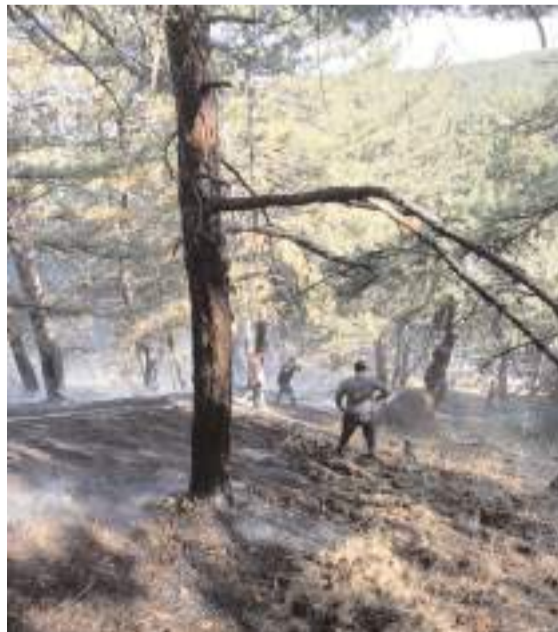
Yangın, Yukarıbeşköy köyü yakınlarındaki ormanlık alanda çıktı.