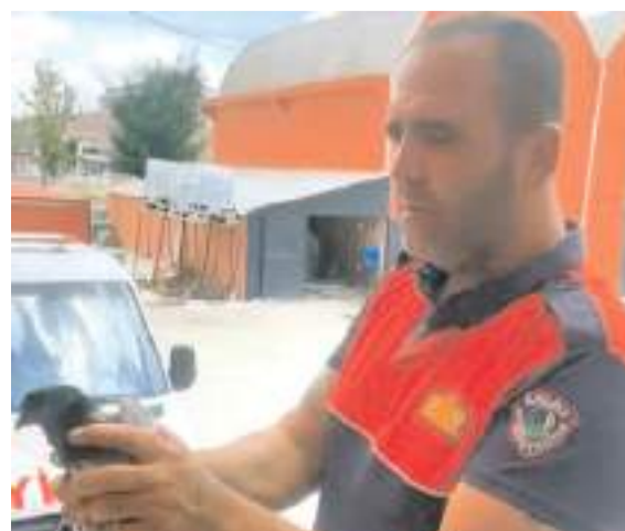
Güvercini sıkıştığı yerden itfaiye ekipleri kurtardı.