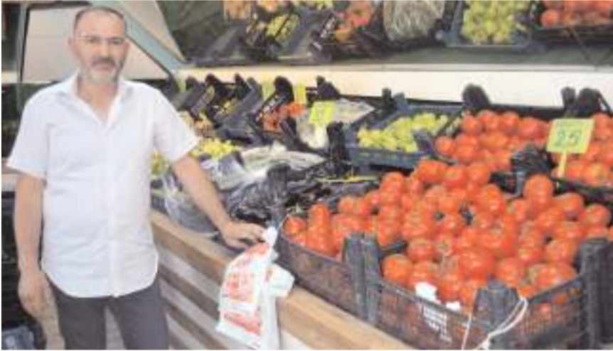
Kardeşler Manavı kaliteli sebze ve meyveleri müşterileriyle buluşturuyor.