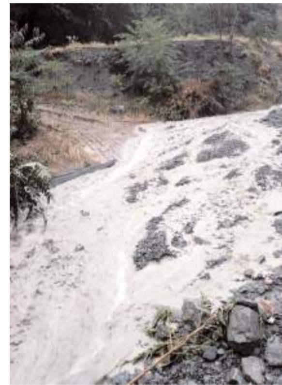
Şiddetli yağış çay ve dereleri taşırdı.