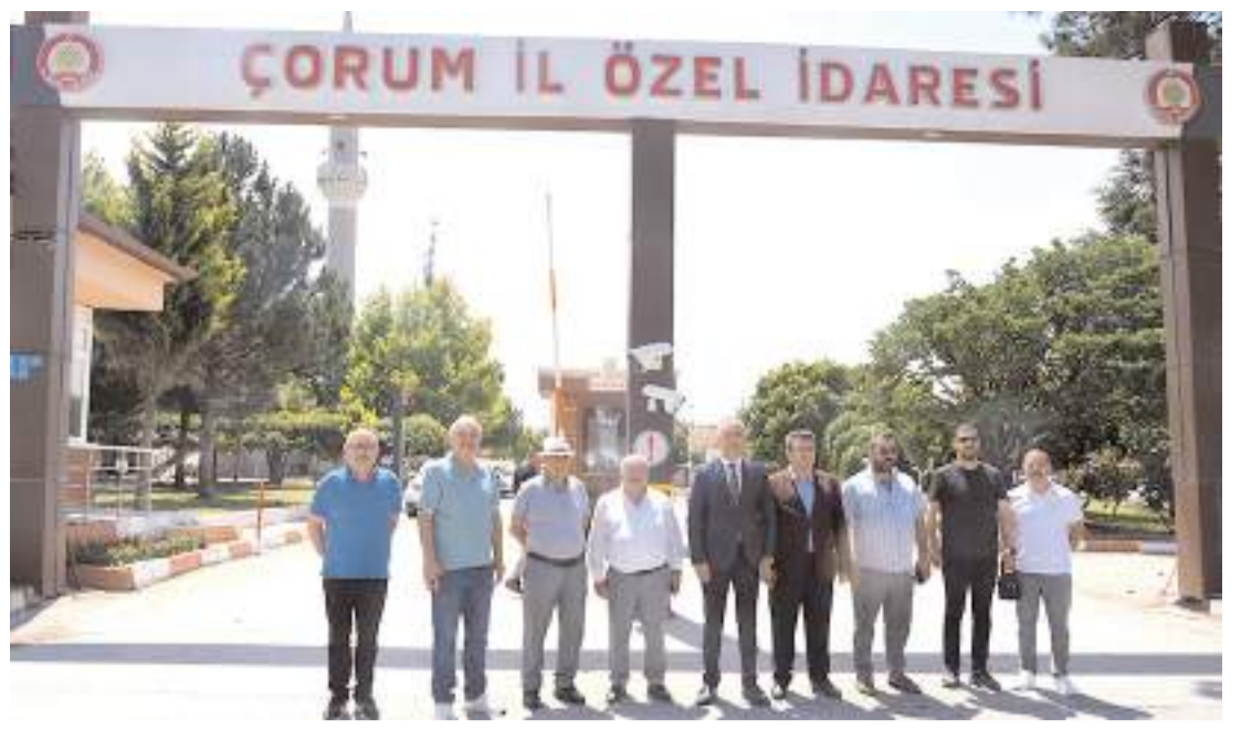
CHP Çorum Milletvekili Mehmet Tahtasız, İl Özel İdaresi önünde açıklama yaptı.