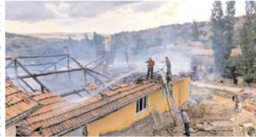
Olay Evcü köyünde meydana geldi.

Evden önce dumanlar sonra alevlerin yükseldiği-