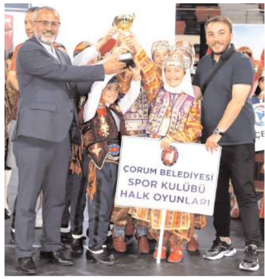
Minikler Geleneksel Düzenlemesiz kategorisinde bölge birincisi olan Çorum Belediyespor kulübü ödülünü alırken görüldüğü

Yıldızlar Geleneksel düzenlemesiz dal kategorisinde Ankara