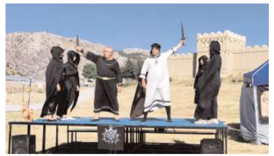
Oyun Hattuşa surları önünde de sahnelendi.