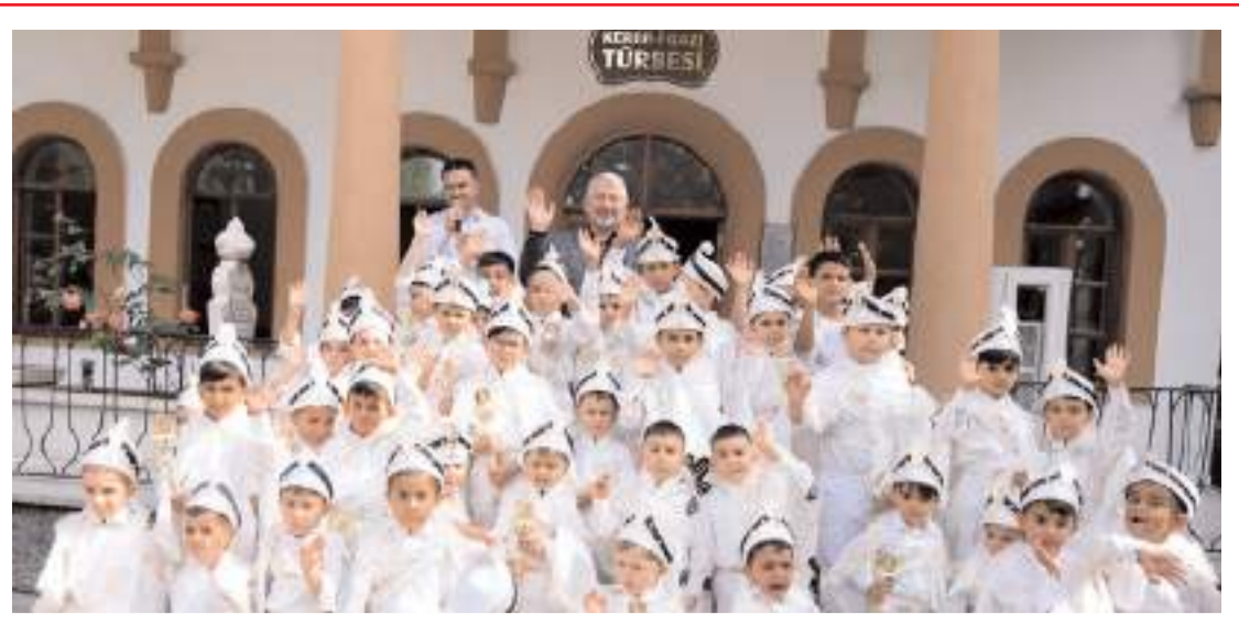
Çocuklar ilk olarak Hıdırlık'a giderek dua ettiler.