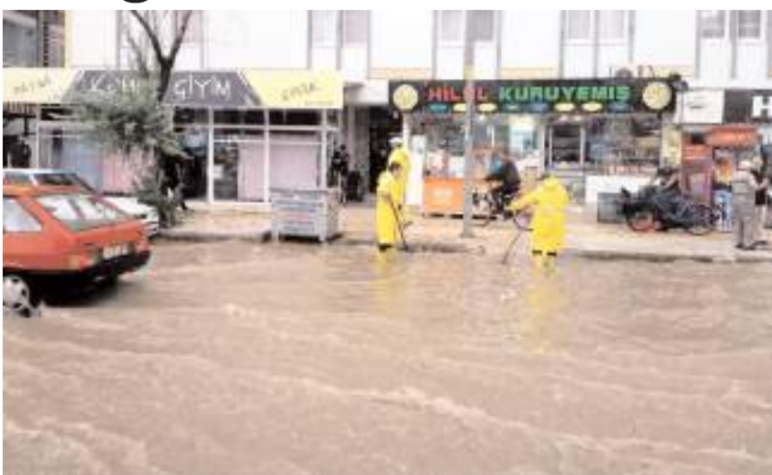
Belediye ekipleri tıkanan giderleri açmak için çalıştı.