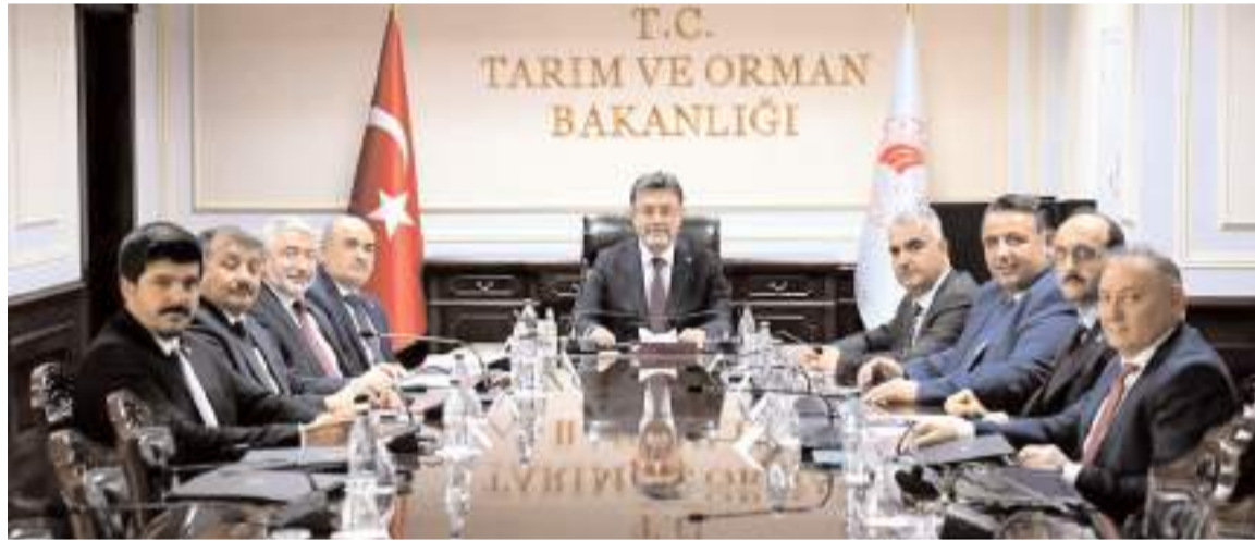
Çorum heyeti, Tarım ve Orman Bakanı İbrahim Yumaklı'yı ziyaret etti.