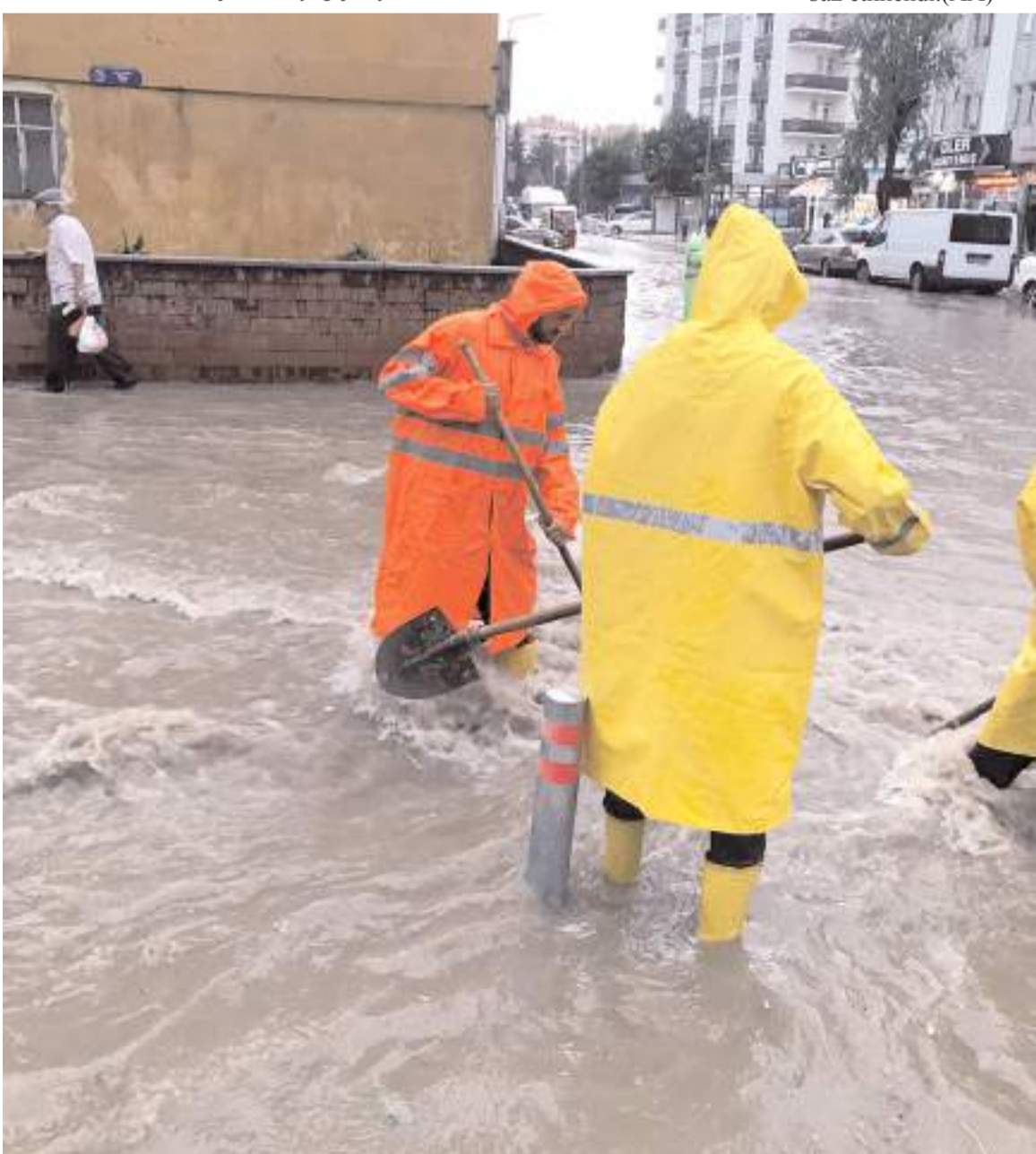
Belediye ekipleri yağmur sularını tahliye etmek için yoğun çaba harcadı.

Çorum'da etkili olan sağanak ve dolu hayatı olumsuz etkiledi.