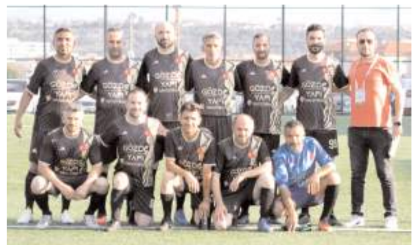
Gözde Yapı grubundaki son maçında rakibini yenerek turnuvaya üç puanla veda etti