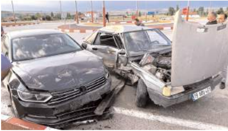
Kaza, Boğaziçi kavşağında meydana geldi.