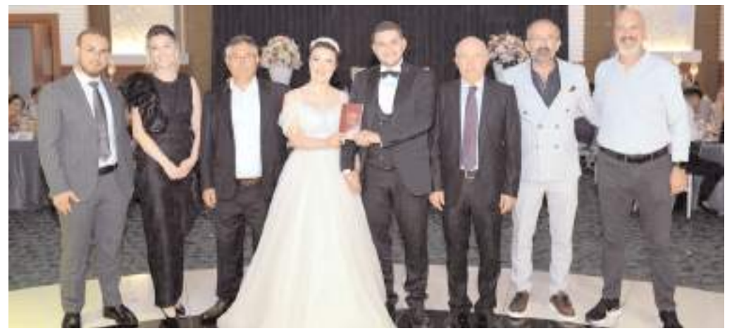
Genç çiftin düğünü Anitta Otelde yapıldı.

"Belirtiler kısa süre için düzelse bile evde beklemek inmenin tekrarlaması ve kalıcı olması riskini doğuracağı için tehlikeli olabilir. İnme belirtileri olan kişiye evde Aspirin vermek doğru değildir. İnme belirtileri olan kişinin tansiyonunu düşürmek için ilaç verilmemelidir. Hemen ambulans çağırılmalı, yoksa en uygun taşıt ile hastaneye gidilmelidir. Ambulans doktorunun gidilecek hastaneyi hastanızdan haberdar etmesi önemlidir. Mutlaka hastanın yanında hastaneye gidilmelidir. Hasta yakını tedavilerin yapılabilmesi için onay vermelidir. Hastaya o sırada en yakın olan veya önceden başka nedenle tedavi olduğu hastane de inme tedavisi için en uygun hastane olmayabilir. Uygun olmayan bir kuruma gitmek tedavi şansını büyük oranda ortadan kaldıracaktır. Mutlaka pıhtı eritici ilaç ve kateter tedavi yöntemlerinin uygulanabilirdiği, içinde bir inme ünitesinin bulunduğu bir hastaneye başvurulmalıdır." (Haber Merkezi)