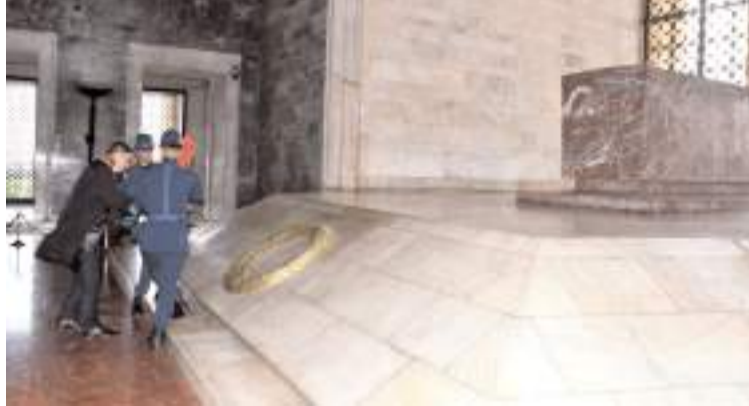
Baro Başkanı Turan Kalıpcı, Atatürk mozolesine çelenk sundu.