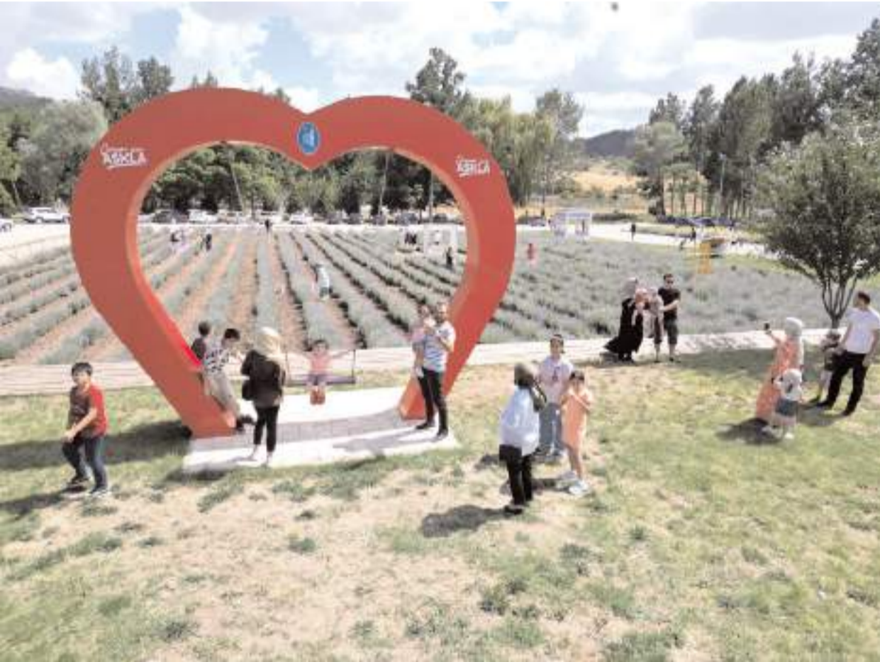
Lavanta Bahçesi bu yıl da ziyarete açıldı.

Resmi İlanlar: www.ilan.gov.tr 'de (Basın: 2059540)