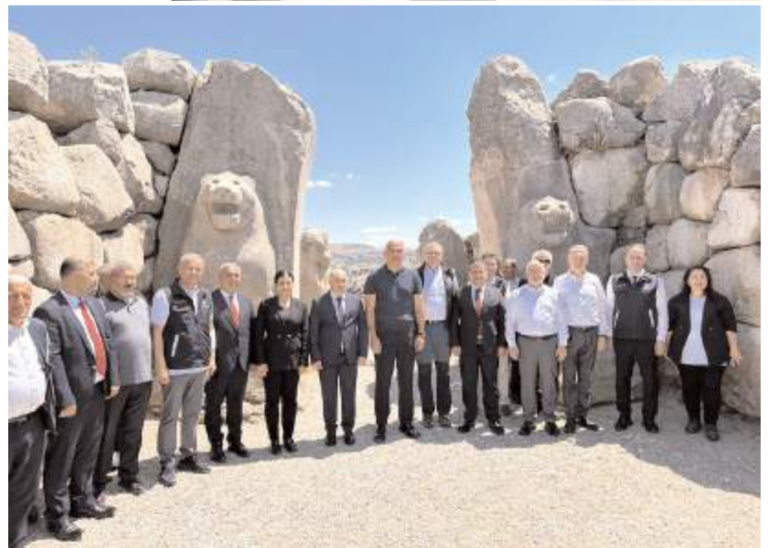
Bakan Ersoy ve beraberindekiler Aslanlı Kapıda hatıra fotoğrafı çekindi.