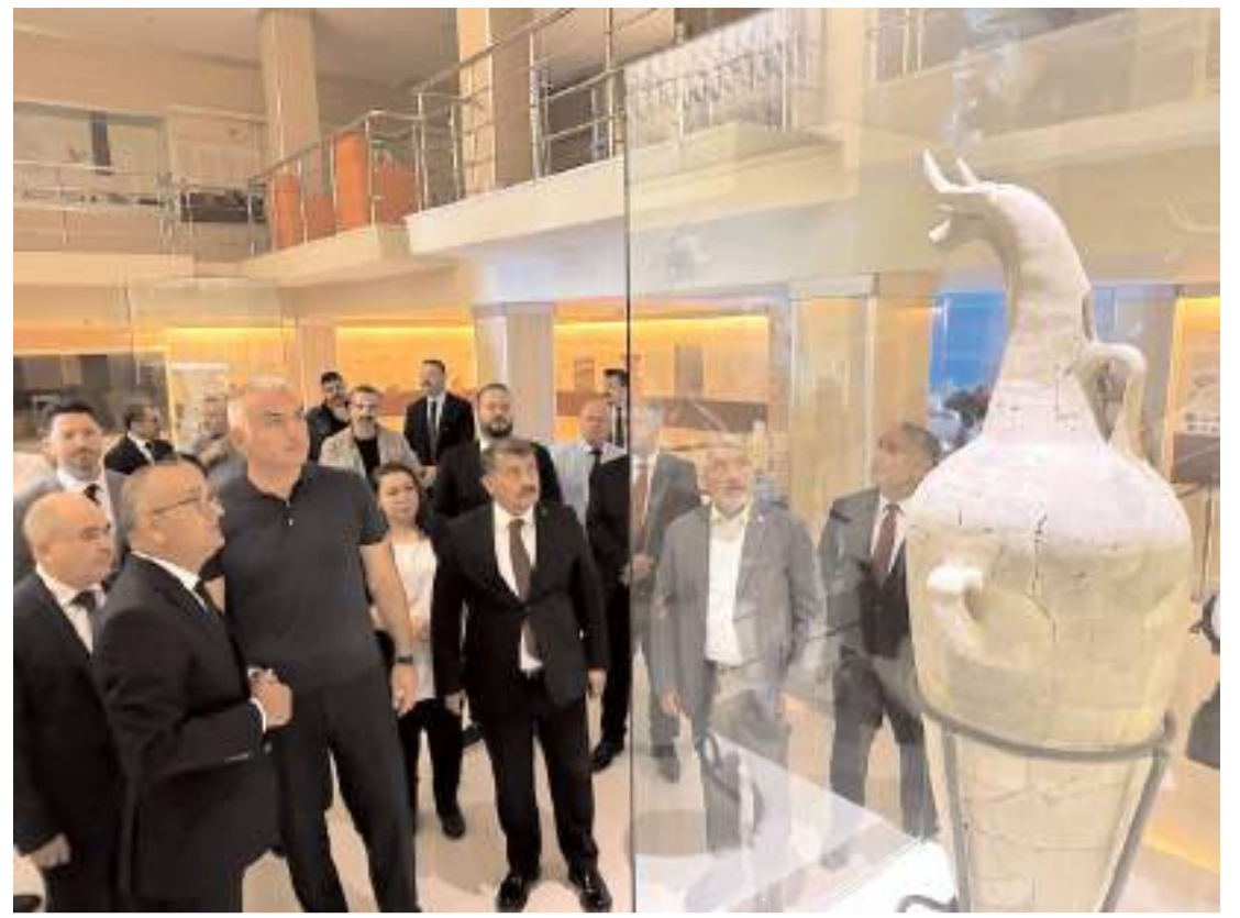
Kültür ve Turizm Bakanı Mehmet Nuri Ersoy, Boğazkale Müzesi'ni gezdi.