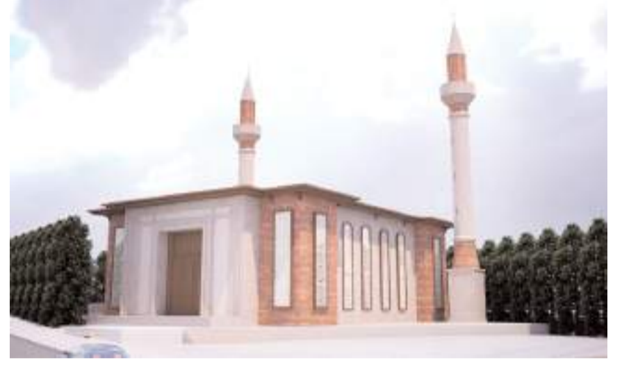
Cami 5 bin 625 metrekare yerleşim alanına sahip.