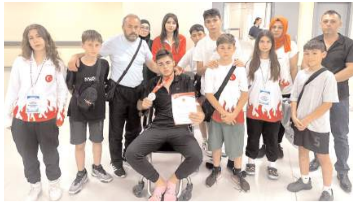
Çorum kafilesi hastaneye kaldırılan sporcu arkadaşlarını yalnız bırakmadı ve geçmiş olsun ziyaretinde bulundu