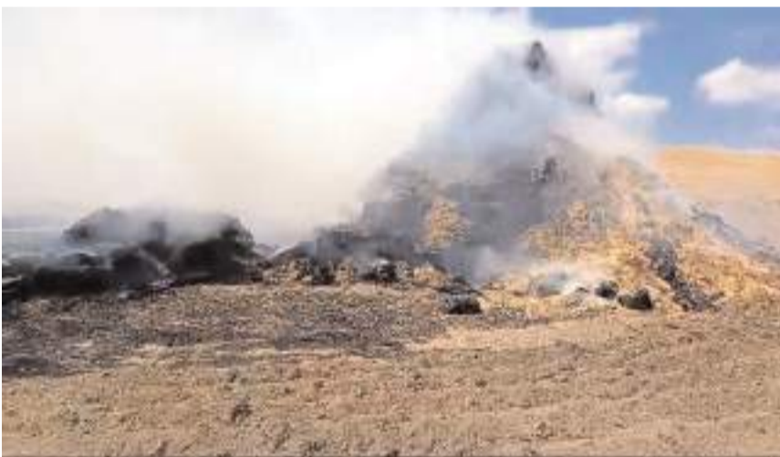
Olay Bolatcık köyünde meydana geldi.

Alaca'da, bilinmeyen bir nedenden dolayı çıkan yangında yaklaşık bin saman balyasını yarak kül oldu.