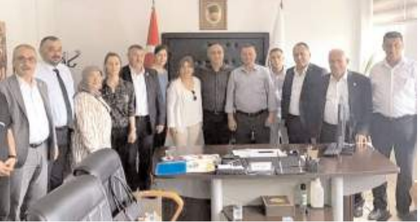
CHP heyeti belediyenin faaliyetleri hakkında bilgi aldı.