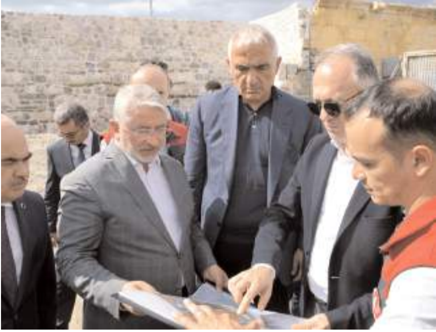
Bakan Ersoy, Çorum Kalesi restorasyon projesini inceledi.