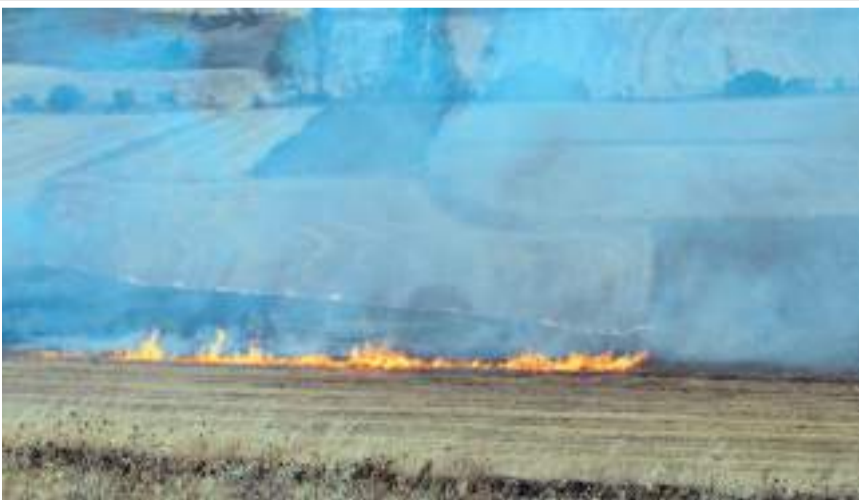
Anız yangını nedeniyle yaklaşık 30 dekar alan zarar gördü.

Dodurga Belediye Başkanı İsmail Çetinkaya da bölgeye gelerek, yangınla ilgili bilgi aldı.(AA)