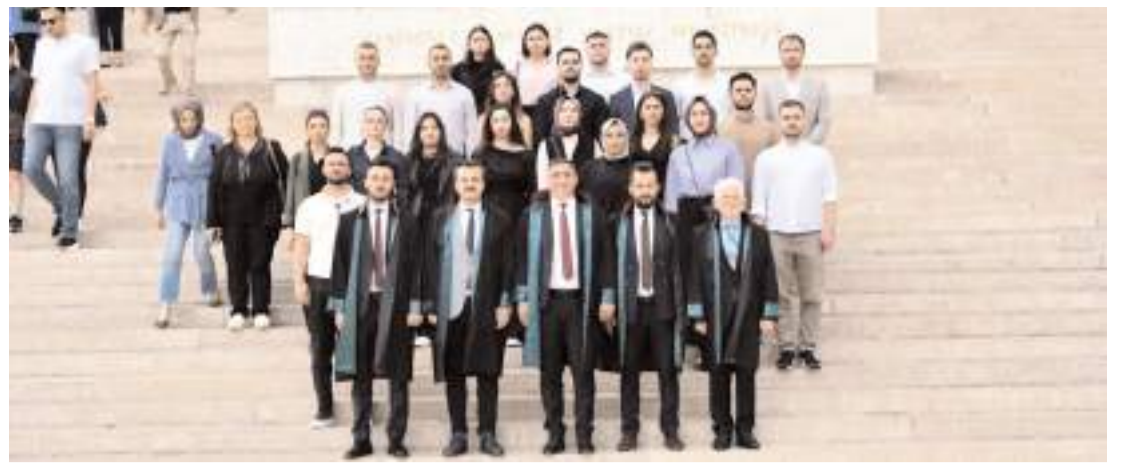
Ziyaretin sonunda hatıra fotoğrafı çekildi.