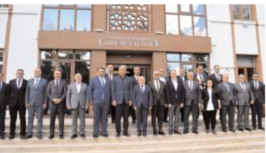
Ziyaretin sonunda hatıra fotoğrafı çekildi.