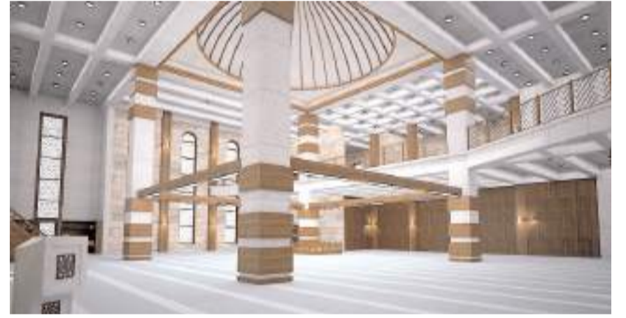
Cami 1000 kişi kapasiteli.

625 metrekare yerleşim alanına sahip cami 1000 kişi kapasiteli olacak. Caminin temeli 2 Şubat 2024 Cuma günü atılmıştı.