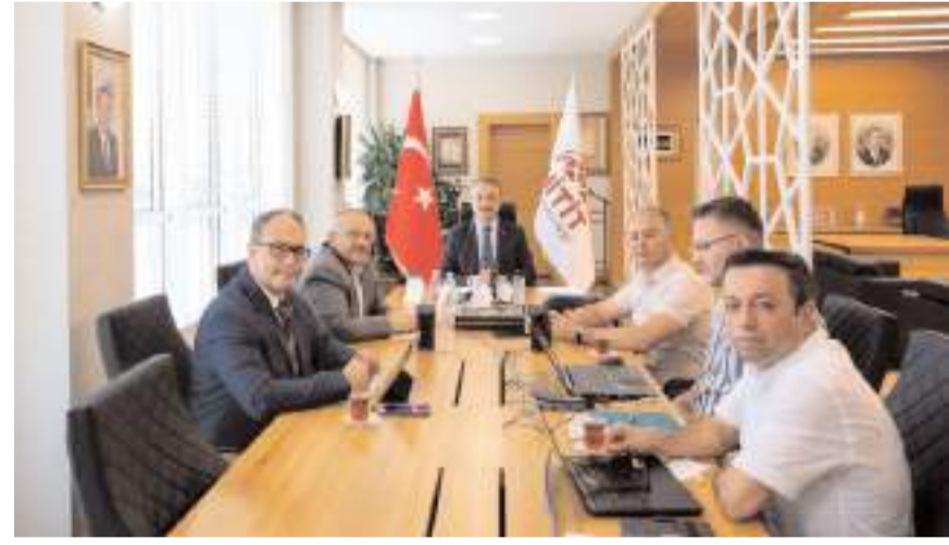
HİTÜ ile Muhammadiyah Bengkulu Üniversitesi işbirliği yapacak.