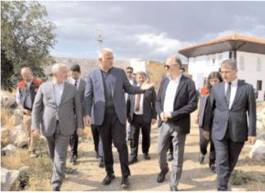
Bakan Ersoy, Kale'de yapılan çalışmalar hakkında bilgi aldı.