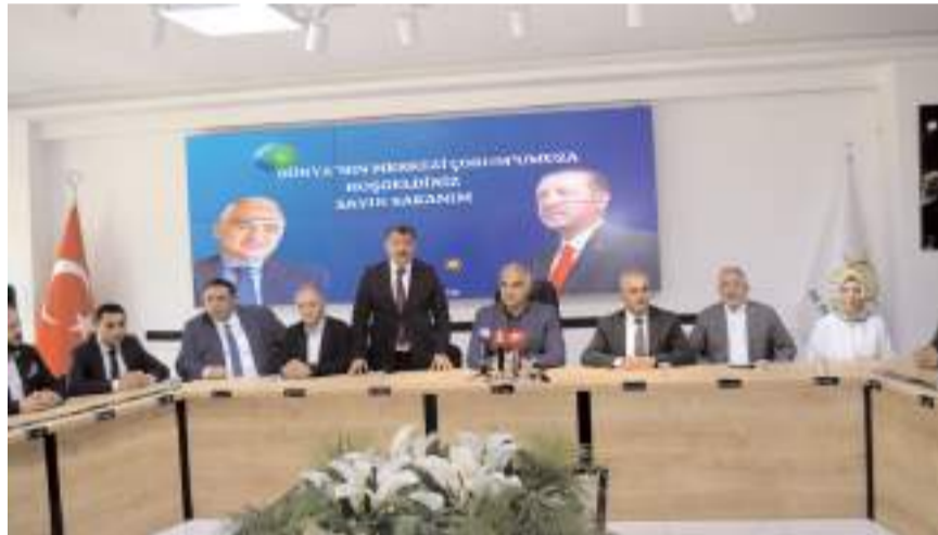
Kültür ve Turizm Bakanı Mehmet Nuri Ersoy, AK Parti İl Başkanlığı'na ziyaret etti.