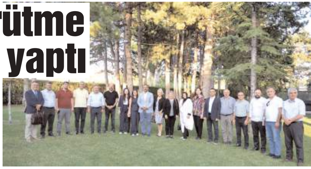
Toplantının ardından hatıra fotoğrafı çekildi.