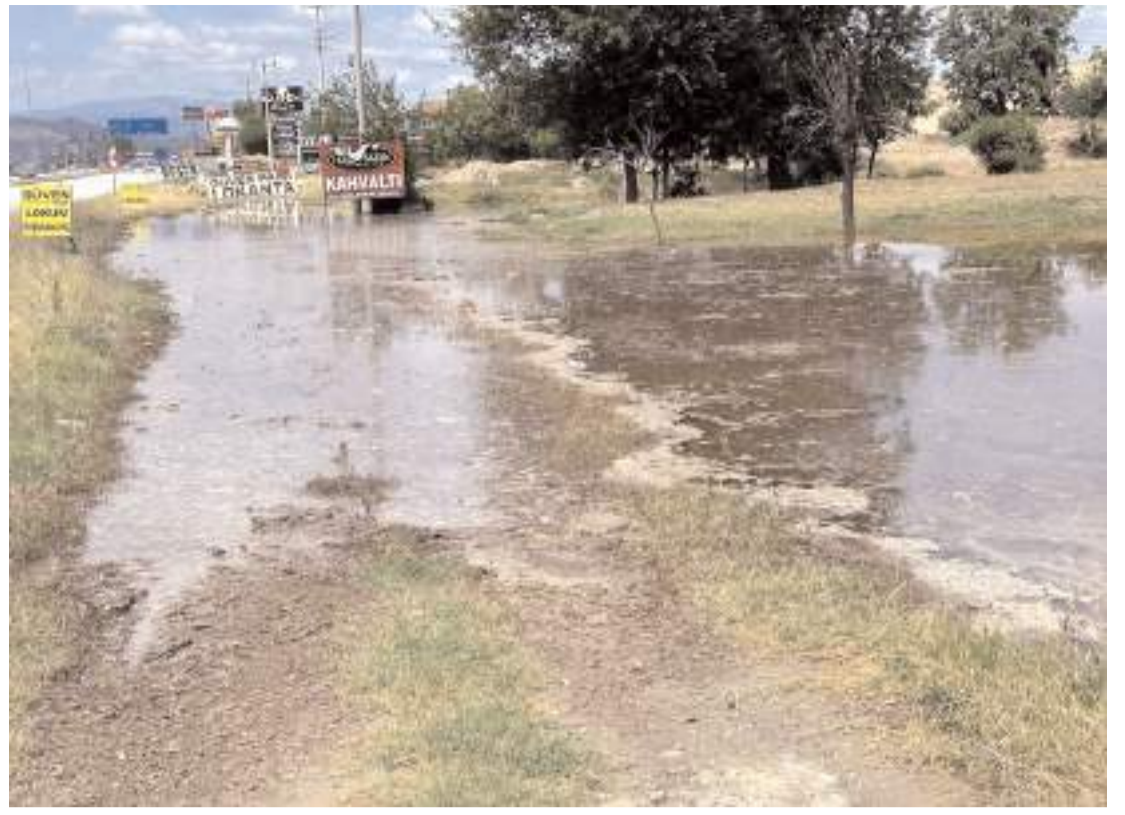
Çiftlikler Mahallesi Gökbel Bağları mevkiinde bulunan menfez tıkanı.

Gözaltına alınan şüpheliler, ifade işlemleri için polis merkezine götürüldü.(AA)