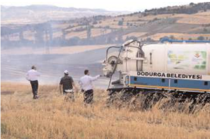
Dodurga Belediyesi itfaiye ekipleri yangını söndürdü.