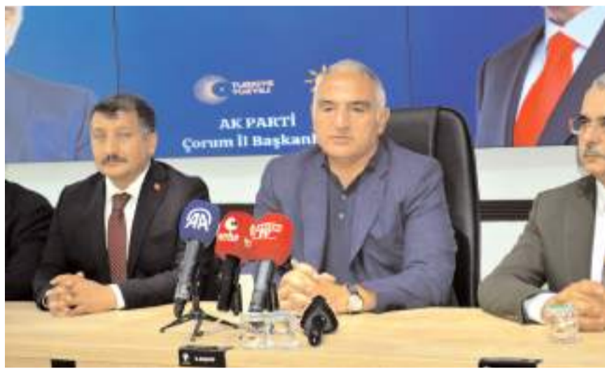
Kültür ve Turizm Bakanı Mehmet Nuri Ersoy, ziyarette açıklamalarda bulundu.

CAĞIZ' Basın mensuplarının Hitit Barajı Park ve Rekreasyon Tesisi Projesi ile ilgili sorularına cevap veren Bakan Ersoy, "Biz Çorum'un turizm potansiyeli ile ilgili Master Planı çalışması yapacağız. Hem bir ana rotanın bir parçası haline getireceğiz hemde kendi içinde kendi rotasını oluşturmamız gerekiyor. Turistlerin Çorum'u birkaç saatte gezip çıkabilecekleri bir şehir olmaktan çıkıp, en az bir gece konaklamasını gerektirecek bir rota oluşturmamız gerekiyor. Bunu yaparken tarihi yerlerin ihyası Hitit Barajı da bunların içinde, Kale ve çevresi dahil içindeki mekanların oluşturularak akşamda dahil keyifli vakit geçirebilecekleri ortamları yaratmamız lazım. Bu bağlamda geniş bir çalışma yapacağız. Bakan Yardımcımız hemşehrini Gökhan Yazgı da bu projeleri birinci dereceden takip edecek. Gelişmeleri birkaç ay içinde göreceksiniz. Bakanlık olarak hızlı bir müdahale bulunacağız" diyerek sözlerini tamamladı.