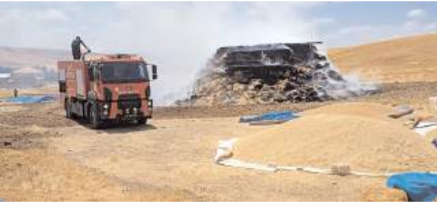
İtfaiye ekipleri yangını söndürdü.