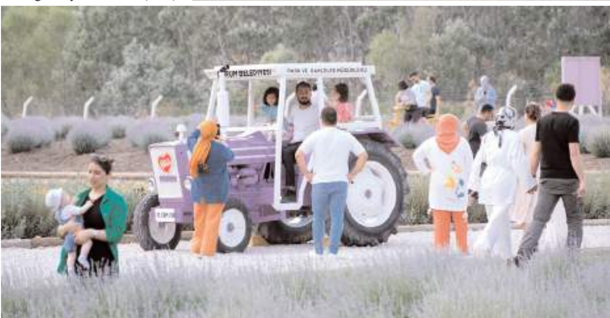
Lavanta Bahçesine vatandaşların ilgisi yüksek oluyor.