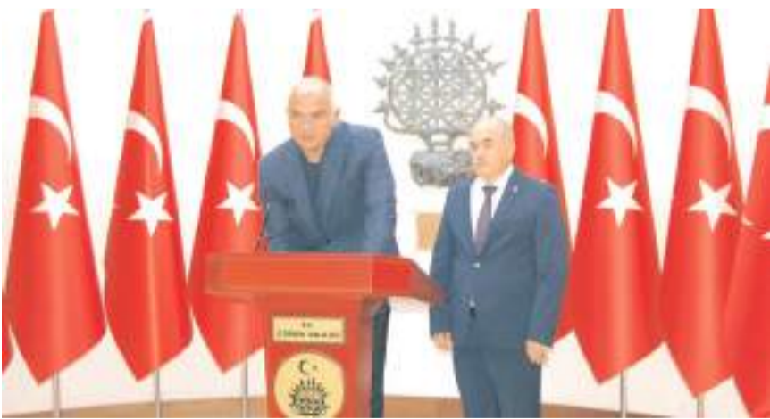
Bakan Ersoy, Valilik anı defterini imzaladı.