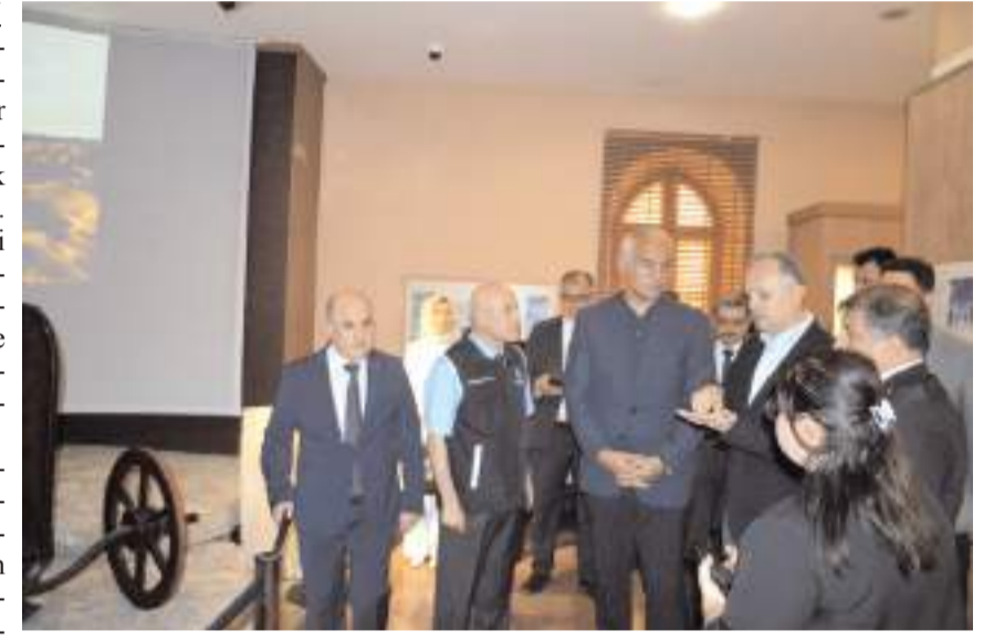
Bakan Ersoy, müzede incelemede bulundu.

Müze ziyaretinden sonra Çorum Kalesi'nde restorasyon çalışmalarını yerinde inceleyen Bakan Ersoy, daha sonra restorasyonu geçtiğimiz yıllarda