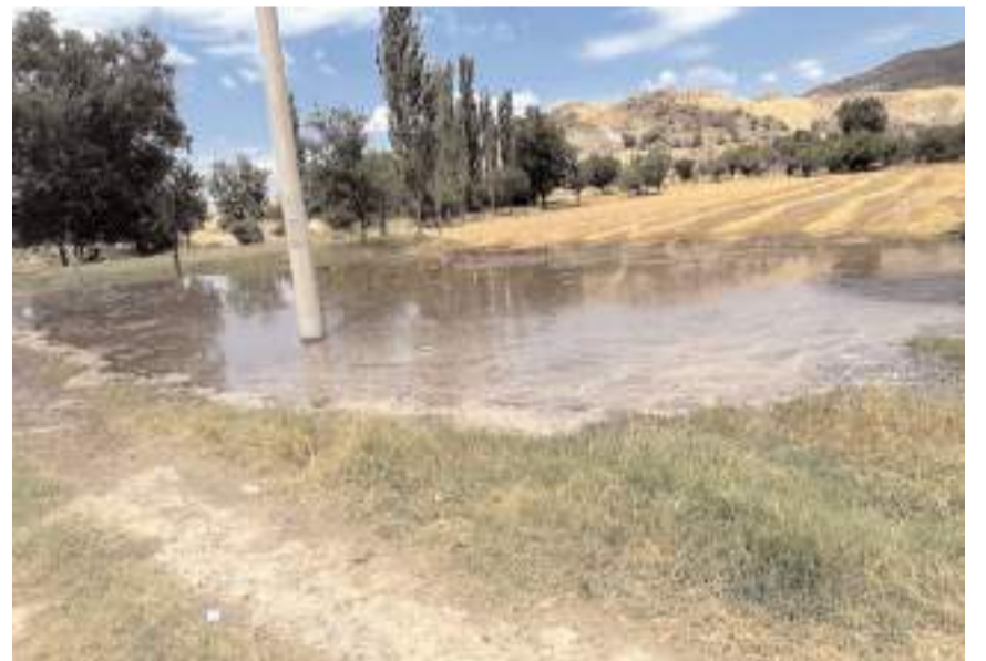
Bölge sakinleri sorunun çözülmesini istiyor.