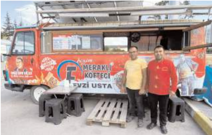
Fevzi usta Fen Lisesi karşısında faaliyet gösteriyor.