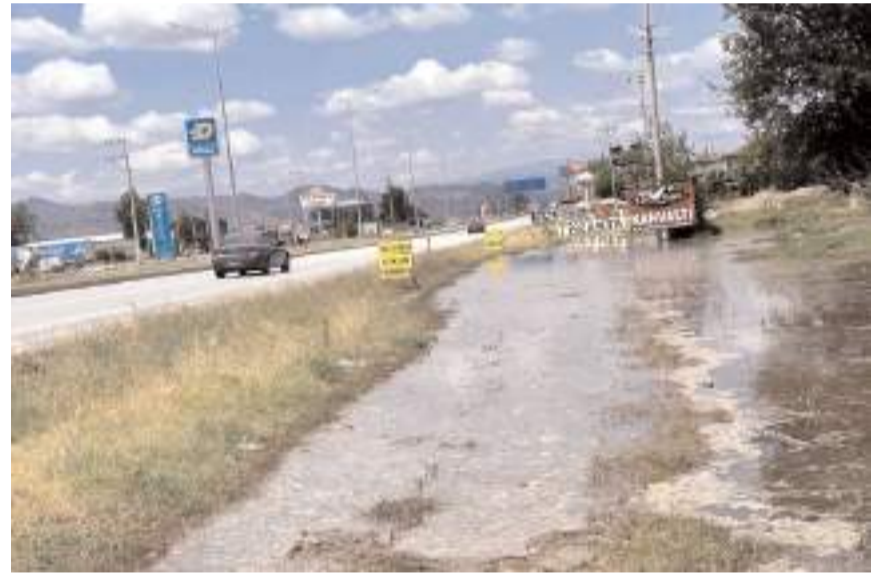
Yağmur suları arazilere doldu.

Bölge sakinleri yol kenarında biriken yağmur sularının tahliye olamadığı için karayoluna taşmasından endişe duyduklarını dile getirerek; "Sağanak biraz daha sürseydi D-100 -E-80 karayolu da trafiğe kapanacak bir hal alacaktı. Araç muayene istasyonu karşısındaki menfez nereye gitti?" şeklinde sorarak konuya el atılmasını istediiler. (İHA)