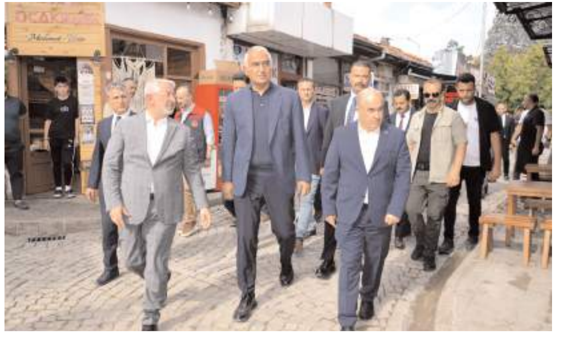
Bakan Ersoy, Tarihi Dikiciler Arastası ile Ayakkabıcılar Arastası'nı gezdi.

Kalenin içinde çok fazla mimari yapının olmaması gerektiğini belirten Bakan Ersoy; "Buranın içerisini serbest bahçe gibi bırakmanız çok daha iyi olur. Sadece tescilli yapıları ihya edin. Her tarafı yeşil, yürüyüş yollarını, solüsyonlu toprak yapın." şeklinde konuştu.