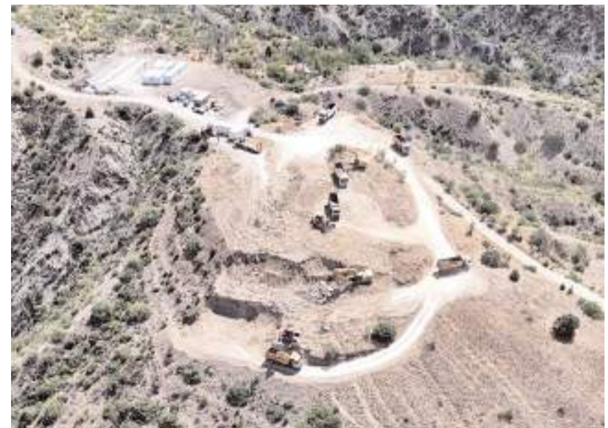
Projenin hafriyat çalışmaları başladı.