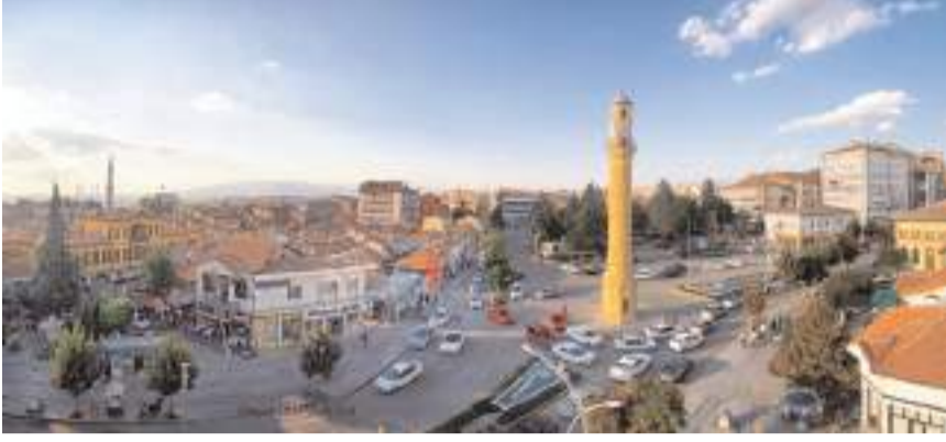
Yayımlanan rapora göre Çorum, 81 il içinde 53.sırada yer aldı.

Araştırmaya göre ortalama 90 puanla öğrenci memnuniyeti açısından ilk sıraya yerleşen Eskişehir, Türkiye'nin en öğrenci dostu şehri oldu.