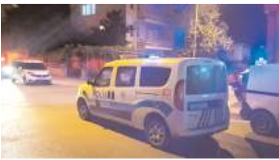
Olay Kale Mahallesi Mahmut Tunaboylu Sokak'ta meydana geldi.