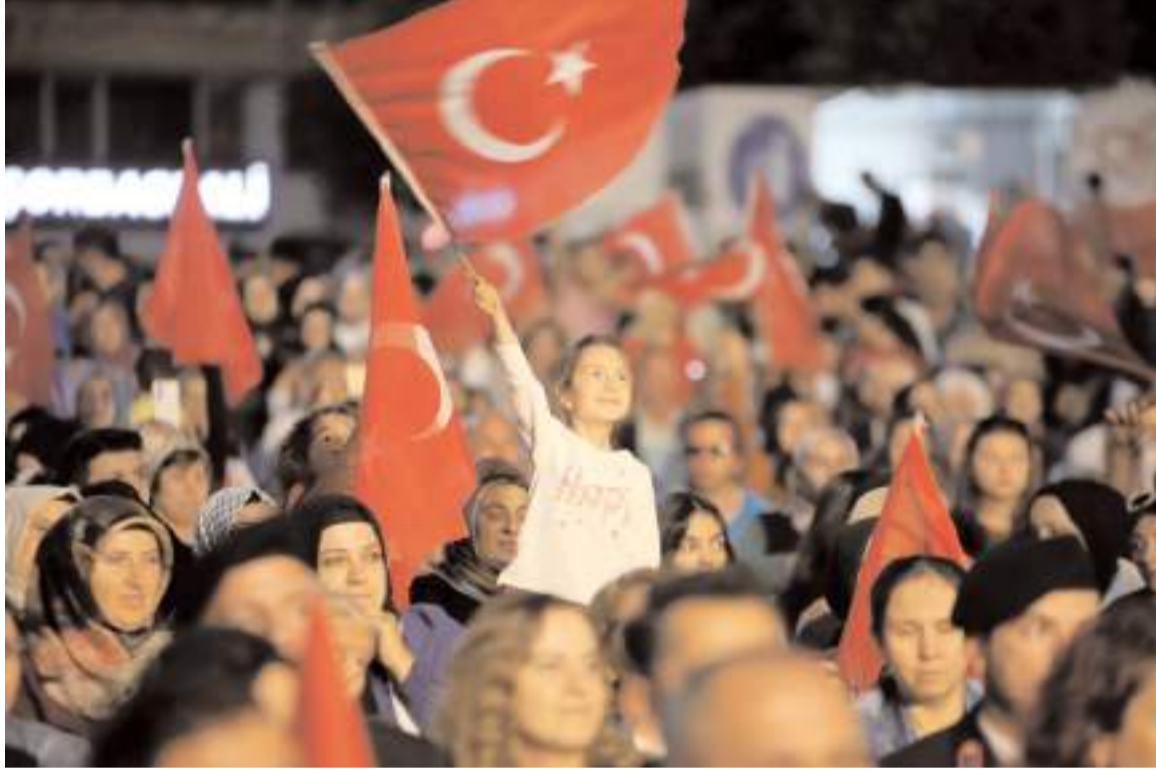
Kadeş Barış Meydanında yapılan etkinliğe ilgi yüksek oldu.