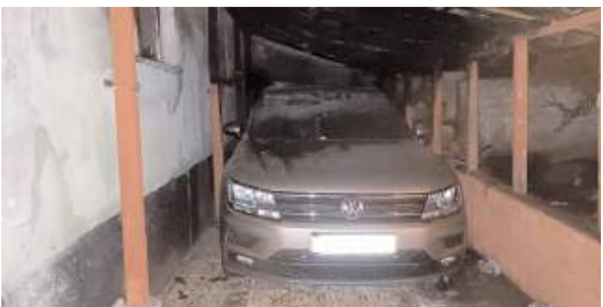
Yangında araç kullanılmaz hale geldi.

Alaca'da bir garajda çıkan yangında park halindeki cip kullanılmaz hale geldi.