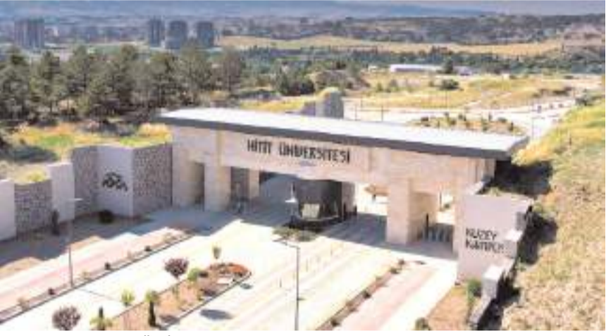
ÜNİAR, üniversite öğrencilerine kucak açan şehirlerle ilgili 2024 yılı incelemesini yayımladı.