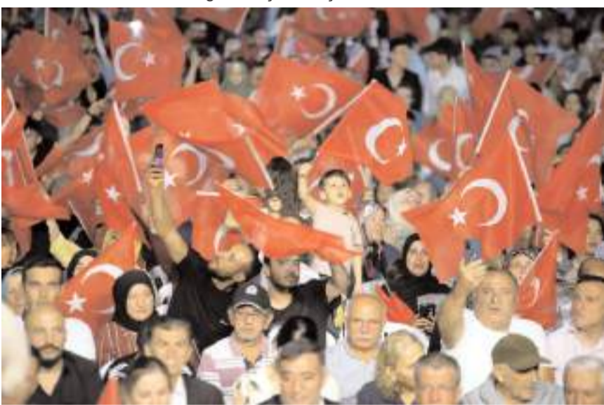
Vatandaşlar ellerinde Türk bayrakları ile etkinliğe katıldı.