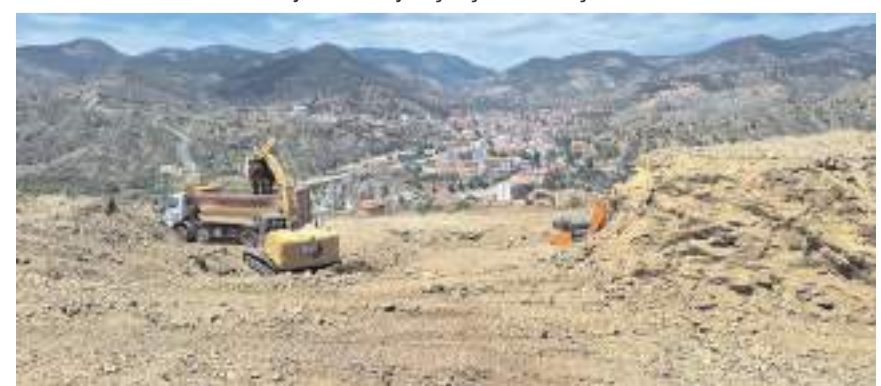
TOKİ konutları 14 blokta 2+1, ve 3+1 dairelerden oluşacak.