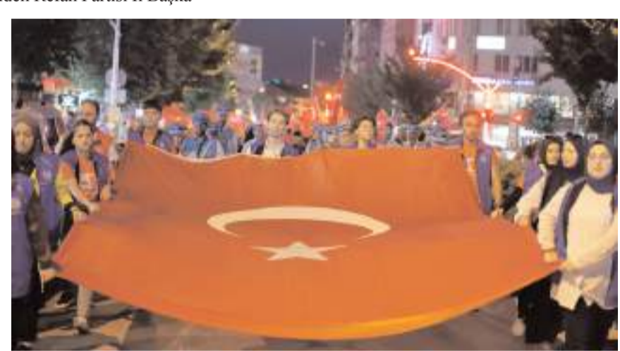
Ulu Cami yanından başlayan yürüyüş Kadeş Barış Meydanında sona erdi.