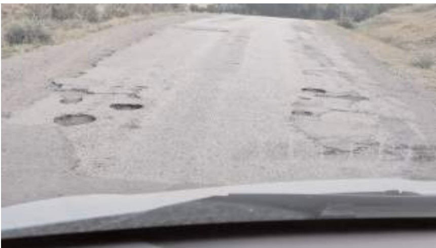
Köy halkı yolun asfaltlanmasını istiyor.