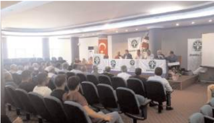
Toplantıda gündem maddeleri görüşülerek karara bağlandı.