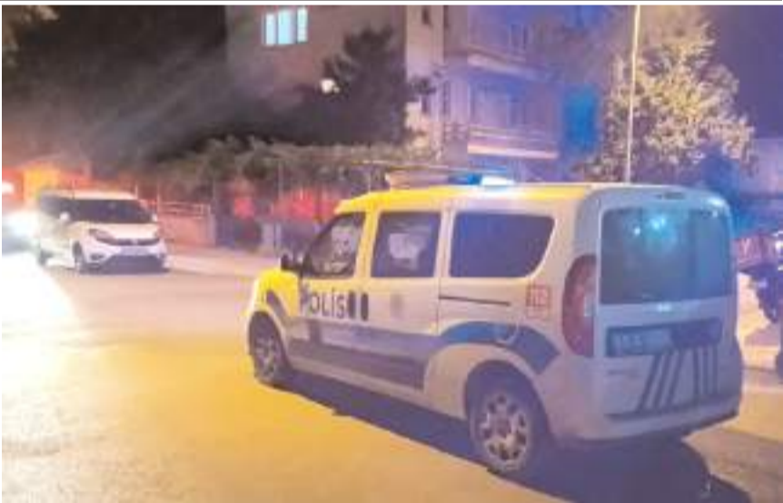
Olay Kale Mahallesi Mahmut Tunaboşlu Sokak'ta meydana geldi.

Olay, önceki gün gece saatlerinde Kale Mahallesi Mahmut Tunaboşlu Sokak'ta meydana geldi. Edinilen bilgiye göre, sokak üzerinde bulunan bir ev, kimliği belirsiz kişi ya da kişiler tarafından kurşunlandı. Şahıslar olay yerinden kaçarken, silah seslerini duyan vatandaşlar durumu 112 Acil Çağrı Merkezine bildirdi. Olayda ölen ya da yaralanan olmazken, kurşunların isabet ettiği evde maddi hasar meydana geldi. İhbar