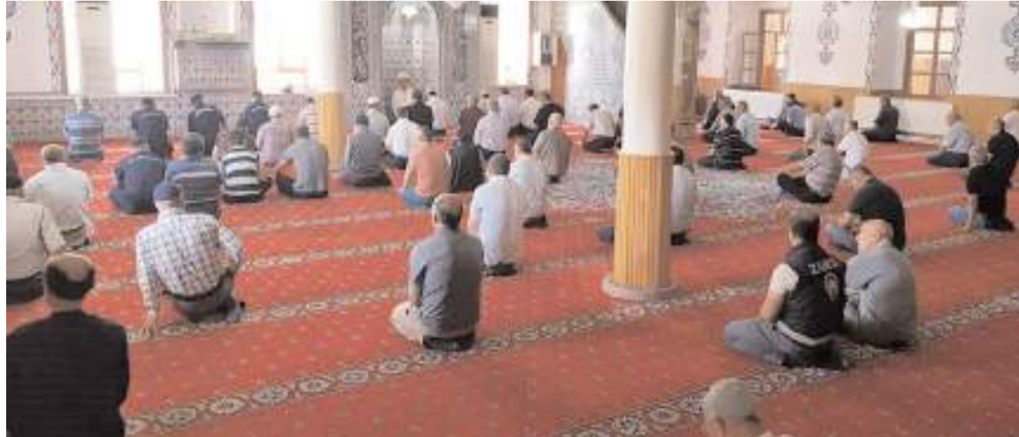
Bayat'ta şehitler için mevlidi şerif okutuldu.

Çorum'un Bayat ilçesinde 15 Temmuz Milli Birlik Günü dolayısıyla bir dizi program düzenlendi. Cumhuriyet Meydanında düzenlenen etkinlikler, saygı duruşu ve İstiklal Marşı'nın okunmasıyla başladı. Şehitler için yapılan duanın ardından 15 Temmuz Milli Birlik Günü sebebiyle düzenlenen yarışmalarda dereceye giren öğrencilere ödülleri verildi.