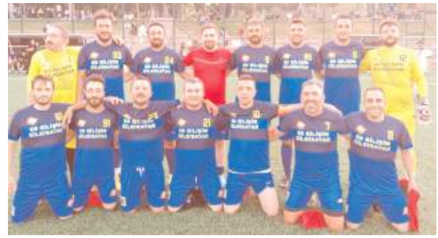
Es Bilişim bugün Eker İnşaat önünde kazanarak finalde mücadele etmek istiyor

Bugün oynanacak yarı final maçlarını kazanan takımlar 20 Temmuz cumartesi günü bu yılın şampiyonunu belirlemek için karşılaşıacaklar.