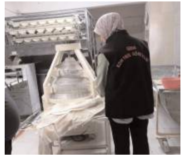
İl Tarım ve Orman Müdürlüğü ekipleri denetimlerine devam ediyor.