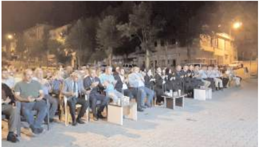
Bayat ilçesinde 15 Temmuz Milli Birlik Günü dolayısıyla bir dizi program düzenlendi.