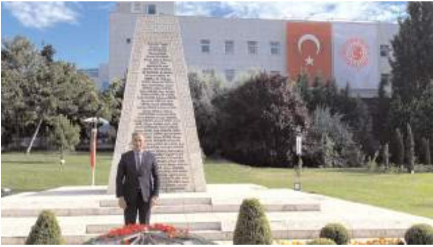
Milletvekili Mehmet Tahtasız, TBMM'de düzenlenen anma etkinliklerine katıldı.