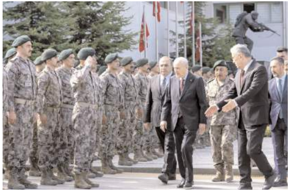
MHP Genel Başkanı Devlet Bahçeli, Ankara Gölbaşı'ndaki Özel Harekat Başkanlığına ziyaret etti.

Biz bu coğrafyada bin yıldır dostça kardeşçe barış içinde yaşıyoruz. Sizin de sizin ağababalarınızın da bu kardeşliği bozmaya gücünüz yetmez. FETÖ, PKK, PYD gibi terör örgütlerinin yurt içindeki ve yurt dışındaki uzantıları unutmasınlar ki: Türkiye Cumhuriyeti Devleti, milleti ve ordusu ile hamdolsun dimdik ayakta. Biz ülkücüler olarak hainlere şöyle haykırıyoruz: "Ruhumuzu kandırdık Orhun'un kaynağından, bu kaynaktan içenin yürekleri tunç olur, Türk'e kefen biçenin ölümü korkunç olur. Türk milletinin, 15 Temmuz Demokrasi ve Milli Birlik Günü'nü kutlar, Allah'tan bu millete bir daha böyle bir gece yaşatmamasını temenni ederim. Bu topraklar için canını vermiş şehit ve gazilerimizi saygı ve rahmet ve minnetle anıyor, ailelerine, milletimize başsağlığı diliyorum. Aziz hatıralarını canımız pahasına koruyacağımıza ve yaşatacağımıza söz veriyoruz. Rabbim Devletimize ve milletimize zeval vermesin." (Haber Merkezi)