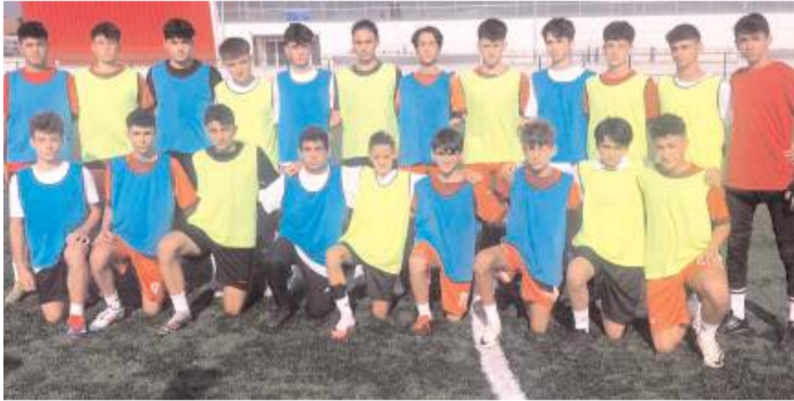
Çorum FK alt yapı seçmelerine değişik illerden beş kategoride toplam 75 sporcu katılarak ter döktü