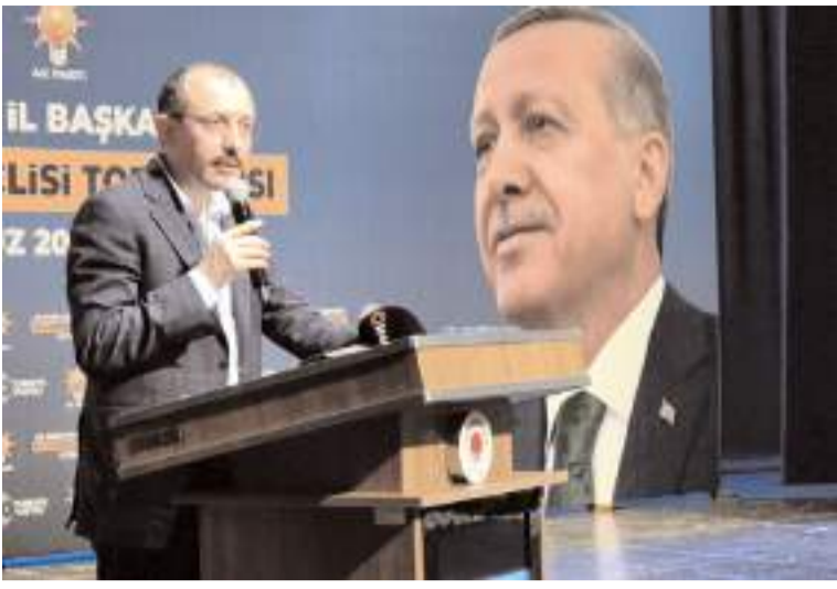
AK Parti Samsun Milletvekili ve TBMM Plan ve Bütçe Komisyonu Başkanı Mehmet Muş

AK Parti Samsun İl Danışma Meclisi Toplantısı'nda konuşan AK Parti Samsun Milletvekili ve TBMM Plan ve Bütçe Komisyonu Başkanı Mehmet Muş, Delice-Çorum hızlı tren projesi ihalesinde Çorum kaynaklı bir pürüz çıktığını belirterek pürüz giderilince ihalenin yapılacağını açıkladı.