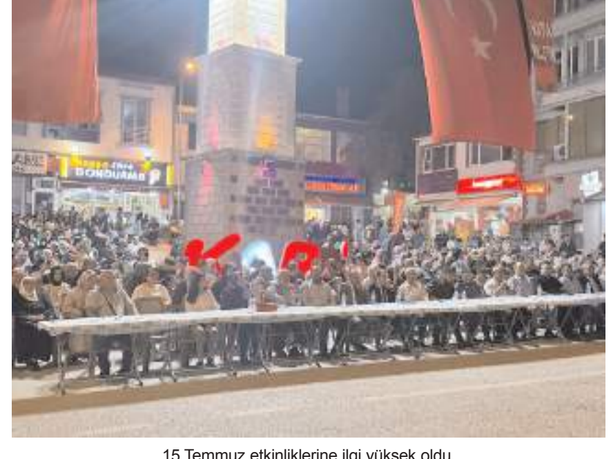
15 Temmuz etkinliklerine ilgi yüksek oldu.