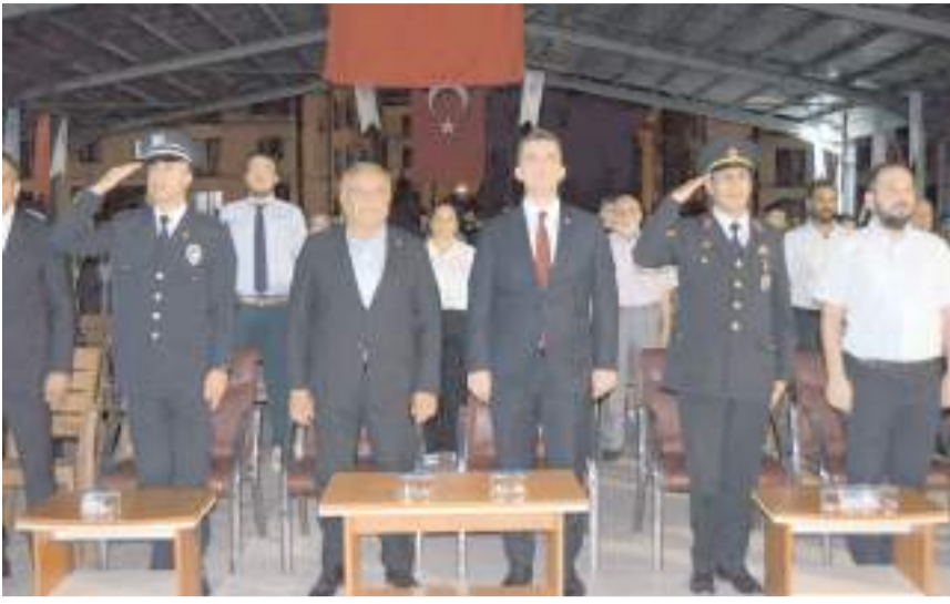
15 Temmuz Demokrasi ve Milli Birlik Günü nedeniyle ilçelerde çok sayıda etkinlik yapıldı.