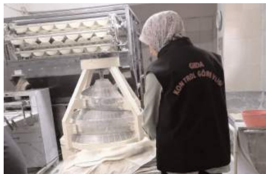
İl Tarım ve Orman Müdürlüğü ekipleri denetimlerine devam ediyor.

"Denetimlerimizde hijyen kurallarına uymayan, ürünlerini uygun koşullarda muhafaza etmeyen ve tüketicinin sağlığını tehlikeye atan işletmelere karşı yasal çerçevede gereken tüm adımları atıyoruz. Amaç-