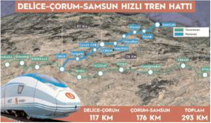
Proje kapsamında ilk olarak Delice-Çorum arasının ihalesi yapılacak.

Danışma Meclisi Toplantısı'nda konuşan Samsun Milletvekili Mehmet Muş, projede pürüz çıkmasının sebebinin 'Çorum'dan kaynaklandığı' şeklinde konuşması Çorumluları kızdırdı.