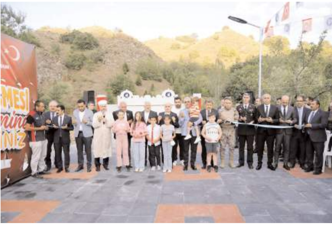
Yapılan duanın ardından açılış kurdelesini kesildi.