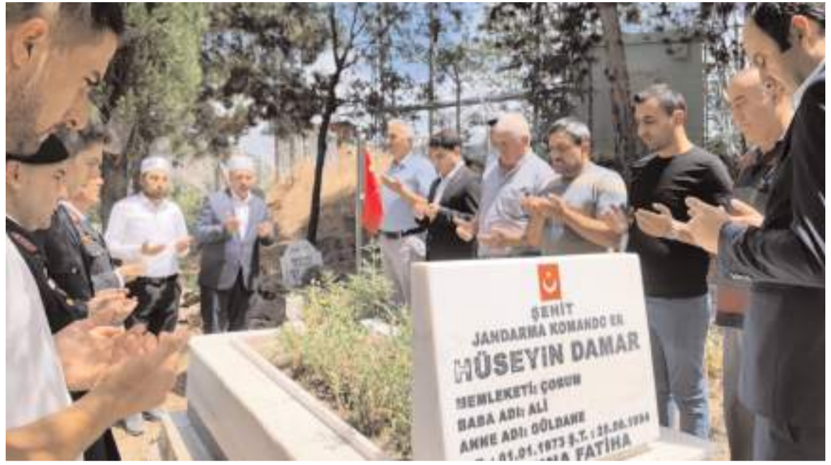
Etkinlikler kapsamında şehitlerin kabirleri ziyaret edilerek dua edildi.

Öğrencilerin şiirler seslendirdiği etkinlik, sela okunmasının ardından sona erdi.(AA)