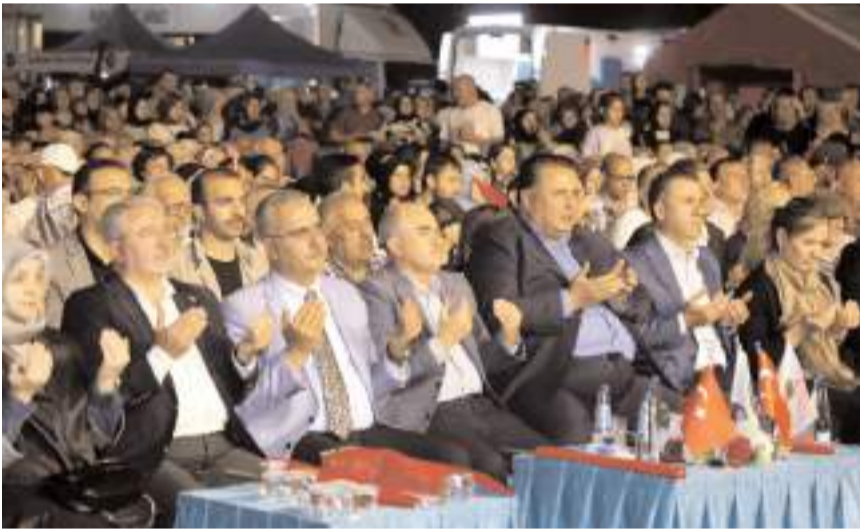
Programda şehitler için dua edildi.