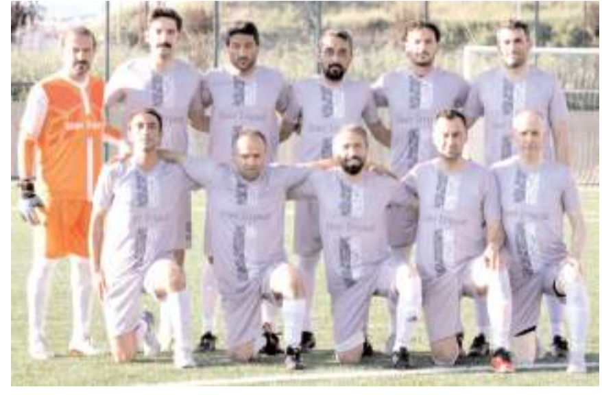
Eker İnşaat yarı finalde kazanarak finale yükselen takım olmayı hedefliyor