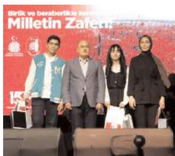
"Milletin Zaferi" konulu kompozisyon, şiir, resim ve koşu yarışmalarında dereceye giren öğrencilere ödülleri verildi.