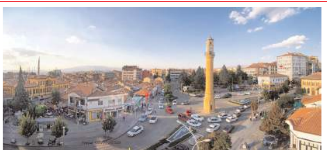
Yayınlanan rapora göre Çorum, 81 il içinde 53.sırada yer aldı.