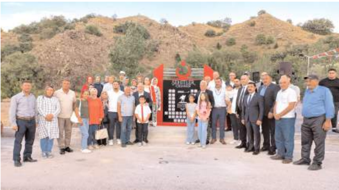
Açılışın ardından toplu hatıra fotoğrafı çekildi.

Toplam 500 metrekarelik alana inşa edilen Şehitler Çeşmesi ve Anıtı'nın içerisinde kameriye ve piknik masaları bulunuyor.