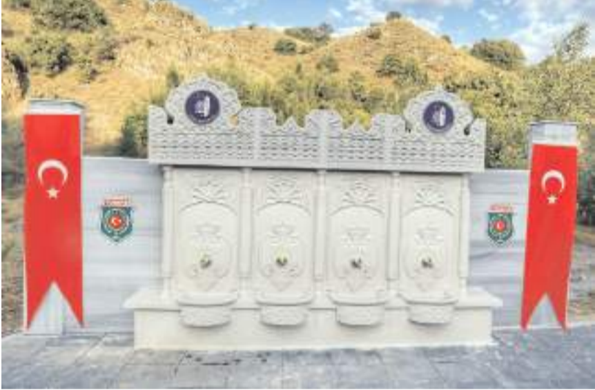
Çeşme ve park Çorum-Ankara Karayolu 30. kilometrede açıldı.