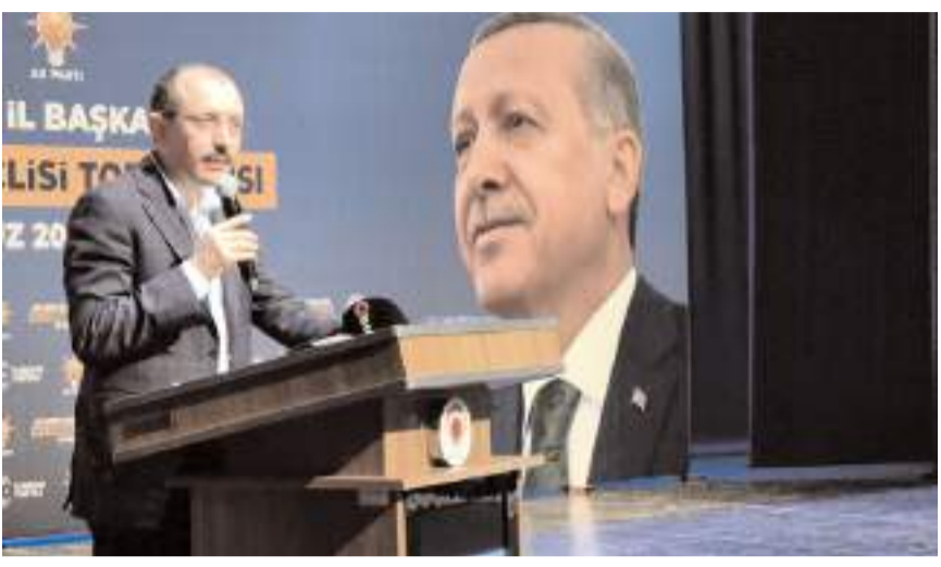
AK Parti Samsun Milletvekili ve TBMM Plan ve Bütçe Komisyonu Başkanı Mehmet Muş

FATİH BATTAR Plan ve Bütçe Komisyonu Başkanı Mehmet Muş, Delice-Çorum hızlı tren ihalesinde pürüz çıktığını açıkladı.