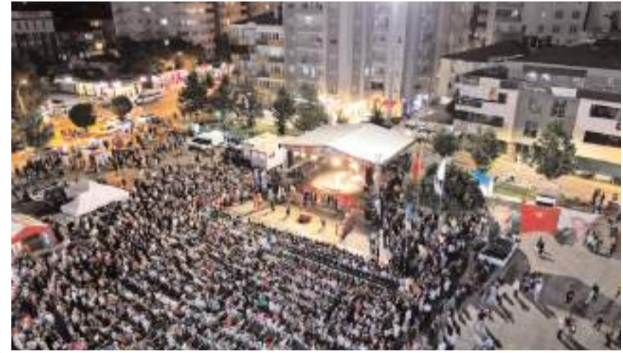
Kadeş Barış Meydanında yapılan etkinliğe ilgi yüksek oldu.

İYİ Parti İl Başkanı Erkan Yıldız ise; "FETÖ Terör Örgütü başta olmak üzere bu çüçüde vatanı bölmek isteyen tüm hainlere sesleniyorum; Bizler 7 düvele başkaldırmış Gazi Mustafa Kemal Atatürk'ün evlatlarıyız. Bizler söz konusu vatan ve bayrak oldu-