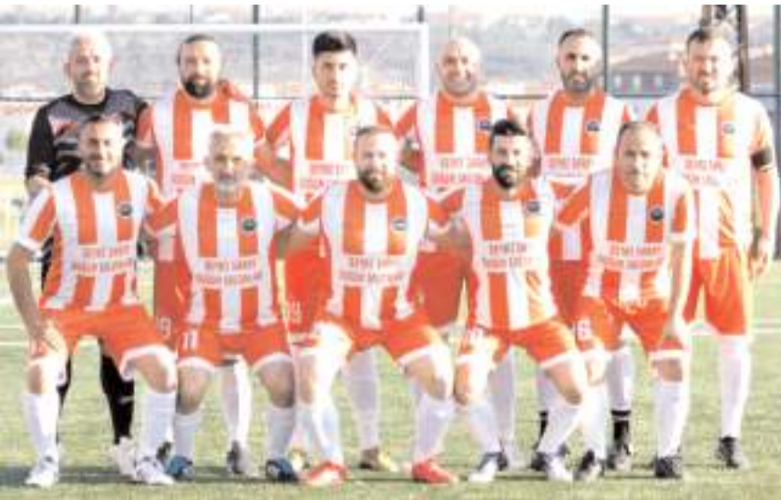
Beyaz Saray Düğün Salonları bugün kazanarak finalde mücadele etmek istiyor