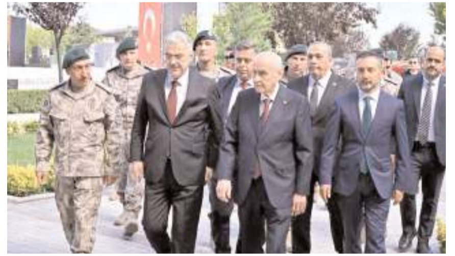
Ankara Gölbaşı'ndaki Özel Harekat Başkanlığına ziyaretinde MHP Genel Başkanı Devlet Bahçeli'ye MHP Çorum Milletvekili Vahit Kayırcı da eşlik etti.

MHP Genel Başkanı Devlet Bahçeli, MHP Çorum Milletvekili Vahit Kayırcı ile birlikte 15 Temmuz hain darbe girişiminde saldırıların hedefi olan Ankara Gölbaşı'ndaki Özel Harekat Başkanlığına ziyaret etti.