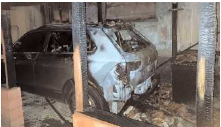
Olay, Yıldızhan Mahallesi Şahin Sokak'ta meydana geldi.