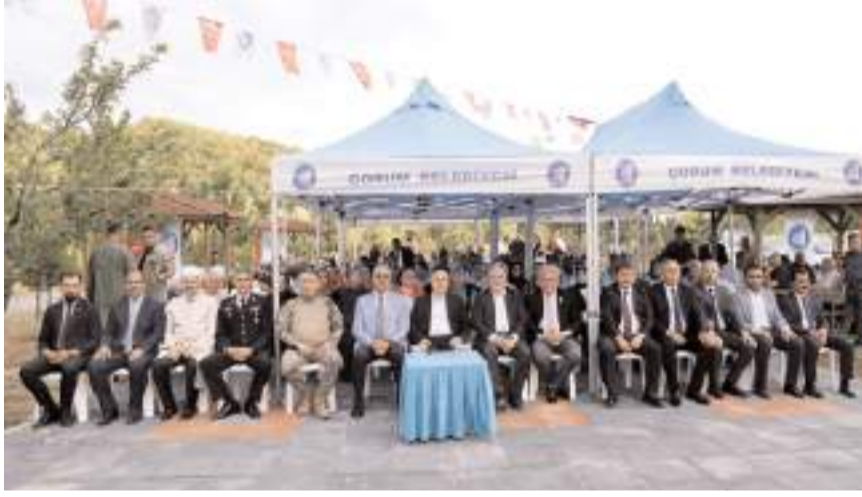
Koparan mevkiinde gerçekleştirilen törene protokol üyeleri de katıldı.