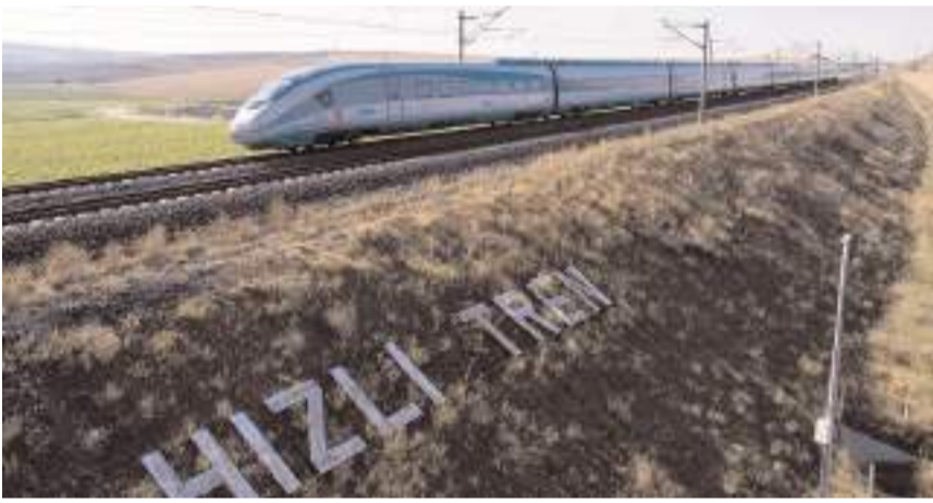
Delice-Çorum arası demiryolu ihalesinin bu yıl yapılması bekleniyor.