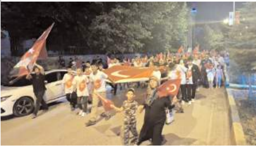
Etkinlikler kapsamında yürüyüş yapıldı.