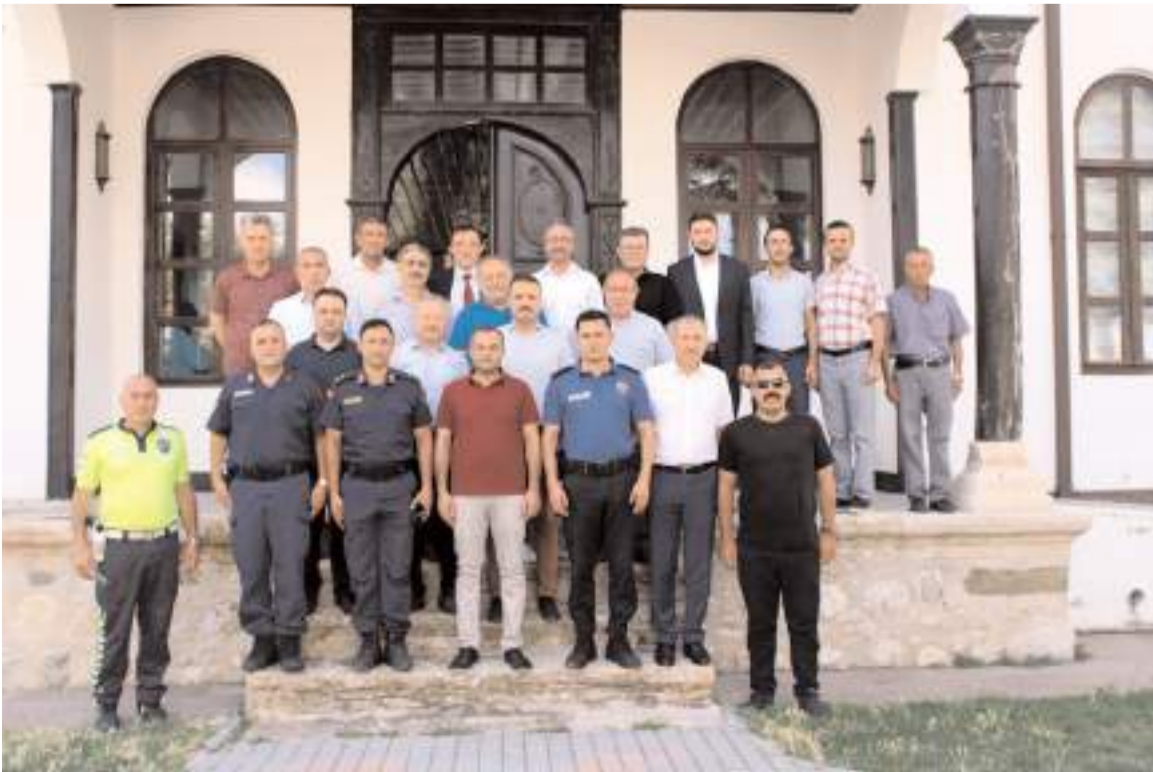
Günün anısına hatıra fotoğrafı çekinildi.