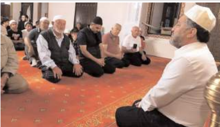
Program Ulu Camii'nde yapıldı.