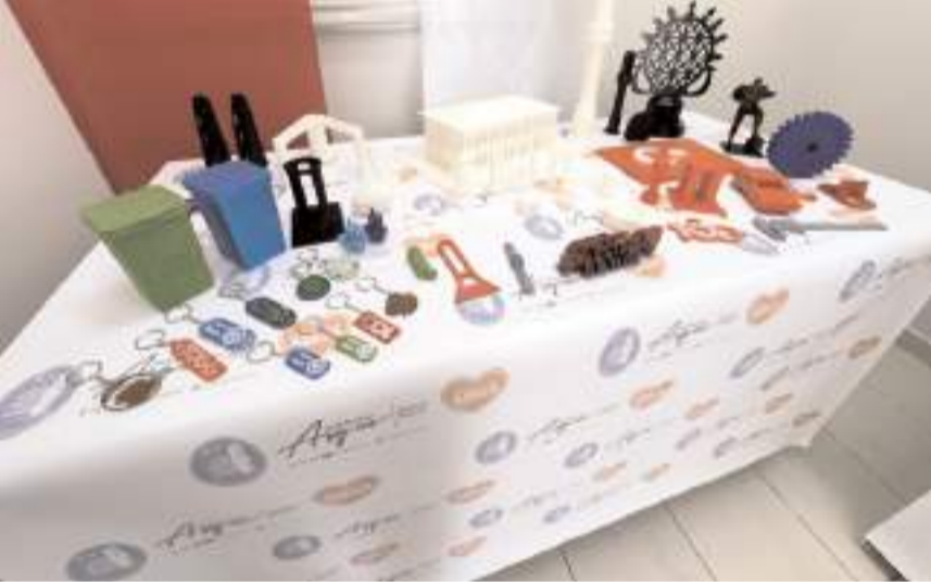
3D yazıcıda üretilen parçalar...