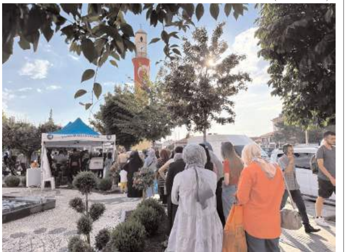
Aşure ikramı Saat Kulesi önünde yapıldı.

Çorum Belediyesi aşure geleceğini bu yıl da sürdürdü. Muharrem ayı nedeniyle şehrin farklı yerlerinde vatandaşlara aşure ikram edildi.