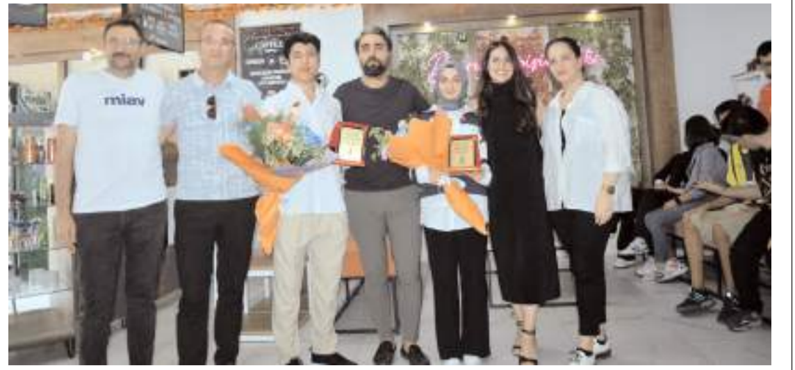
Değişim Eğitim Kurumları başarılı öğrencileri tebrik etti.