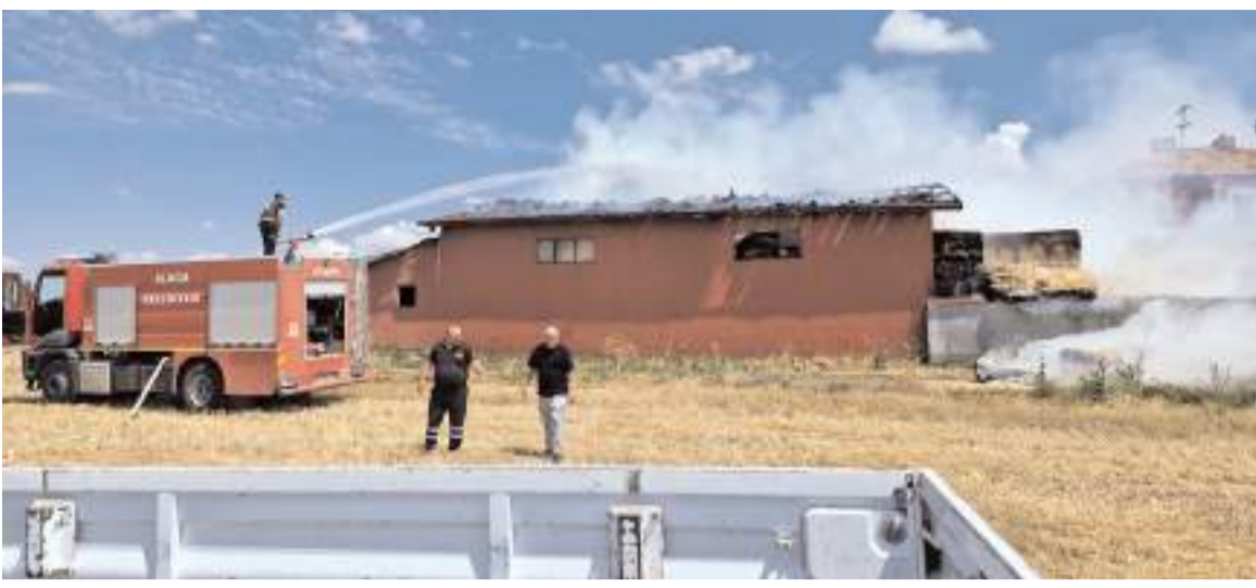
Olay, Zile Caddesi'nde meydana geldi.