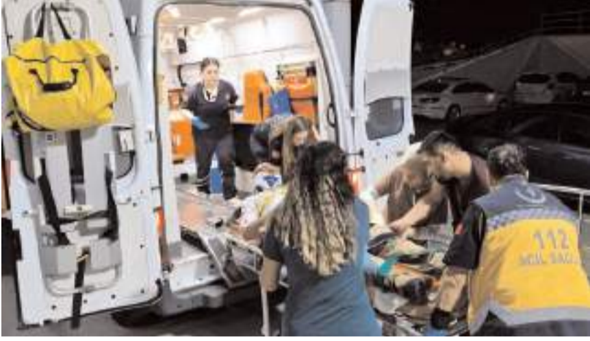
Yaralılar hastaneye kaldırıldı.