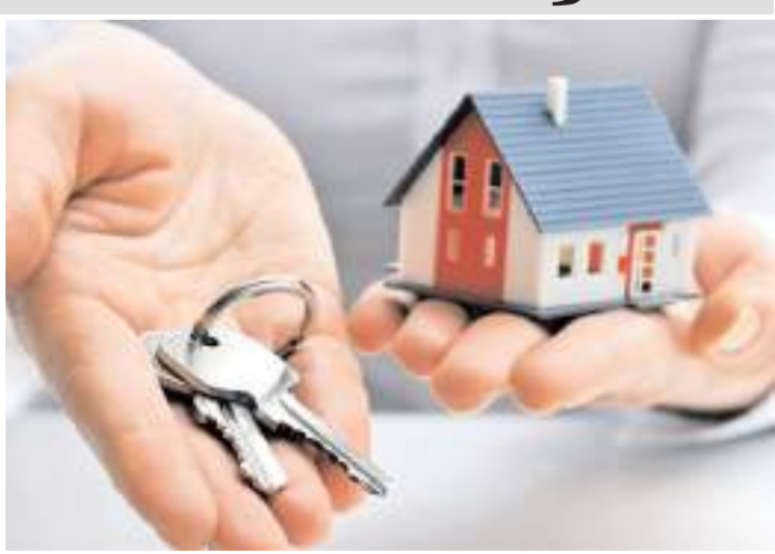
Çorum'da konut satışında haziranda bir önceki aya göre yüzde 6,23 azaldı.

Haziran'da Samsun'da 1449, Tokat'ta 507, Amasya'da ise 384 konut satıldı.