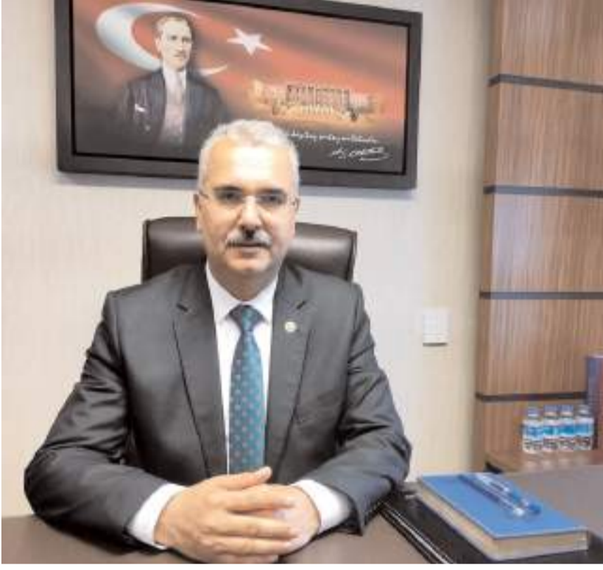
Milletvekili Av. Yusuf Ahlatcı

Allah'ın izni ile Sayın Cumhurbaşkanımızın liderliğinde, milletimize hizmet için güzel şehrimizde daha nice eserlere de hep birlikte imza atacağız."