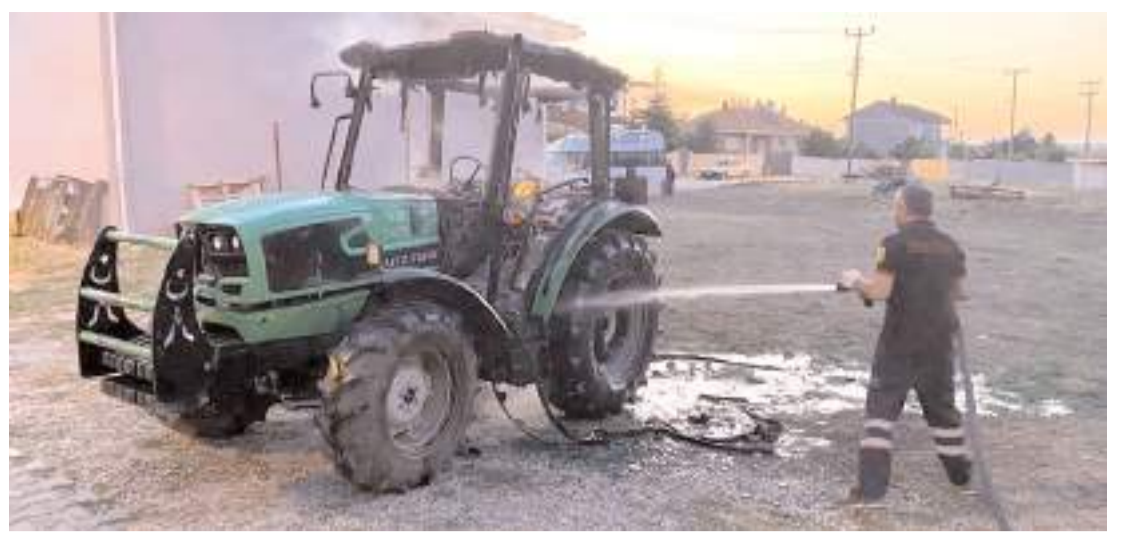
İtfaiye ekipleri yangını söndürdü.

Olayla ilgili başlatılan soruşturma sürüyor. (İHA)