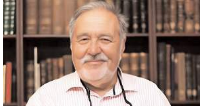
Prof. Dr. İlber Ortaylı

Ortaylı'nın Çorum'u da önerdiği yerler arasında Söke Havzası'nda Ephesus, Didim, Milet ve Prien, İyonya bölgelerinin üstünde Bergama, Göreme, Alacahöyük ve Antalya'nın doğusu Side, Aspendos ve Batısında Termessos ve Sagalossos yer aldı. (Haber Merkezi)