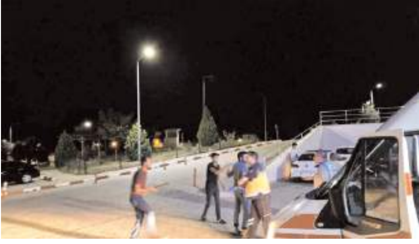
Olay, Günhan Mahallesi'nde meydana geldi.