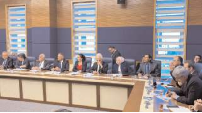
Milletvekili Mehmet Tahtasız, Sağlık, Aile, Çalışma ve Sosyal İşler Komisyonu'na katıldı.

Sungurlu ve Uğurludağ ilçelerimizin hemen hepsinde cerrah yok. İlçelerimizde ciddi anlamda ambulans sıkıntısı var. Üniversitesi Tıp Fakültesi binası, Erol Olçok Eğitim ve Araştırma Hastanesi'nin 10 kilometre uzağında. Tıp öğrencileri morfoloji liseden bozma binada eğitim görüyorlar. Yapılacağı açıklanan ancak bir türlü yapılamayan Güney Kampüsü'ne morfoloji binası olan bir Tıp Fakültesi yapılmalıdır. 7 yıl aradan sonra yapımına başlanan Çorum Devlet Hastanesi'nin bir an önce bitirilmesini bekliyoruz. Çorum Devlet Hastanesi hizmet vermediği için tüm yük Erol Olçok Eğitim ve Araştırma Hastanesi'ne biniyor. Erol Olçok Eğitim ve Araştırma Hastanemizde; endokrin, algoloji, göğüs cerrahisi, plastik cerrahisi yok. KBB, Nöroloji ve Göz bölümlerinde de ciddi sıkıntılar var. Hastanede 60 uzman hemşire eksikliği var. SMA hastalarıyla ilgili sıkıntılar var. SMA hastalarıyla ilgili Valilik yardım izni verdiyse, toplanan yardımların tamamlanması beklenmeden Bakanlığın bu çocukların tedavisine başlanması ile ilgili düzenlemeler yapılmalıdır. SMA Tıp 1 hastalarının kitleri bir an önce temin edilmelidir. Çorum'daki ilçe devlet hastanelerinin depreme dayanıklılığı noktasında güçlendirmeleri yapılmalıdır. Yavruturna Mahallesi Dış Hastanesi 8 Temmuz'da açılacak denildi ama henüz açılmadı. Eski Dış Hastanesi'nin olduğu yerin de Fizik Tedavi Merkezi olarak yeniden planlanmasını talep ediyoruz." (Haber Merkezi)