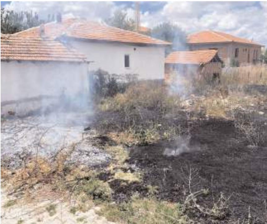
Olay Yıldızhan Mahallesi Gelin Sokak'ta meydana geldi.

Alaca'da boş arsada çıkan yangın evlere sıçramadan söndürüldü.