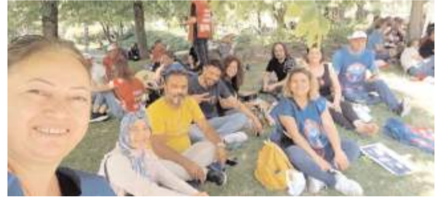
Eğitim İş, Milli Egemenlik Parkı'nda Öğretmenler Odası oluşturdu.