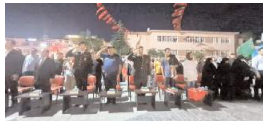
Program saygı duruşunda bulunulması ve İstiklal Marşının okunmasıyla başladı.