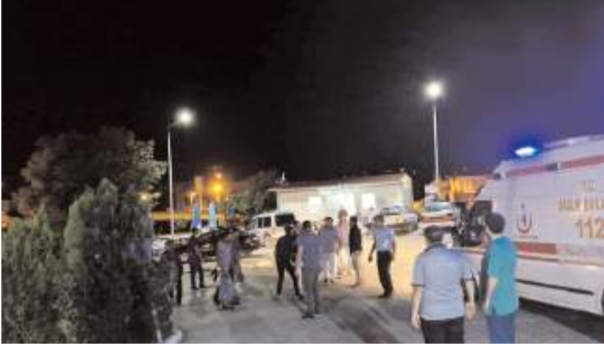
Hastane bahçesinde her iki tarafın yakınları arasında çıkan arbedeye polis müdahale etti.

Çorum'un Alaca ilçesinde iki aile arasında alacak-verecek meselesi yüzünden çıkan kavgada 5 kişi yaralandı.