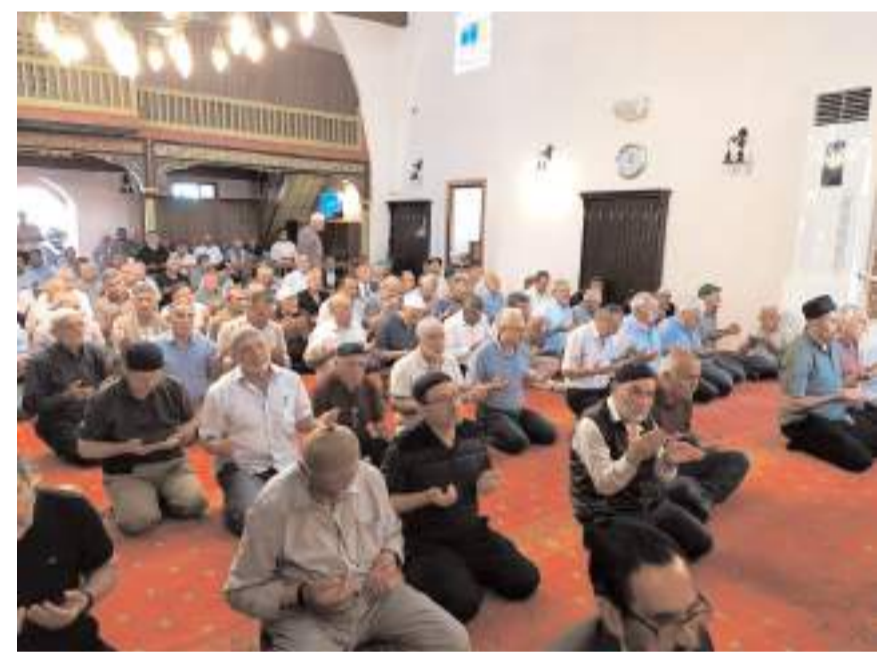
Etkinlikler ilçedeki camilerde şehitler için okunan hatimler ve Mevlid-i Şerif ile başladı.