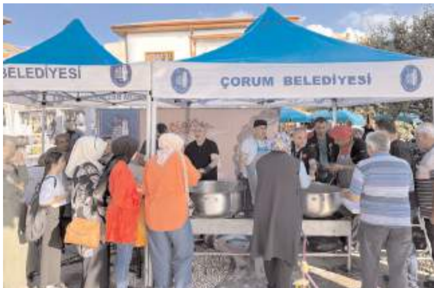
Aşure ikramına vatandaşların ilgisi yüksek oldu.