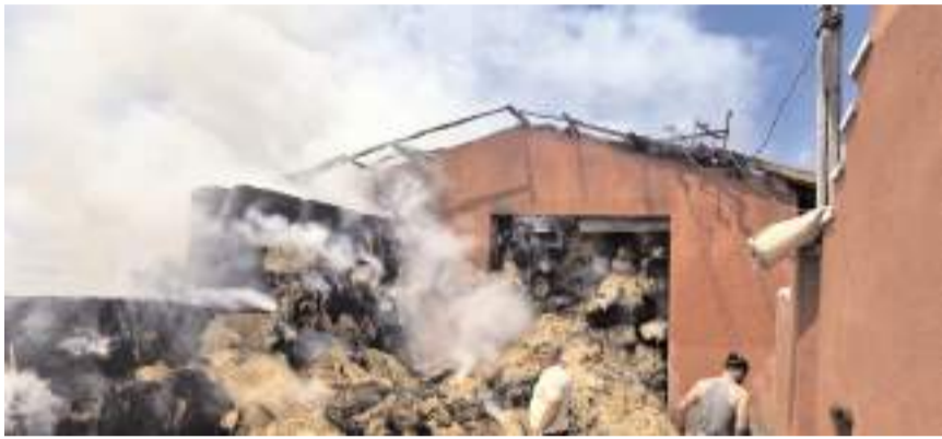
Yangında çok sayıda saman balyası yandı.