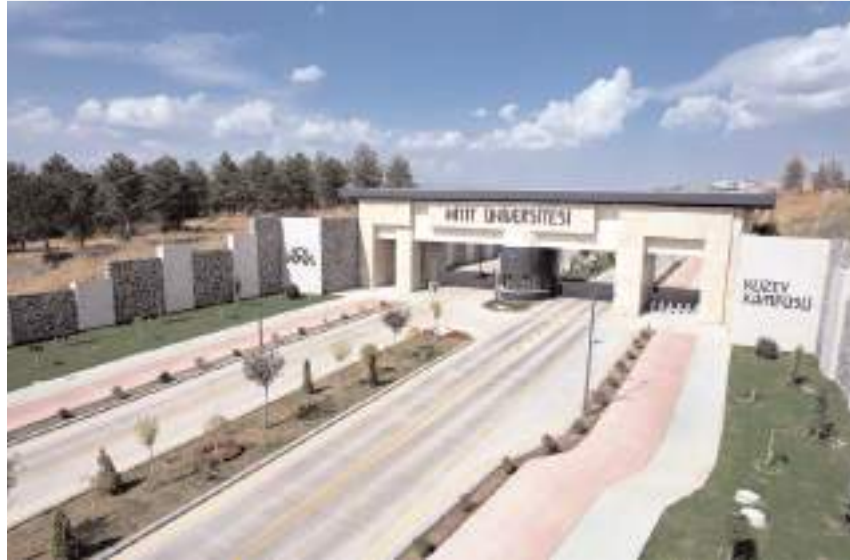
Bu 3 yeni program 2024-2025 eğitim-öğretim döneminde öğrenci alınacak.

■ Hitit Üniversitesi tarafından Yükseköğretim Kuruluna (YÖK) yapılan başvuru sonucunda 3 programa 2024-2025 eğitim-öğretim döneminde öğrenci alınacak. * HABERİ'5'TE