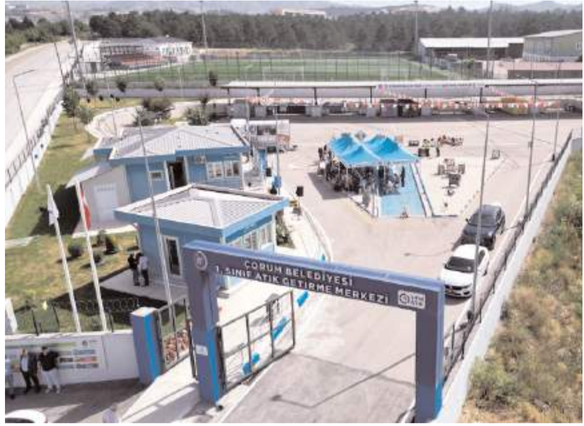
Filament üretimi Atık Getirme Merkezinde faaliyet gösteriyor.

Filament üretimi yaparken atık malzemeleri kullanmaya dikkat ettiklerini anlatan Aşgın, "Pet şişeler, pet şişe kapaklarını belli işlemlerden geçirerek 3 boyutlu yazıcılarda kullanılacak boyutlara dönüştürüyoruz. Özellikle filament pila olarak bu ham madde kısmını tamamlamış oluyoruz. Bu filamentin yüzde 60'ını atıklardan oluşturuyoruz. Bu çok önemli bir rakam. Bunu yapmazsak bu atıklar doğaya atılacak ve çevreye zarar verecek. Plastik atıkların geri dönüşümünü sağlayarak hem doğanın ve çevrenin kirlenmesini önlemiş oluyoruz hem de ekonomiyeye katkı sağlıyoruz. Filamentlerin yüzde 40'ı ise atık malzemenin oluşuyor. AR-GE çalışmalarımız devam ediyor. Yüzde 60 atık oranını daha üst seviyeye çıkarmayı planlıyoruz. Mümkün olduğunda maksimum atık, minimum granül kullanarak filament üreteceğiz. Doğada gördüğümüz plastiklere atık diye bakarsanız atık. Ancak atık olarak görmezseniz tekrar ekonomiyeye kazandırabileceğimizi son derece önemli. Bildiğim kadarıyla Türkiye'de filament malzemesini kendisi tesisinde üreten başta yedek parça üretimi olmak üzere hediye eşya üretimi yapan sanayilerimiz tek belediyemiz. Emegi geçen tüm arkadaşlara teşekkür ediyorum" diye konuştu.