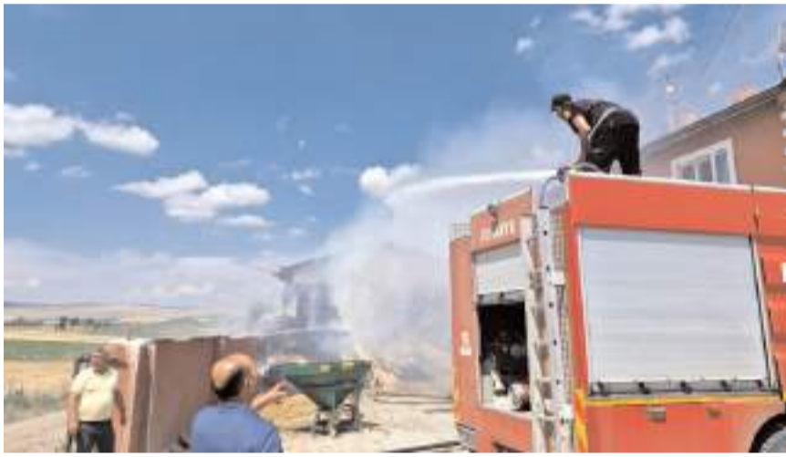
Yangın itfaiye ekipleri tarafından söndürüldü.