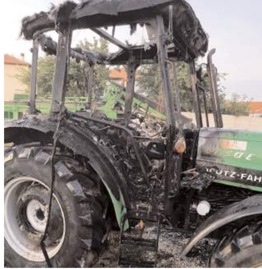
Olay Günhan Mahallesi Erdek Sokak'ta meydana geldi.

Çorum'un Alaca ilçesinde park halindeyken alev alan traktör yandı.