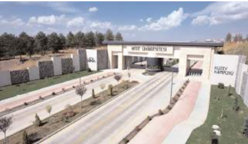
Bu 3 yeni program 2024-2025 eğitim-öğretim döneminde öğrenci alınacak.

Yeni öğrencilerini Teknik Bilimler Meslek Yüksekokulunda yetiştirecek Kuyumculuk ve Takı Tasarımı Programı ile 3 boyutlu katı model-