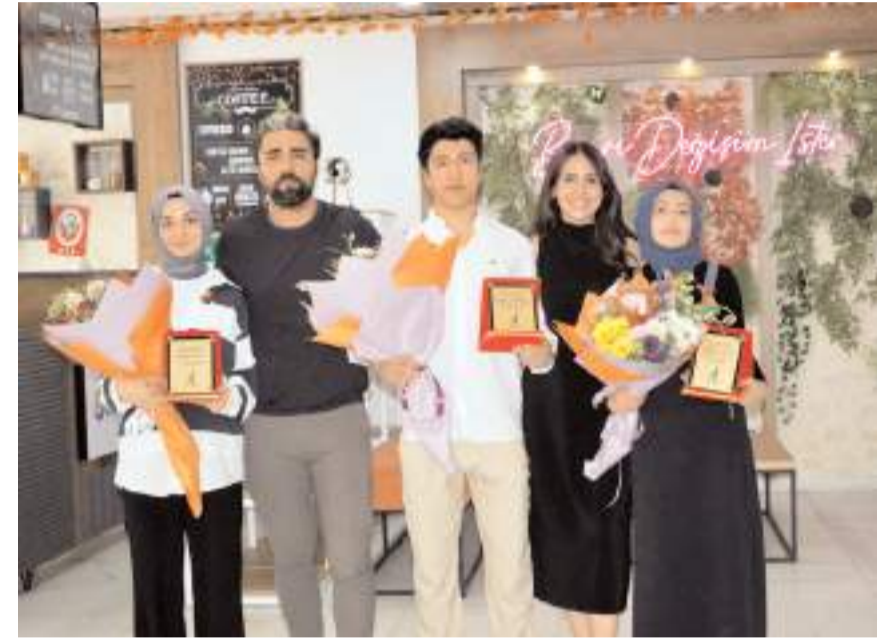
Yükseköğretim Kurumları Sınavında derece elde eden öğrencilere plaket verildi.