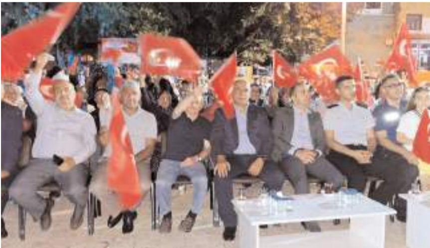
İskilip'te 15 Temmuz Demokrasi ve Milli Birlik Günü nedeniyle çeşitli etkinlikler düzenlendi.