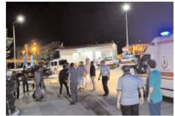
Hastane bahçesinde her iki tarafın yakınları arasında çıkan arbedeye polis müdahale etti.