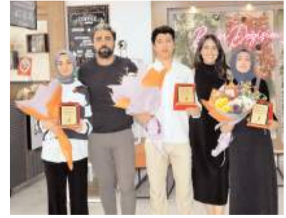
Yükseköğretim Kurumları Sınavında derece elde eden öğrencilere plaket verildi.