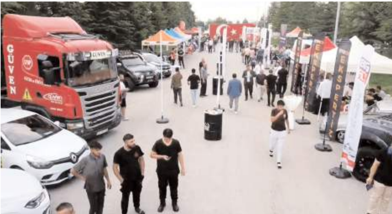
Çorum Sanayi Sitesinde açılan fuara çok sayıda firma katıldı.