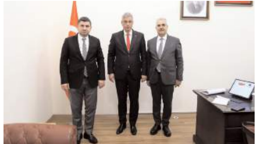
AK Parti Çorum Milletvekili Yusuf Ahlatcı, Sağlık Bakanı Prof. Dr. Kemal Memişoğlu'nu ziyaret etti.

Sağlık alanında şehrin ihtiyaçlarının karşılanması, sağlık hizmetlerinden vatandaşların daha kaliteli şekilde yararlanması amacıyla çeşitli projelerin hayata geçirileceğini ifade eden Ahlatcı, ilgi, alaka ve desteklerinden dolayı Sağlık Bakanı Prof. Dr. Kemal Memişoğlu'na teşekkür etti.