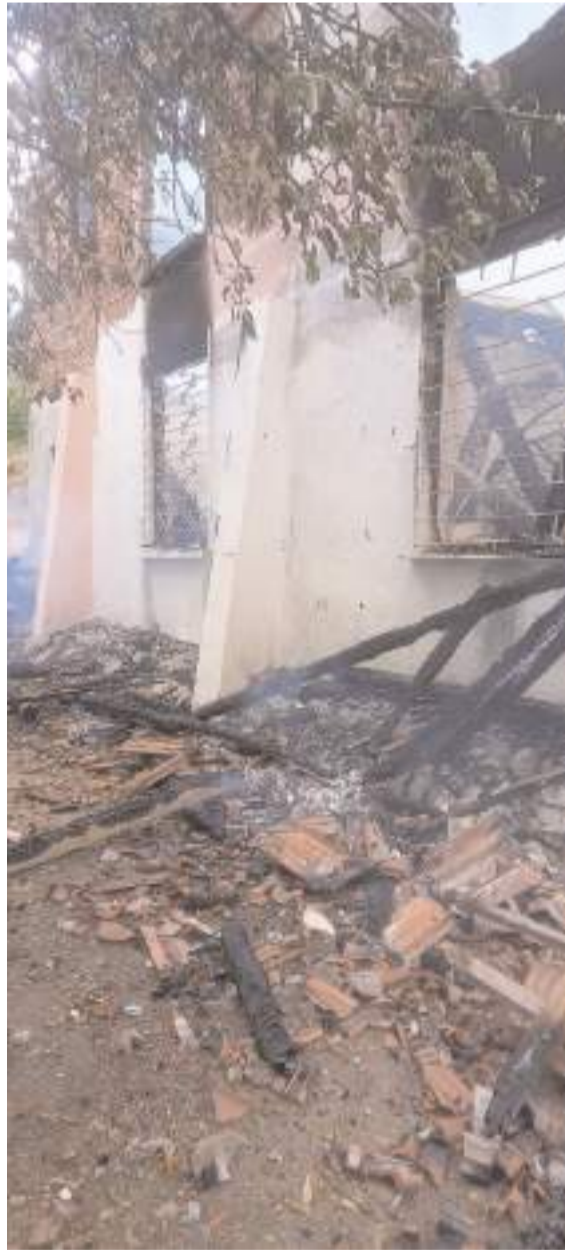
Olay Kalınpelit köyünde meydana geldi.