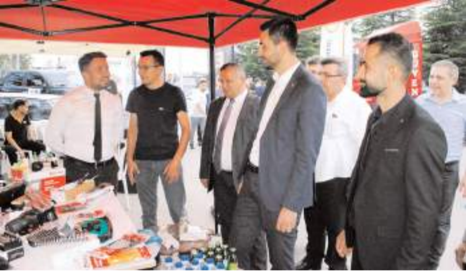
Davetliler fuarı gezerek bilgi aldılar.