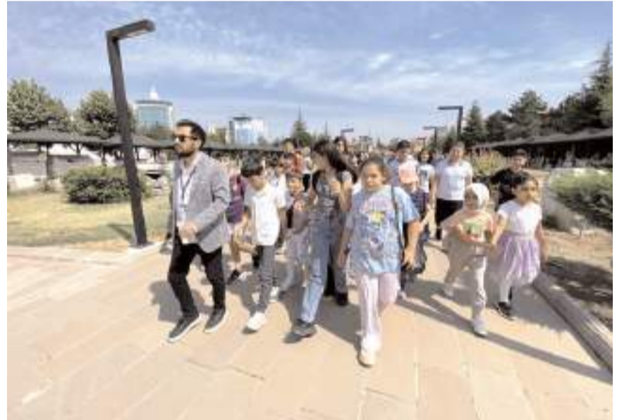
Proje kapsamında yaklaşık 2.500 öğrencinin gezilere katılması hedefleniyor.