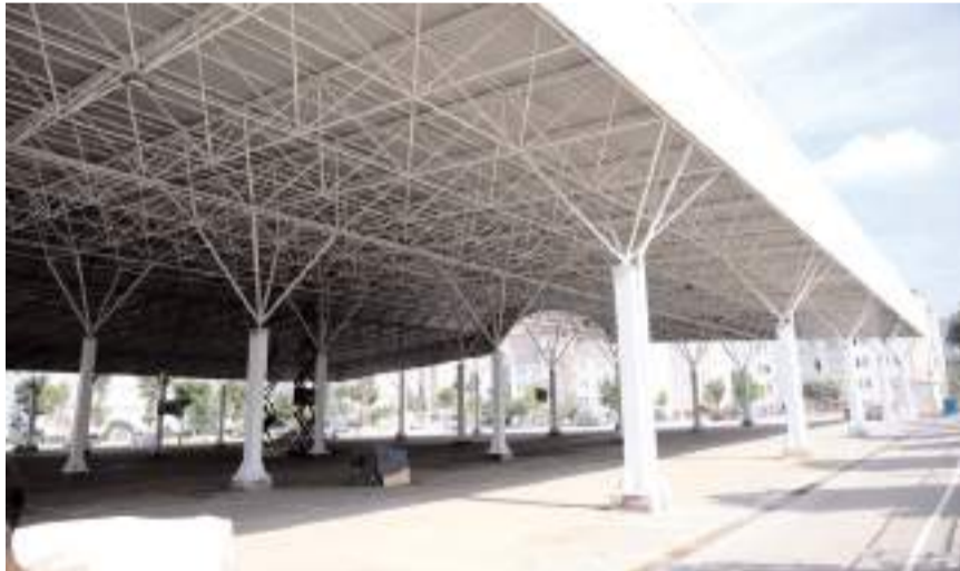
Belediye kapalı pazarlarda yenileme çalışması yapıyor.