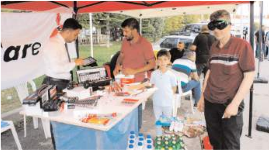
Fuarda tedarikçi firmalarla sanayi esnafı buluştu.