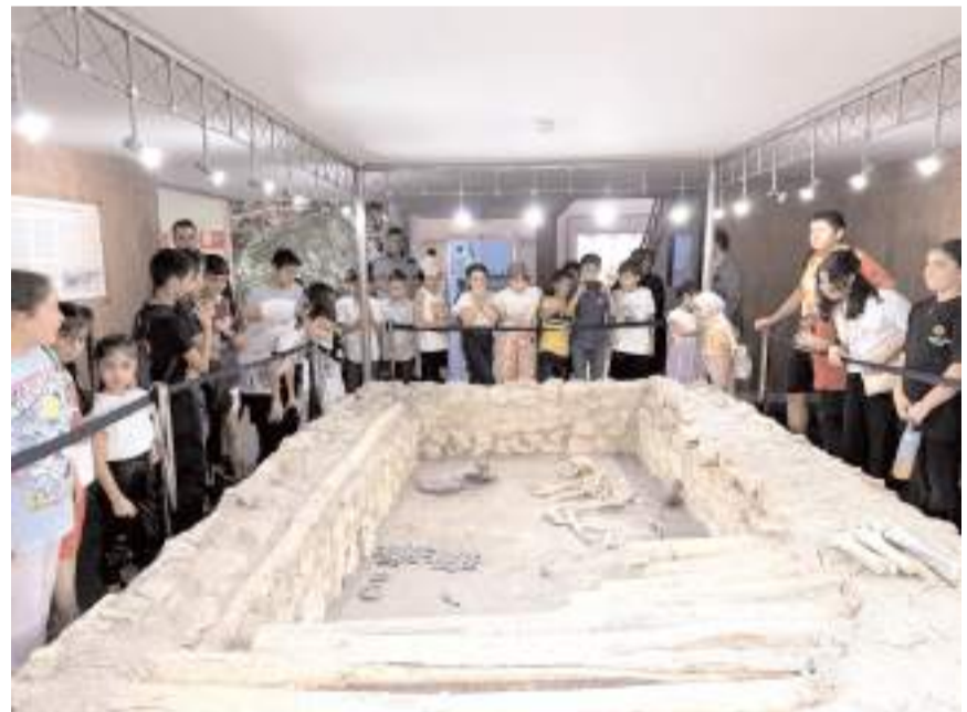
Gezilere Çorum Belediyesi'nin 8 farklı gençlik merkezinde yaz kurslarına devam eden öğrenciler katılıyor.