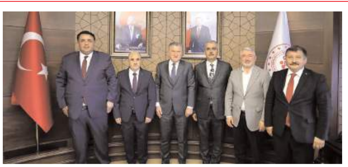
Çorum heyeti Gençlik ve Spor Bakanı Osman Aşkın Bak'ı ziyaret etti.