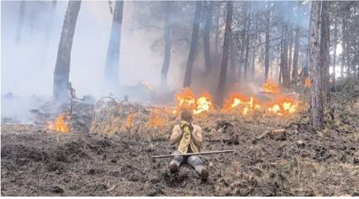
Yangın Tepeyolaltı köyü yakınlarındaki ormanlık alanda çıktı.