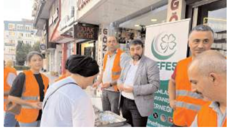
Aşure dağıtımına demek yönetimi de katıldı.

Avcı, geleneksel hale getirdikleri aşure ikramına katkı sağlayan, dağıtılmasında emeği geçen ve hayra vesile olan dernek üyelerine teşekkür ederek, "Bu ikramları vatandaşımıza