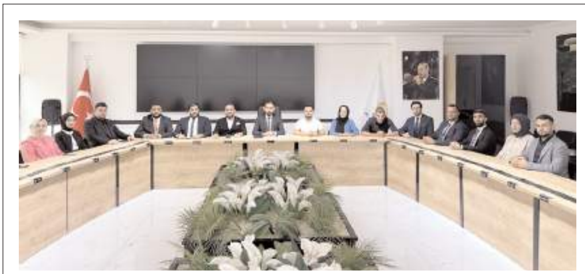
AK Parti Çorum İl Gençlik Kolları Yürütme Kurulu ilk toplantısını yaptı.

Olay yeri ekiplerince yapılan çalışma sonrası Sercan K.'nin cenazesi Cumhuriyet Savcısı talimatı ile otopsi için Hitit Üniversitesi Erol Olçok Eğitim ve Araştırma Hastanesi Morgu'na kaldırıldı.