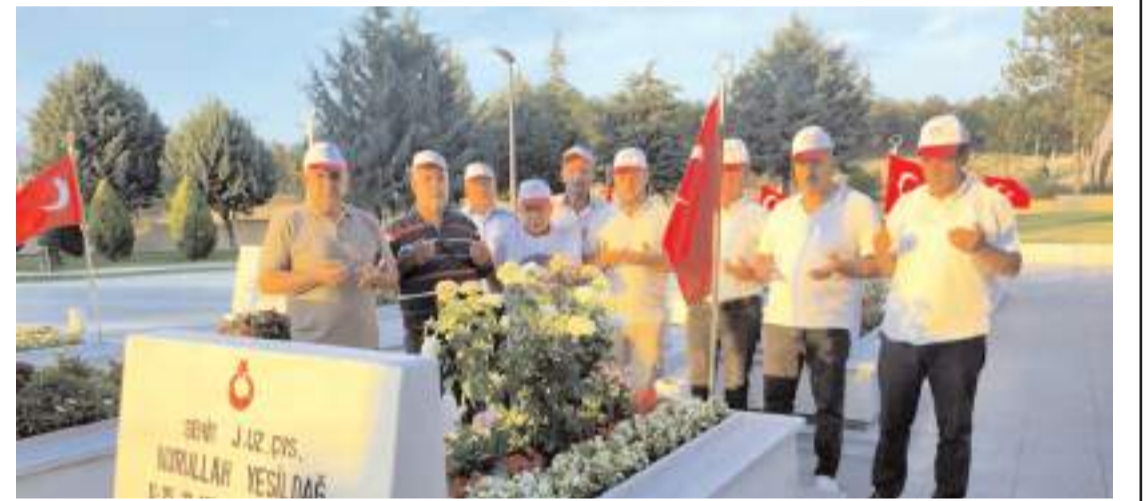
Hak-İş Çorum Şubesi yönetimi ve üyeleri şehitlerin kabirlerini ziyaret ederek dua etti.