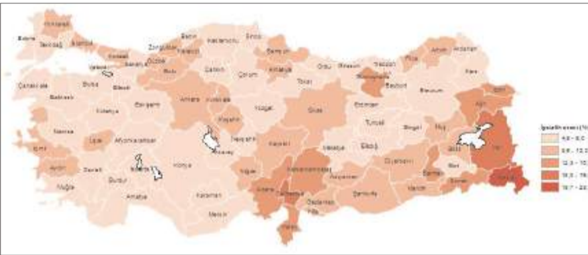
Çorum'da 2022 yılında %9,7 olan işsizlik oranı 2023'te %8,1'e düştü.