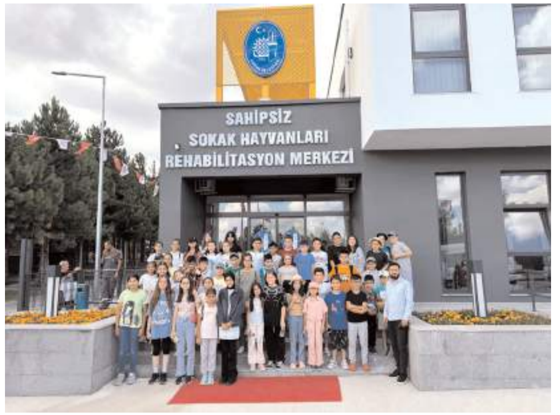
Geziye Çorum Belediyesi Gençlik Merkezleri düzenliyor.

Esnafın da desteğiyle çöp toplama konusunda olumlu sonuçlar aldıklarını belirten Başkan Aşgın, "Tüm pazar yerlerimizde çöp konteynerlerimizin sayısını artırdık. Şu anda konteyner konusunda eksikliğimiz yok. Bunun yanı sıra esnafımıza çöp poşeti dağıtılmaya da devam edilecektir. Çorum Belediyesi olarak temizlik konusu, bizim hassas olduğumuz konulardan birisidir. Destek olan pazarcılarımıza teşekkür ediyoruz. Semt pazarlarımız tüm hemşehrilerimizin yoğun olarak kullandığı, bizim için önemli yerlerdir. Halkımızın daha güvenli, temiz ve düzenli semt pazarlarında alışveriş yapmalarını sağlamak için sebze esnafımızla, Zabita Müdürlüğümüz ve Temizlik İşleri Müdürlüğümüzle birlikte güzel çalışmaları hayata geçireceğiz" dedi. (Haber Merkezi)