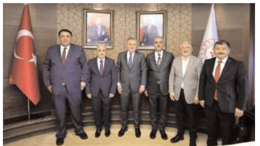
Çorum heyeti Gençlik ve Spor Bakanı Osman Aşkın Bak'ı ziyaret etti.

Ahlatcı ziyarette Memişoğlu'na Çorum'un 2025 yılı yatırım programları ile ilgili taleplerini aktardı.