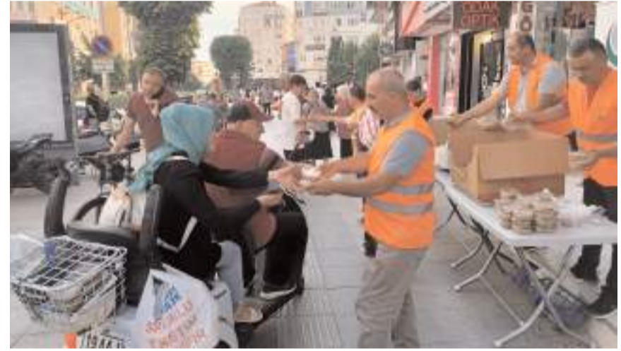
1750 kişilik aşure ikram edildi.

sunmaktan mutluluk duyduk. Muharrem ayımız mübarek olsun. Bu mübarek günlerin