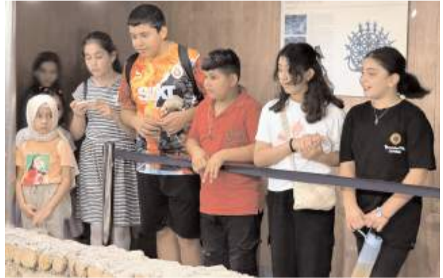
Gençler gezilerle Çorum'un tarihi ve turistik yerlerini görüyor.