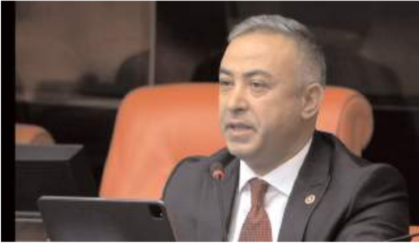
CHP Çorum Milletvekili Mehmet Tahtasız

edeceğimizi şaşırık. O nedenle, en yetkili ağızdan net bir açıklama bekliyoruz. Ulaştırma Bakanına soruyorum: Delice-Çorum Hızlı Tren Projesi'nin ihalesi ne zaman yapılacak? Çorumlular yıllardır hayalini kurduğu hızlı trene zaman binecek?" (Haber Merkezi)