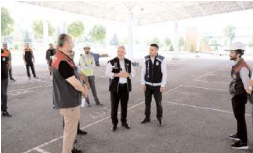
Başkan Aşgın, çalışmalar hakkında bilgi aldı.