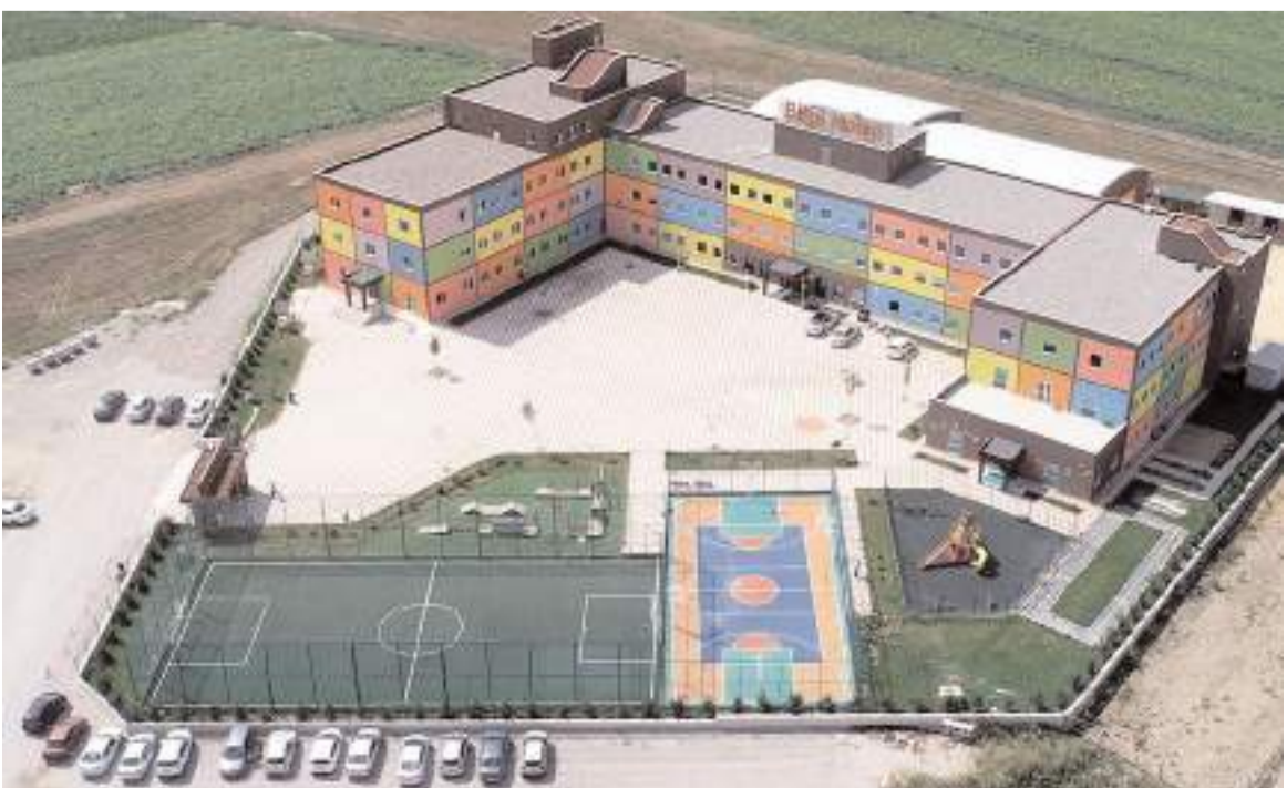
Bilgi Koleji modern alt yapısı ile dikkat çekiyor.