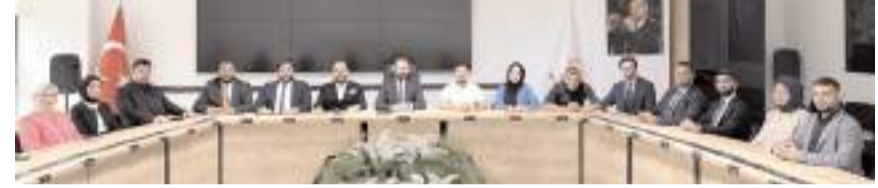
AK Parti Çorum İl Gençlik Kolları Yürütme Kurulu ilk toplantısını yaptı.