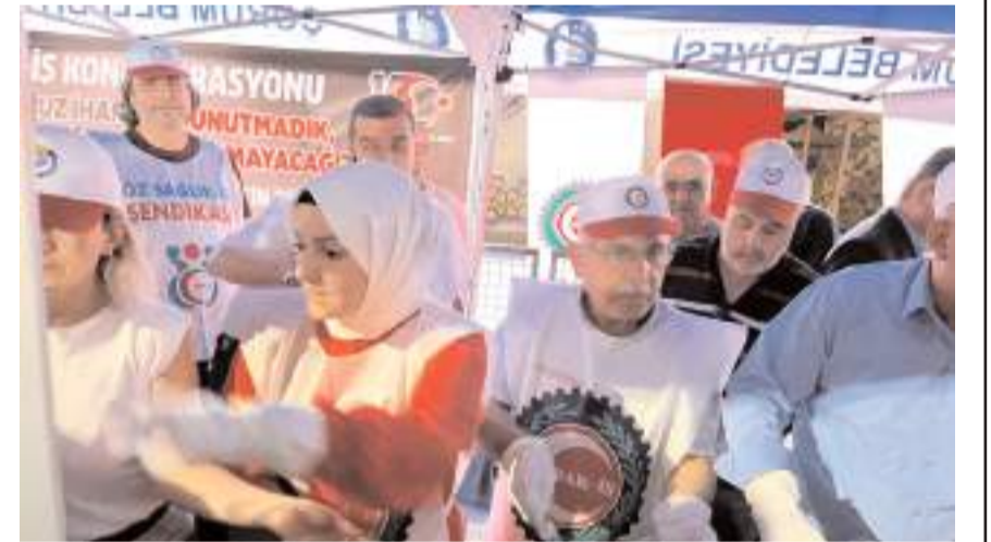
Kadeş Barış Meydanı'nda vatandaşlara helva ve su ikramında bulunuldu.

Köroğlu ve beraberindeki heyet daha sonra Kadeş Barış Meydanı'nda gerçekleştirilen anma programına katılarak vatandaşlara helva ve su ikramında bulundu.