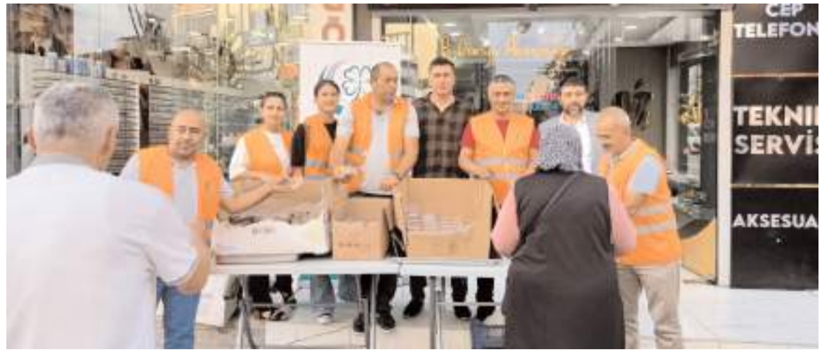
Dernek aşure dağıtımını Gazi Caddesi üzerinde yaptı.

Yangın nedeniyle ev kullanılamaz hale geldi.