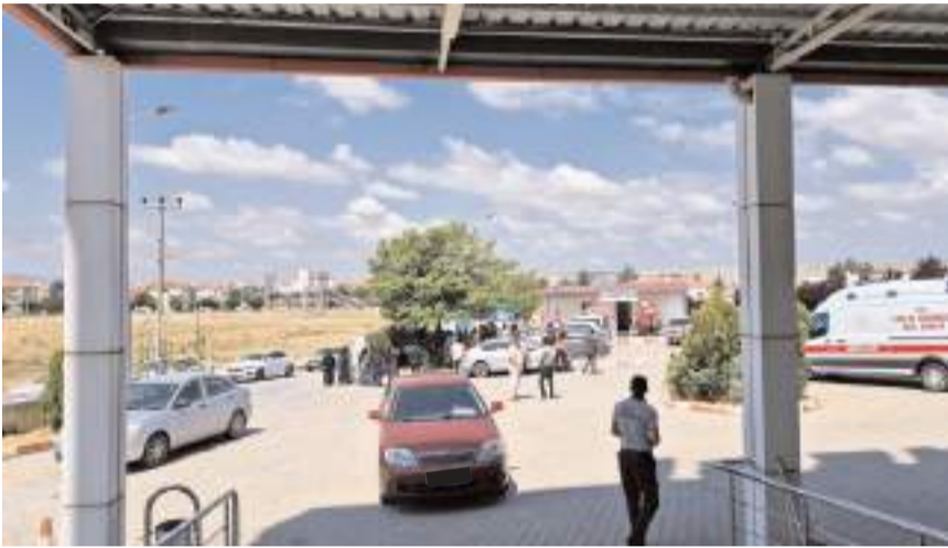
Alacak-verecek kavgasında iki aile yeniden kavga etti.

Çorum'un Alaca ilçesinde, önceki gün alacak-verecek meselesi yüzünden iki aile arasında çıkan ve 5 kişinin yaralanması ile sonuçlanan kavga tekrar alevlenince bu kez de 3 kişi yaralandı.