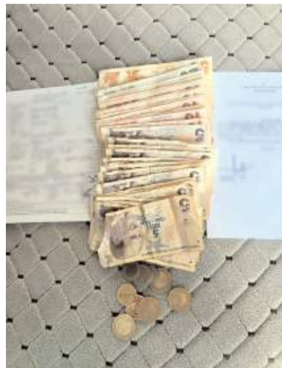
Dilencilerin paraları saklamak için bulduğu yöntemler herkesi şaşırttı.