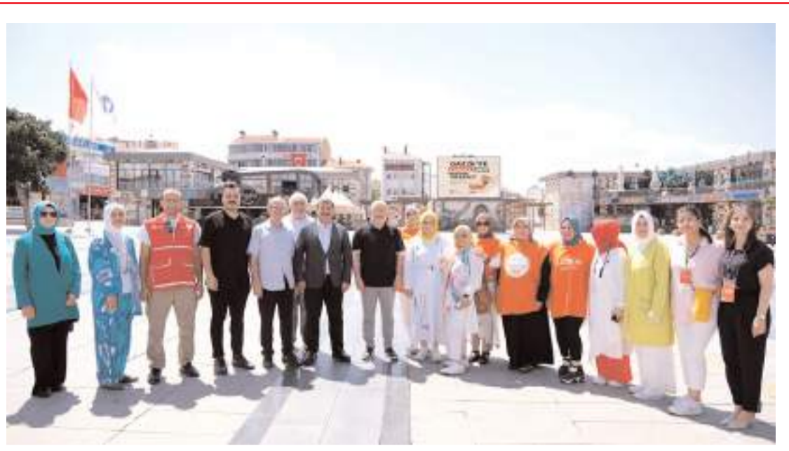
Hayır çarşısını KADEM, Kızılay ve Hitit Güneşi Kadın Girişimi Üretim ve Kalkınma Kooperatifi açtı.