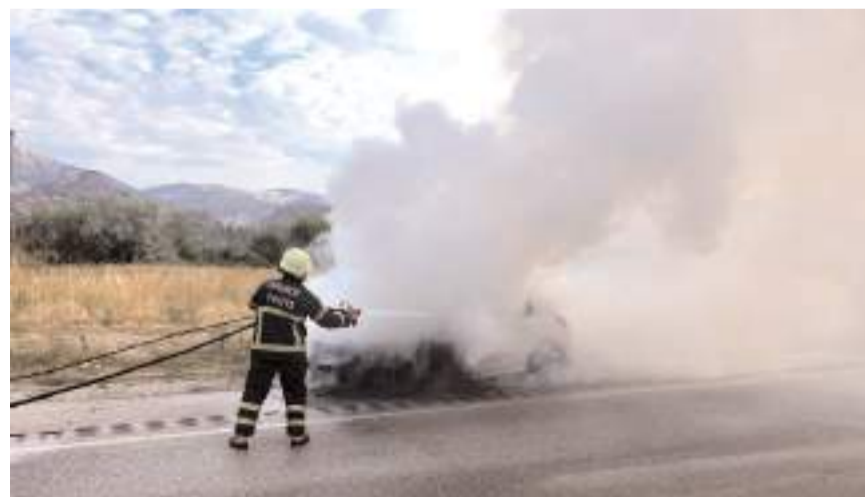
Seyir halindeki araç bir anda alev aldı.