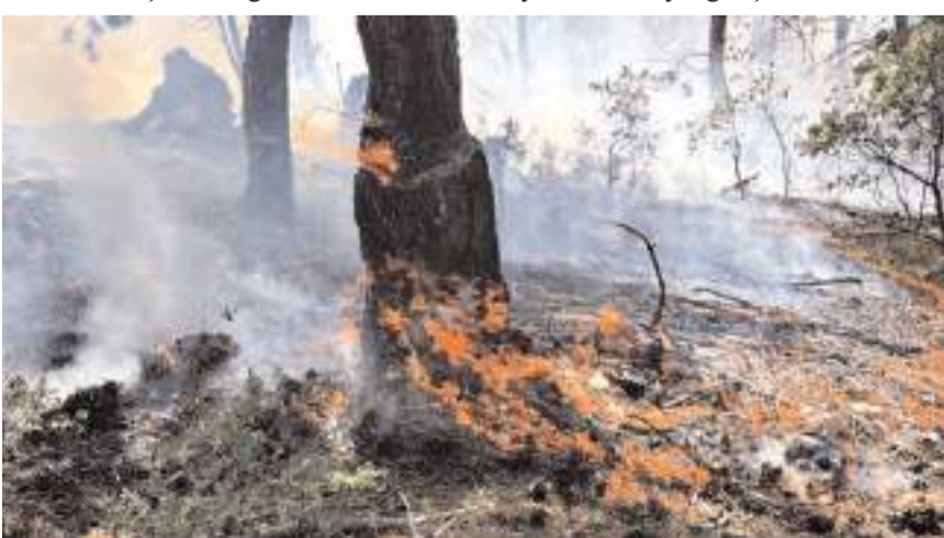
Yangının söndürülmesinin ardından itfaiye ekipleri bölgede soğutma çalışması yaptı.

Çorum'un Dodurga ilçesinde çıkan yangında 2 dekar orman arazisi zarar gördü.