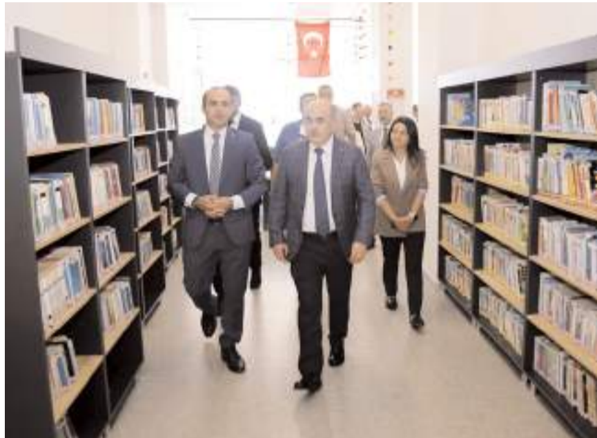
Vali Dağlı kütüphane hakkında bilgi aldı.