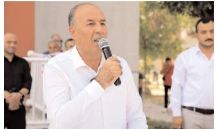
Alaca Belediye Başkanı Şerif Arslan