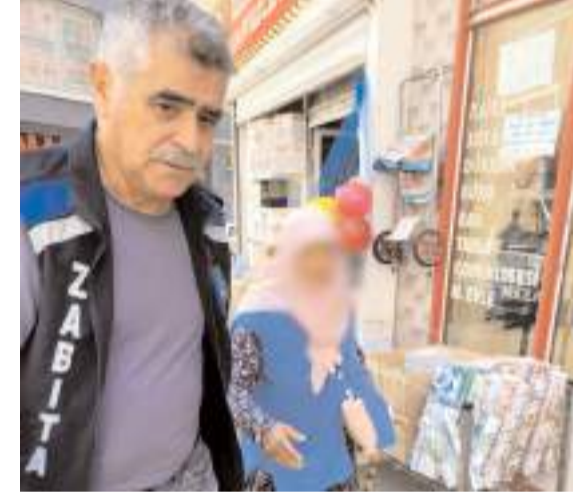
Dilencilik yapan yaşlı kadın hakkında tutanak tutuldu.