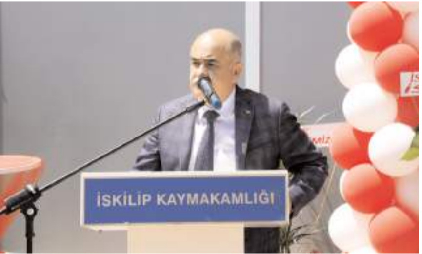
Merkezin açılışına Vali Zülkif Dağlı da katıldı.