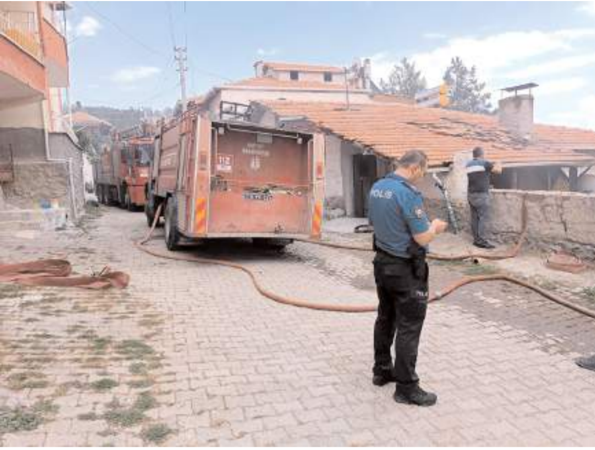
İtfaiye ekipleri yangına müdahale ederken...