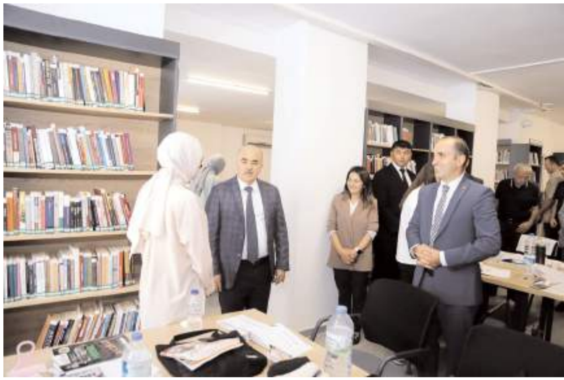
Vali Zülkif Dağlı, Halk Kütüphanesi'ni ziyaret etti

İncelemeler sırasında kursiyer bir kadın, merkezin açılışından duyduğu memnuniyeti dile getirerek Vali Dağlı'ya teşekkür etti. İskilip Kaymakamlığı Sosyal Yardımlaşma ve Dayanışma Vakfı bünyesinde hizmet veren merkezde 2 adet atölye, çocuklar için oyun odası, eğitim odası ve spor salonu bulunuyor. Merkez bünyesinde açılan dikiş nakış, el sanatları, spor, İslami ilimler kurslarında 106 kursiyer eğitim görüyor. (İHA)