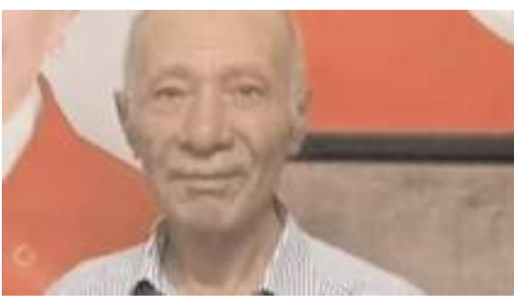
Yaşlı adam üzerine demir kapı düşmesi sonucu hayatını kaybetti.