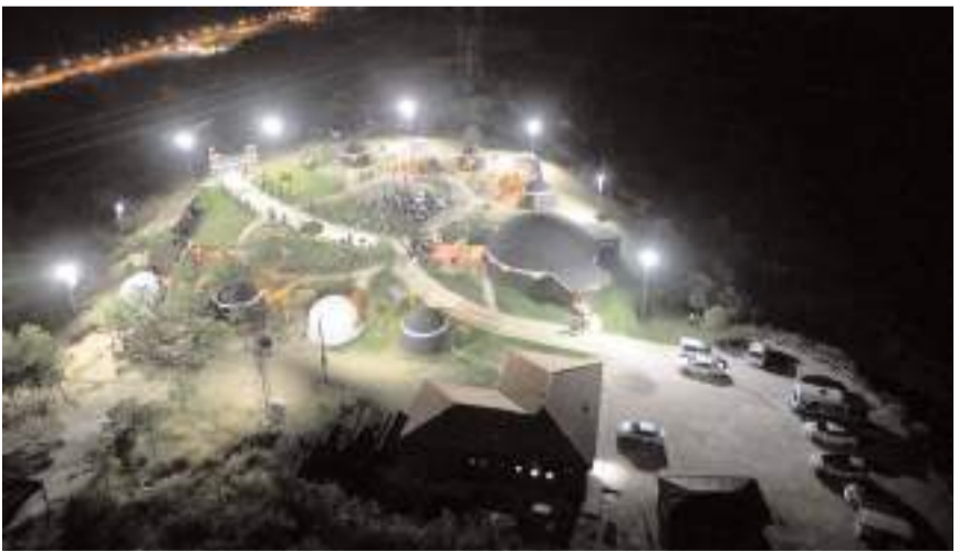
Etkinliklere ulaşımı sağlamak için 20 Temmuz Cumartesi günü saat 19.30'da Saat Kulesi önünden araç kaldırılacak.