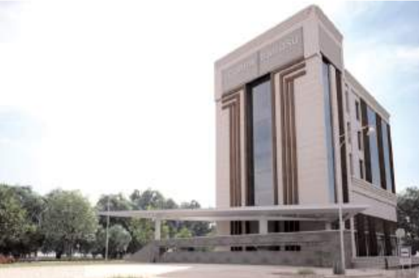
Yeni Baro Binasi projesinden bir fotoğraf...

Baro binasının inşaatına Ağustos ayında başlaması bekleniyor.