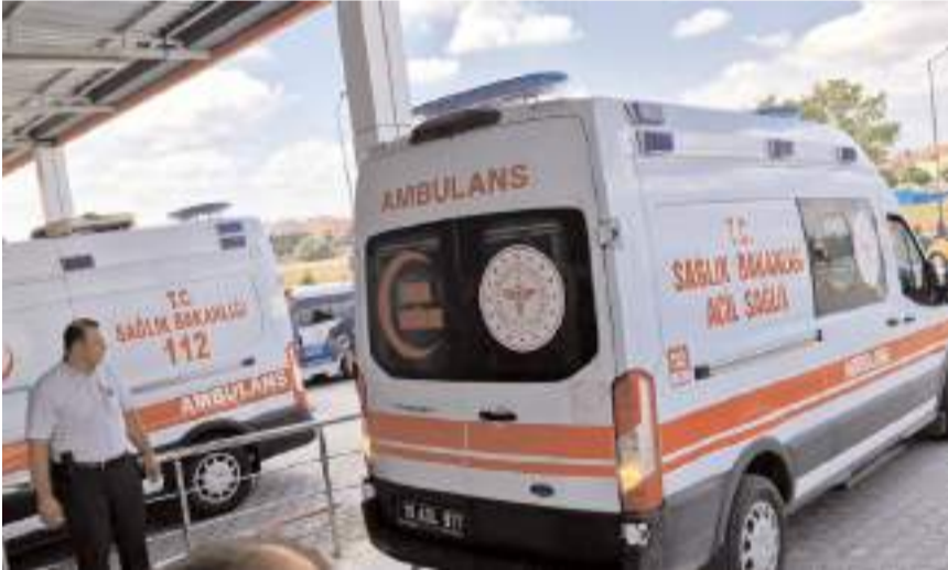
Yaralıları ambulansla hastaneye kaldırıldı.