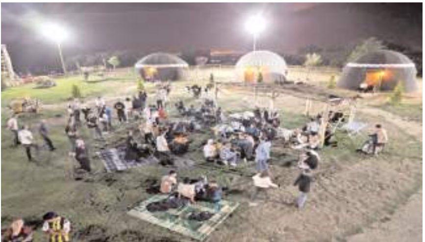
Sıklık Tabiat Parkı'ndan Çorumlu Obası'na gece yürüyüşü yapılacak.

Çorum Belediyesi, Sıklık Tabiat Parkı'ndan Çorumlu Obası'na gece yürüyüşü düzenliyor. Etkinlik, 20 Temmuz Cumartesi günü gerçekleşecek.