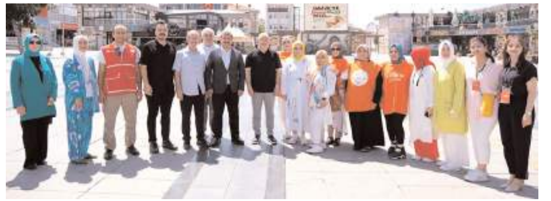
Hayır çarşısını KADEM, Kızılay ve Hitit Güneşi Kadın Girişimi Üretim ve Kalkınma Kooperatifi açtı.

Etkinlik kapsamında yürüyüş, Çorumlu Obası'nda ateş başı konseri, ikramlar, ahşap oyunları, ebru, taş baskı, teleskopla gözlem etkinlikleri ve çocuklara özel etkinlikler yapılacak. Etkinliklere ulaşımı sağlamak için 20 Temmuz Cumartesi günü saat 19.30'da Saat Kulesi önünden araç kaldırılacak. (Haber Merkezi)