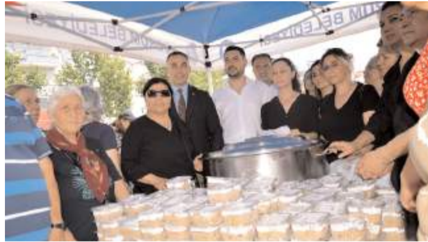
Konuşmanın ardından vatandaşlara aşure ikram edildi.

ve oruç: adalet, doğruluk ve mazlumların yanında olma bilincini diri tutar. Hz. Hüseyin'in yası ay-