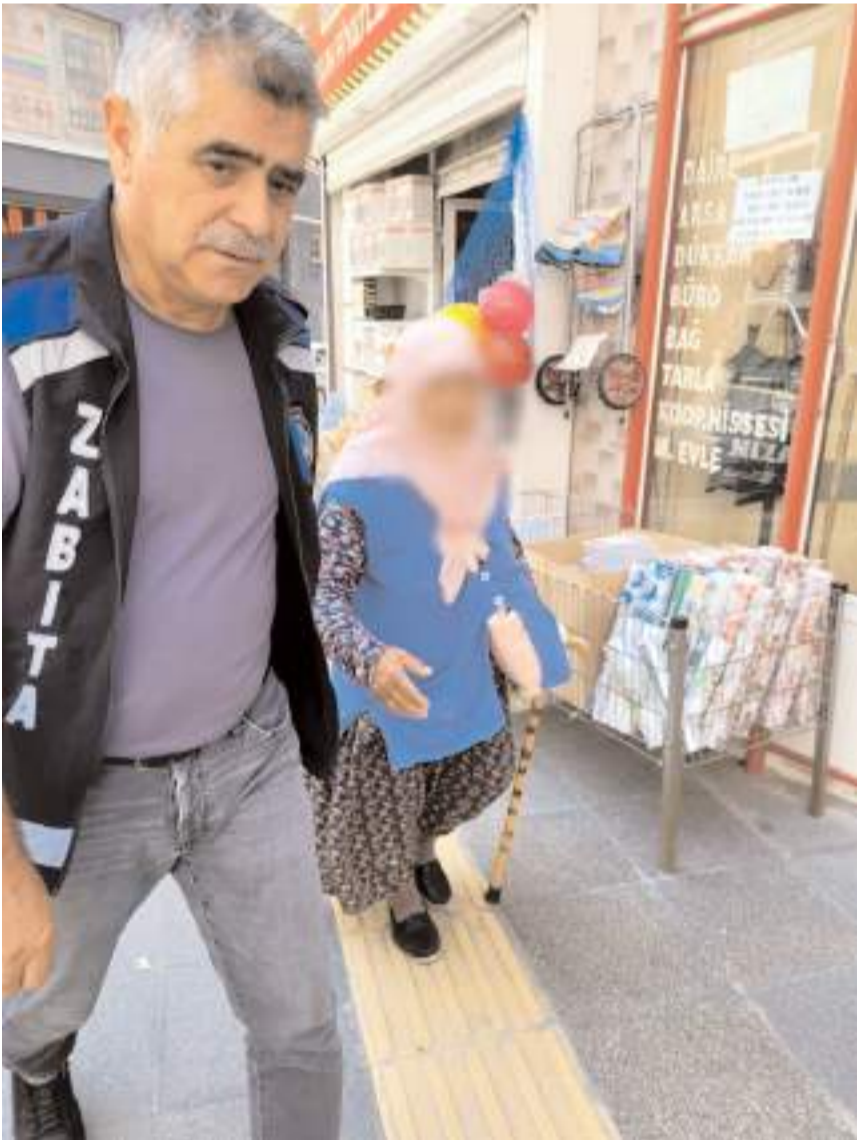
Dilencilik yapan yaşlı kadın hakkında tutanak tutuldu.