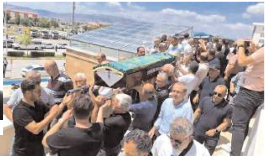
Cenaze törenine çok sayıda vatandaş katıldı.