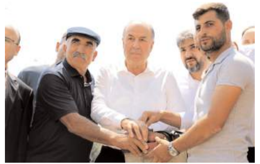
Temel atma butonuna basılırken....