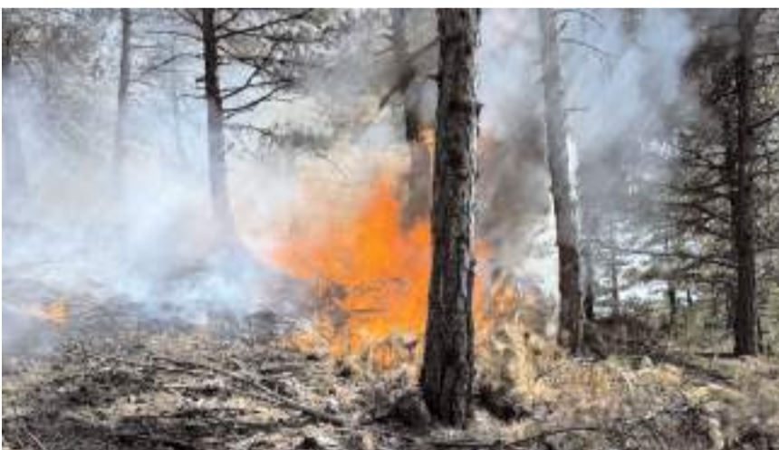
Çakırkırırgan mevkinde bilinmeyen nedenle yangın çıktı.