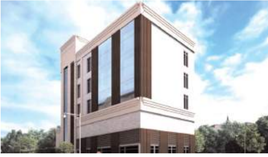
Yeni Baro Binası projesinden bir fotoğraf...

İskillipli Atıf Hoca Parkı'nın yanına yapılacak olan Çorum Barosu yeni hizmet binasının ihalesi önceki gün yapıldı.