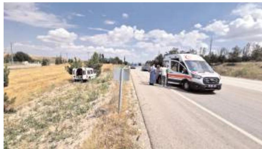
Yaralıları olay yerinde ilk müdahale yapıldı.