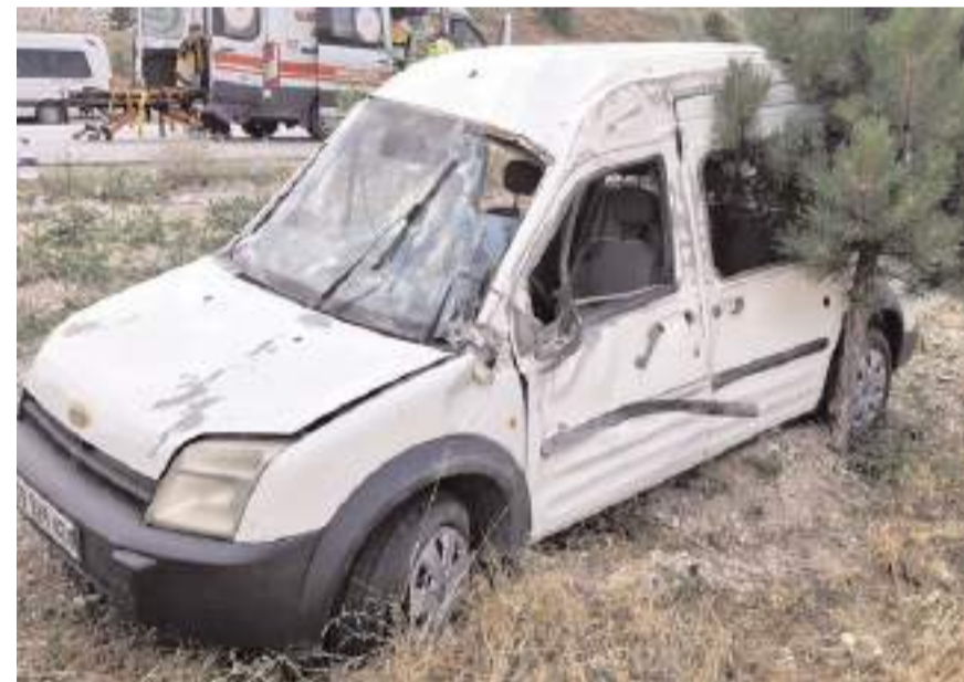
Kaza sonrası araç bu hale geldi.

Kazayla ilgili olarak başlatılan soruşturma sürüyor. (İHA)