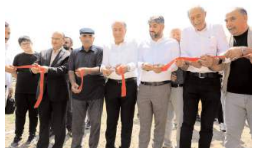
Cami inşaatı için kurdele kesildi.