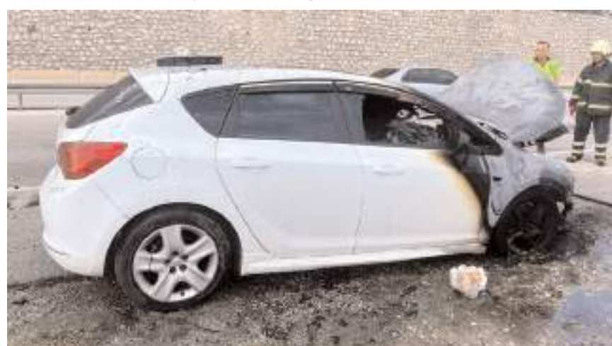
Alev alan otomobil itfaiye ekiplerince söndürüldü