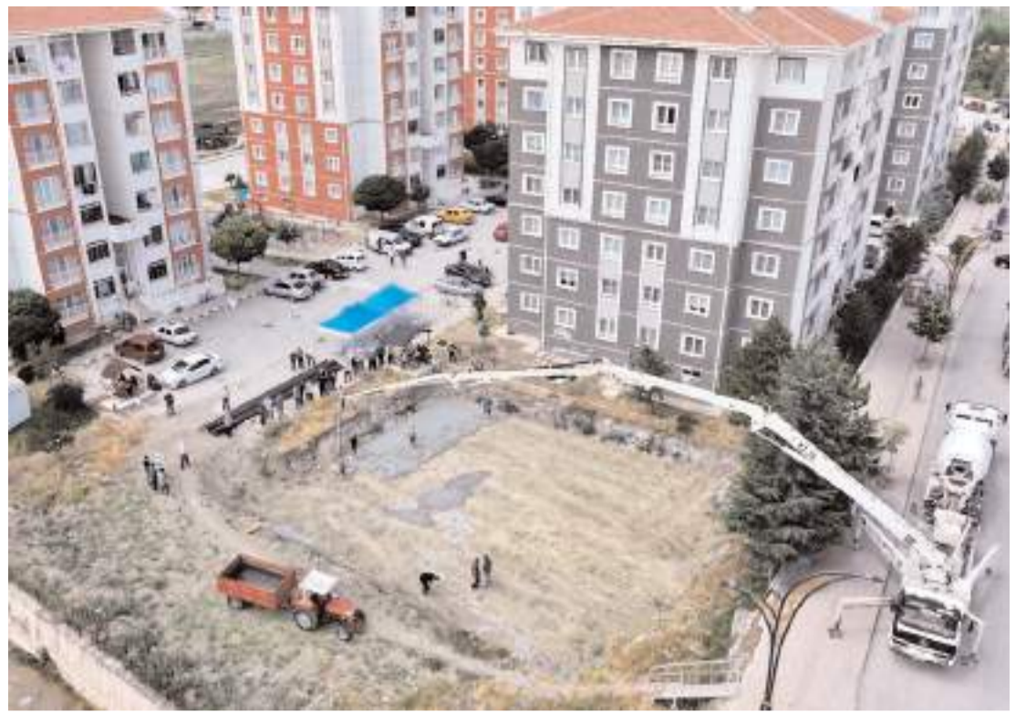
Alaca TOKİ Camii inşaatının temeli dualarla atıldı.