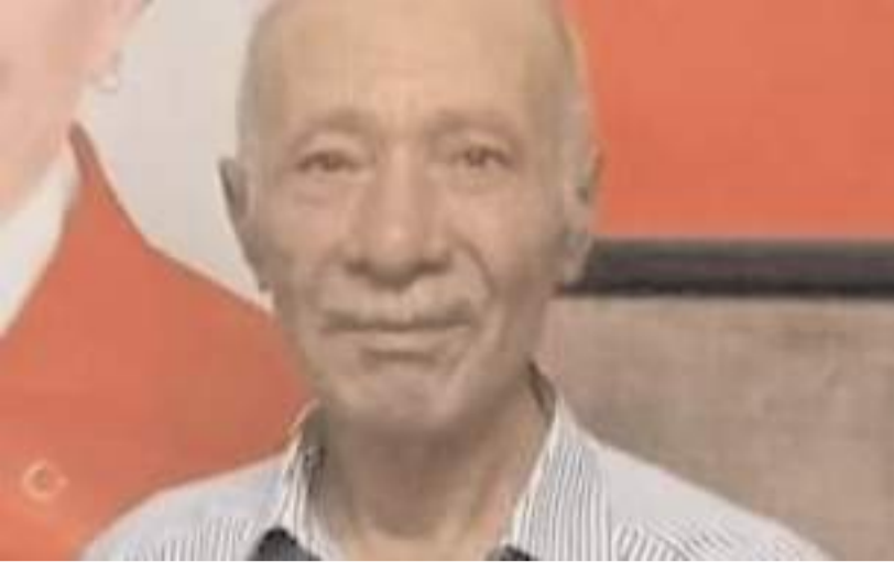
Yaşlı adam üzerine demir kapı düşmesi sonucu hayatını kaybetti.

Çorum'un Mecitözü ilçesinde üzerine demir kapı düşen kişi hastanede hayatını kaybetti.