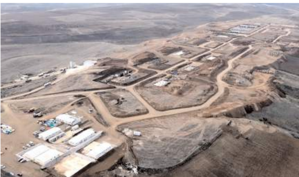
Sungurlu Organize Sanayi bölgesi her geçen büyüyor.

OSB'deki fabrikaların faaliyete geçmesiyle ilçe nüfusunun iki kat artacağı, buna paralel olarak da şehrin kısa sürede büyüyüp, gelişeceği ifade ediliyor. (Haber Merkezi)