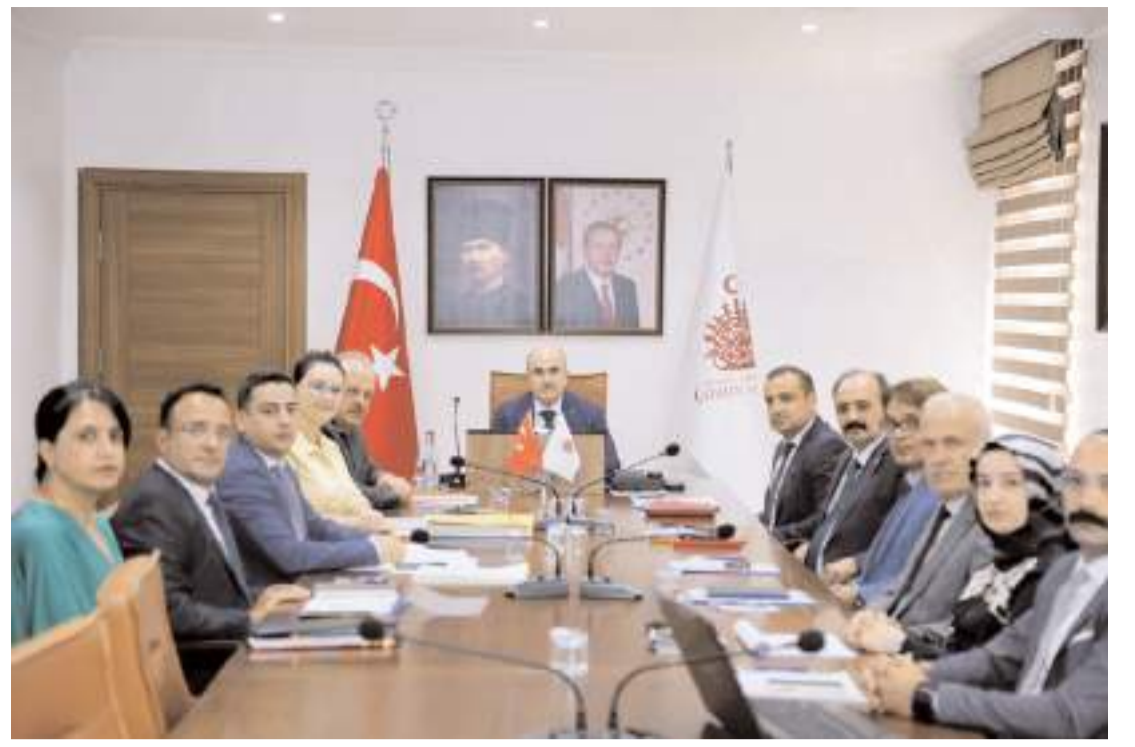
Toplantı Vali Zülkif Dağlı'nın başkanlığında yapıldı.

Sivil Toplum Kuruluşlarıyla İşbirliği: Sokak hayvanları konusunda çalışan sivil toplum kuruluşlarıyla işbirliği yaparak daha etkin çözümler üretilmelidir. Farkındalık Oluşturma Çalışmaları: Kamuoyunda sokak hayvanlarına karşı duyarlılığı artırmak için farkındalık oluşturma çalışmaları düzenlenmelidir. Çorum Eczacı Odası olarak, sokak hayvanlarının yaşam haklarının korunması ve refahının sağlanması için tüm paydaşlarla işbirliği yapmaya hazırız. Bu konuda duyarlılık gösteren tüm kurum ve kuruluşlara teşekkür ederiz" ifadelerini kullandı. (Haber Merkezi)