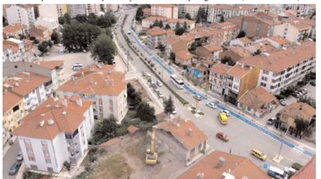
Belediye, kamulaştırma ve yıkım çalışmalarının ardından yaklaşık 1 kilometrelik bir bulvarı daha şehrin merkezinde oluşturacak.