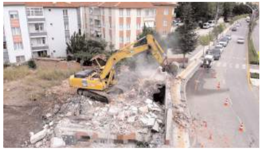
Kamulaştırılan binalar yıkılıyor.

yeni yollar açarken diğer yandan da mevcut yolları genişletmeye devam ettiklerini belirten Belediye Başkanı Dr. Halil İbrahim Aşgın, "Göreve geldiğimiz andan itibaren akıllı şehir ve ulaşılabilir şehir projelerimizi bir bir hayata geçiriyoruz. Şehir içi ulaşımını rahatlatmak için yeni yollar açıyor, şehrin nefes alacağı yeni alanlar oluşturmak için kamulaştırma çalışmalarımıza devam ediyoruz. Bölgede başlattığımız yıkım çalışmalarının ardından yol genişletme çalışmalarımızı da en kısa sürede tamamlayacağız" dedi. (Haber Merkezi)