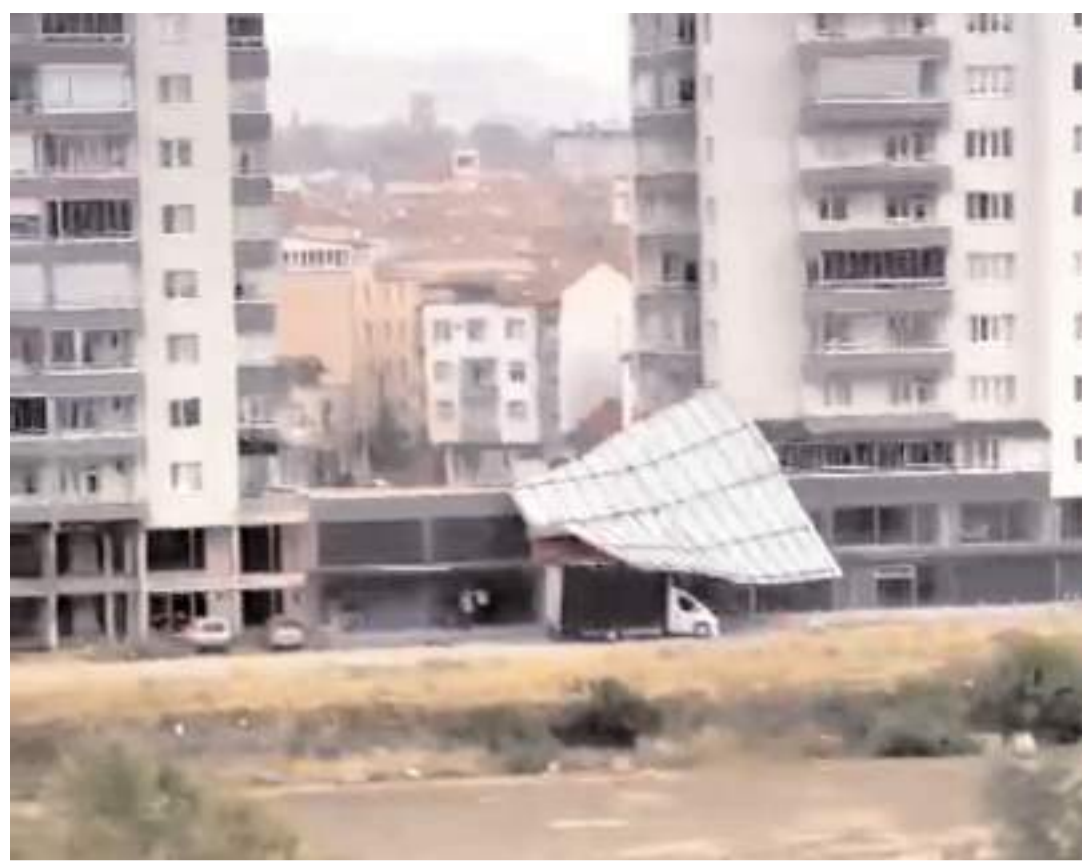
Sungurlu'da etkili olan şiddetli fırtına sebebiyle bir binanın çatısı uçtu.