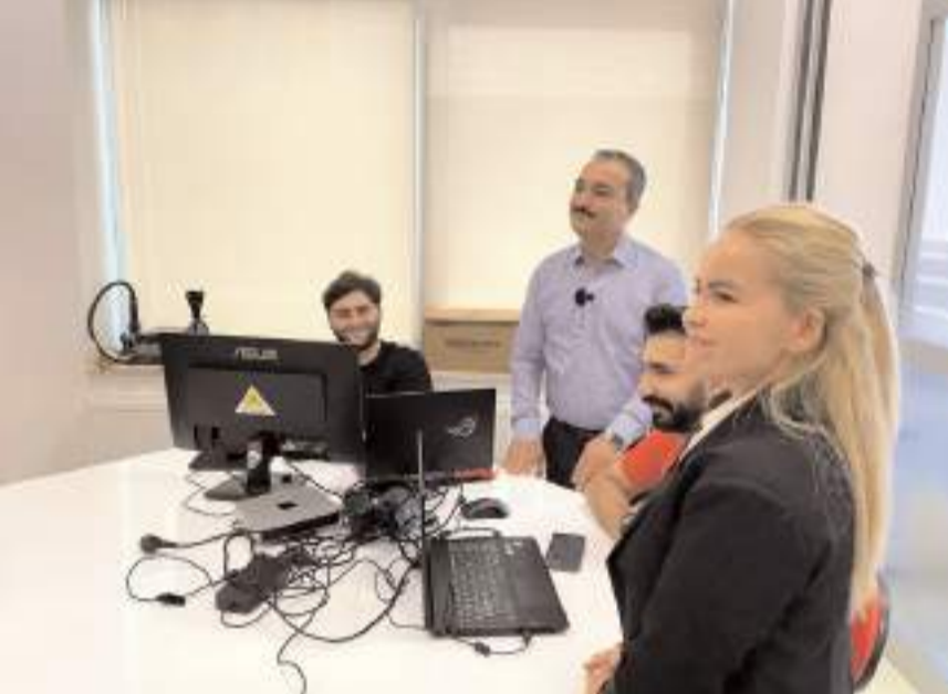
Proje kültürünün yerleşmesi adına fikir atölyesinin önemli bir rolü olacak.