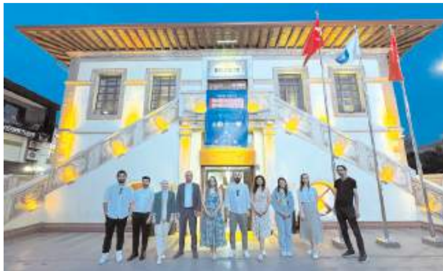
Türk Psikolojik Danışma ve Rehberlik Derneği NFK Gençlik Merkezi ve Millet Kütüphanesinde ücretsiz tercih danışmanlığı yapacak.