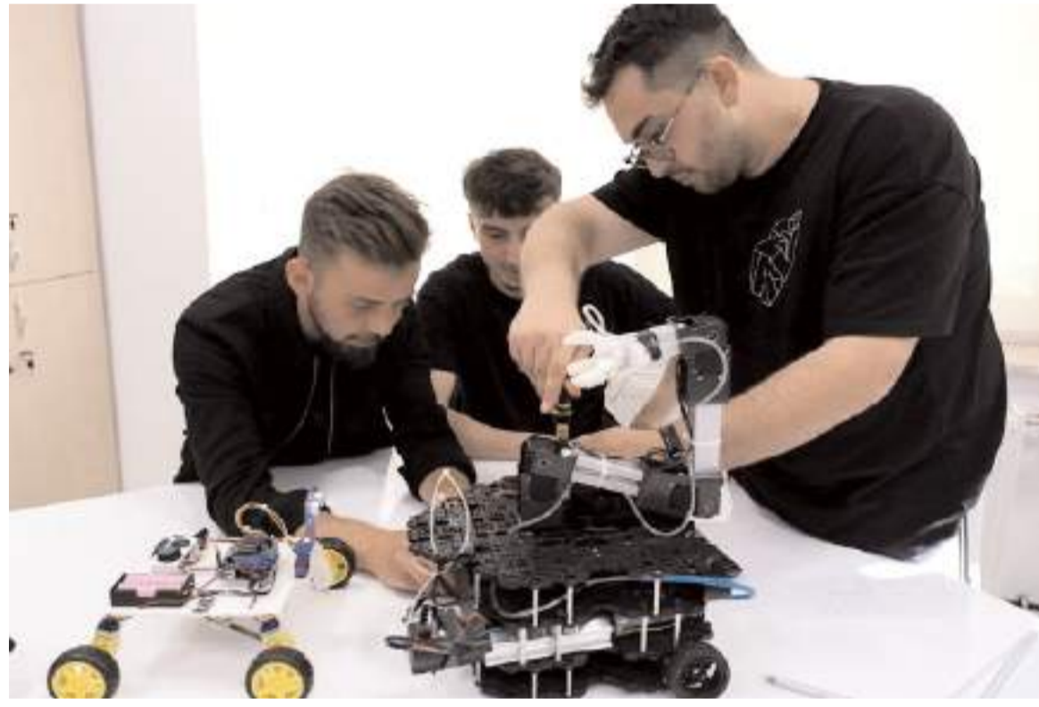
"Fikir Atölyesi" Ar-Ge üssü haline geldi.