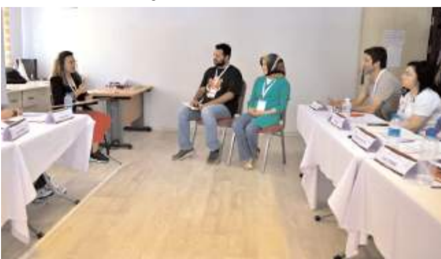
Katılımcılara 3 gün teorik, 2 gün de pratik eğitim verildi.