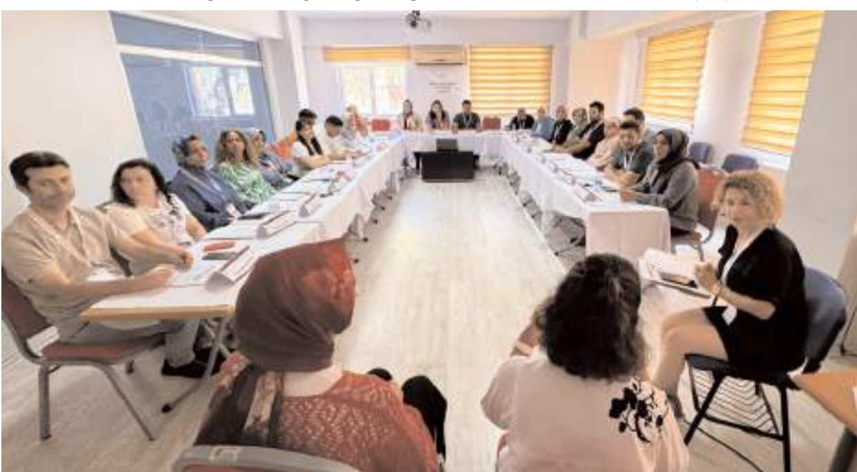
Eğitime Adıyaman, Amasya, Çorum, Karaman, Kayseri, Malatya, Niğde, Sinop, Tokat ve Yozgat'tan 24 personel katıldı.