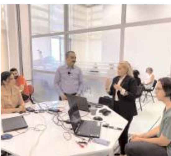
"Fikir Atölyesi" Ar-Ge üssü haline geldi.

Çorum'da Hitit Üniversitesi tarafından son teknoloji ile kurulan atölyede öğrenciler yenilikçi iş fikirleri ve projelerini hayata geçirebiliyor. Yenilikçi fikirleri bulunan öğrencilere, atölyede projelerin alt yapı hazırlıklarından tasarımına kadar akademisyenler danışmanlığında her türlü bilimsel destek veriliyor. * HABERİ4'DE