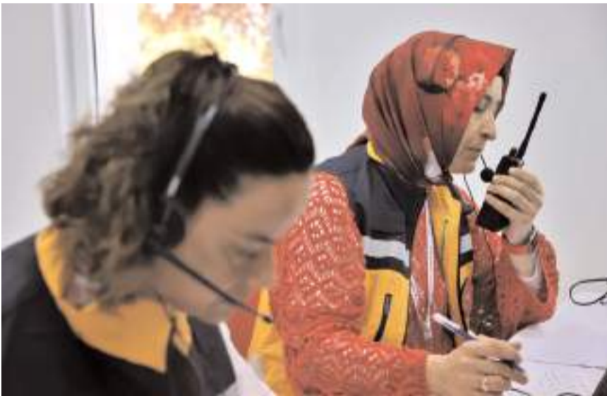
Eğitim Samsun'da düzenlendi.

Acil çağrı merkezlerinde sanyelerin dahi hayatı önem taşıdığını vurgulayan Uras, "İnşallah bu eğitimler sayesinde birçok insanımızın hayatla ölüm arasındaki mücadelelerinde onları hayatta tutacak sanyeleri kazanacağız. Eğitimin ilimize düzenlenmesine vesile olan Sağlık Bakanlığı Acil Sağlık Hizmetleri Genel Müdürlüğümüze, tüm eğitimcilerimize teşekkür ediyor, eğitime katılan sağlık çalışanlarımıza bundan sonraki mesleki hayatlarında başarılar diliyorum." dedi.(AA)