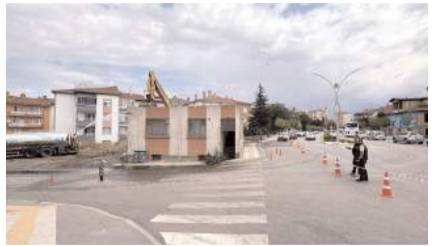
Recep Tayyip Erdoğan Caddesi ile Okul 1. Sokağın bulunduğu noktadaki bir binanın daha yıkım çalışmalarına başlandı.