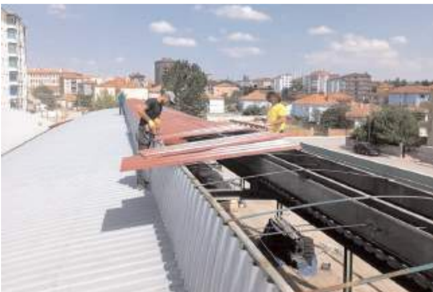
Çalışmalar kapsamında pazarın çatısı yenileniyor.