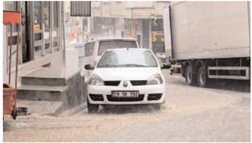
Şiddetli yağış ilçede hayatı olumsuz etkiledi.

Sungurlu'da etkili olan şiddetli fırtına sebebiyle bir sitede binanın çatısı uçtu.