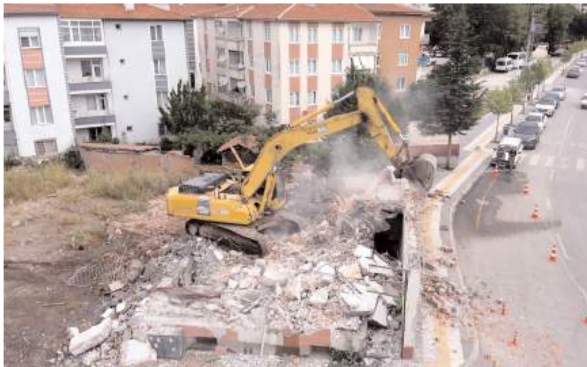
Kamulaştırılan binalar yıkılıyor.

Anadolu Gençlik Derneği (AGD) Çorum Şubesi tarafından yapılan basın açıklamasında bir araya gelen çocuklar Filistin için özgürlük istedi. * HABERİ5'DE