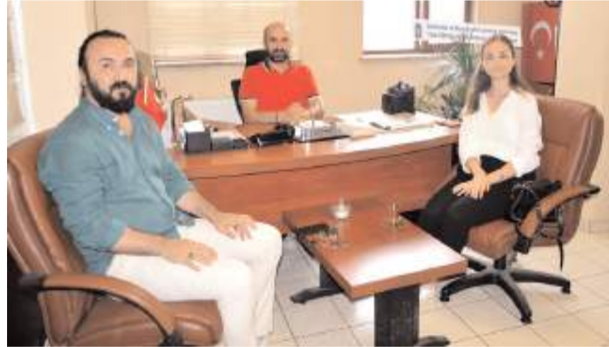
Türk Psikolojik Danışma ve Rehberlik Derneği Çorum Şube yönetimi gazetemizi ziyaret etti.