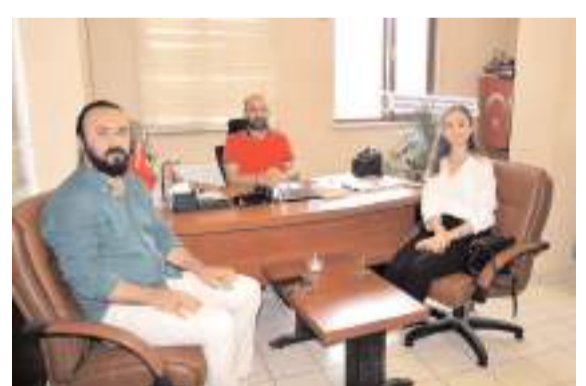
Türk Psikolojik Danışma ve Rehberlik Derneği Çorum Şube yönetimi gazetemizi ziyaret etti.

Çorum'da 1984 yılından bu yana sondaj sektöründe hizmet veren Cansu Sondaj, Çorum'da ilk ve tek olarak basınçlı hava ile sert zeminde derin kuyu açmaya başladı. * HABERİ6'DA