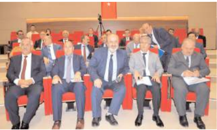
Toplantıda Çorum'daki yatırımlar değerlendirildi.