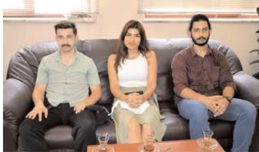
Ziyarete derneğin yönetim kurulu üyeleride katıldı.