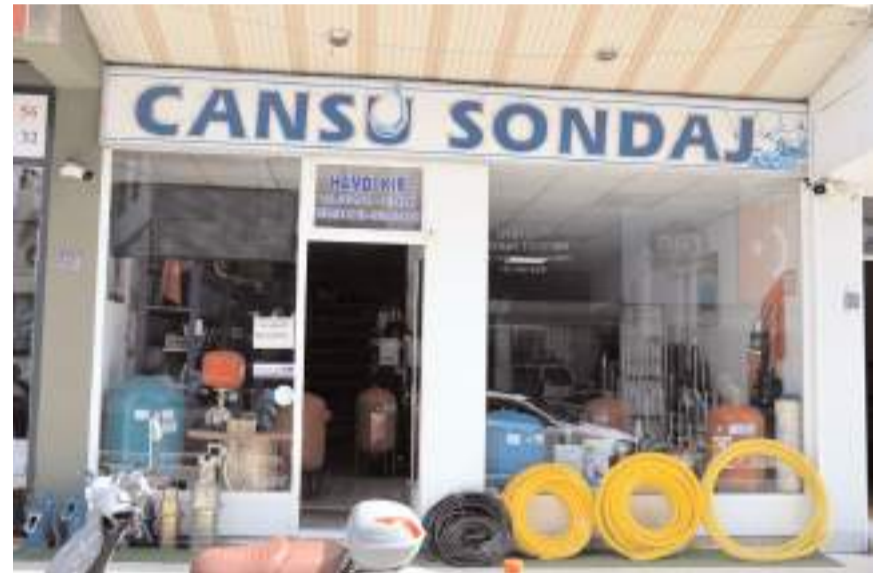
Cansu Sondaj, 40 yıldır su sondajı ve dalgıç pompa sistemleri alanında faaliyet gösteriyor.

Ayrıca Cansu Sondaj olarak çevre duyarlılığına büyük önem veriyoruz. Su kaynaklarının sürdürülebilir bir şekilde yönetilmesine katkıda bulunarak doğal kaynakların korunmasına destek oluyoruz." dedi