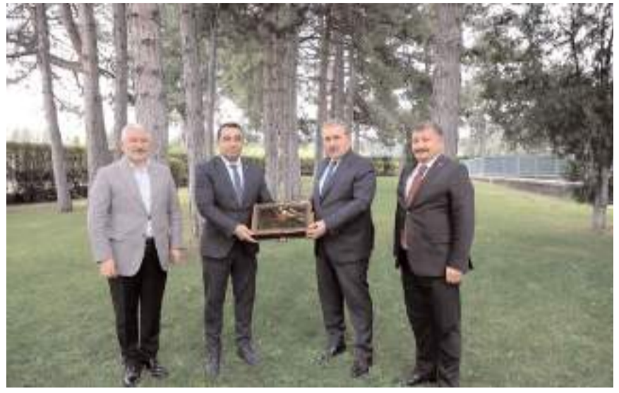
BBP Genel Başkanı Mustafa Destici'ye hediye verildi.