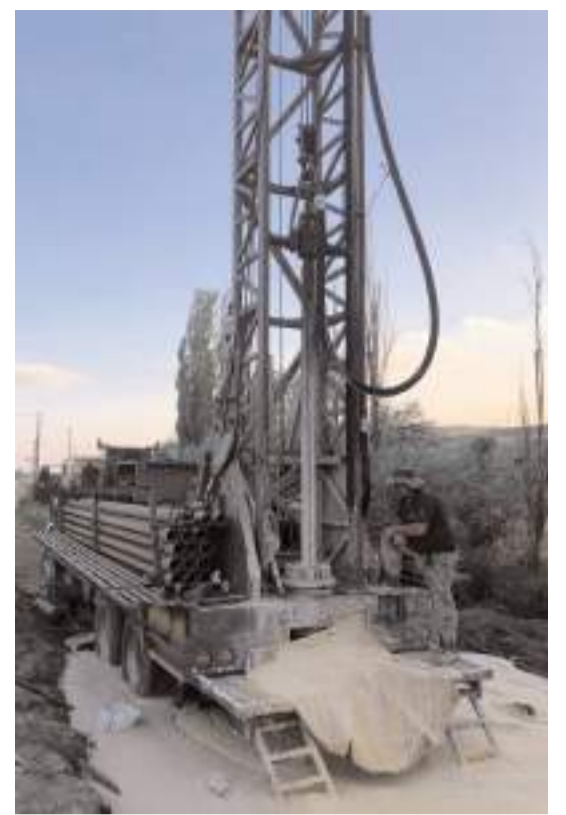
Cansu Sondaj, Çorum'da ilk ve tek olarak basınçlı hava ile sert zeminde derin kuyu açmaya başladı.