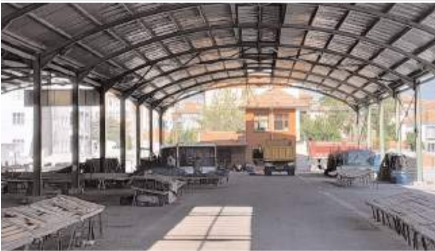
Alaca'da kapalı pazar yerinde belediye tarafından yenileme çalışmaları başlatıldı.