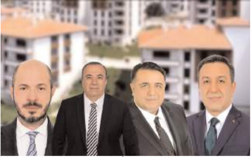
Çorum heyeti TOKİ Başkanlığına atanan Mustafa Levent Sungur'a hayırlı olsun ziyaretinde bulundu.

lu'muzda, yapılması planlanan TOKİ projeleri hususunda istişarelerde bulunduk. Milletvekillerimiz ve TOKİ Başkanımızla gerçekleştirdiğimiz görüşme sonucunda alınan kararlar, Manastır Mahallesi'nde yapılacak olan 359 konutun, yapım ihale tarihinin 26 Eylül 2024 olarak belirlenmesi müjdesini de bu vesileyle siz değerli hemşehrilerimle paylaşmak istiyorum. Kıymetli Milletvekillerimiz Sayın Vahit Kayıncı'ya, Sayın Oğuzhan Kaya'ya ve TOKİ Başkanı Sayın Mustafa Levent Sungur'a teşekkürlerimi sunuyorum, Sungurlu'muza hayırlı olsun dileklerini iletiyorum" ifadelerini kullandı. (Haber Merkezi)