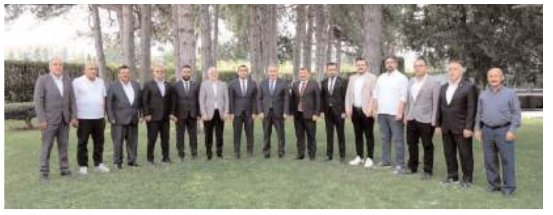
Büyük Birlik Partisi Genel Başkanı Mustafa Destici, Samsun'a giderken Çorum'a uğradı.