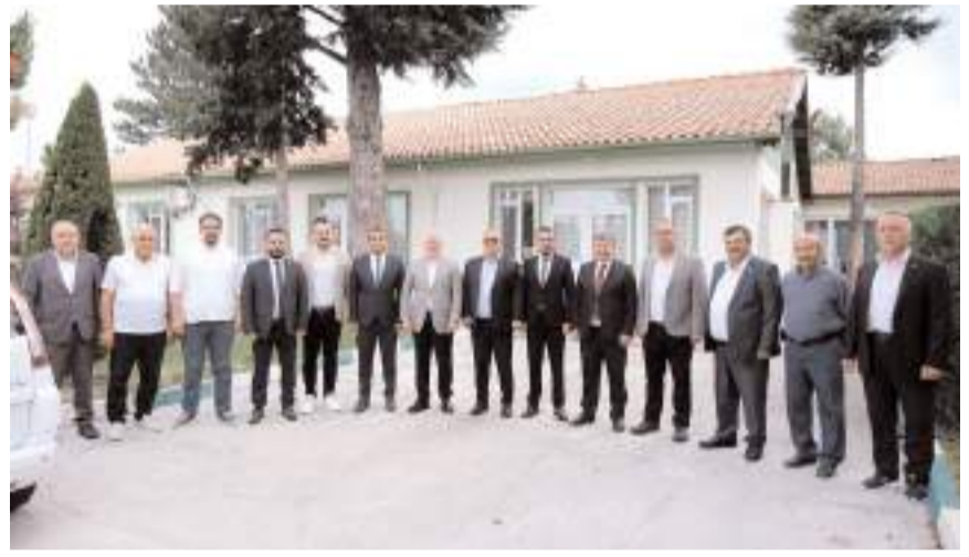
Ziyaretin ardından hatıra fotoğrafı çekildi.