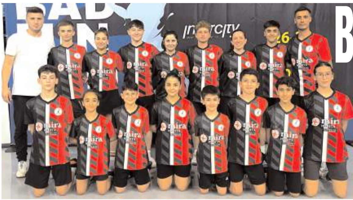
Osmançık Barış Boyar Badminton Akademisi takımları İstanbul etabını yenilgisiz tamamladılar