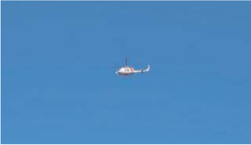
Abdullah Taşlıtepe'yi arama çalışmalarına helikopterde katıldı.