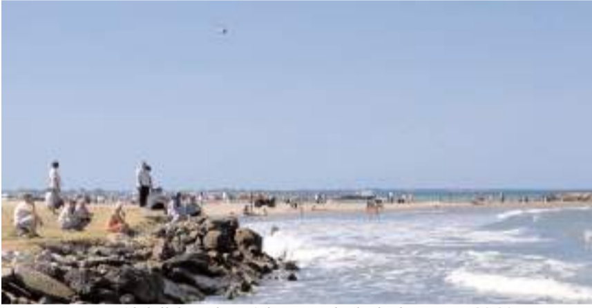
Abdullah Taşlıtepe'nin cansız bedeni, akşam saat 20.30 sıralarında denize girdiği yere yakın bölgede karaya vurdu.