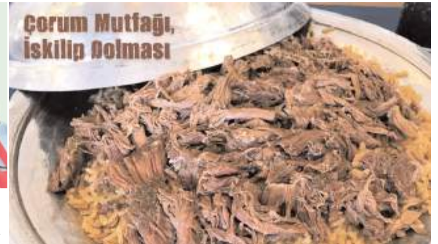
Yazıda İskilip dolmasına dikkat çekildi.