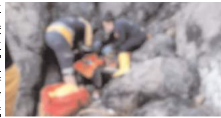
Olay Bayat'a bağlı Kuruçay köyünde meydana geldi.