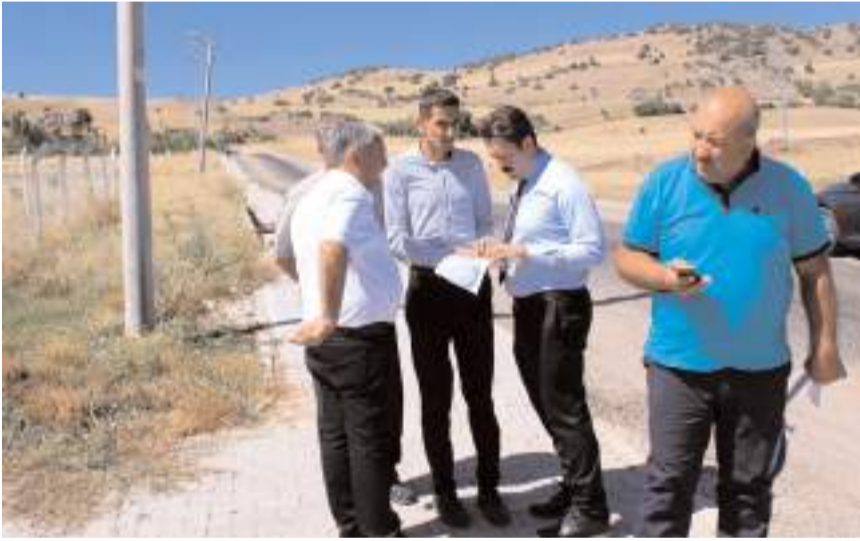
Çorumgaz yetkilileri ilçede incelemede bulundu.