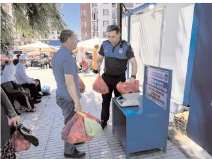
Vatandaşlar pazar esnafından aldıkları ürünlerin ağırlığını zabita eşliğinde kontrol edebiliyorlar.

Çorum Belediyesi, semt pazarlarında vatandaşların güvenli ve rahat alışveriş yapabilmesi için çeşitli hizmetler sunmaya devam ediyor. Ücretsiz pazar servisi ile halkın ulaşımını kolaylaştıran belediye, ürün denetimleri ve tartı kontrol noktaları ile pazar yerlerinde kaliteyi ve güvenliğini artırmaya yönelik çalışmalar yapıyor.