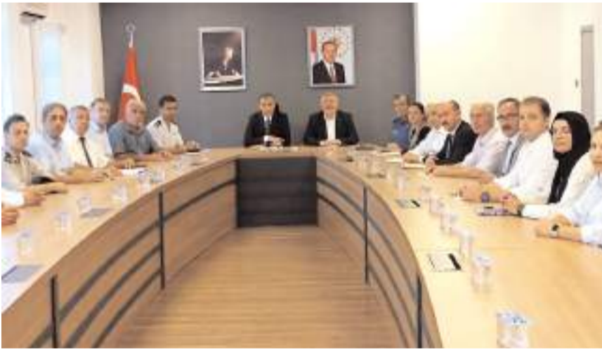
Kaymakam Duman, Kaymakamlık toplantı salonunda daire amirleri ile tanıştı.