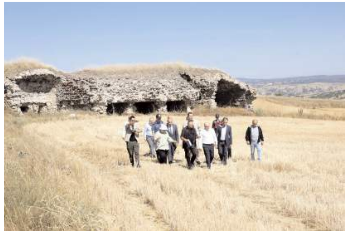
Mahmudiye köyü yakınındaki sit alanı içerisinde, Behramşah Külliyesi ismiyle de bilinen bir medrese ile bu yapının güneydoğusunda bir kervansaray günümüzde ayakta olan yapılardan.

Mahmudiye köyü yakınındaki sit alanı içerisinde, Behramşah Külliyesi ismiyle de bilinen bir medrese ile bu yapının güneydoğusunda bir kervansaray günümüzde ayakta olan yapılardan. Bu yapıların güneybatısında yer alan Kalehisar Kale-sinde ise yine bu yapılar ile çağdaş olduğu düşünülen sur kalıntıları ve karakol binası olduğu düşünülen bir yapı bulunmakta. Çalışmalar neticesinde yapılan tespitler, burasının Anadolu Selçuklu dönemine ait bir kent olduğunu doğrulamaktadır. Kalehisar, Orta Karadeniz bölgesinde araştırması devam eden tek Anadolu Selçuklu kenti olma özelliği ile öne çıkıyor.