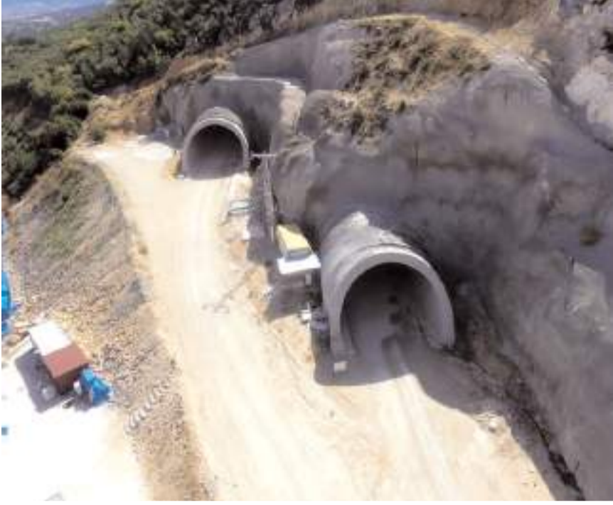
Projede tünel imalatları tamamlandı.