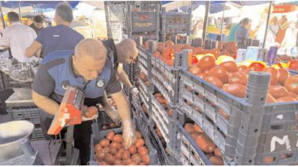
Zabita ekipleri pazar esnafının tartılarını kontrol ediyor.