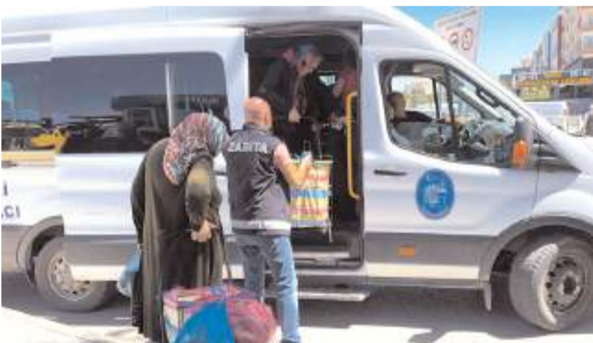
Belediyenin ücretsiz pazar servisi hizmeti devam ediyor.