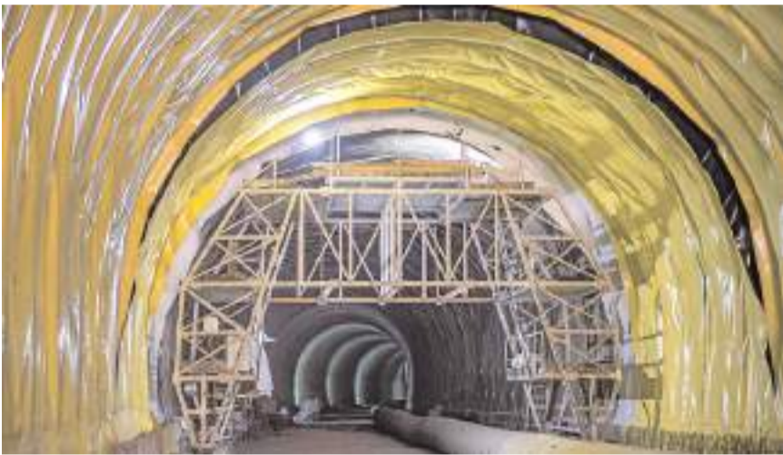
Yeni ihale kapsamında elektrik, elektronik, elektromekanik ve tünel kontrol merkezi yapım işleri yapılacaktır.