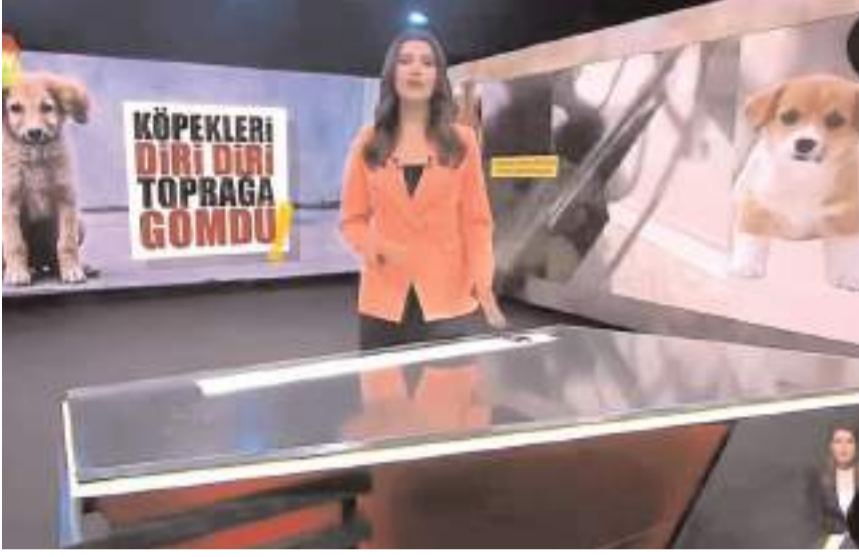
Haber, Show Tv haber bülteninde yer aldı.

Görüntülerde köpeklerin sesini duyan yaşlı adamın komşuları, köpek yavrularını toprak altından son anda kurtardığı yer alırken, kurtarılan köpeklerin Çorum Belediyesi Hayvan Barınağına teslim edildiği belirtildi. (Haber Merkezi)