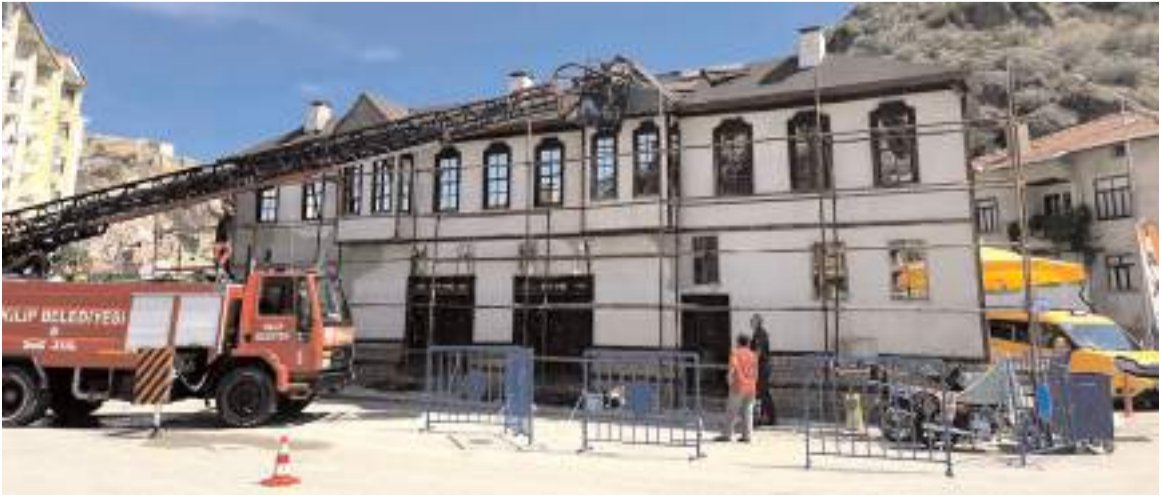
Bakım onarım çalışmasını belediye ekipleri yapıyor.