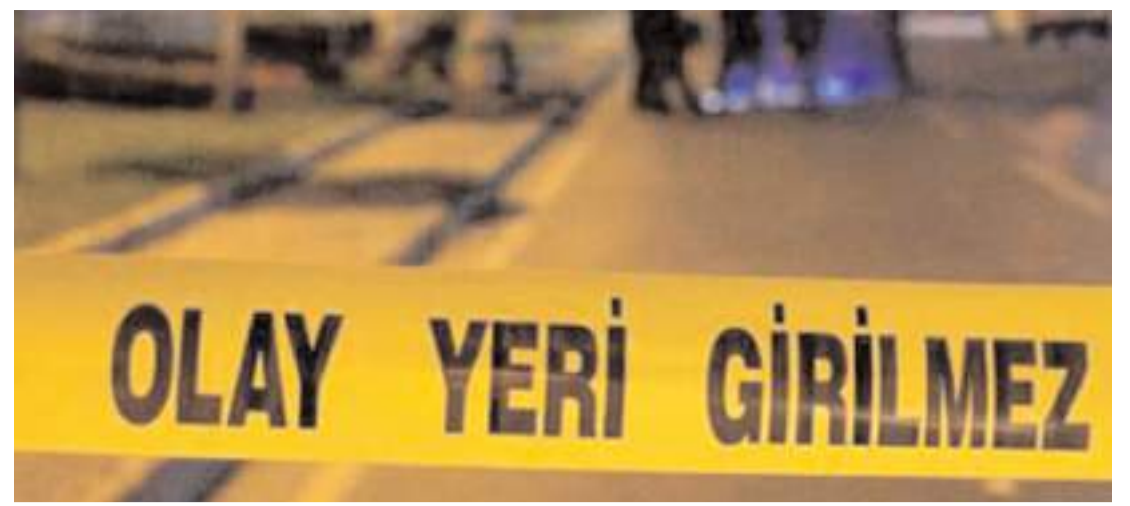
Olay Akkent 4. Cadde'de bir evde meydana geldi.