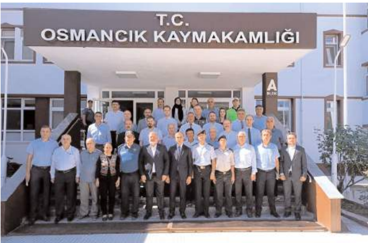
Günün anısına toplu hatıra fotoğrafı çekinildi.

timi alanında "Türkiye'de 2000 Sonrası Yerel Yönetimler Alanında Yapılan Yasal Reformların Yeni Kamu Yönetimi Anlayışı Açısından Değerlendirilmesi" konusundaki tezini tamamlayarak ikinci yüksek lisansını yaptı.