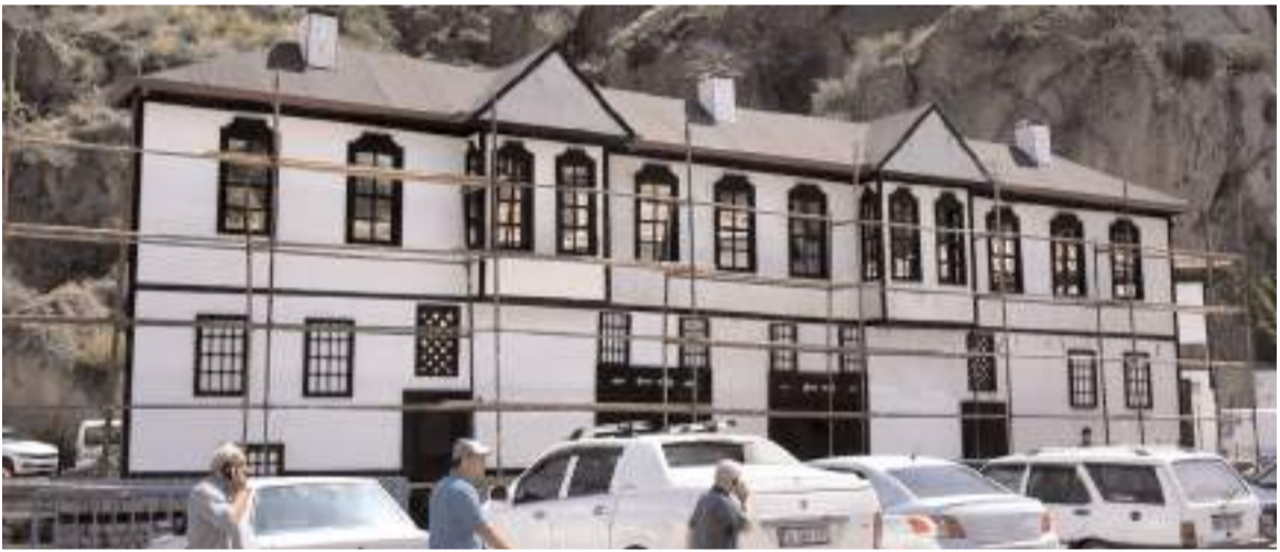
Maket İskilip evinin bakım ve onarımı yapılıyor

Projede 2024 yılında, 1,5 km bölünmüş yol ve sıcak asfalt yapılması hedefleniyor. Ayrıca 2024 yılında T2 ve T3 tünellerinde üstyapı çalışmaları devam ediyor.