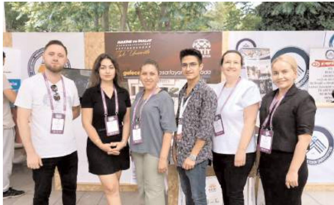
Ankara'da düzenlenen "Üniversite Tanıtım ve Tercih Günleri"nde HITÜ'yü tanıtan ekip...

Hitit Üniversitesi, Ankara'da düzenlenen "Üniversite Tanıtım ve Tercih Günleri"nde aday öğrenciler, aileler ve rehber öğretmenlerle buluştu.