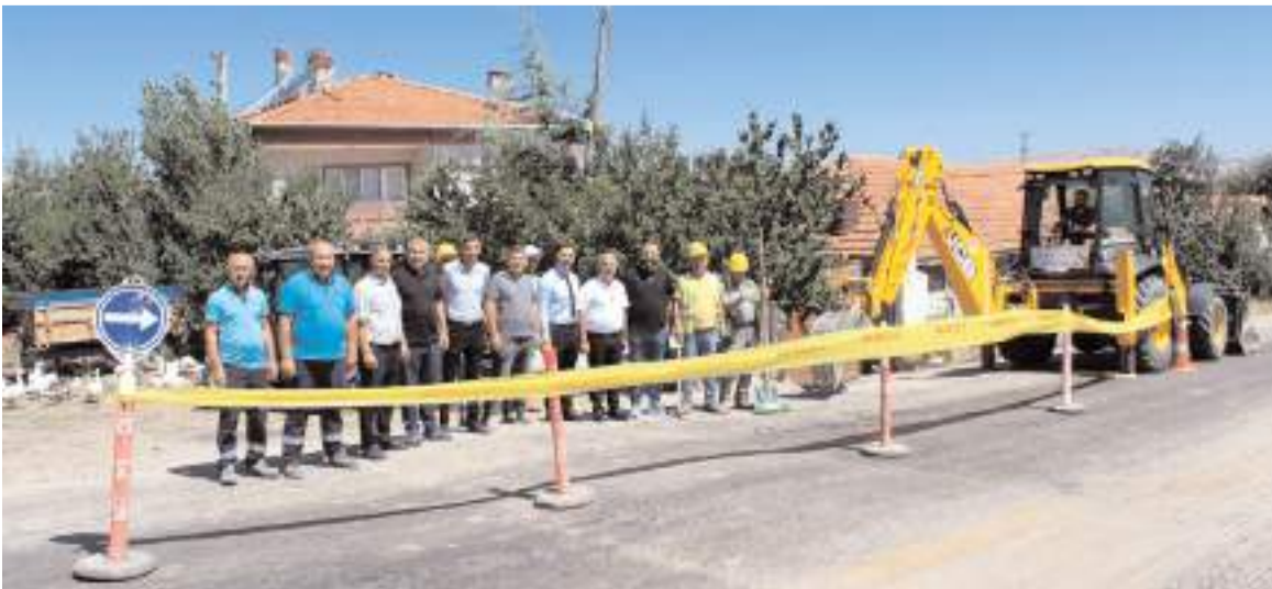
Boğazkale'de doğalgaz çalışmaları için ilk kazma vuruldu.