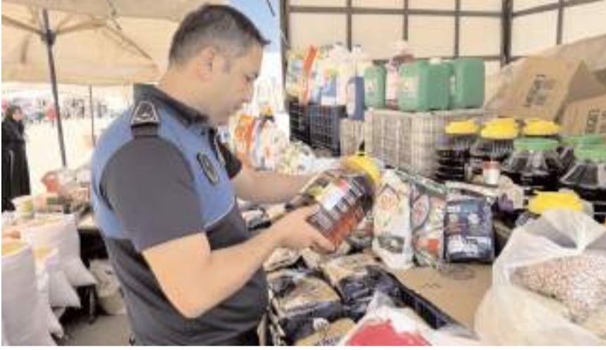
Zabita ekipleri pazarda satılan ürünlerin son kullanma tarihlerini kontrol ediyor.