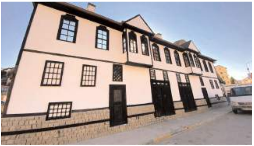
Maket İskilip Evi İskilip girişi Hacıkaranı Köprüsü üzerinde bulunuyor.

İskilip girişi Hacıkaranı Köprüsü üzerinde bulunan maket İskilip evinin bakım ve onarımları yapılırken, "Amacımız, ilçemize gelen misafirlerimizi etkileyici bir görüntüyle karşılayarak İskilip'in güzelliklerini ön plana çıkarmak. Yapılan bu çalışmalarla, ilçemiz girişinin görünümünü modernize ederek, halkımıza ve ziyaretçilerimize daha estetik bir karşılama sunmayı hedefliyoruz." denildi. (Haber Merkezi)