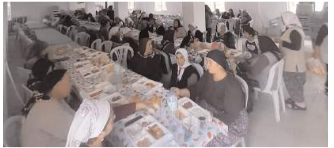
Aşure programına köy halkı ile davetiler katıldı.