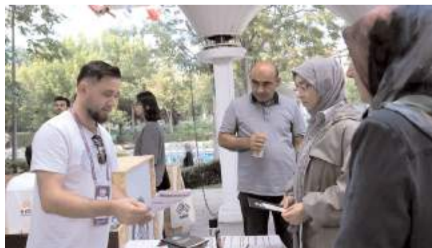
Aday öğrencilerin üniversite ile ilgili soruları cevaplandırıldı.