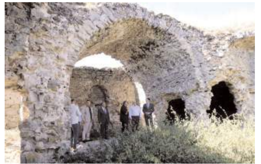
Kalehisar köyünde Selçuklu dönemine ait yapıların gün yüzüne çıkarılması planlanıyor.

Mahmudiye köyü yakınındaki sit alanı içerisinde, Behramşah Külliyesi ismiyle de bilinen bir medrese ile bu yapının güneydoğusunda bir kervansaray günümüzde ayakta olan yapılardan. Bu yapıların güneybatısında yer alan Kalehisar Kale-sinde ise yine bu yapılar ile çağdaş olduğu düşünülen sur kalıntıları ve karakol binası olduğu düşünülen bir yapı bulunmakta. Çalışmalar neticesinde yapılan tespitler, burasının Anadolu Selçuklu dönemine ait bir kent olduğunu doğrulamaktadır. Kalehisar, Orta Karadeniz bölgesinde araştırması devam eden tek Anadolu Selçuklu kenti olma özelliği ile öne çıkıyor.