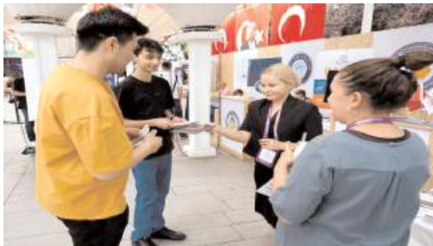
Aday öğrencilere Hitit Üniversitesi ile ilgili broşürler verildi.