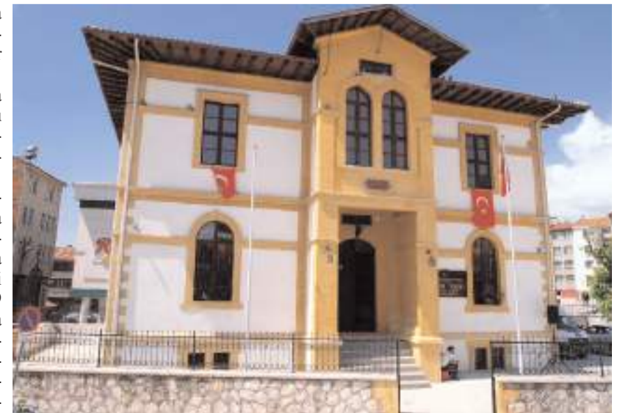
Hasan Paşa Yazma Eser Kütüphanesi