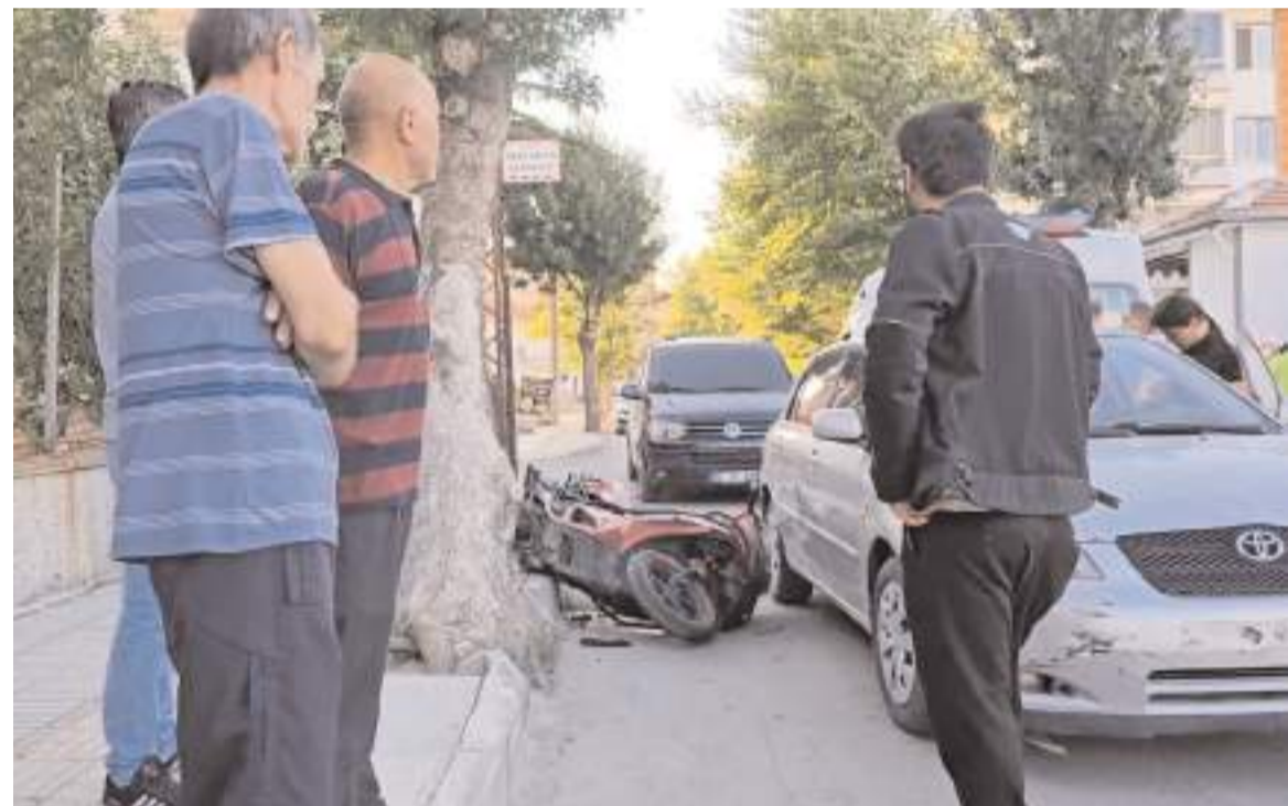
Olay Kale Mahallesi Aksaray 3. Cadde'de meydana geldi.