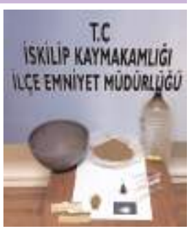
Operasyonda 272 gram esrar ele geçirildi.

■ İskilip'te bir bağ evine düzenlenen operasyonda 272 gram esrar ele geçirildi. Operasyonda 4 kişi gözaltına alındı. * HABERİ'5'DE