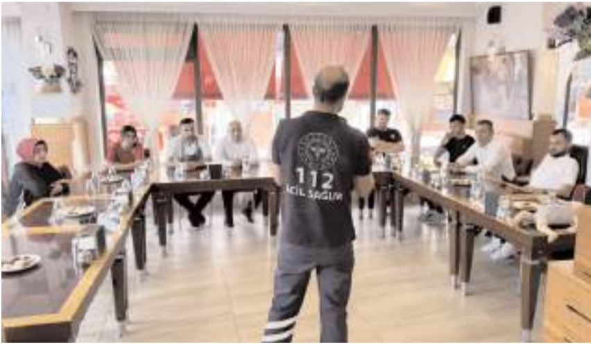
'Heimlich' eğitimi verilmeye başlandı.

■ Çorum'da lokantacılık sektöründe görev yapan tüm personele, acil müdahale uygulaması olan 'Heimlich' eğitimi verilmeye başlandı. * HABERİ'3'DE