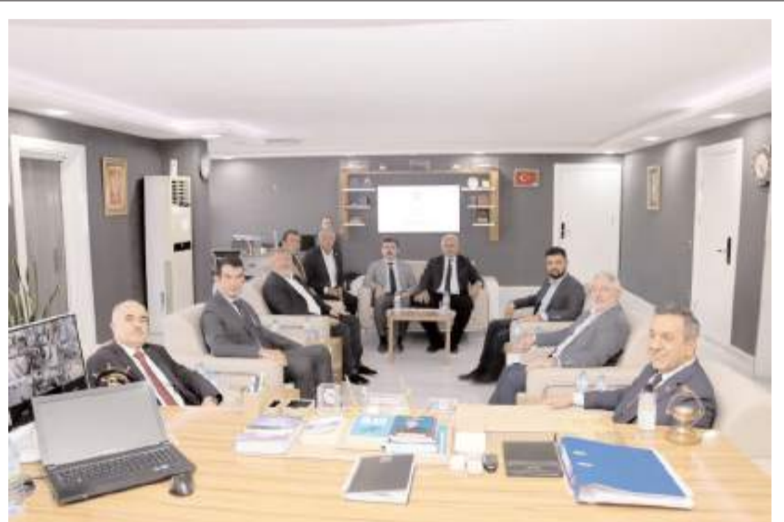
Toplantıda gündem maddeleri görüşüldü.

bir potansiyel var. Bunun değerlendirilmesi lazım. Kültürel varlıklar hepimizin. Hepimizin sahiplenmesi lazım. Çorum Belediyesi'ne tarihi ve kültürel mirasa sahip çıkılması noktasında verdikleri destekten dolayı teşekkür ediyorum" ifadelerini kullandı. (İHA)