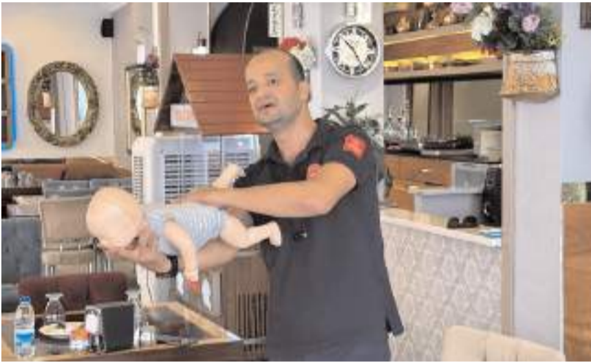
Eğitimi İl Sağlık Müdürlüğü uzmanları veriyor.

İl Sağlık Müdürlüğü ilk yardım ekiple birlikte verilen eğitimlerde, lokanta çalışanlarına teorik ve uygulamalı olarak bilgi verildi. (Haber Merkezi)