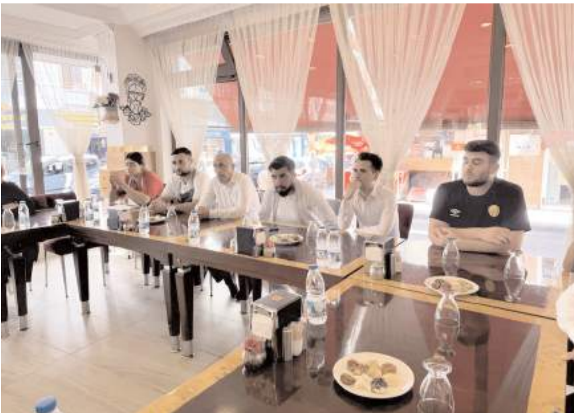
Kentte lokanta ve restoranlarda görev yapan 320 personele Heimlich eğitimi verilecek.