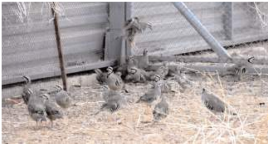
Kelkit Kanatlı Üretim İstasyonu'nda üretilen kekkikler Çorum'a da gönderildi.