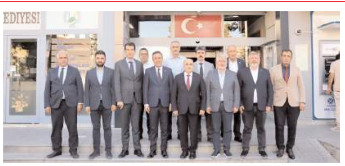
Toplantının ardından toplu hatıra fotoğrafı çekildi.

■ Anadolu'da bilinen tek Selçuklu kenti olan Kalehisar'da tarihin yeniden ayağa kaldırılması, kültürel mirasın korunması ve gelecek nesillere aktarılması için Çorum Belediyesi destek olmaya devam ediyor. * HABERİ'2'DE