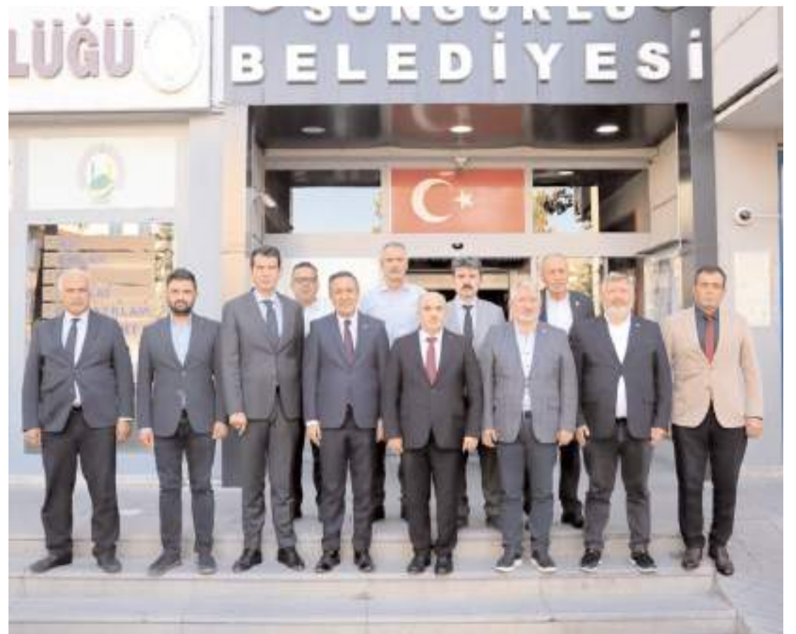
Toplantının ardından toplu hatıra fotoğrafı çekildi.

5199 sayılı Kanun'da yapılan değişikliklerin Birliğin çalışmalarına etkisinin ele alındığı toplantıda, Çorum'da dört noktada yapılacak doğal yaşam alanlarının yapımına ilişkin esaslar görüşüldü ve teknik bir heyet oluşturularak barınak inşa çalışmalarının hızlandırılması kararlaştırıldı. (Haber Merkezi)