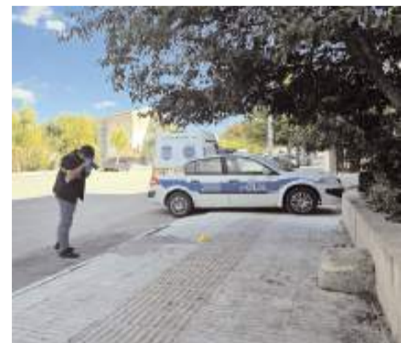
Olay Mimar Sinan Mahallesi'nde meydana geldi.