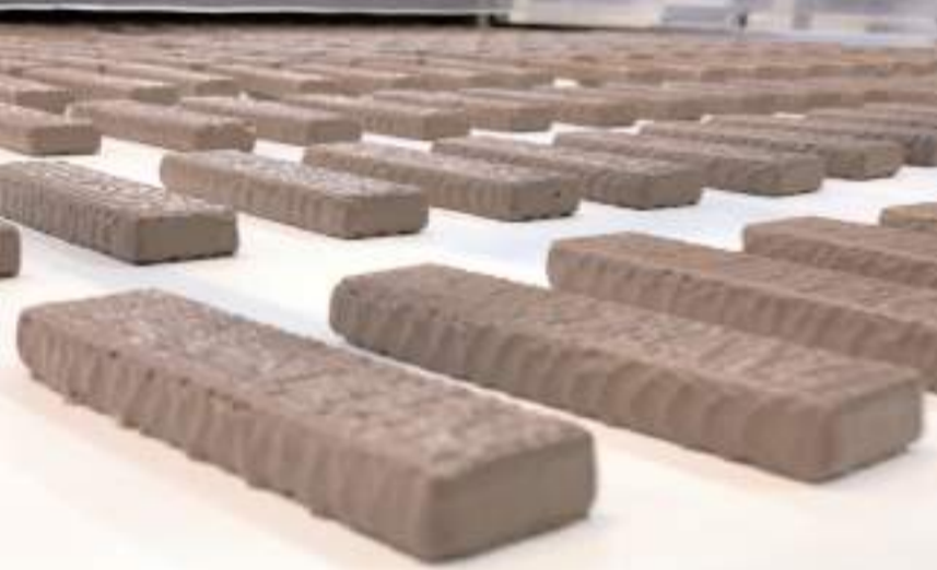
Proje Çorum ile birlikte Kırıkkale'de uygulanacak.