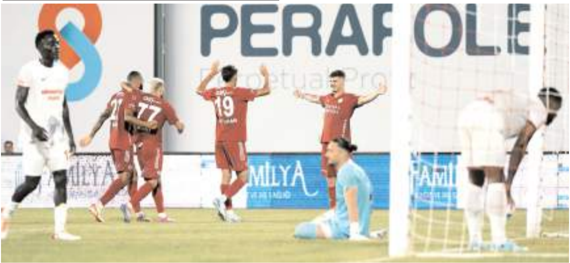
Çorum FK, Ümraniyespor karşısında aldığı mağlubiyetin ardından sahada futbolcular büyük hayal kırıklığı yaşadılar