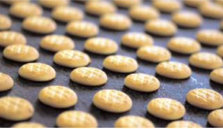
Firma 2030'a kadar 10 bin dekar alanda onarıcı tarım uygulaması yapmayı hedefliyor.