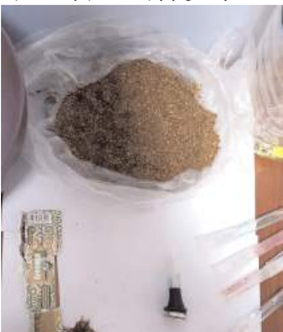
Operasyonda 272 gram esrar ele geçirildi.

Olayla ilgili başlatılan soruşturma sürüyor. (İHA)