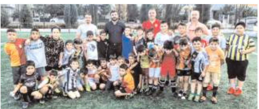
Osmancık Belediyespor antrenman ziyareti sonrasında ASKF yönetimi ile birlikte

Ziyaret sırasında Osmancık Kandiberspor ve Osmancık Belediyespor tarafından yaz spor okulları bünyesinde çalışma yapan takımları ziyaret eden ASKF Başkanı Ferhat Arıcı ve Yönetim Kurulu üyeleri çocuklara tatlı ikram ettiler ve antrenörlerle sohbet ederek çalışmalar hakkında görüş alışverişinde bulundular.