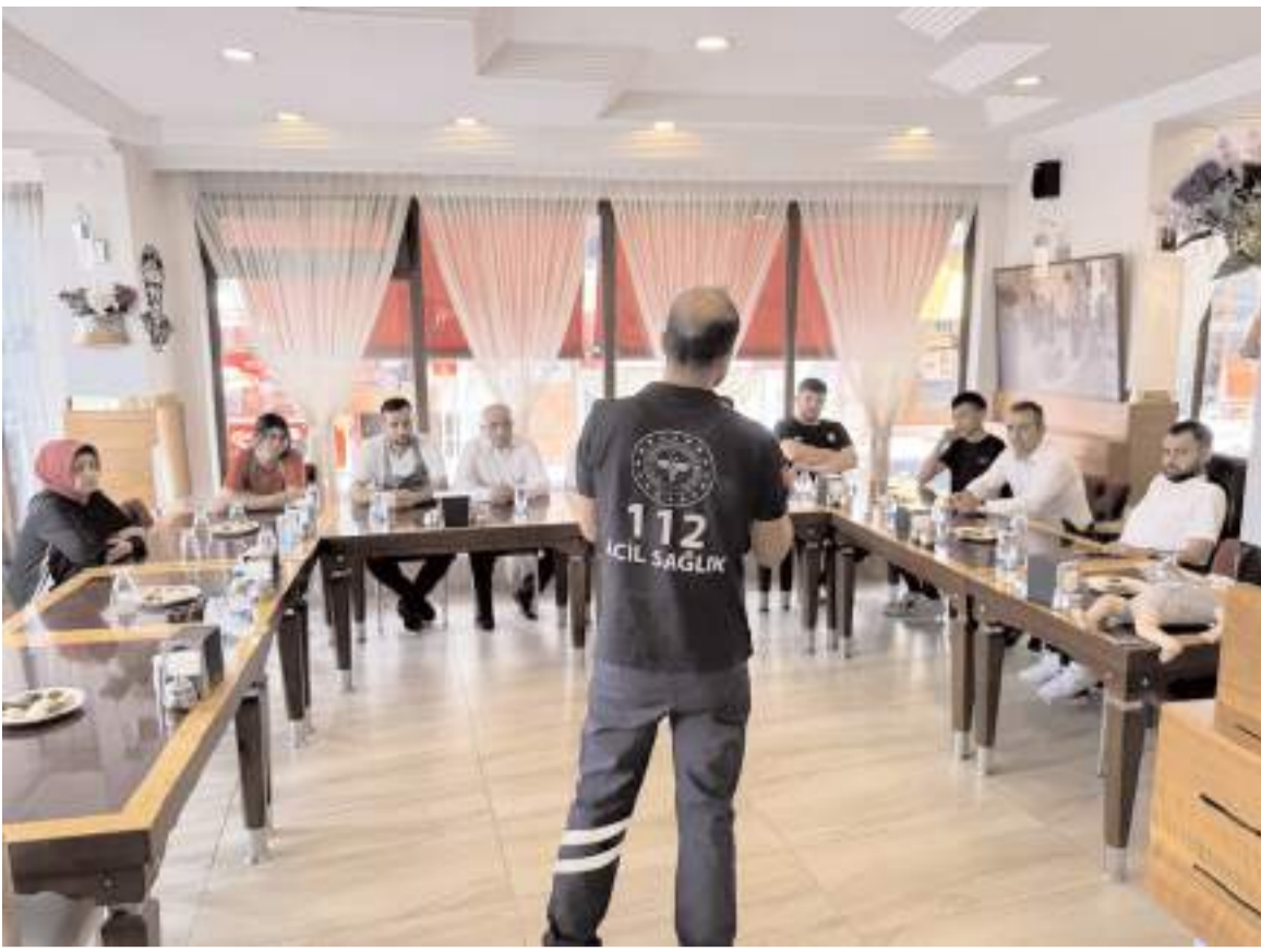
'Heimlich' eğitimi verilmeye başlandı.