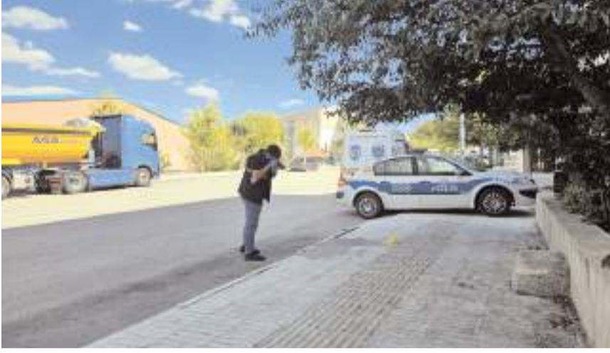
Olay Mimar Sinan Mahallesi'nde meydana geldi.