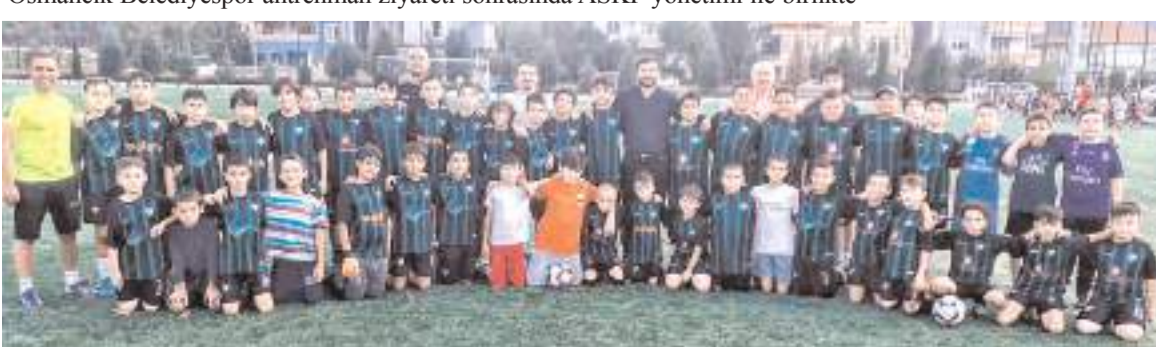
Osmancık Kandiberspor yaz futbol okulu çalışmalarına katılan sporcular ziyaret sonrasında toplu halde