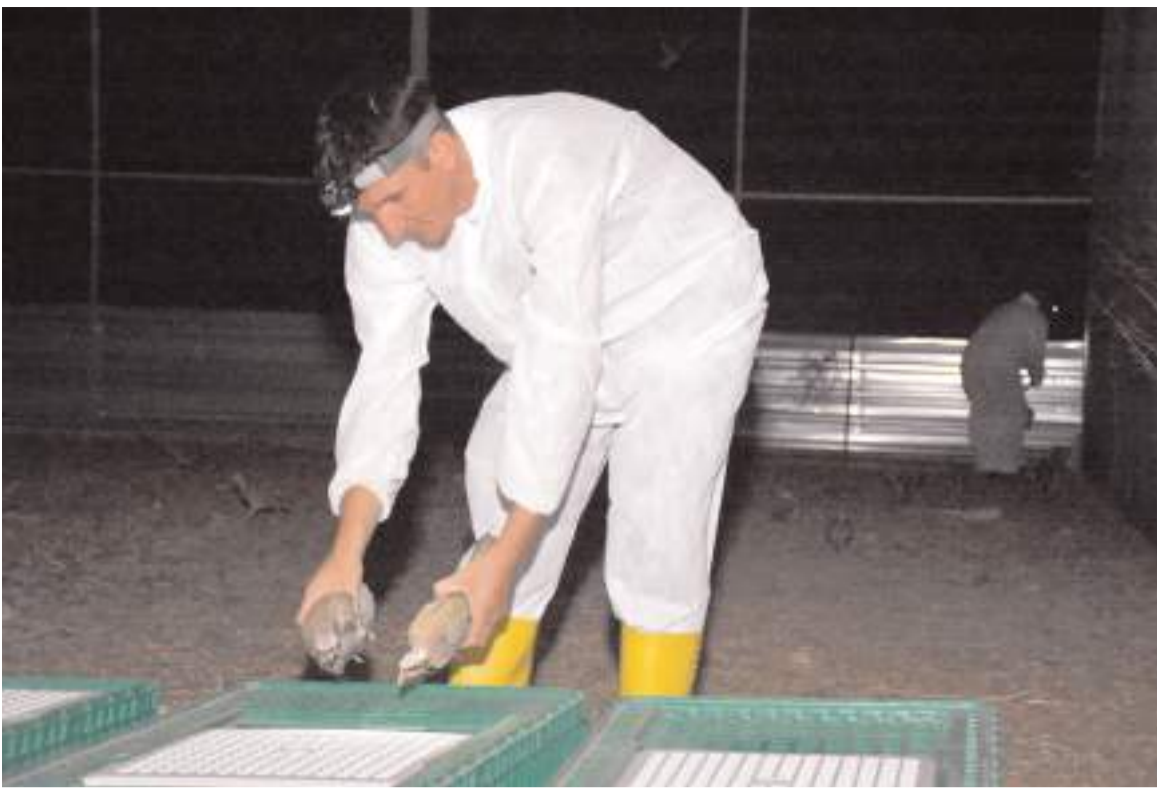
Doğa Koruma ve Milli Parklar Genel Müdürlüğü (DKMP) Kelkit Kanatlı Üretim İstasyonu'nda, yıllık 10 bin kekkik üretiliyor.