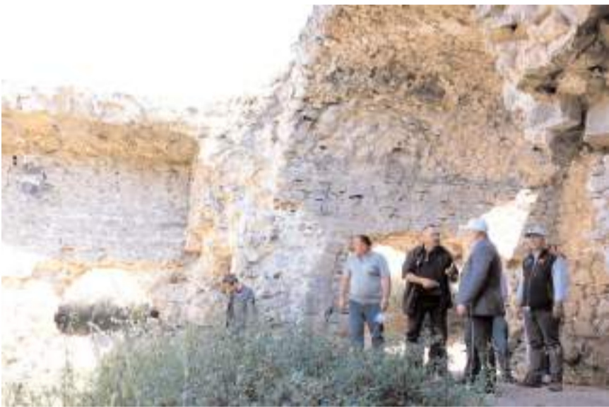
Kalehisar Örenyeri, 800 yıllık geçmişe sahip.