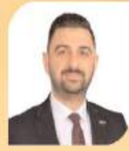
MUHAMMED FATİH TEMUR