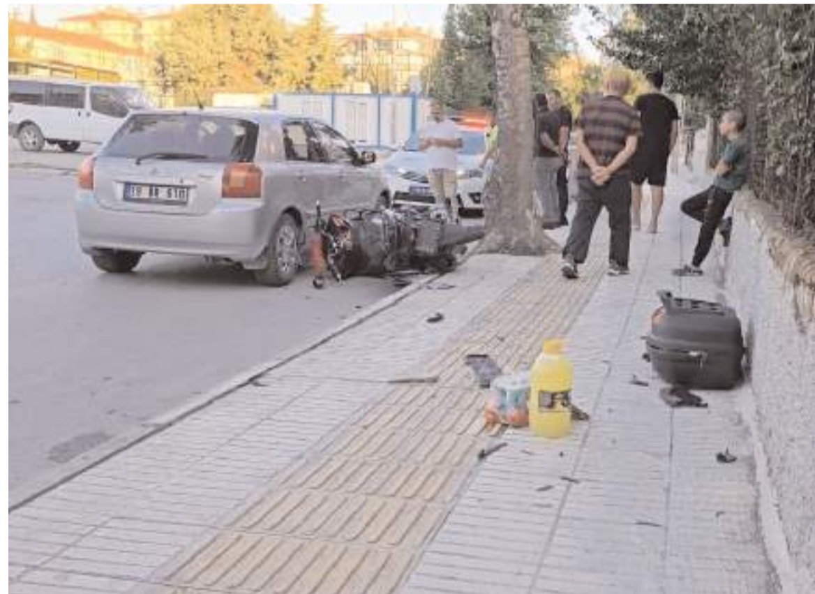
Kazada her iki araçta da maddi hasar meydana geldi.

İhbar üzerine kaza yerine polis ve sağlık ekipleri sevk edildi. Kazada yaralanan motosiklet sürücüsü, sağlık ekiplerince yapılan müdahalenin ardından Hitit Üniversitesi Erol Olçok Eğitim ve Araştırma Hastanesi'ne kaldırıldı.(AA)