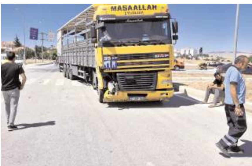
Kazada her iki araçta da maddi hasar meydana geldi.

Polis ekiplerinin olayla ilgili başlattığı soruşturmanın devam ettiği öğrenildi. (İHA)