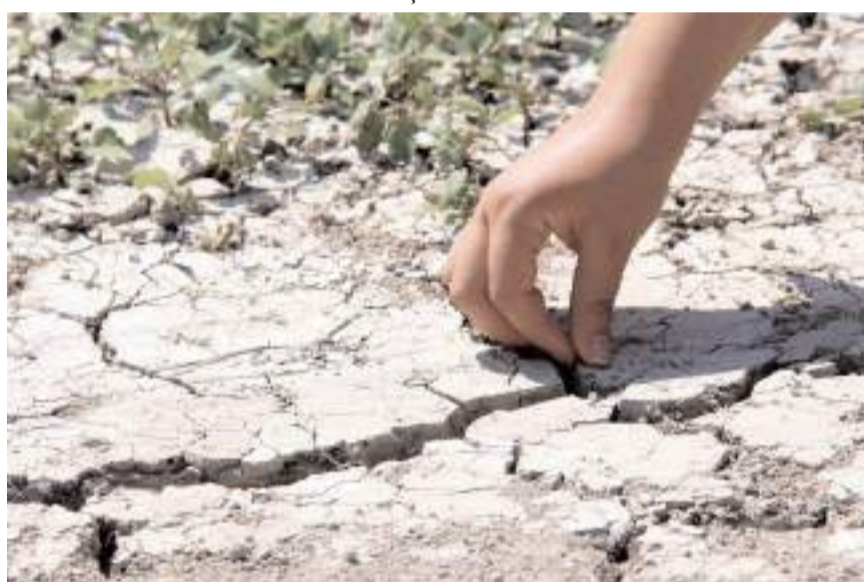
Yaz aylarının aşırı sıcak geçmesi verim kaybına neden oldu.

rum'un tüm dinamiklerinden destek bekliyoruz.