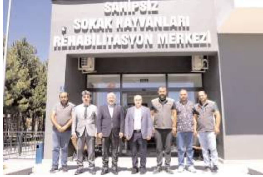
Ziyaretin sonunda hatıra fotoğrafı çekinildi.