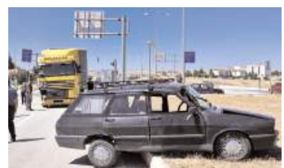
Kaza, Alaca Emniyet kavşağında meydana geldi.