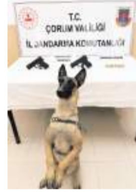
Bomba Arama Köpeği 'Arşiv'