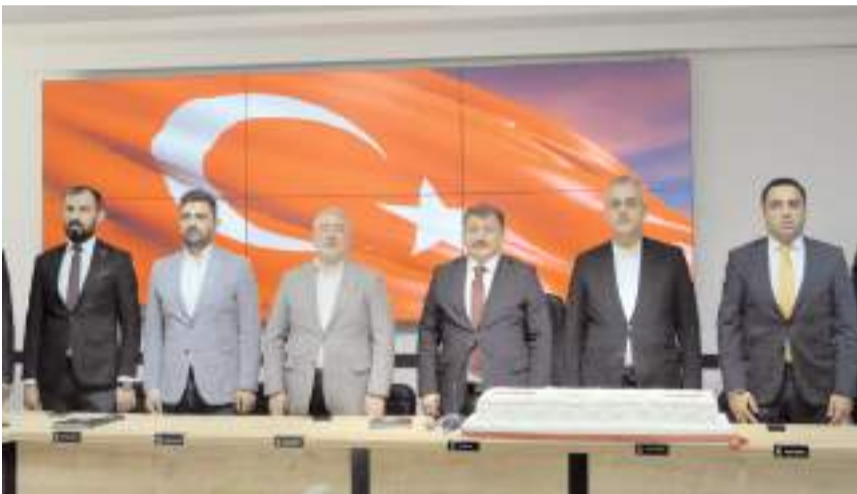
AK Parti'nin 23. kuruluş yıl dönümü nedeniyle İl Başkanlığı tarafından program düzenlendi.