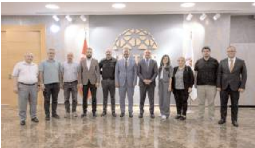
Ziyaretin anısına toplu fotoğraf çekinildi.