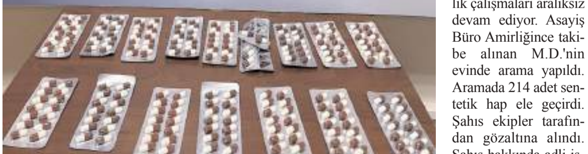
Operasyonda 214 adet sentetik hap ele geçirildi.

Edinilen bilgiye göre, İskilip İlçe Emniyet Müdürlüğü'nün zehir tacirlerine yönelik çalışmaları aralıksız devam ediyor. Asayiş Büro Amirliğince takibe alınan M.D.'nin evinde arama yapıldı. Aramada 214 adet sentetik hap ele geçirildi. Şahıs ekipler tarafından gözaltına alındı. Şahıs hakkında adli işlem başlatıldı. (İHA)