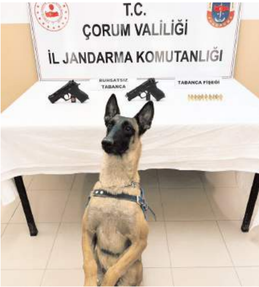
Bomba Arama Köpeği 'Arşiv'

Çorum İl Jandarma Komutanlığı emniyet ve asayiş ile kamu düzeninin korunmasına yönelik çalışmalarında köpekte kullanılıyor.