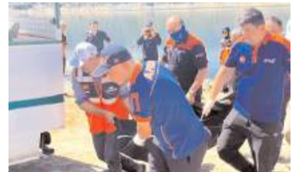
AFAD ekipleri yaşlı adamın cansız bedenini baraj gölünde buldu.