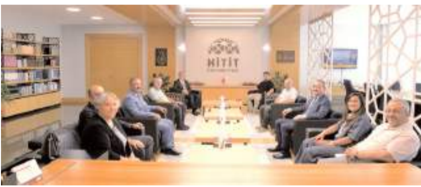
Ziyarette birlikte yapılabilecek etkinlikler istişare edildi.