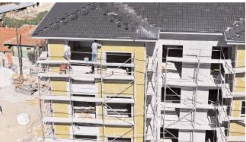
Okul inşaatı hızla devam ediyor.