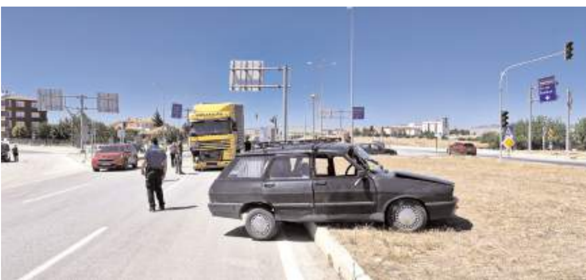
Kaza, Alaca Emniyet kavşağında meydana geldi.