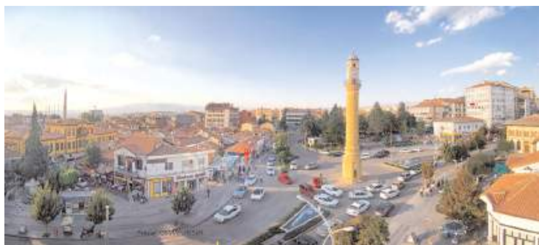
2023 yılında verdiğimiz göçten fazlasını aldık.

mümkün gözükmemektedir. Tarımı, çiftçiyi, üreticiyi ve üretimi ihmal etmek, topyekun toplumun geleceğini ihmal etmek anlamı taşır. Acil olarak tedbir alamazsak, Çorum tarımının ve çiftçisinin geleceği tehlikededir." (Haber Merkezi)