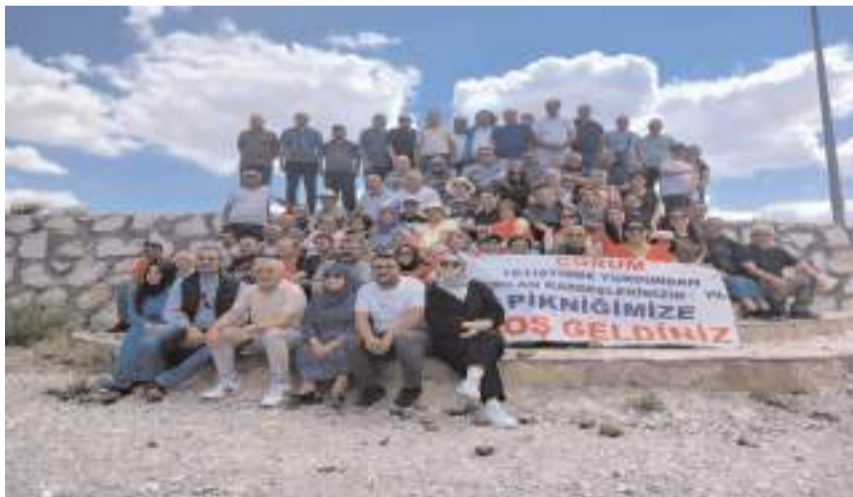
Programın sonunda toplu hatıra fotoğrafı çekildi.

■ Çorum Yetiştirme Yurdu'ndan ayrılanların geleneksel hale getirdiği pikniğin 6'ncısı geçtiğimiz pazar günü gerçekleşti. * HABERİ'8'DE