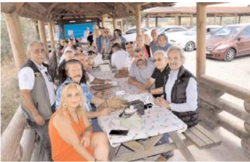
Pikniğe katılım yüksek oldu.