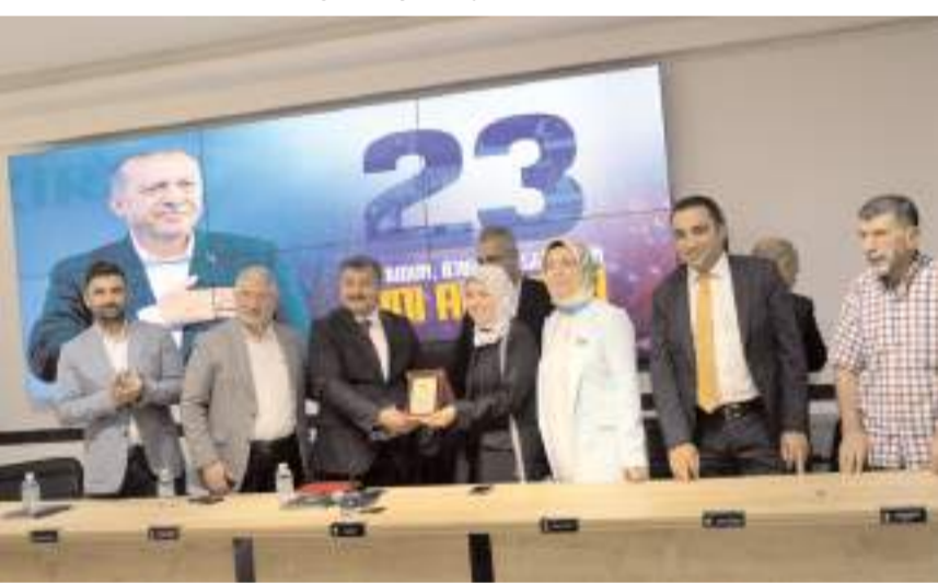
AK Parti'de geçmiş dönemde Gençlik Kolları ve Kadın Kolları Başkanlığı yapan isimlere hizmetlerinden dolayı plaket verildi.