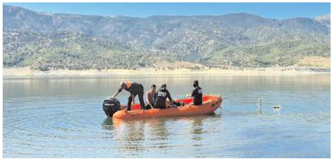
Olay Kargı'da Boyabat Barajı yakınlarında meydana geldi.

Konya İl Emniyet Müdürlüğü Narkotik Suçlarla Mücadele Şube Müdürlüğünce yapılan operasyonda 237 bin 16 adet uyuşturucu hap, 12 kilogram skunk ele geçirildi. 8 sokak satıcısı yakalandı. Operasyonları gerçekleştiren kahraman polislerimize ve Edirne Gümrük Muhafaza ekiplerimize tebrik ediyorum." (İHA)