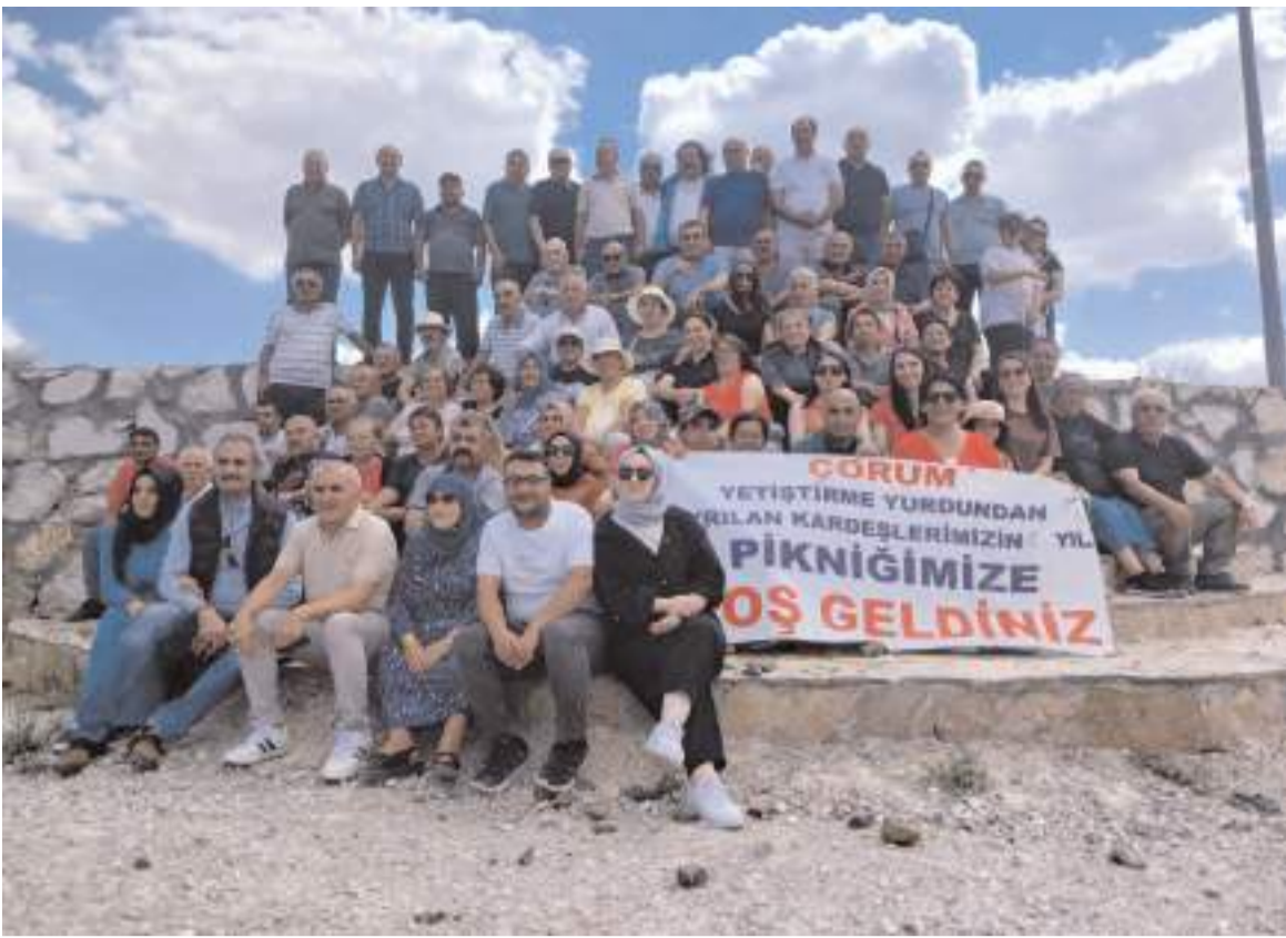
Programın sonunda toplu hatıra fotoğrafı çekildi.