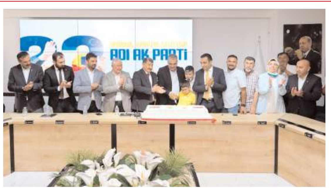
AK Parti'nin 23. kuruluş yıl dönümü nedeniyle yaş pasta kesildi.