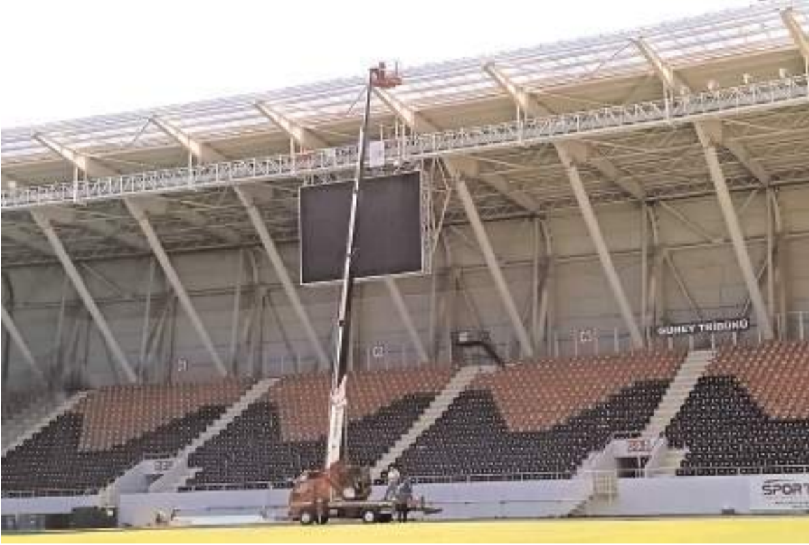
Stadyumun çatısındaki kısa bölümler uzatılarak tribünlerin yağmurdan etkilenmesi önlenmiştir.