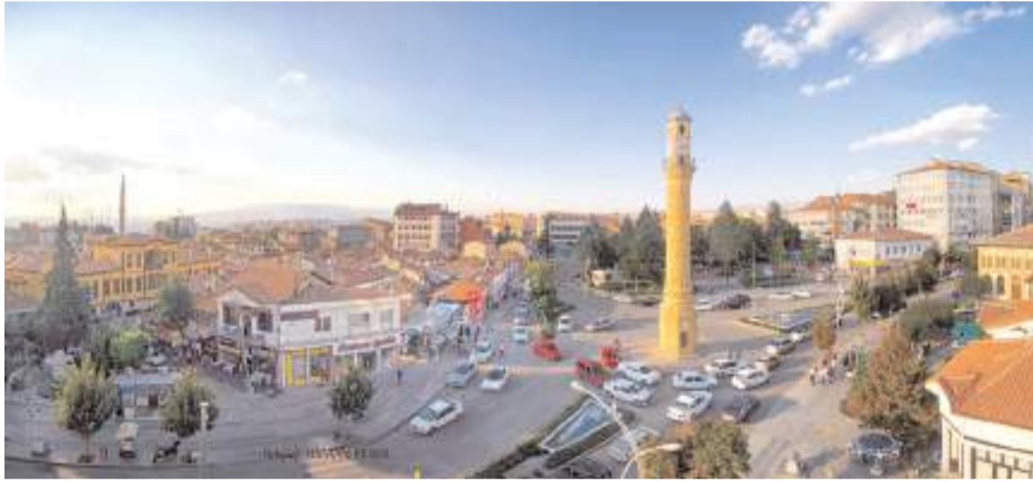
2023 yılında verdiğimiz göçten fazlasını aldık.