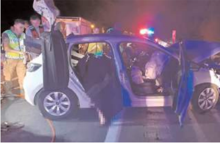
Kaza, Bitlis'in Günkırı beldesi mevkiinde meydana geldi.