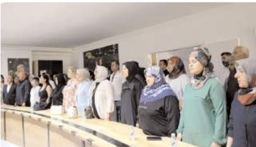
Programda çok sayıda partili katıldı.