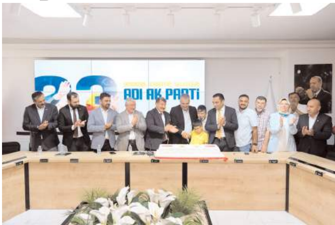
AK Parti'nin 23. kuruluş yıl dönümü nedeniyle yaş pasta kesildi.

Ayrıca, partide geçmiş dönemde Gençlik Kolları ve Kadın Kolları Başkanlığı yapan isimlere hizmetlerinden dolayı plaket verildi.