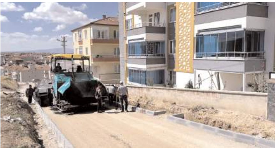
Mehmet Akif Ersoy ve Sülüklüevler Sokaklarda asfalt çalışması yapıldı.