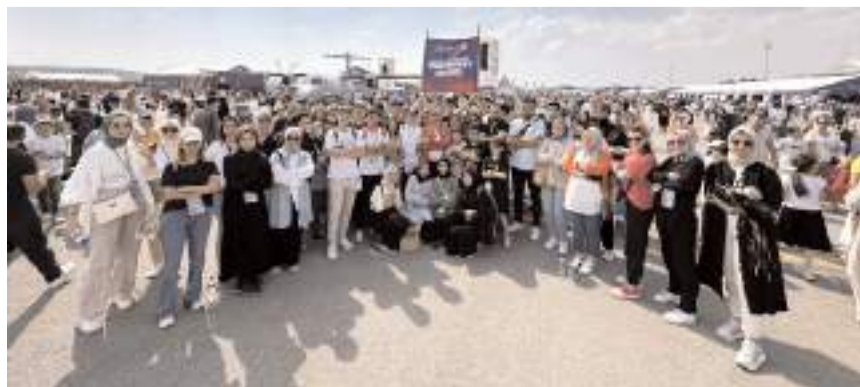
Yarışmanın finalleri Antalya Anfaş Uluslararası Fuar ve Kongre Merkezi'nde yapılacak.

■ TEKNOFEST Havacılık, Uzay ve Teknoloji Festivali'nde Çorum'u temsil eden 5 takım da finale kalmayı başardı.