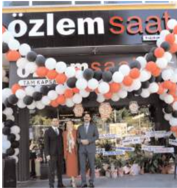
Özlem Saat Galerisi'nin Bahabey Şubesi, Pir Baba Parkı karşısında faaliyete başladı.