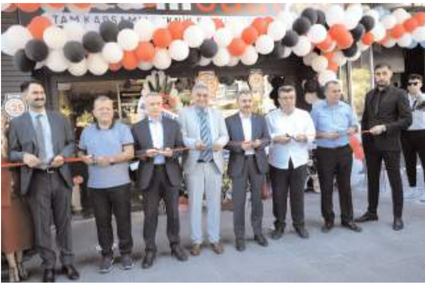
Özlem Saat Galerisi'nin Bahabey Şubesi yapılan törenle açıldı.