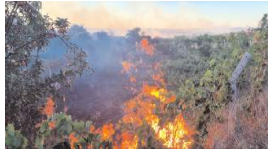
Yangın üzüm bağlarına da zarar verdi.

Yangın nedeniyle içinde ayçiçeği tarlası, üzüm bağları, ceviz bahçeleri ve hasat edilmiş buğday tarlalarının bulunduğu yaklaşık 3 bin 500 dekar tarım arazisi zarar gördü.(AA)