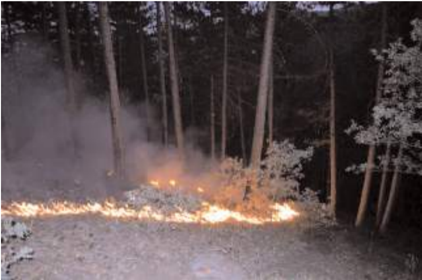
Yangın gece saatlerinde kontrol altına alındı.