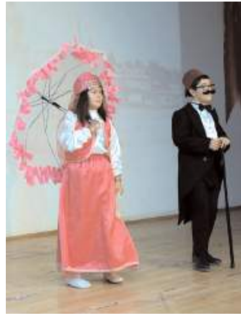
Öğrenciler birbirinden güzel gösteriler yaptılar.

Başkan Aşgın konuşmasında "Bizi en çok mutlu eden ve manen en çok haz aldığımız iş, Engelli Eğitim ve Rehabilitasyon Merkezi'mizdeki kardeşlerimizin kalbine dokunmak, yüreğine dokunmak, gönlüne dokunmaktır. Onların yüreğinde o muhabbeti hissetmek bizim için milyonlarca liralık yatırımlarımızdan çok daha kıymetli, çok daha önemlidir" dedi. (Haber Merkezi)