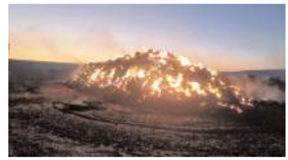
Anız yangını, yaklaşık 3 bin 500 dekar tarım alanında zarara neden oldu.