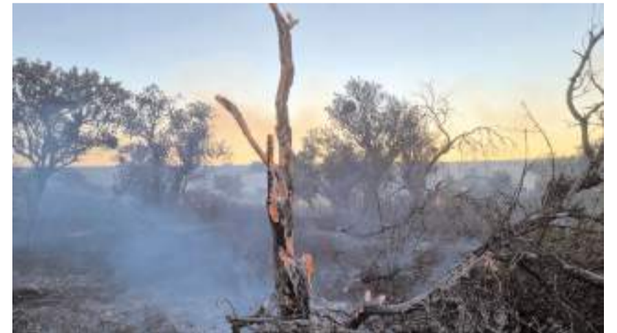
Yangında ekili araziler zarar gördü.