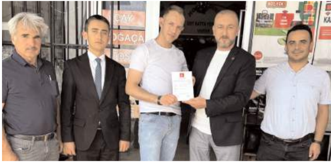
Yeniden Refah Partisi Sanayi Sitesi'nde esnaf ziyareti gerçekleştirildi.