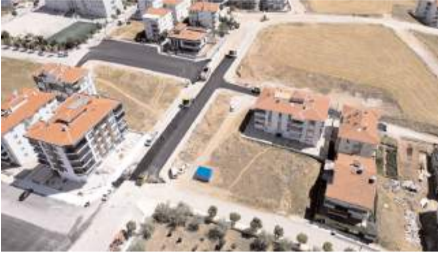
Belediye Bahçelievler Mahallesi'nde sıcak asfalt çalışması başlattı.

Yeni yerleşim alanlarının oluştuğu Sülüklüevler 16.Sokak, Sülüklüevler 20. Sokak, Mehmet Akif Ersoy 37. Sokak ve Mehmet Akif Ersoy 2.Cadde de alt yapı çalışmalarının ardından 500 metre uzunluğunda alana Bin 100 ton asfalt atıldı. Öte yandan sokakların kaldırım ve bordür çalışmaları da tamamlandı. (Haber Merkezi)