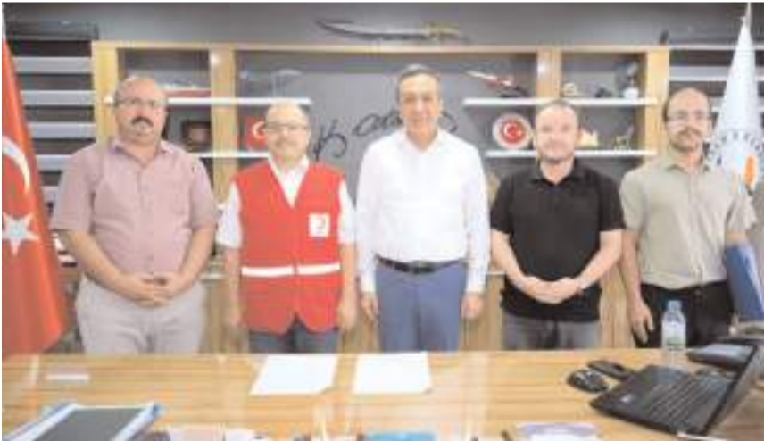
İmzaların atılmasının ardından hatıra fotoğrafı çekildi.