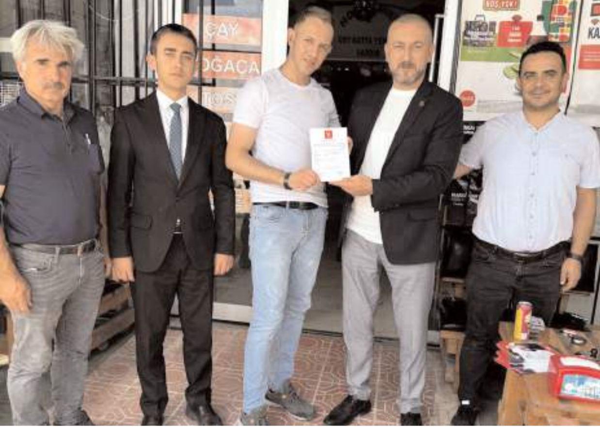
Yeniden Refah Partisi Sanayi Sitesi'nde esnaf ziyareti gerçekleştirdi.