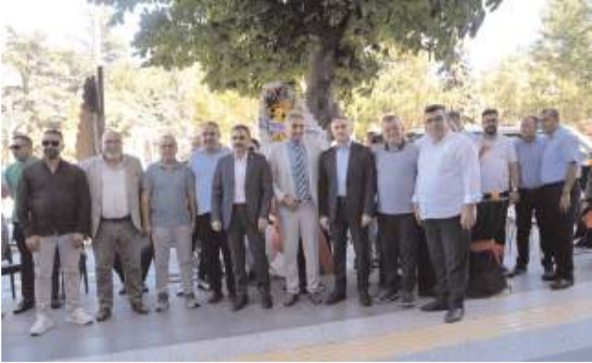
Açılış törenine çok sayıda davetli katıldı.