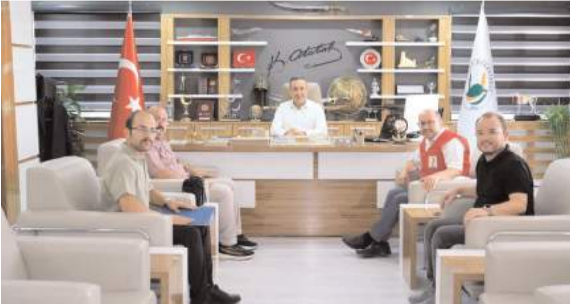
Sungurlu Belediyesi tarafından İlçenin belirlenen noktalarına kıyafet kumbaraları yerleştirilecek.