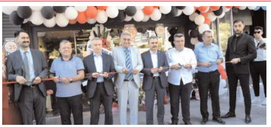
Özlem Saat Galerisi'nin Bahabey Şubesi yapılan törenle açıldı.