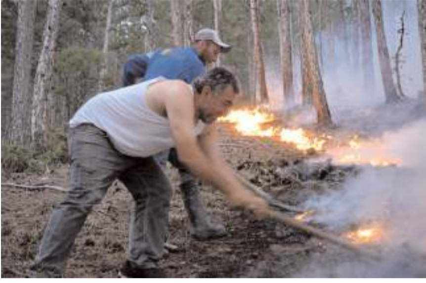
Yangın Alpagut köyü ile Gümüşkedi mevkindeki ormanlık alanda çıktı.