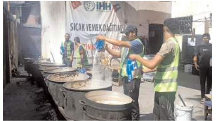
İHH, Gazze'de her gün 35 bine yakın kişiye sıcak yemek dağıtıyor.

İHH, Gazze'ye ulaştırılmak üzere 12 ambulans satın aldı. Bunların 9'u AFAD aracılığıyla Gazze'ye ulaştırılırken 3 ambulans Mısır'ın Ariş Limanı'nda bölgeye gitmeyi bekliyor. Vakıf, AFAD tarafından organize edilen 3 yardım