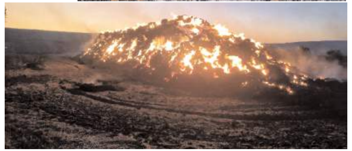
Anız yangını, yaklaşık 3 bin 500 dekar tarım alanında zarara neden oldu.