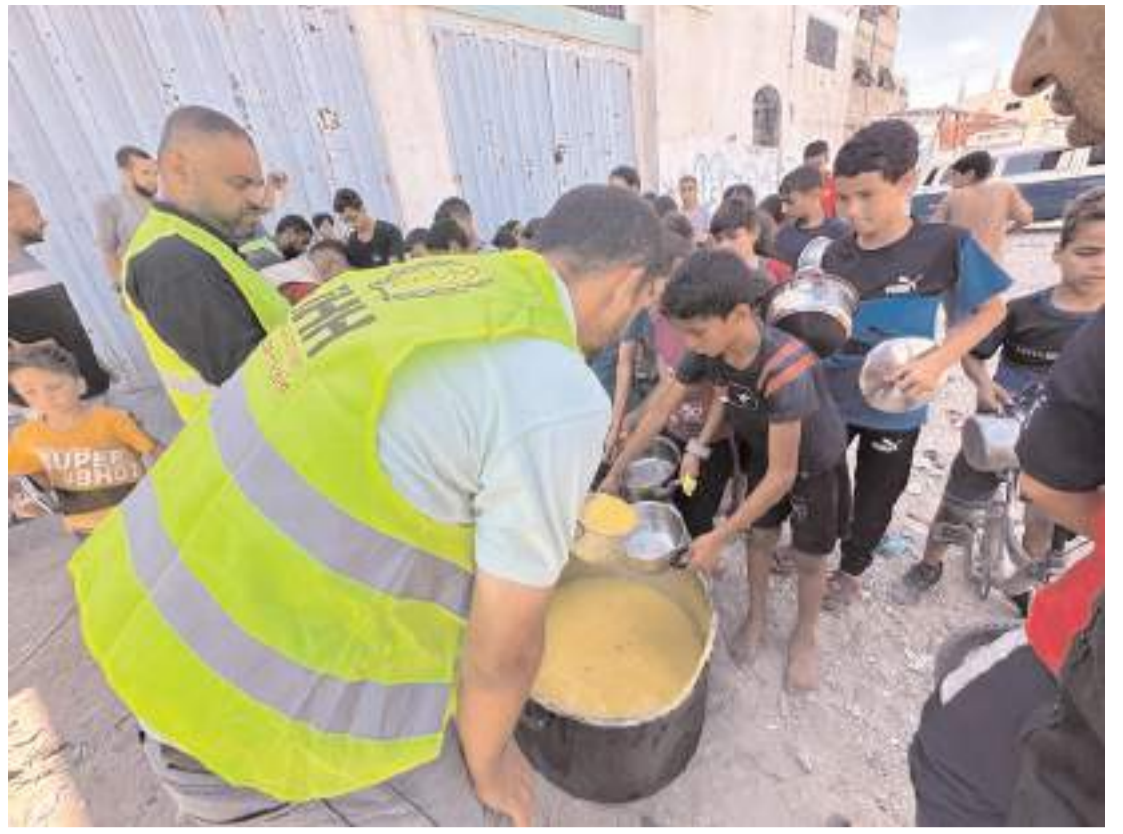
İHH İsrail'in saldırıları nedeniyle zor günler geçiren on binlerce Gazzeli'ye el uzatmaya devam ediyor.

Çeşitli ikramların ardından açılış programı sona erdi.