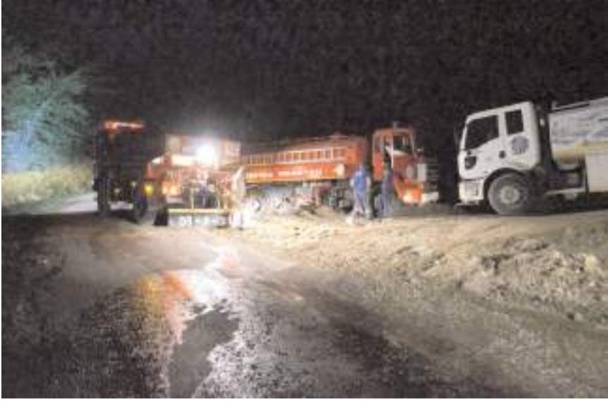
Yangına 70 personel ve 13 araçla müdahale edildi.