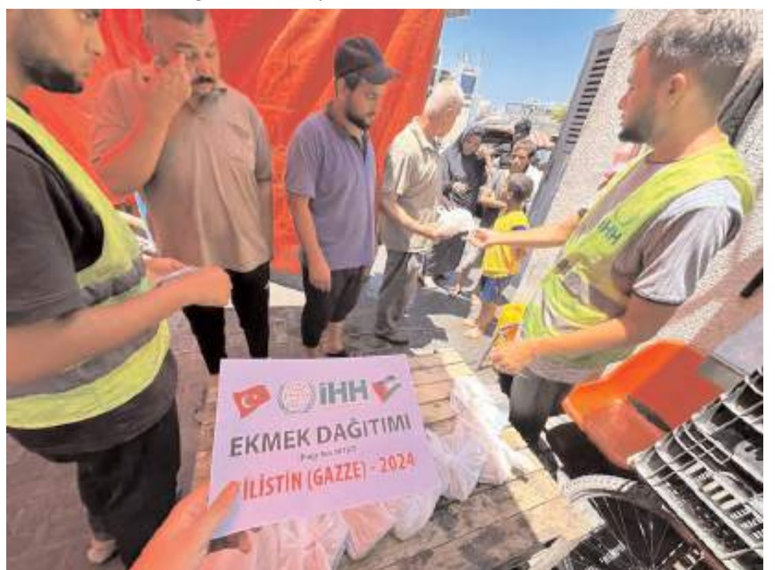
İHH, bölgede 7 Ekim'den bu yana 9 milyon 385 bin 902 ekmeğe dağıttı.

gemisi ve 1 yardım uçağına 41 tırlık insani yardım malzemesi desteği verdi. İHH ile "Kuwait Society for Relief" tarafından ortak hazırlanan insani yardım gemileriyle farklı kalemlerde 2 bin 650 tona yakın malzeme Gazze'ye ulaştırıldı. Ayrıca, İHH'nin gönderdiği, 2 bin 500 tona yakın yardım malzemesi taşıyan Anadolu Gemisi de Refah Sınır Kapısı'na ulaştı. Toplam 133 tırda oluşan yardımlar, Gazze'ye ulaştırılmak için sınırda bekliyor" ifadelerini kullandı. (Haber Merkezi)