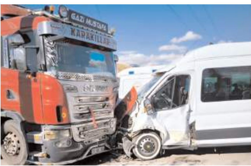
Kaza Çorum-Ankara kara yolunun 3'üncü kilometresinde meydana geldi.

Sağlık ekiplerince yapılan müdahalenin ardından Hitit Üniversitesi Erol Olçok Eğitim ve Araştırma Hastanesi ile kentte bulunan özel hastanelere kaldırılan yaralıların durumlarının iyi olduğu öğrenildi.(AA)