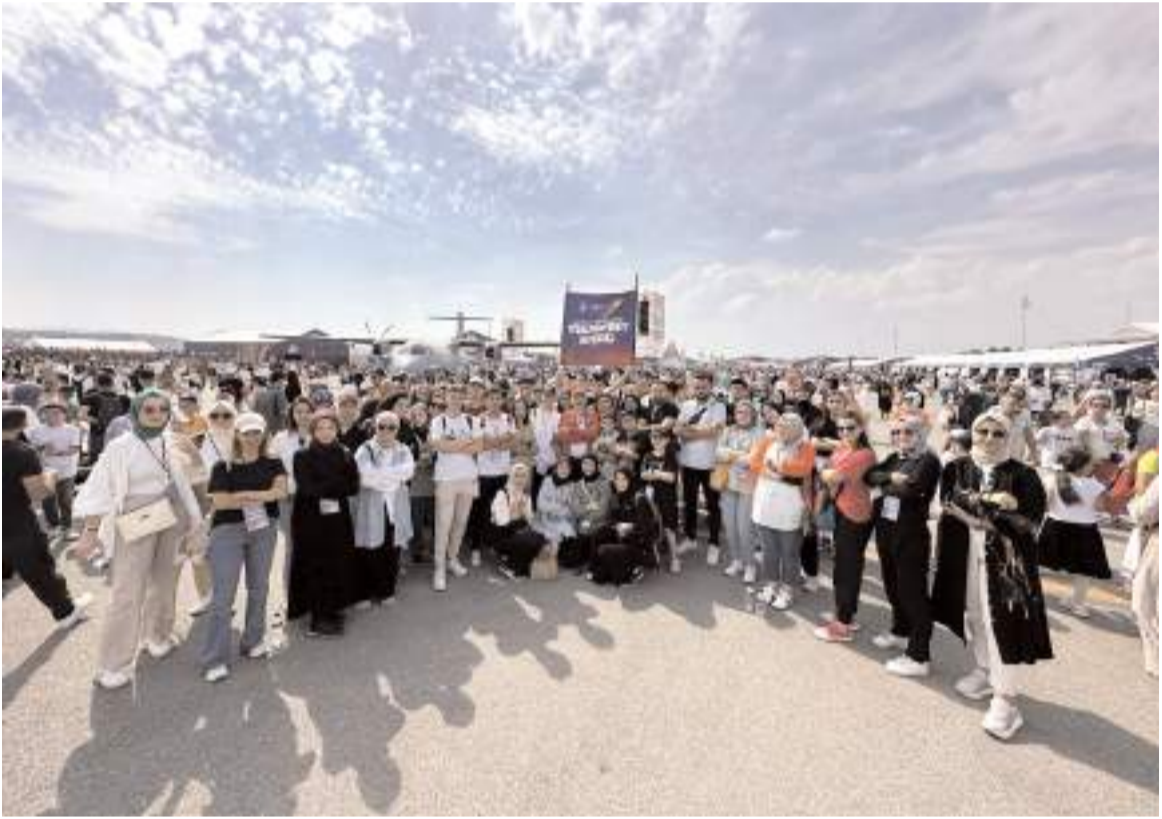
Yarışmanın finalleri Antalya Anfaş Uluslararası Fuar ve Kongre Merkezi'nde yapılacak.