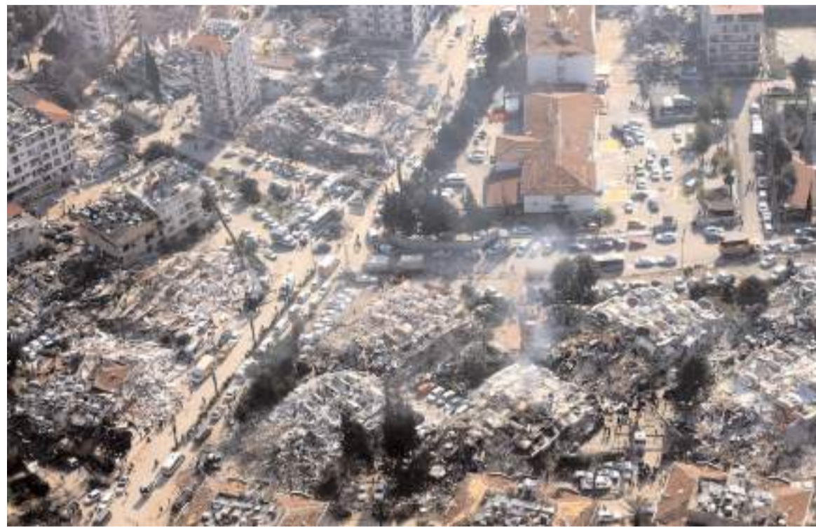
6 Şubat depremleri büyük bir yıkıma neden olurken binlerce insanda hayatını kaybetti.

2001 yılında çıkarılan 4708 sayılı Yapı Denetimi Hakkında Kanunla denetim hizmetinin kamusal niteliği yok sayılarak denetim hizmeti ticarileştirilmiştir. Öyle ki 2019 yılına kadar müteahhitlerin kendi denetim şirketlerini belirlediği bir sistem yürürlükte olmuş ve 18 yıl boyunca müteahhitler kendi yaptık-