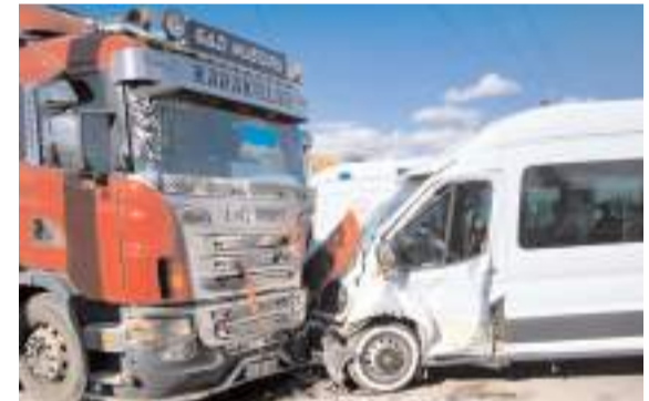
Kaza Çorum-Ankara kara yolunun 3'üncü kilometresinde meydana geldi.