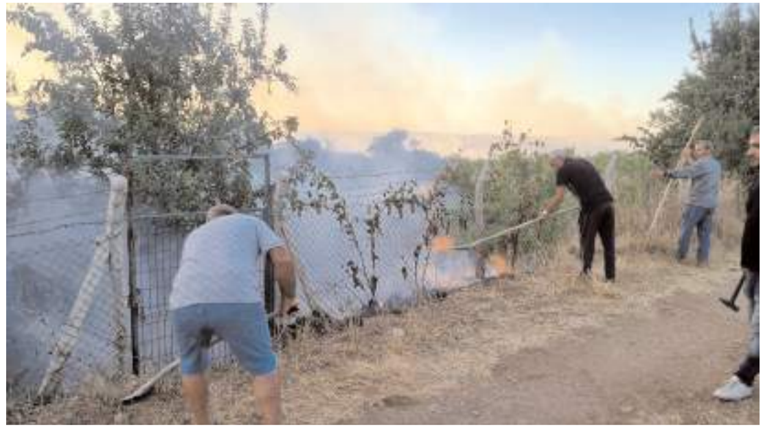
Anız yangını çevrede bulunan bahçelerde sıçradı.

Dodurga ilçesine bağlı Alpagut köyü yakınlarında dün ormanlık alanda yangın çıkması üzerine bölgeye ekipler sevk edilmişti.(AA)