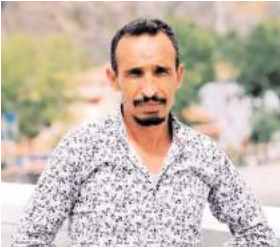
H.K.'nin hayatını kaybettiği belirlendi.