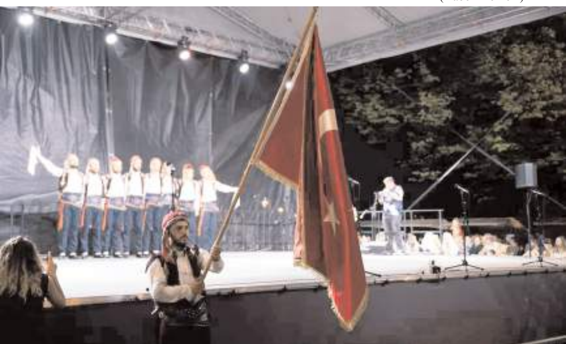
Çorum Belediyesi Halk Oyunları Topluluğu, festivalde gösteri yaptı.

Çorum Belediyesi Halk Oyunları Topluluğu, Macaristan'ın Mohaç Kasabası'nda düzenlenen 27. Uluslararası Halk Dansları Festivali'nde ülkemizi temsil etti.