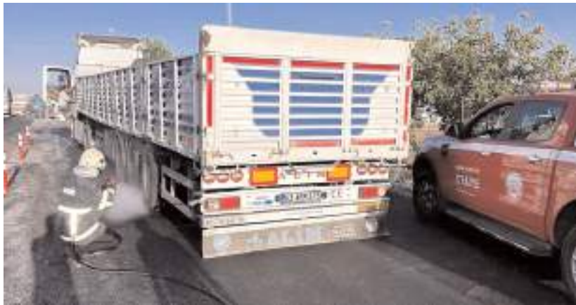
İtfaiye ekipleri yangını büyümeden söndürdü.

İzmir'in Karşıyaka ilçesindeki orman yangınlarına takviye olarak giden Çorum Belediyesi itfaiyesi, dönüştürme araç yangınına müdahale etti.