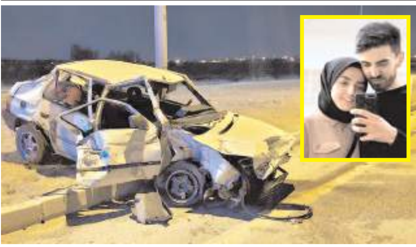
Kazada otomobil hurdaya döndü.