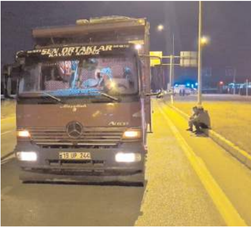
Kaza, Zile kavşağında meydana geldi.