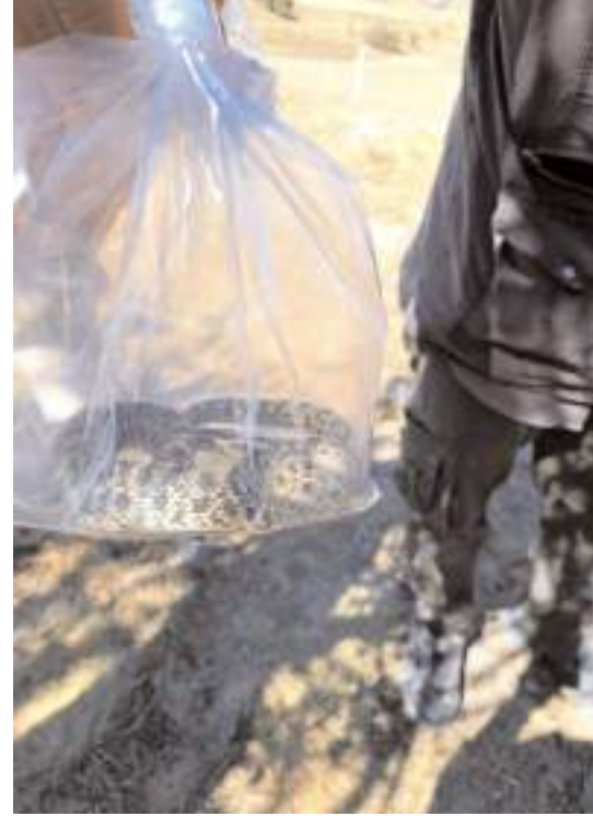
Yılan, ören yerinin dışında doğal yaşam alanına bırakıldı.

Yapılan kontrolde sağlık problemi olmadığı belirlenen yılan, ören yerinin dışında doğal yaşam alanına bırakıldı. (AA)