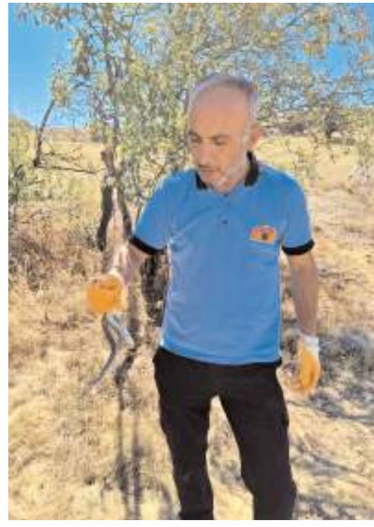
İtfaiye eri yılanı girdiği yerden uzun uğraşlar sonucu çıkarttı