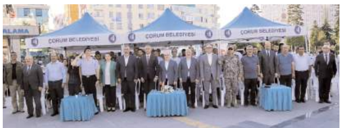
Program Çorum'da "Anıları Yaşat, Geleceğini Kazan" Projesi kapsamında yapıldı.

Planlama bölümünden mezun olmak. Görevinde tecrübeli olmak.