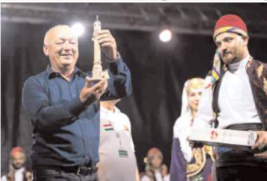
Yetkililere Çorum ile ilgili hediyeler verildi.