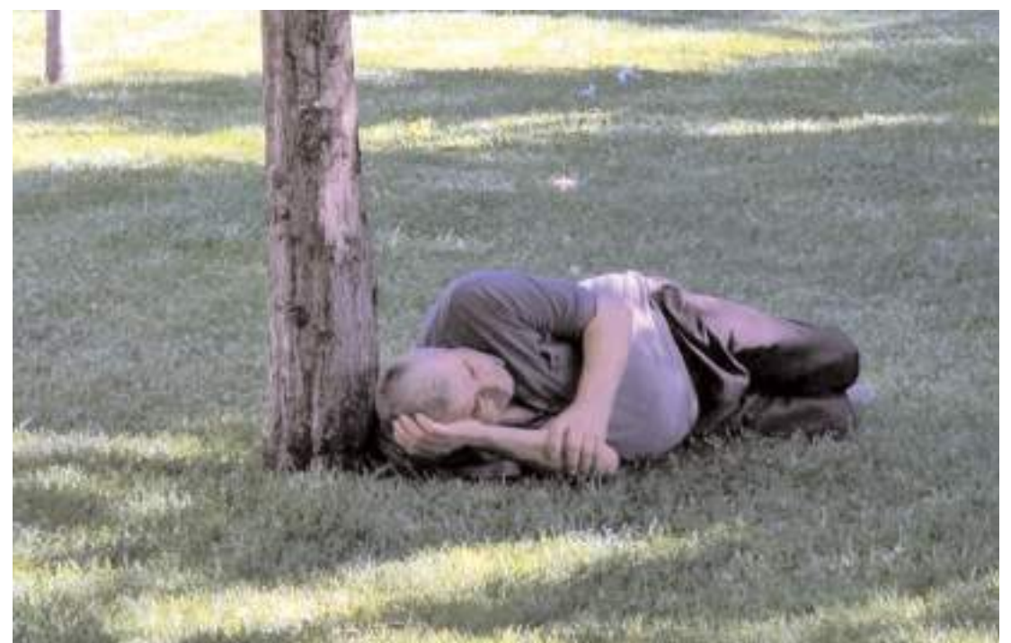
Sıcaktan bunalan vatandaşlar ağaç gölgelerinde serinlediler. (İHA)

yi gösterdi. Sıcak hava nedeniyle vatandaşlar gölgelik alanlara sığındı. Parklara akın eden vatandaşlar gölgelik alanlarda serinlemeye çalıştı. (İHA)