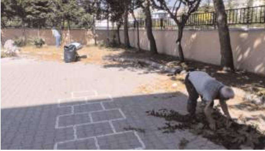
Okul bahçesinde bakım ve onarım çalıřması yapıldı.