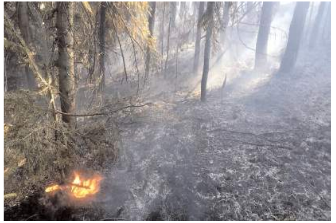
Yangın Ayrangölü mevkiinde çıktı.