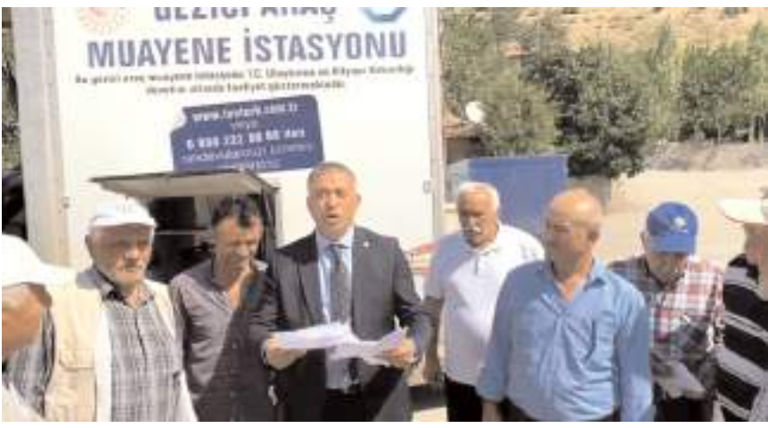
Milletvekili Mehmet Tahtasız, açıklamada bulundu.

Tahtasız'a araç muayene ve sigorta ücretlerinin yüksekliğinden dert yanan çiftçiler ise "Trafığe dahi çıkmayan traktörler için zorunlu trafik sigortası ücreti 600 lira oldu. Traktörümüze muayeneye götürüyoruz. Tekerlekleri ölçüyorlar. İncelmiş deyip geri gönderiyorlar. Bizim durumumuz olsa tekerlekleri zaten değiştiririz. Bir çift arka teker 30 bin lira olmuş. Ben çiftçilikten o kadar kazanıyorum mu ki değiştir, gel diyorlar" şeklinde açıklamalarda bulundular. (Haber Merkezi)