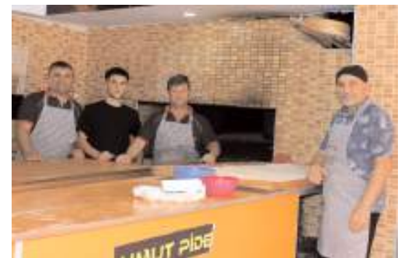
Umut Pide Salonu tecrübeli kadrosuyla hizmet veriyor.