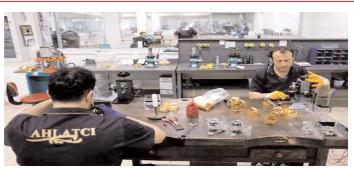
Mücevher sektöründe en fazla ihracat Birleşik Arap Emirlikleri, ABD, Irak, Libya ve Hong Kong'a yapıldı.