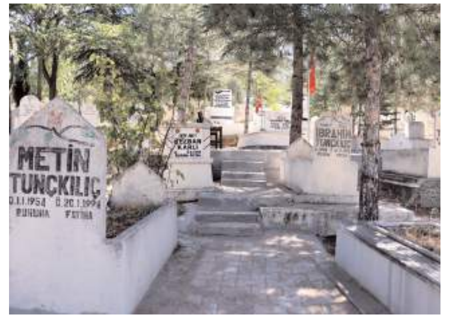
Çalıřmalar kapsamında bakım, onarım, peyzaj ve çevre dzenlemesi yapıldı.