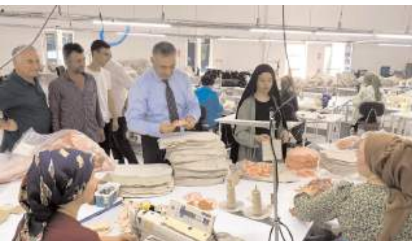
Milletvekili Mehmet Tahtasız, tekstil firmalarını ziyaret etti.

CHP Çorum Milletvekili Mehmet Tahtasız, 5. Yatırım ve Teşvik bölgesinde yer alan Çorum ve çevre illerin 6. Yatırım ve Teşvik Bölgesi'ne alınması gerektiğini söyledi. * HABERİ6'DA