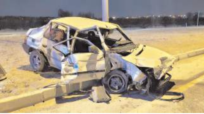
Kazada otomobil hurdaya döndü.