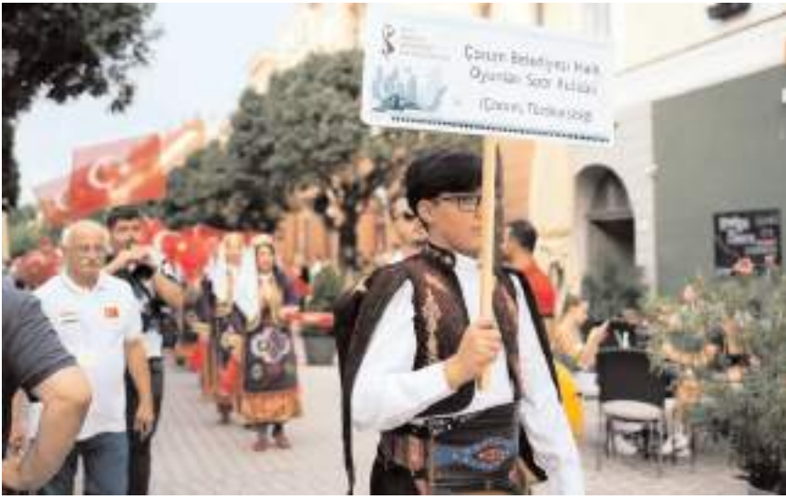
Festivalde geçit törenine katılan Çorum ekibi...