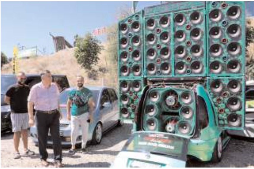
Festivalde birbirinden ilginç araçlar yer aldı.

Türkiye'nin çeşitli illerinden modifiye araç tutkunları Samsun'un Havza ilçesinde Havza Sanayi Clup tarafından bu yıl ilki düzenlenen Havza Auto Fest'te buluştu.