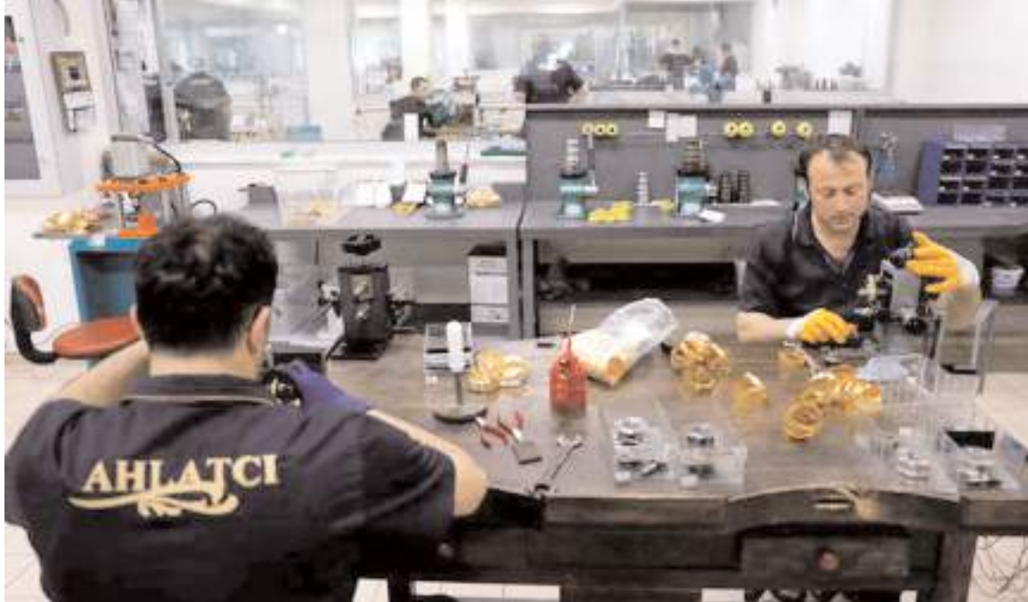
Mücevher sektöründe en fazla ihracat Birleşik Arap Emirlikleri, ABD, Irak, Libya ve Hong Kong'a yapıldı.

Geçen ay mücevher sektörünün toplam ihracat içerisindeki payı ise yüzde 4,2 olarak gerçek-