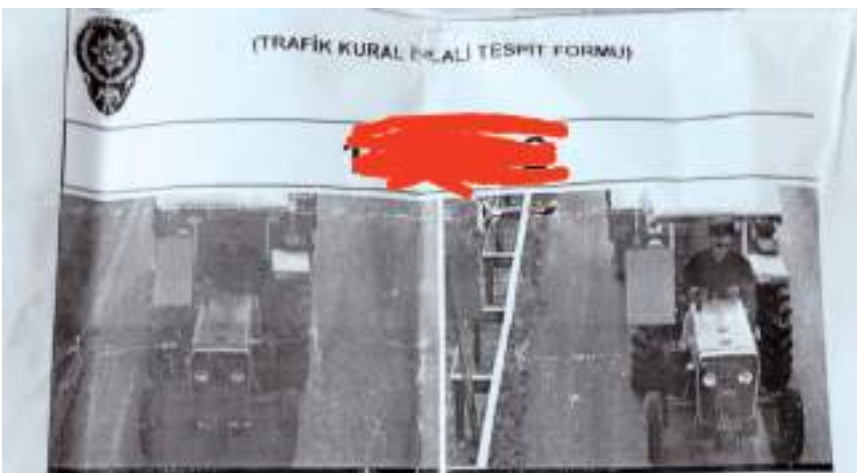
Traktör sürücüsü hız cezasını görünce şaşkına döndü.

3 bin 150 lira ceza işlemi eline ulaşan çiftçi, makbuzu incelediğinde traktörle radara yakalandığını ve ceza yazıldığını görünce şaşkına döndü. (Haber Merkezi)