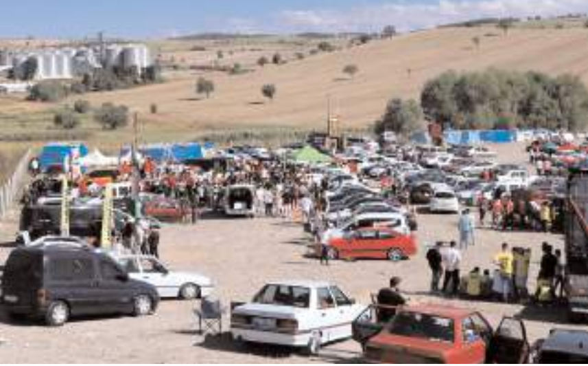
Etkinliğe ilgi yüksek oldu.