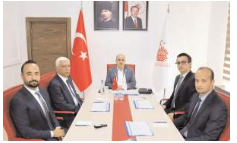
Toplantıda Vali Dağlı, Çorum'un acil sağlık hizmetlerinin mevcut durumu hakkında bilgiler aldı.

İlçelerde sunulan acil sağlık hizmetleri her ilçe özelinde vaka sayıları, ambulans sayıları, ulaşım süreleri ile ilgili mevcut durum hakkında da bilgi alan Vali Dağlı, Çorum'un afet potansiyelini de değerlendiren, UMKE biriminin ilde ve ülkede oluşabilecek afetlere hazırlıklarını ile ilgili bilgiler aldı.