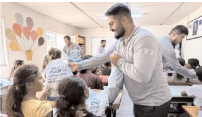
YEDAŞ, mevsimlik tarım işçilerinin çocuklarına özel hazırladığı hediye paketleriyle mutluluk dağıttı.

"Fındık hasadı dönemi, bölge ekonomisi için de büyük önem taşıyor. Gerek fındık hasadı kaynaklı gerekse il dışında yaşayan birçok gurbetçimizin bu dönemde bölgemize yoğun olarak göç etmesi sebebiyle elektrik tüketiminde önemli bir artış yaşanıyor. Bu kapsamda, artan enerji talebini karşılamak için biz de çalışmalarımızı sürdürüyoruz. Bölgede sağladığımız elektrik dağıtım hizmetinin kaliteli ve sürdürülebilir olması amacıyla bakım onarım çalışmalarımıza ağırlık veriyoruz. Kullanıcıların günlük yaşamını kolaylaştırmak için saha ekibimizle yoğun bir şekilde çalışıyoruz. Yaşanabilecek enerji kesintilerini önlemeyi ve yaşanan elektrik kesintilerinin sürelerini minimuma indirmeyi hedefliyoruz. Bölgemiz için çok kıymetli olan bu dönemde, artan enerji taleplerinde önlemlerimizi alırken toplumsal sosyal sorumluluklarımızı da unutmuyoruz. YEDAŞ olarak, müşteri memnuniyetini her daim ileriye taşımaya devam edeceğiz." (İHA)