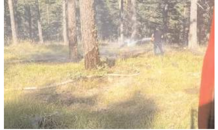
Yangın büyümeden ekipler tarafından söndürüldü.

Yangında 1 hektarlık alan zarar görürken ekiplerin söğütme çalışmaları devam ediyor. (İHA)