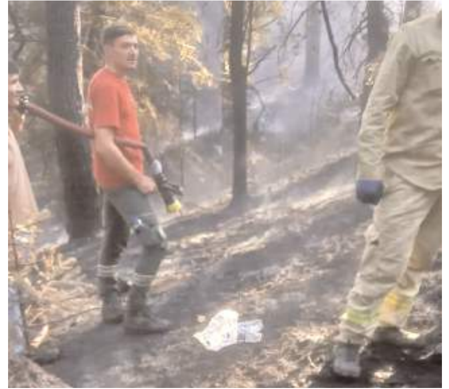
Ekipler yangının büyümemesi için büyük çaba harcadı.