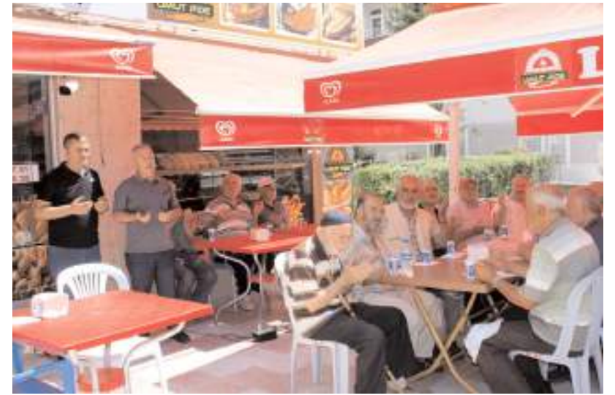
Yapılan duanın ardından işletme faaliyete başladı.