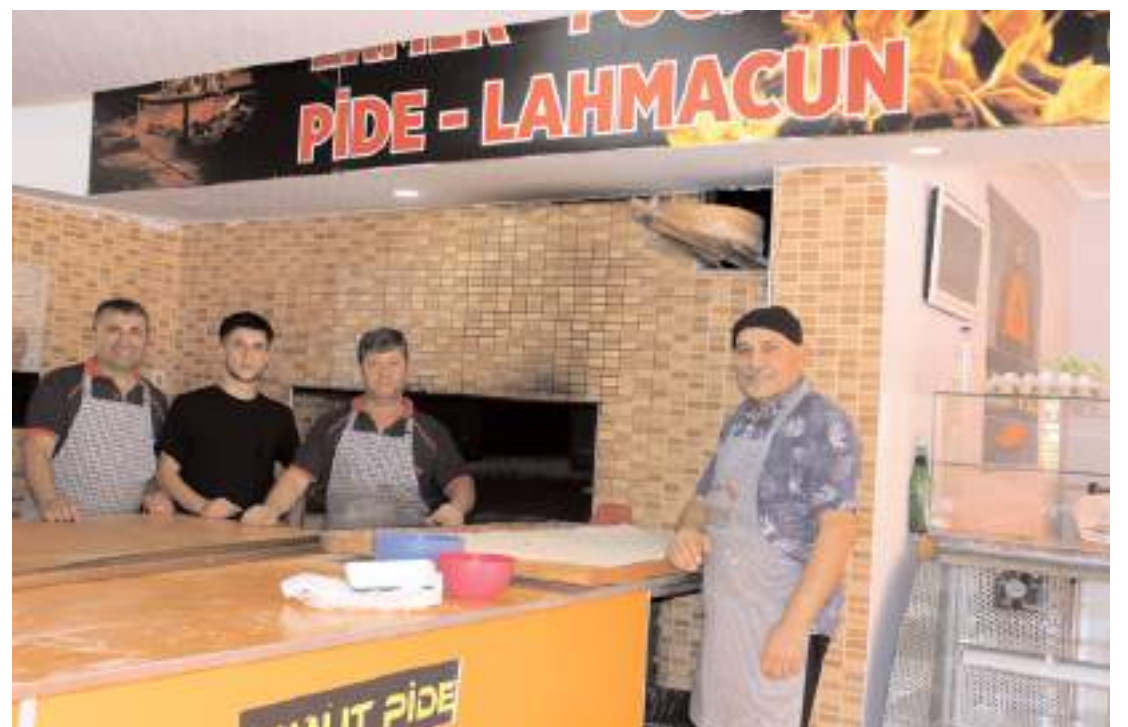
İşletmede pide çeşitlerinin yanı sıra lahmacun da yapılıyor.