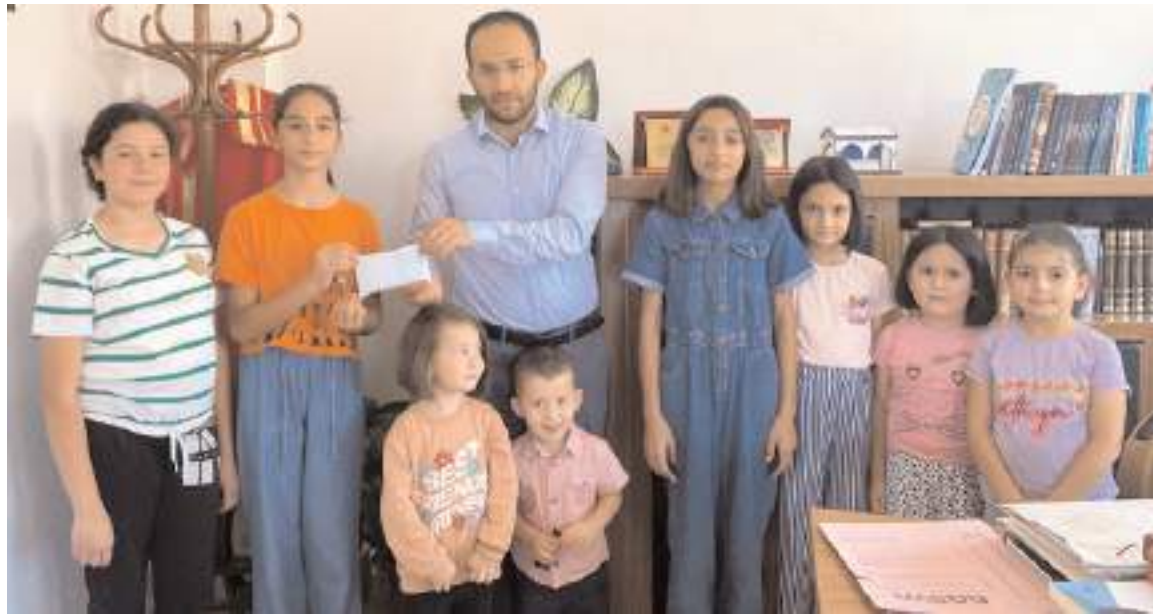
Çocuklar limonata satarak kazandıkları parayı Filistinli çocuklara ulaştırılmak üzere Ortaköy Müftüsü Sadık Saran'a teslim ettiler.