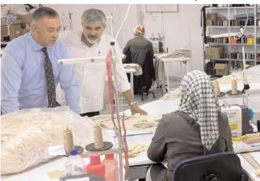
Milletvekili Mehmet Tahtasız, tekstil sektörünün sorun ve taleplerini dinledi.