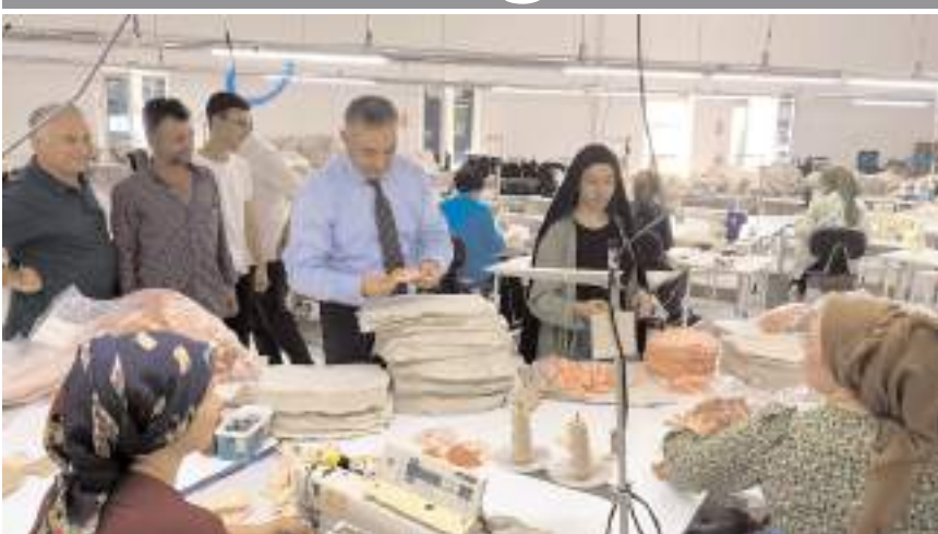
Milletvekili Mehmet Tahtasız, tekstil firmalarını ziyaret etti.