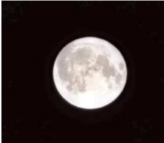
Çorum'da 'süper ay' çıplak gözle de görülebildi.