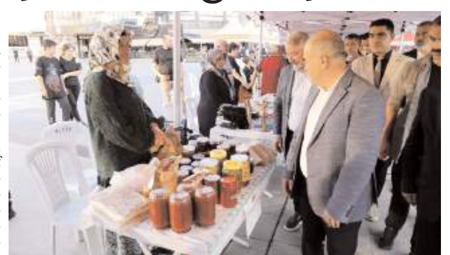
Protokol üyeleri stantları gezerek ürünleri inceledi.