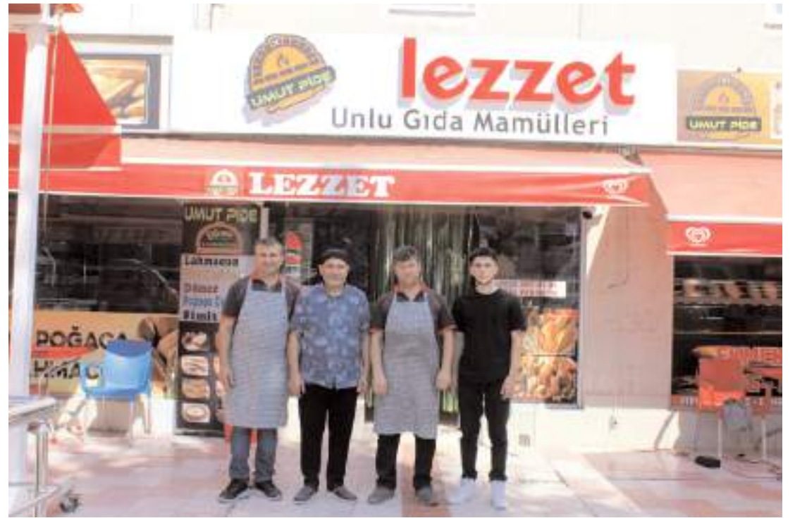
Umut Pide Salonu tecrübeli kadrosuyla hizmet veriyor.