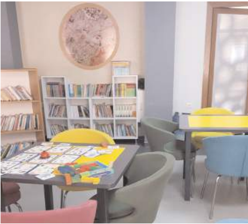
Yeni dnem ncesinde derslikler bakımdan geirildi.