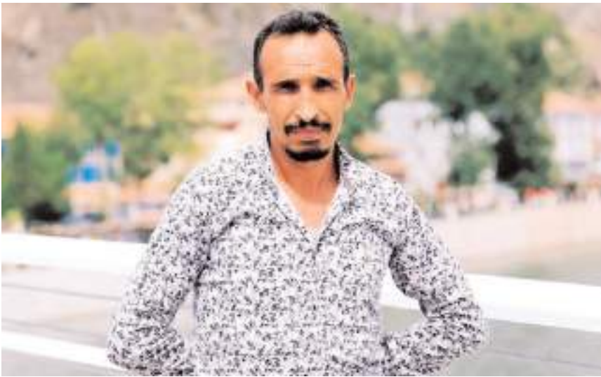
H.K.'nin hayatını kaybettiği belirlendi.

Sağlık ekiplerince yapılan kontrollerde, H.K.'nin hayatını kaybettiği belirlendi. Olay