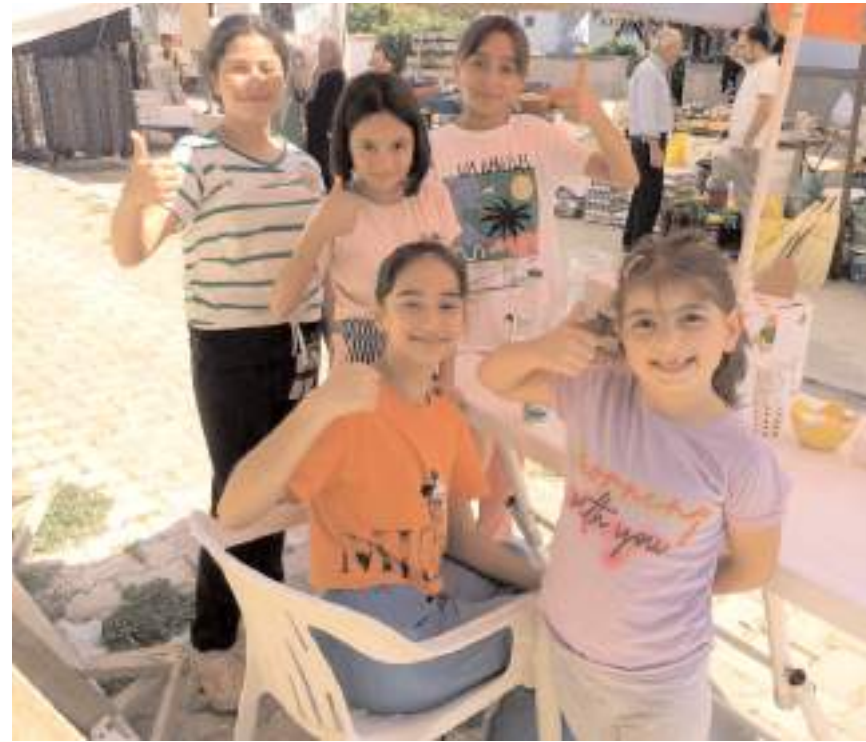
Çocuklar Ortaköy'de pazarda limonata sattılar.

Saran, duyarlılıklarından ötürü çocuklara teşekkür etti. (AA)