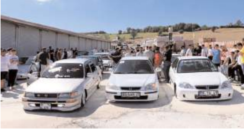
Etkinlik kapsamında, "desibel", "basıklık" ve "en güzel modifiye araç" kategorilerinde yarışlar yapıldı.