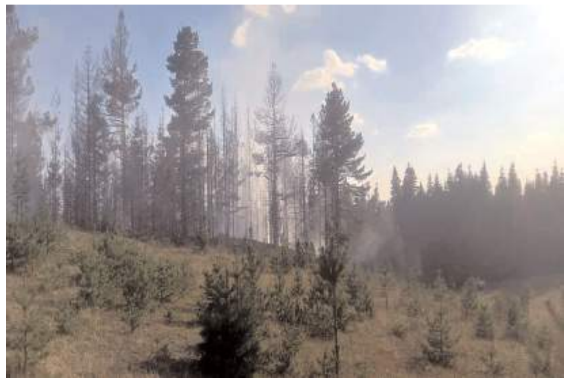
Yangında 1 hektarlık alan zarar gördü.