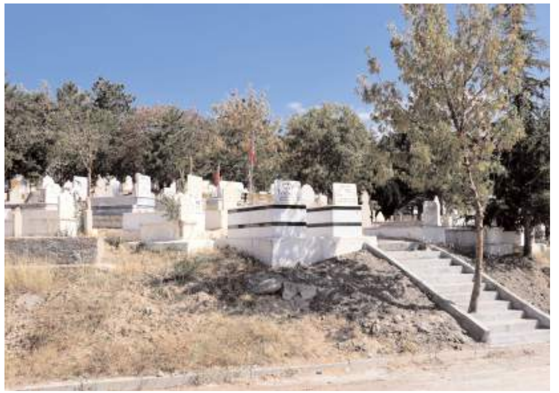
Sungurlu Belediyesi Őehitlerin kabirlerinde bakım ve onarım çalıřması yaptı.

Velilere gsterdikleri ilgi ve destek iin teřekkr eden Akkaya, đrencilerin hem akademik hem de sosyal aıdan geliřimini sađlamak iin hazır olduklarını belirterek, tm đrencileri drt gzle beklediklerini ifade etti.