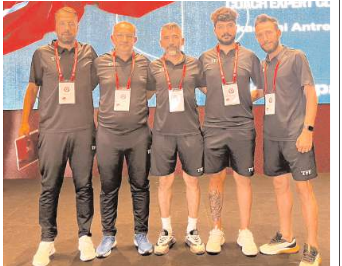
Seminerin ilk etabına katılan Çorum FK Teknik Direktörleri toplu halde gönüllüyor

Futbol Gelişim Ligi Direktörleri tarafından verilen seminerde futbolcu gelişimi, antrenman bilgisi ve diğer konularda teknik adamlara bilgilendirme yapıldı. Seminerin ikinci etabında Çorum FK alt yapısından dört isim daha katılacak.