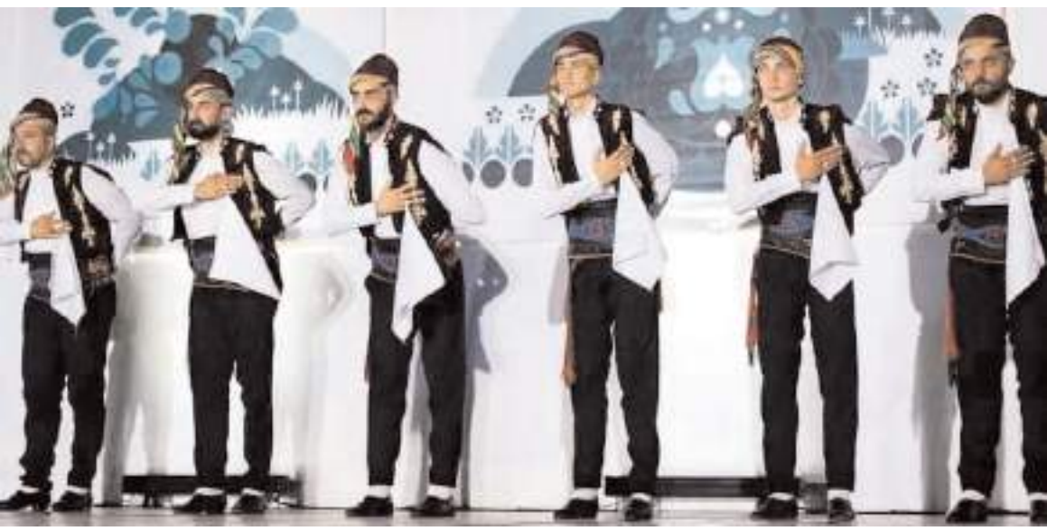
27. Uluslararası Halk Dansları Festivali Macaristan'ın Mohaç Kasabası'nda yapıldı.