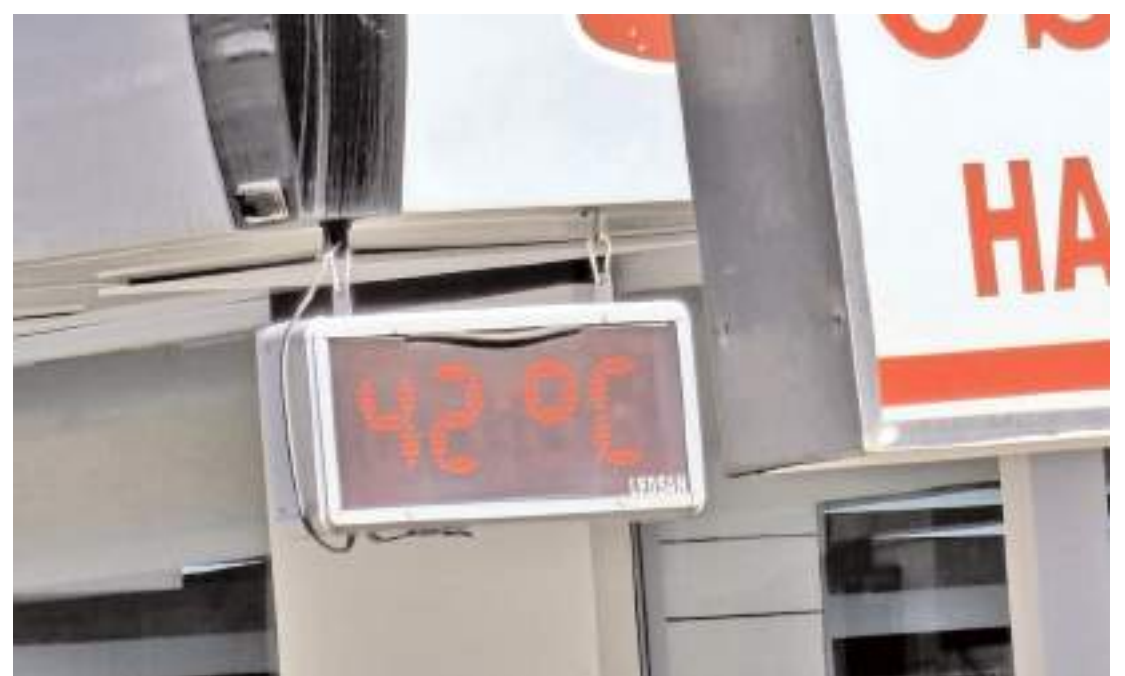
İlçede termometreler 42 dereceyi gösterdi.