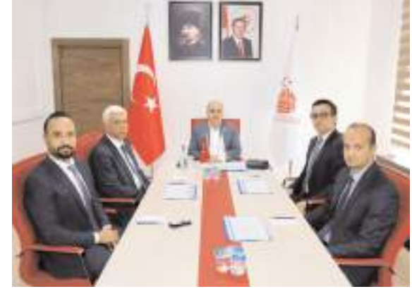
Toplantıda Vali Dağlı, Çorum'un acil hizmetlerinin mevcut durumu hakkında bilgiler aldı.