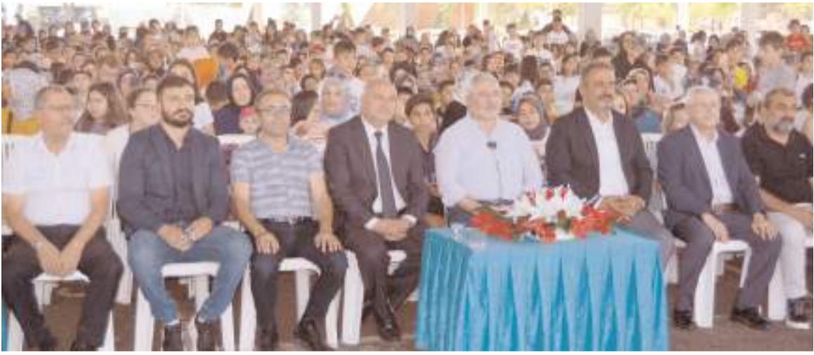
Çorum Belediyesi Yaz Spor Okulları kapanış törenine protokol üyeleri ve sporcu velileri büyük ilgi gösterdiler