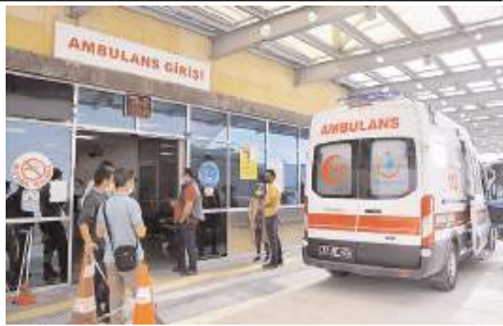
Yaralı kadın yoğun bakım ünitesinde tedavi altına alındı.

Kadının tedavisinin yoğun bakıma devam ettiği öğrenildi. (Haber Merkezi)