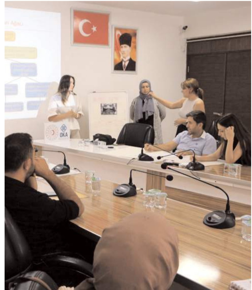
Eğitimi Orta Karadeniz Kalkınma Ajansı verdi.

Katılımcılar ile Sungurlu'nun ihtiyaçları, fırsatları ve gelişim alanlarının istişare edildiği eğitimde ekonomik, sosyal ve çevresel alanlarda yeni proje fikirleri geliştirmek için atölye çalışmaları da gerçekleştirildi.