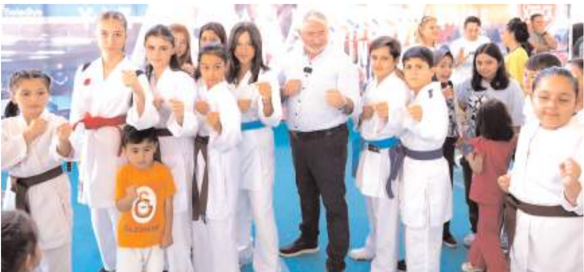
Taekwondo çalışmalarına katılan öğrenciler törende Belediye Başkanı Dr. Halil İbrahim Aşgın ile

En fazla sporcunun eğitim aldığı tesis ise Buhara Kültür Merkezi oldu. Fitnessde 333, Yüzme'de 318, Step Aerobikde 201, Buz pateninde 172, basketbolda 162, voleybolda 155, badmintonda 52 ve masa tenisinde ise 48 olmak üzere toplam 1570 sporcu bu tesisde yaz boyunca eğitim aldı.