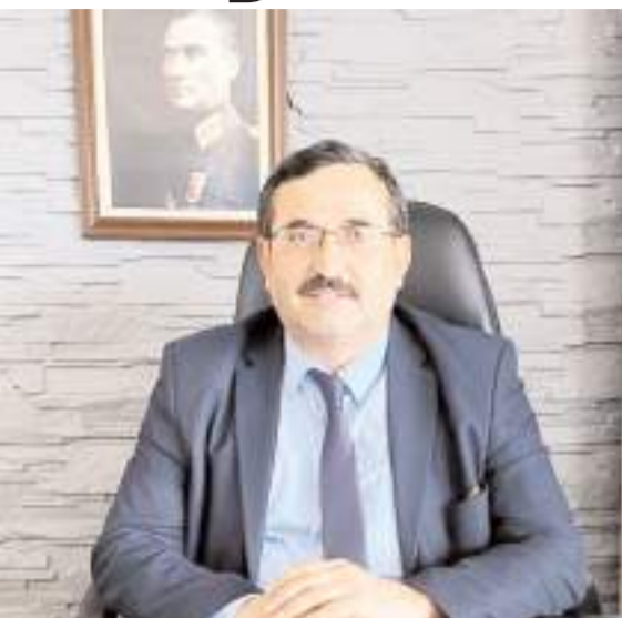
Ziraat Odası Başkanı Adem Özdemir

Ziraat Odası Başkanı Adem Özdemir, 2025 yılı Çiftçi Kayıt Sistemi'nin (ÇKS) 1 Eylül tarihinde başlayacağını belirterek, yapılacak tüm desteklerden yararlanmak için ÇKS'nin önemli olduğuna işaret etti.