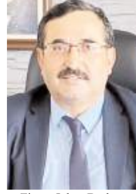
Ziraat Odası Başkanı Adem Özdemir