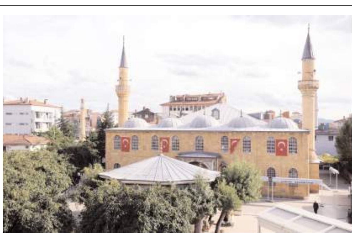
Ulu Caminin bahçesindeki ağaçlar cami temeline zarar verdiği için kesilecek.