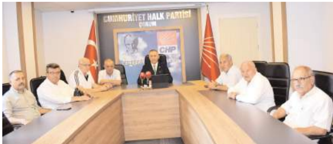
CHP Çorum Milletvekili Mehmet Tahtasız, basın toplantısı düzenledi.

Erol Olçok Eğitim ve Araştırma Hastanesinde Ameliyathane ve Yoğunbakım Ünitelerinin dezenfeksiyon ve sterilizasyon görevlisi 30 personel yılbaşında da işsiz kalmış ve nisan ayında yeniden görev başlamışlardı. 31 Ekim 2024 tarihinde sözleşme süresi dolacak olan aynı personeller şimdi de tasarruf tedbirleri gerekçe gösterilerek yine işsiz kalma riskiyle karşı karşıyalar. (Haber Merkezi)