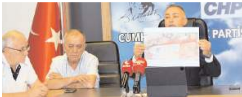
Cumhuriyet Halk Partisi (CHP) Çorum Milletvekili Mehmet Tahtasız, açıklamalarda bulundu.