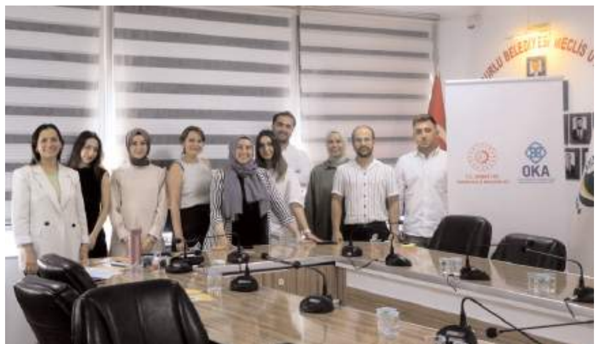
Eğitime 13 personel katıldı.

Eğitim, Sungurlu'nun kalkınmasına katkı sağlayacak proje fikirlerinin ortaya çıkmasından verimli geçti. (İHA)