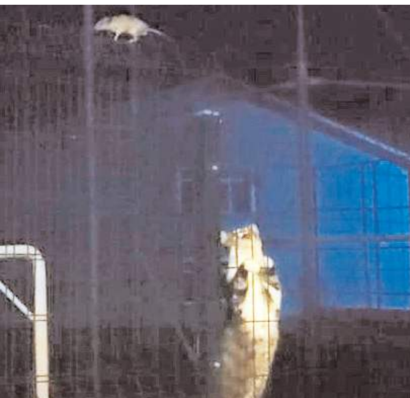
Kedi ile farenin kovalamacası ilginç görüntüler çıkarttı.

Çorum'un Sungurlu ilçesinde kedi ile farenin bir okulun bahçe duvarındaki tel örgü üzerindeki kovalamacası cep telefonu ile kaydedildi.