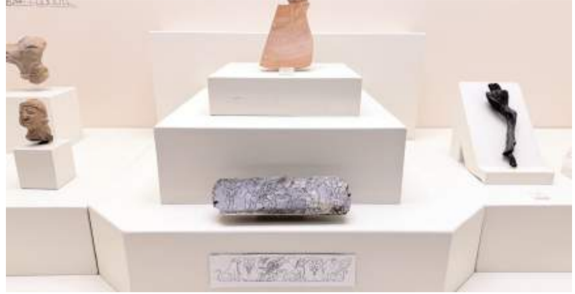
Süs eşyası 30 santimetre uzunluğa, 10 santimetre genişliğe sahip.

Eserin kısa sürede Boğazkale Müzesi'ne kazandırıldığını vurgulayan Schachner, eseri herkesle paylaşmak istediklerini sözlerine ekledi. (AA)