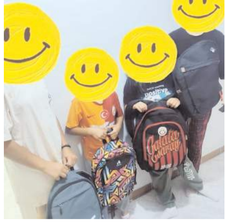
Öğrenciler ile aileleri hayırseverlere teşekkür ettiler.