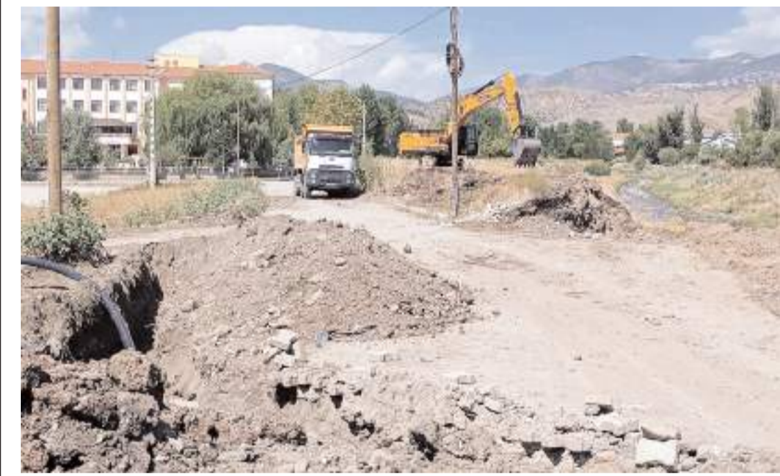
Proje kapsamında 5 kilometrelik çay yatağı ıslah edilecek.