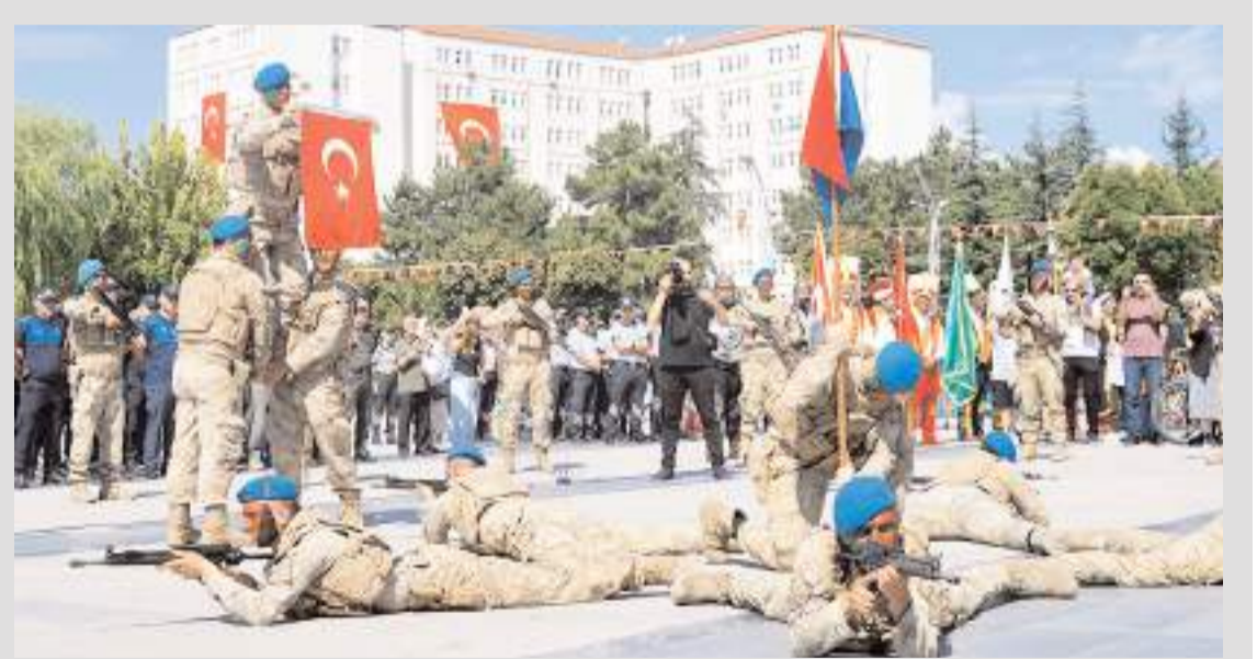
Askerlerin gösterisi büyük alkış aldı.