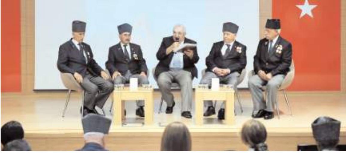
30 Ağustos Zafer Bayramı etkinlikleri kapsamında söyleşi düzenlendi.