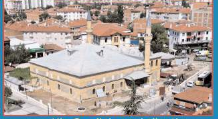
Ulu Cami'nin yeni silueti