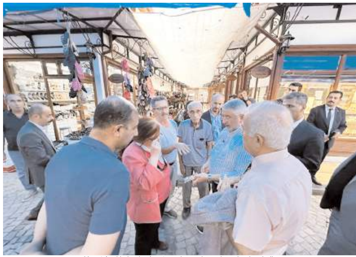
Heyet Ayakkabıcılar Arasında yapılan çalışmalarını inceledi.