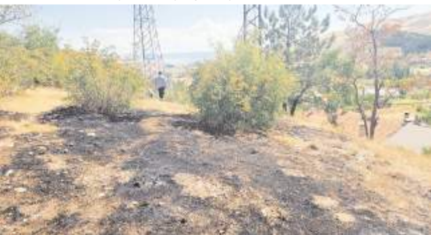
Yangın Yatukcu Mahallesi Osman Yıldırım Caddesi'ndeki ormanlık alanda çıktı.