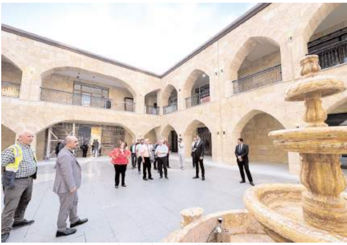
Kültür ve Turizm Bakanlığı Ankara Kültür Varlıklarını Koruma Bölge Kurulu heyeti Bedesten inşaatında incelemede bulundu.