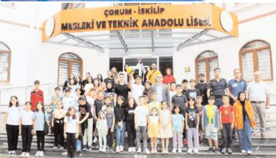
Törenin ardından günün anısına toplu fotoğraf çekildi.