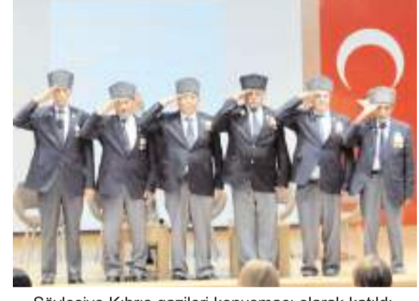
Söyleşiye Kıbrıs gazileri konuşmacı olarak katıldı.