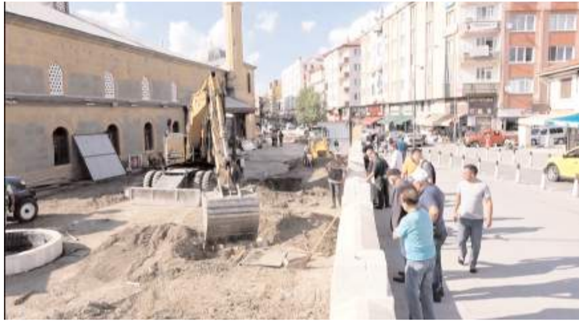
Vatandaşlar cami bahçesindeki ağaçların kesilmesine tepki gösterdi.

Ulu Camii bahçesinde bulunan tüm ağaçların kesilmesine tepki gösteren vatandaşlar, ağaçların binaya zarar veren belli bölümünün kesilebileceğini ancak tamamının kesilmesinin doğru olmadığını dile getirdiler.