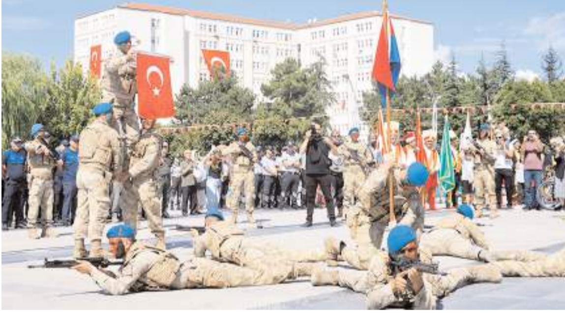
Askerlerin gösterisi büyük alkış aldı.