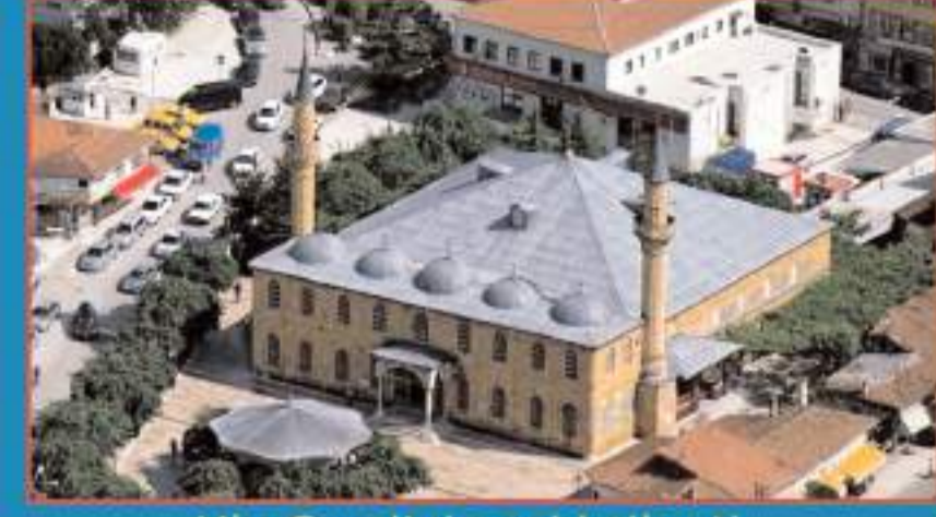
Ulu Cami'nin eski silueti

Vakıflar Genel Müdürlüğü Tokat Vakıflar Bölge Müdürlüğü'nün talebi ve Kültür ve Turizm Bakanlığı Ankara Kültür Varlıklarını Koruma Bölge Kurulu kararı doğrultusunda Çorum Belediyesi tarafından tarihi caminin bahçesindeki tüm ağaçlar kesildi. Cami bahçesinde bulunan tüm ağaçların kesilmesine tepki gösteren vatandaşlar, ağaçların binaya zarar veren belli bölümünün kesilebileceğini ancak tamamının kesilmesinin doğru olmadığını dile getirdiler. HABERİ 2'DE