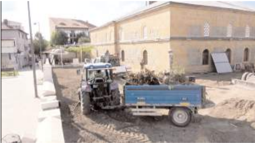
Caminin bahçesindeki tüm ağaçlar kesildi.