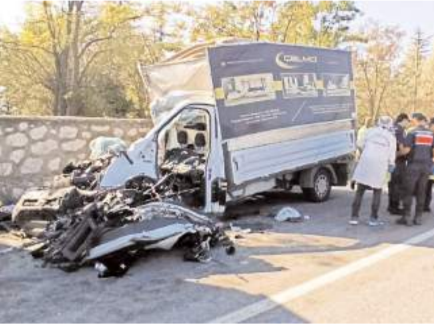
Kaza, Çorum-Sungurlu karayolu Organize Sanayi Kavşağı mevkiinde meydana geldi.

Çorum'da mobilya yüklü kamyonetin park halindeki tır dorsesine çarpması neticesinde meydana gelen trafik kazasında 3 kişi öldü.