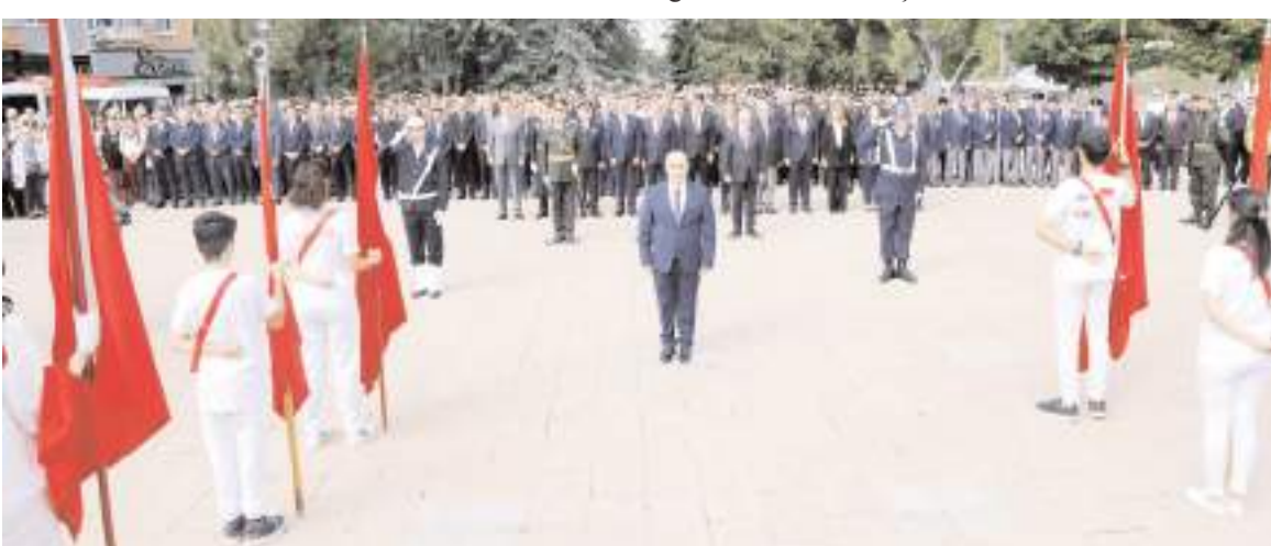
30 Ağustos Zafer Bayramı kapsamında ilk tören Atatürk Anıtında yapıldı.