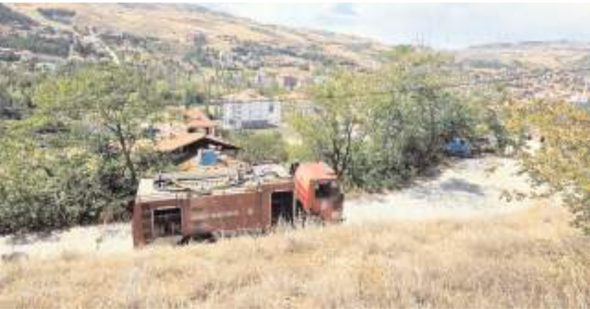
İtfaiye ekipleri yangını büyümeden söndürdü.

Çorum'un Bayat ilçesindeki ormanlık alanda çıkan yangın, itfaiye ve vatandaşların hızlı müdahalesiyle büyümeden söndürüldü. Yatukcu Mahallesi Osman Yıldırım Caddesi'ndeki ormanlık alanda, elektrik direklerinden çıkan kıvılcımlardan kaynaklandığı değerlendirilen yangın çıktı. İhbar üzerine bölgeye polis ve itfaiye ekipleri sevk edildi. Bayat Belediyesi itfaiye ekipleri, vatandaşların da yardımıyla yangını kısa sürede söndürdü. Hızlı müdahale sayesinde yangının, ikametlerin bulunduğu bölgeye yayılması önlenildi. Yangında yaklaşık yarım dekar alan zarar gördü. (AA)