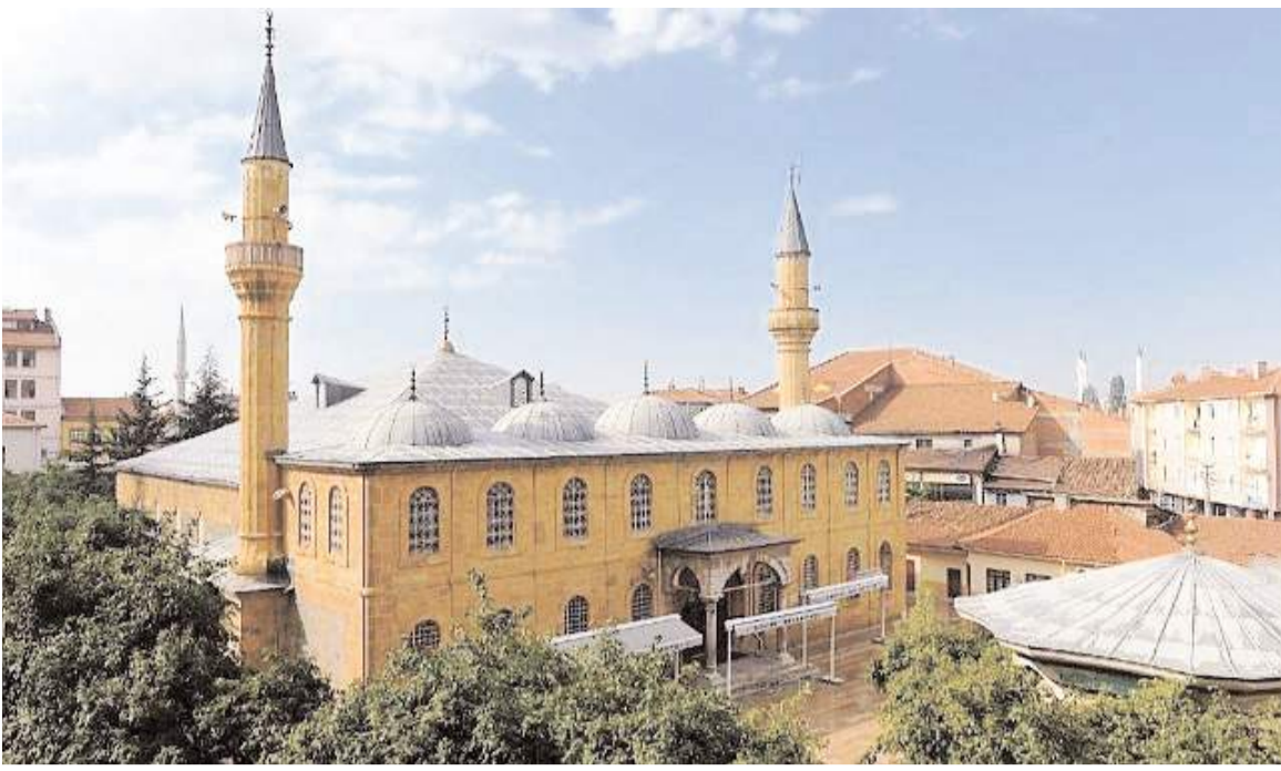
Ulu Caminin ağaçlar kesilmeden önceki hali.