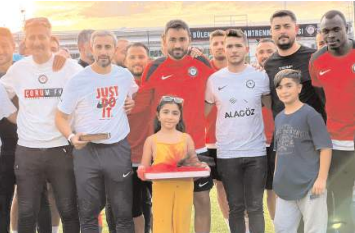
Çorum FK tribün liderleri antrenman ziyaretinde Teknik heyet ve futbolcularla tatlı ve kuruyemiş ikramında bulundu