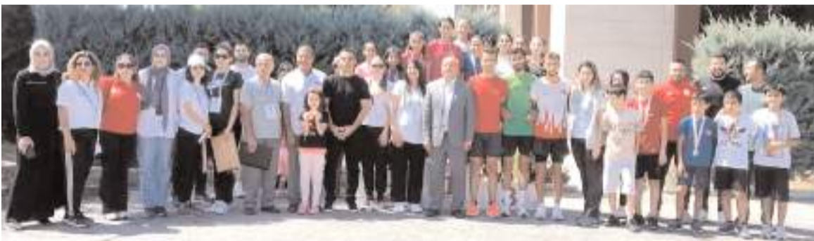
Büyük Zafer Koşusuna katılan ve dereceye giren sporcular ödül töreninde hakemler ve idareciler ile toplu halde