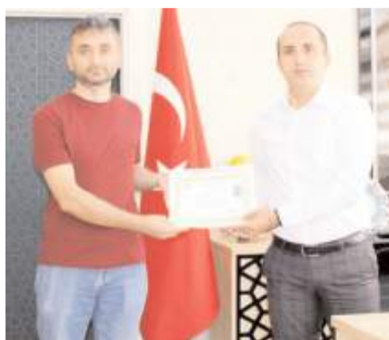
Uyuşturucu ve kaçak içki operasyonlarında başarılı olan polis memurlarına başarı belgesi verildi.