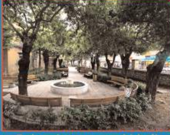
Bahçe kısmının eski hali