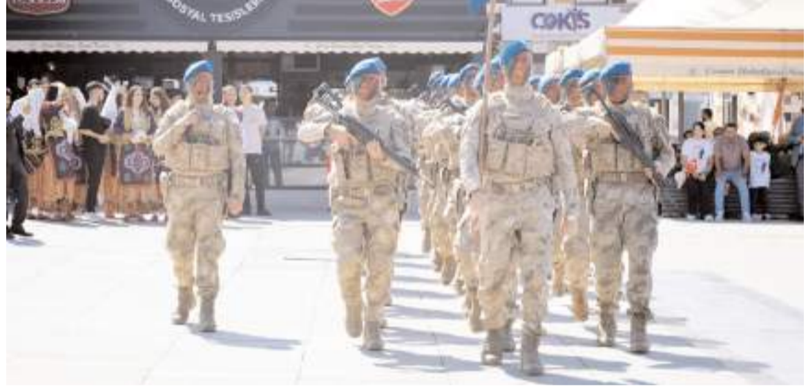
Törende İl Jandarma Komutanlığı askerleri geçit yaptı.