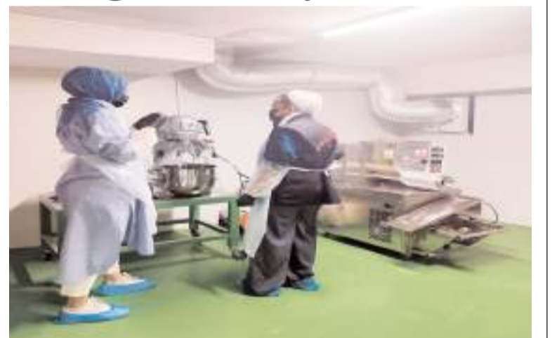
Denetimler sırasında mevzuata aykırı faaliyet gösteren işletmelere gerekli uyarılar yapılıyor ve yasal işlem uygulanıyor.

İl Tarım ve Orman Müdürlüğü, gıda güvenliği konusunda halkı bilinçlendirmek amacıyla çeşitli bilgilendirme faaliyetleri yürütürken, vatandaşların şüpheli gördükleri durumları Alo Gıda 174 hattına bildirmeleri için çağrıda bulunuldu. (Haber Merkezi)