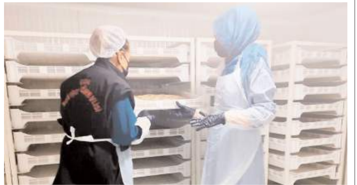
Çorum İl Tarım ve Orman Müdürlüğü, denetimlere devam ediyor.