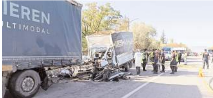
Kazada kamyonette bulunan 3 kişi hayatını kaybettiler.

■ ÇORUM'da mobilya yüklü kamyonetin park halindeki tır dorsesine çarpması neticesinde meydana gelen trafik kazasında 3 kişi hayatını kaybetti. * HABERİ 3'DE