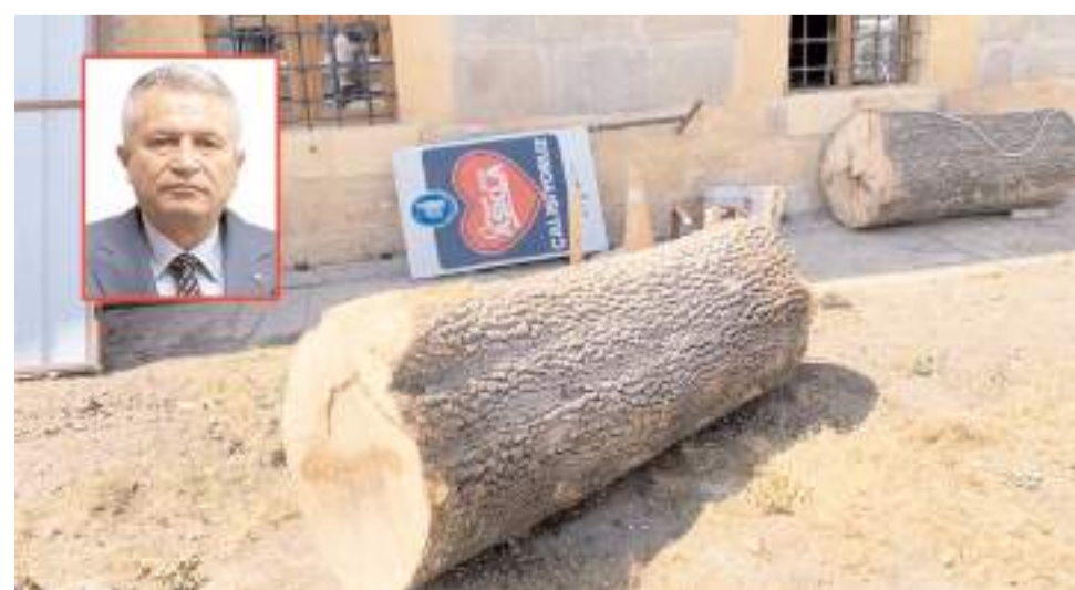
Zafer Partisi İl Başkanı Bedii Onan, ağaç kesimine tepki gösterdi.

"Taşı, binayı, çevreyi restore ettiniz. Tamam da ağacı da restore ettiniz. Bizim çocukluğumuzun döneminde var olan o güzelim ağaçlar dipten kesildi. Camii bahçesinde ağaç kalmadı. Batı kapısı tarafında asma ağacı vardı. İnşallah asma ağacını da kesmemişlerdir. Böyle bir restorasyon olmaz. Halkın kullandığı alan ve mekânları vatandaşa sormadan söküp, kesip dağıtmak nedir? Sizin dizayn ettiğiniz ortamı kabullemek zorunda mıyız? Restorasyon çalışmalarıyla bahçedeki bütün ağaçları kestiler.