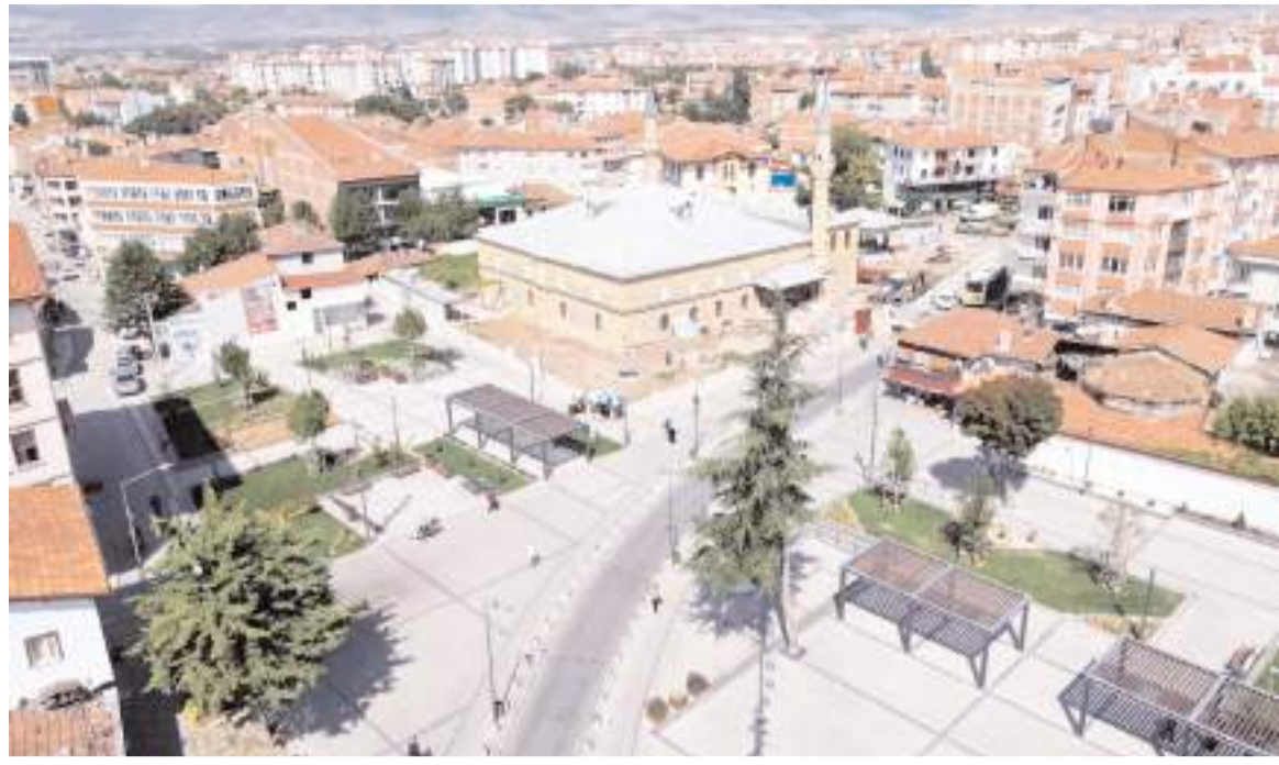
Ulu Caminin ağaçlar kesildikten sonraki hali.