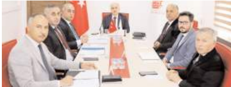
Toplantıda İbikçam Orman Parkının vatandaşların hizmetine sunulması için yapılması gereken çalışmalar istişare edildi.