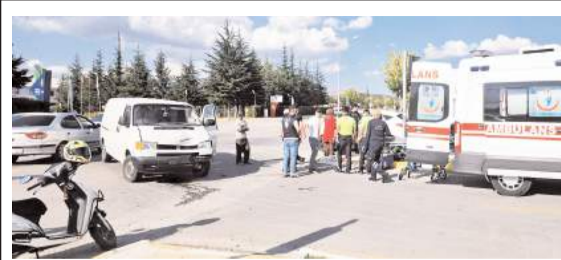
Kaza Gazi Caddesi Şehitlik kavşağında meydana geldi.