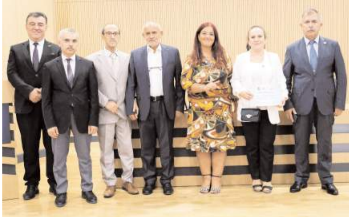
Eğitimin sonunda STK'ların temsilcilerine katılım belgeleri verildi.

Programın ardından katılım belgeleri takdim edildi. (Haber Merkezi)