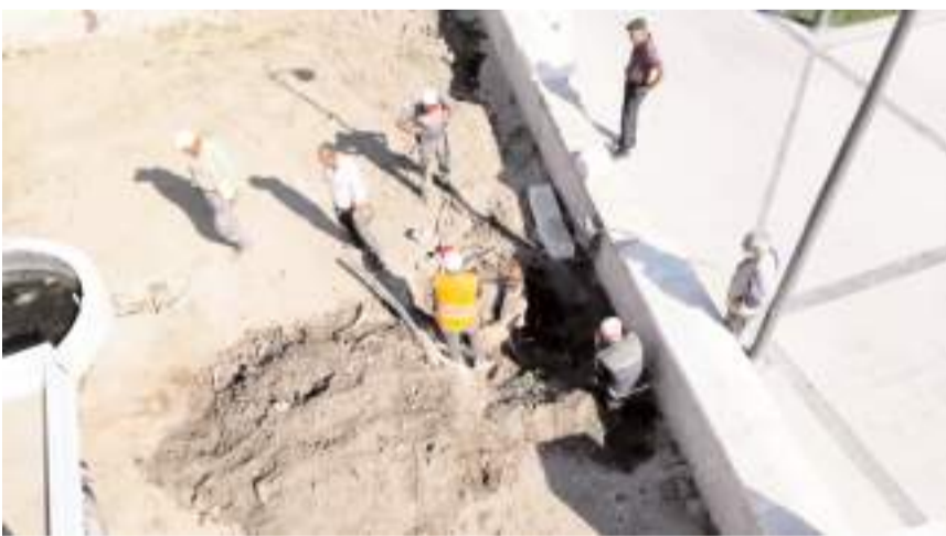
İşçiler cami bahçesindeki ağaçları kesti.

Çorum'da tarihi Ulu Camii'de restorasyon çalışmaları kapsamında cami bahçesinde bulunan ağaçların tamamı kesildi.