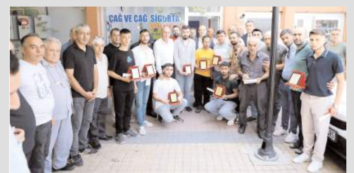
Alaca METEM'i bitirerek berber ve kuaförlük alanında ustalık belgesi almaya hak kazanan öğrencilere plaketleri törenle verildi.