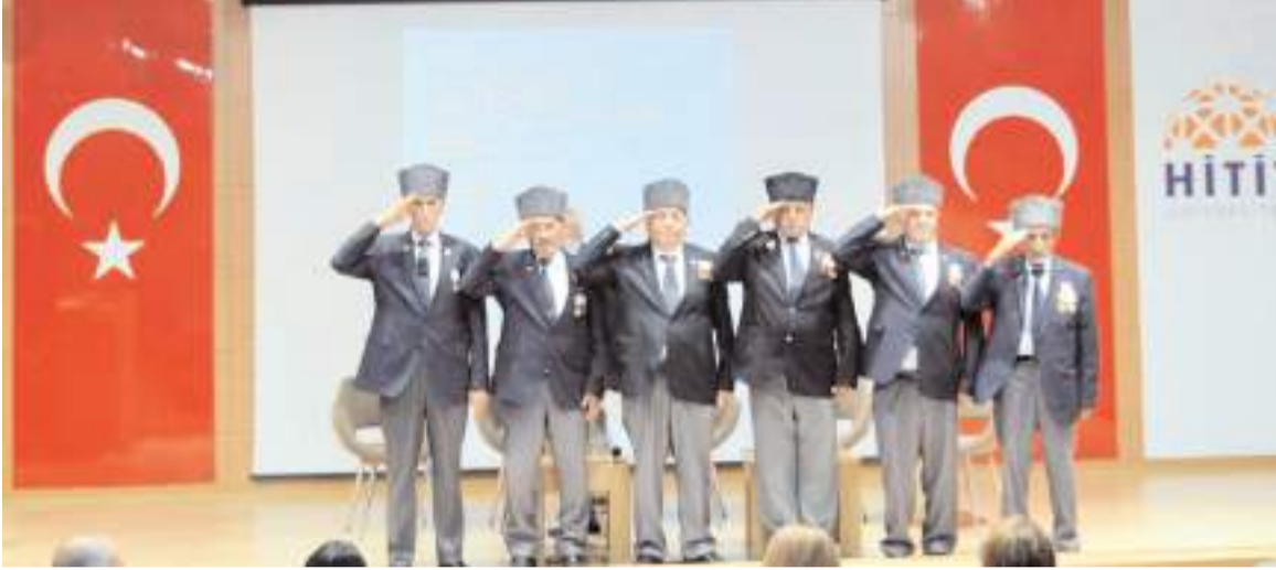
Söyleşiye Kıbrıs gazileri konuşmacı olarak katıldı.