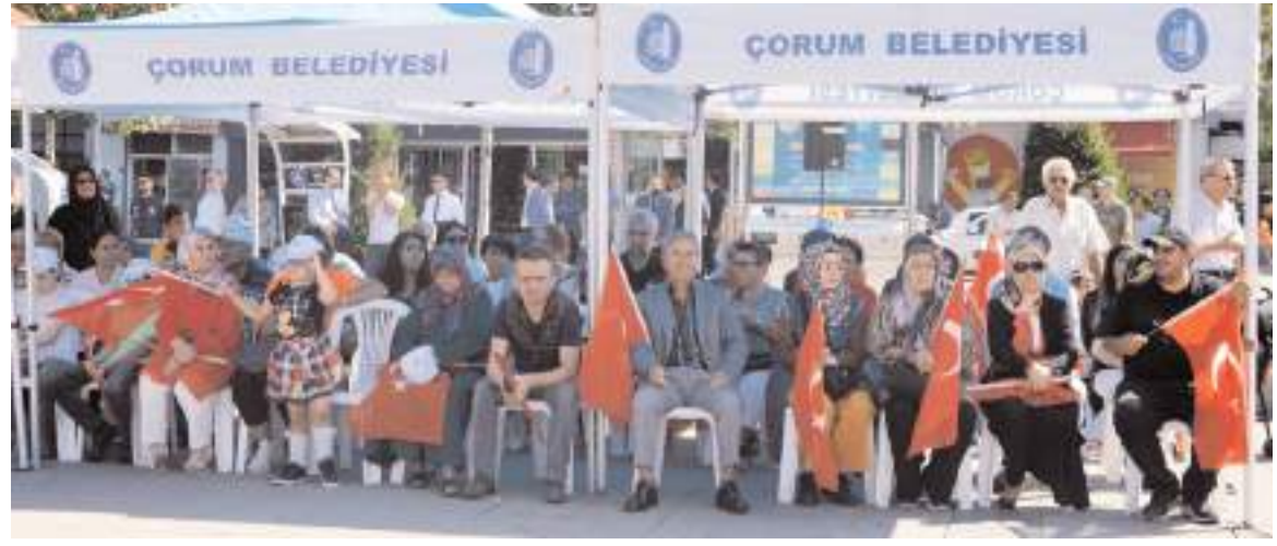
Kadeş Barış Meydanında yapılan törene vatandaşlar ellerinde Türk bayrakları ile katıldı.