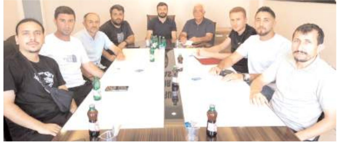
2. Amatör Küme'nin erken başlatılması için dün yapılan olağüstü toplantıya katılan kulüp temsilcileri