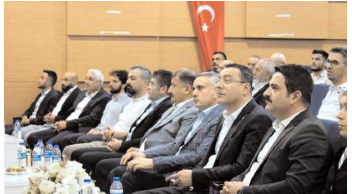
Genel Kurul Turgut Özal Konferans Salonunda yapıldı.