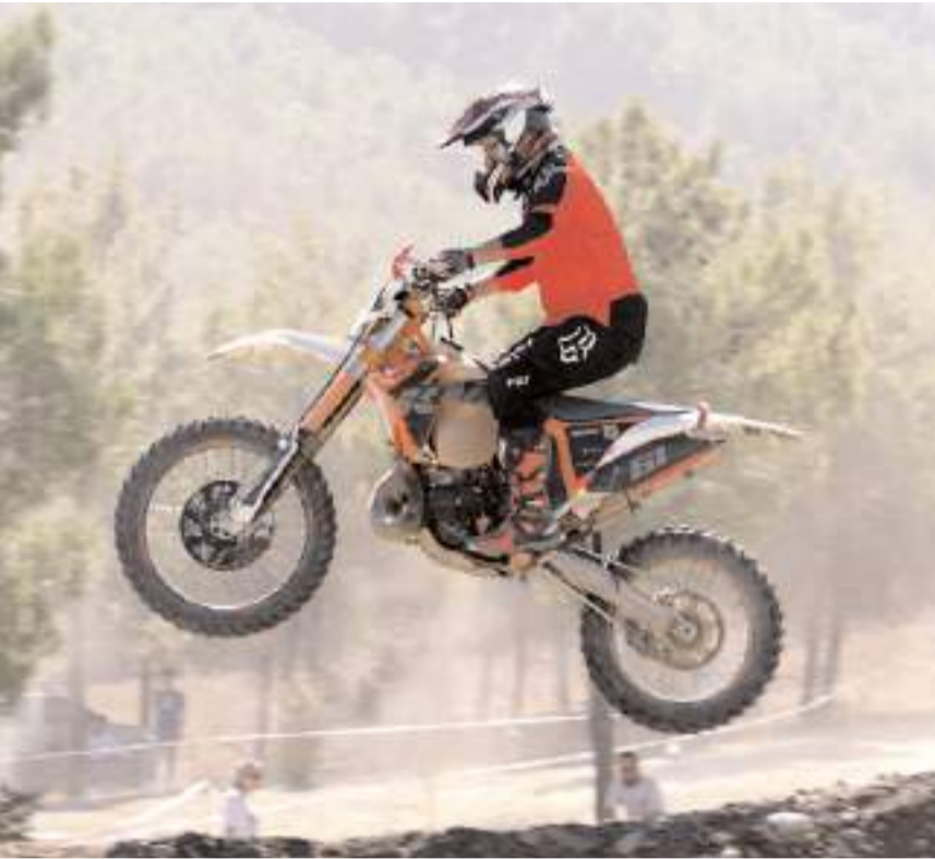
Osmancık'taki Enduro Motosiklet yarışlarında izleyiciler büyük heyecan yaşadılar