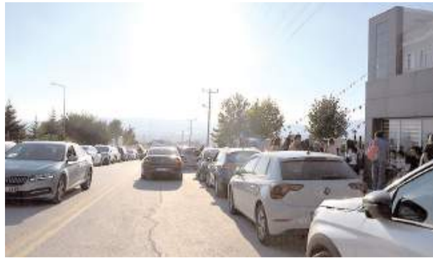
Veliler bölgede yaşanan trafik sorununa çözüm bulunmasını istiyor.