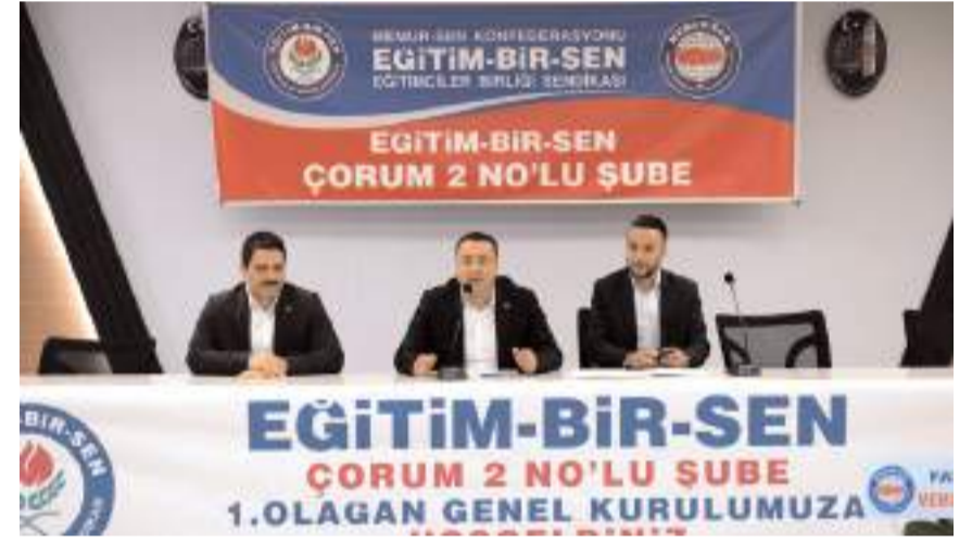
Genel kurulda ilk olarak divan heyeti belirlendi.