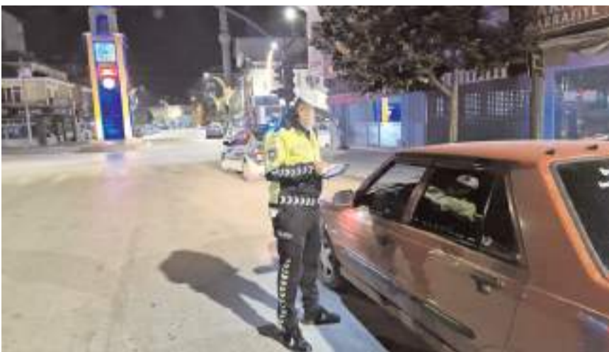
Denetimde, 100 şahıs ve 80 araç sürücüsü kontrol edildi.

Çorum'un Alaca ilçesinde, polis ekipleri tarafından gerçekleştirilen denetimde, 100 şahıs ve 80 araç sürücüsü kontrol edildi.