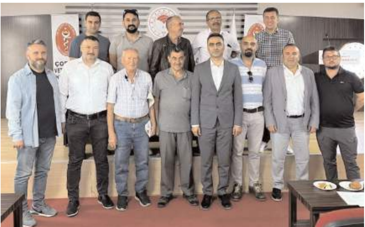
Genel kurulun ardından hatıra fotoğrafı çekinildi.