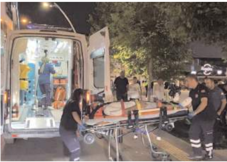
Olay Kadeş Barış Meydanında meydana geldi.