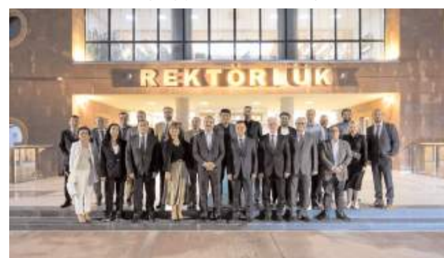
Toplantının ardından hatıra fotoğrafı çekildi.