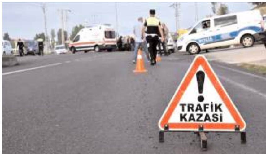
Ağır yaralanan Özer, sağlık ekiplerince yapılan müdahalenin ardından kaldırıldığı Mecitözü Devlet Hastanesi'nde müdahalelere rağmen hayatını kaybetti. (Haber Merkezi)

Durumu farkeden sürücünün ihbar üzerine olay yerine jandarma ve sağlık ekipleri sevk edildi.