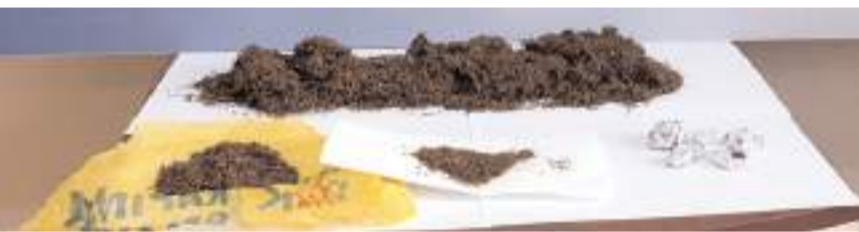
Operasyonda 100 gram uyuşturucu madde ele geçirildi.