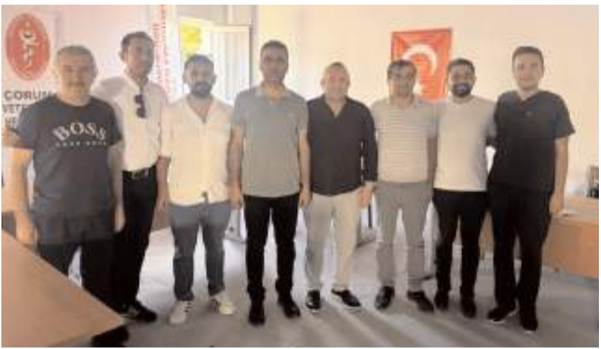
Genel kurul İl Tarım ve Orman Müdürlüğü'nde yapıldı.