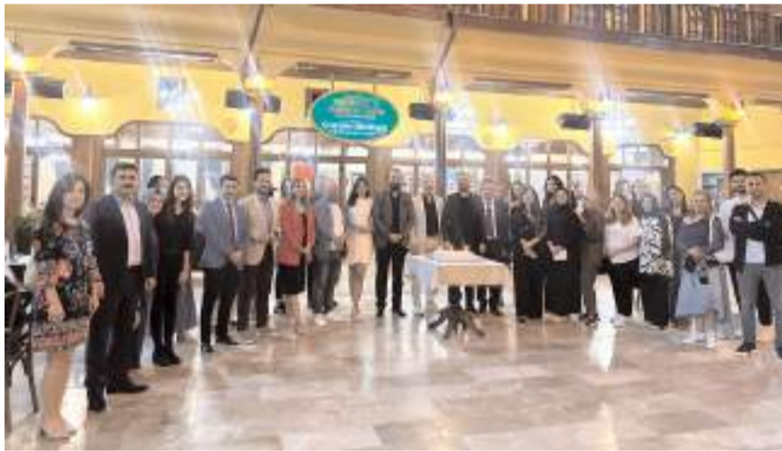
Programın ardından hatıra fotoğrafı çekildi.