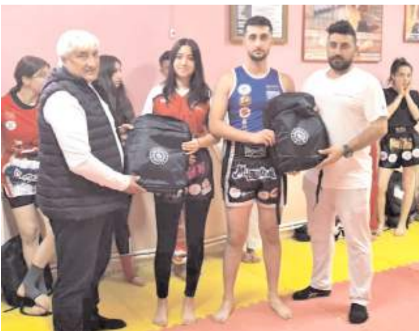
Baharspor'da yıl içinde derece yapan sporculara kulüp tarafından hediyeleri verildi