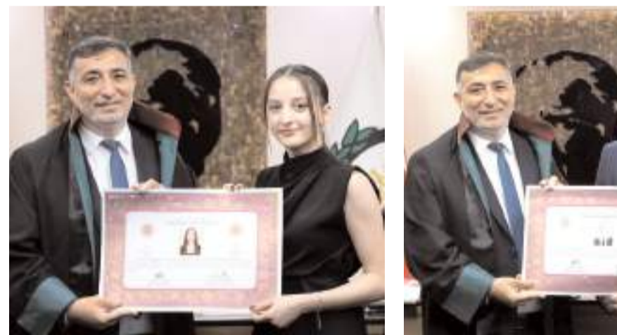
Törende avukatlar ruhsatlarını Baro Başkanı Av. Turan Kalıpcı ve yönetim kurulu üyelerinden aldılar.