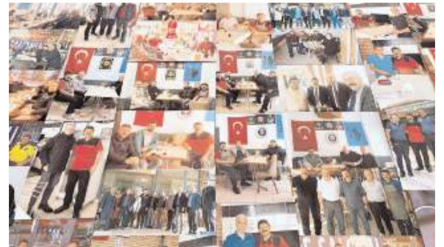
İşyerinin duvarında 400'den fazla müşterinin fotoğrafı yer alıyor.