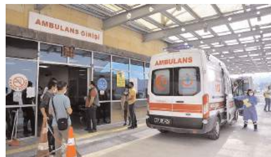
altına alınan 11 kişinin tedavilerinin ardından taburcu oldukları öğrenildi. (Haber Merkezi)