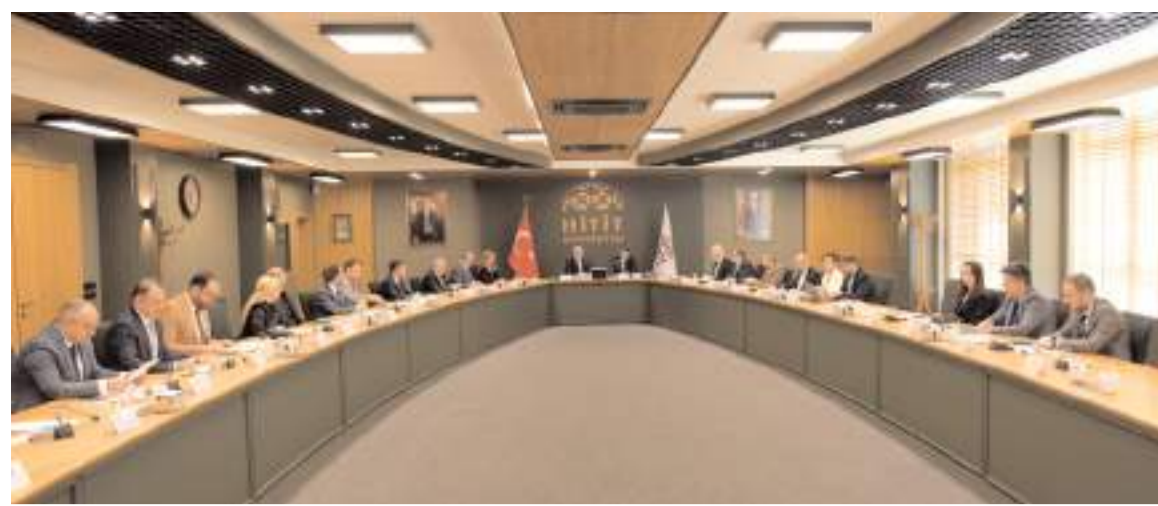
Hitit Üniversitesi ve Kastamonu Üniversitesi, işbirliklerini değerlendirmek üzere ikinci kez toplandı.