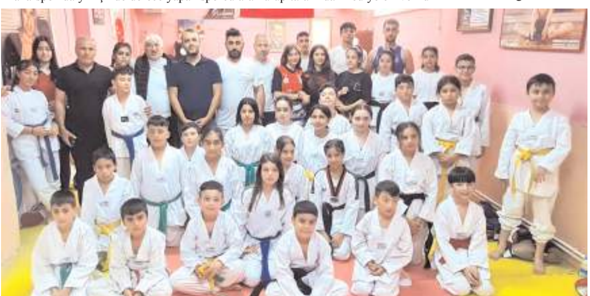
Baharspor Kuşak Terfi Sınavı ve ödül törenine katılanlar toplu halde görüldü