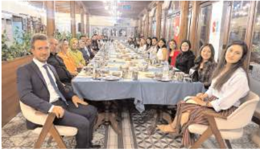
Program Velipaşa Hanında gerçekleştirildi.