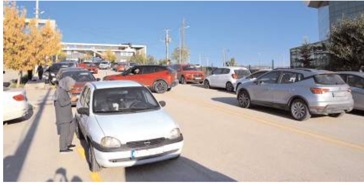
Gülkent 1.Cadde'de 3 okulun çıkış saatinde yoğun trafik yaşanıyor.