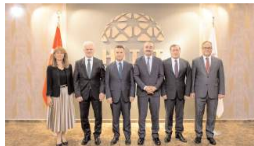
Toplantıda işbirliği yapılabilecek konular istişare edildi.