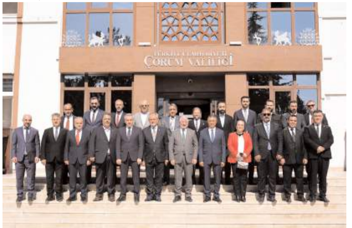
Ziyaretin ardından Valilik önünde hatıra fotoğrafı çekinildi.