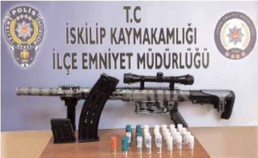
Şüphelilere ait adreslerde yapılan aramada av tüfeği ve mermiler bulundu.

Emniyetteki işlemlerin tamamlanmasının ardından adliye sevk edilen 3 şüpheli, çıkarıldığı mahkemece adli kontrol şartıyla serbest bırakıldı.(AA)