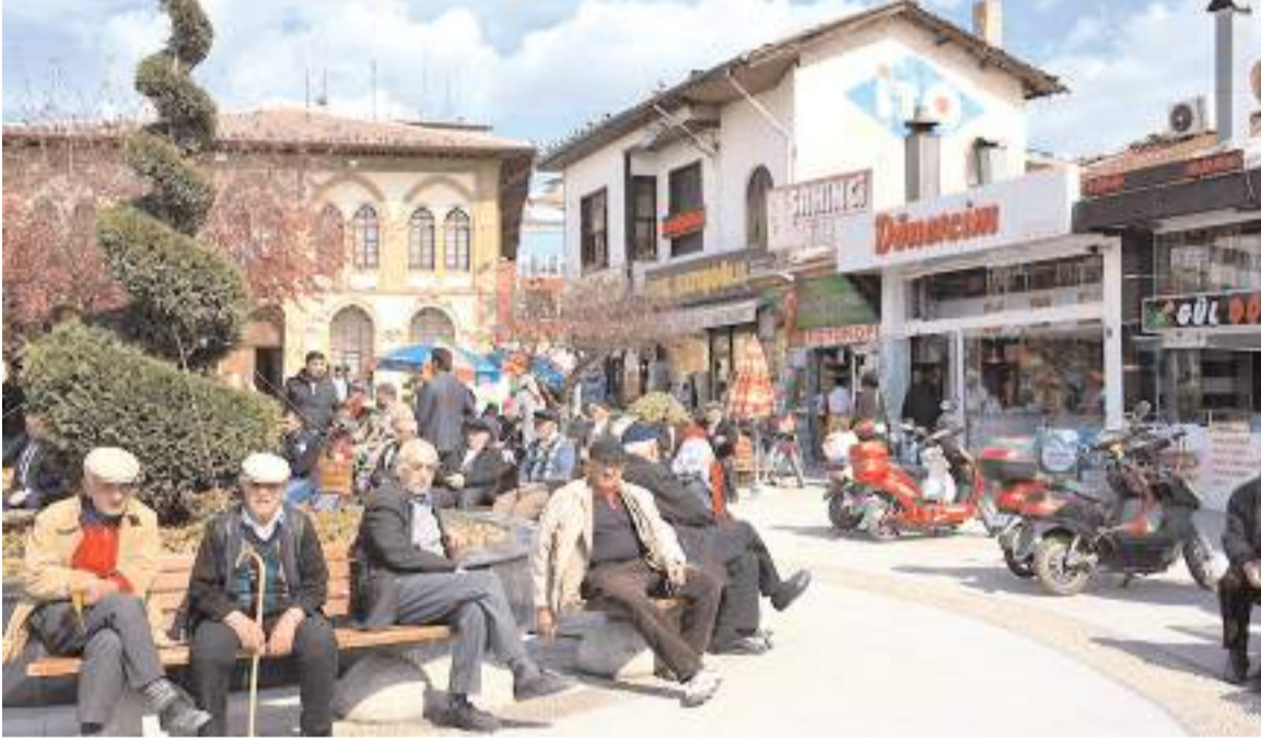
Haziran ayında Çorum'da emekli sayısı, çalışan kişi sayısını geçti.

Turizm illerinde ve deprem bölgesi illerinde ise çalışan sayısında artış var.