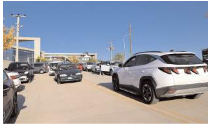
Veliler bölgede yaşanan trafik sorununa çözüm bulunmasını istiyor.

Yaşanan trafik çilesine dikkat çeken bir veli, "Bu bölgede iki özel okulun çıkış saati aynı olduğu için inanılmaz bir trafik yoğunluğu yaşanıyor. Trafik yoğunluğu nedeniyle kazalarda eksik oluyor. Geçtiğimiz günlerde bir çocuğumuz ezilme tehlikesi geçirdi. Buraya bir çözüm bulunmasını istiyoruz. Ya okul çıkış saatleri değiştirilsin ya Şehit Osman Kız Anadolu İmam Hatip Lisesi'nin bahçesi otopark olarak kullanılmasına izin verilsin yada okul çıkışlarında bu bölgeye bir trafik polisi yönlendirilsin. Yetkililerden çözüm bekliyoruz." dedi.