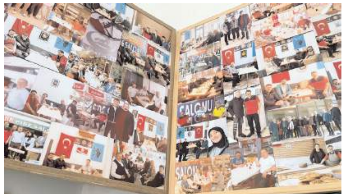
Duvarlarda bulunan fotoğraflar vatandaşların ilgisini çekiyor.