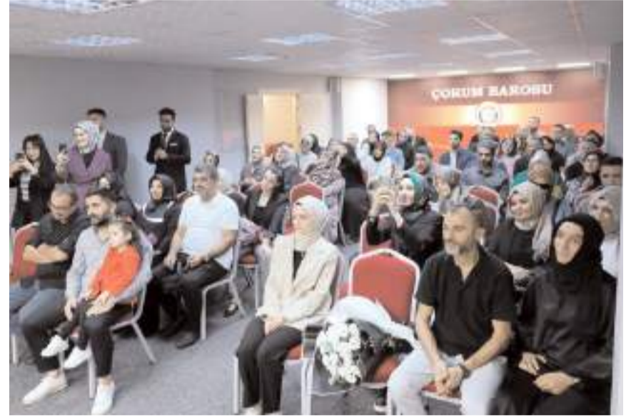
Avukatları aileleri yalnız bırakmadı.