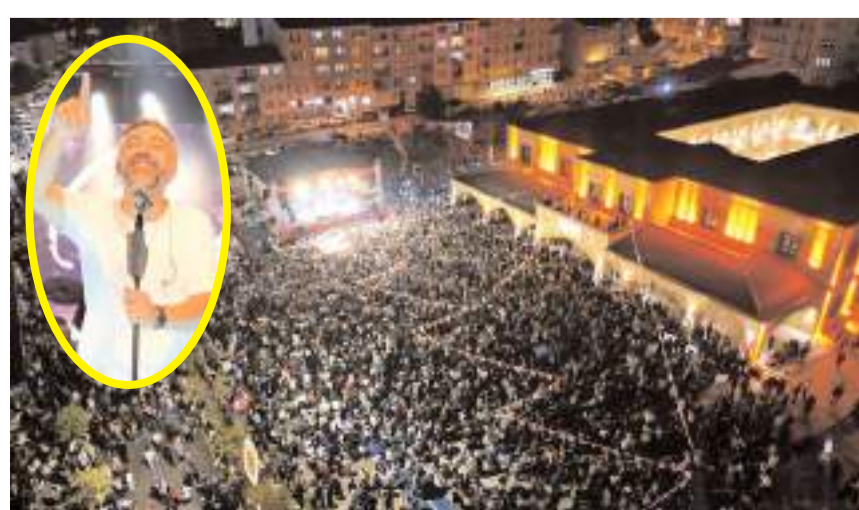
Bedesten önünde gerçekleştirilen konsere ilgi yüksek oldu.