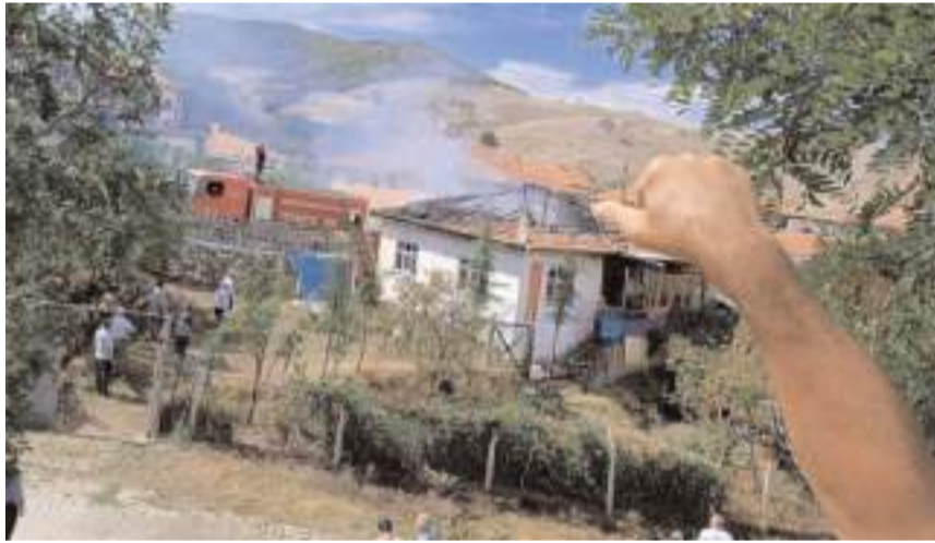
Olay Yarımsöğüt köyünde meydana geldi.

Sungurlu Belediyesi itfaiye ekiplerince söndürülen yangında ev kullanılamaz hale geldi.(AA)