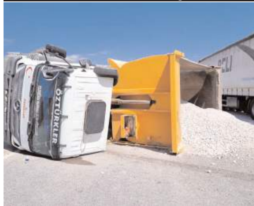
Kaza Koçhisar Barajı yakınlarında meydana geldi.

Çorum'un Alaca ilçesinde devrilen kamyonun sürücüsü yaralandı.