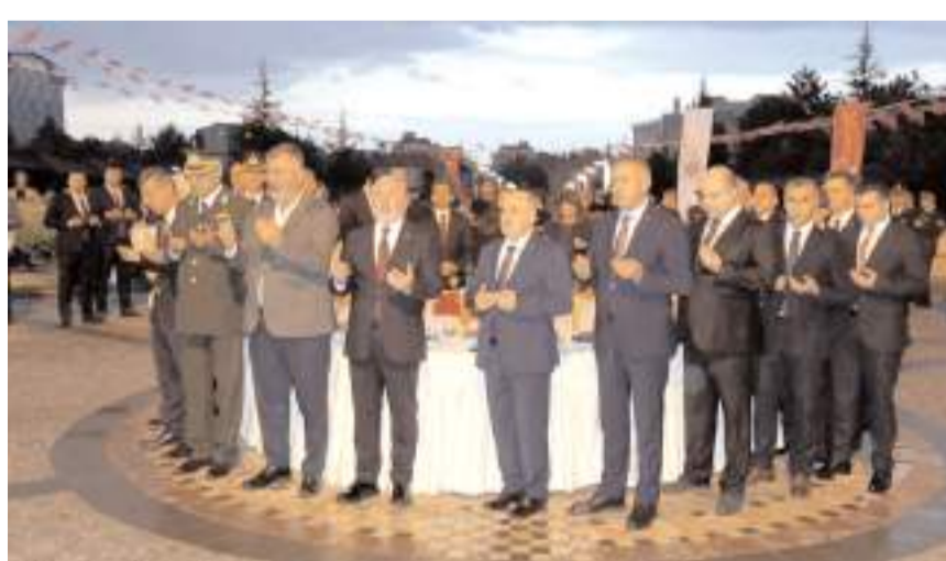
Programda şehitler için dua edildi.