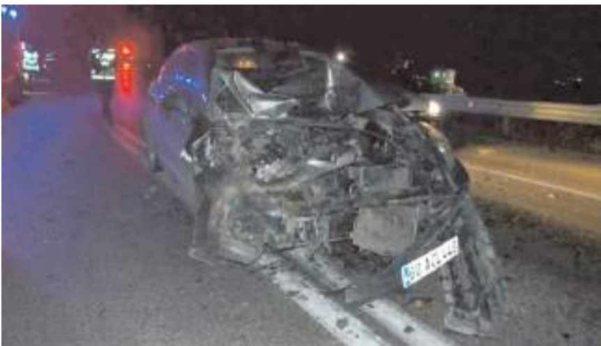
Kazada her iki araçta hurdaya döndü.