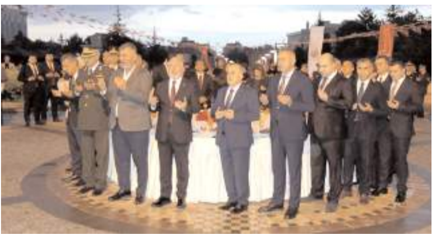
Programda şehitler için dua edildi.