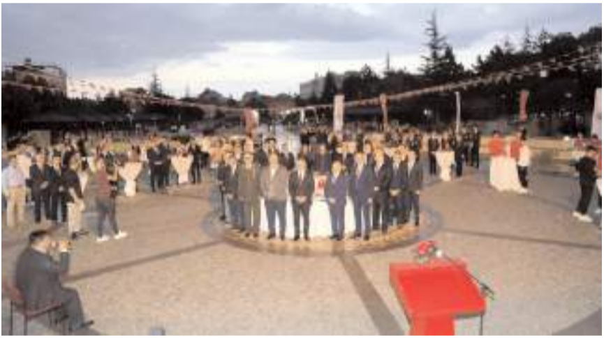
Resepsiyona çok sayıda davetli katıldı.