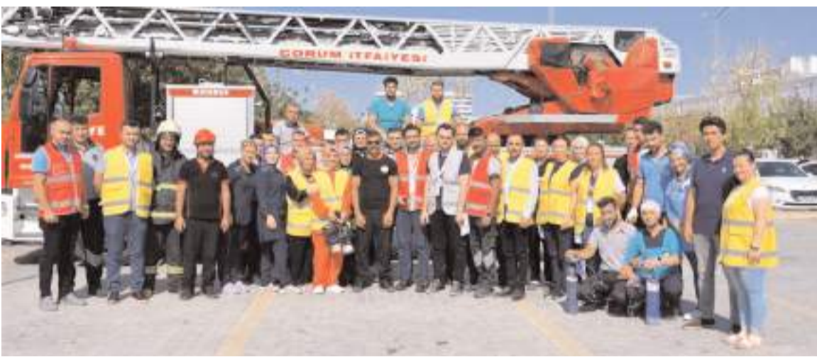
Hitit Üniversitesi Erol Olçok Eğitim ve Araştırma Hastanesi'nde yangın tatbikatı gerçekleştirildi.