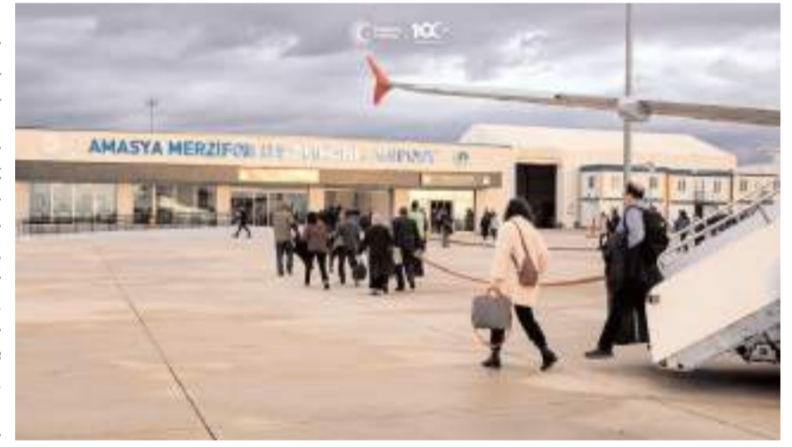
Havalimanı Temmuz ayında 12 bin 121 yolcuya hizmet verdi.

2024'ün ilk 7 ayında 80 bin 173 yolcuya hizmet veren Amasya Merzifon Havalimanı'nda 666 uçak trafiği gerçekleşirken yük (kargo, posta ve bagaj) trafiği ise, 715 ton oldu.