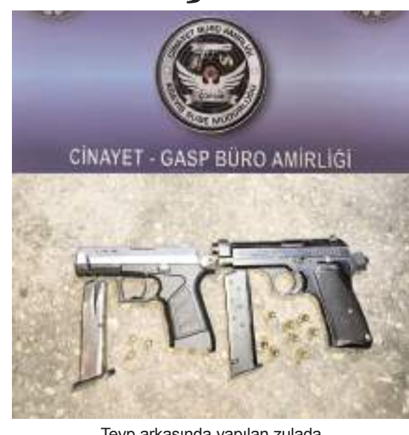
Teyp arkasında yapılan zulada 2 adet ruhsatsız silah ele geçirildi.

Polis ekipleri tarafından yapılan detaylı aramada teyp kısmında gizli bölme olduğu tespit edilen araçtan 2 adet ruhsatsız tabanca ve bu tabancalara ait 11 adet fişek ele geçirildi. (İHA)