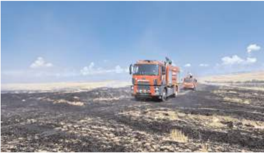
Yangın Alaca'da Karatepe köyü arazisinde meydana geldi.