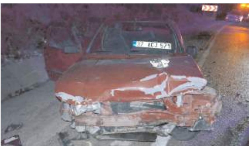
Kazada 3 kişi yaralandı.

Çorum'un Laçın ilçesinde 3 otomobilin karıştığı kazada 2 kişi yaralandı.