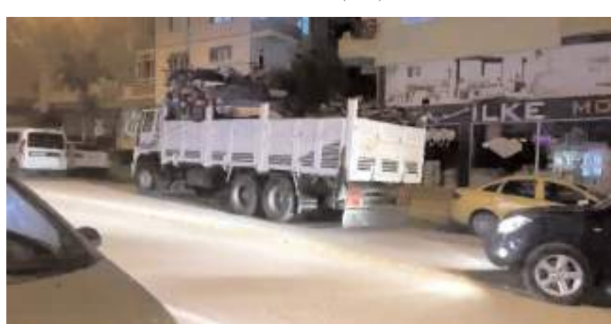
Olay, Ata Caddesi üzerinde meydana geldi.

Detaylı incelemeye alınan kamyonun sürücüsüne 34 bin 813 TL, para cezası uygulandıktan araç sahibine teslim edildi. (İHA)