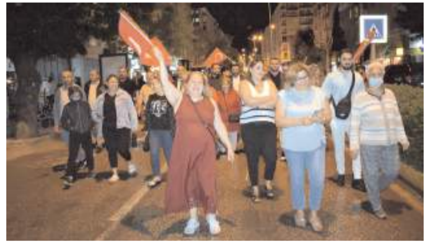
Vatandaşlar ellerinde Türk bayrakları ile yürüyüşe katıldı.

Katılımcılar daha sonra Anıt önünde hatıra fotoğrafı çekti.