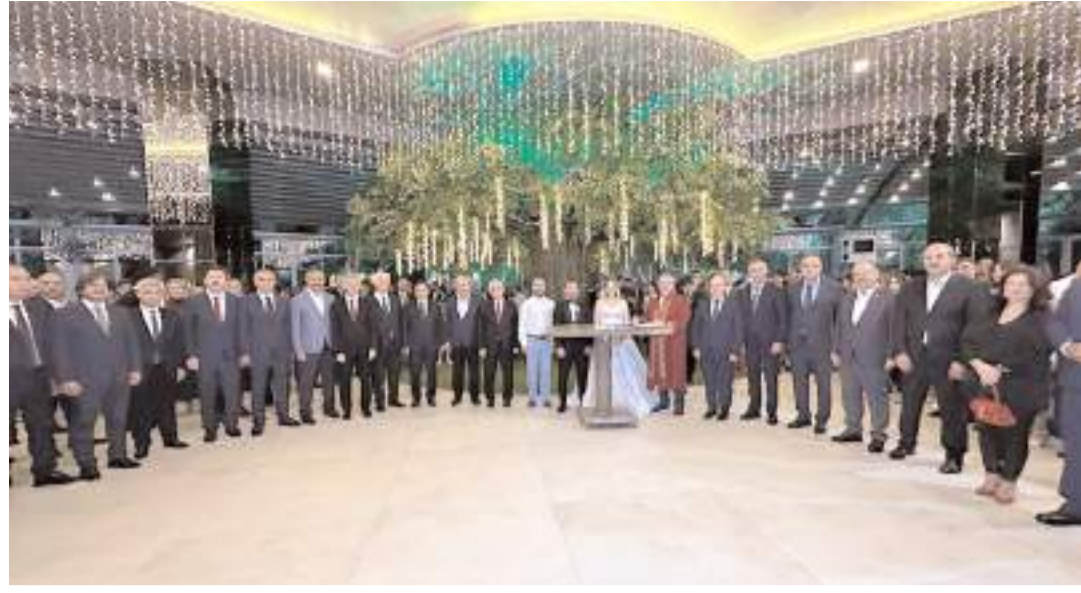
Düğün töreni Altınkaya Arena Salonu'nda yapıldı.