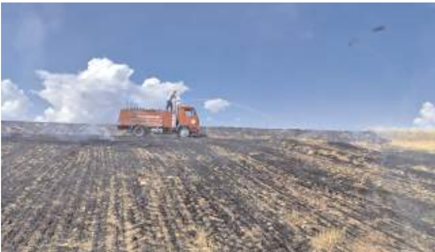
İtfaiye ekipleri yangını ormana sıçramadan söndürmek için büyük çaba harcadı.

Çorum'un Alaca ilçesinde çıkan anız yangını ormanlık alana sıçramadan söndürüldü.