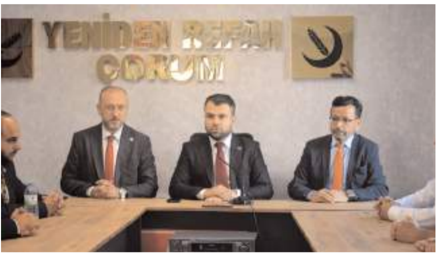
Fatih Müjdecî, Çorum'da açıklamalarda bulundu.

Bu zaten devletin boynunun borcu. Burada ifade edilmesi gereken husus milletin sofrasındaki zeytin sayısını artırmak, yediği etin gramajını artırmak, çocuğuna okul elbisesi alırken dükkan dükkan gezmemesini sağlamak. Milletimiz artık bu çözüme kavuşmak için Yeniden Refah Partisi'ni dört gözle, dört elle, dört ayakla, bütün sermayesiyle bekliyor. Ve bize yakışan da inşallah Çorum'da da bunu başaracağız, inanıyoruz. Bu milletin yüzünü inşallah Yeniden Refah Partisi ile güldüreceğiz. Bu milletin yüzünü yine inşallah milli görüşle hep beraber bizler güldüreceğiz. Çalmayacağız, çırpamayacağız, yolsuzluk yapmayacağız. Kendi iddia ettiklerimizle Allah bizi intihar etme suretini göstermemesi üzerine dua edeceğiz ve kendimiz inşallah insan bir şekilde, çalışkan bir şekilde Mümince bir durumda, Müslümanca, Erbakanca, milli görüşçe kendi kimliğimize, kendi siyasetimizi sergileyeceğiz.”