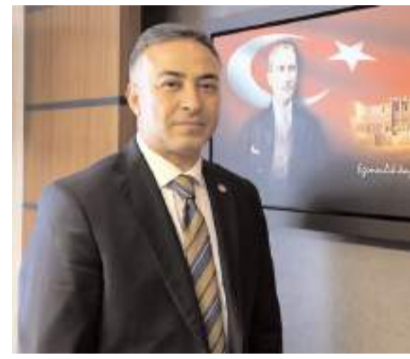
CHP Çorum Milletvekili Mehmet Tahtasız