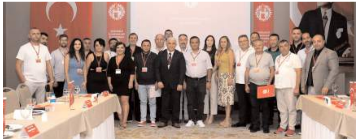
Çorumlu İş İnsanları Platformu ilk toplantısını gerçekleştirdi.