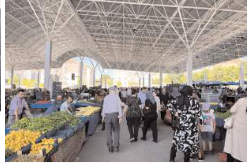
Kapalı pazarlarda artık çadır kullanılması yasak.