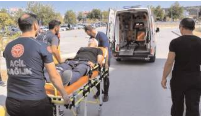
Çorum Belediyesi itfaiye ekipleri işbirliğinde düzenlenen tatbikata yaklaşık 100 personel katıldı.

Dumanlar etrafı sarkarken, kırmızı kod verilerek yangın hastane söndürme ekipleri ve itfaiyenin katkılarıyla kontrol altına alındı.