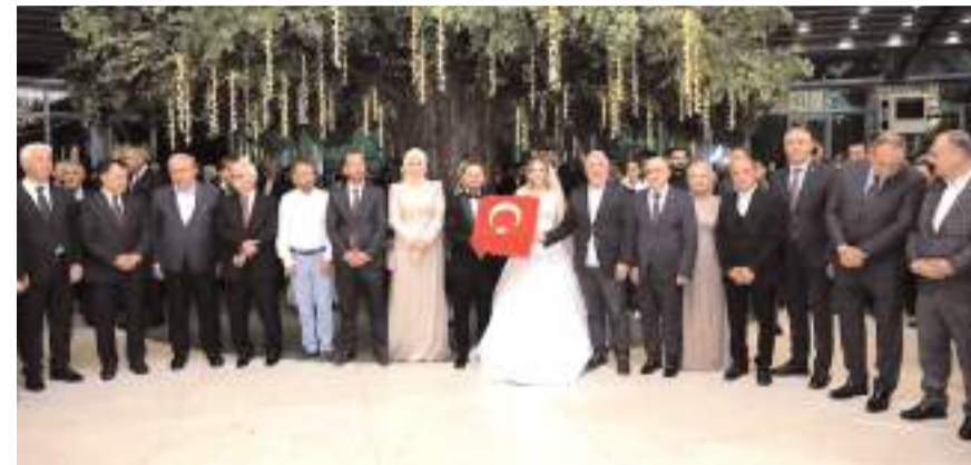
Düğüne çok sayıda davetli katıldı.