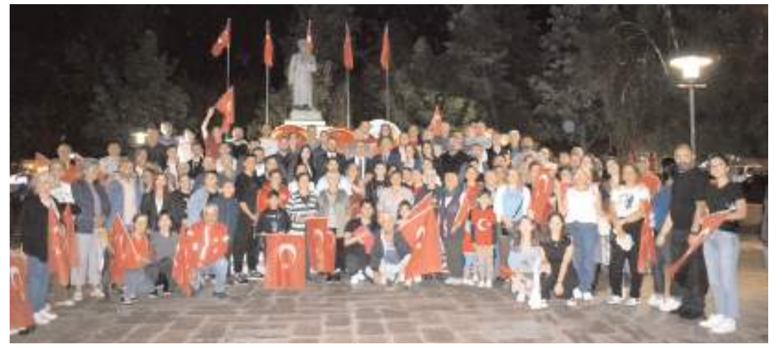
Bahabey Caddesi İpek Taksi Kavşağından başlayan yürüyüş, Atatürk Anıtı'na kadar devam etti.

Etkinlik, katılımcıların alkışları ve marşlarla son buldu. İskilip halkı, Fener Alayı ile bir kez daha milli birlik ve beraberliğini gösterirken, 30 Ağustos Zafer Bayramı'nın coşkusu doyasıya yaşandı. (İHA)