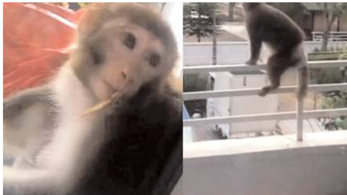
Maymun bir kişiye saldırmıştı.

Sağlık Bakanı Sayın Kemal Memişoğlu'na ilimizin sağlık sorunlarını ve hastanelerimizdeki uzman doktor eksikliklerini içeren ayrıntılı bir dosya sundum. Yapılacak yeni atamalar ve görevlendirmelerde bu hususları dikkate alınmasını temenni ediyorum, yeni hekimlerimizimize uzun soluklu bir çalışma dönemi diliyorum."