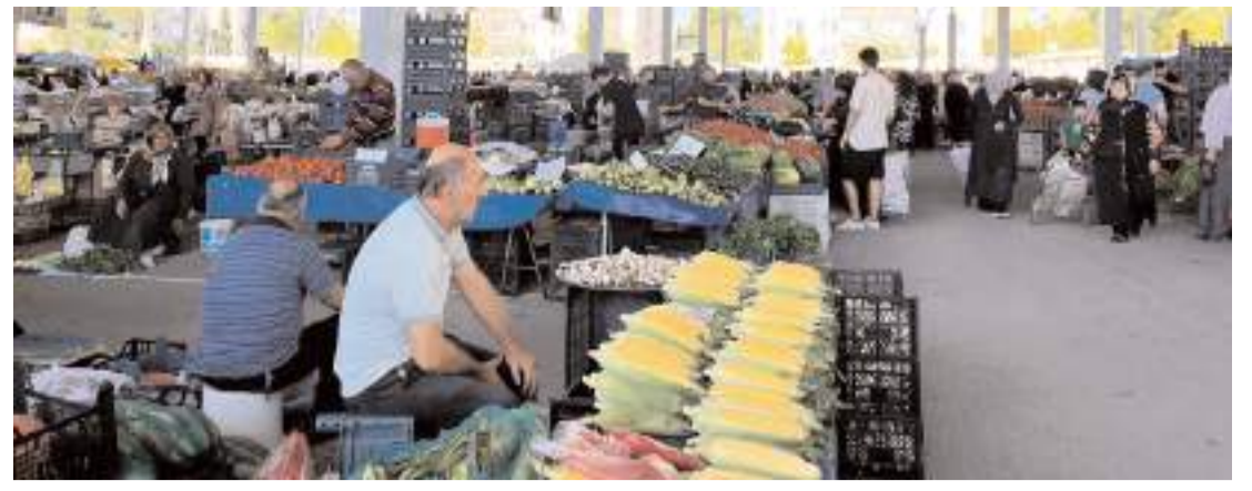
'Çadırsız Pazar' uygulaması ilk olarak Perşembe Pazarında hayata geçirildi.

"Uyan ey Türk milleti, uyan Türk gençliği. Memlekette, aile hayatı bitti. Eğitim bitti, ahlak, görgü, örf anene, adalet, liyakat bitti. Adam kayırmaca, yandaşlık, hukuksuzluk başladı. Kısaca insanı insan yapan değerleri bitirdiler. Hadi üzerindeki karabulutları, ölü toprağı kaldırı artık. Türk'e Türk'ten başka dost yoktur. Bedeli canla ödenmiş vatan topraklarında, rengini şehit kanından almış bayrağı, al kanlı şehitlerine selam olsun." (Haber Merkezi)