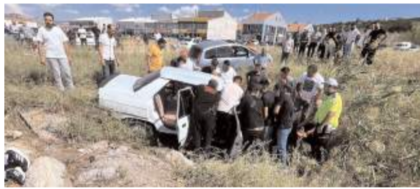
Kaza, Galericiiler Sitesi kavşağında meydana geldi.