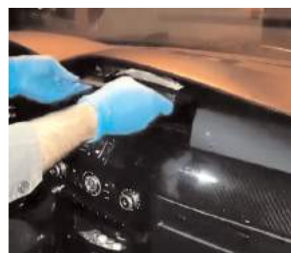
Polis ekipleri aracın teyp kısmının arkasının zulaya dönüştürüldüğünü tespit etti.

Doktor ataması ile ilgili açıklama yapan CHP Çorum Milletvekili Mehmet Tahtasız, 8 ilçeye atama yapılmadığını belirterek, mevcut atamaların beklentileri ve ihtiyacı karşılamadığını söyledi. * HABERİ2'DE