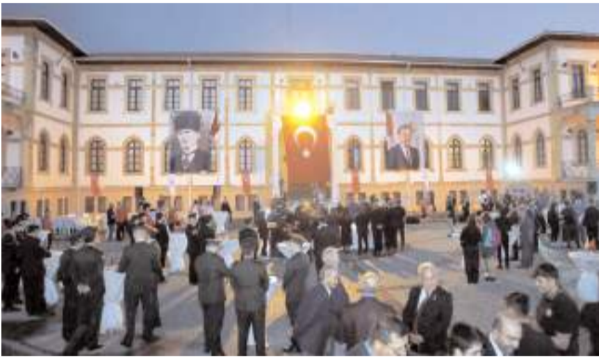
Çorum Valiliğinin 30 Ağustos resepsiyonu Çorum Müzesi önünde yapıldı.