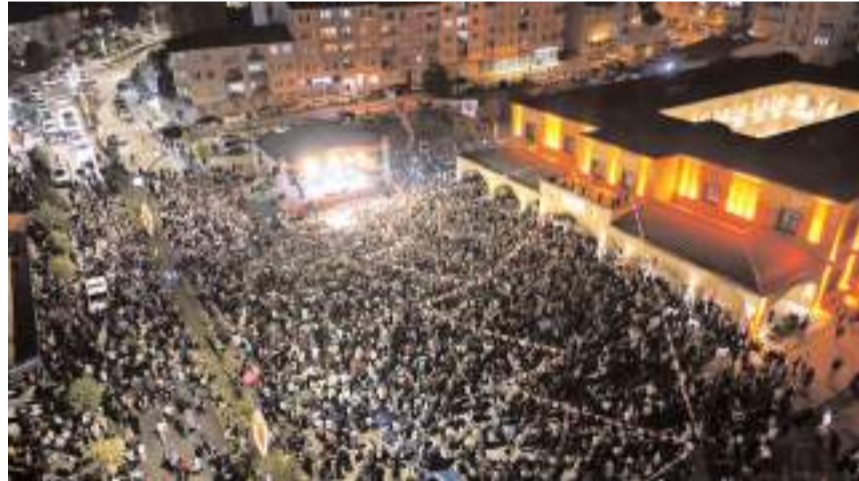
Bedesten önünde gerçekleştirilen konsere ilgi yüksek oldu.