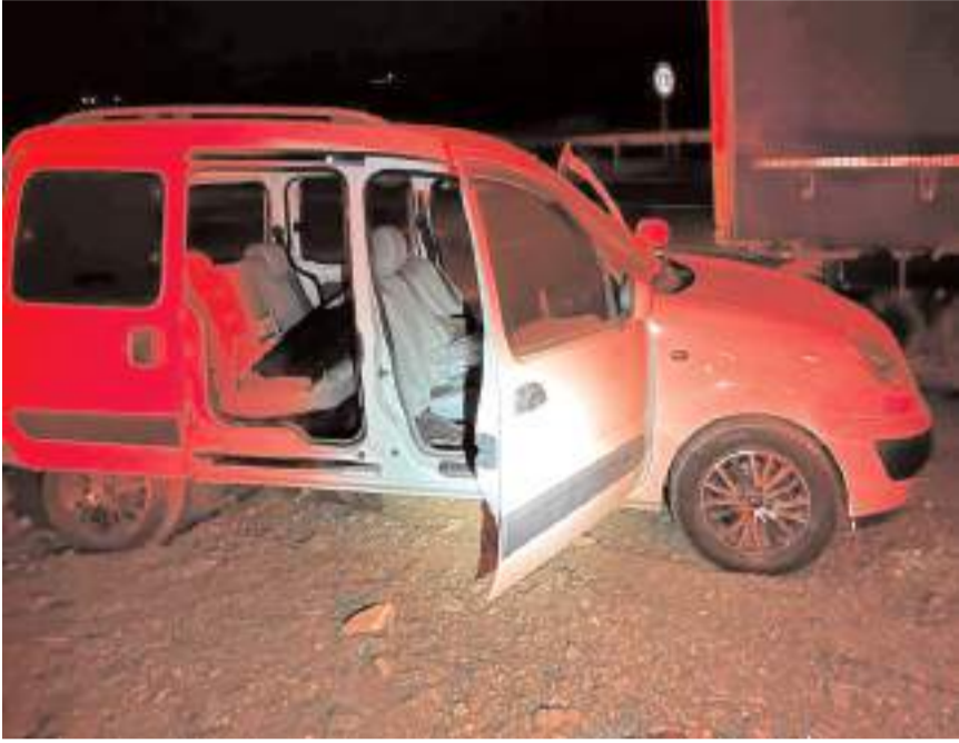
Kaza Kırıkkale'nin Delice ilçesinde meydana gelmişti.

Acı haber, Börekçi'nin ailesi ve yakınları başta olmak üzere, sanayi sitesindeki esnaf arkadaşları arasında büyük üzüntü yarattı.