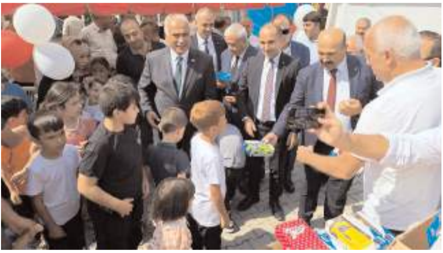
Çocuklara çeşitli hediyeler verildi.