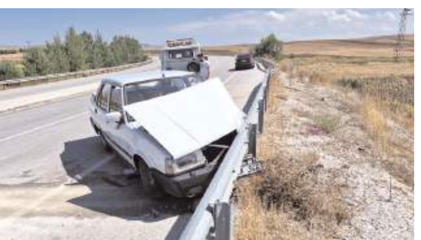
Kaza Alaca-Yozgat karayolu Sincan köyü yakınlarında meydana geldi.

Kazayla ilgili olarak başlatılan soruşturmanın devam ettiği öğrenildi. (İHA)