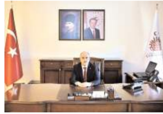
Çorum Valisi Zülkif Dağlı

Yağışın Çorum'un güney ve batı bölgelerinde etkili olduğunu aktaran Dağlı, Sungurlu ilçesine bağlı Haciosman ve Sarıcalar köylerinde bazı konut ve ahırlarda su baskını, köy yollarında bozulma meydana gelmesinden dolayı Sungurlu Belediyesinden 3 kişilik ekip