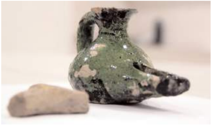
Bilimsel kazılarda 800 yıllık kandil bulundu.