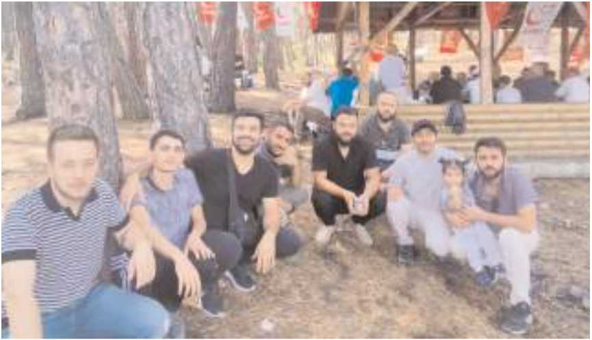
Saadet Partisi İl Teşkilatı'nın İl Divan Toplantısı, Çatak Tabiat Parkında yapıldı.

"Bugün ülkemiz ve tüm insanlık büyük krizlerle boğuşmaktadır. Âdil bir düzen, yeniden büyük bir Türkiye ve yeni bir dünya düzeni, sadece Millî Görüş kadroları ile mümkündür. Çünkü Saadet Partisi'nin temsil ettiği değerler, herhangi bir değerler sistemi değildir. Millî Görüş'ün asıl ve yegâne temsilcisi Saadet Partisi, tüm insanlığın saadetine vesile olacak kurtuluş reçetesini sunmaktadır. Bu nedenle Saadet Partisi'nin iktidar yolundaki her çalışma ve gayret, herhangi bir siyasi parti çalışmasından çok daha öte anlam ve önem taşımaktadır. Millî Görüş kadroları işte bu önemi çok iyi idrak etmiş donanımlı ve heyecanlı kadrolardır. Dolayısıyla inancımız odur ki tüm bu gayretli çalışmalarımızın sonucunda basiretli halkımız, er ya da geç, Saadet Partisi'nde gönül birliği yapacaktır." (Haber Merkezi)