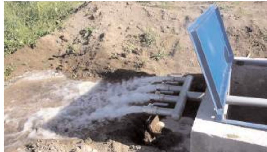
Aşağı ve Yukarı Beşpınar köylerine sulama tesisi yapılacak.

9 Eylül saat 10.00'da yapılacak ihale, Çorum İl Özel İdare Tarımsal Hizmetler Müdürlüğü toplantı salonunda gerçekleştirilecek. 4734 sayılı Kamu İhale Kanununun 19 uncu maddesine göre açık ihale usulü ile ihale edilecek olup, teklifler sadece elektronik ortamda EKAP üzerinden alınacak. İhale ile Aşağı ve Yukarı Beşpınar köylerine 700 m beton kanal, 7 adet yol geçidi, 10 adet tarla priz kapağı (Toplam 15 adet iş kalemi) yapılacak.