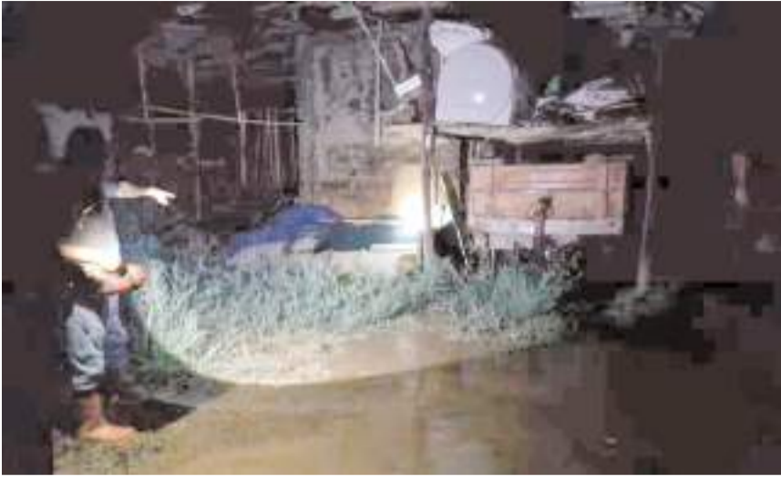
Yağış sonrası oluşan sel nedeniyle ulaşımda aksamalar yaşandı.