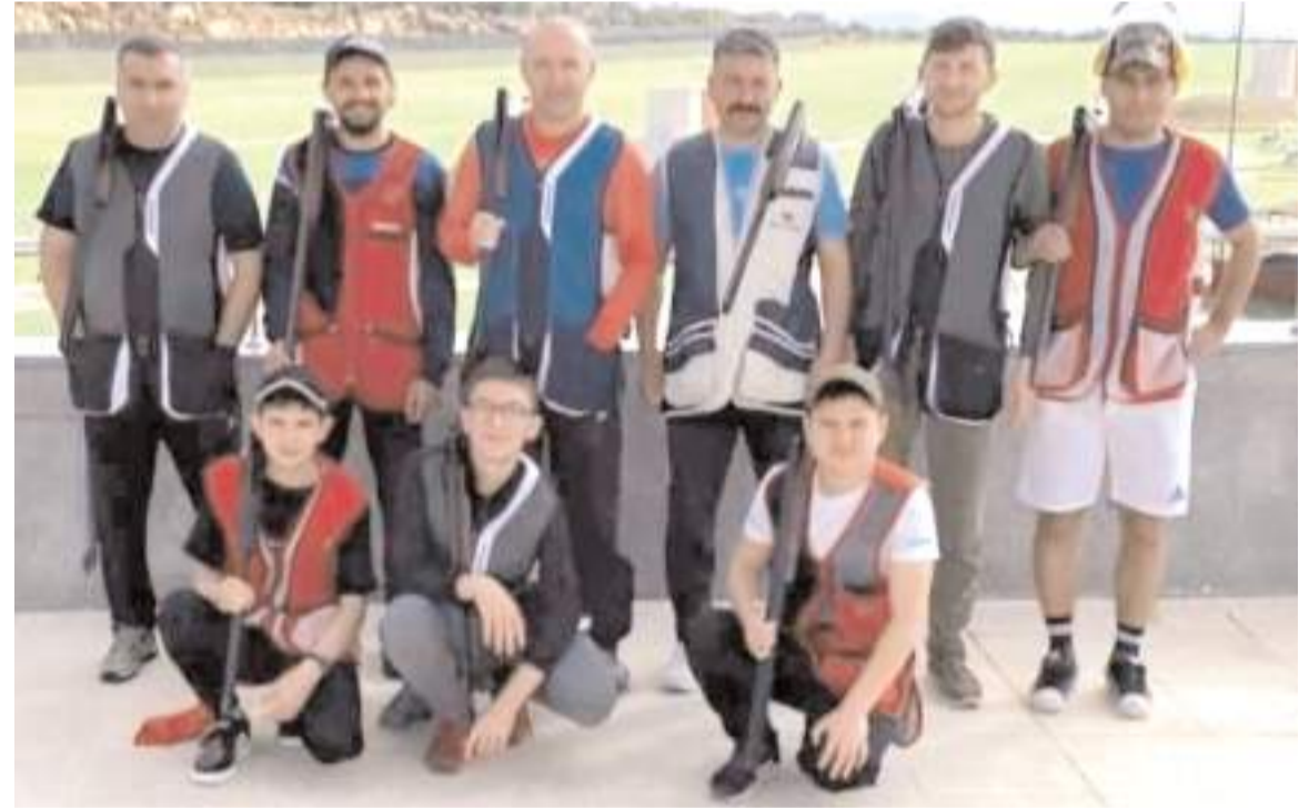
Konya'da yapılan Zafer Kupası yarışmalarında mücadele eden Çorum takımı sporcuları atışlar sonunda toplu halde