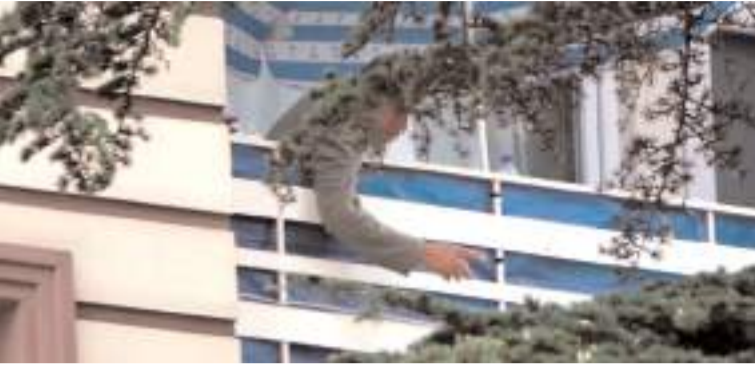
Polis ekipleri uzun süre A.R.'yi ikna etmeye çalıştı.