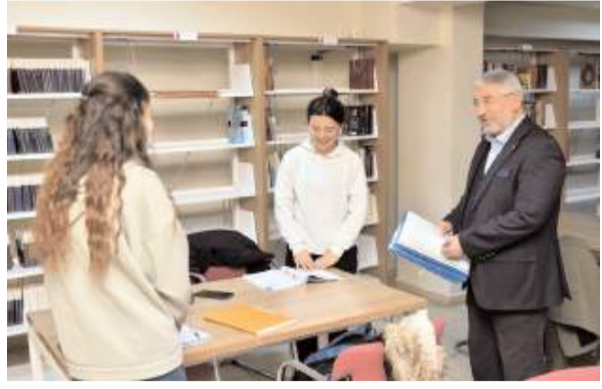
Kurslarda 40 deneme sınavı yapılacak.

Kurslara katılmak isteyenler https://basvuru.corum.bel.tr/ Online Başvuru Sistemi'nden kayıt yaptırabilecekler. (Haber Merkezi)