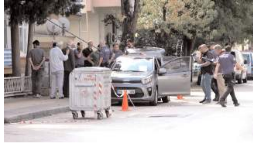
Polis ekipleri şüphelinin aracında arama yaptı.

venlik önlemi olarak yolu trafiğe kapattı. Doğalgaz ekipleri de bölgede gaz akışını kesti. İtfaiye ve sağlık ekipleri de olay yerinde görev aldı. 2,5 saat süren ikna çabalarının ardından şahıs ikna edildi. Polis ekiplerince evden çıkarılan A.R., polis merkezine götürüldü. (İHA)