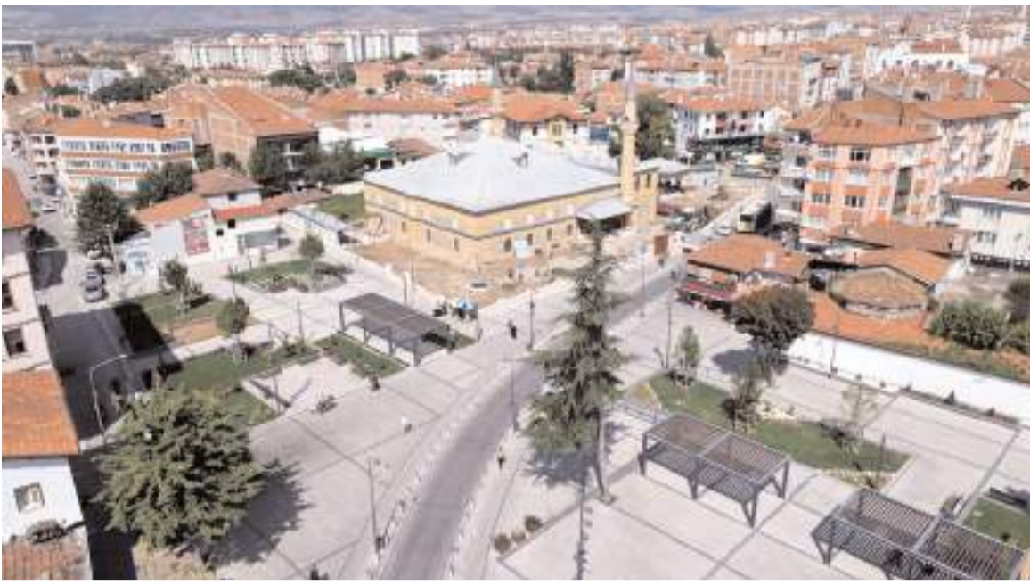
Ulu Cami bahçesindeki ağaçların tamamı kesildi.