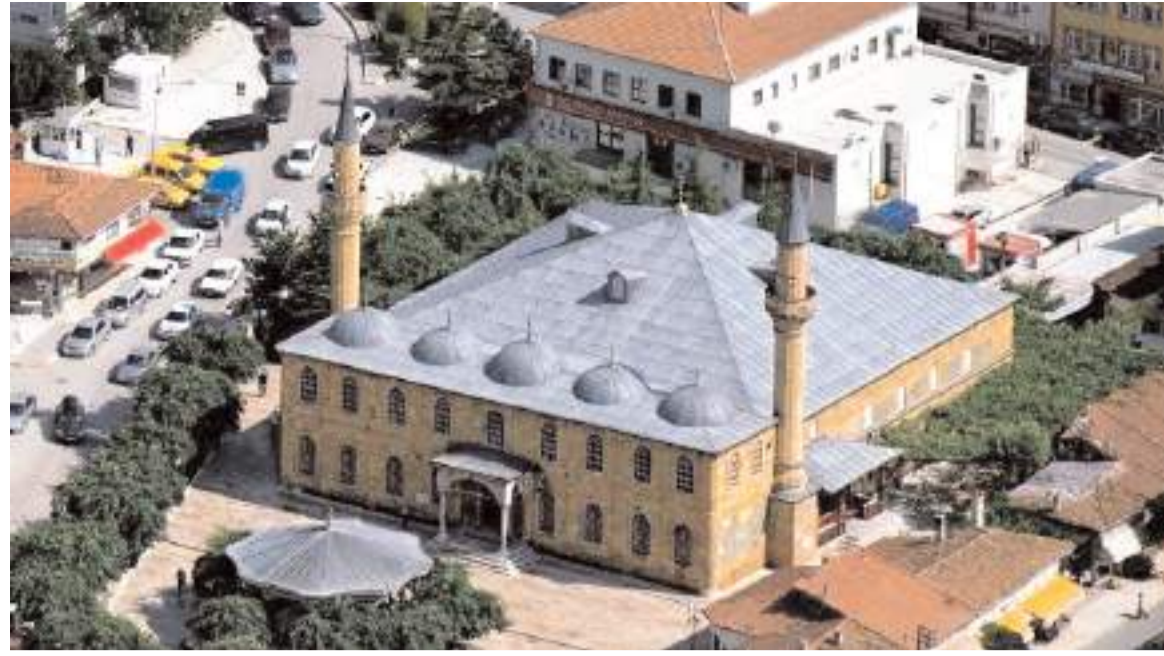
Cami bahçesindeki ağaçların tamamının kesilmesine vatandaşlar tepki gösterdi.