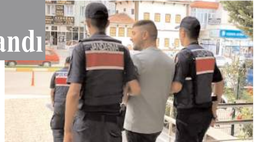
Adliyedeki işlemleri tamamlanan hükümlü, cezaevine gönderildi.

Adliyedeki işlemleri tamamlanan hükümlü, cezaevine gönderildi.(AA)