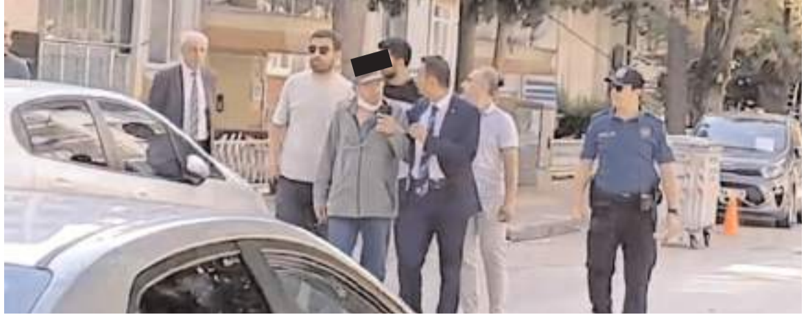
Uzun süren ikna çabalarının sonunda A.R. teslim oldu.

İhbar üzerine bölgeye çok sayıda ekip sevk edildi. Polis ekipleri gü-