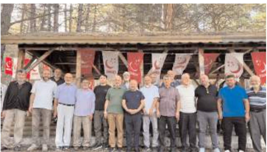
Toplantının ardından hatıra fotoğrafı çekildi.