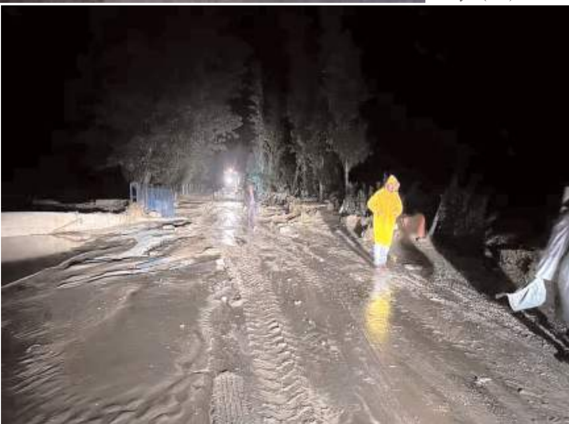
Şiddetli yağış kırsalda sele neden oldu.

Çorum'da etkili olan sağanak yağış ve şiddetli rüzgar hayatı felç etti. Yağış sonrası oluşan sel nedeniyle ulaşımda aksamalar yaşanırken, şiddetli rüzgar nedeniyle bazı evlerin çatıları zarar gördü.