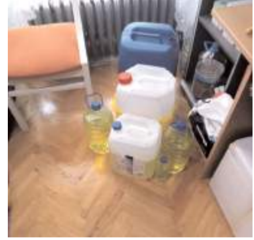
Şahsın evin her tarafına benzin dolu şişeler ve bidonlarla donattığı ortaya çıktı.