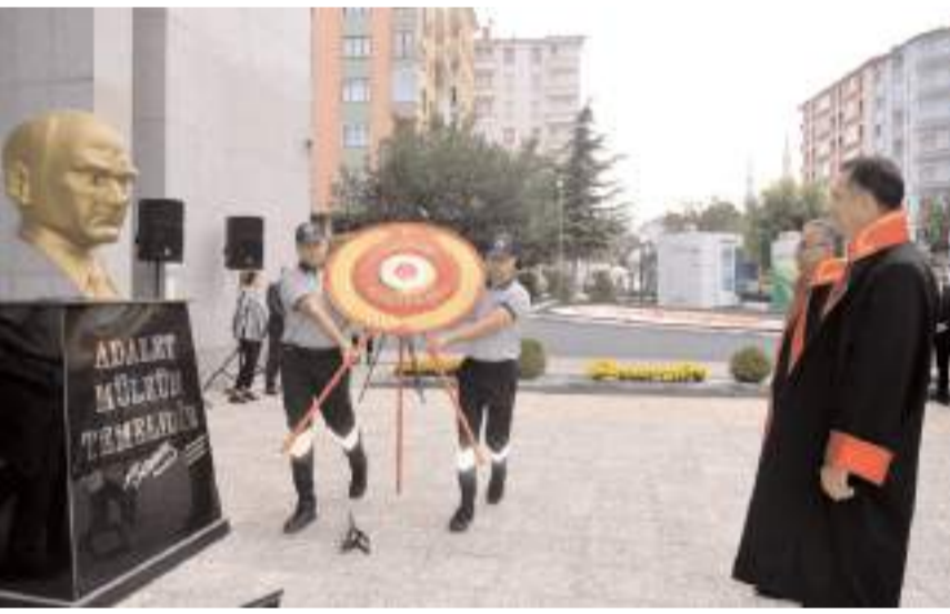
Açılış töreninde Atatürk büstüne çelenk sunuldu.