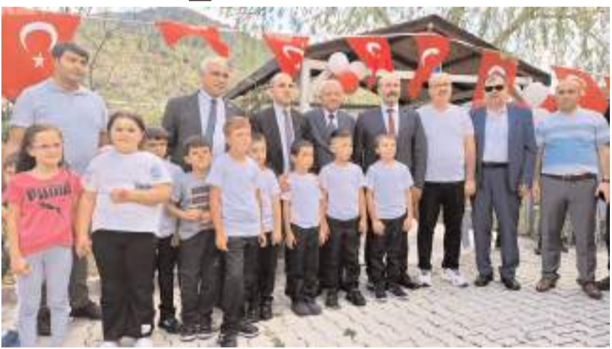
İskilip Belediyesi tarafından sünnet ettirilen 22 çocuk için sünnet şöleni düzenlendi.