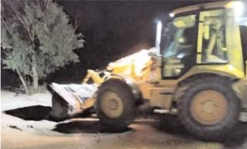
Ekipleri kapanan yolları açmak için gece boyu çalıştı.