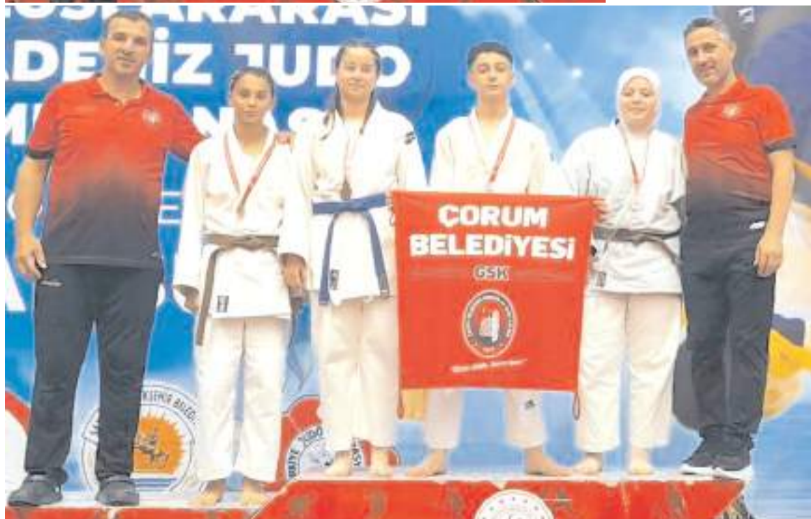
Karadeniz Turnuvasında madalya kazanan Çorum Belediyespor judo takımı sporcu ve antrenörleri toplu halde