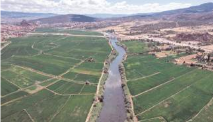
Osmancık'ta 24 bin dekar alanda çeltik üretimi yapılıyor.