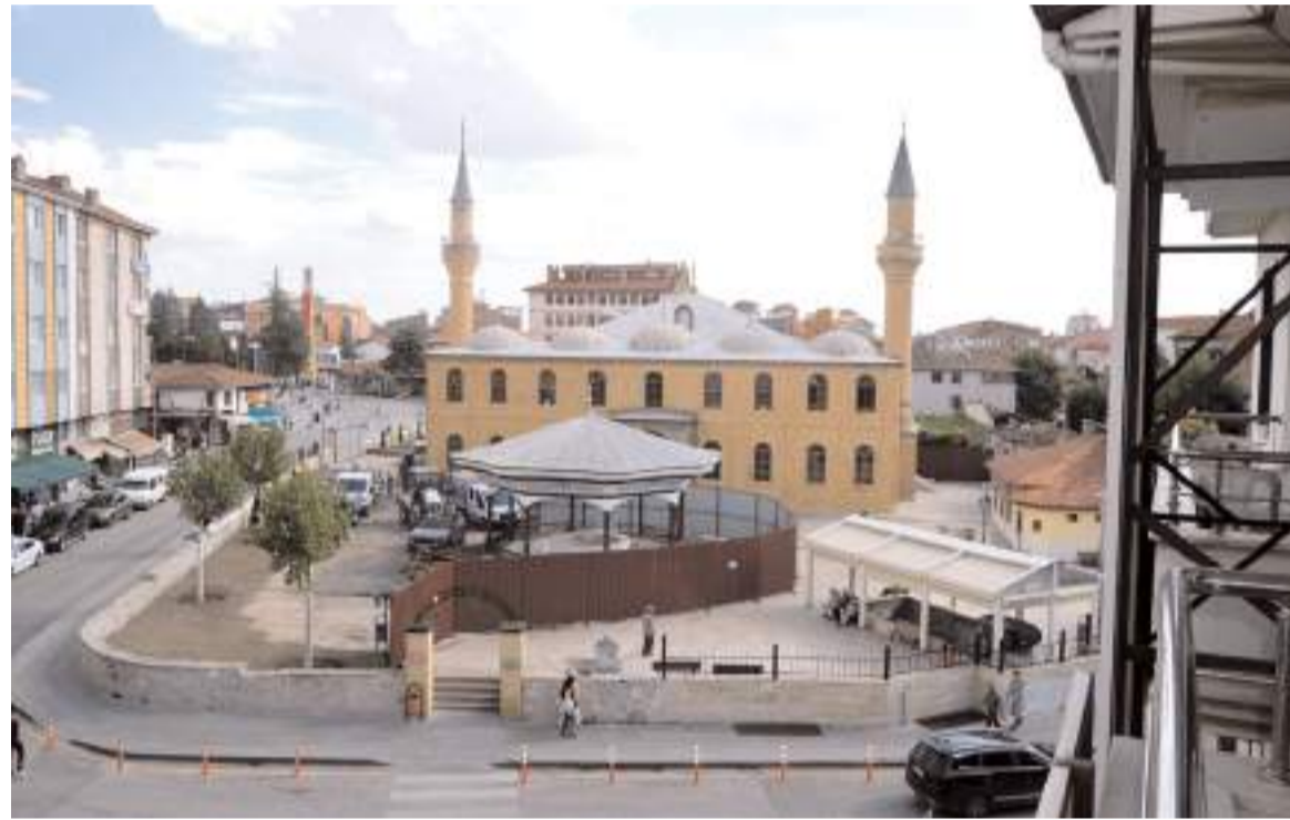
Çorum Belediyesi Ulu Cami bahçesinde peysaj düzenlemesi yaparak yetmiş ağaçları dikti.

'KARAR KİME AİT OLURSA OLSUN BELEDİYE İTİRAZ EDİP KORUMALIYDI'