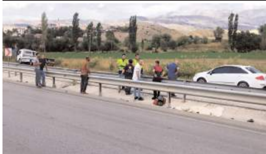
Kaza, Osmaniç ilçesine bağlı Gecek köyü yakınlarında meydana geldi.