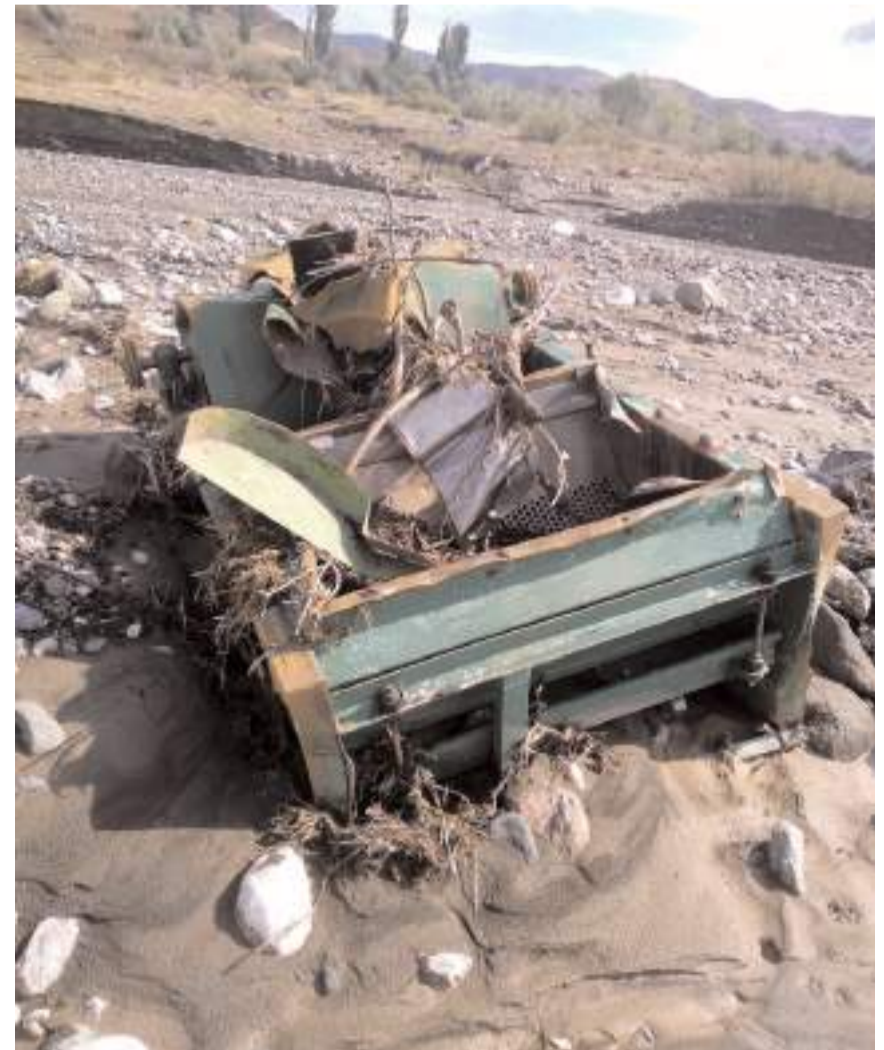
Sarıcalar Köyü'nde sele kapılan patos Haciosman köyü yakınlarında bulundu.

Yaşanan sel felaketinin ardından ilçeye bağlı Gülözlük köyünde vatandaşlar mahsur kaldı.