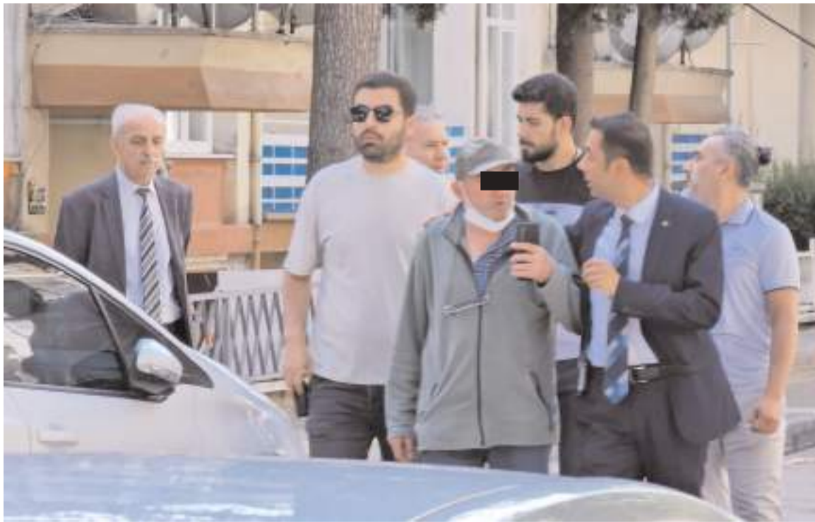
Uzun süren ikna çabalarının sonunda A.R. teslim oldu.