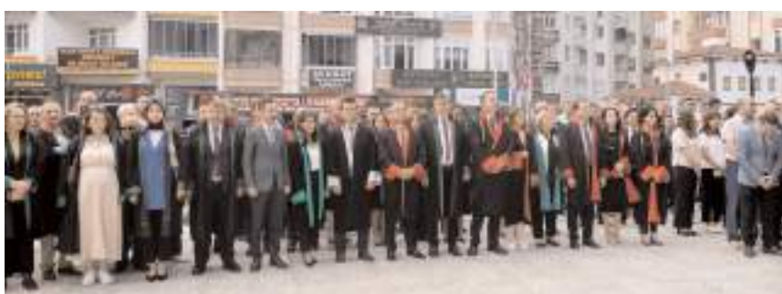
Yeni Adli Yılın başlaması nedeniyle Adliye Sarayı önünde tören yapıldı.