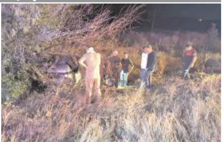
Kaza Çorum-Ankara kara yolu Sungurlu OSB Kavşağı yakınlarında meydana geldi.

Sağlık ekiplerince Sungurlu Devlet Hastanesi'ne kaldırılan yaralılar, ilk müdahalenin ardından Hitit Üniversitesi Erol Olçok Eğitim ve Araştırma Hastanesi'ne sevk edildi.(AA)