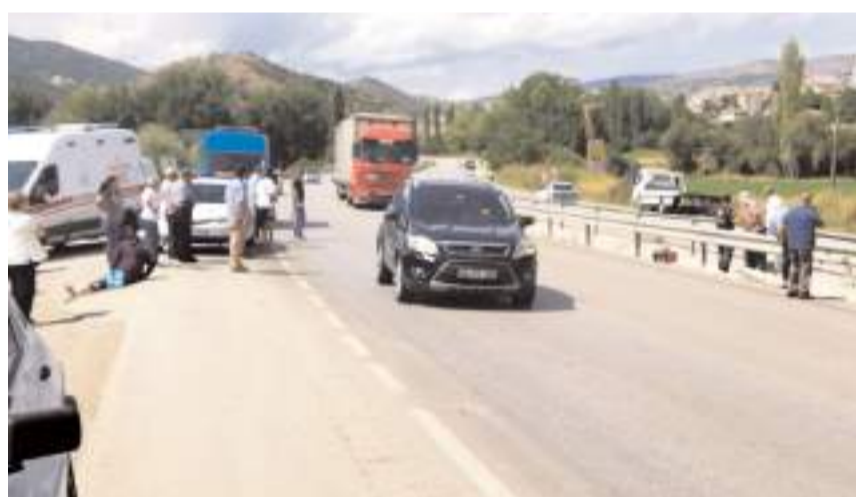
Yaşlı kadın olay yerinde hayatını kaybetti.

Çorum'un Osmaniç ilçesinde meydana gelen trafik kazasında 1 kişi hayatını kaybetti.