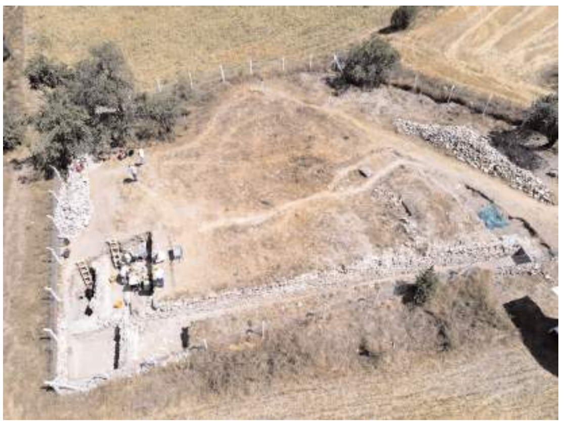
Kalehisar ören yerinde bilimsel kazılar devam ediyor.