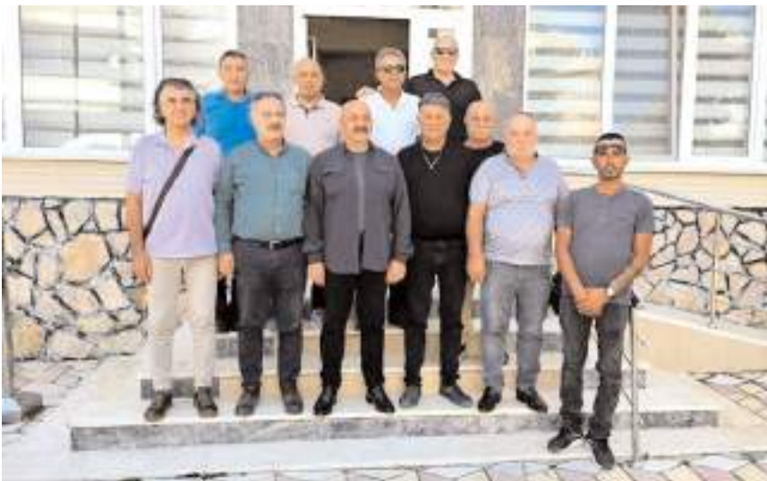
Muhtarlar Ortaköy Belediye Başkanı Taner İsbir'i ziyaret etti.

Ortaköy Belediye Başkanı Taner İsbir, Kuzey Kıbrıs Türk Cumhuriyeti'nden (KKTC) gelen muhtarları misafir etti.