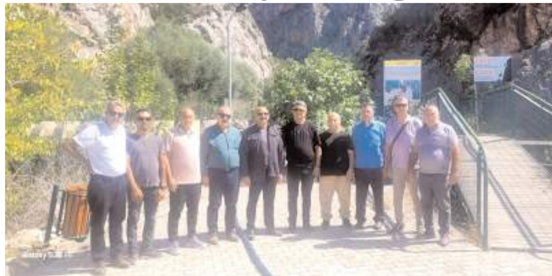
Muhtarlar ilçenin tarihi ve turistik yerlerini gezdiler.