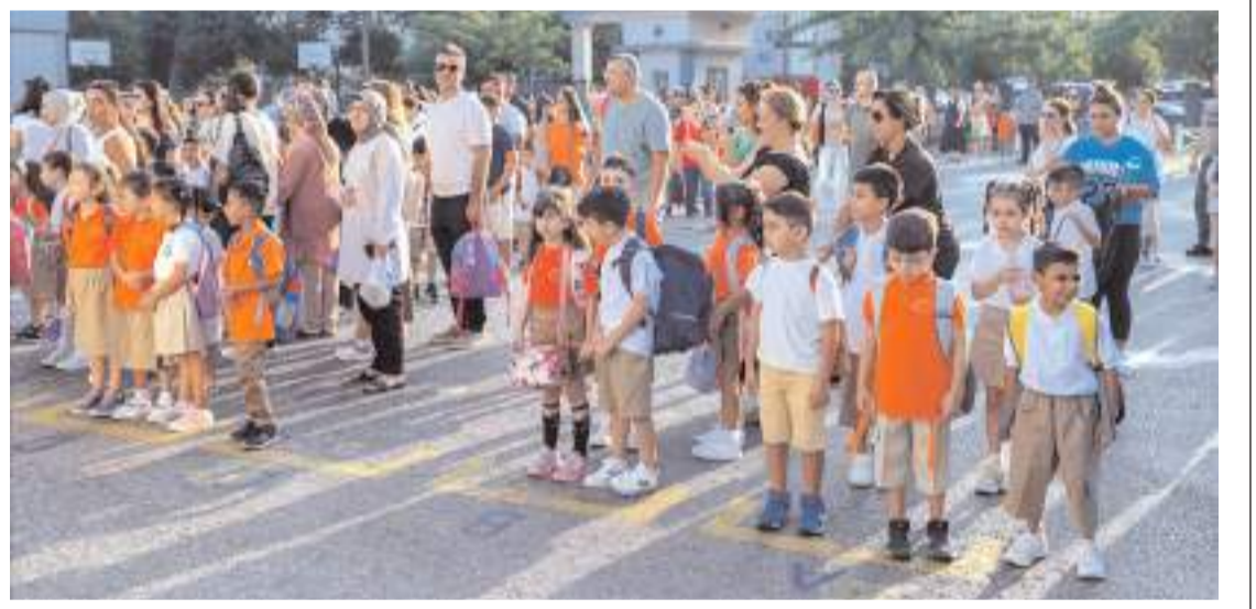
Öğrenciler okula başlamanın heyecanını yaşadılar.

Öğrenci ve veliye eğitim ortamı, öğretmen ve arkadaşlarını tanıtan uyum haftası programı kapsamında Çorum'da minikler öğretmenleriyle buluştu.