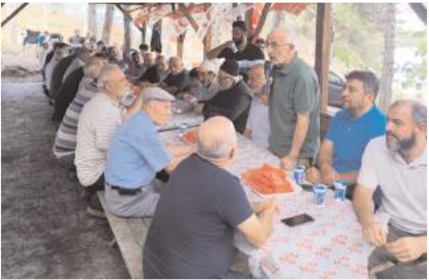
Toplantıda parti çalışmaları değerlendirildi.