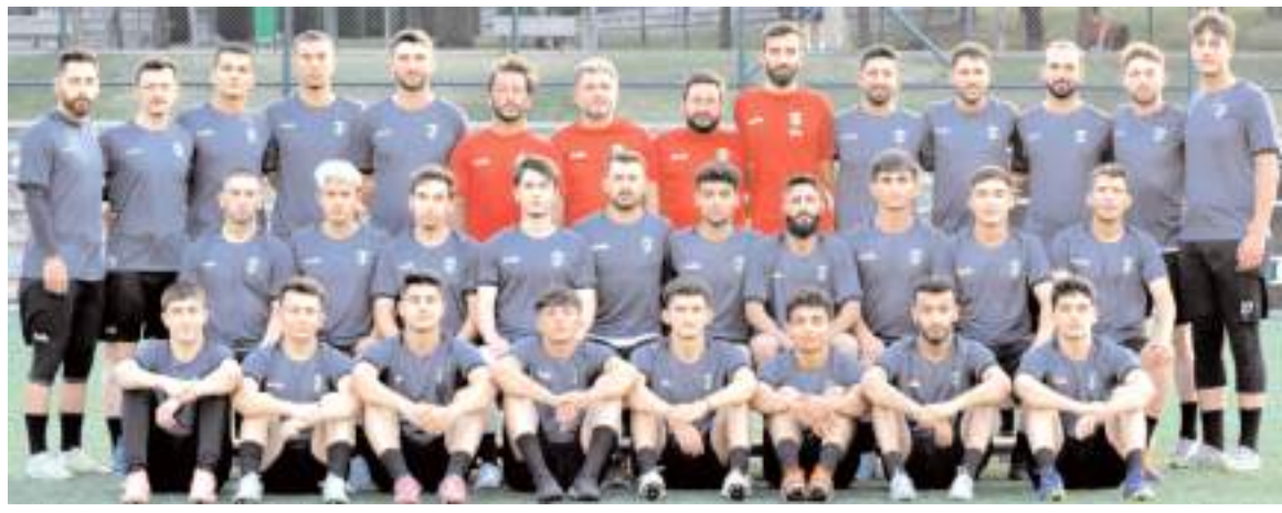
Mimar Sinanspor'un Bölgesel Amatör Ligdeki fikstürü yarın çekilecek fikstür sonunda belli olacak