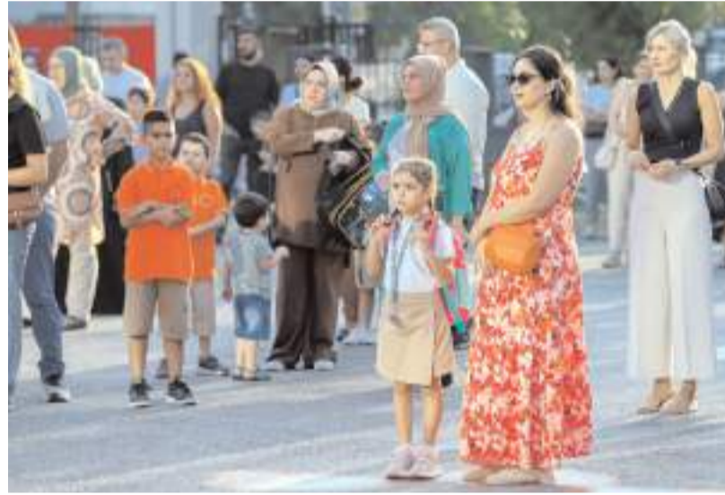
Anaokulu ve ilkokul 1. sınıf öğrencileri için bir haftalık uyum eğitim başladı.

Çorum'da anaokulu ve ilkokul 1. sınıf öğrencileri, uyum haftası kapsamında okula başladı.