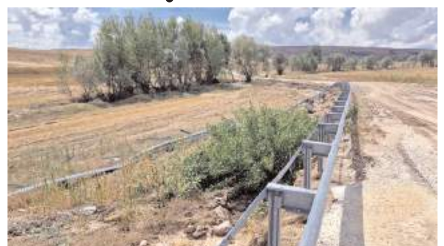
Şiddetli yağış yollarda hasara neden oldu.

Ekiplerin bölgede çalışmaları devam ediyor. (İHA)