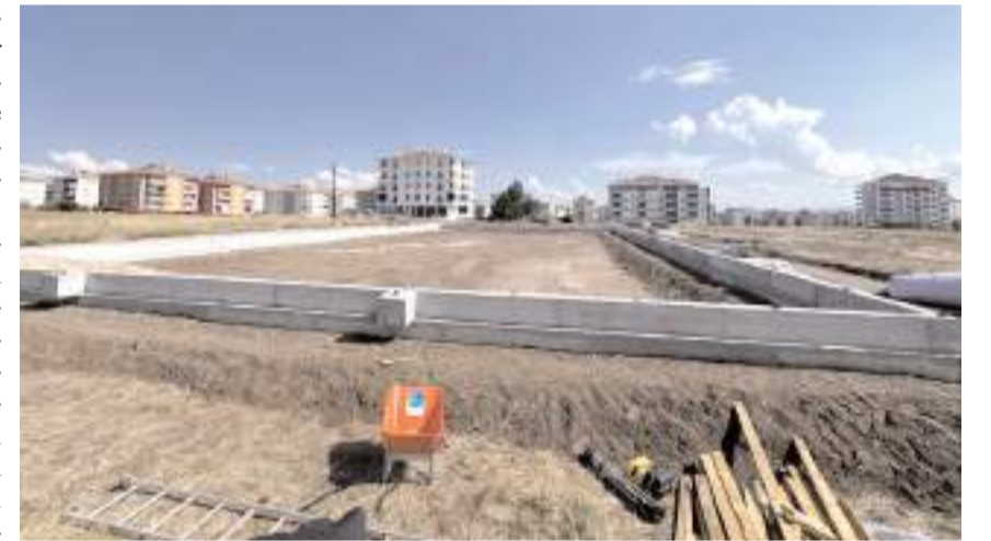
Mahallelerde bulunan semt sahalarında bakım, onarım ve yenileme çalışmaları yapıldı.

zamanda kullanıma hazır hale getirerek gençlerimizin hizmetine sunacağız. Bayat Gediği'nde de gençlerimiz için yeni bir saha yapıyoruz. Çalışmalar başladık ve kısa süre içerisinde tamamlayarak gençlerimizin hizmetine sunacağız. Her zaman sporun ve sporunun yanında yer alıyoruz, gençlerimize spora teşvik ediyoruz. Çorum'u bir spor kenti haline getirmek için göreve geldiğimiz günden bu yana çalışmalarımızı artırarak sürdürüyoruz" dedi. (Haber Merkezi)