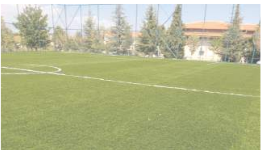
Sahanın tel örgüleri ile sentetik çimi yeniledi.