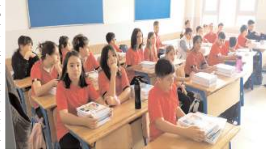
Ders kitaplarını öğrenciler masalarında hazır buldular.

Türkiye Yüzyılı Maarif Modeli bu öğretim yılında; Okul öncesi, 1, 5 ve 9. sınıflarda uygulanacak, öğretmen eğitimleri ise tamamlandı. Birinci dönem ara tatili 11 Kasım 2024 Pazartesi günü başlayacak ve 15 Kasım 2024 Cuma günü sona erecek. Yarıyıl tatili, 20 Ocak 2025 Pazartesi başlayacak ve 31 Ocak 2025 Cuma günü sona erecek. İkinci dönem 3 Şubat