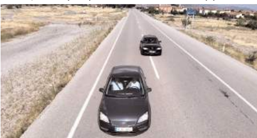
Havadan yapılan denetimlerde, kazalara neden olan hatalı sollama, şerit ihlali, seyir halinde cep telefonu kullanımı, hız sınırını aşma gibi kural ihlallerinin önlenmesine yönelik denetim yapıldı.

Çorum'un Kargı ilçesinde polis ekipleri, dron ile trafik denetimi yaptı.