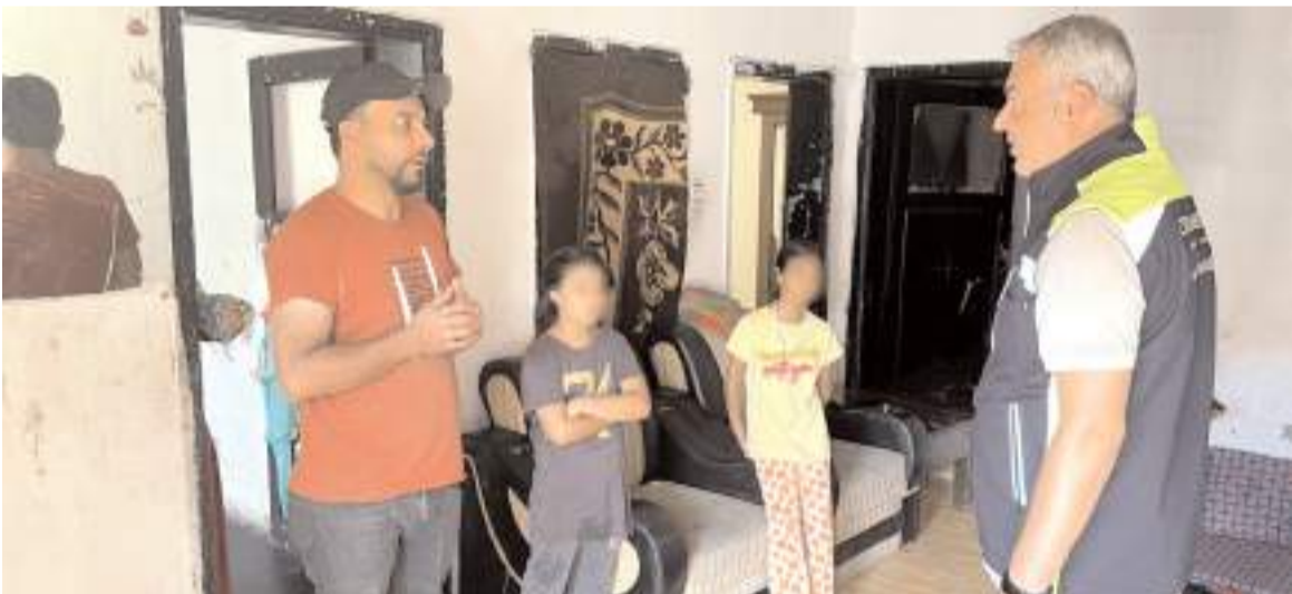
Basın Yayın ve Halkla İlişkiler Müdürlüğü ekipleri aileyi ziyaret etti.

Çöpten kağıt toplayan zihinsel ve bedensel engelli çocuğun darbedilmesiyle ilgili 2 kişi gözaltına alındı. Vali Yardımcısı Yeliz Mercan (solda), 4 çocuklu, sokaklardan kağıt toplayarak geçimini sağlamaya çalışan Irak uyruklu ailenin Üçtutlar Mahallesi'ndeki evini ziyaret ederek, "geçmiş olsun" dileklerini ilettiler.