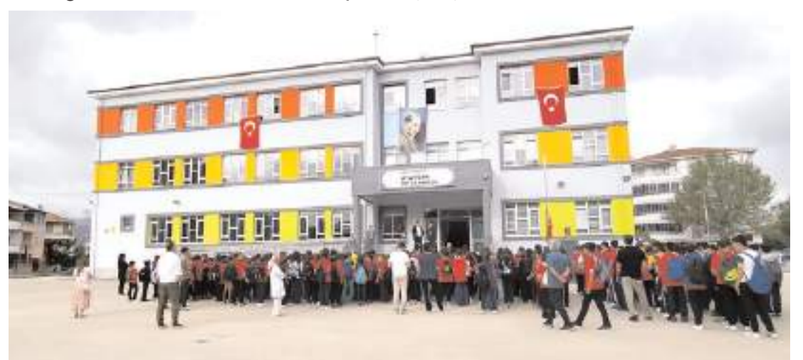
Osmancık Atatürk Ortaokulu yeni binasında ilk ders zili çaldı.

Osmancık'ta 1963 yılında eğitim-öğretime başlayan Atatürk Ortaokulu'nun mevcut binası, 24 Şubat 2023 Cuma günü ders bitiminde eğitim öğretime kapatılmış öğrencileri ise 27 Şubat 2023 tarihi itibarıyla Akşemseddin İlkokulunda eğitime başlamıştı. Hakkında YIK-YAP kararı bulunan ve 12 sınıf, 4 kattan oluşan okulun yeni binasının inşaatı tamamlanarak 2024-2025 eğitim-öğretim yılına hazır hale geldi. (İHA)