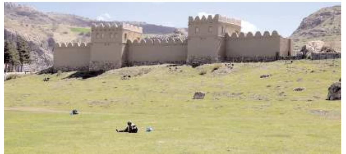
İl genelinde toplam 202 sit alanı bulunuyor.

İl genelinde toplam 202 sit alanı bulunurken bunların 199 arkeolojik, 3'ü ise kentsel alandan meydana geldi.