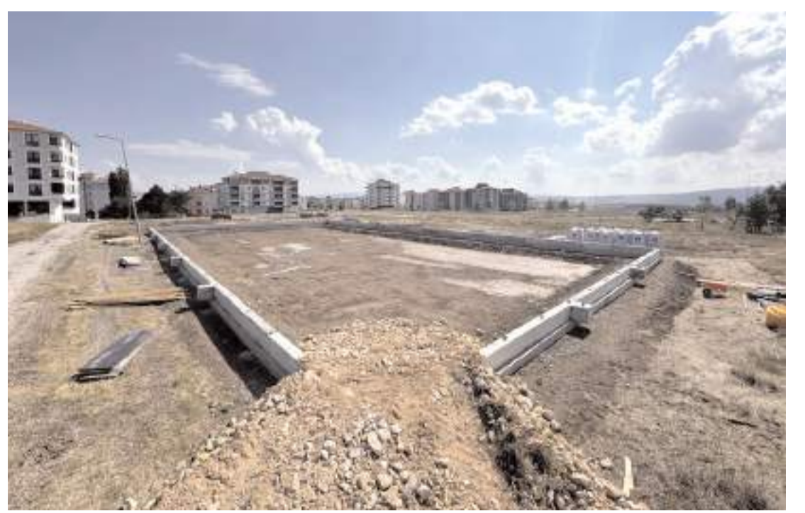
Bayat Gediği'ne yeni bir saha yapılıyor.

İ.A'nın tedavisinin yoğun bakım servisinde devam ettiği öğrenildi.(AA)