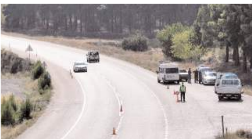
Çorum-Sinop kara yolunda dron destekli trafik denetimi yapıldı.