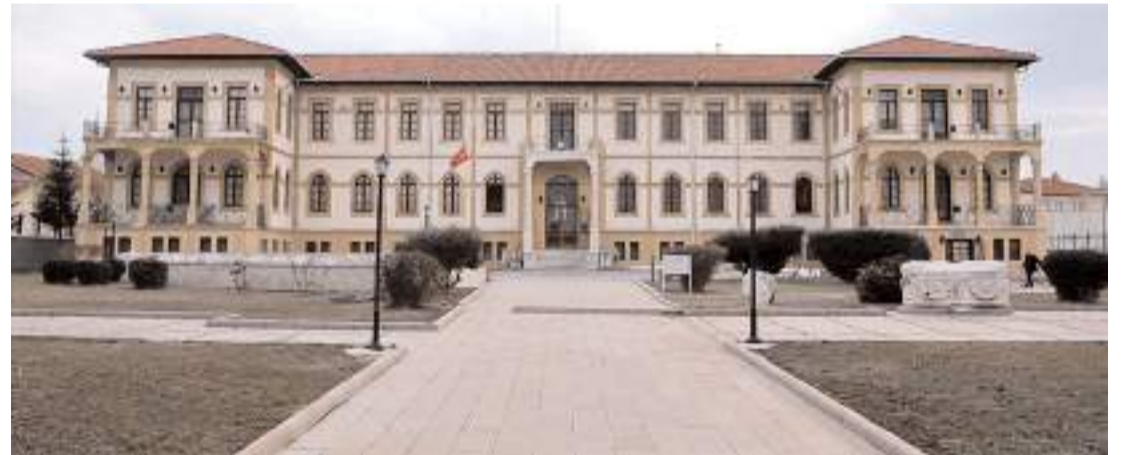
Çorum'da 6 bin 981 müze kart satıldı.

Çok sayıda eseri ve bestesi bulunan Meftuni Topcu (Ozan Meftuni), son dönemlerde "Heri Çorumlu musun" adlı türküsü ile adını duyurmuştu.