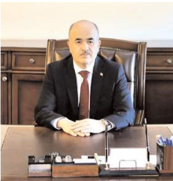
Vali Zülkif Dağlı

■ Çorum Valisi Zülkif Dağlı, çöpten kağıt toplayan zihinsel ve bedensel engelli çocuğun darbedilmesiyle ilgili yaptığı açıklamada konunun hassasiyetle takip edildiğini belirtti. * HABERİ'7'DE