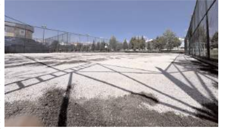
Eskiye üç saha yenilendi.