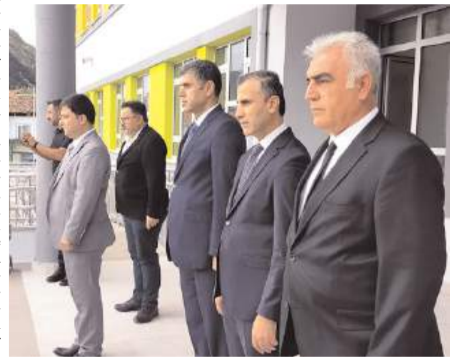
Osmancık Atatürk Ortaokulu'nda yapılan törene ilçe protokolü de katıldı.