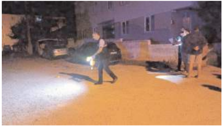
Olay, Gülabibey Mahallesi Kapaklı 9. Sokak üzerinde meydana geldi.

Olay, Gülabibey Mahallesi Kapaklı 9. Sokak üzerinde meydana geldi. Edinilen bilgiye göre, olay yerine gelen kimliği belirsiz kişi ya da kişiler park halindeki otomobile tabanca ile ateş açtı. Araç sahibinin ihbarı üzerine olay yerine polis ekibi sevk edildi. Olayda herhangi bir can kaybı ya da yaralanan olmazken, otomobilde maddi hasar meydana geldi. Yapılan incelemede olay yerinde 3 adet boş kovan bulan polis ekiple-