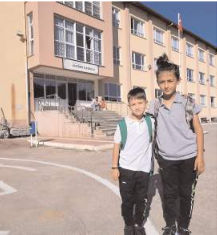
Bayat ilçesinde 19 eğitim kurumunda 1550 öğrenci ders başı yaptı.

İskilip ve Bayat ilçelerinde öğrencileri yeni eğitim öğretim yılının başlamasıyla birlikte ilk ders heyecanı yaşandı.