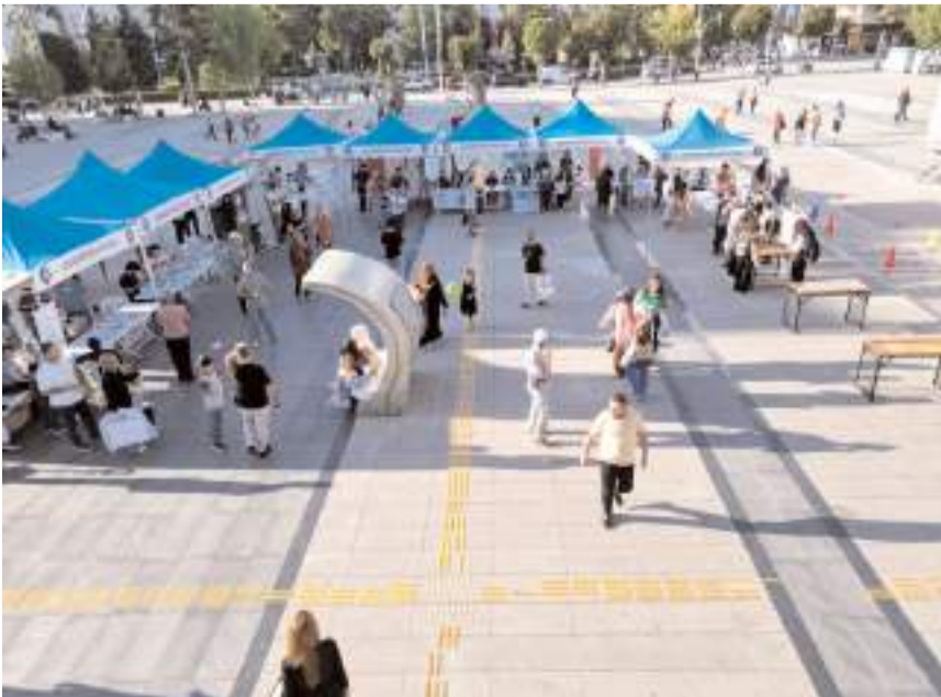
Etkinlik Kadeş Barış Meydanı'nda gerçekleştirildi.