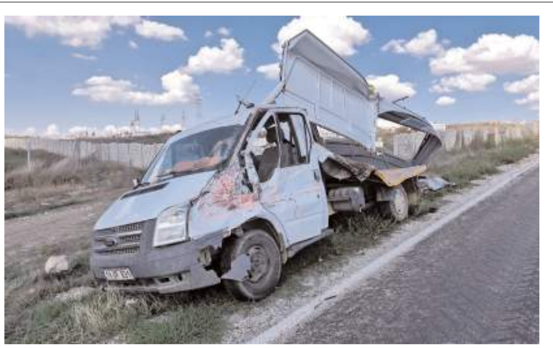
Kaza, Alaca-Ünalán köyü karayolunda meydana geldi.