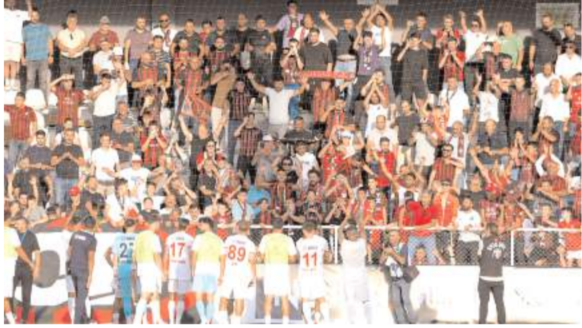
Çorum FK taraftarları ve futbolcuları maçın ardından galibiyet sevincini hep birlikte böyle yaşadılar

der görülen bu fair play davranış maçı izleyen herkesi son derece mutlu etti.