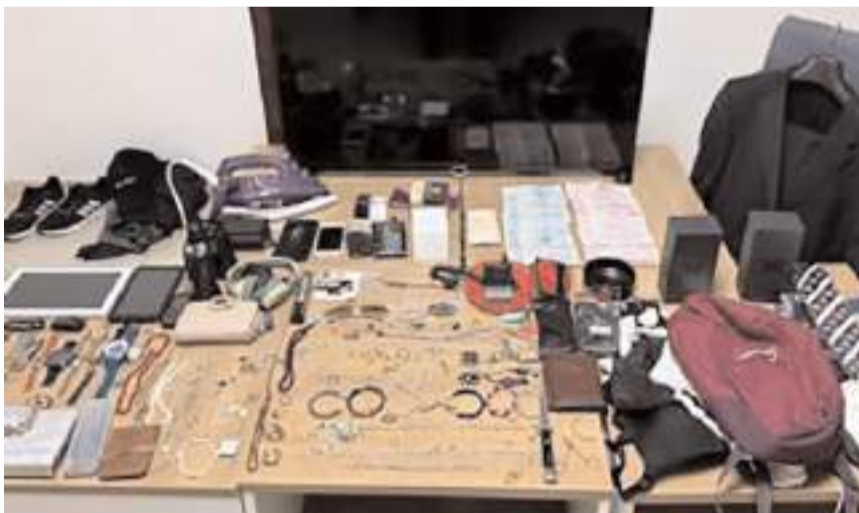
Zanlının evinde yapılan aramalarda çok sayıda çalıntı eşya ele geçirildi.

Zanlı, işlemleri için polis merkezine götürüldü. (İHA)