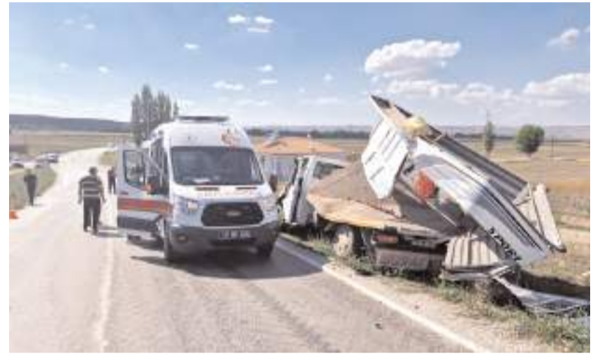
Yaralılara 112 acil sağlık ekipleri müdahale etti.

Kazayla ilgili inceleme başlatıldı. (İHA)