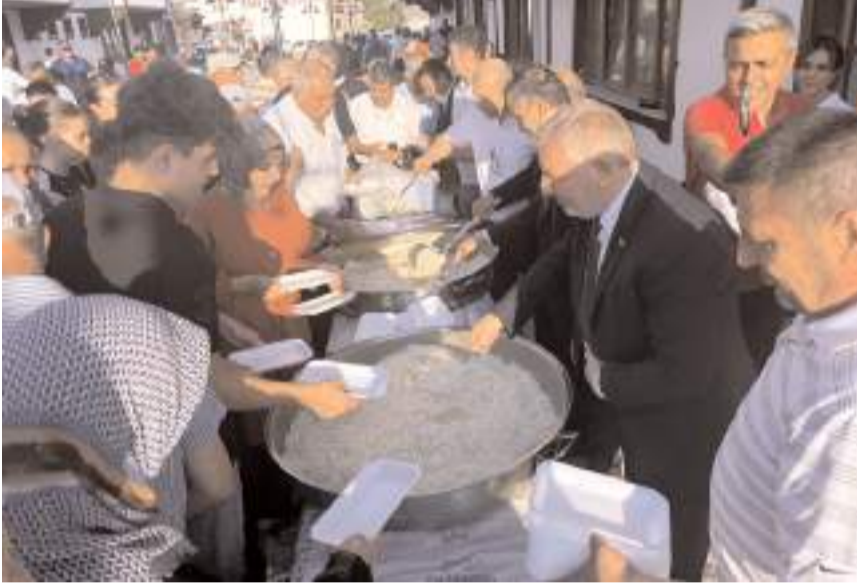
Vatandaşlara pilav ikram edildi.