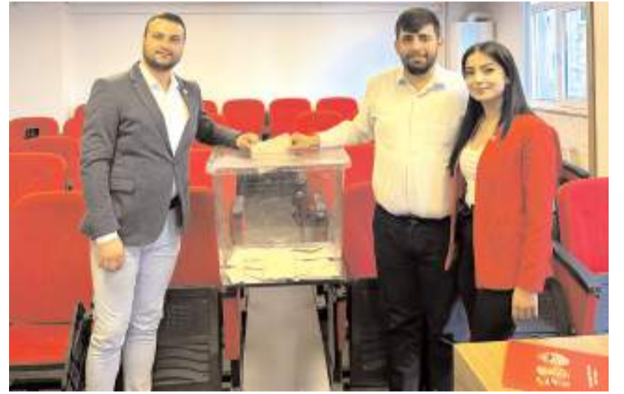
Kongrede 145 delegeden 140'ı oy kullandı.