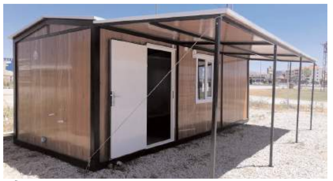
Özer Konteyner yönetimi, Sonbahar kampanyası adı altında cazip fiyatlarla ürün sunumuna başladı