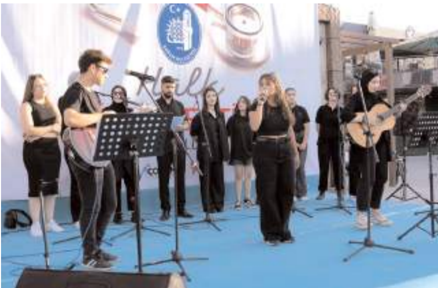
Kent Konseyi Gençlik Meclisi üyeleri tarafından oluşturulan müzik grubu müzik ziyafeti sundu.