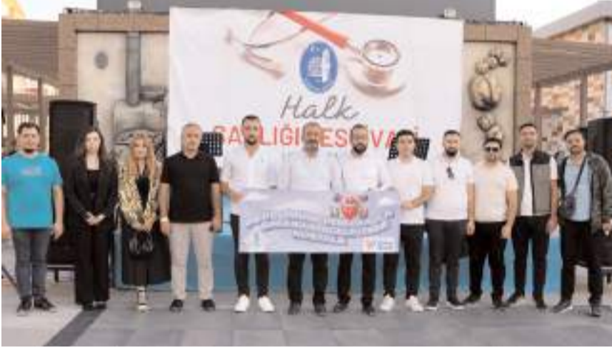
Festival Çorum Belediyesi Kent Konseyi ve Gençlik Meclisi tarafından düzenlendi.