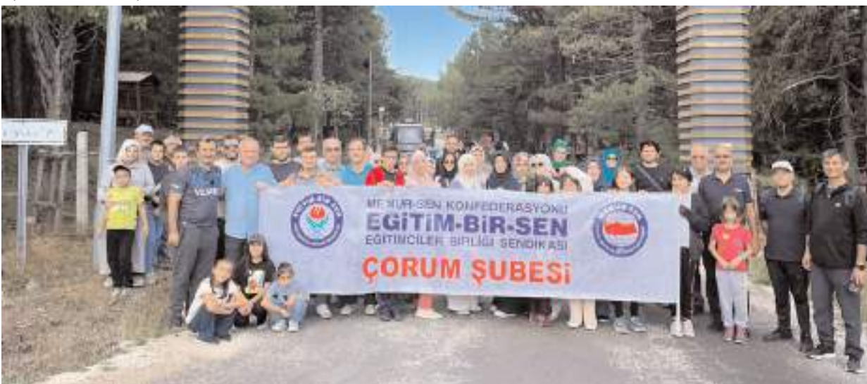
Programın sonunda hatıra fotoğrafı çekildi.