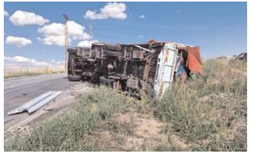
Kazaya karışan kamyon yolun ortasına devrildi.