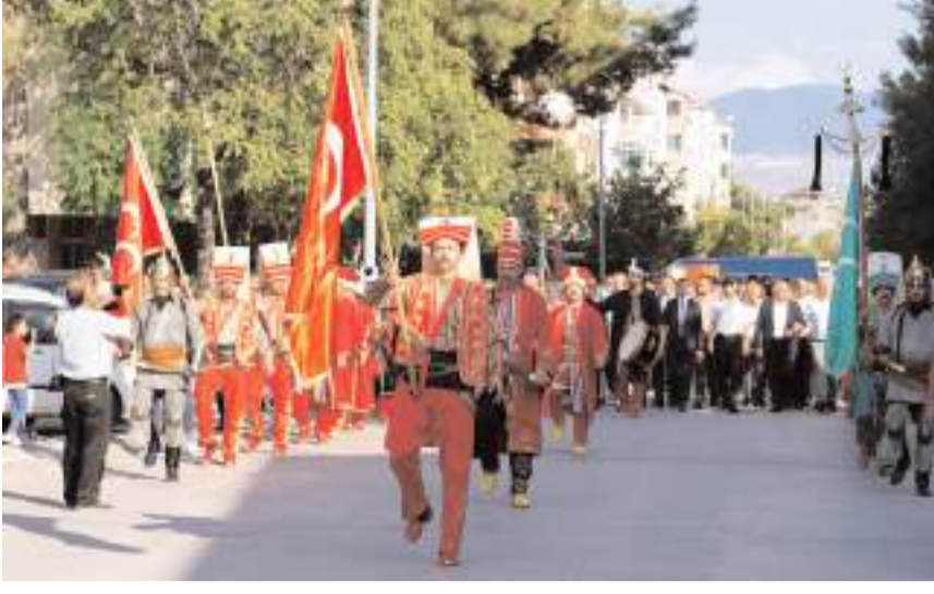
Festivalin açılışında kortej yürüyüşü düzenlendi.