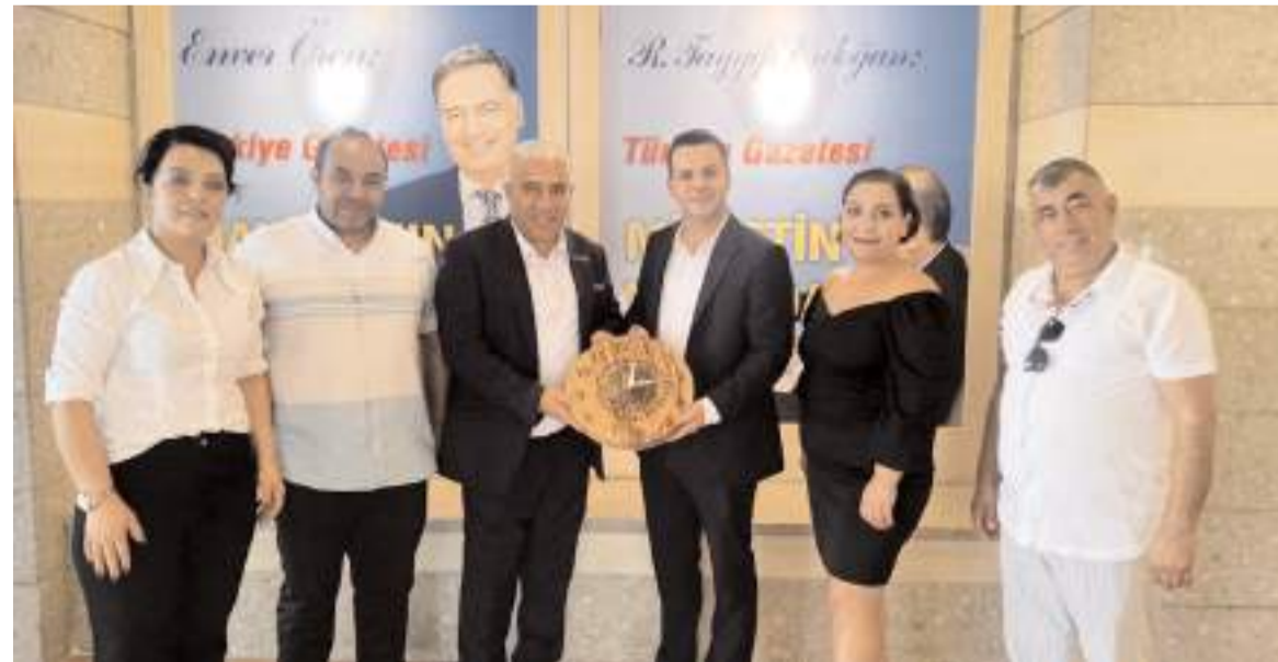
Çorumlu İş Adamları Platformu yönetim kurulu başkanı ve üyeleri Antalya İhlas Matbaacılık Türkiye Gazetesine ziyarette bulundu.

yelerin karşılıklı işbirliği ve diyalog halinde sorunları çözerek, hizmet üretmek halkın beklentilerine en güzel şekilde cevap vereceğini bildirerek, Ankara'da son derece verimli ziyaretler gerçekleştirdiklerini söyledi. (Haber Merkezi)