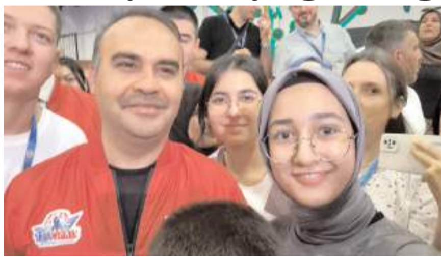
Proje ekibi ile Sanayi ve Teknoloji Bakanı Mehmet Fatih Kaçır birlikte...