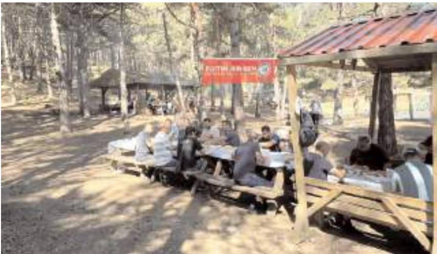
Yürüyüşün ardından katılımcılara ikramda bulunuldu.