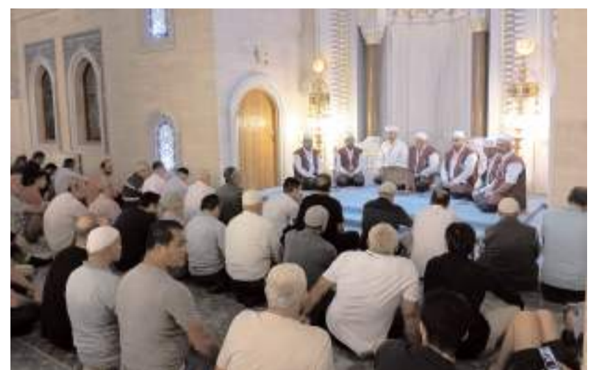
Programda ilahiler okundu.

Namaz sonrasında ise cami çıkışında hayırseverler ve Çorum Belediyesi tarafından vatandaşlara ikramlarda bulunuldu.