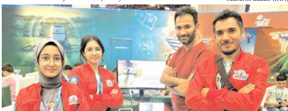
"Ateş Böceği" projesi, buldukları kategoride büyük ilgi gördü.

Alaca Bilim ve Sanat Merkezi'nin, 5-8 Eylül 2024 tarihlerinde gerçekleştirilen Teknofest 2024 Antalya yarışmalarında, başarıyla sundukları ve tamamen kendi imkânlarıyla geliştirdikleri "Ateş Böceği" projesi, buldukları kategoride büyük ilgi gördü.