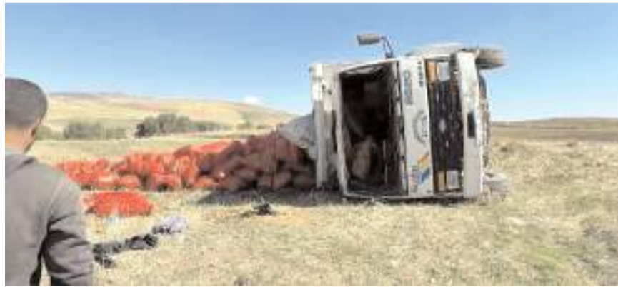
Kaza, Sultan Köyünde yaşandı.

Kazayla ilgili olarak başlatılan soruşturmanın devam ettiği öğrenildi. (İHA)