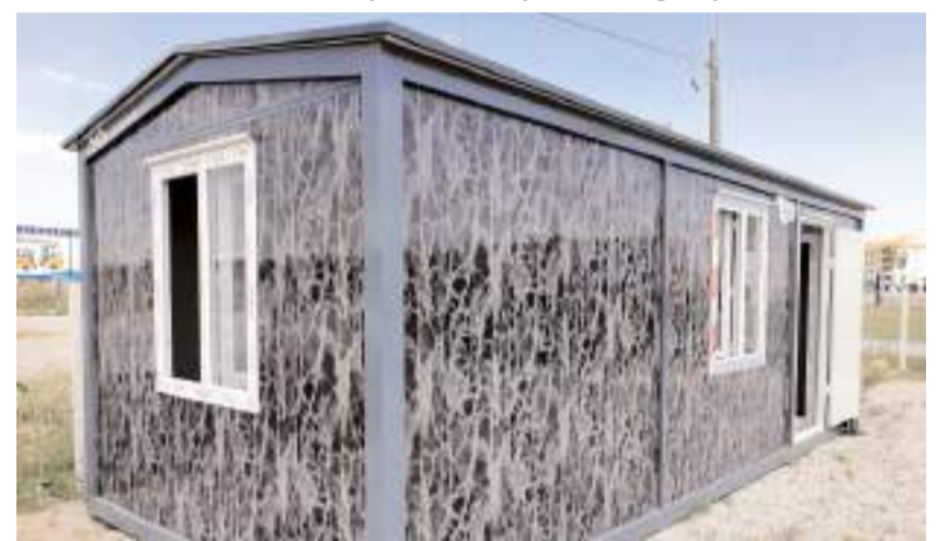
Farklı dizayn ve ebat çalışmalarından oluşan konteyner Çorum halkını bekliyor.