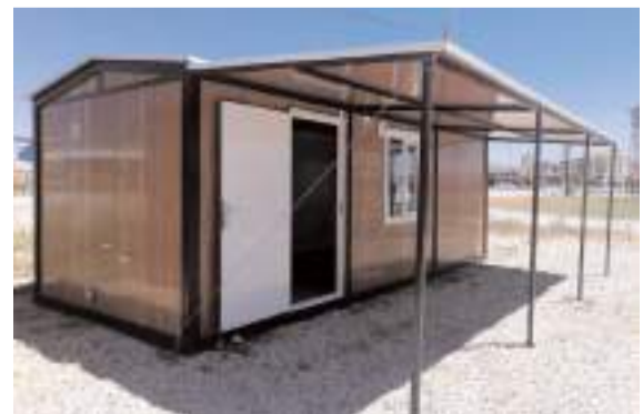
Parklı dizayn ve ebat çalışmalarından oluşan konteyner Çorum halkını bekliyor.