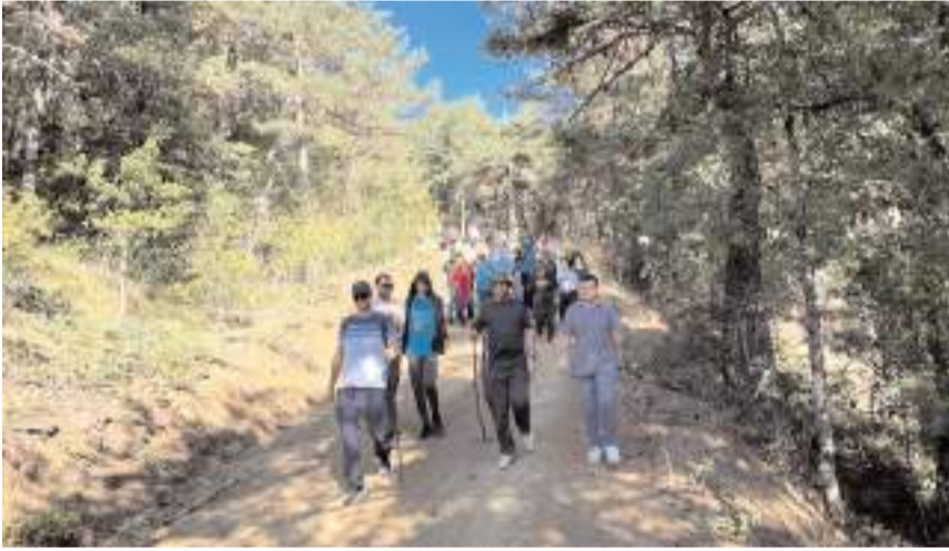
Doğa yürüyüşü yaklaşık 3,5 kilometre sürdü.

Belli aralıklarla ve farklı yerlerde doğa yürüyüşlerini düzenlemeye devam edeceklerini kaydeden Okumuş, "Doğayı ve sporu seven herkesi etkinliklerimize bekliyoruz" ifadelerini kullandı. (Haber Merkezi)