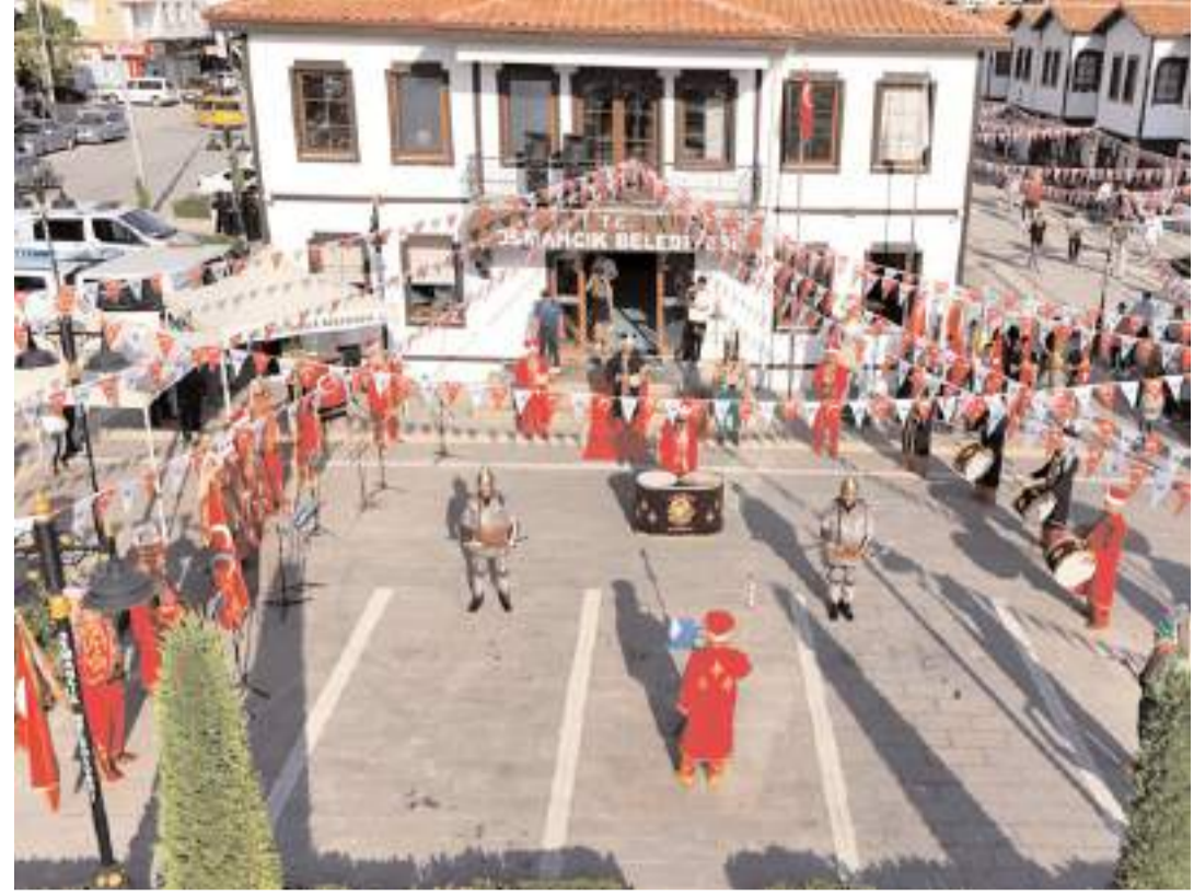
Belediye önünde yapılan törende mehteran bölüğü konser verdi.

Festival etkinlikleri kapsamında 14 Eylül Cumartesi günü yağlı güreş müsabakaları, 22 Eylül Pazar günü ise rahvan at yarışları düzenlenecek.(AA)