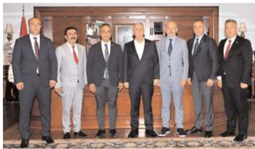
CHP heyeti Ankara Büyükşehir Belediye Başkanı Mansur Yavaş'ı ziyaret etti.