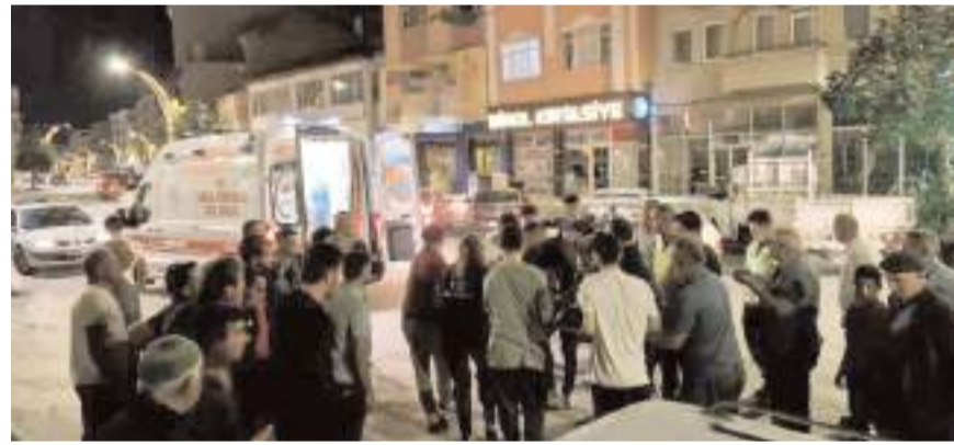
Yaralılar 112 acil sağlık ekipleri tarafından hastaneye kaldırıldı.