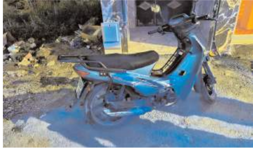
Kaza, Günhan Mahallesi Yozgat Caddesi üzerinde meydana geldi.

Kazayla ilgili başlatılan soruşturma devam ediyor. (İHA)