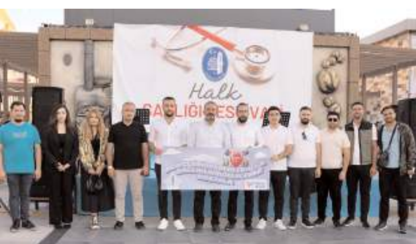
Festival Çorum Belediyesi Kent Konseyi ve Gençlik Meclisi tarafından düzenlendi.

Çorum Belediyesi Kent Konseyi ve Gençlik Meclisi tarafından şehirde ilk defa Halk Sağlığı Festivali düzenlendi.