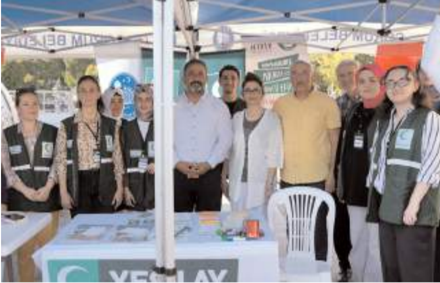
Festivalde STK'lar stant açtı.