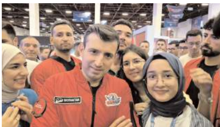
Proje ekibi ile Selçuk Bayraktar birarada...