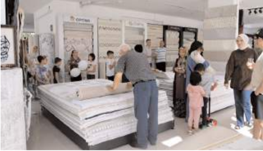
Açılış ardından davetliler ürünleri inceledi.