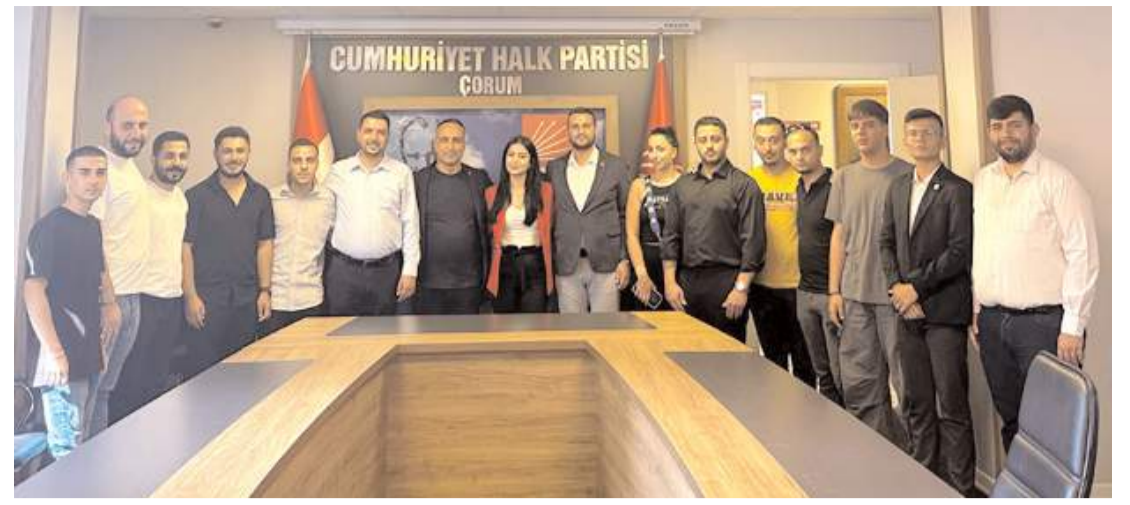
CHP Çorum İl Gençlik Kolları 17. Olağan Kongresi İl Başkanlığında yapıldı.

HAKİMİYET, merhuma Allah'tan rahmet, ailesi ve sevenlerine başsağlığı diler.