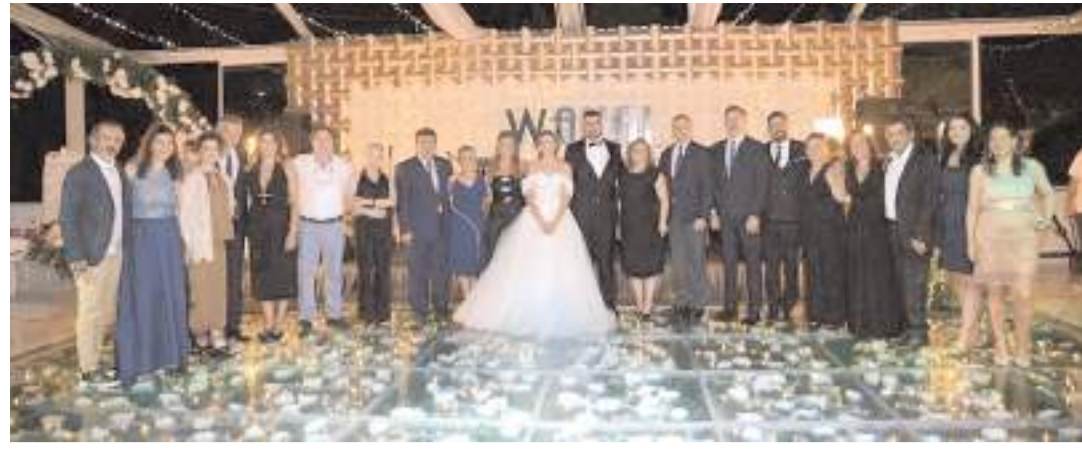
Genç çiftin düğün töreni Ankara'nın Gölbaşı ilçesinde yapıldı.

HAKİMİYET, genç çifti tebrik eder ömür boyu mutluluklar diler. (Haber Merkezi)