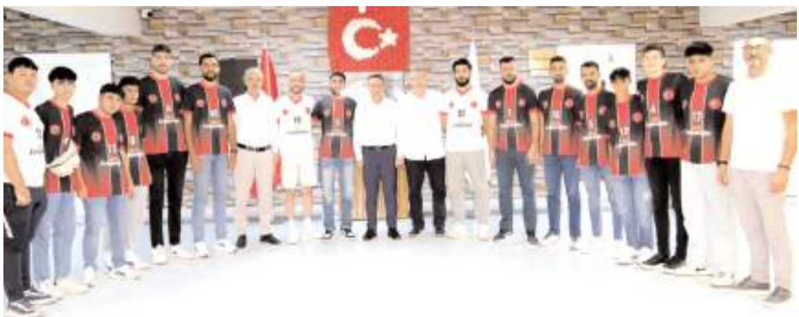
Sungurlu Belediyespor erkek voleybol takımı sporcu ve teknik ekibi ziyaret sonrasında toplu halde görülüyor