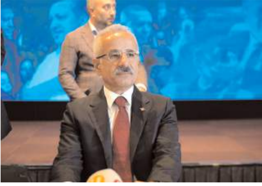
Ulaştırma ve Altyapı Bakanı Abdulkadir Uraloğlu

"Samsun İçin Her Daim Birlikte Özümlüden Geleceğe Türkiye Buluşmaları"na katılan Ulaştırma ve Altyapı Bakanı Abdulkadir Uraloğlu, Kırıkkale ile Çorum arasındaki 115 kilometrelik demiryolu ihalesini bu yıl mutlaka yapacaklarını söyledi.