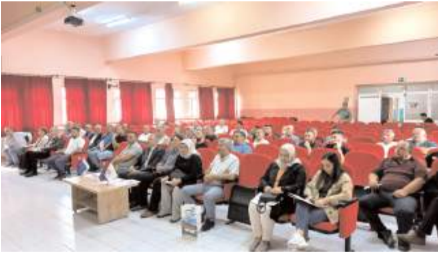
"Arıları Yaşat Geleceğini Kazan Projesi" kapsamında çiftçilere eğitim verildi.