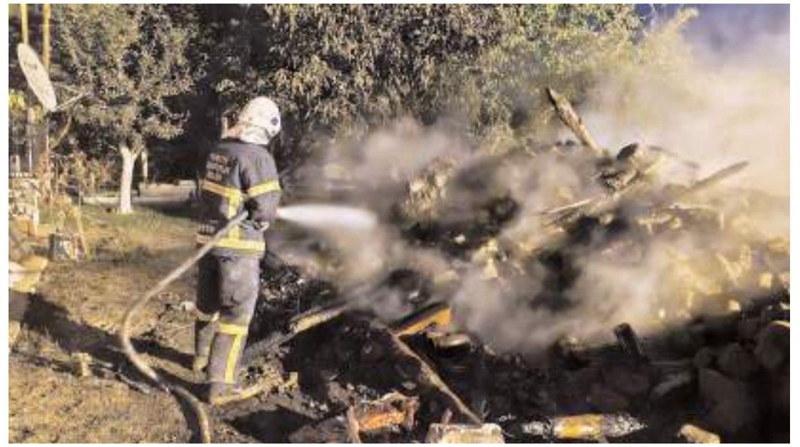
Olay, Alaca ilçesi Eskiyyapar köyünde meydana geldi.

Denetimlerin devam edeceği bildirildi. (AA)