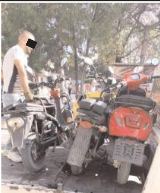
Uygulamada 790 motosiklet denetlendi.

Konuyla ilgili İl Emniyet Müdürlüğünden yapılan açıklamada, "İlimiz genelinde halkımızın huzur ve sükununu temin etmek, emniyet ve asayiş sağlamak amacıyla yukarıda belirtilen konular başta olmak üzere trafik denetimleri yoğunlaştırılarak devam edecektir" denildi. (Haber Merkezi)