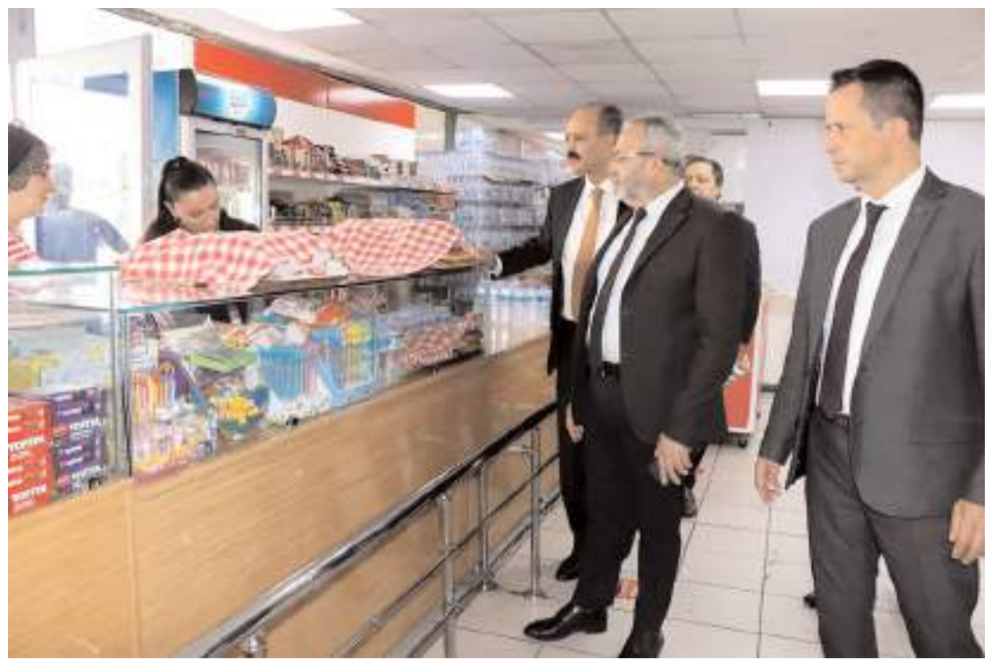
Denetimlerde işletmelerin teknik ve hijyenik koşulları kontrol edildi.

Mecitözü Yatılı Bölge Ortaokulu Konferans Salonu'ndaki eğitimde çiftçilere gençlerin tarım sektöründeki önemi ve sektöre geçiş imkanları, arıcılık ve arı ürünleri, tozlaşmanın önemi, gezginci arıcılık, arıcılığın iklim değişikliği üzerine katkıları, tarımda sigortalılık ve önemi ile TKDK arıcılık destekleri konusunda bilgiler verildi.(AA)