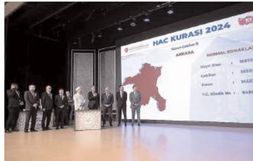
Kayıtlar 27 Eylül 2024 tarihine kadar uzatıldı.

Başkan Erbaş, "2025 Yılı Hac ön kayıt ve kayıt yenileme işlemleri vatandaşlarımızdan gelen yoğun talep üzerine 27 Eylül 2024 tarihine kadar uzatılmıştır. Vatandaşlarımız hac ön kayıt ve kayıt yenileme iş-