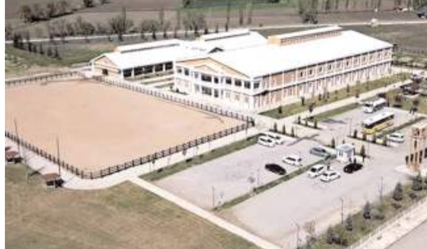
At Çiftliği canlandırılacak ve arkasındaki bölüme ise Çorum FK alt yapı tesisi yapılacak