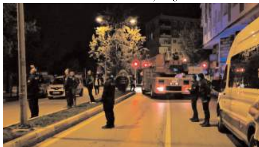
Polis ekipleri ve itfaiye bölgede önlem aldı.