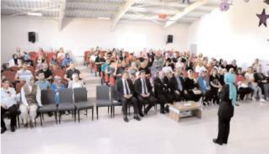
Proje kapsamında eğitimler başladı.

Milli Eğitim Bakanlığı ile Aile ve Sosyal Hizmetler Bakanlığı arasında yapılan işbirliği kapsamında BİZ projesi çerçevesinde okula yeni başlayan öğrencilerin okul ortamına ve öğretmenlerine alışmasını sağlamak, oyunlar ve etkileşimli etkinlikler ile kaygılarını azaltmak, aile ilişkilerini güçlendirmek, ailelerin öğretmenlerle tanışması ve iletişim kurması için fırsatlar sunmak, farklı kültürlerden gelen öğrencilerin ve ailelerinin bir araya gelerek kaynaklarını sağlamak, velilere çocuklarının eğitimi konusunda reh-