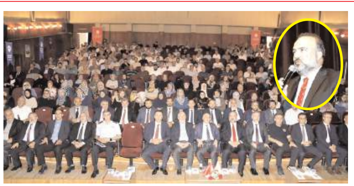
Konferansa katılım yüksek oldu.