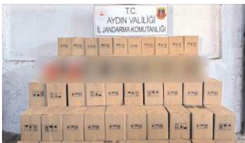
Operasyonda 8 ton 340 litre zeytinyağı ele geçirildi.

Aydın'da kargo ve şehirlerarası otobüs yolu ile 8 ton 340 litre zeytinyağını çeşitli illere göndermek isteyen 3 şüpheli jandarma ekipleri tarafından suçüstü yakalandı.