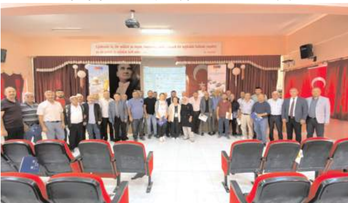
Eğitimin ardından toplu hatıra fotoğrafı çekildi.

Çorum'un Mecitözü ilçesinde "Arıları Yaşat Geleceğini Kazan Projesi" kapsamında çiftçilere eğitim verildi.