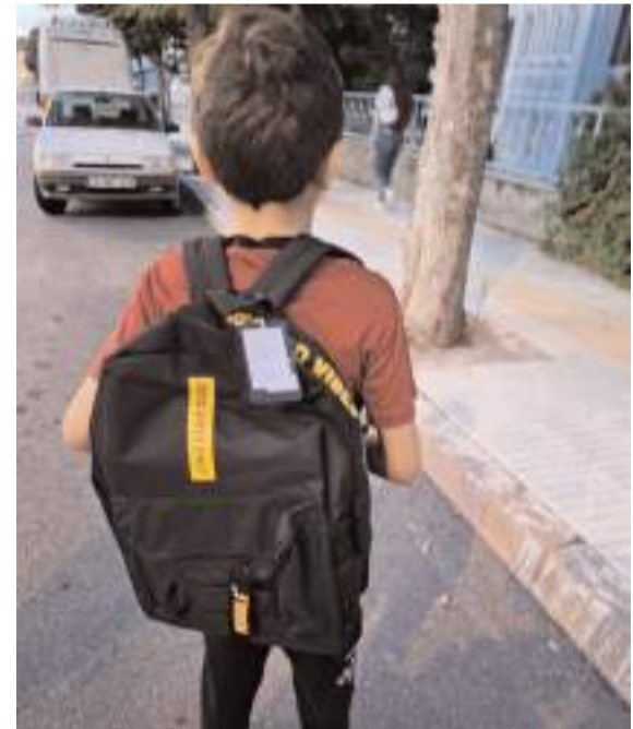
Nefes Yardımlaşma ve Dayanışma Derneği, ihtiyaç sahibi ailelerin yükünü hafifletmeye devam ediyor.

Çocuklara yatırım yapmanın, geleceğe yatırım yapmak olduğunu vurgulayan Avcı, "Öğrencilerimiz için Nefes Yardımlaşma ve Dayanışma Derneği olarak üzerimize düşeni en iyi şekilde yapma yönünde özve-