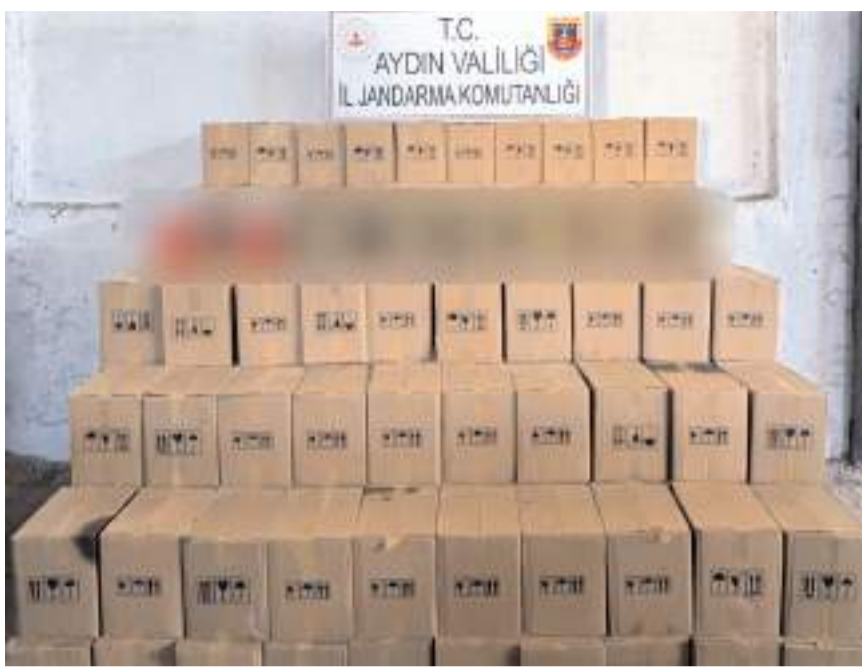
Operasyonda 8 ton 340 litre zeytinyağı ele geçirildi.