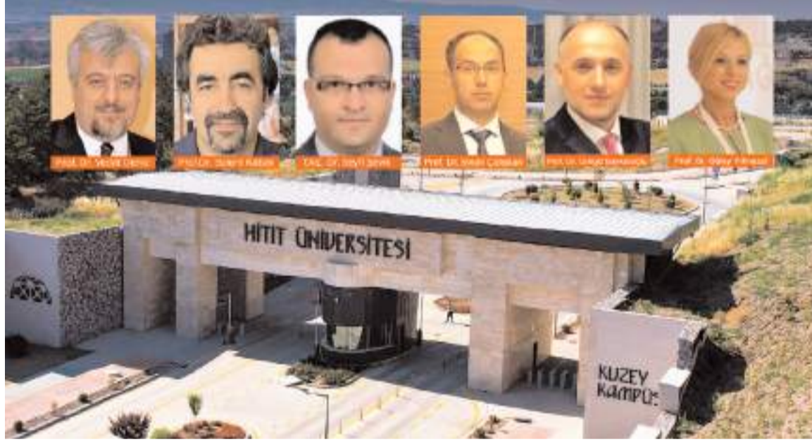
"Dünya'da En Etkili Bilim İnsanları-202" listesine 6 öğretim üyesi girme başarısı gösterdi.