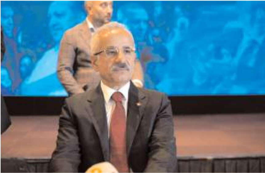
Ulaştırma ve Altyapı Bakanı Abdulkadir Uraloğlu