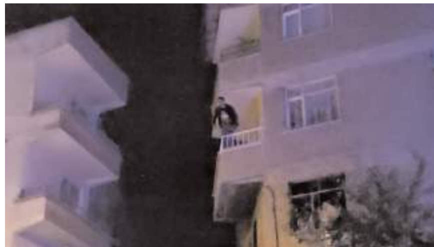
Olay Kale Mahallesi Kıbrıs Caddesi üzerinde bulunan 4 katlı binada meydana geldi.

Şahıs yaklaşık 2 saat sonra polis ekiplerince ikna edilerek aşağı indirildi.