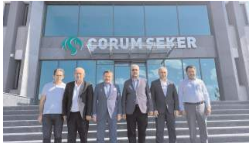
Milletvekili Av. Yusuf Ahlatcı, Çorum Safi Şeker Fabrikası'nı ziyaret etti.