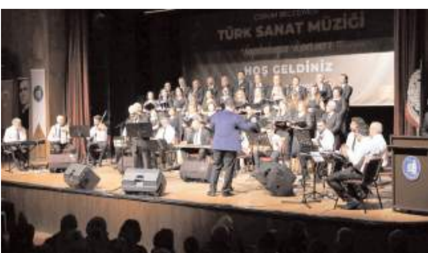
Koro ilk çalışmasını 19 Eylül Perşembe günü gerçekleştirecek.

Yağbat, "Korusumuz yeni dönemde de sanat müziğinin zengin repertuarından hazırladıkları birbirinden güzel şarkılarla unutulmaz konserlere imza atacak. Türk Sanat Müziği'ne ilgi duyan tüm hemşehrilerimizin koroya katılımlarını bekliyoruz" ifadelerini kullandı. (Haber Merkezi)