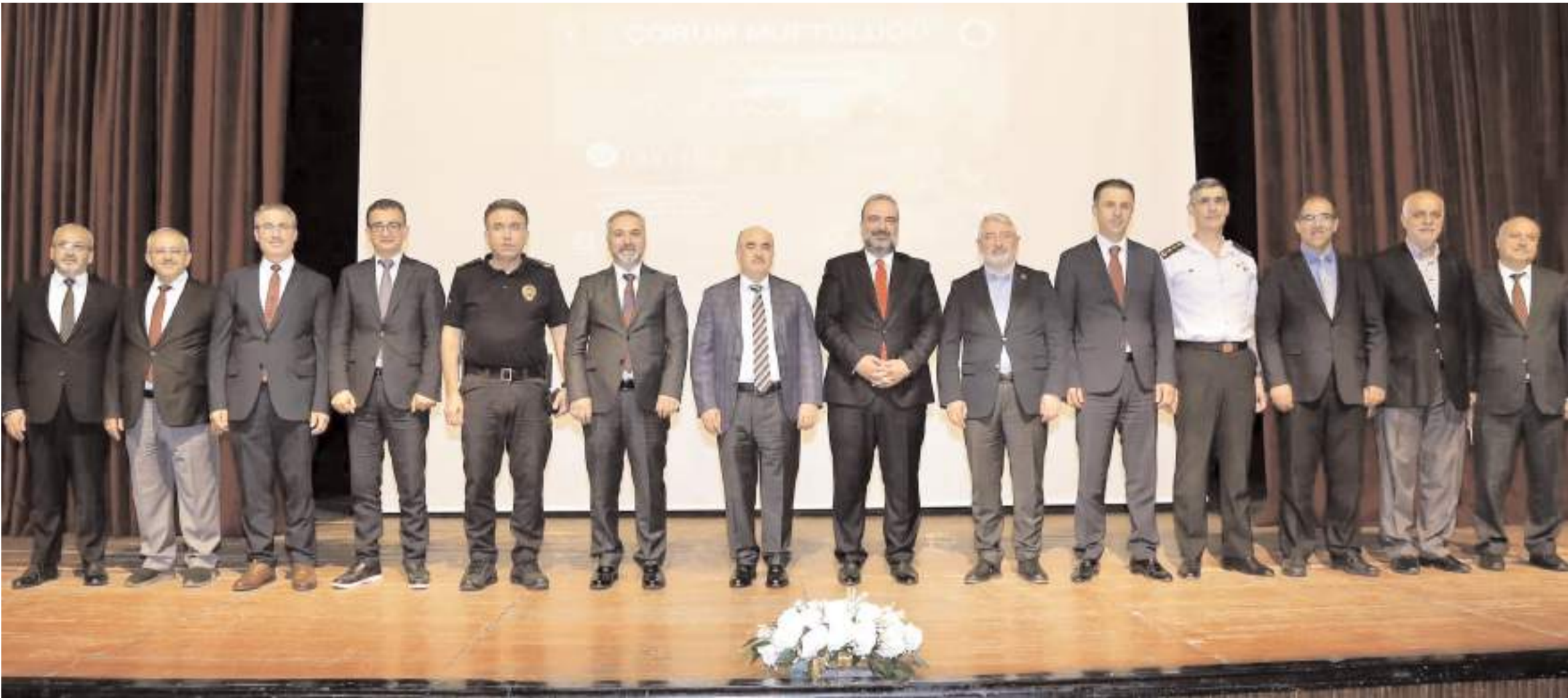
Devlet Tiyatro Salonunda gerçekleştirilen konferansın ardından hatıra fotoğrafı çekildi.