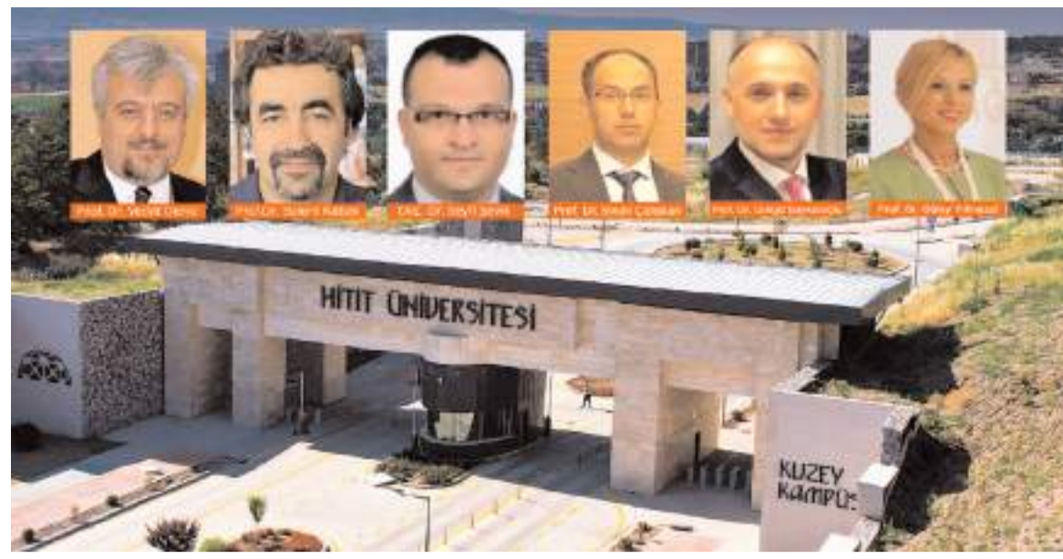
“Dünya’da En Etkili Bilim İnsanları-202” listesine 6 öğretim üyesi girme başarısı gösterdi.

Türkiye Noterler Birliği iş birliği ile hayata geçirilen Güvenli Ödeme Sistemi 27 Eylül tarihi itibarı ile zorunlu hale gelecek.” (Haber Merkezi)