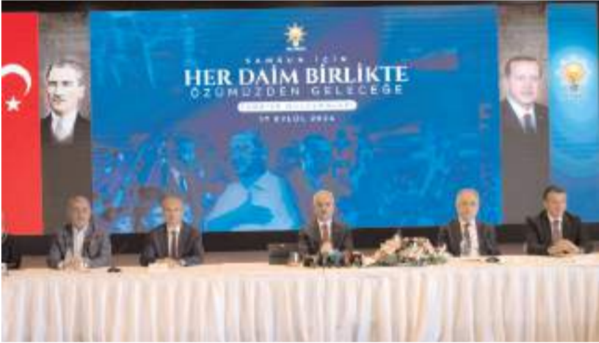
Bakan Abdulkadir Uraloğlu, "Samsun İçin Her Daim Birlikte Özümlüden Geleceğe Türkiye Buluşmaları"na katıldı.