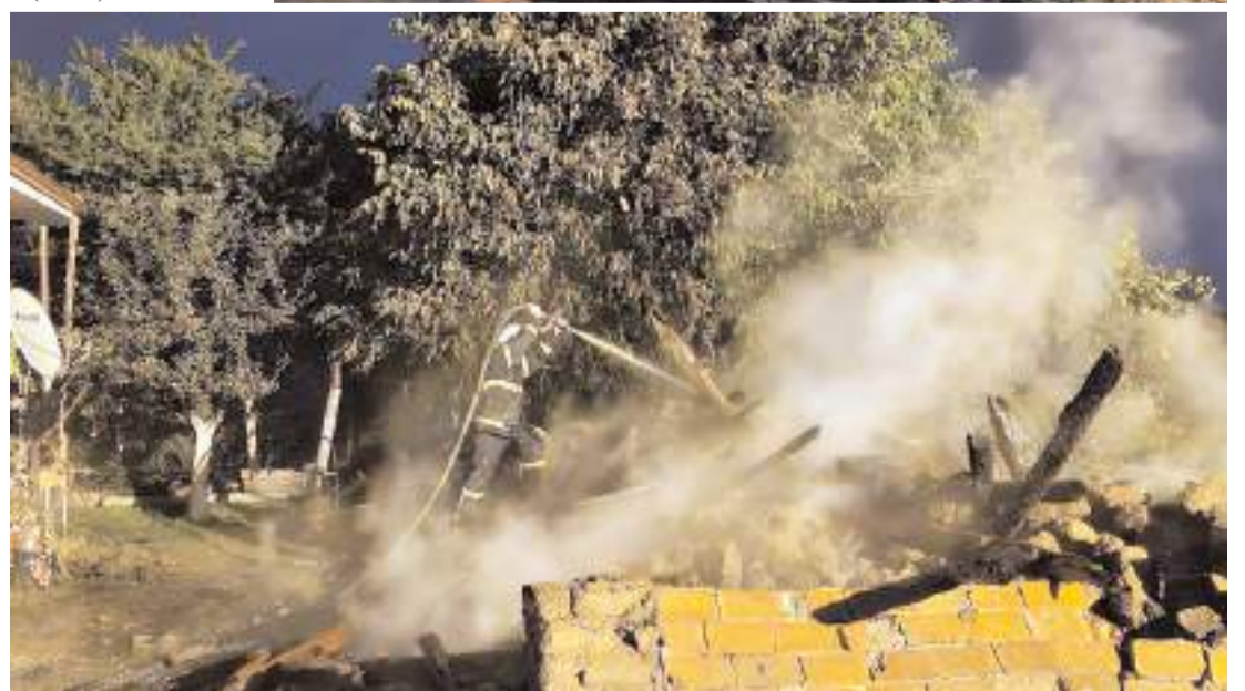
Yangın çevre binalara sıçramadan söndürüldü.