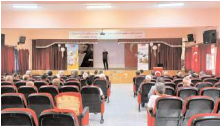
İlk eğitim programı Mecitözü ilçesinde yapıldı.