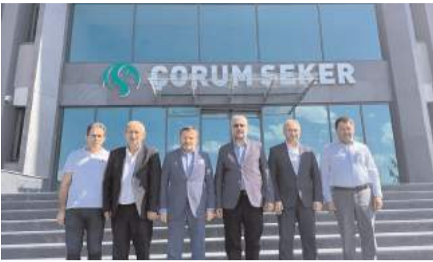
Milletvekili Av. Yusuf Ahlatcı, Çorum Safi Şeker Fabrikası'nı ziyaret etti.

Ahlatcı, konuşmasının sonunda, Safi Şeker Fabrikası'nın Çorum için stratejik bir öneme sahip olduğunu belirterek, "Safi Şeker Fabrikası, sadece bir sanayi kuruluşu değil, aynı zamanda çiftçimizden nakliyecimize kadar geniş bir kesime ekonomik katkı sağlayan bir değer. Biz de bu değeri daha ileriye taşımak için gerekli tüm çalışmaları yapmaya devam edeceğiz" görüşünü dile getirdi.