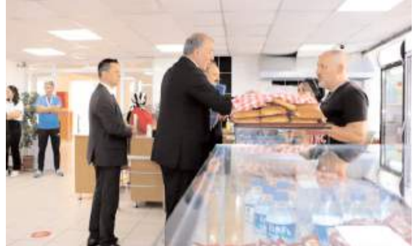
Denetimlerde satışa ve tüketime sunulan gıdalar ve etiket bilgileri, tüketim tarihleri kontrol edildi.