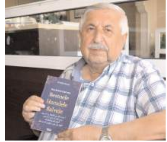
Eğitimci Yazar Ethem Erkoç, yeni kitabı hakkında bilgi verdi.