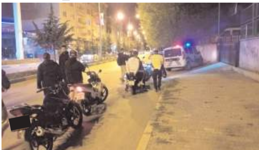
Denetiminde 54 sürücüye 84 bin 119 lira para cezası uygulandı.