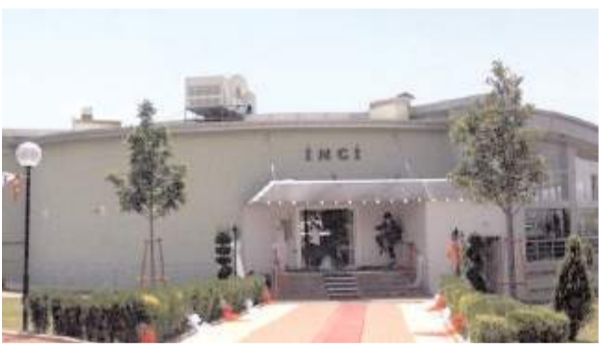
İnci Park tesisi modernize edilerek kiraya verilecek ve kulübe sabit gelir kaynağı olacak