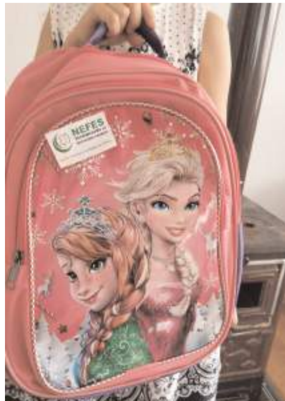
Dernek 2024-2025 eğitim ve öğretim yılı öncesinde de öğrencilere kırtasiye ve kıyafet desteğinde bulundu.