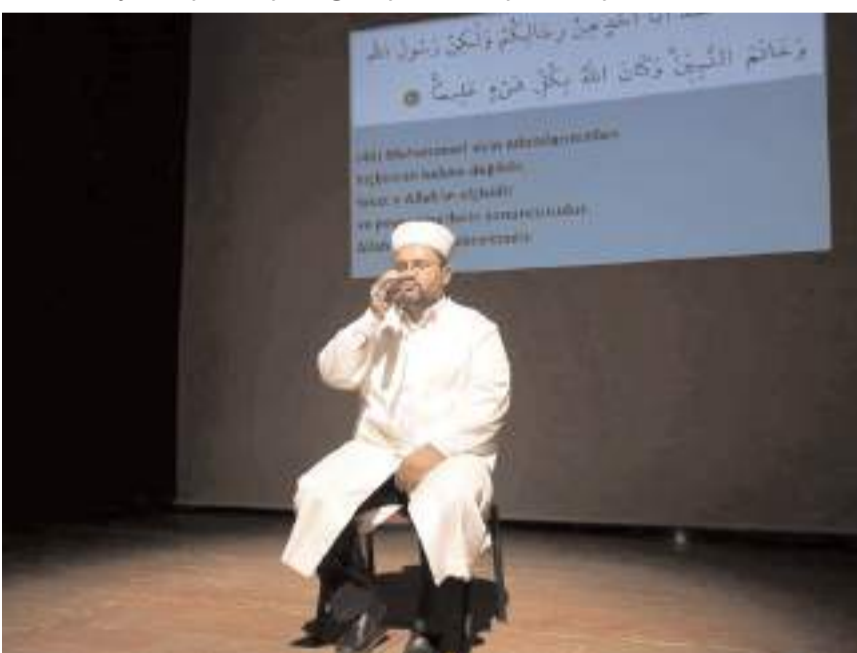
Konferans Kur'an-ı Kerim tilaveti ile başladı.