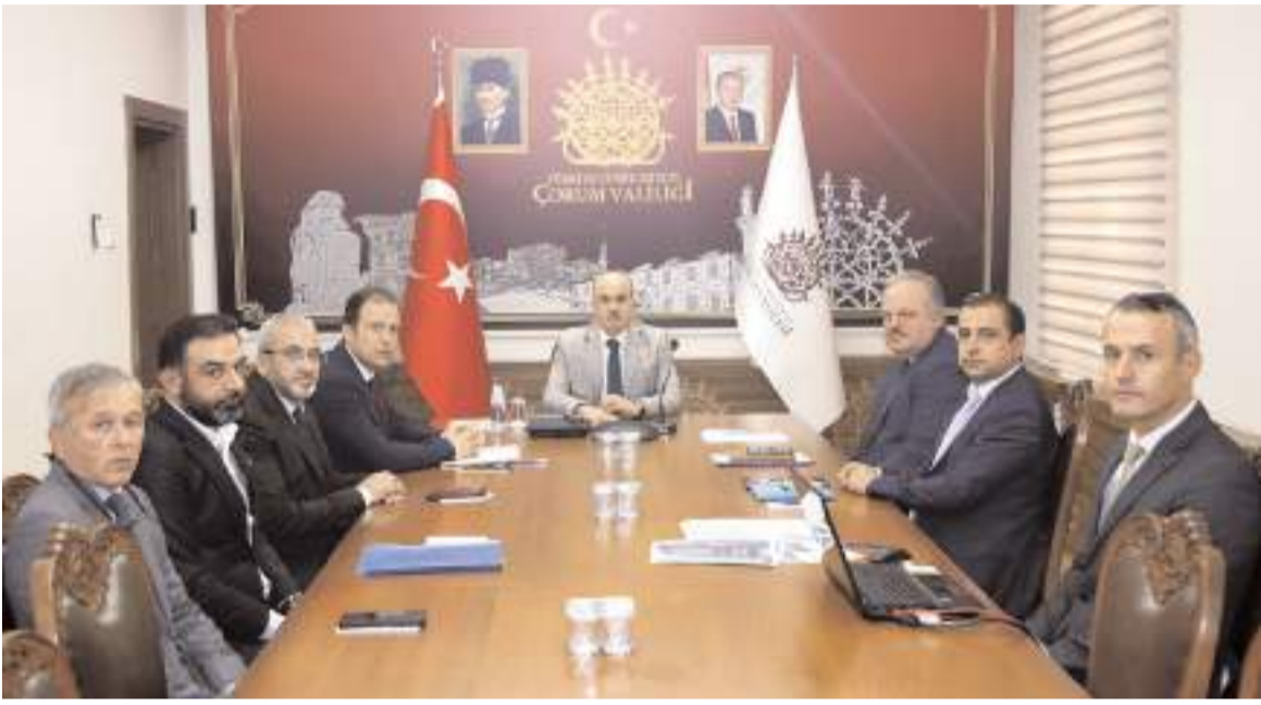
Toplantı Vali Dağlı'nın başkanlığında yapıldı.

Okul binasının bitme sürecinde olduğunu belirten Vali Dağlı, yapılan gayretli çalışmalar neticesinde en kısa sürede inşaatın bitirilerek okulda eğitim - öğretime başlanacağını ifade etti.