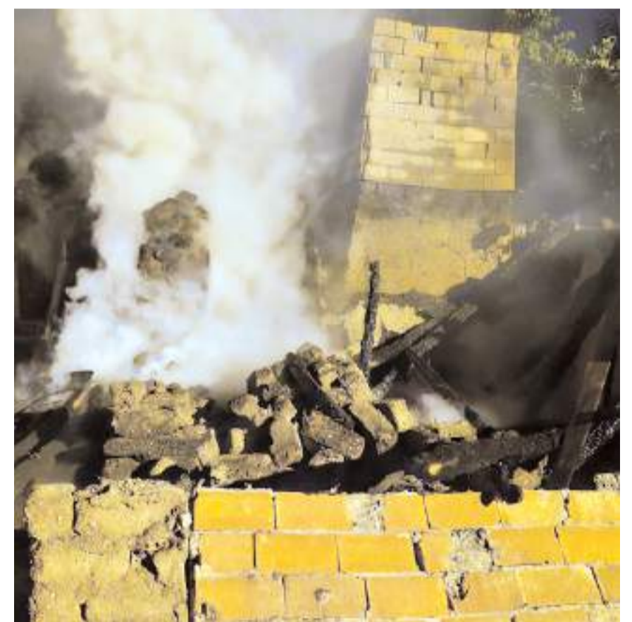
Kısa sürede büyüyen yangın tüm evi sardı.

Yangınla ilgili inceleme başlatıldı.