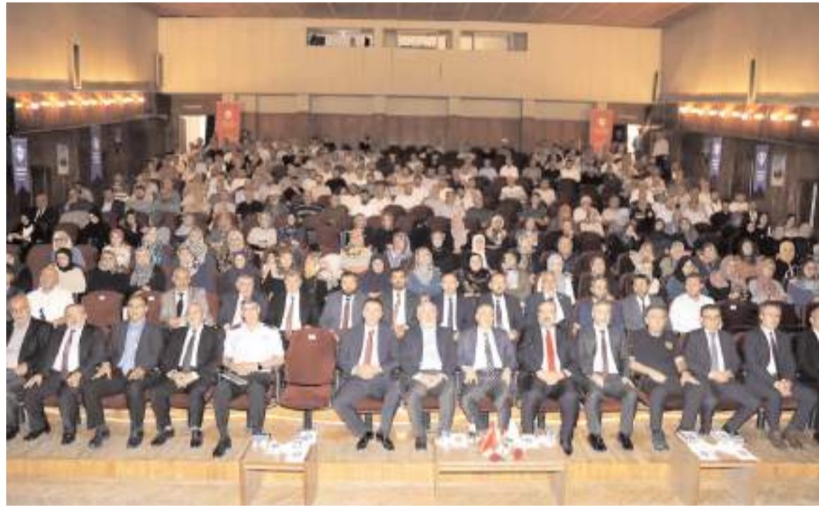
Konferansa katılım yüksek oldu.