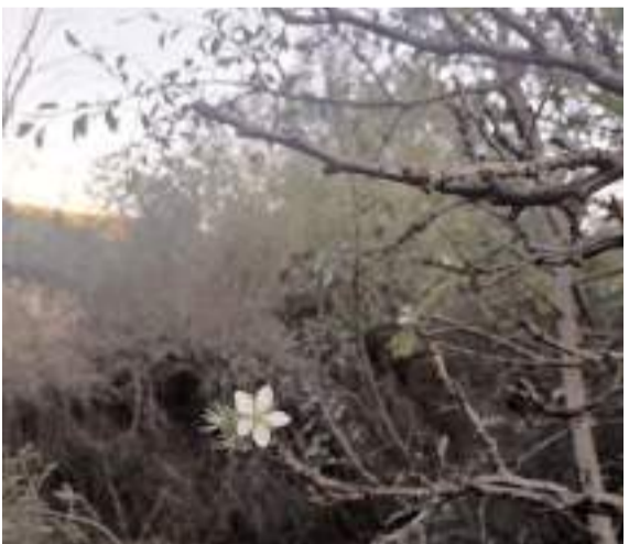
Karaoğlu köyünde erik ağacı aynı yıl içinde ikinci çiçek açtı.

yünde erik ağacı aynı yıl içinde ikinci çiçek açtı. Erik ağacının dalları bembeyaz çiçek açarken, ilk defa böyle bir olayla karşılaştığını anlatan vatandaşlar, "Bu yıl birincisini yedik, bu ikinci çiçek açtı. Erik bunda da olacak. Bugüne kadar böyle çiçek açtığını hiç görmedik" şeklinde konuştular. (İHA)