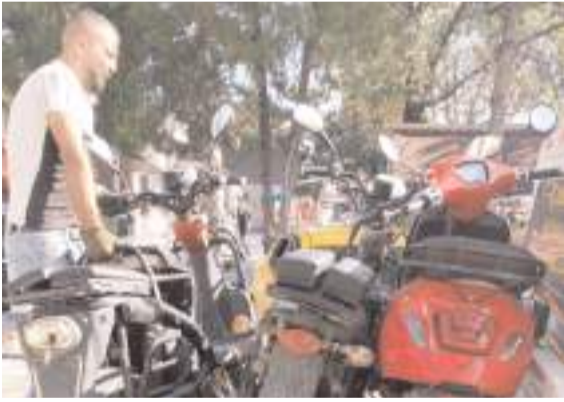
Uygulamada 790 motosiklet denetlendi.