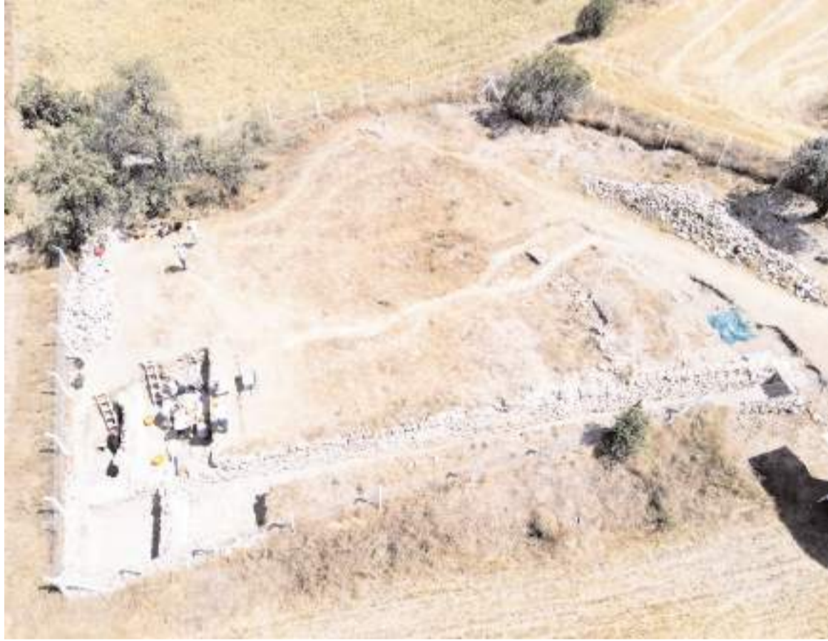
Kalehisar'da tarihin yeniden ayağa kaldırılması için bilimsel kazılar yapılıyor.