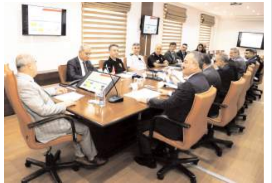
Toplantıda üniversiteler açılmadan önce alınacak tedbirler görüşüldü.

Toplantıda, yurtların genel durumları, kapasite ve disiplin işlemleri, emniyet ve güvenlik gibi konularda ilgili kurumlar tarafından yapılan sunumların ardından öğrencilerin güvenli bir şekilde eğitim almalarını ve huzurlu bir şekilde yurtlarda barınmalarını sağlamak, ihtiyaç ve taleplerini gidermek amacıyla Valilik koordinasyonunda kampüsler, yurtlar, üniversiteler, öğrencilerin genel olarak bulunduğu güzergah ve alanlarda dahil olmak üzere yapılan çalışmalar ve denetimler gözden geçirildi.