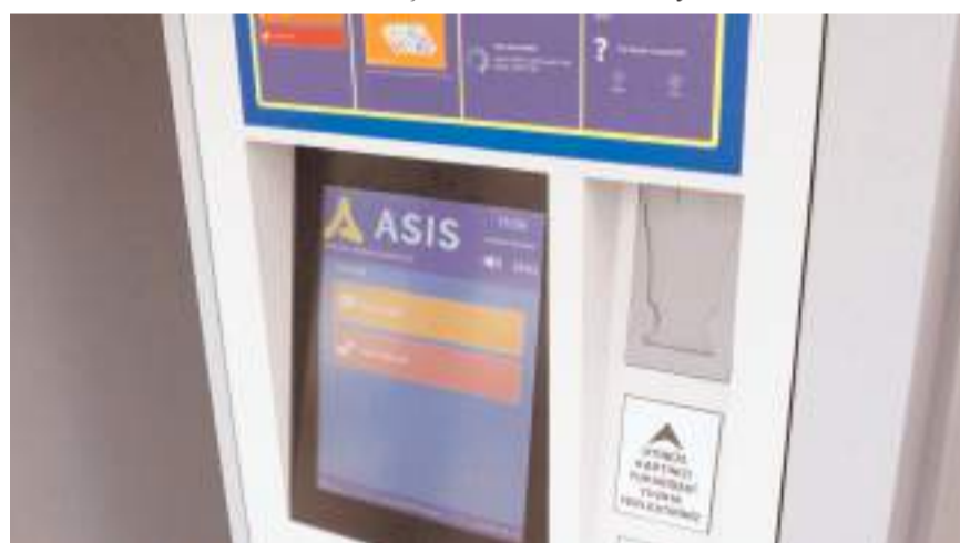
KİOSK cihazlarıyla kısa süre içerisinde sanal kart ile yükleme işlemleri de yapılabilir.

Valilik Binası önü, Kubbeli Cami önü ve Recep Tayyip Erdoğan Caddesi'ndeki merkez otobüs durağı olmak üzere 3 farklı noktaya kurulan KİOSK sistemiyle vatandaşlar daha önceden sadece nakit olarak işlem yapabilmekteydi. Yapılan çalışmaların ardından KİOSK cihazlarına kredi kartı ile bakiye yükleme kolaylığı getirildi. KİOSK cihazlarında vatandaşlar bakiye yüklemenin yanı sıra yeni kart alım işlemlerini de gerçekleştirebilecek. KİOSK cihazlarıyla kısa süre içerisinde sanal kart ile yükleme işlemleri de yapılabilir. (Haber Merkezi)