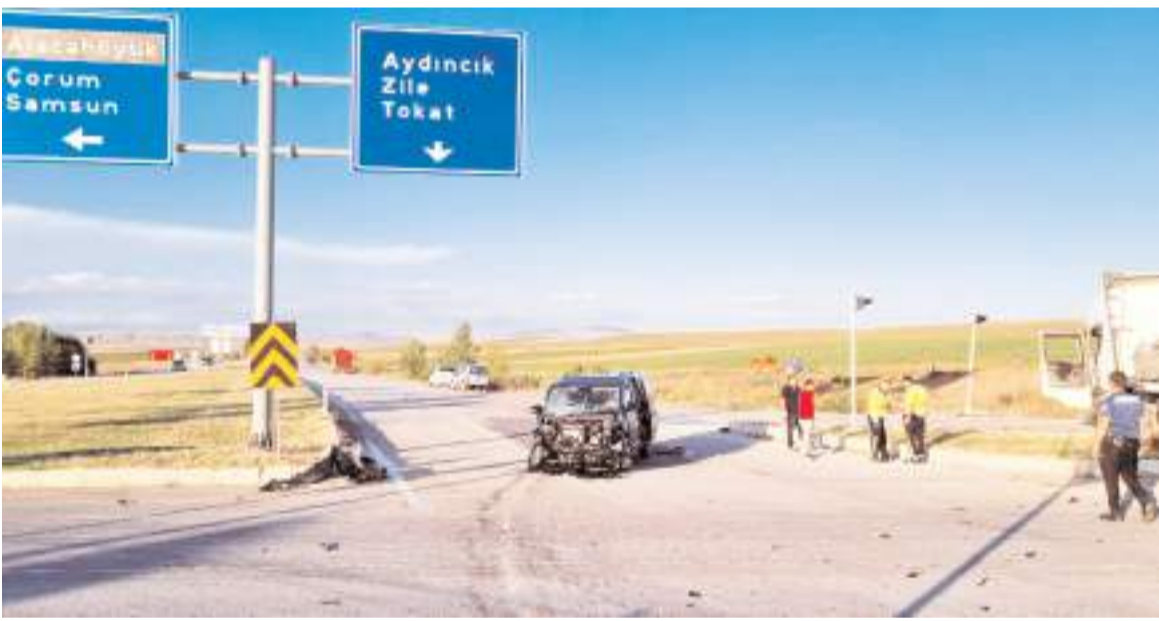
Kaza Çorum-Yozgat kara yolu Zile kavşağında meydana geldi.

Hakimiyet, merhumeye Allah'tan rahmet, ailesine ve yakınlarına başsağlığı diler.