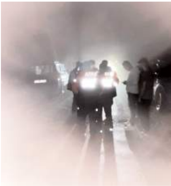
Arama çalışmalarına AFAD, Jandarma ve vatandaşlar katıldı.