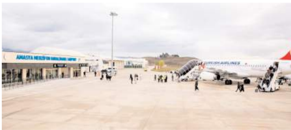
8 ayda 91 bin 665 yolcu Merzifon Havalimanını kullandı.

AFAD Başkanlığı'yla yıl başında yaptıkları toplantıyla hem Konya'da hem de diğer illerde çalışmaların başlatılmasını kararlaştırdıklarını ifade eden Arık, "Belirlenen illerde obruk risk haritası ortaya çıkarılacak. Tabii önce bir duyarlılık haritası çıkarılacak, yani obruk oluşma potansiyeli olan bölgelerin haritası çıkarılacak. Bunları oluşturduktan sonra da planlama devam edecek ancak bir bölgede çalışmanın yapılmış olması orada obruk sürecinin durduğu anlamına gelmez. Nitekim içinde bulunduğumuz bölgede duyarlılık çalışması yapıldı ama obruklar oluşmaya devam ediyor." diye konuştu. (A.A)