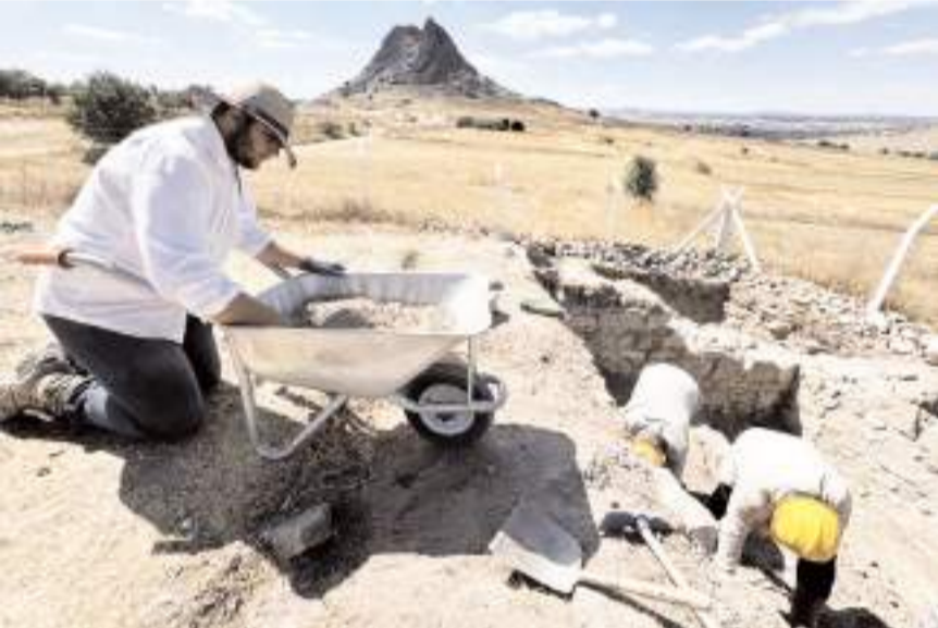
Yapılan kazı çalışmaları Anadolu Selçuklu arkeolojisi için önemli.