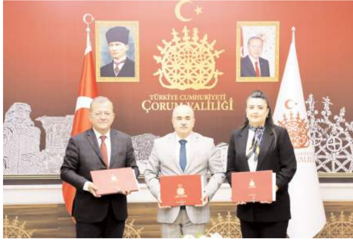
İmzaların atılmasının ardından hatıra fotoğrafı çekildi.

2012 yılında Çorum'da %21 olan kayıtlı kadın istihdamı, 2023 yılında %37'ye yükseldi. Bu artış, Çorum'u Türkiye genelinde kadın istihdamında 37. sıradan 26. sıraya taşıdı. On İkinci Kalkınma Planı doğrultusunda, 2028 yılına kadar kadınların işgücüne katılım oranının %40'a, kadın istihdam oranının ise %36'ya ulaşması hedefleniyor. Bu hedef doğrultusunda, kadınların ihtiyaç duyulan alanlarda mesleki beceri kazanmaları ve iş gücüne daha fazla katılım sağlamaları kritik öneme sahip. (Haber Merkezi)