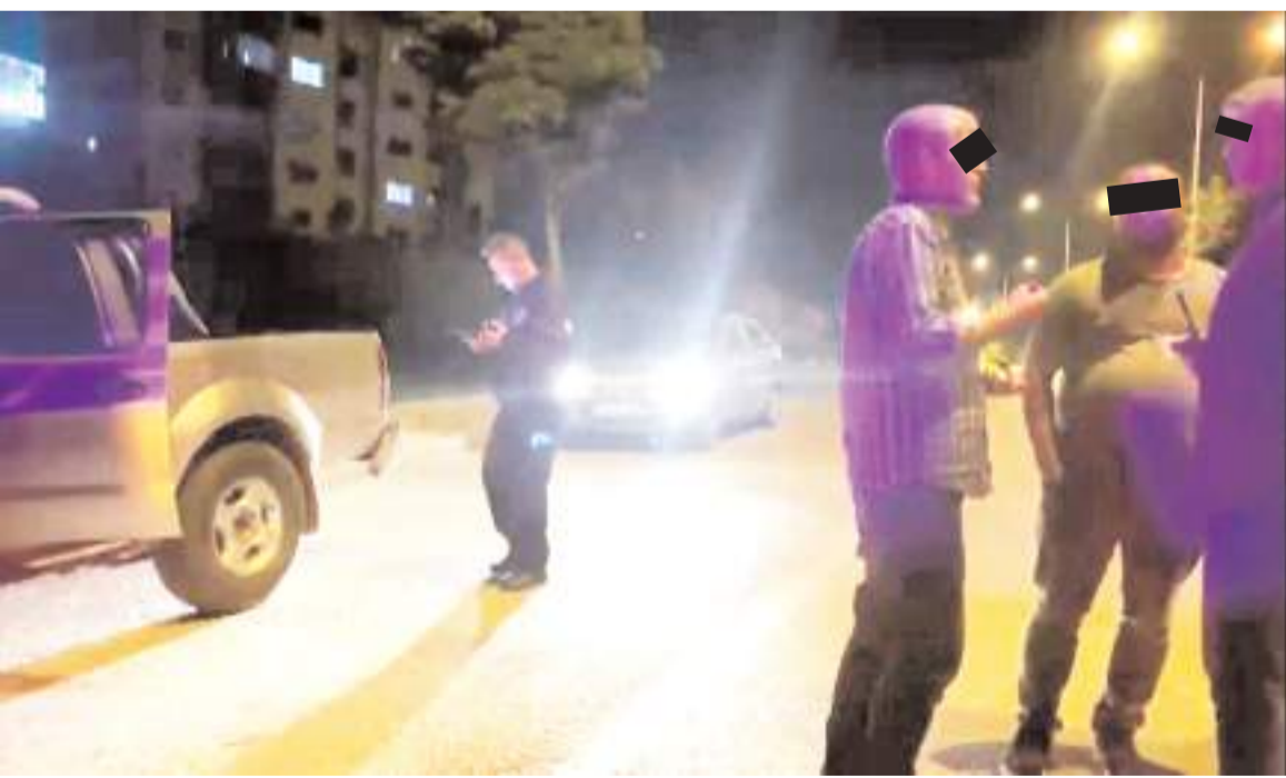
Olay Akkent Caddesi'nde meydana geldi.