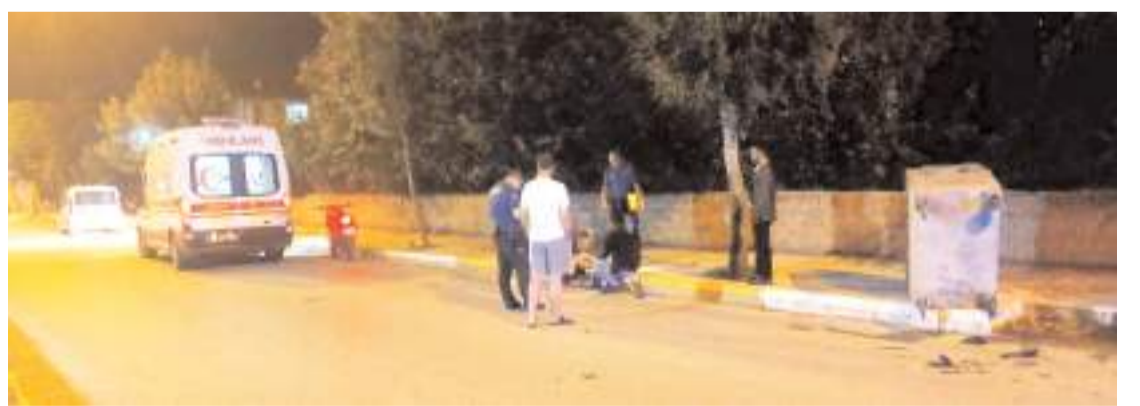
Kaza, Adnan Menderes Caddesi üzerinde meydana geldi.