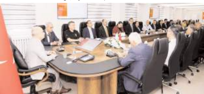
Toplantıda, bağımlılıkla mücadele konusunda yapılan ve yapılacak olan çalışmalar değerlendirildi.