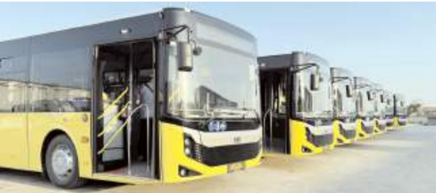
8 yeni araç Çorum'a geldi.

Çöplü "Ulaşımda hemşehrilerimizin daha konforlu ve rahat yolculuk yapmaları adına çalışmalarımızı aralıksız sürdürüyoruz. Toplu ulaşımda kaliteyi artırmak adına satın aldığımız 8 otobüsümüzü filomuzda dahil ettik. Bu araçlarımızdan 3 tanesi 8,5 metre, 5 tanesi ise 12,5 metre. Aldığımız yeni araçlarla birlikte artık toplu taşımada miladını dolduran araçları devre dışı bırakacağız. Ayrıca mahalle yoğunluğuna göre sefer sayılarında değişiklikler yapabileceğiz" dedi. (Haber Merkezi)