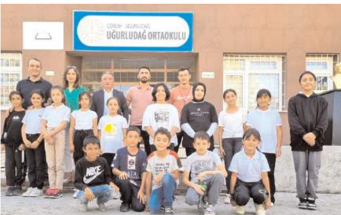
Gençlik ve Spor İl Müdürlüğü Okul Sporları heyeti Uğurludağ Ortaokulu'nu ziyaretinde öğrencilerle toplu halde