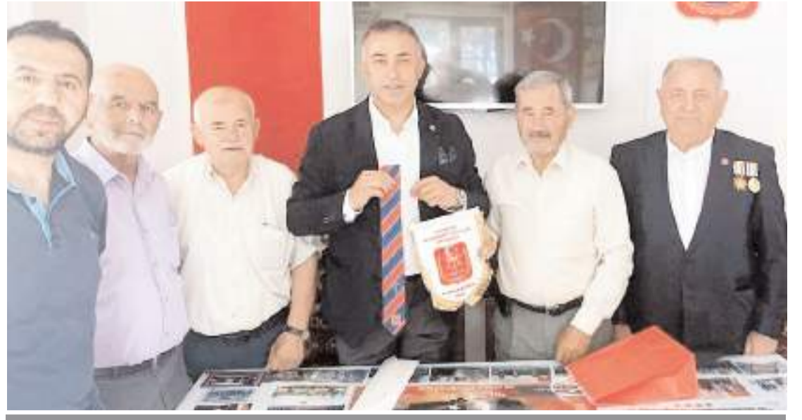
Milletvekili Tahtasız'dan Gaziler Günü mesajı