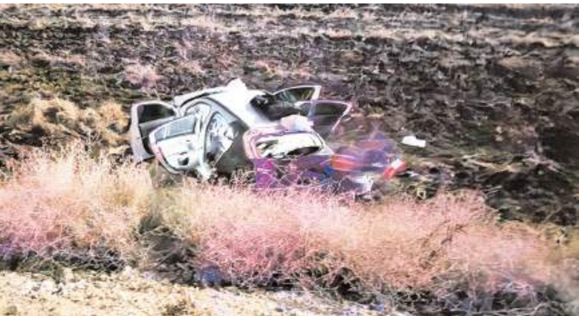
Kaza, Alaca-Yozgat karayolunda meydana geldi.

Kazayla ilgili başlatılan soruşturma sürüyor.