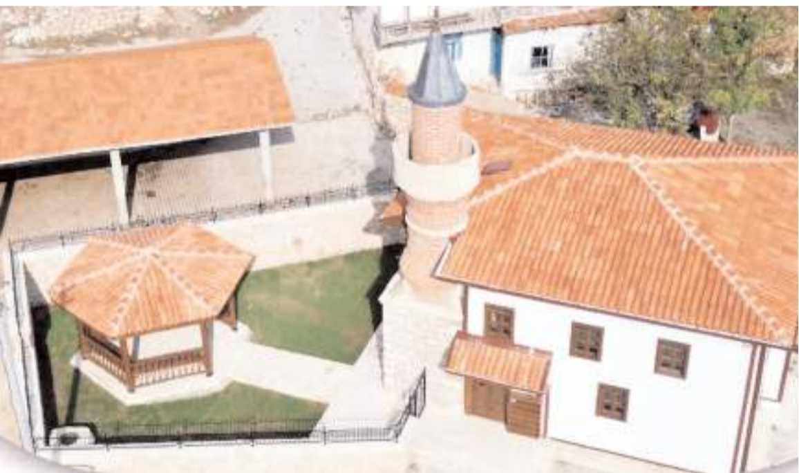
Alören Köyü Caminin restorasyonu tamamlandı.