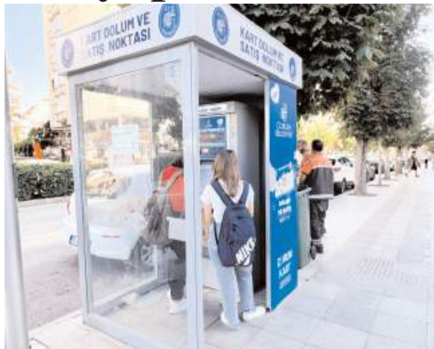
KİOSK'lar üç farklı noktada bulunuyor.

Çorum Belediyesi'nin toplu ulaşımda vatandaşlara kolaylık sağlamak amacıyla şehrin 3 farklı noktasına yerleştirdiği KİOSK kart satış ve bakiye yükleme noktalarında artık kredi kartı ile de işlem yapılabilir.