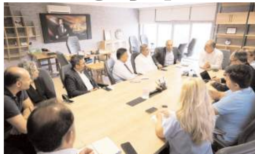
Toplantıda "Makine ve İmalat Teknolojileri" konusu olmak üzere ortak araştırma-geliştirme ve TÜBİTAK projeleri görüşüldü.