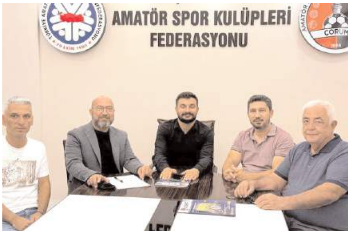
Çorum Belediyesi 5 Yıllık Strateji Planı öncesinde Amatör Spor Kulüpleri Federasyonu ziyaretinde görüşüyor