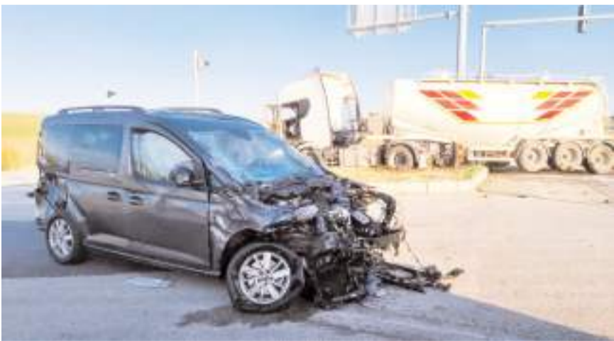
Kazada her iki araçta da maddi hasar meydana geldi.

Kaza anı, çevredeki bir iş yerinin güvenlik kamerasınca kaydedildi.