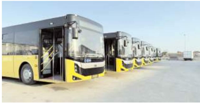
8 yeni araç Çorum'a geldi.