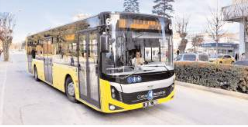
Belediye, Akkent yeni TOKİ konutlarına toplu ulaşım seferlerini artırdı.

Çorum Belediyesi, Akkent Mahallesi yeni TOKİ konutları bölgesinde otobüs sefer sayılarını artırdı.