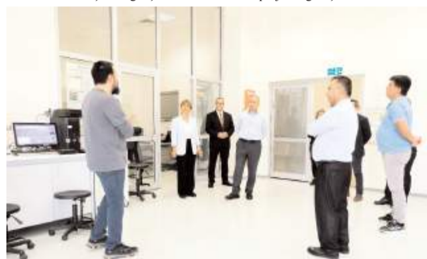
Safi Çorum Şeker, yetkilileri laboratuvarları gezdi.