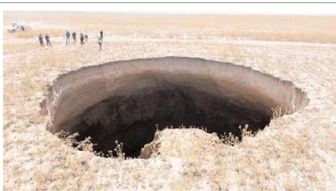
Obruk tehlikesi bulunan 16 il arasında Çorum'da bulunuyor.