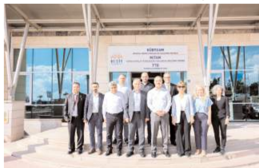
Toplantının ardından toplu hatıra fotoğrafı çekildi.