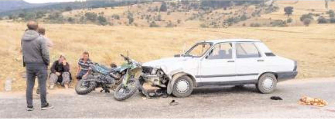
Kaza, İlçeye bağlı Danişment köyünde meydana geldi.

Ulaşım Hizmetleri Müdürlüğü'nden yapılan açıklamada, "Akkent yeni TOKİ konutlarına toplu taşıma seferlerimiz artırılmıştır. 9/A hattında 15 dakika aralıklarla çalışan toplu taşıma araçlarımız Yeni TOKİ konutlarına da gitmektedir" denildi. (Haber Merkezi)