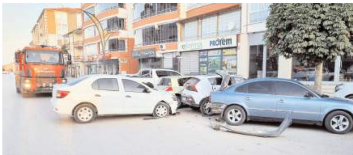
Kaza, Zile Caddesi'nde meydana geldi.

Hangi belge ve bulgulara dayanarak, Milli Eğitim Bakanlığını ve İl Milli Eğitim Müdürlüğünü bir cinayete ilişkilendirip zan altında bırakıyorsunuz?sorularına cevap bekliyor, kamuoyunun takdirine bırakıyoruz" dedi. (Haber Merkezi)