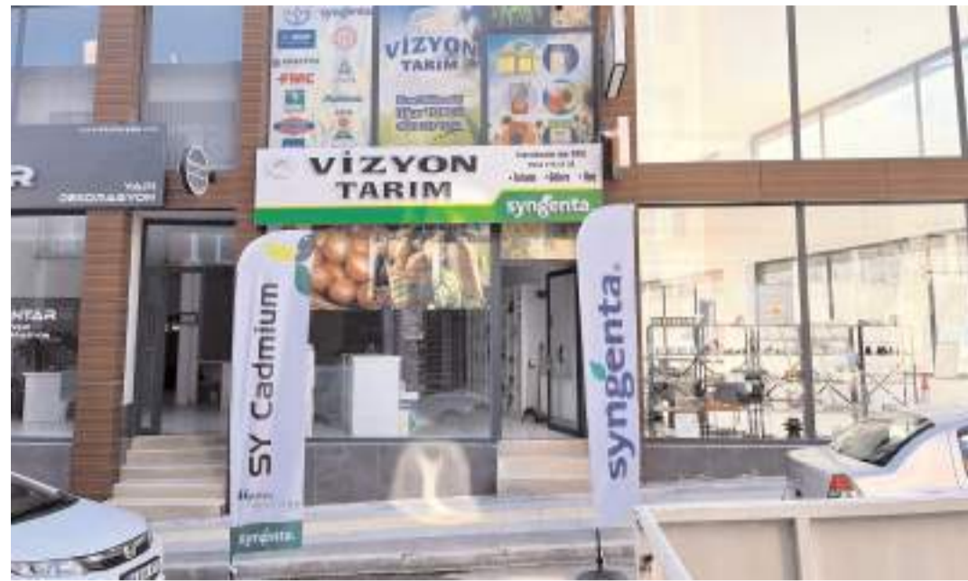
Vizyon Tarım Gülabibey Mahallesi İnkılap Sokak 35/B adresinde faaliyet gösteriyor.