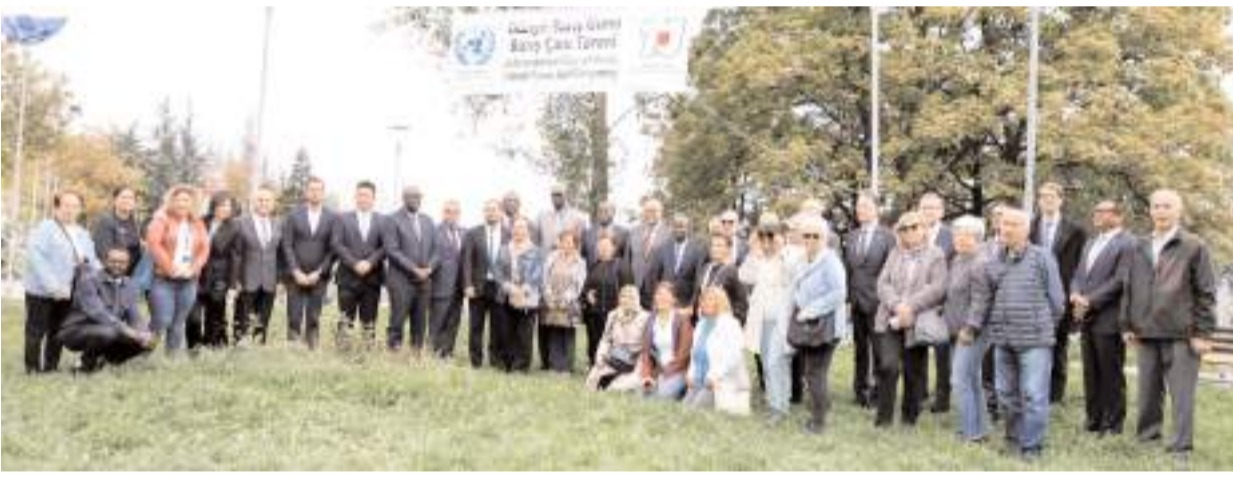
Ankara'daki Botanik Parkı'nda düzenlenen Barış Çanı Töreninde hatıra fotoğrafı çekildi.

Resmi İlanlar: www.ilan.gov.tr 'de (Basın: 2095311)