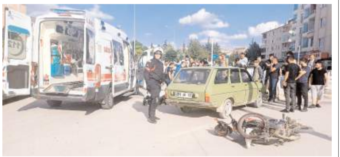
Kaza, Çamlık Caddesinde meydana geldi.