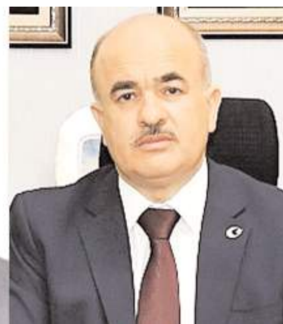
Zülkif Dağlı bugün şehirden ayrılacak.

Çorum'un yeni Valisi Ali Çalgan için ise saat 15.00'da Valilik önünde karşılama programı düzenlenecek. Karşılamanın ardından Vali Ali Çalgan basın açıklaması yapacak.