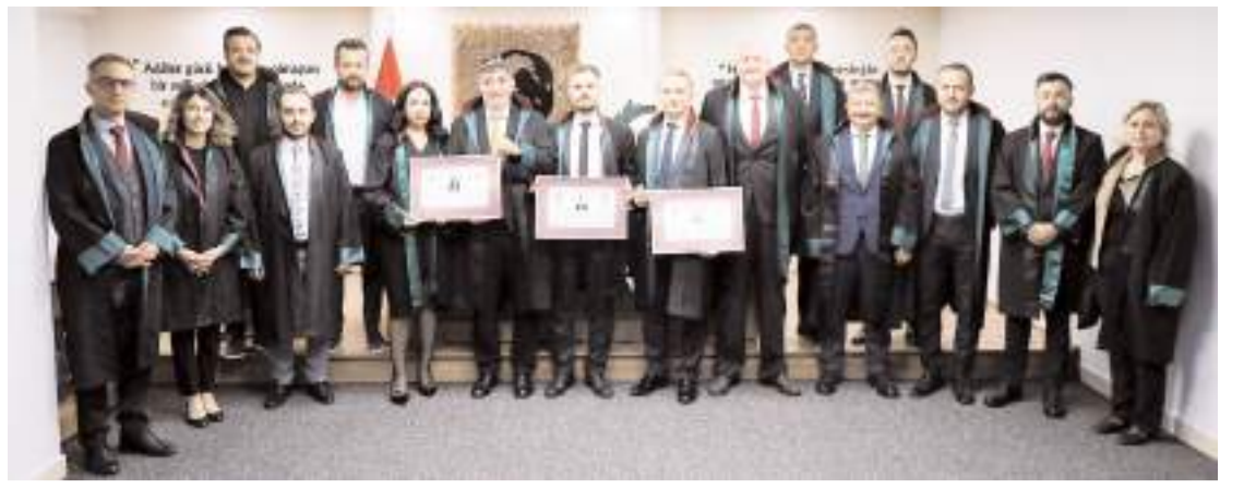
Stajını tamamlayan avukatlar için ruhsat töreni yapıldı.