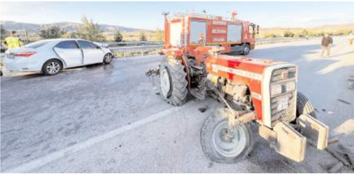
Kaza Sungurlu-Çorum kara yolu Kırankışla köyü yakınlarında meydana geldi.

Baro seçimi, 6 Ekim Pazar günü 09.00 ile 17.00 saatleri arasında Atatürk Spor Salonunda gerçekleştirilecek. (Haber Merkezi)