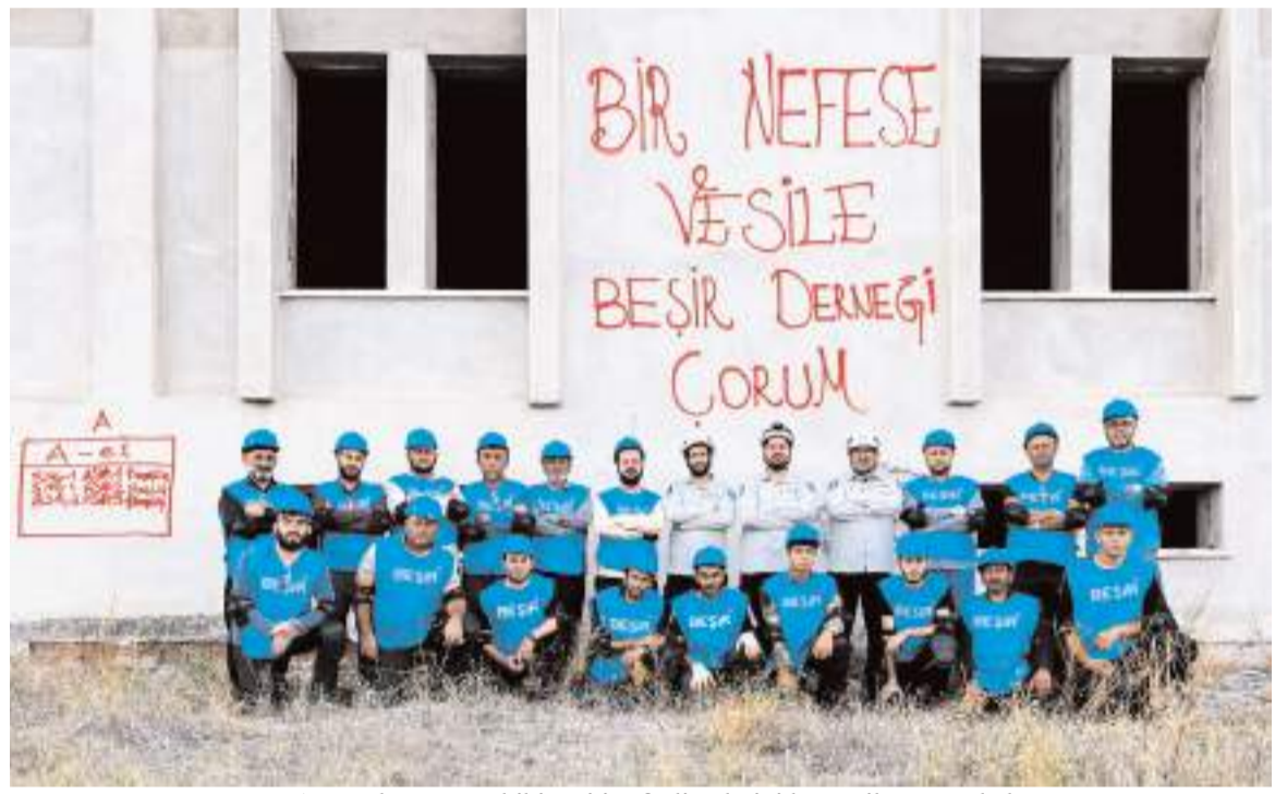
Arama kurtarma ekibi, eğitim faaliyetlerini başarı ile tamamladı.

Eğitimlerde emeği geçen herkese teşekkür ediyoruz. İlk yardım