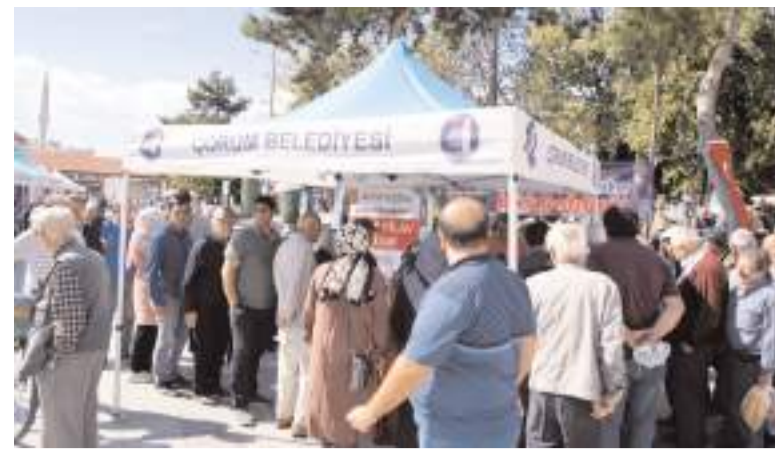
Programın ardından Ahilik pilavı dağıtıldı.