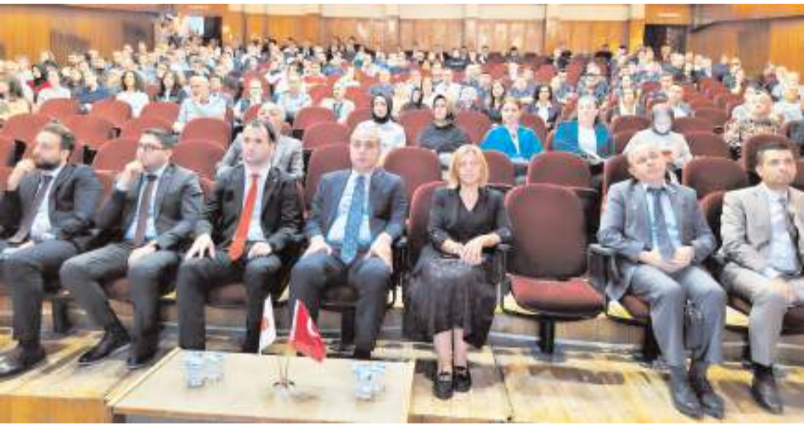
Eğitim semineri Devlet Tiyatrosu Salonu'nda yapıldı.

Yaralı traktör sürücüsü, burada yapılan müdahalelere rağmen kurtarılamadı. (AA)