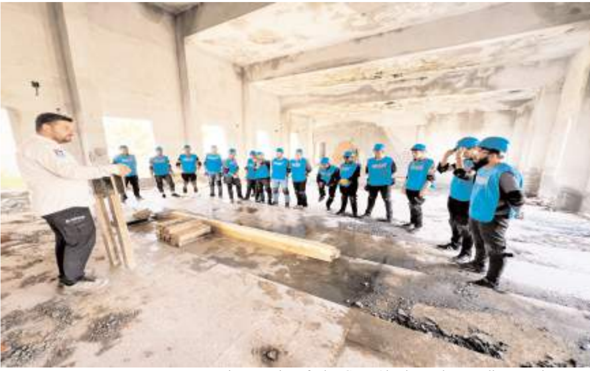
Beşir Derneği tarafından Çorum'da oluşturulan gönüllü arama kurtarma ekibi, sivil toplum kuruluşları arasında ilk hafif arama kurtarma ekibi oldu.