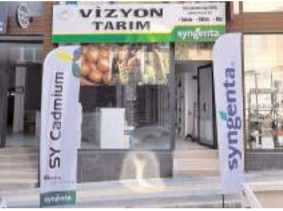
Vizyon Tarım Gülabibey Mahallesi İnkılap Sokak 35/B adresinde faaliyet gösteriyor.