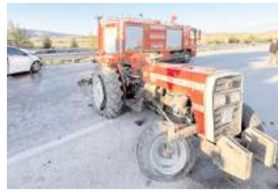
Kaza Sungurlu-Çorum kara yolu Kırankışla köyü yakınlarında meydana geldi.

■ SUNGURLU'da, otomobille çarpışan traktörün sürücüsü öldü, kazada 4 kişi yaralandı. * HABERİ 4'DE