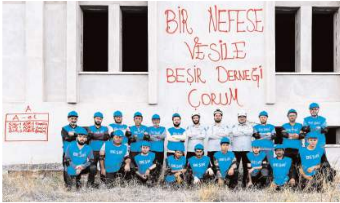
Arama kurtarma ekibi, eğitim faaliyetlerini başarı ile tamamladı.

■ BEŞİR Derneği tarafından Çorum'da oluşturulan gönüllü arama kurtarma ekibi, eğitim faaliyetlerini başarı ile tamamlayarak sivil toplum kuruluşları arasında ilk hafif arama kurtarma ekibi oldu. * HABERİ 5'DE