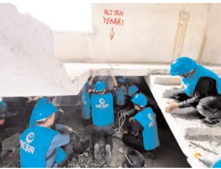
Ekibe 6 gün boyunca sahada hafif arama kurtarma eğitimi verildi.