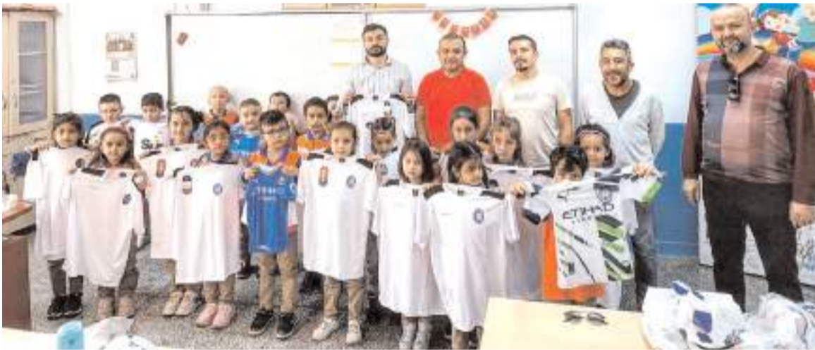
ASKF Ortaköy'de okulları ziyaret ederek öğrencilere spor malzemeleri dağıttı ve destek sözü verdi