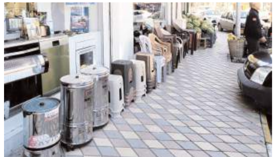
İskilip Belediyesi kaldırım işgaline yönelik denetimlerine devam edecek.

Kaldırım işgalinin yayaların erişimini güçleştirdiğine, ayrıca haksız rekabete neden olduğuna dikkat çekilen açıklamada, "Zabita ekiplerimizce yapılan kontrollerde, kurallara uymadığı tespit edilen 26 iş yerine idari para cezası uygulandı. Halkın ortak kullanım alanlarına saygı gösterilmesi için denetimler kararlılıkla sürecek. Haksız kazanç sağla-