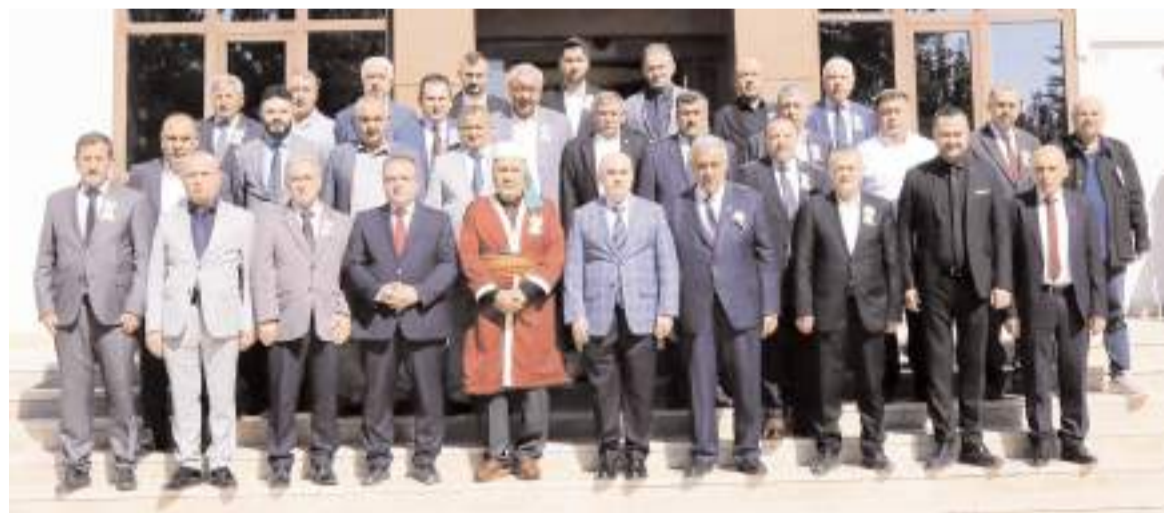
Valilik ziyaretinin ardından hatıra fotoğrafı çekildi.

Törenin ardından katılımcılar Atatürk Anıtı önünde toplu fotoğraf çekindiler.