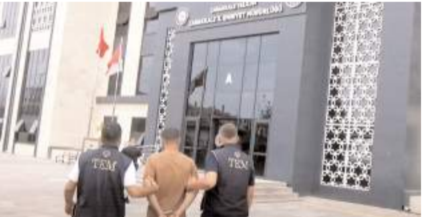
A.D.D. adliyyede çıkarıldığı mahkemece tutuklanarak, Çanakkale E Tipi Ceza İnfaz Kurumuna teslim edildi.

Çanakkale'de Terörle Mücadele Şube Müdürlüğü ve İstihbarat Şube Müdürlüğü ekiplerince düzenlenen operasyonda, FETÖ/PDY Silahlı Terör Örgütüne üye olma suçundan 7 yıl 6 ay kesinleşmiş hapis cezası bulunan Çorum Osmancık ilçe imamı A.D.D. yakalandı. Emniyetteki işlemlerinin ardından tutuklanarak, Çanakkale E Tipi Ceza İnfaz Kurumuna teslim edildi. Tutuklanan Çorum Osmancık ilçe imamı A.D.D.'nin kapatılan örgüt okullarında öğretmenlik yaptığı öğrenildi.