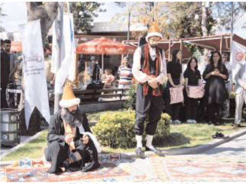
Ahilik konulu tiyatro gösterisi gerçekleştirildi.