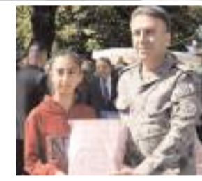
Ahilik Haftası nedeni ile düzenlenen resim, şiir ve kompozisyon yarışmalarında dereceye giren öğrencilere de hediyeleri takdim edildi.