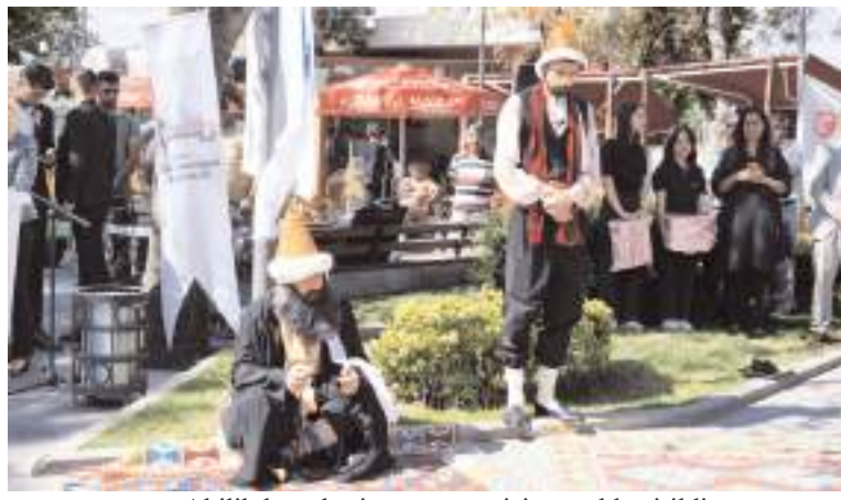
Ahilik konulu tiyatro gösterisi gerçekleştirildi.