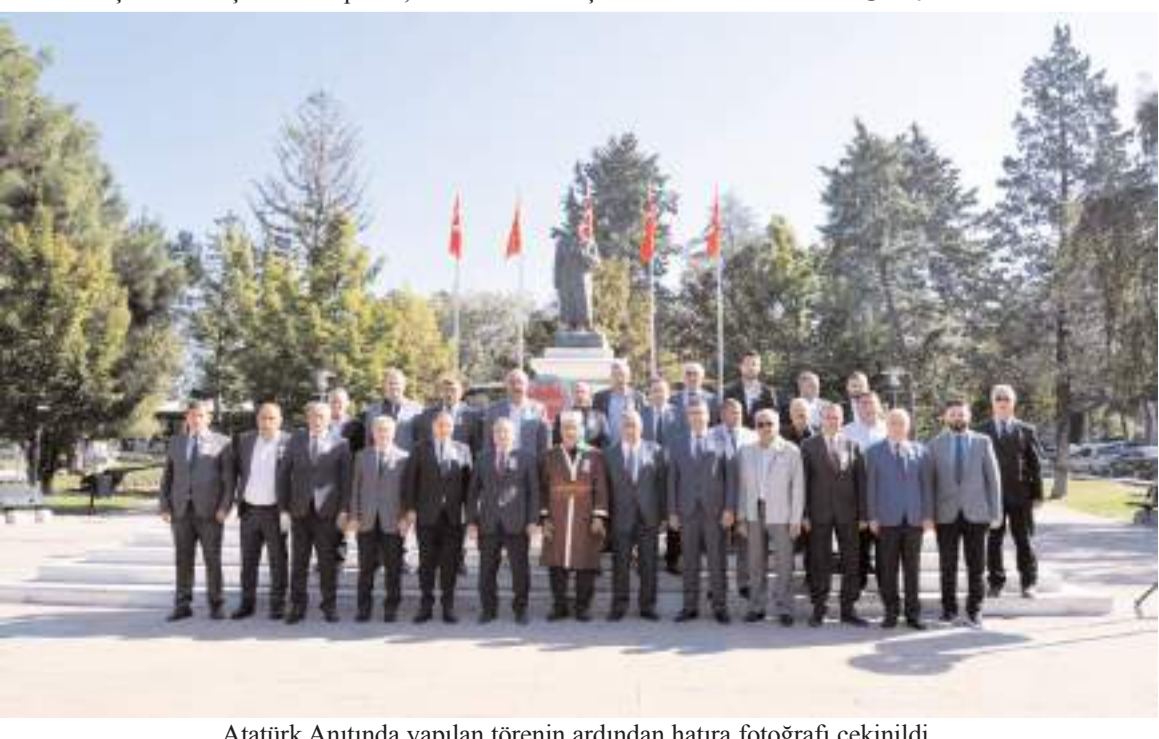
Atatürk Anıtında yapılan törenin ardından hatıra fotoğrafı çekildi.