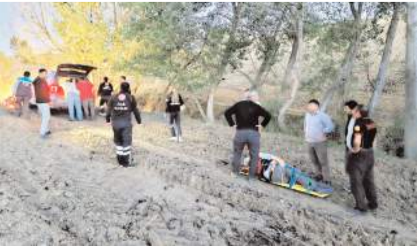
Yaşlı adama 112 acil sağlık ekipleri ilk müdahaleyi yaptı.