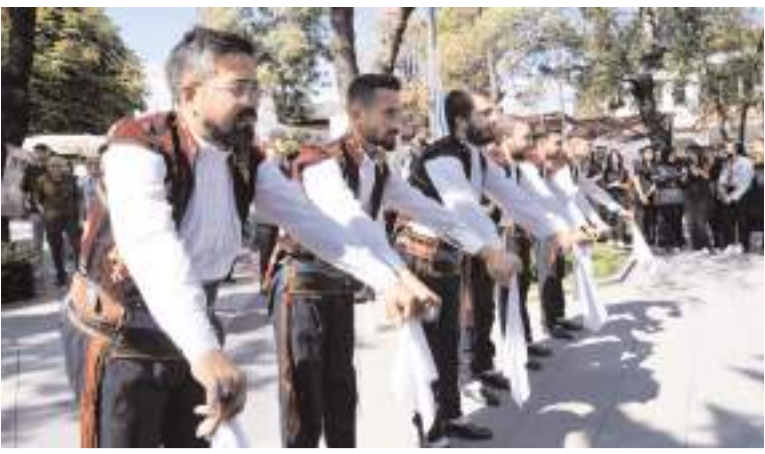
Programda halk oyunları gösterisi yapıldı.