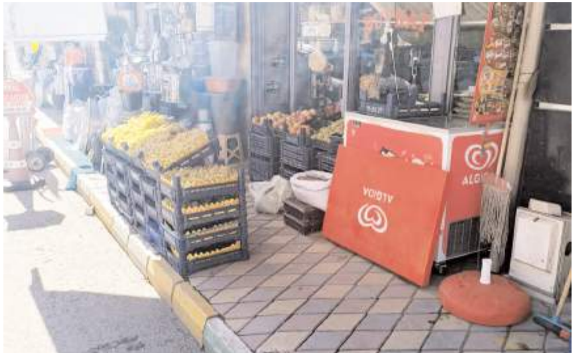
İskilip'te kaldırımları işgal eden 26 esnafa cezai işlem uygulandı.

Ziyarete Gelgör, itfaiye ekipleriyle birlikte pasta kesti.