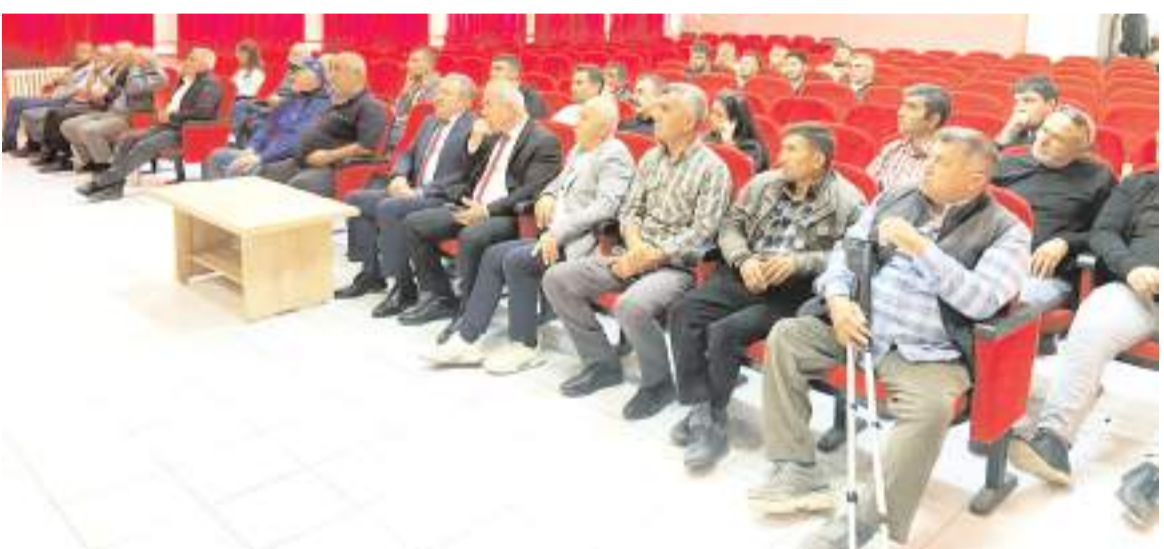
Eğitim Mecitözü Kaymakamlığına Yatılı Bölge Ortaokulu'nda yapıldı.