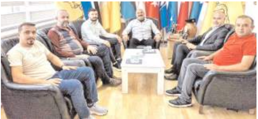
ASKF ve Kulüp Yönetimi Belediye Başkanı Taner İspir'i ziyaret etti