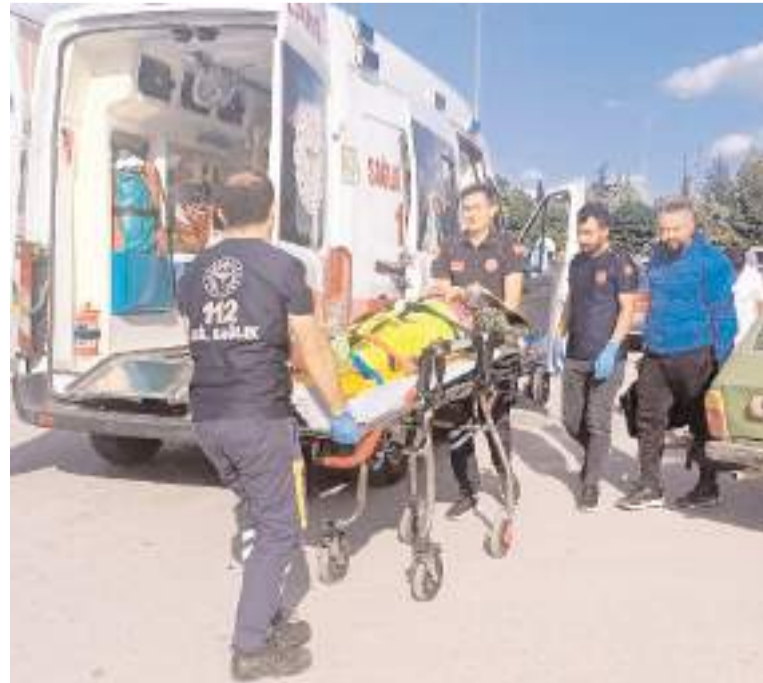
Yaralılar hastanede tedavi altına alındı.

Çorum'da otomobil ile motosikletin çarpışması sonucu meydana gelen trafik kazasında 2 kişi yaralandı.