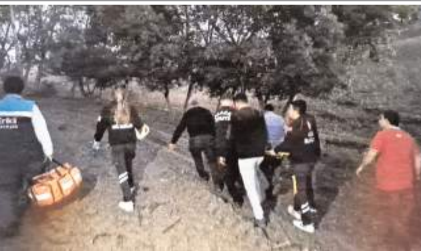
Olay, ilçeye bağlı Tutaş köyünde meydana geldi.