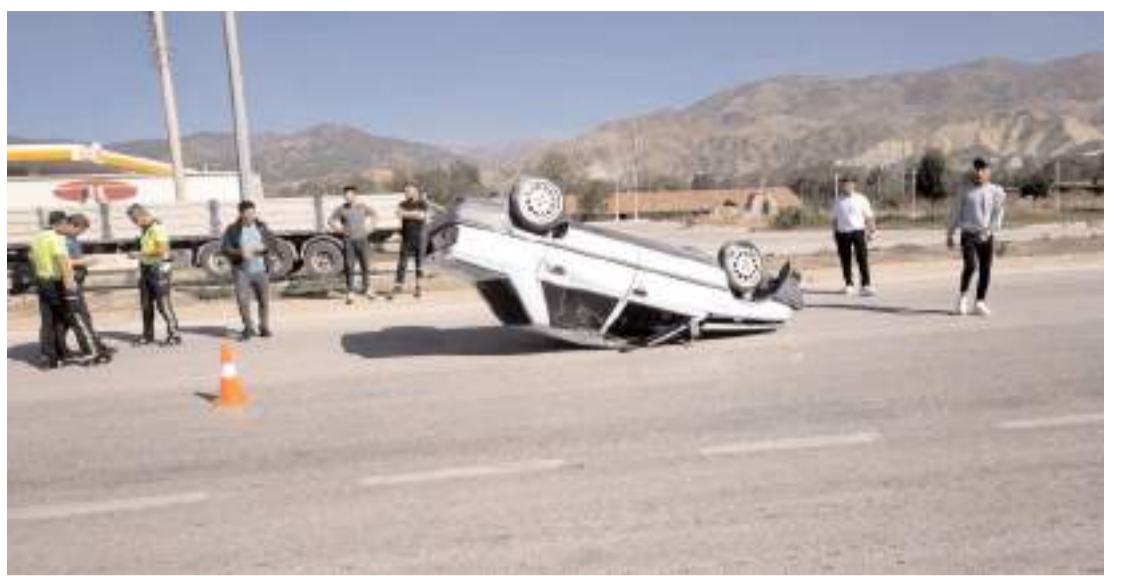
Kaza, D100 karayolu Dereboğazı mevkiinde meydana geldi.

Elinden yaralanan S.Ş., kendi imkanları ile başvurduğu Hitit Üniversitesi Erol Olçok Eğitim ve Araştırma Hastanesi'nde tedavi altına alındı.(AA)