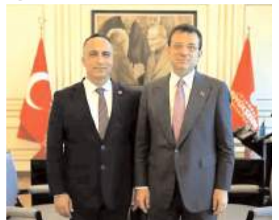
Ortak açıklamaya CHP Çorum örgütünde destek verdi.

"İnanıyoruz ve biliyoruz ki Türkiye Cumhuriyeti'nin değerlerine sahip olan herkes Ekrem İmamoğlu'na karşı yapmayı planladığınız hukuksuzluğun karşısında olacak, Türkiye İttifakı ona sahip çıkacaktır. Ne yaparsanız yapın İstanbul Büyükşehir Belediye Başkanımız Sayın Ekrem İmamoğlu'nun İstanbul'a ve Türkiye'ye hizmet etme arzusunun iradesini de engelleyemeyeceksiniz. Daha önce olduğu gibi bu sefer de kendi hukuksuzluğunuzun altında kalacaksınız. Açılan dava tamamen hukuksuzdur. Çünkü biliyoruz ki bu bir hukuk davası değildir. Bu bir iktidar mücadelesidir. Biliyoruz ki sizler yağmayı, talanı sürdürmek istiyorsunuz ve bunun için iktidarı kaybetmek istemiyorsunuz. Kaybedeceğinizi bildiğiniz için korkuyorsunuz. Bu yüzden Sayın Ekrem İmamoğlu'na saldırıyorsunuz ve yok ettiğiniz hukuk eliyle siyaset dışına itmeye çalışı-