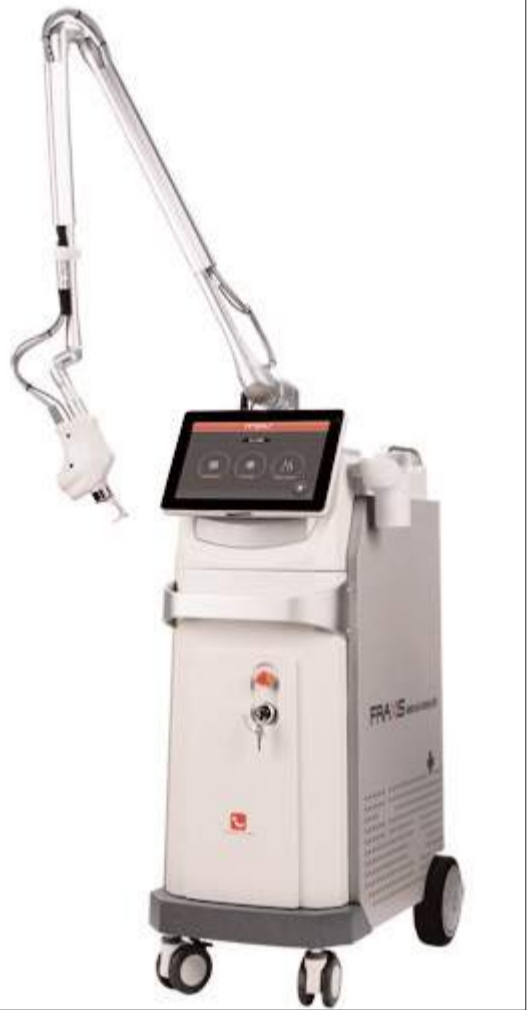
Fraksiyonel Karbondioksit Lazer Cihazı