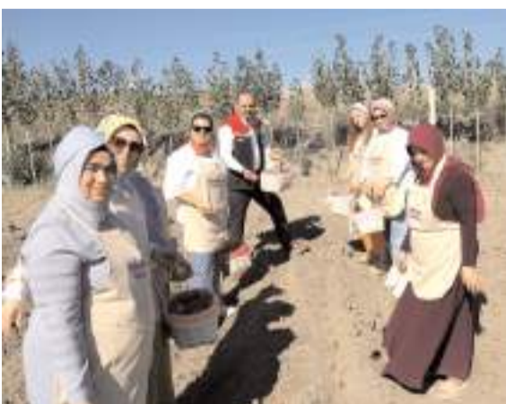
Çorum'da safran üretiminin yaygınlaştırılması için safran ekimi yapıldı.