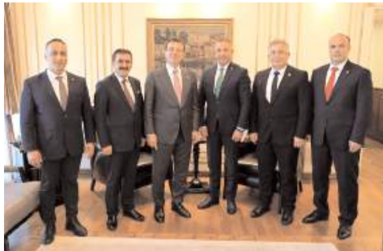
Çorum CHP heyeti İstanbul Büyükşehir Belediye Başkanı Ekrem İmamoğlu'nu ziyaret etti.