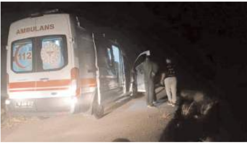
Yaralıları ambulansla Erol Olçok Eğitim ve Araştırma Hastanesi'ne kaldırılarak tedavi altına alındı.

Kazayla ilgili başlatılan soruşturma sürüyor. (İHA)