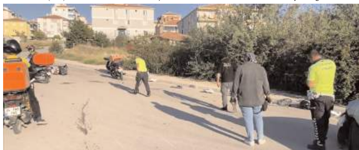
Polis ekipleri kaza yerinde inceleme yaptı.