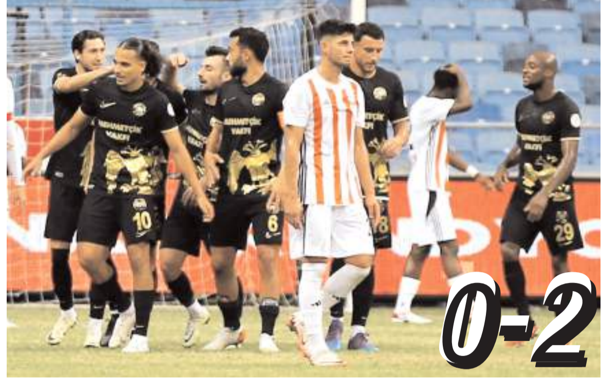
Çorum FK Adanaspor deplasmanında attığı ikinci golün ardından takım olarak böyle sevindi