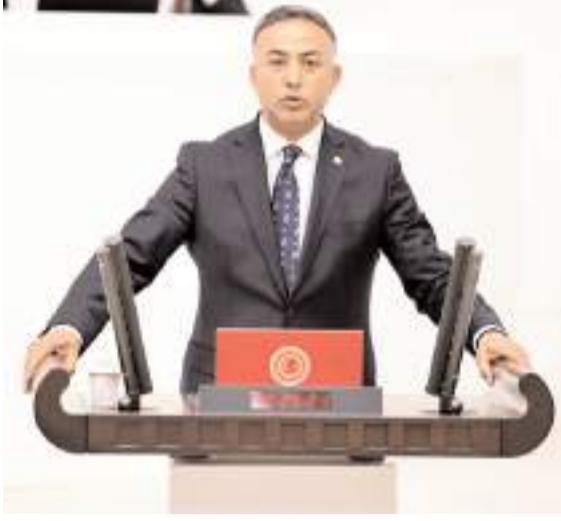
Milletvekili Mehmet Tahtasız

CHP Çorum Milletvekili Mehmet Tahtasız, Ticaret Bakanı Ömer Bolat'ın yanıtı istemiyle verdiği soru önergesinde Türkiye genelinde ve Çorum'da son 3 yılda iflas eden, kapanan, konkordato kararı verilen şirketler hakkında bilgi istedi.