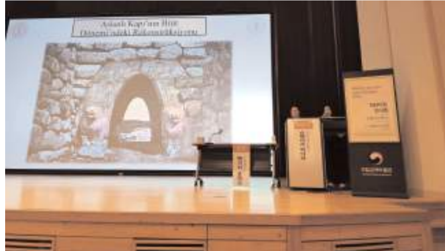
Gimhae Ulusal Müzesi'nde sempozyum düzenlendi.

rihi eserlerden 212'sinin 7 Ekim'den itibaren sempozyumun yapıldığı müzede 6 ay süreyle sergileneceğini aktardı.