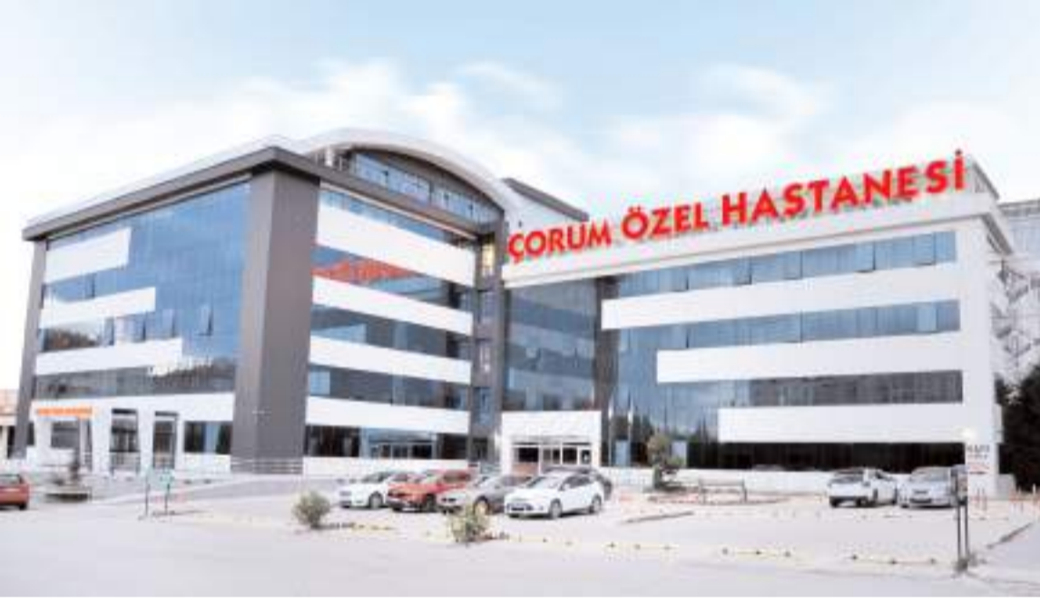
Çorum Özel Hastanesinin yeni binası 13 bin m2'lik kapalı alana sahip.