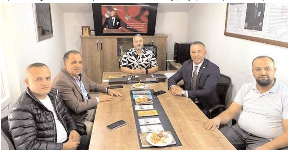
Milletvekili Tahtasız, ÇORDER'in çalışmalarını hakkında bilgi aldı.