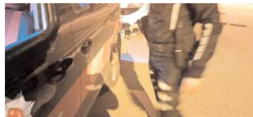
N.K. işlem yapılmak üzere Çocuk Şube Müdürlüğü'ne götürüldü.