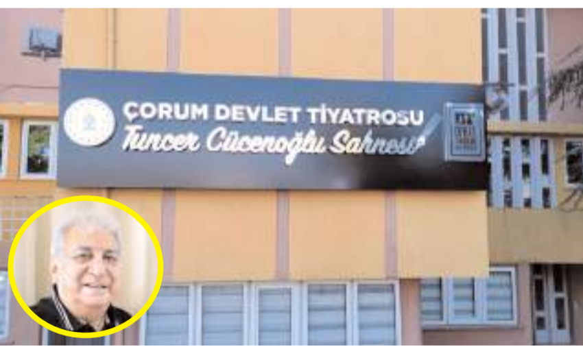
Tuncer Cücennoğlu'nun ismi Çorum'da yaşayacak.

■ Türk tiyatrosunun duayen isimlerinden Tuncer Cücennoğlu'nun adı, memleketi Çorum'da yaşatılacak. Çorum Devlet Tiyatrosuna Tuncer Cücennoğlu Sahnesi adı verildi.