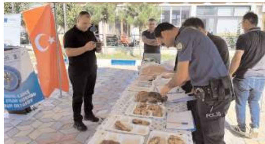
Dört kişiden oluşan jüri üyelerinin değerlendirmesi sonucu dereceye girenler belirlendi.

Çorum'un Ortaköy ilçesinde Yöresel Lezzet Yarışması düzenlendi.