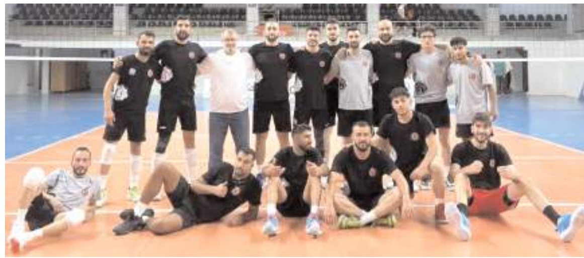
Sungurlu Belediyesi spor voleybol takımı hazırlık maçında Ankara Barosu'nu 3-1 yenerek iyi bir prova yaptı