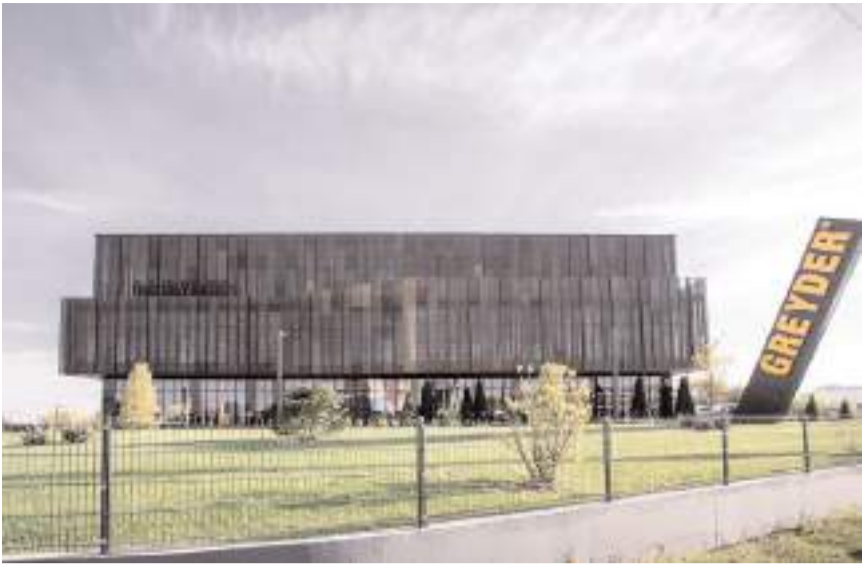
Greyder Türkiye'nin tescilli ilk ayakkabı markası.

■ Çorum'un ayakkabı markası Greyder, 35 milyon 726 bin 927 TL tahakkuk ile Çorum'un 2023 yılı vergilendirme dönemi kurumlar vergisi rekortmeni oldu.