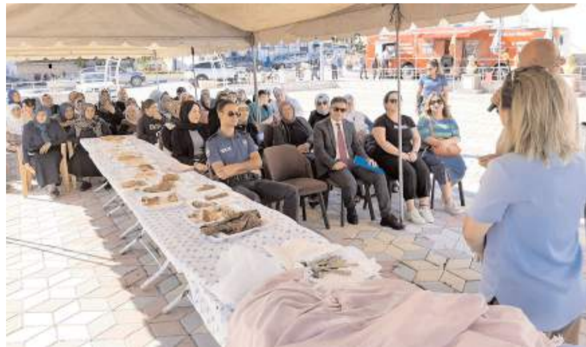
Ortaköy ilçesinde Yöresel Lezzet Yarışması düzenlendi.

Ayrıntılı bilgilere "www.emlakmuzayede.com.tr" internet adreslerinden ve "0212 608 15 00" numaralı telefondan ulaşılabilir.