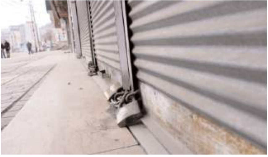
1 Ocak 2021 ile 31 Temmuz 2024 tarihleri arasında Çorum'da 167 şirket kapandı.