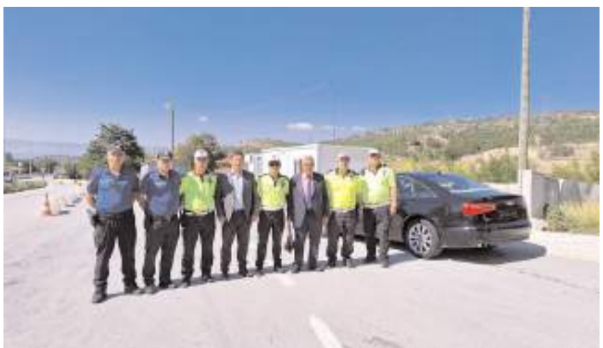
Leblebi dağıtımının ardından hatıra fotoğrafı çekildi.

Çorum Esnaf ve Sanatkarlar Odaları Birliği (ÇESOB) tarafından bu yıl 37.'si kutlanan Ahilik Haftası dolayısıyla sürücülere Ahilik Leblebisi ikram edildi.