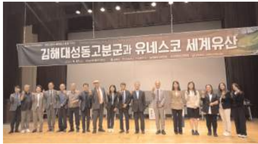
Gimhae kentinde düzenlenen sempozyumda, Anadolu'nun ilk medeniyetlerinden Hititler anlatıldı.

Çorum'da yer alan Hititler'in başkenti Hattuşa ile Alacahöyük, Şapinuva ve Eskişehir antik kentleri hakkında bilgi veren Bektaş, bu kentlerde bulunan ta-