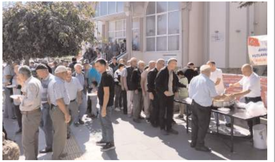
Ahilik Haftası etkinlikleri kapsamında 6 farklı camide cemaate Ahilik pilavı ikramında bulunuldu.

Olayın ardından kaçan şüphelilerin yakalanması için çalışma başlatıldı.(AA)