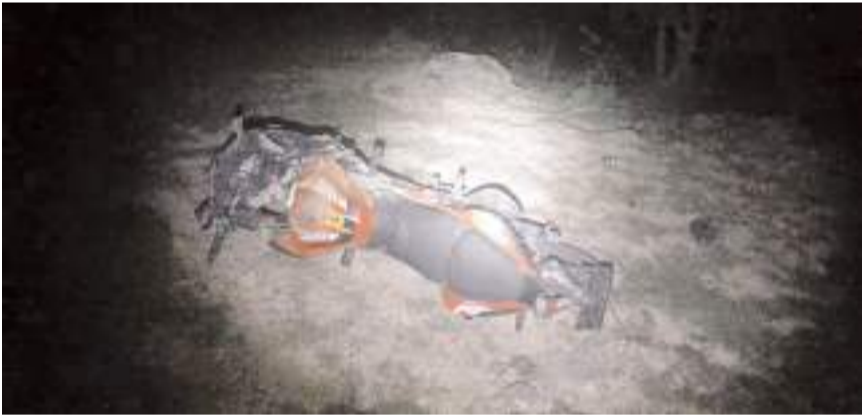
Kaza, Çamlık Caddesinde meydana geldi.

Çorum'da kontrolden çıkan motosikletin devrilmesi sonucu meydana gelen trafik kazasında 2 kişi yaralandı.