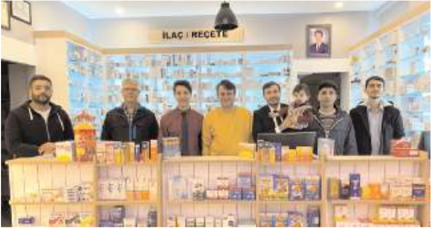
Saadet Partisi Çorum İl Gençlik Kolları, eczacıları ziyaret etti.

"Bizim bu çalışma ile amacımız, tüm millî ve manevî değerlerimizin erozyona uğradığı böyle bir dönemde, ekonomik sıkıntılarla mücadele eden esnafımızın yanında olduğumuzu hatırlatmanın yanı sıra, Ahilik kültürüne ve dayanışma ruhuna karınca kararınca katkı sağlamaktır. Bu vesileyle Saadet Partisi olarak, Ahilik kültürünü yaşatan tüm esnafımıza hayırlı işler diliyor, helâl ve bereketli kazançlar temenni ediyoruz." ifadelerini kullandı. (Haber Merkezi)