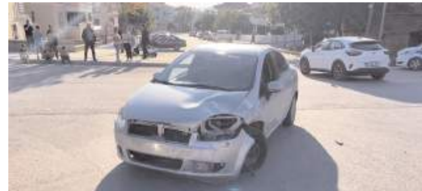
Kaza Bahçelievler Mahallesi Bahar 15. Sokak'ta meydana geldi.