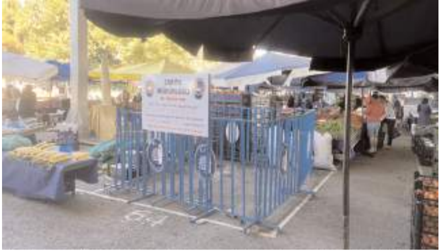
Hijyen kurallarına uymadığı için daha önceden 2 kez cezai işlem uygulanan pazar esnafına 1 hafta tezgah kapatma cezası verildi.

Sabah saatlerinde Cuma Pazarı'nda denetim yapan ekipler bir esnafın hijyen kurallarına uymadığını tespit etti. 2024 yılı içerisinde 2 kez daha aynı kuralı ihlalden dolayı idari para cezası uygulanan esnafa Belediye Encümen kararı gereği tezgah kapatma cezası verildi. (Haber Merkezi)