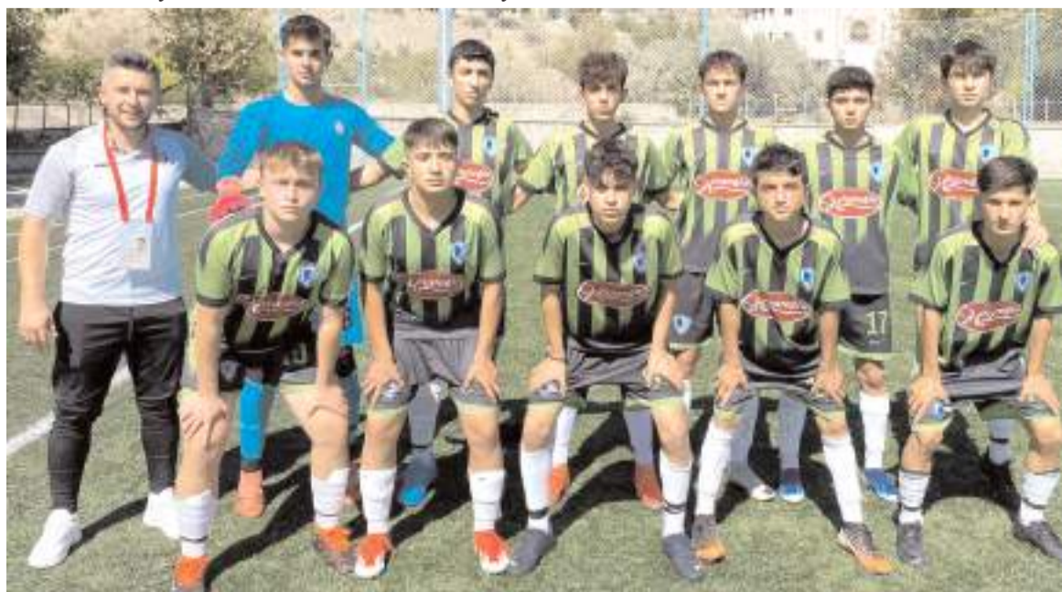
Mimar Sinan U 16 takımı ikinci maçında İskilipspor deplasmanından gol yemeden galip gelerek liderliğini sürdürdü

B grubunda ilk hafta maçlarını kazanan iki takım Çorumspor ile Osmancık Belediyesi spor arasında Nazmi Avluca sahasında oynanan maç 78. dakikada yarıda kaldı. Çorumspor'un 2-0 önde girdiği maçta bu dakikada iki futbolcu arasında ortalık karıştı ve maçın hakeminin gösterdiği kırmızı kartların ardından Osmancık Belediyesi spor antrenörü takımı sahadan çekti. Bu maçla ilgili kararı Tertip Kurulu verecek. Maçın ardından ise Osmancık Belediyesi spor antrenörü maçın hakeminin rakibinin sert futbola izin vermesi sonucunda iki oyuncusunun hastanelik olduğunu belirterek tepkisini dile getirdi.