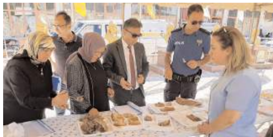
20 yarışmacı, Ortaköy'ün yöresel lezzetlerinden haşhaşlı çörek, gillik, ekmekek ve erişte hazırladı.