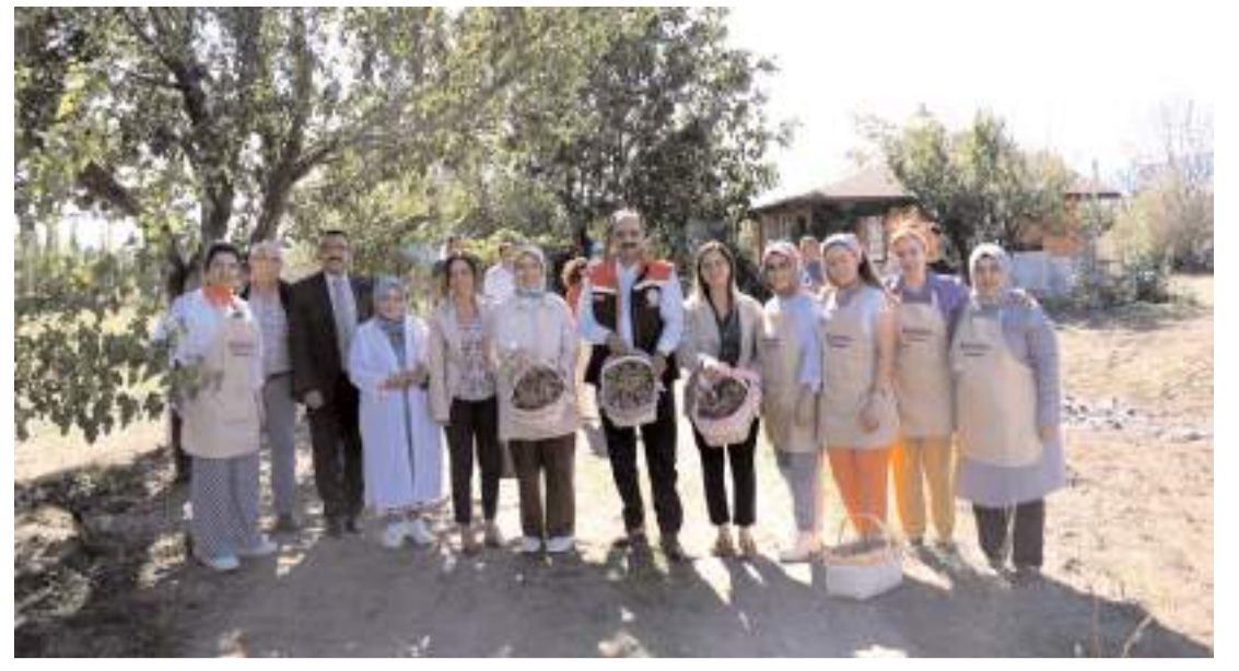
Çorum'da da safran üretimi için harekete geçildi.

Çorumluların, hem de tiyatro camiasının vefa borcuydu.