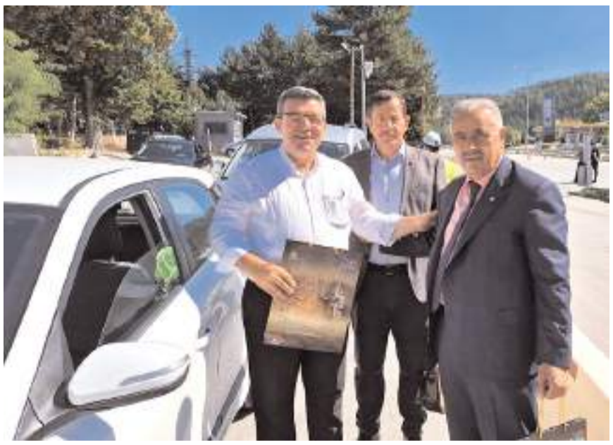
Bölge Trafik Müdürlüğü önünde sürücülere leblebi ikram edildi.