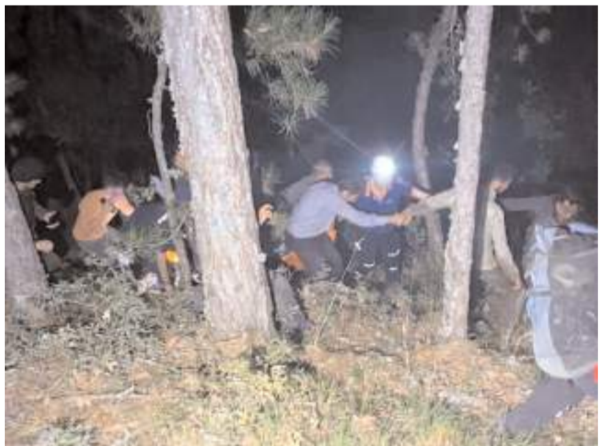
Yaralı baba ile oğlunu düştükleri yerden AFAD ekipleri kurtardı.