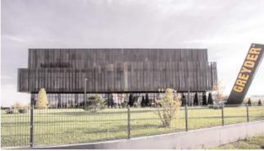
Greyder Türkiye'nin tescilli ilk ayakkabı markası.