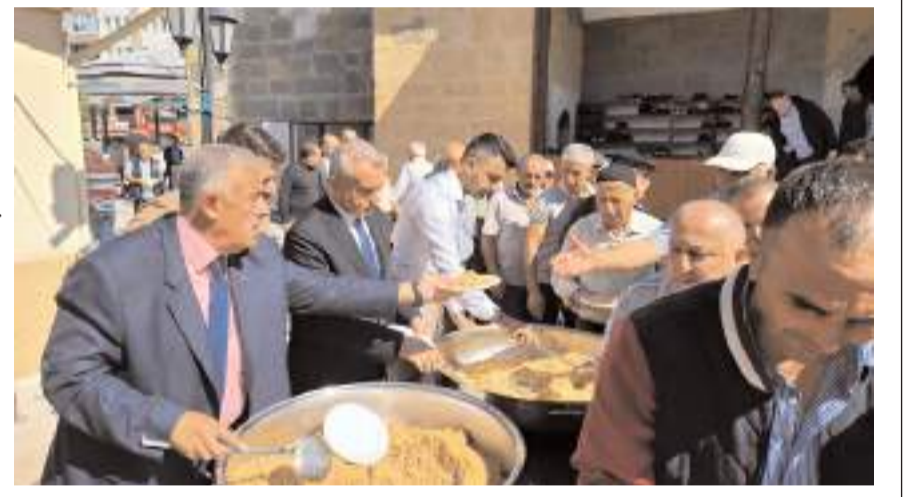
Pilav dağıtımına protokol üyeleri de katıldı.