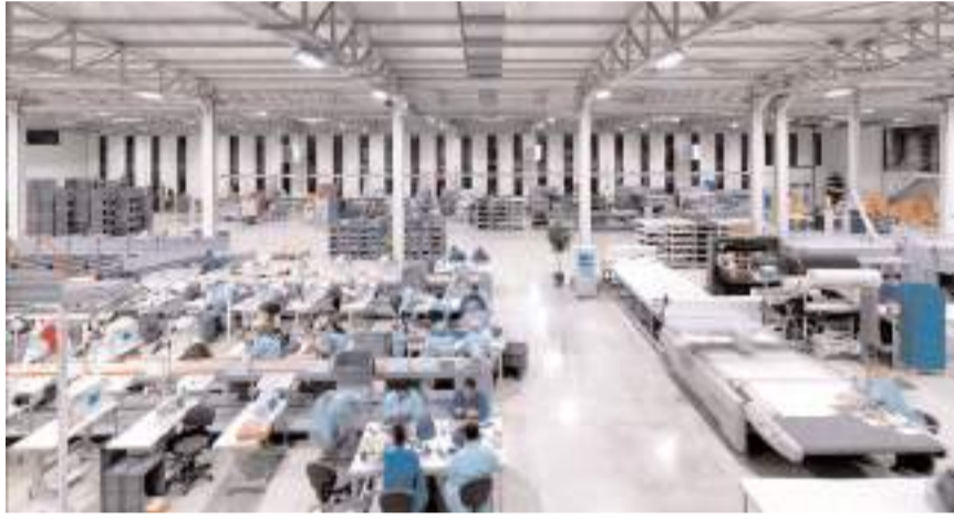
Firma yılda 2 milyon çift ayakkabı üretiyor.