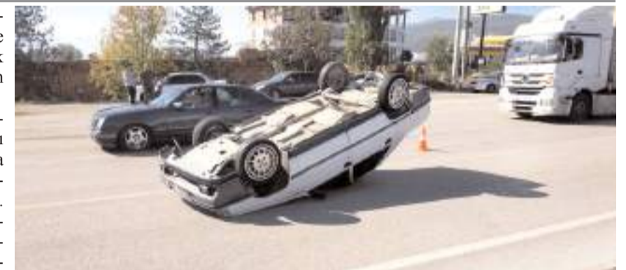
Kazada refüje çarpan araç takla atıp sürüklendi.

Kaza, D100 karayolu Dereboğazı mevkiinde meydana geldi. Edinilen bilgilere göre, Caner B. yönetimindeki otomobil, sürücüsünün direksiyon hakimiyetini kaybetmesi neticesinde, kontrolden çıkarak refüje çarptı. Savrulmaya başlayan otomobil takla attıktan sonra yaklaşık 100 metre sürüklendi. Kazada otomobil sürücüsü yaralandı. Sağlık ekipleri-