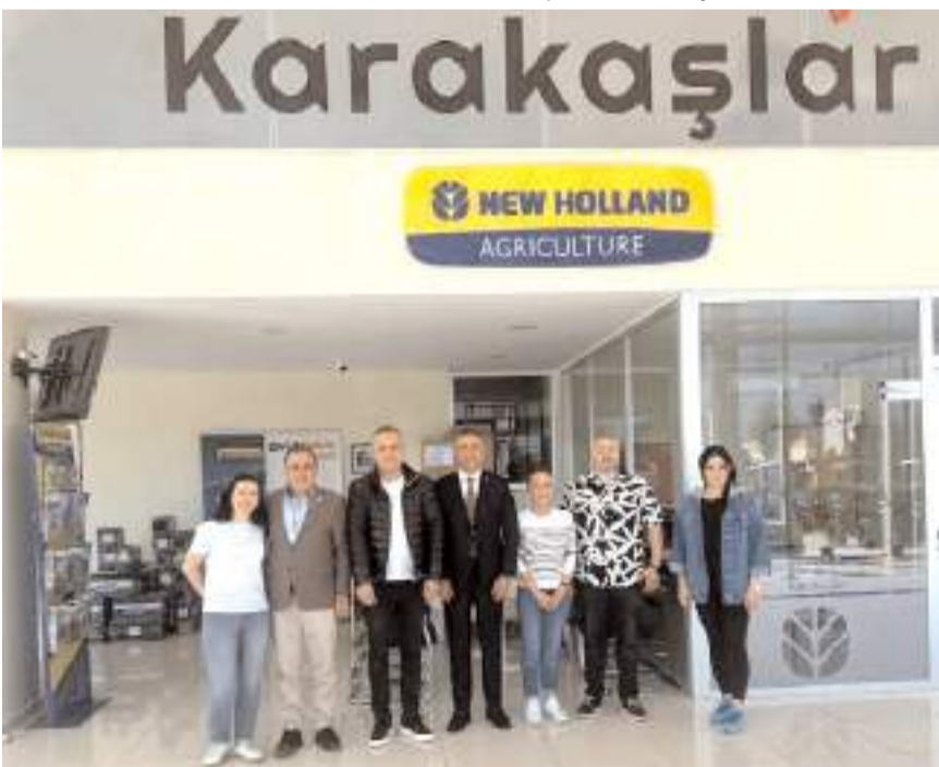
2025 yılında Şubat veya Mart ayının 19'unda saat 19.00'da Çorumlular buluşması yapmayı planladıklarını ifade etti.