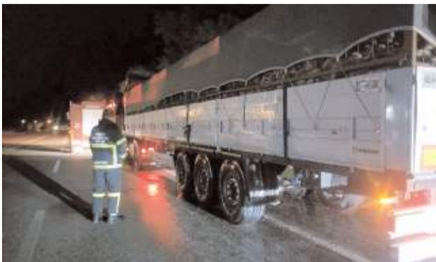
İtfaiye ekipleri tırda soğutma işlemi yaptı.

Edinilen bilgilere göre, Alaca istikametinden Çorum istikametine seyir halindeki tırın balatalarında henüz bilinmeyen bir sebepten dolayı dumanlar yükseldi, tırın lastiklerinden yükselen duman kısa süreliğine paniğe sebep olurken, dumanları gören tır sürücüsü 112 Acil Çağrı Merkezi'ni arayarak yardım istedi. İhbar üzerine bölgeye Alaca Belediyesi itfaiyesi ve jandarma ekipleri sevk edildi.