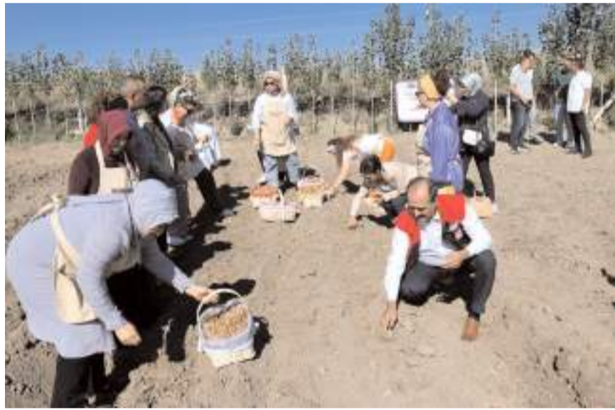
Çorum'da safran üretiminin yaygınlaştırılması için safran ekimi yapıldı.

yerel ekonomiye yüksek katma değerli ürün kazandırmak, katma değeri yüksek ürünlerin üretimi sayesinde üreticilerin tarımsal gelirlerini artırmak, bölgede yeni üretim modellerinin ve üretim çeşitliliğini artırmak amacıyla Çorum'da safran üretiminin yaygınlaştırılması için safran ekimi yapıldı.