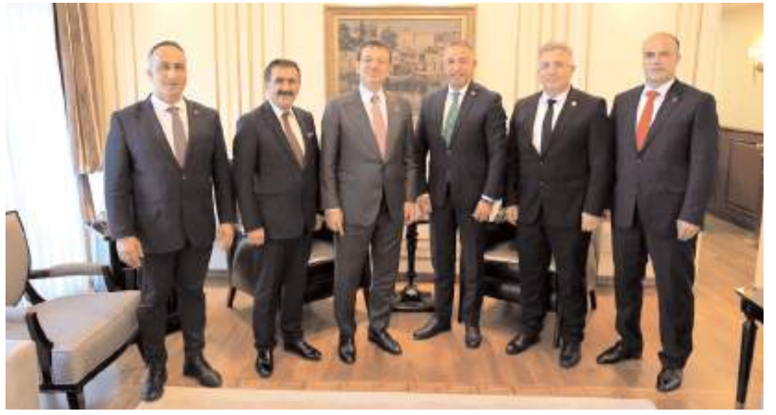
Çorum CHP heyeti İstanbul Büyükşehir Belediye Başkanı Ekrem İmamoğlu'nu ziyaret etti.