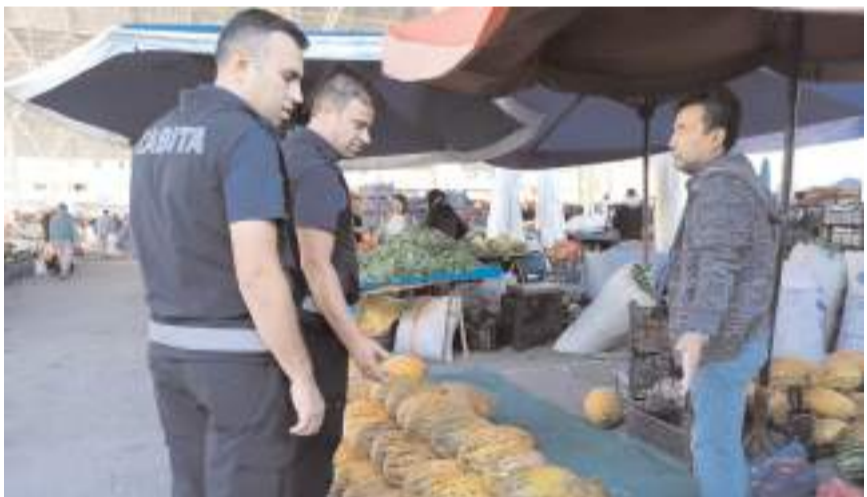
Zabıta ekipleri pazar esnafını denetledi.