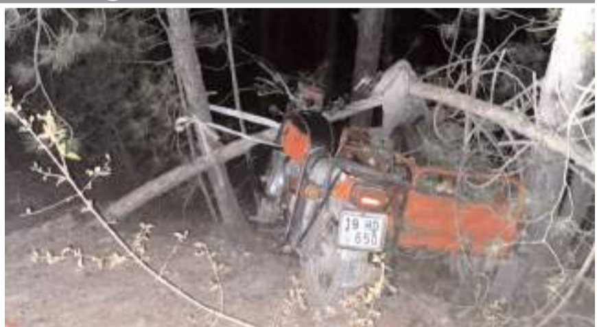
Kaza Kargı'da Kavakçay Deresi mevkiisinde meydana geldi.

Kazayla ilgili başlatılan soruşturma sürüyor.