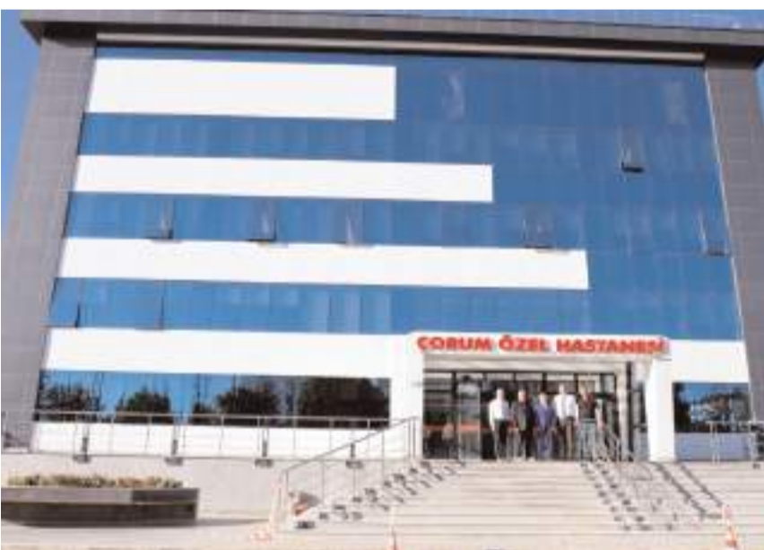
Hastanenin yeni binası geçen yıl faaliyete başladı.

Hastane büyürken hizmet için teknolojik yatırımların da sürdürmüş yeni MR cihazını halkımızın hiz-