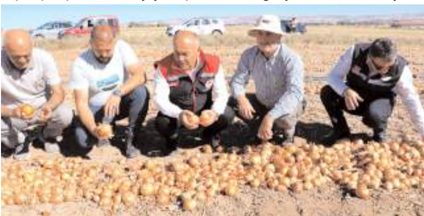
Şarkışla ilçesinde hasadı yapılan Çorum moru soğan Dubai'ye yola çıktı.