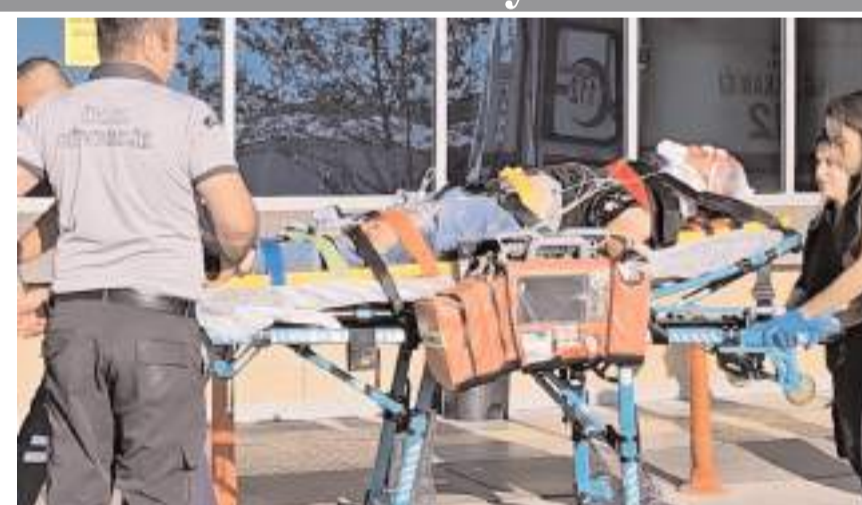
Hayati tehlikesi bulunan genç, buradaki müdahalenin ardından Ankara Etilik Şehir Hastanesi'ne sevk edildi.

Hayati tehlikesi bulunan genç, buradaki müdahalenin ardından Ankara Etilik Şehir Hastanesi'ne sevk edildi.