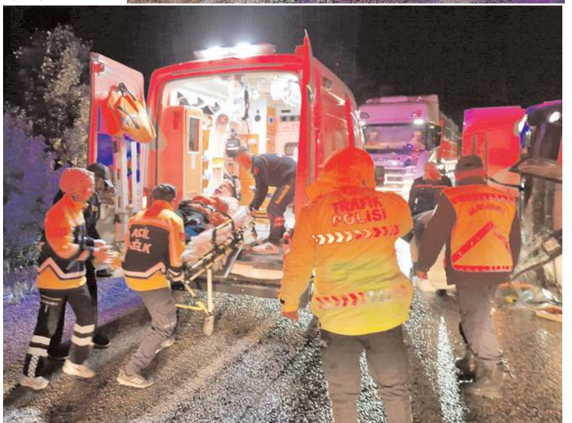
Yaralı sürücüler hastanede tedavi altına alındı.