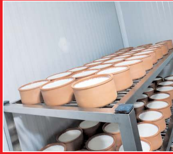
Yoğurt Soğuk Hava Deposu