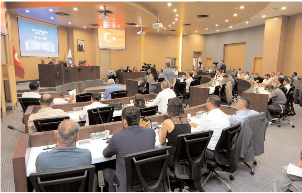
Meclis toplantısında imar ağırlıklı konular görüşülerek karara bağlanacak.

Bahçelievler Mahallesi 5080 ada 2,3,4,5 ve 6 nolu parsellere yönelik imar planı değişikliği teklifi, Yeniol Mahallesi 421 nolu yapı adasının plan değişikliği sınırları içerisindeki parsellere yönelik imar planı değişikliği teklifi, Çepni Mahallesi 4555 ada 1 nolu parselin doğusunda bulunan plan değişikliği sınırları içerisindeki alana yönelik imar planı değişikliği teklifi, Karakeçili Mahallesi 4783 ada 9, 10 ve 11 nolu parsellere yönelik imar planı değişikliği teklifi, Çepni ve Yeniol Mahalleleri içerisinde bulunan 1,5 hektarlık alana yönelik imar planı değişikliği teklifi, 1 adet imar planı değişikliği teklifinin imar komisyonuna havalesi, Çorum İl Milli Eğitim Müdürlüğü ve Çorum Kültür Turizm Derneği ile ortak hizmet projesi."