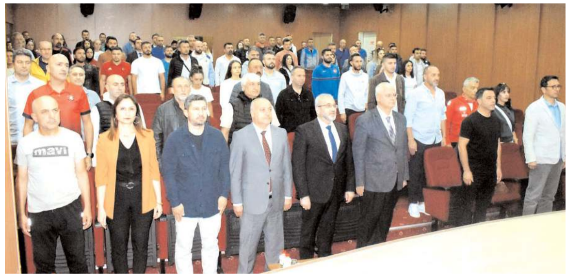
Okul Sporları yeni sezon teknik toplantısı dün protokol üyeleri ve öğretmenlerin katılımı ile yapıldı.

Yarının geleceği olan evlatlarımızımıza onlara saygılı olmak onlara bişey bırakmak istiyorsak yapmış olduğunuz işinizin ne kadar kıymetli ve değerli olduğunu hepimiz biliyoruz Ben bu ekibe 2023-2024 döneminde göstermiş olduğunuz gayretle istediğimiz çitinin daha üstünde olmasını temenni ediyorum hepimizi saygı sevgi muhabbetle selamlıyorum' dedi.