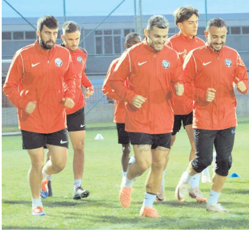
Çorum FK cuma akşamı oynayacağı Iğdır FK maçının hazırlıklarını tam kadro sürdürüyor

Cuma akşamı evinde Iğdır FK ile karşılaşacak olan Çorum FK'da moraller yerinde. Kırmızı Siyahlı takımında tüm hesaplar galibiyet üzerine yapılıyor.