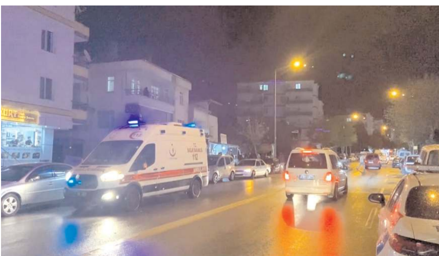
Olay Ata Caddesinde meydana geldi.