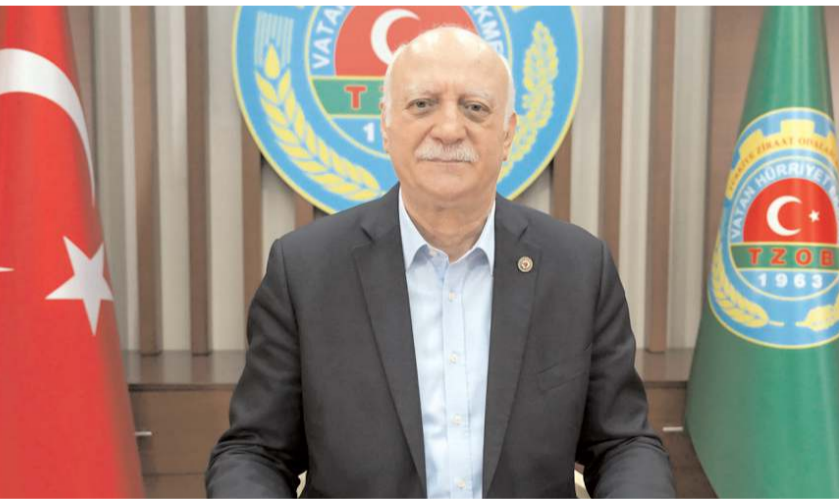
Ziraat Odaları Birliği Genel Başkanı Şemsi Bayraktar