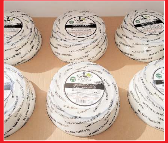
Cam Kase Yoğurt