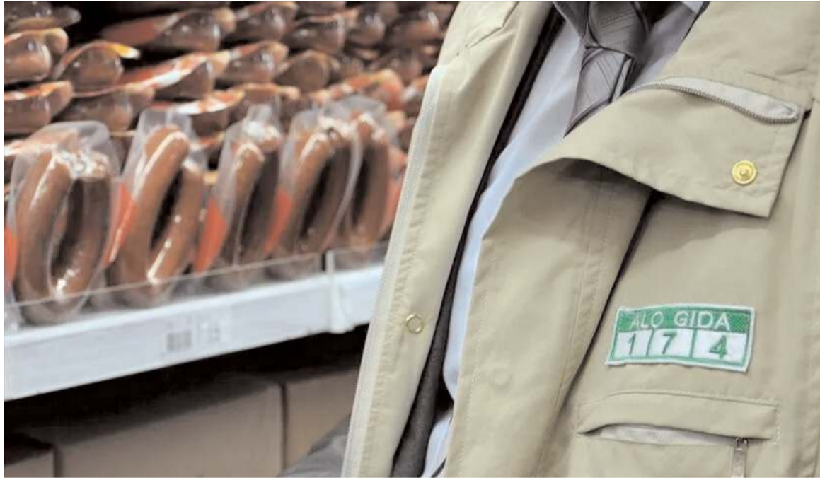
Yeni sistem, güvenilir gıda.tarimorman.gov.tr internet sitesinde yer alacak.

Yumaklı, Beslenme Beyanları Kılavuzu hazırla-