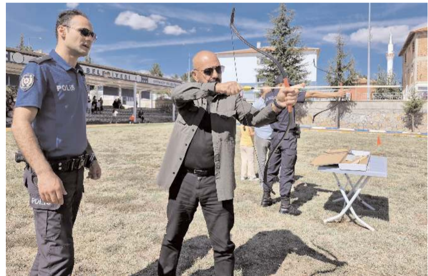
Etkinlik 100. Yıl İlkokulu bahçesinde yapıldı.

Etkinlik sonrası düzenlenen ok atma yarışmasında dereceye giren öğrenciler, Başkan İsbir tarafından para ödülü ile ödüllendirildi. (Haber Merkezi)