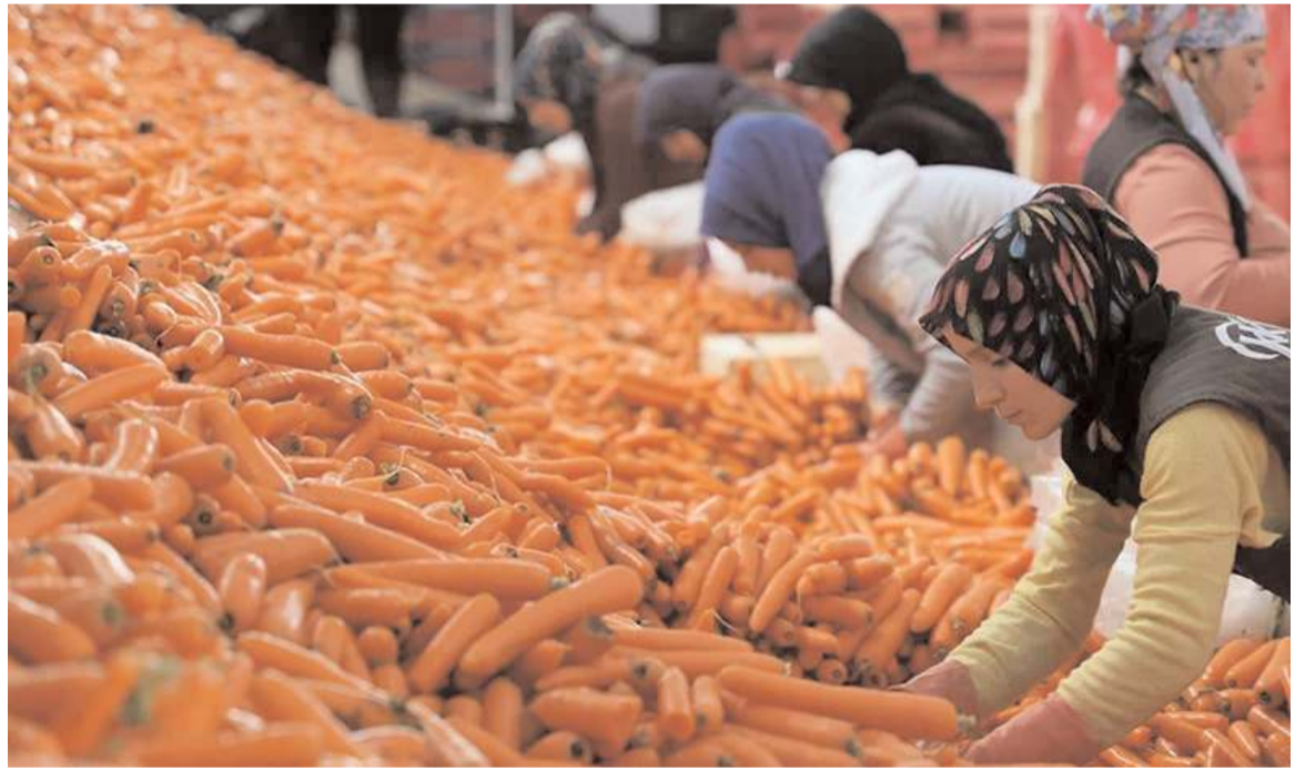
Eylül ayında havuç üreticiden markete gelene kadar 3,5 kat zamlandı.

Buna göre havucun fiyatı markete gelene kadar 3,5 kat, limon 3,2 kat, kuru kayısı, kuru soğan ve patates 3,1 kat arttı. Üreticide 7 lira 50 kuruş olan havuç, markette 26 lira 18 kuruş, 11 lira 50 kuruş olan limon 36 lira 78 kuruş, 130 lira olan kuru kayısı 406 lira 76 kuruş, 5 lira 60 kuruş olan kuru soğan 17 lira 48 kuruş, 4 lira 70 kuruş