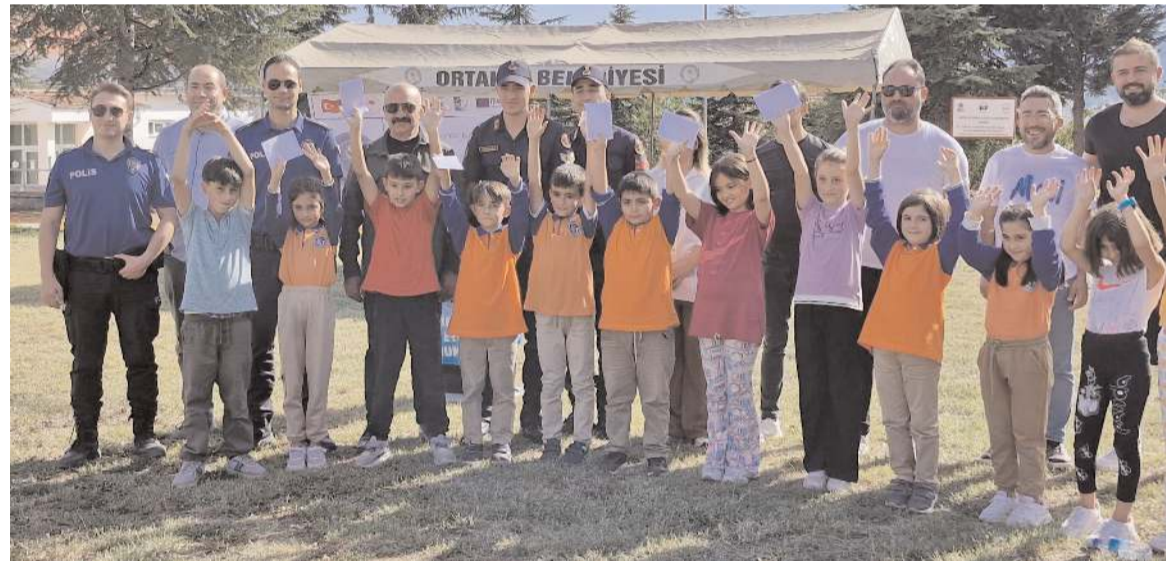
Yarışmada derece elde eden öğrencilere ödül verildi.