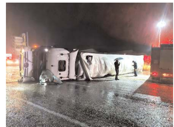
Kaza, Çorum-Alaca karayolunda meydana geldi.