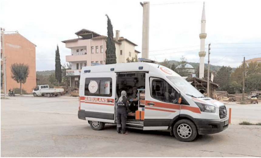
Kaza, Osmancık'ta Çorum Caddesinde meydana geldi.