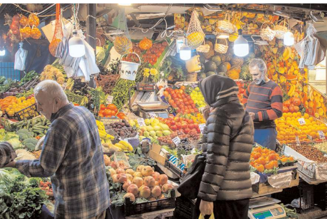
Zamlı yolculuk limon, kuru kayısı, soğan ve patatesten de cep yaktı.