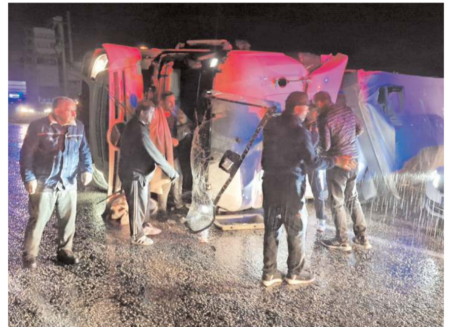
Araç içinde sıkışan her iki sürücü, itfaiye ekipleri tarafından çıkartıldı.