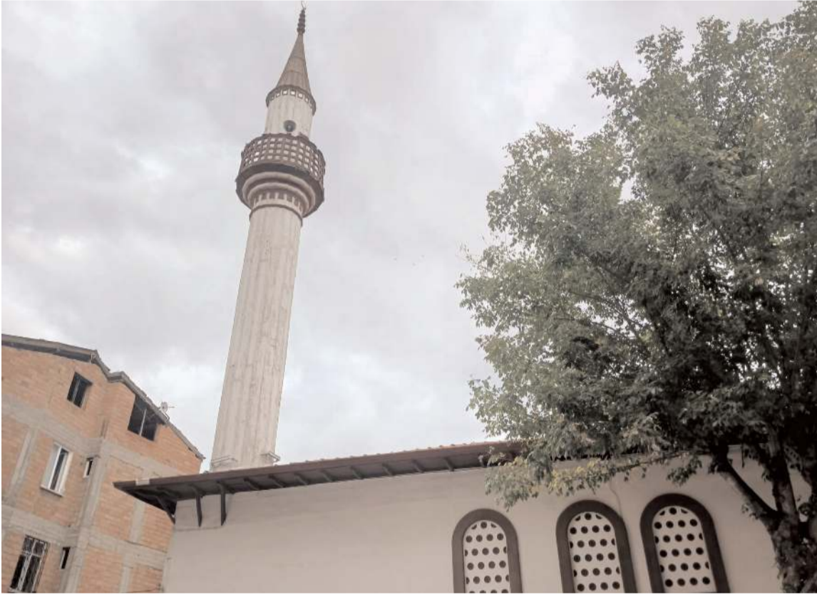
Çakır Caminin 19 yy. ortalarına doğru yapıldığı tahmin ediliyor.