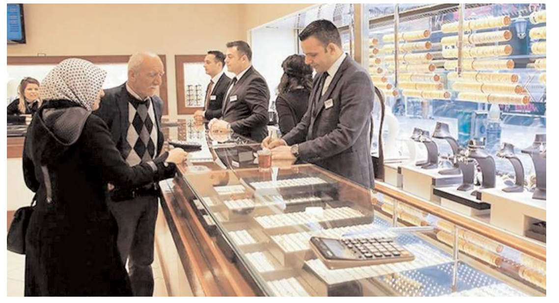
Yatırımlık olarak düşünülen çeyrek, yarım ve tam altın fiyatları ilden ile değişir oldu.