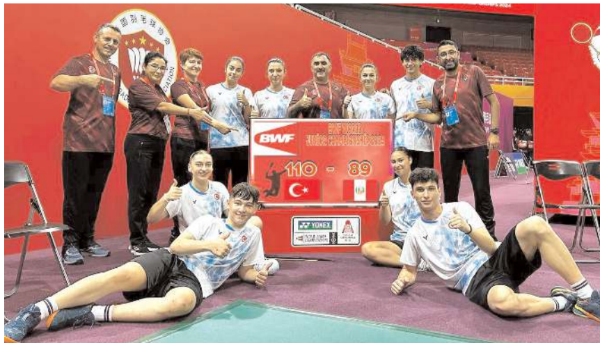
Badminton milli takımı Çin'de grubunda ilk iki maçında kazanmayı başardı

Milli takım bu maçı kazanması halinde akşam seansında kendisi gibi tüm maçlarını kazanan Hindistan ile grup birinciliği maçına çıkacak. Bu maçı kazanması halinde çeyrek finalde mücadele edecek milli takım kaybetmesi halinde 9-16 sıralama maçları oynayacak. Takım müsabakalarının ardından Dünya Şampiyonası ferdi müsabakalar ile 12 Ekim'de sona erecek.