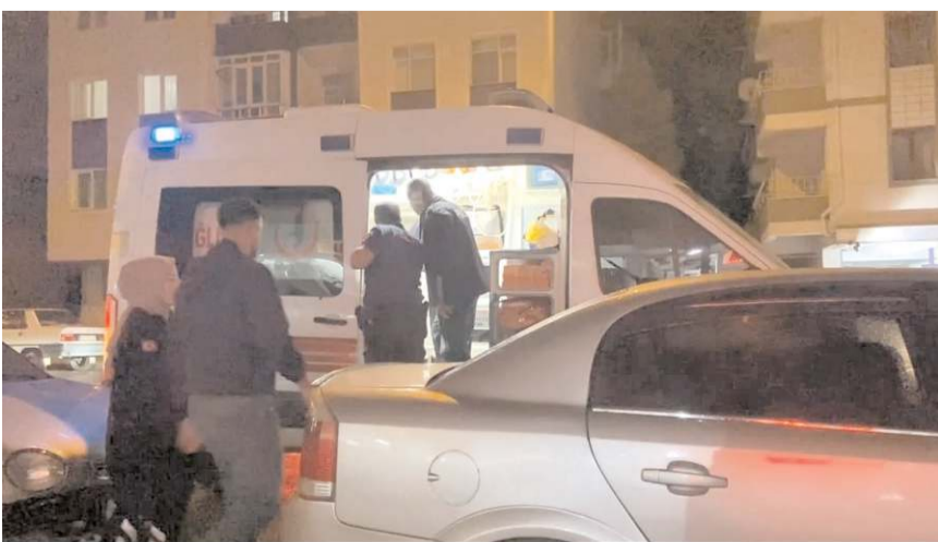
Yaralıları hastanede tedavi altına alındı.

Çorum'da iki grup arasında çıkan kavgada 1 kişi bıçaklandı, 3 kişi darp edildi.