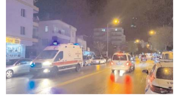
Olay Ata Caddesinde meydana geldi.

Bazı eğitim sendikaları, Öğretmenlik Meslek Kanunu Teklifindeki bazı hükümler dolayısıyla eylem yapacaklar. * HABERİ 5'DE