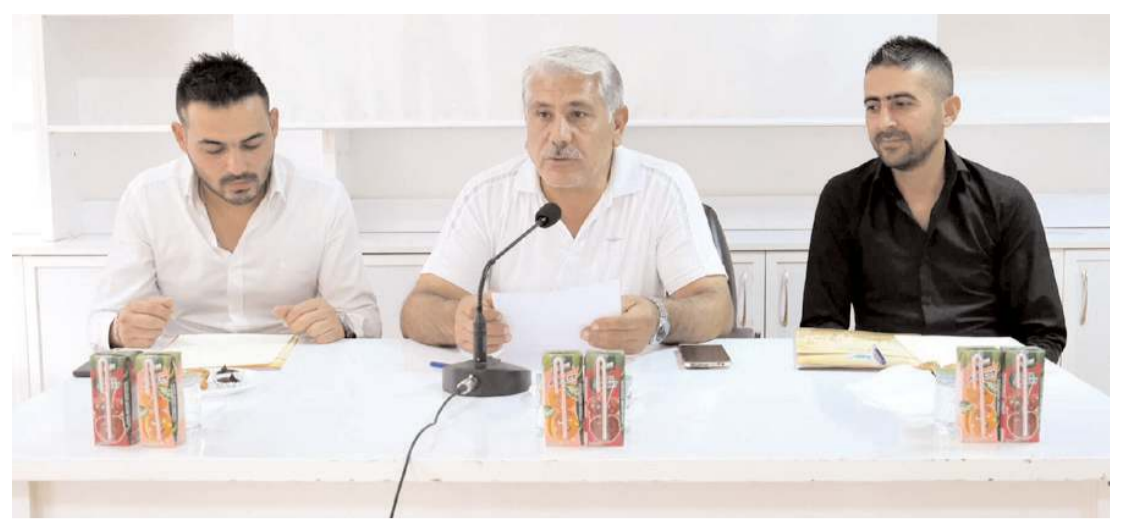
Sungurlu Belediyesi Kent Konseyi ilk toplantısını gerçekleştirdi.