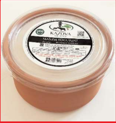
Güveç Manda Yoğurdu

Aynes süt ürünlerinin Çorum bayisi olduklarını da belirten Kınık, Aynes markasının 10 kilogramdan 100 grama kadar tüm yoğurt çeşitlerinin yanı sıra tam yağlı, yarım yağlı, litrelik, 200 miligramlık süt, ayran ve meyve suları ile birlikte, kaşar peyniri, beyaz peynir, tereyağı ürünlerinin de toptan ve perakende satışını yaptıklarını söyledi. Günseven markasının Çorum bayisi olduklarını söyleyen Tuncay Kınık bu markanın sirke, limon suyu, şalgam, nar ekşisi, limonata ürün çeşitlerine de firmamızda bulabilirsiniz diyerek tüm Çorumluları yeni taşındıkları Ulukavak Mahallesi Kunduzhan 1. Cadde No: 4/B (Hürriyet İlkokulu karşısı)deki iş yerlerine davet etti.