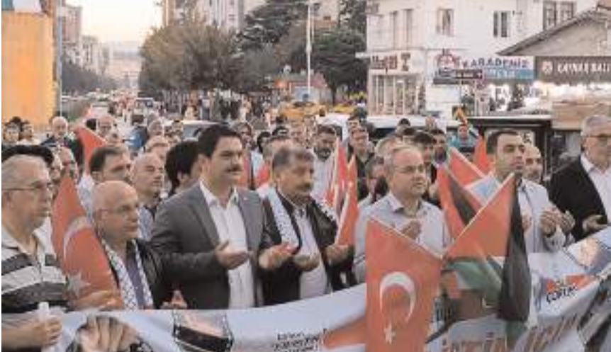
Yürüyüşe siyasi partilerin ve STK'ların temsilcileri de katıldı.