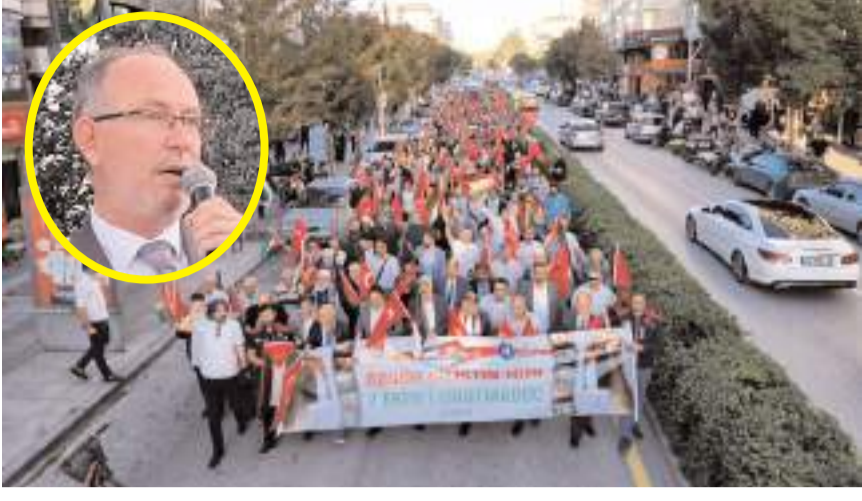
"Soykırma İsyan Filistin'e Destek Yürüyüşü" önceki gün gerçekleştirildi.

■ Çorum'da Filistin Platformu tarafından İsrail'in 7 Ekim'den bu yana bir yıldır süren Filistin'deki saldırılarını protesto etmek amacıyla "Soykırma İsyan Filistin'e Destek Yürüyüşü" yürüyüşü düzenledi. * HABERİ'2'DE