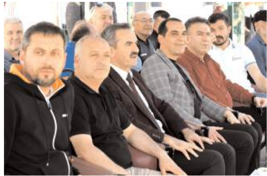
Karşılaşmayı protokol soyunma odaları önünde kurulan geçici tribünde maçı birlikte izlediler