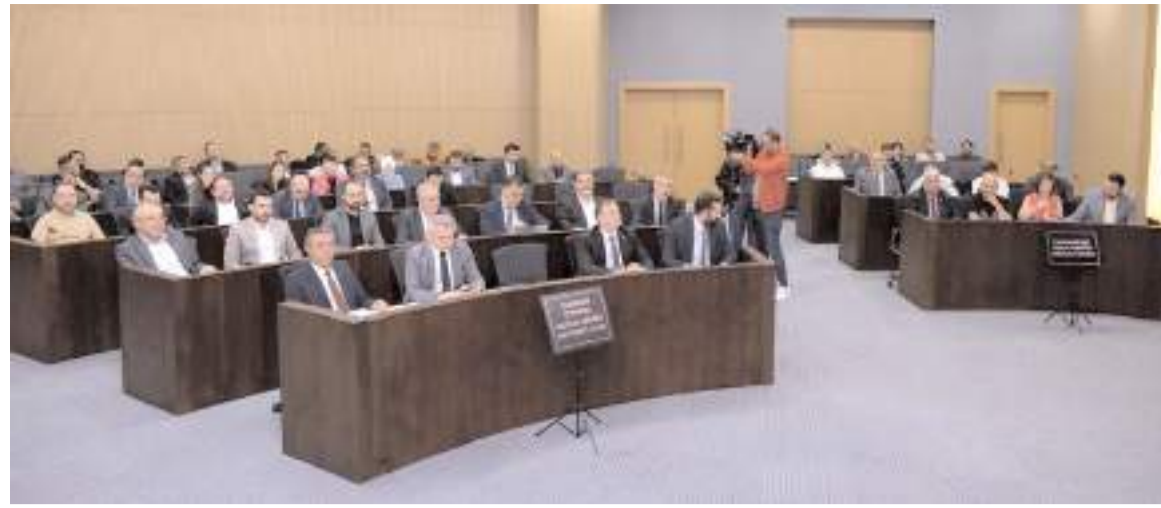
Belediye meclisi toplantısında Bahçelievler'de yeni cemevi işaretlenmesi tartışmalarına neden oldu.

Bırakın projeleri yeni 5 yıllık dönemde biz bu bölgenin alt yapı çalışmalarını tamamlayabilecek miyiz?" dedi.