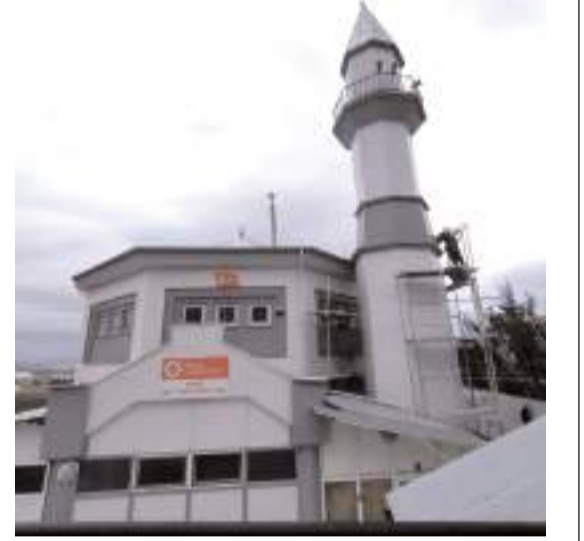
Cami'nin yeni ismi Akent Şehit Semih Yılmaz Camii oldu