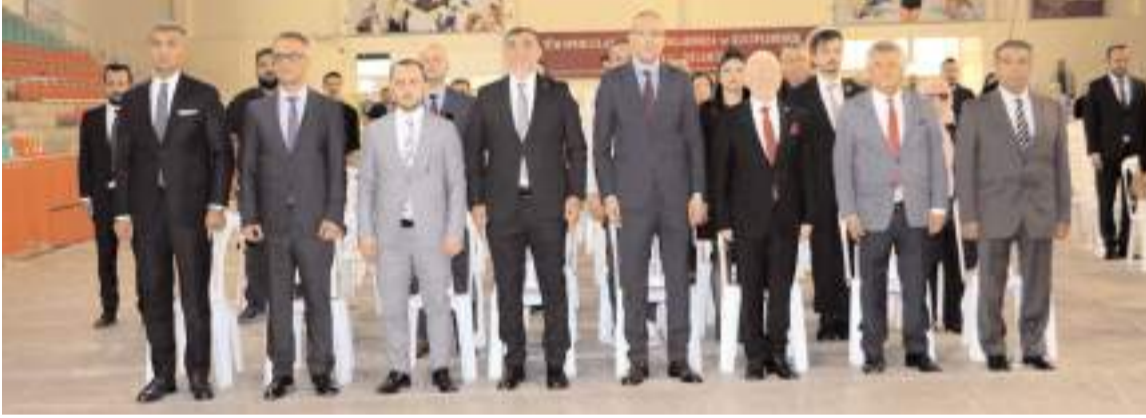
Baro'nun Olağan Genel Kurul Toplantısı Atatürk Spor Salonu'nda gerçekleştirildi.