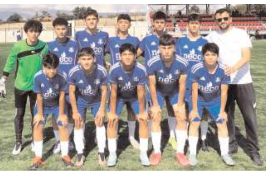
Vefaspor U 16 takımı play-off için kritik maçı kazanarak iddiasını devam ettirdi