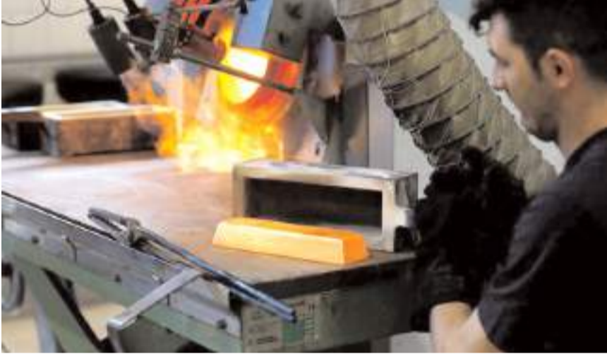
2024 yılında Çorum'dan 1.6 milyar dolarlık mücevher ihracatı gerçekleştirildi.