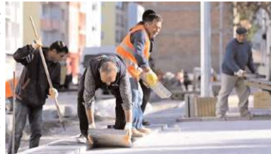
Ortaköy ve Sungurlu Belediyesi daimi işçi alacak.

SUNGURLU SYDV'YE SOSYAL YARDIM VE İNCELEME GÖREVLİSİ