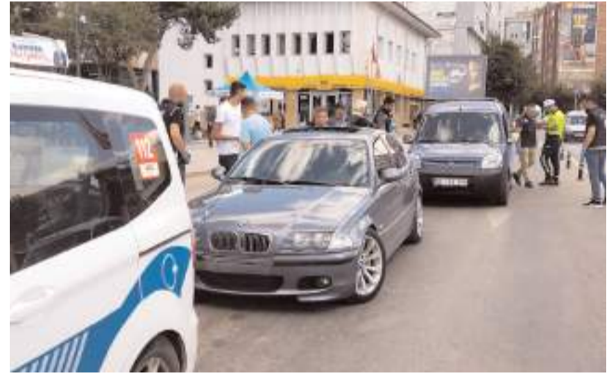
Çalışmalar neticesinde, 2 bin 638 şahsın GBT kontrolü yapıldı.

Yapılan uygulamalar sırasında haklarında çeşitli mahkemeler tarafından arama kararı bulunan 7 şahıs yakalanırken, 7 ruhsatsız tabanca, 5 tüfek, 3 kuru sıkı tabanca, 6 kesici ve delici alet olmak üzere toplam 21 adet silah, 84 adet fişek, 10 adet şarjör, 37 adet sentetik ecza, 19,38 gram sentetik kannobionoid maddesi, 20 adet extacy ile 1 adet metal jop ele geçirildi.