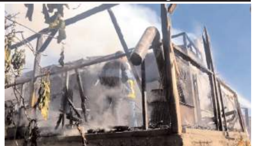
Ağaçcamı köyünde çıkan yangında ev ile samanlık kullanılamaz hale geldi.

him K'ye sağlık ekiplerince müdahale edildi. Oğuzlar Belediyesince mağdur aileye yardımda bulunulacağı belirtildi.(AA)