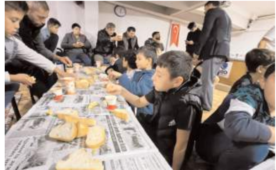
AGD'nin sabah namazı buluşmasına onlarca aile ve çocuk katıldı.

Sabah namazının önemi ve Gazze, Kudüs ne bağlantısı var diyenler olabilir? Selahattin Eyyubi'nin şu kıssasını çok önemli buluyorum. Selahaddin Eyyubi Cuma hutbesinde iken bir genç bağırır; Ey Selahaddin Kudüs esir sen burada konuşuyorsun. Selahattin Eyyubi cevap vermez. Ertesi gün sabah namazında cemaate döner o genç nerede der? Yok derler Cumaya gelenler. Selahattin Eyyubi cemaate dönerek "Cuma namazına gelen müslümanlar sabah namazına da geldiği gün Kudüs bizimdir" der.