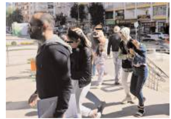
Ziynet eşyası çalan 2 kadın çıkarıldıkları mahkemece tutuklandılar.