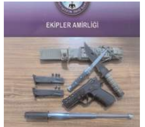
Polis ekiplerince gerçekleştirilen şok uygulamada haklarında arama kararı bulunan 7 kişi yakalandı.