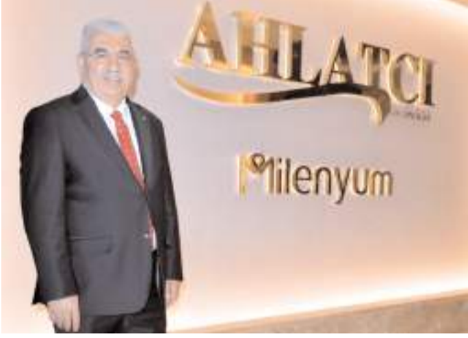
Ahlatcı Holding Yönetim Kurulu Başkanı Ahmet Ahlatcı

AA muhabirinin Türkiye İhracatçıları Meclisi