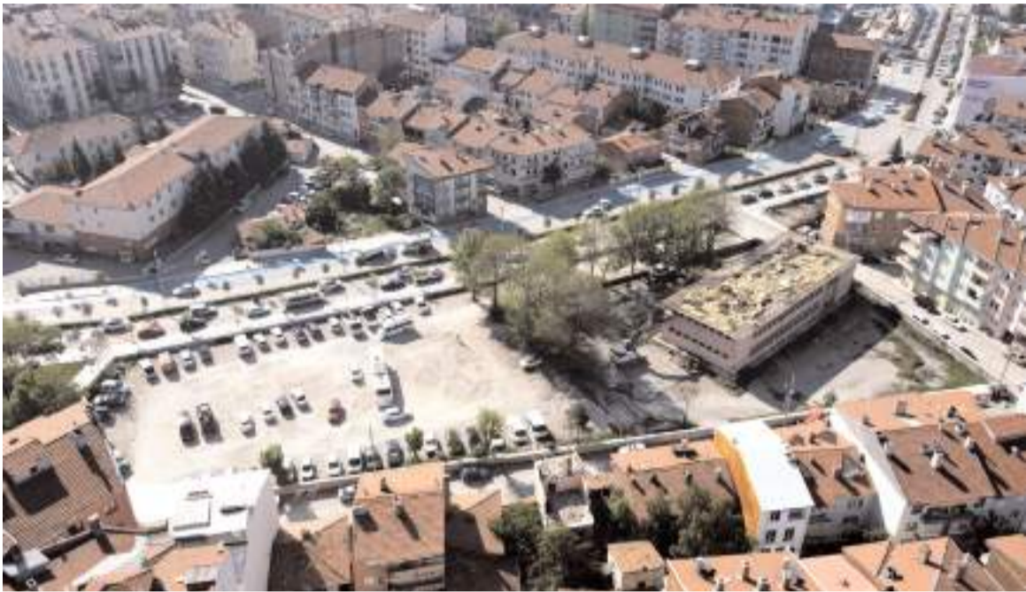
Arsanın satışından elde edilecek gelir afet riski altındaki alanlar ile kentsel dönüşüm projelerinde kullanılacak.

Tayyip Erdoğan Caddesi üzerindeki eski Kız İHL arsası ve otopark olarak kullanılan bahçenin bulunduğu bölgedeki 5.200 m2'lik 4 ayrı parselin satışı ve buradan elde edilecek kaynağın afet riski altındaki alanlar ile kentsel dönüşüm projelerine kullanılması Meclis'in onayına sunuldu. Gündem maddesi oy çokluğuyla kabul edildi.