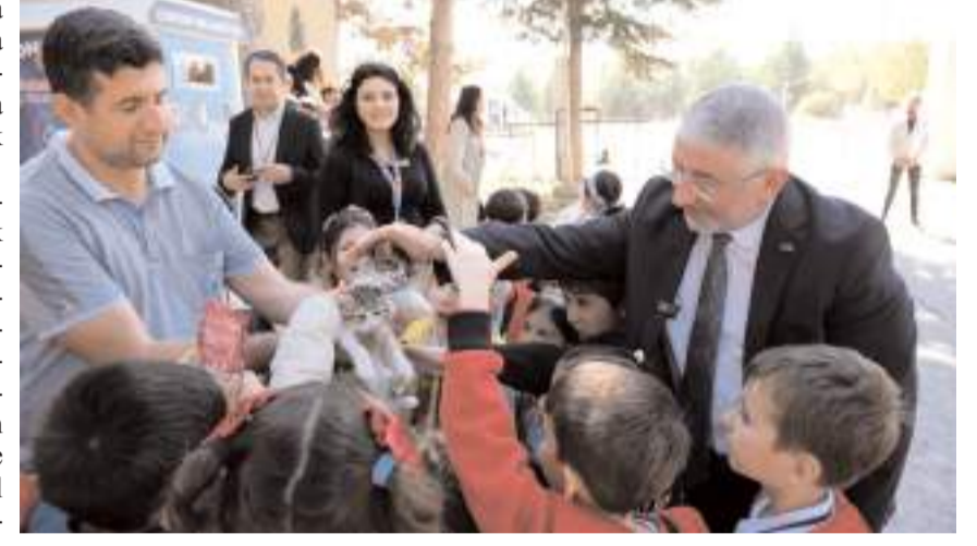
Öğrenciler sokak hayvanlarının bulunduğu bölümleri gezerek, sevdiler.