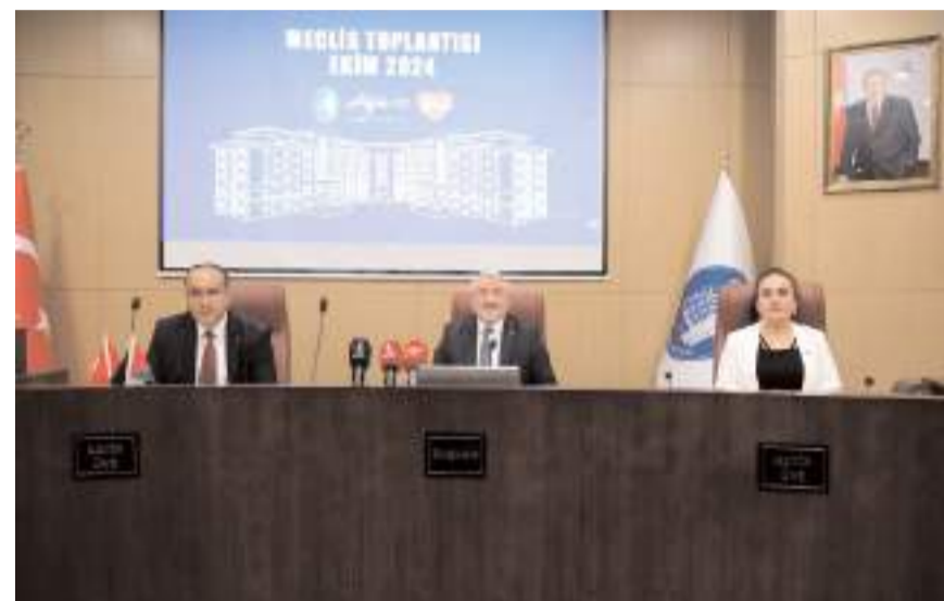
Meclis toplantısı geçtiğimiz Cuma günü gerçekleştirildi.

Toplantı CHP grubunun yokluğunda devam etti.