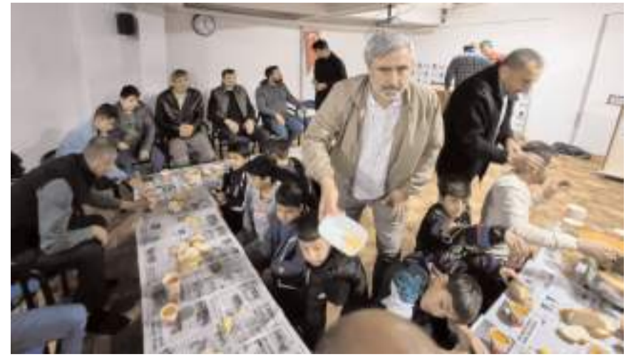
Etkinlikte çocuklara çorba ikram edildi.

Evet ahlaki bir bozulma olabilir, gençlerin kafası karışık, olabilir ama inşallah aziz milletimizin gençleri bu milli ve manevi ahlak ile nice mazlumlara umut olacak. Rahmetli Erbakan hocamızın "Bu milletin külüne üflesen, altından iman çıkar" derdi. Bütün mesele azıcık bir gayret. Aylık sabah namazı dışında da hafta sonları tüm ortaokul öğrencilerimizi dernek binamıza davet ediyoruz."