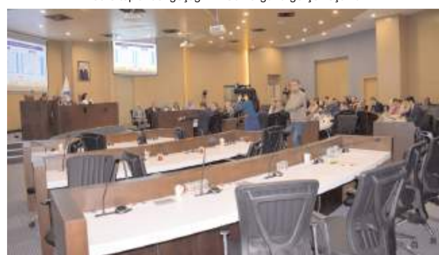
CHP, söz konusu maddenin kabul edilmesinin ardından toplantıyı terk etti.