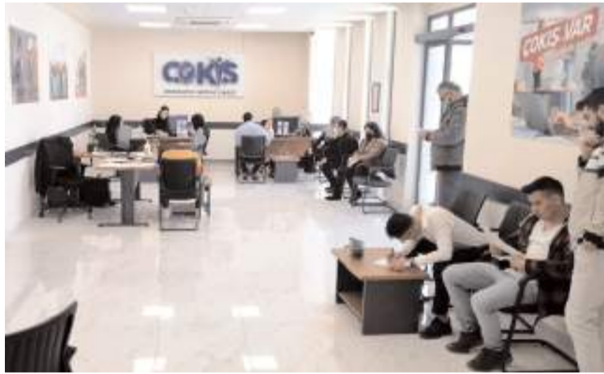
2020 yılında kurulan ÇOKİŞ, 4 yıl da 3 bin kişiye istihdam sağladı.

2020 yılında kurulan ve yaptığı firma ziyaretleriyle önemli bir misyon üstlenen Çorum Belediyesi ÇOKİŞ şehrin ekonomisine önemli katkı sağlıyor.