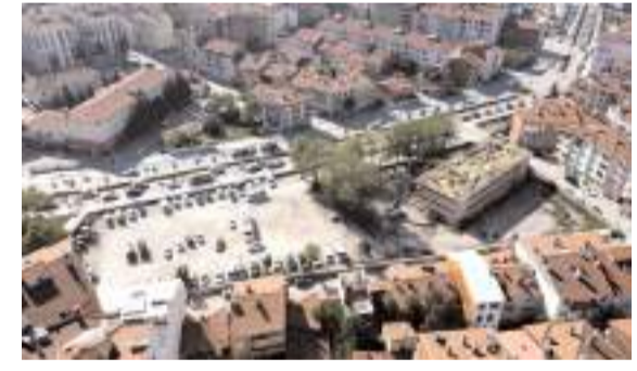
Arsanın satışından elde edilecek gelir atet riski altındaki alanlar ile kentsel dönüşüm projelerinde kullanılacak.

■ Türkiye'nin en büyük altın ihracatçılarından biri olan Ahlatcı Kuyumculuk, yılın 9 ayında 1.6 milyar mücevher ihracatı gerçekleştirdi. * HABERİ'5'DE