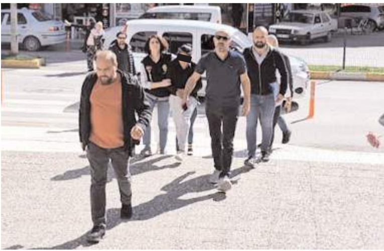
Ziyet eşyası çalan 2 kadın çıkarıldıkları mahkemece tutuklandılar.

Çorum'da bir evden hırsızlık yaptıkları iddiasıyla gözaltına alınan 2 kadın tutuklandı.