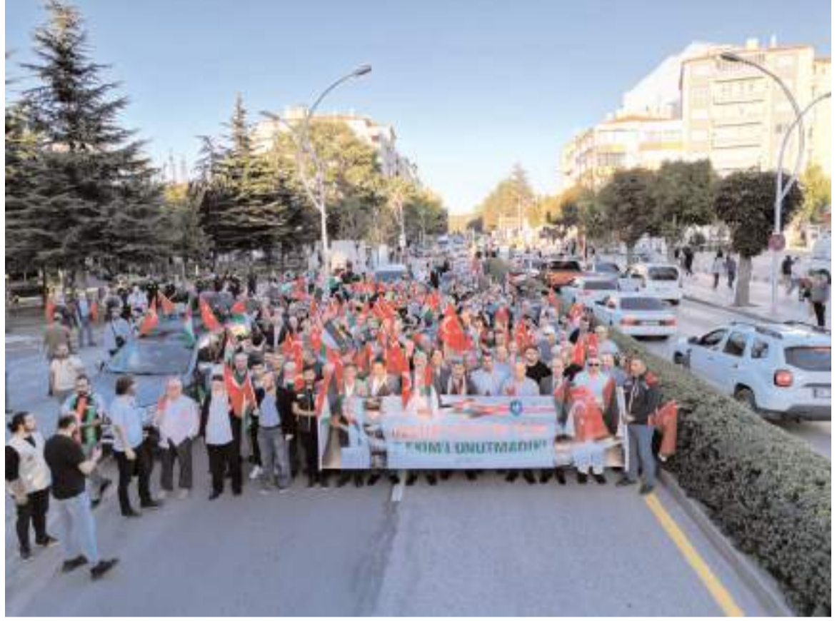
"Soykırıma İsyan Filistin'e Destek Yürüyüşü" önceki gün gerçekleştirildi.