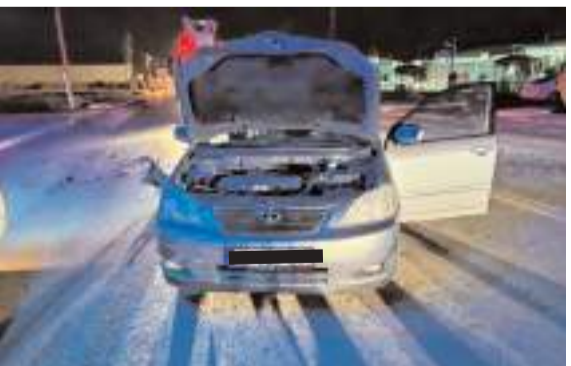
Çorum Caddesi'nde meydana gelen kazada 4 kişi yaralandı.

Polis, havaya ateş eden kişinin belirlenmesi için çalışma başlattı.(AA)