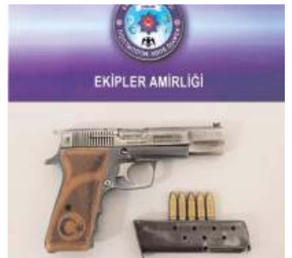
Aramalarda çok sayıda tüfek ve ruhsatsız tabanca da ele geçirildi.