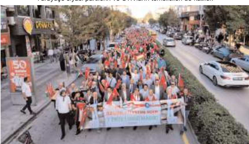
Çorumlular sloganlarla Hürriyet Meydanı'na kadar yürüdü.