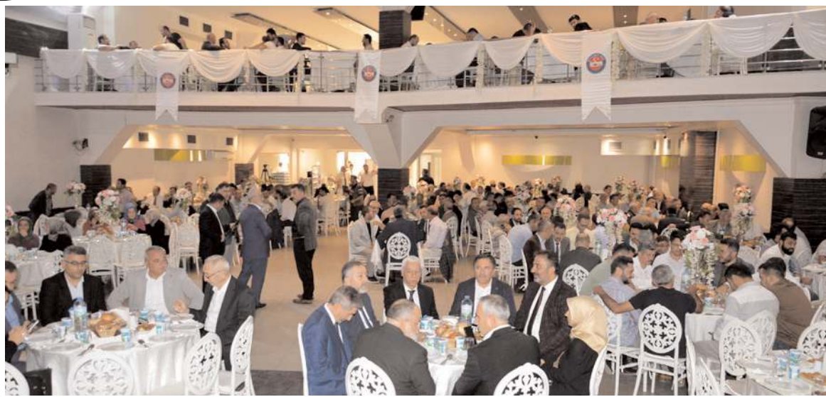
Programa çok sayıda din görevlisi katıldı.

"Bizler, Memur Sen Konfederasyonu'ndan sendikal anlayışı olarak, sendikacılığı boş, sığ, ideolojik bir sendikacılık olarak görmüyoruz. Bizler, Diyanetsen ailesi, Memur Sen ailesi, sendikacılığı özlük ve özgürlük mücadelesi olarak koruyoruz ve bu anlayışla yolumuza devam ediyoruz. Dolayısıyla 4688 yasanın bize vermiş olduğu, sendikal çalışmalara vermiş olduğu yetki çerçevesinde, din görevlisi kardeşlerimizin bu anlamdaki taleplerini iki yılda bir kez toplu sözleşme masasında, yılda iki kez kamu idari toplantısında, yine yılda bir kez kamu personel kurulu toplantıları olmak üzere yine hükümet oturup bu sorunları tartışıp, bu anlamda sorunları aşma noktasında, çözüm bulma noktasında toplantılarımızı yaptık. Bundan sonra da bun yaptıklarımızı devam ettireceğiz. Şu ana kadar yedi tane toplu sözleşme yaptık. Bu yedi toplu sözleşmede 107 ana başlıkta bu aziz teşkilatın çalışanlarına her unvandan dokunuşlar yapacak şekilde kazanımlar elde ettik. Çünkü biz yirmi bir yıldır Diyanet İşleri Başkanlığı'nda tek yetkili sendikayız. Sayısal çoğunluğumuz, Türkiye birincisi olmamız bizim sadece bu aziz kadim teşkilata karşı sorumluluklarımızı ve bu konuda mükelleffiyetliliklerimizi arttırmaktadır. Bu bilinçle bu şurada biz de çalışmalarımızı yapıyoruz.