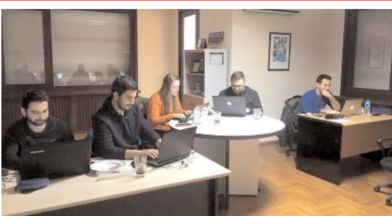
Özel girişimcilerden oluşan ekibin kurs vereceği belirtildi.