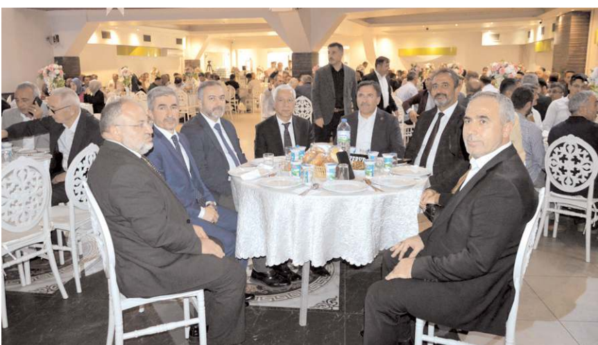
Camiler ve Din Görevlileri Haftası nedeniyle Afra Düğün Salonu'nda program düzenlendi.