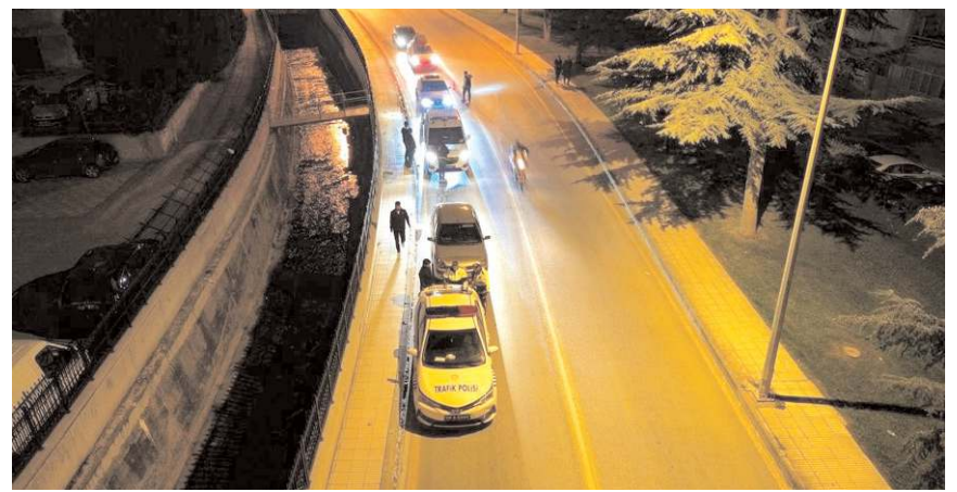
Uygulamada araçlar bir bir durdurularak kontrol edildi.