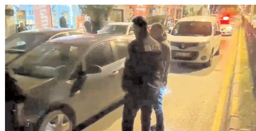
Pide fırını ile fırına ait kamyonetin camları kimliği belirsiz kişiler tarafından kırıldı.

Şehir dışında bulunduğu öğrenilen işletme sahibinin şikayetçi olmadığı öğrenildi.(AA)