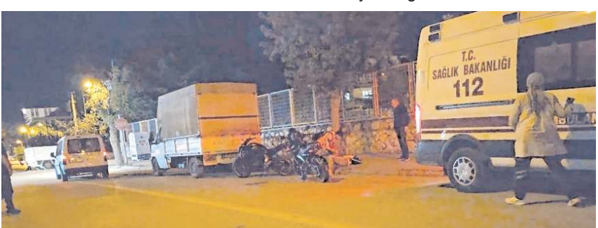
İhbar üzerine olay yerine sağlık ekipleri sevk edildi.