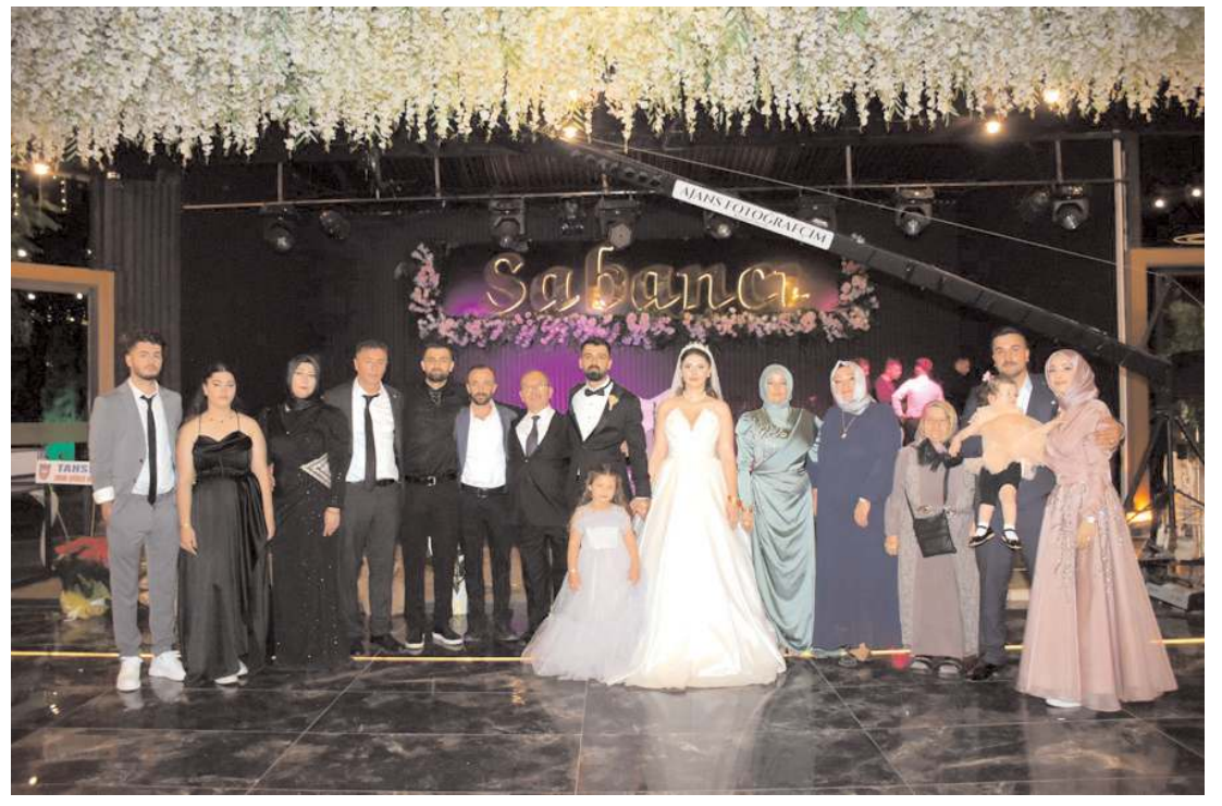
Genç çiftin düğün töreni Sabancı Garden Düğün Salonu'nda gerçekleşti.