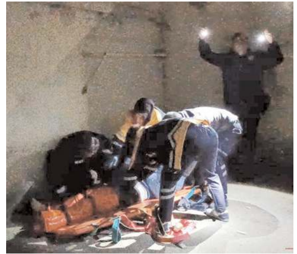
H.D isimli vatandaş, evinin balkonundan aşağı düşerek ağır yaralandı