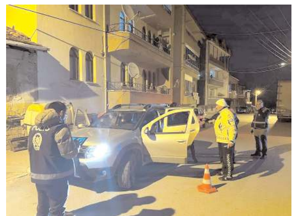
Emniyet Müdürlüğü'nün şok uygulamaları aralıksız devam ediyor.

■ Çorum'da bir apartmanın 4'üncü katından düşen şahıs ağır yaralandı. * HABERİ 7'DE