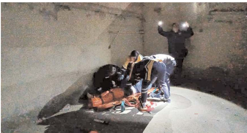
Çorum'da bir apartmanın 4'üncü katından düşen şahıs ağır yaralandı.

Olayla ilgili inceleme başlatıldı. (İHA)