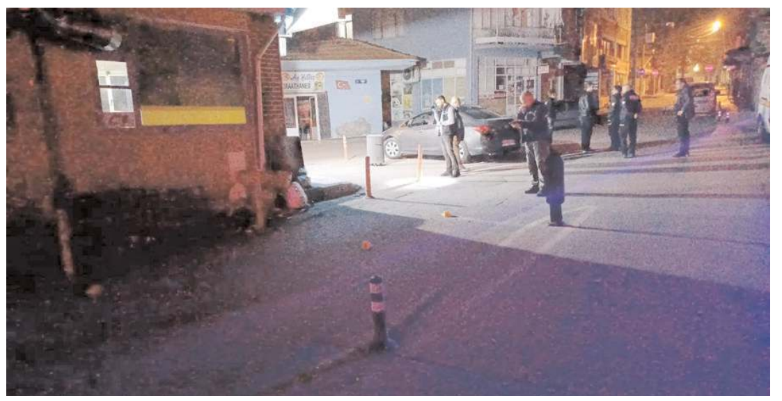
Kunduzhan Caddesi'nde kimliği belirsiz kişi ya da kişiler tarafından iş yerine ateş açıldı.

Polis ekipleri olayın ardından kayıplara karışan yakalanması için çalışmalar sürüyor. (İHA)