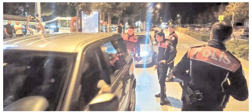
Emniyet Müdürlüğü'nün şok uygulamaları aralıksız devam ediyor.

Uygulamalarda 8 tabanca, 3 tüfek ve 3 kurusıkı tabanca, 5 adet kesici ve delici alet, 52 tabanca mermisi, 73 adet av fişegi, 9 adet tabanca şarjörü ele geçirildi. Denetimlerde ayrıca 61 adet sentetik ecza maddesi, 6 ader extacy, 2, 64 gram sentetik kannoboid ele geçirildi.