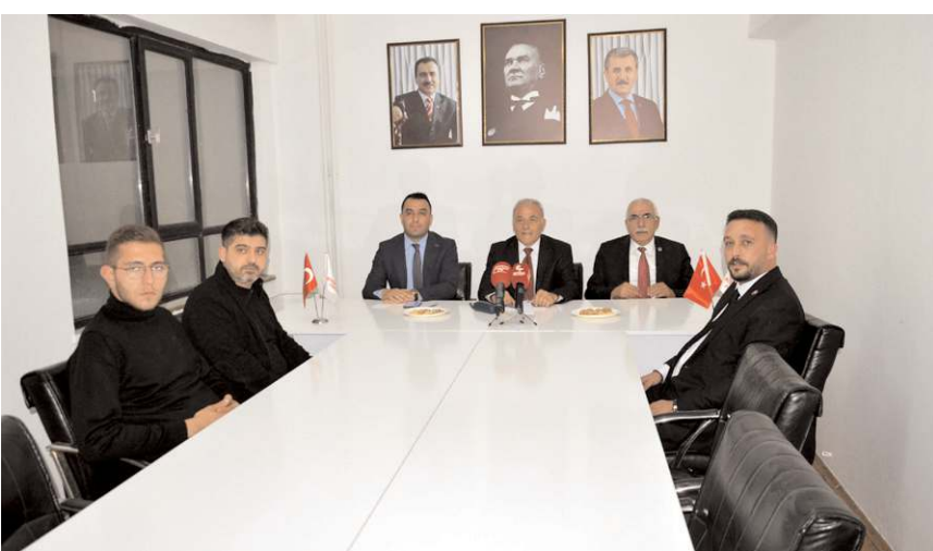
Basın toplantısında bazı partililerde hazır bulundu.

hal indirimlerinin, o mahkemelere duyulan güveni yerle bir ettiğini, işlenen çok sayıda suç için o suçların yasalarda belirlenen cezalarının yeterli olmadığını, ağır suçlardaki kısa infaz sürelerinin ve şartlı tahliyelerin, suçun mağdurları başta olmak üzere, milletimizin tümünde adalet duygusunu sarstığını, yeni suçlara zemin hazırladığını defalarca söyledik. Hukuk sistemimizde, tahliyesiz müebbet hapis cezasının bulunmamasının hiçbir haklı gerekçesi ve izahı yoktur. İdam cezası bugünün Türkiye'si için bir mecburiyettir ve idam cezası geri gelmelidir. Maalesef, bu konuları ilk kez ve sadece dile getiren biz olduk. Anlamayanlara, anlamak istemeyenlere bir kez daha söylüyorum: Tek bir derdimiz var: Milletimizi korumak. Bu, ancak sağlam bir hukuk sistemi ve bunun doğru işletilmesi ile mümkün olabilir. Milletimizi korumak için ne gerekiyorsa yapacağız." ifadelerini kullandı