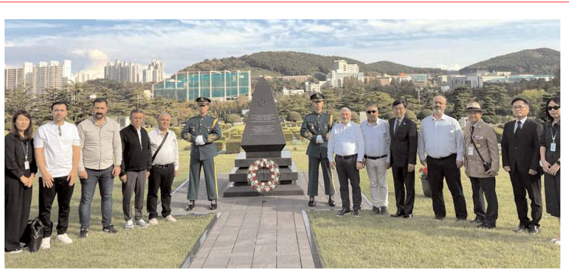
Çorum heyeti, Birleşmiş Milletler Anıt Mezarlığı içerisindeki Busan Türk Şehitliği'ni ziyaret etti.