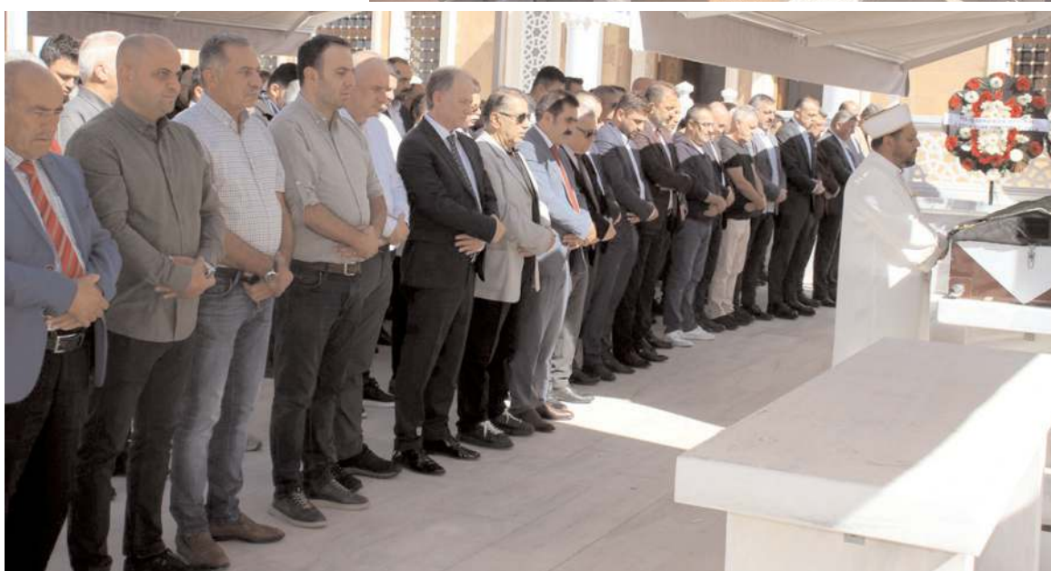
Cenazeye protokol üyeleri de katıldı.