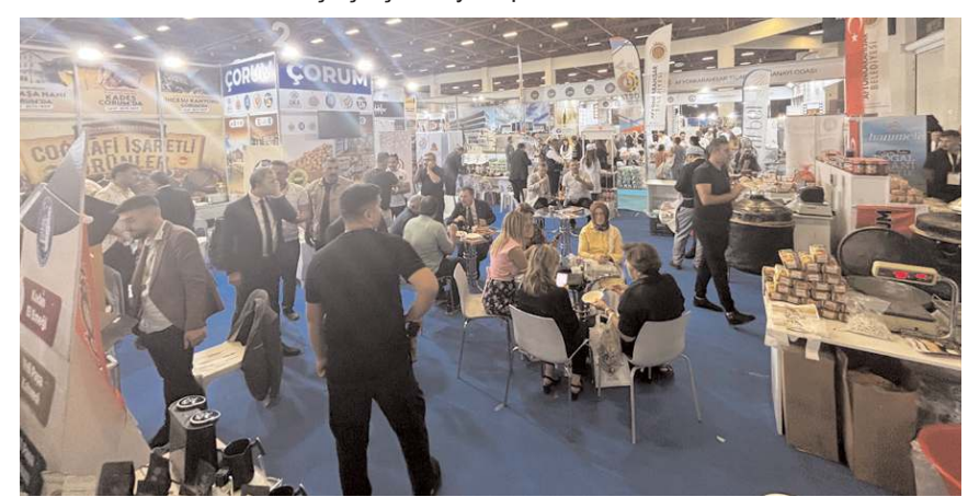
Çorum'un lezzetlerinin tanıtıldığı stant, katılımcılardan yoğun ilgi gördü.