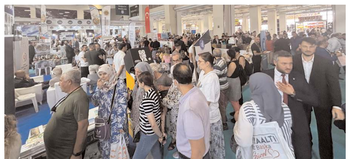
Çorum Belediyesi 13. Yöresel Ürünler Fuarı'nda yerini aldı.