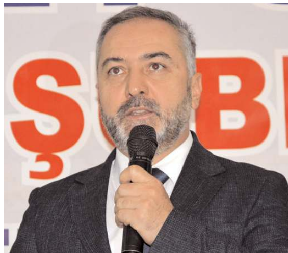
İl Müftüsü Şahin Yıldırım