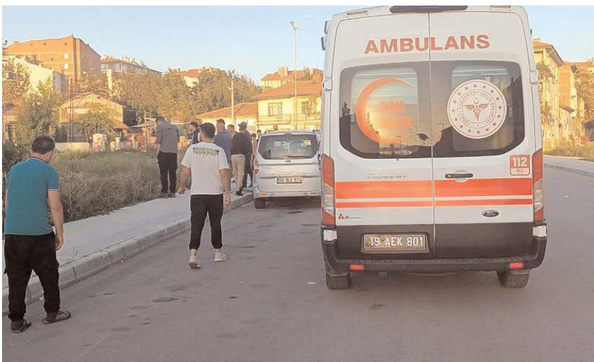
Kayıplara karışan yakalanması için çalışmalar sürüyor.

Çorum'da cezaevinden yeni tahliye olan şahıs, kendisine geçmiş olsun dileklerini ileten husumetlisi tarafından ayağından vuruldu.