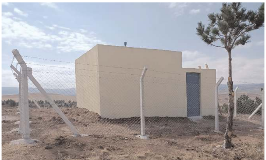
Vatandaşların sağlıklı ve nitelikli içme suyuna kavuşması sağlandığı belirtildi.

İl Özel İdaresi 2024 yılı KÖYDES programı kapsamında Boğazkale İlçesine bağlı Gölpınarlar ve Yanıca köylerine birer adet 30'ar tonluk içme suyu deposu yapıldı.