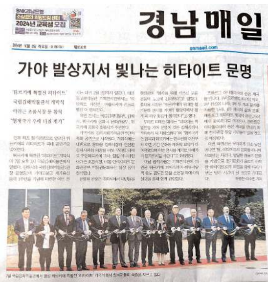
Hitit Özel Sergisi, Kore medyasında da geniş yer buldu.

Güney Kore'de açılan Hitit Özel Sergisi, Kore medyasında da geniş yer buldu.