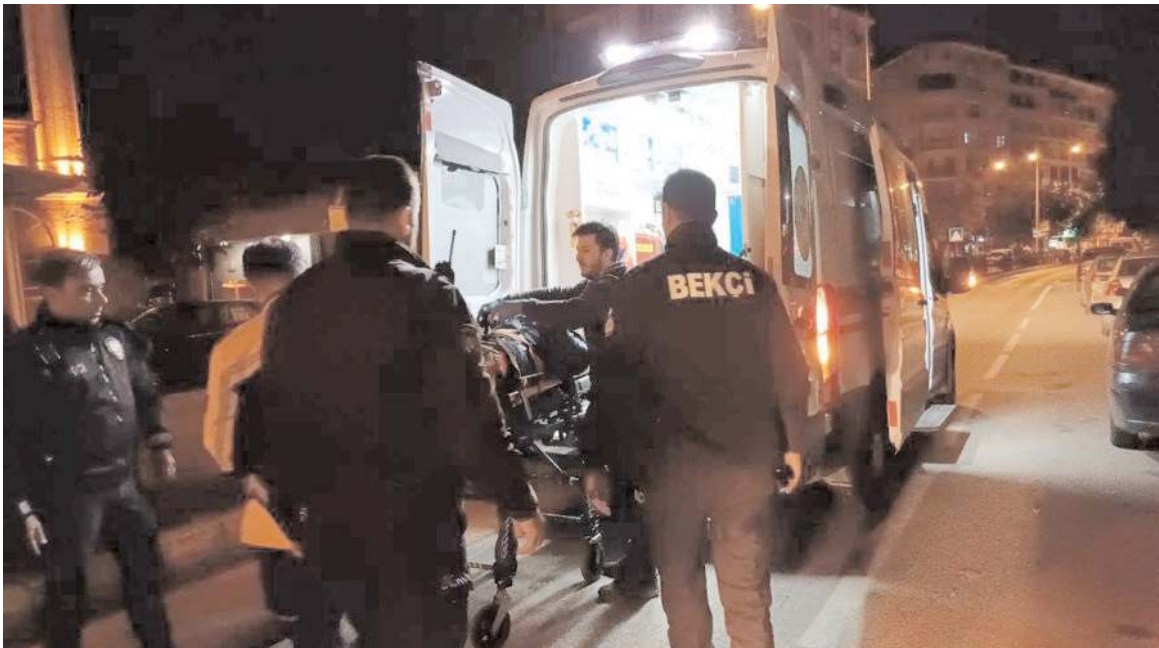
Yaralıya ilk müdahale olay yerinde yapıldı.