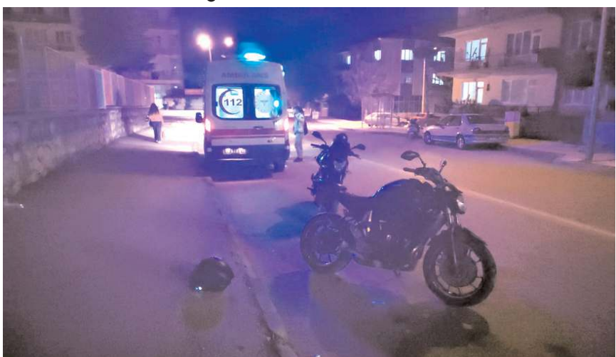
Kaza Kale Mahallesi'nde meydana geldi.

Yaralı motosiklet sürücüsü, sağlık ekiplerince Hitit Üniversitesi Erol Olçok Eğitim ve Araştırma Hastanesi'ne kaldırıldı.(AA)