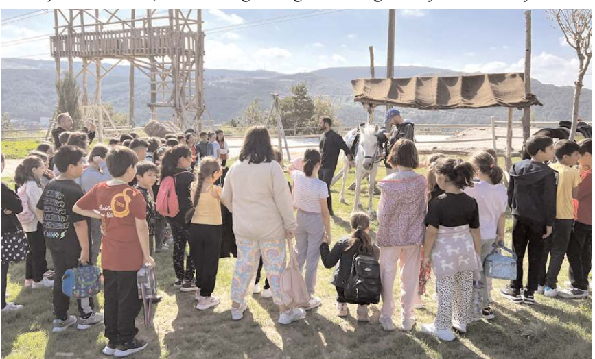
Ata binen öğrenciler keyifli anlar yaşadı.

Çorumlu Oba, okullardan gelen öğrencileri ağırlamaya devam ediyor.