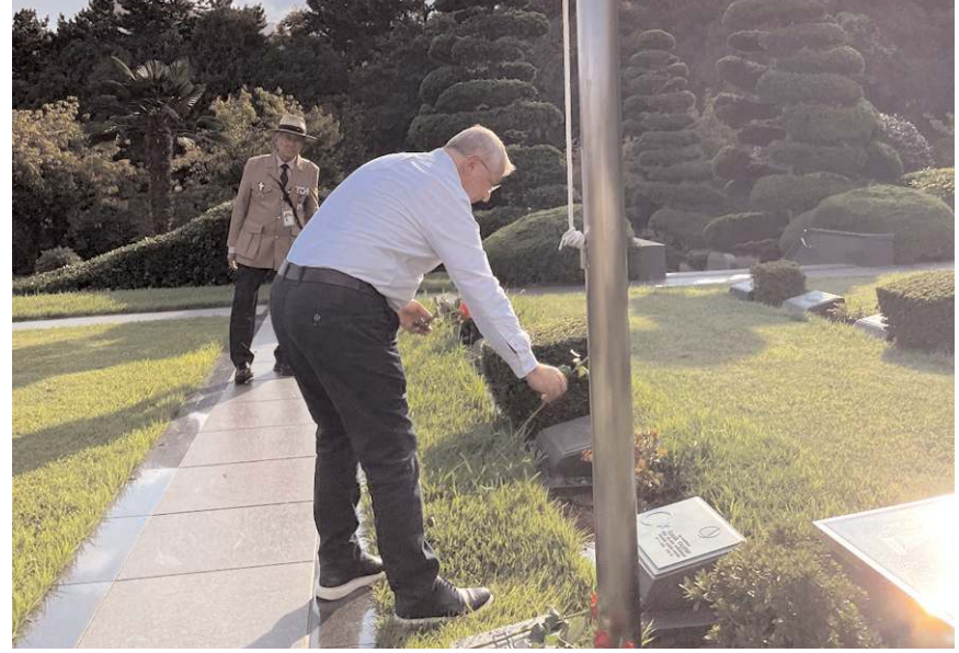
Belediye Başkanı Halil İbrahim Aşgın, mezarlara gül bıraktı.