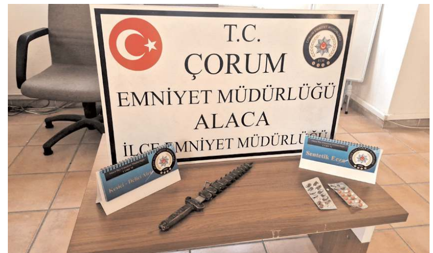
Aramada 12 adet uyuşturucu hap ve 1 adet 'sallama' diye tabir edilen kama bıçak ele geçirildi.

Edinilen bilgilere göre, İlçe Emniyet Müdürlüğü Suç Önleme ve TEM Büro ekiplerince yapılan çalışma çerçevesinde H.Ö yönetimindeki araç, şüpheli üzerine durduruldu. Polis ekiplerinin araçta yaptığı aramada 12 adet uyuşturucu hap ve 1 adet 'sallama' diye tabir edilen kama bıçak ele geçirildi. Araç sürücüsü ve yanında bulunan B.Ö. ve R.Ş. ekipler tarafından gözaltına