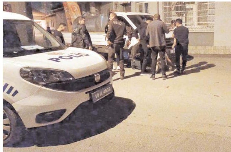
Açılan ateş sonucu S.D. isimli şahıs yaralandı.

Çorum'da bir iş yerine ateş açıldı. Olayda 1 kişi yaralanırken, park halindeki araçta zarar gördü.