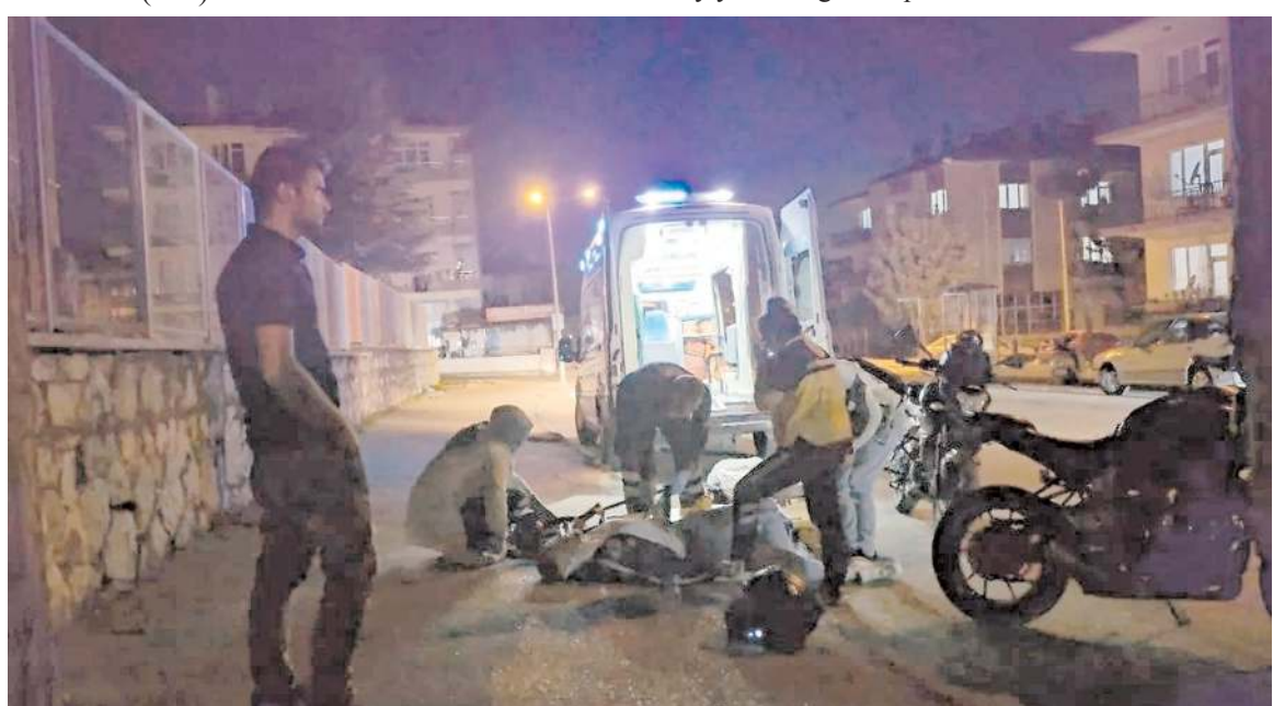
Yaralı sürücü ilk müdahalenin ardından hastaneye kaldırıldı.