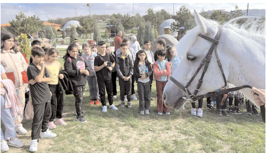
Çorumlu Oba, okullardan gelen öğrencileri ağırlamaya devam ediyor.