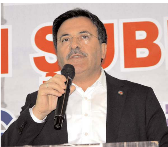
Diyanet Sen Genel Başkanı Ali Yıldız