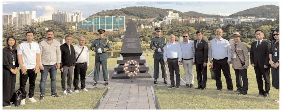
Çorum heyeti, Birleşmiş Milletler Anıt Mezarlığı içerisindeki Busan Türk Şehitliği'ni ziyaret etti.

Öğrenciler Çorumlu Oba'sını çok beğendiklerini ve atla gezmenin kendilerini çok mutlu ettiğini söyledi. (Haber Merkezi)