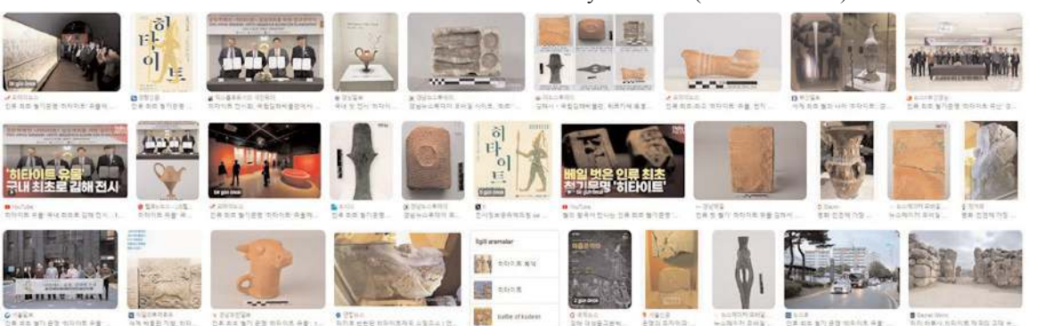
Kore halkı tarafından ilgiyle takip edilen sergiye Kore medyası da geniş yer verdi.

Gimhae Şehri, Türkiye'nin Çorum şehrinde Hitit kalıntılarının getirilmesini onaylamasıyla, Çorum şehri ile olan dostluğunu kardeş şehre yükseltti" ifadelerine yer verildi. (Haber Merkezi)