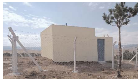
Vatandaşların sağlıklı ve nitelikli içme suyunu kavuşması sağlandı belirtildi.

■ Çorum'da polis ekipleri tarafından gerçekleştirilen 'şok uygulamaları'nda 14 kişi yakalandı. * HABERİ 6'DA