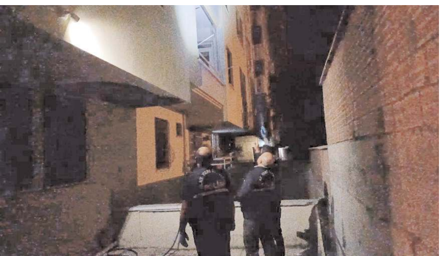
Olayı gören vatandaşlar, 112 Acil Çağrı Merkezi'ni arayarak yardım istedi.