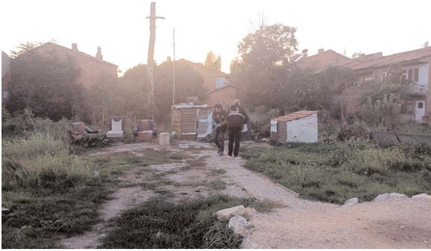
Cezaevinden yeni tahliye olan şahıs, husumetlisi tarafından ayağından vuruldu.