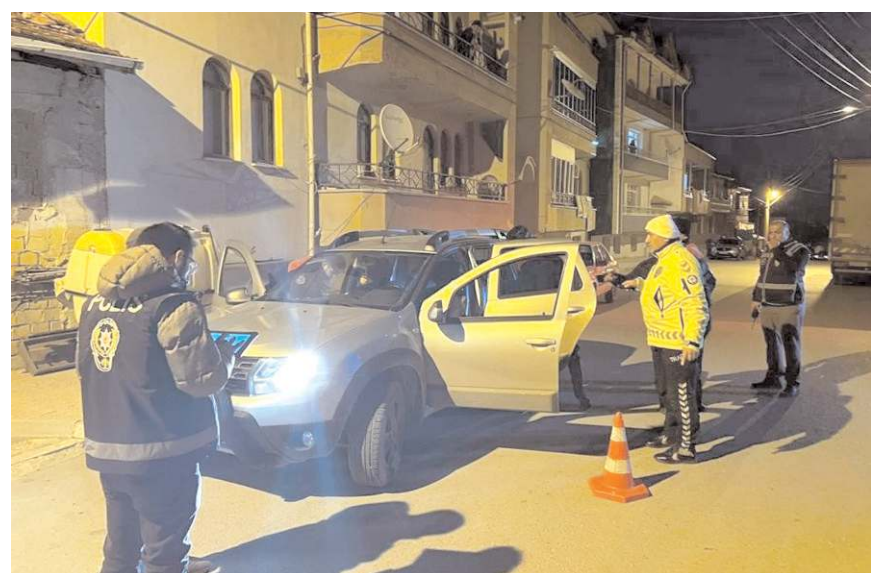
Şok uygulamalarda haklarında yakalama kararı bulunan 14 kişi yakalandı.

Ekipler tarafından bin 140 araç kontrol edilirken, 11 araca toplamda 177 bin 430 TL para cezası uygulandı. Ayrıca 1 araç trafikten men edildi. (İHA)