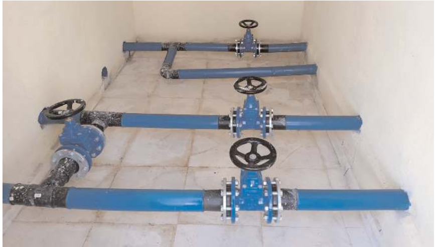
Gölpınarlar ve Yanıca köylerine birer adet 30'ar tonluk içme suyu deposu yapıldı.