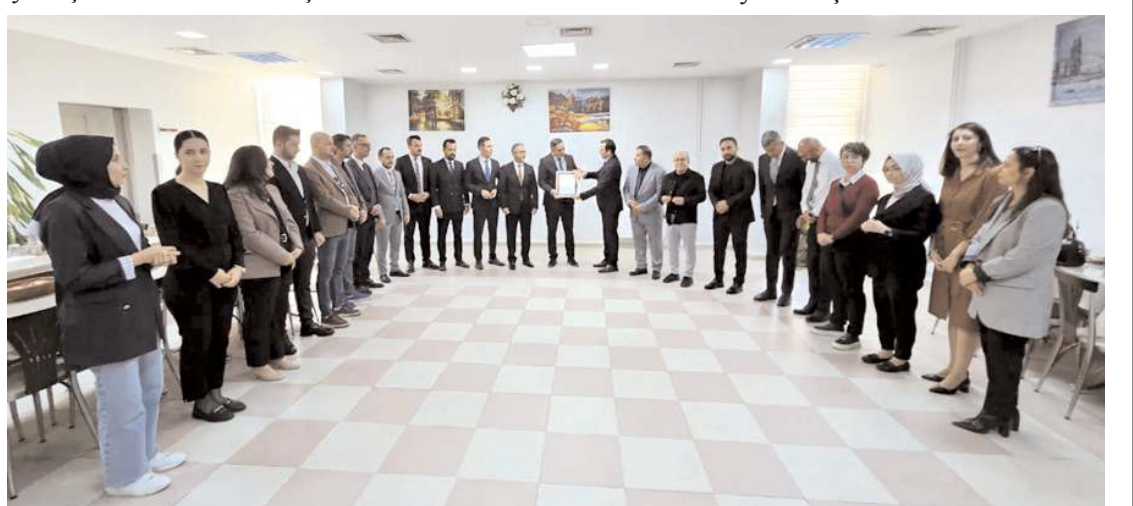
Kalıpcı, avukatlık mesleğinin saygınlığını ve hukukun üstünlüğünü savunmaya devam edeceklerini söyledi.