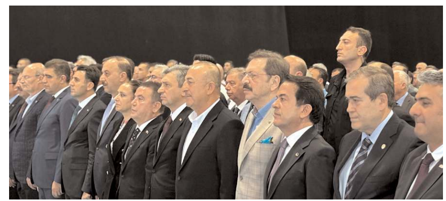
Açılışa çok sayıda protokol katıldı.

İskilip dolması, leblebi, kadın el emeği ürünleri ve Veli-paşa Kahvecisi ürünlerinin yer aldığı Çorum standı fuar süresince ziyarete açık olacak. (Haber Merkezi)