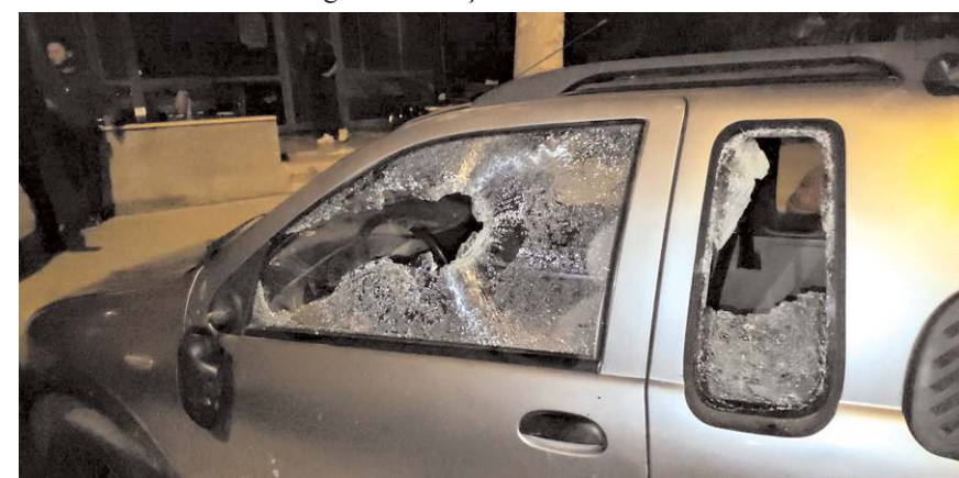
İşletme sahibi şahıslardan şikayetçi olmadı.