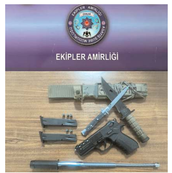
Şok uygulamalarda çok sayıda suç aleti ele geçirildi.