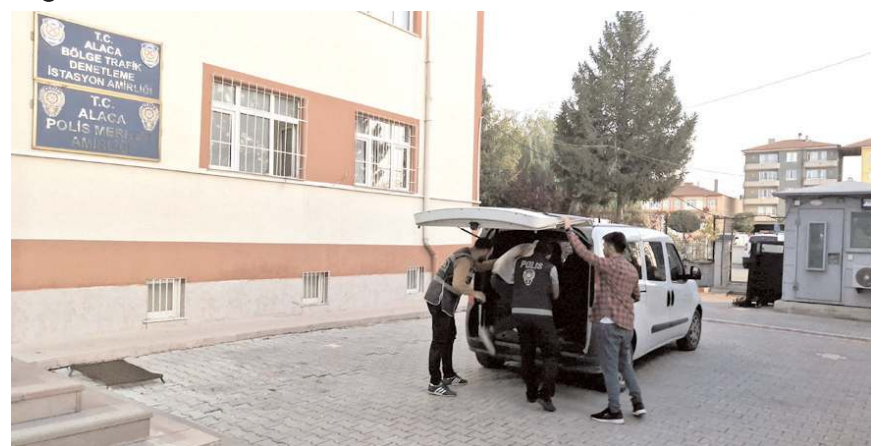
Alaca'da parkta bulunduğu kişiyi silahla yaralayan şüpheli tutuklandı.

Yaralanan Fatih Han Y. ise kendi imkanlarıyla gittiği hastanede tedavi altına alınmıştı.(AA)