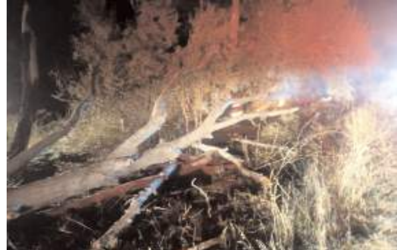
Alaca'da meydana gelen anın yangınında ağaçlık alan zarar gördü.

Yanan ağaçlara itfaiye ekipleri müdahale ederek söndürdü, ardından ağaçlar kenara çekilerek köy grup yolu trafiğe açıldı. (İHA)