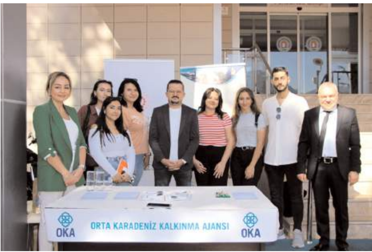
OKA, "1. Kariyer Günleri" programında üniversite öğrencilerine kalkınma ajanslarını tanıttı.