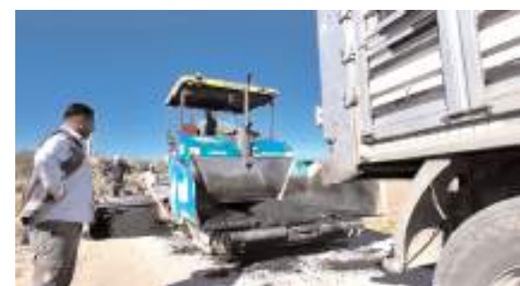
Çorum Belediyesi ilçelere asfalt desteği vermeye devam ediyor.