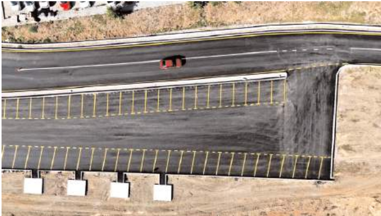
Çalışma ile Sungurlu'nun genel ulaşım kalitesini artırması ve şehir içi trafiğini rahatlatması bekleniyor.

Sungurlu'da Çiftlik Mahallesi'nde devam eden sıcak asfalt çalışmaları tamamlandı.