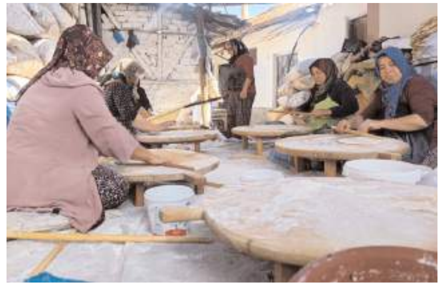
Oğuzlar'da kışlık yufka yapımına başlandı.