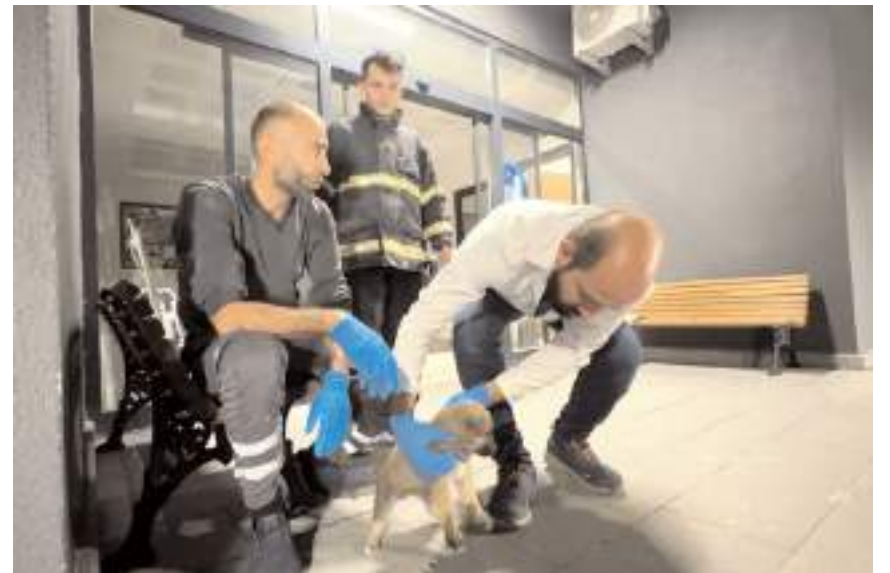
Tedavi altına alınan köpeklerin sağlık durumlarının iyi olduğu belirtildi.