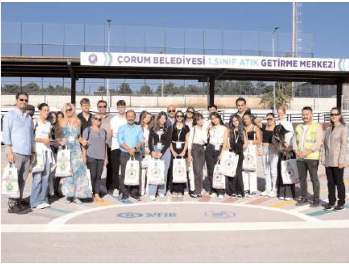
Yurt dışından Çorum'a gelen bir grup öğretmen ve öğrenci, "sıfır atık" çalışmalarını inceledi.