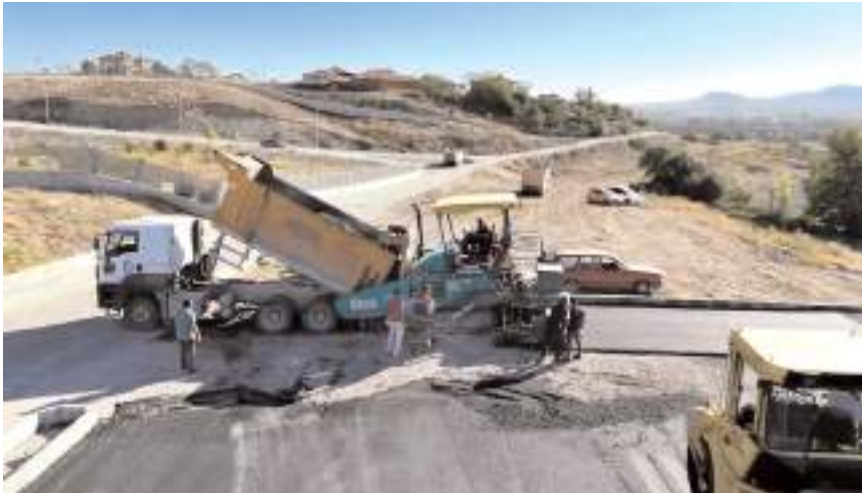
Fen İşleri Müdürlüğü'ne bağlı ekipler ilçelerde de asfalt çalışmalarını gerçekleştiriyor.