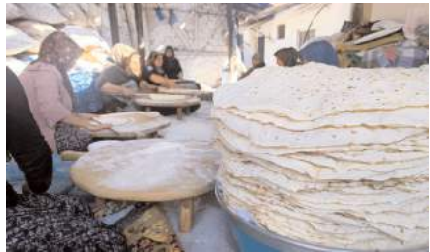
Sakinler, imece usulüyle her gün bir kişi için yufka açarak, birbirlerine yardım ediyor.

Oğuzlar'da kışlık yufka yapımına başlandı.