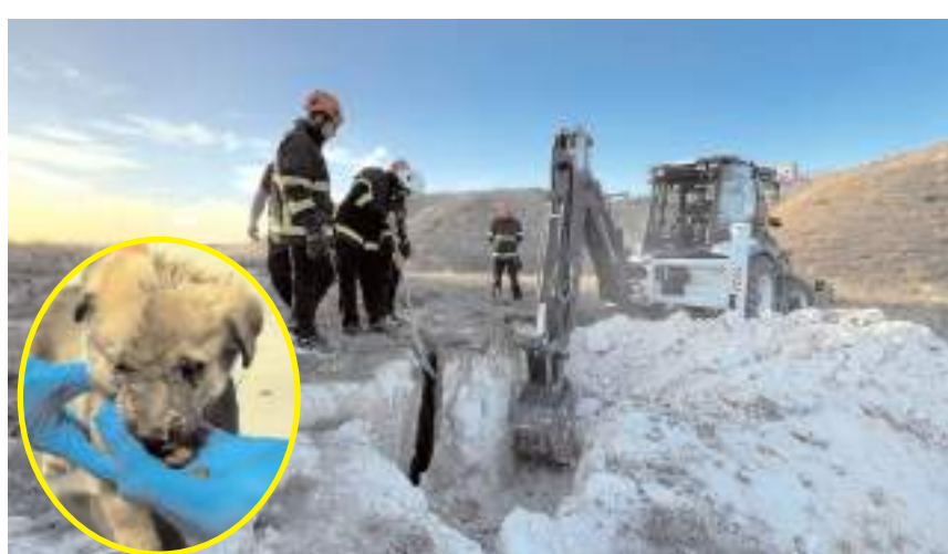
Çorum Belediyesi İtfaiye ekipleri 2 yavru köpeği toprak altından kurtarmayı başardı.

■ Çorum Belediyesi İtfaiye ekipleri saatler süren çalışmanın ardından başarılı bir kurtarma operasyonuna imza attı. Ekipler 2 yavru köpeği toprak altından kurtarmayı başardı. * HABERİ'4'DE