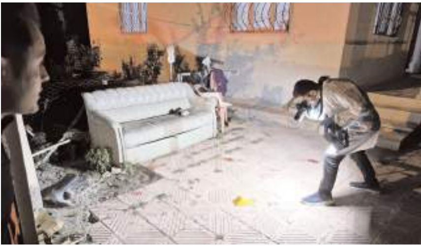
Olay Günhan Mahallesi'nde meydana geldi.

Polis ekipleri kaçan şahıs veya şahısların yakalamak için çalışma başlattı. (İHA)