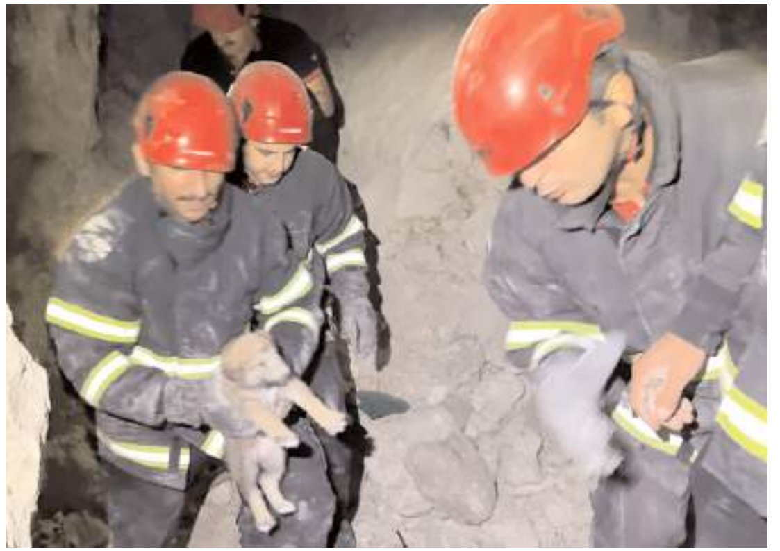
Çorum Belediyesi İtfaiye ekipleri 2 yavru köpeği toprak altından kurtarmayı başardı.