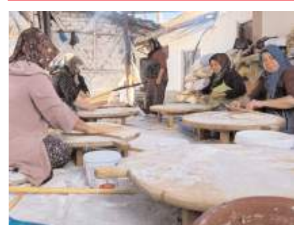
Oğuzlar'da kışık yufka yapımına başlandı.