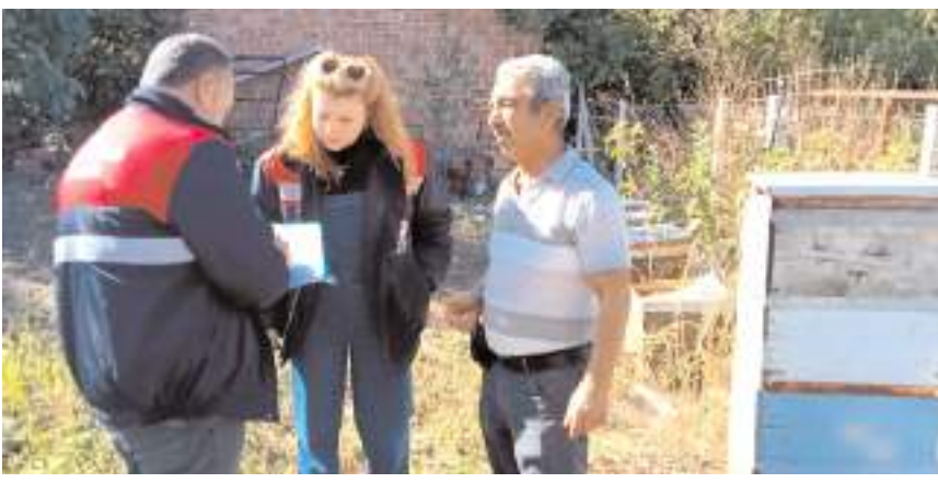
Arılı Kovan Destekleme tespit çalışmaları hız kesmeden devam ediyor.