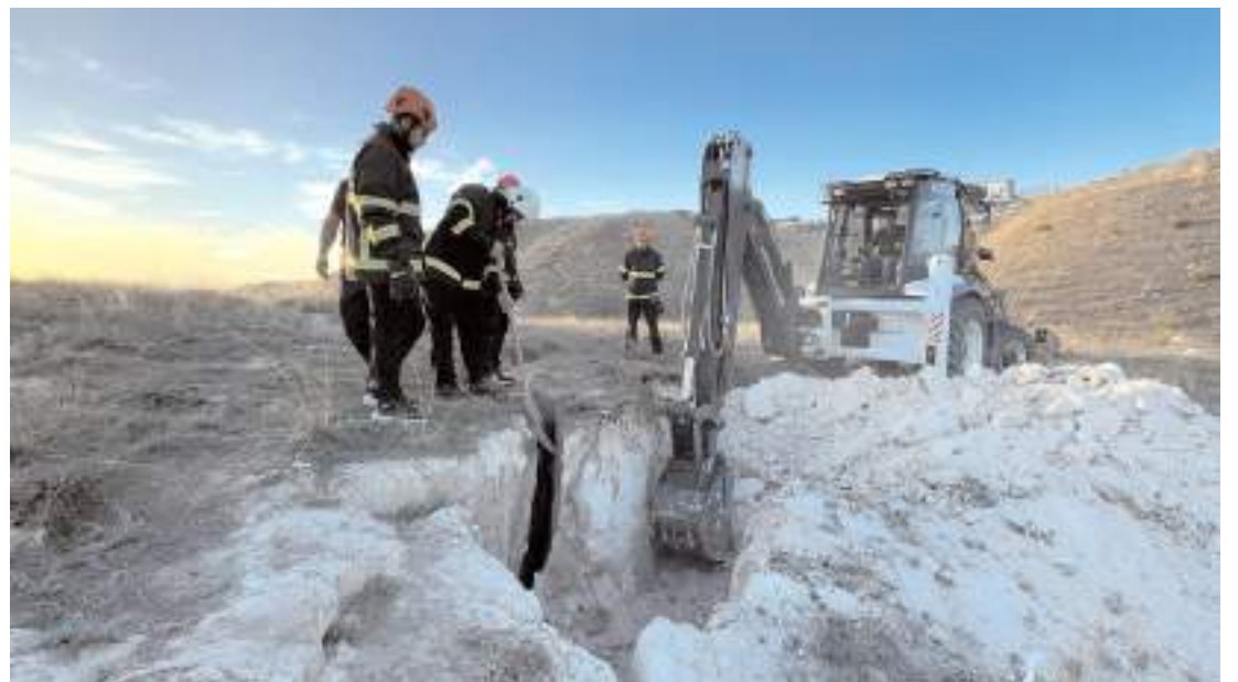
3 saatlik titiz çalışmanın ardından yavru köpekler mahsur kaldıkları yerden kurtarıldı.