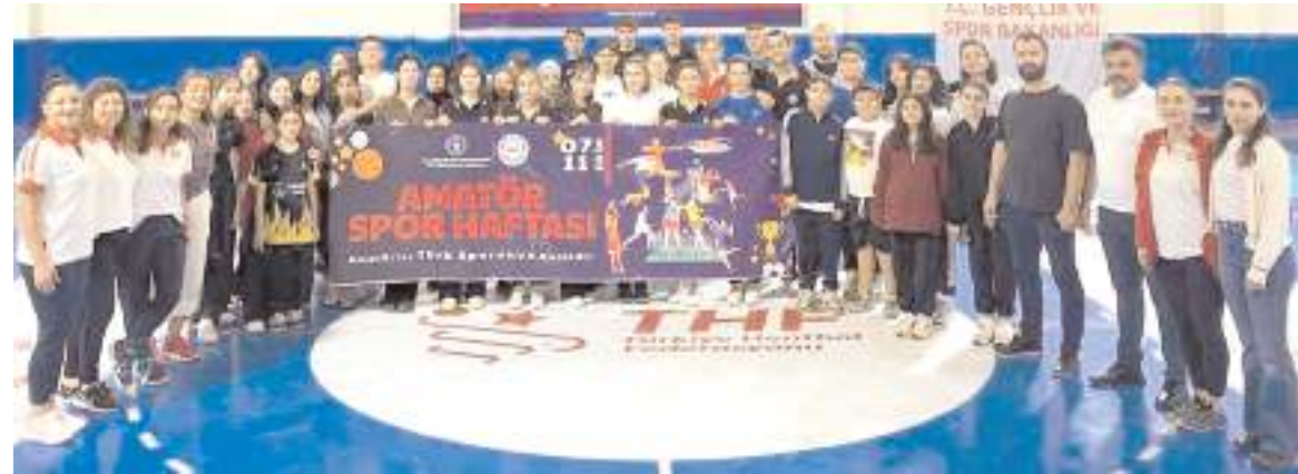
Amatör Spor Haftası Curling turnuvasında mücadele eden sporcular ve hakemler ödül töreni sonrası toplu halde

men Atatürk İmam Hatip Ortaokulu ise dördüncü oldu. Erkeklerde ise birincilik kürsüsüne Necip Fazıl Kısakürek Ortaokulu A takımı çıkarken, T.O.B.B Anadolu Lisesi ikinci, Necip Fazıl Kısakürek Ortaokulu C takımı üçüncü, Gazipaşa Ortaokulu dördüncülüğü elde etti. Karma kategorisinde ise Güzel Sanatlar Lisesi B takımı birinci, Gazipaşa Ortaokulu ikinci, Güzel Sanatlar Lisesi A takımı ise üçüncü olarak tamamladı. Müsabakalar sonunda düzenlenen törenle dereceye giren takım sporcularına başarı belgesi verildi.