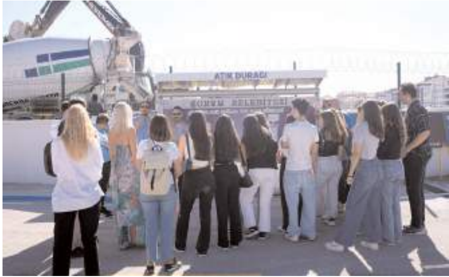
Heyete çalışmalarla ilgili bilgi verildi.