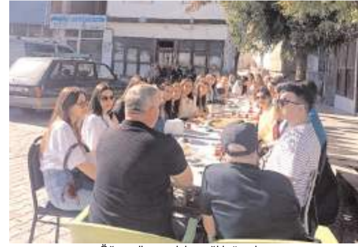
Öğrenciler cevizin sağlık üzerine faydaları konusunda çalışma yaptı.

Hantal, Hitit Üniversitesi Beslenme ve Diyetetik Kulübüne ziyaretlerinden dolayı teşekkür etti.(AA)