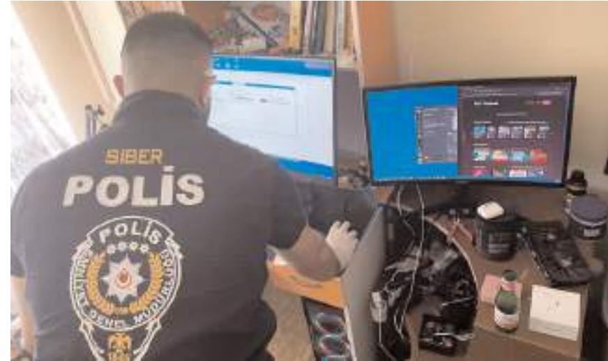
95 adrese yapılan eş zamanlı operasyonda 76 şüpheli yakalanarak gözaltına alındı.

Yaklaşık 16 ay süren teknik ve fiziki takip sonrasında şüphelilere yönelik "suç işlemek amacıyla örgüt kurma ve nitelikli dolandırıcılık" suçundan Diyarbakır başta olmak üzere İstanbul, Adana, Karabük, Antalya, Muğla, Çorum, Ankara, Yalova, Kocaeli, Şırnak, Kırklareli, Batman, Samsun, Mersin, Hatay, Ordu, İzmir ve Van illerinde toplam 95 adreste eş zamanlı operasyon düzenleyen polis, 92 şüpheliden 76'sını yakalayarak gözaltına aldı. 8 şüphelinin yurt dışında olduğunu belirleyen polis ekipleri, 8 firari şahsın da yakalanması için çalışmalarına devam ediyor.