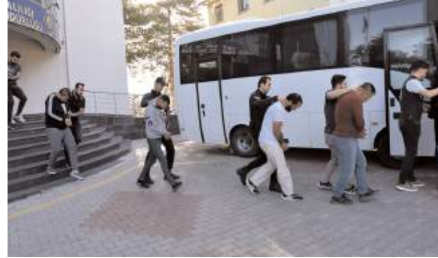
Aralarında Çorum'un da bulunduğu 19 ilde operasyon yapıldı.

Edinilen bilgiye göre, dolandırıcılar Nevşehir'de ikamet eden bir vatandaşın telefonuna Whatsapp'tan Endonezya kayıtlı +62 numara üzerinden "Görev tamamlayarak para kazanmak ister misin?" şeklinde mesaj göndererek, Google Haritalar uygulamasında bulunan işletmelere yorum yapması karşılığında 50 TL verileceği vaadinde bulundu. Dolandırıcılar, verilen ilk görevleri yapan şahsın hesabına para yatırarak güven sağladı. Şahsın kazanç sağlamaya devam edebilmesi için kendisinin VIP gruba geçmesi gerektiği, bunun için de para yatırması gerektiği söylendi. Üyeligi kabul eden şahıs, farklı banka hesaplarına toplam 259 bin 800 TL yatırdı. Dolandırıcıların para taleplerinin devam etmesi üzerine dolandırıldığını anlayan vatandaş, Nevşehir İl Emniyet Müdürlüğüne başvurdu. Nevşehir Emniyet Müdürlüğü Siber Suçlarla Mücadele Şube Müdürlüğü ekipleri, şüphelilerin tespiti için başlattığı çalışmalarda mağdurun farklı bankalara gönderdiği paraları takibe aldı. Yatırılan paraların kripto borsalarına gönderildiği, paranın takibine devam edildiğinde paranın soğuk cüzdana transfer edildiği tespit edildi. Çete liderinin ise Diyarbakır'da berberlik yaptığı belirlendi. Siber Suçlarla Mücadele Şube Müdürlüğü ekipleri, aynı yöntemle il genelinde 12 kişinin daha dolandırıldığını ve toplamda 13 kişinin göndermiş olduğu toplam 811 bin TL'nin aynı soğuk cüzdana aktarıldığını belirledi.