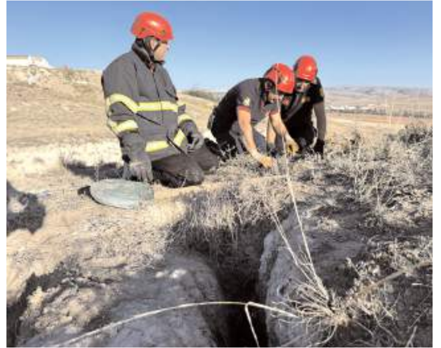
Yerin 2 metre altında olduğu tespit edilen köpekler için keçeden yardım istendi.