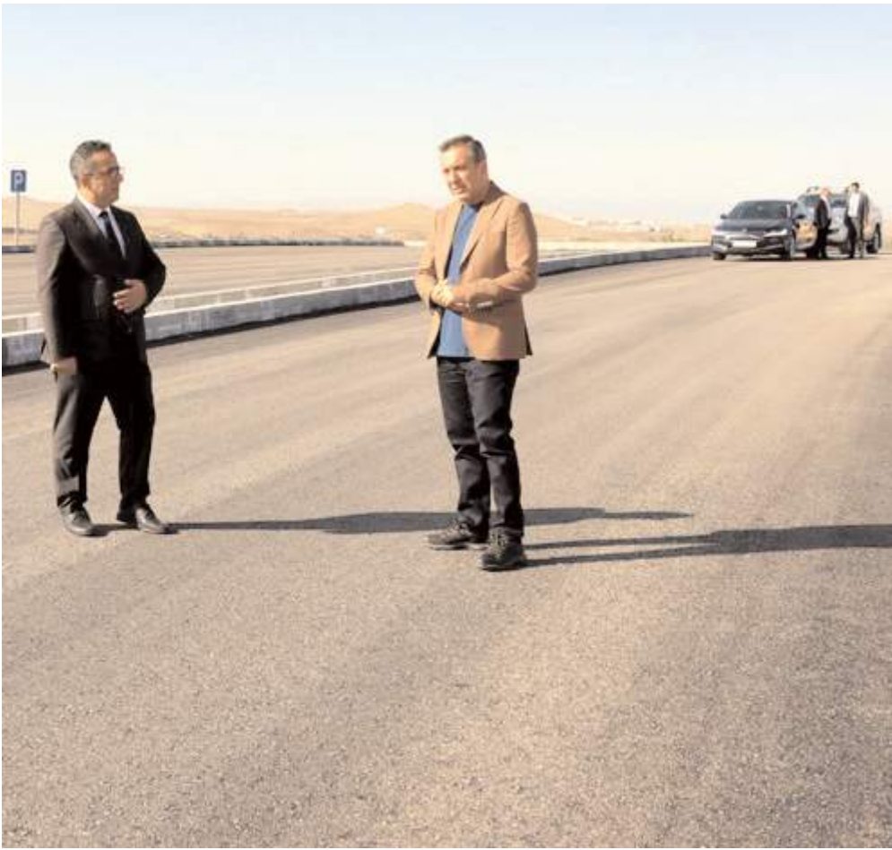
Belediye Başkanı Muhsin Dere, çalışmaları yerinde inceledi.