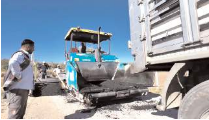
Çorum Belediyesi ilçelere asfalt desteği vermeye devam ediyor.