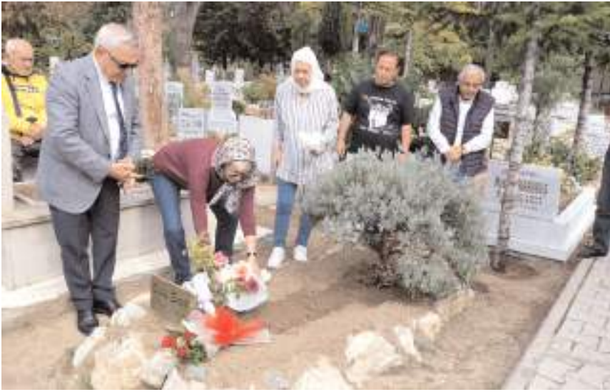
Ertek'in eşi ve dostları tarafından kabre çiçek bırakıldı.