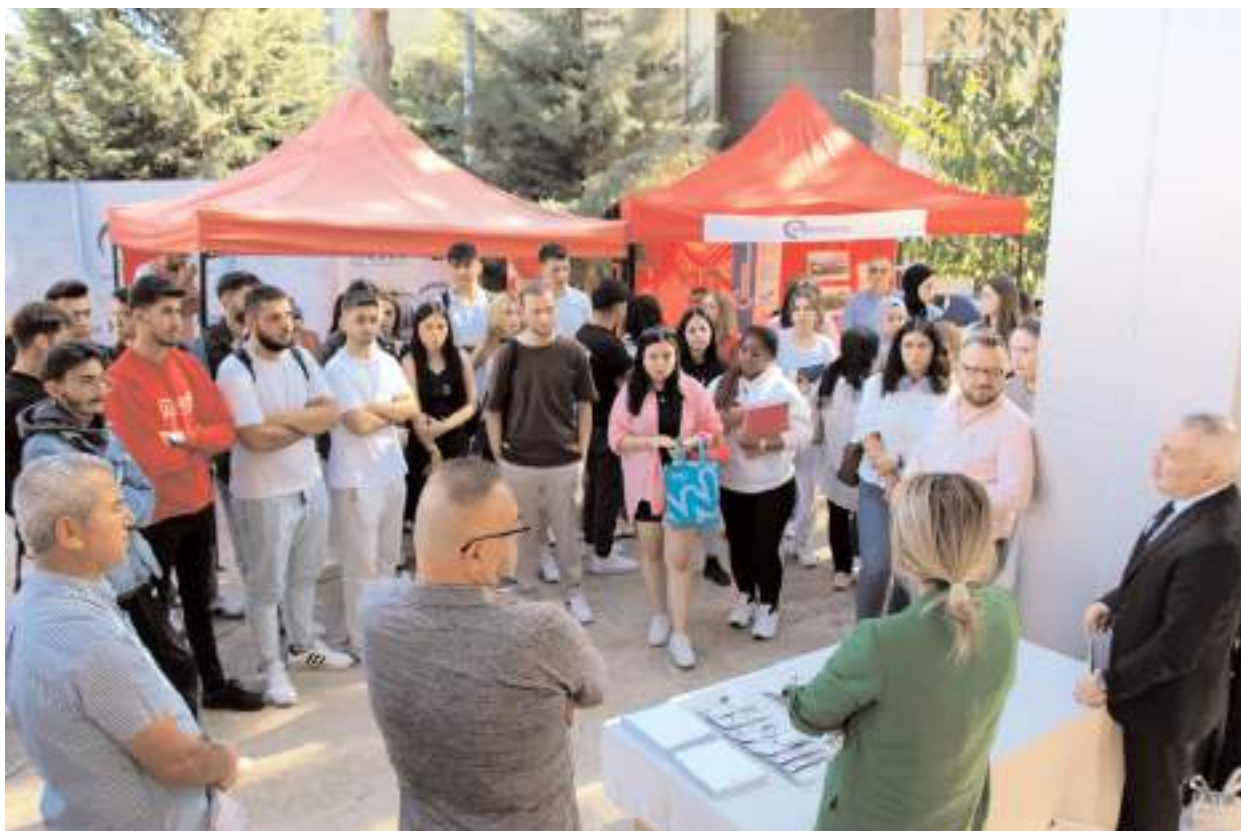
Programda öğrencilere ajansın çalışmalarını ve yürüttüğü projeleri ile personel alım süreci hakkında bilgi verildi.