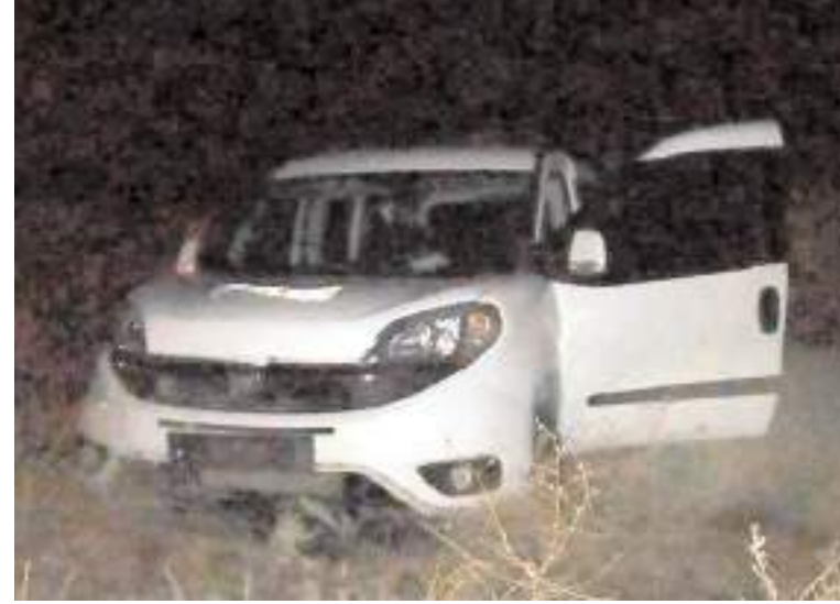
Yaralı sürücü hastaneye kaldırıldı.

Çorum'da kontrolden çıkan hafif ticari aracın şarampole uçması sonucu meydana gelen kazada sürücü yaralandı.