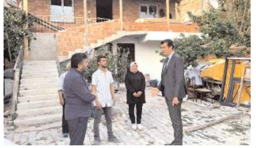
Evleri tamamen yanan aileye yardım seferberliği devam ediyor.

İnşaat sürecinin en kısa sürede tamamlanarak, ailenin yeni meskenine taşınmasının hedeflendiği belirtildi.