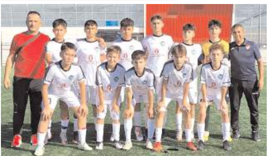
Osmancık Kandiberspor grubunda dördüncü maçında kazanarak liderliğini sürdürdü