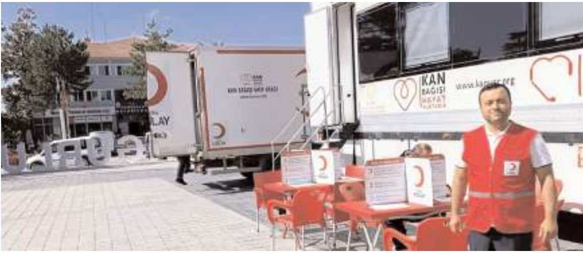
Türk Kızılay'ı Sungurlu'da yeni bir kan bağışi kampanyası başlattı.

Bölgedeki arıcılık faaliyetlerinin desteklenmesi ve kayıt altına alınması amacıyla yapılan bu çalışmalar, arı üreticilerinin sürdürülebilir ve verimli bir şekilde faaliyet göstermelerine katkı sağlamayı hedefliyor.