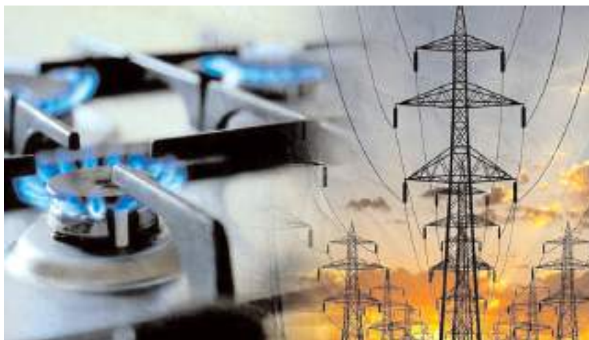
Bakan Bayraktar elektrik ve doğalgaza 3 ay zam yapılmayacağını söyledi.

"Bu yıl sonuna kadar herhangi bir fiyat artışı öngörmüyoruz özellikle bu süreçte" diyen Bakan Bayraktar "Ama yani bu vesileyle de bir