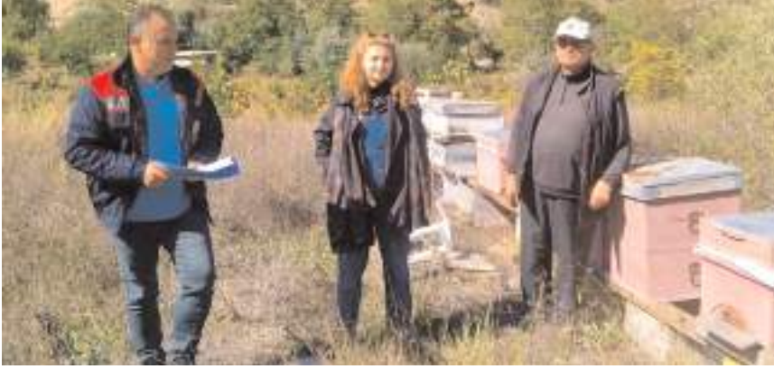
Çalışmalarla, arı üreticilerinin verimli bir şekilde faaliyet göstermelerine katkı sağlanması hedefliyor.