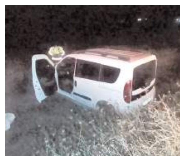
Kaza, Çorum-Laçın karayolunda meydana geldi.