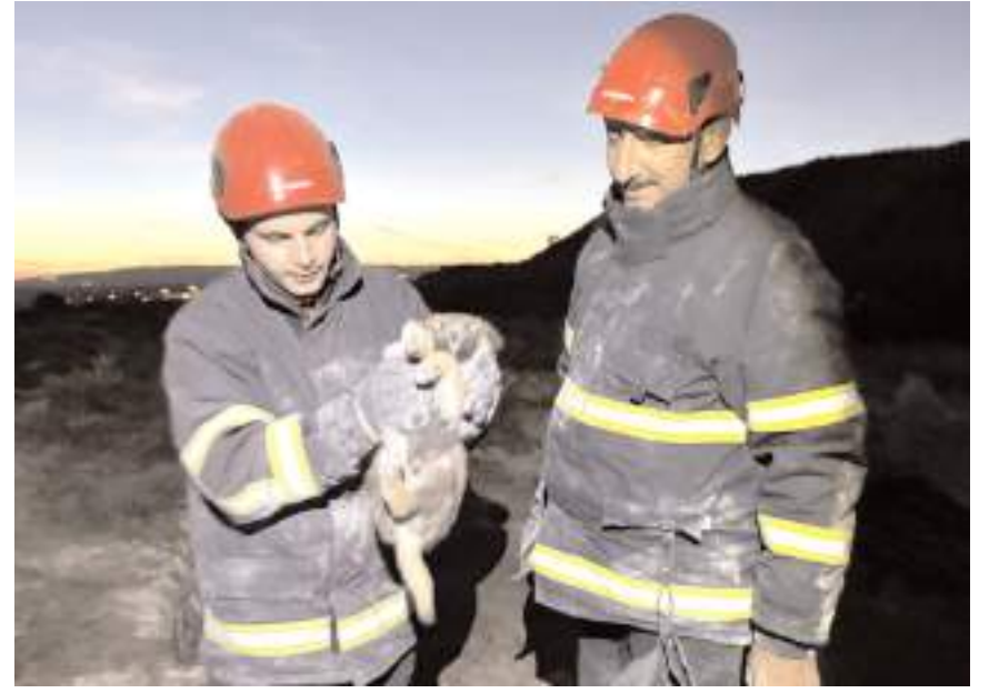
İhbar İtfaiyeye Yaydığın Köyü civarından geldi.

Çorum Belediyesi Basın Yayın ve Halkla İlişkiler Müdürlüğü'nden yapılan açıklamada, Çorum Belediyesi İtfaiye Müdürlüğü ekipleri tarafından 2024 yılı içerisinde 213 hayvan kurtarma çalışması yapıldığı bildirildi. (Haber Merkezi)