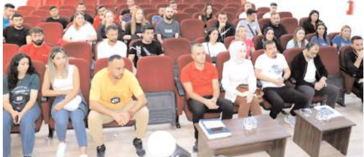
EYT antrenörleri olarak okullarda görev yapan öğretmenler yeni öğretim yılı için değerlendirme yaptılar