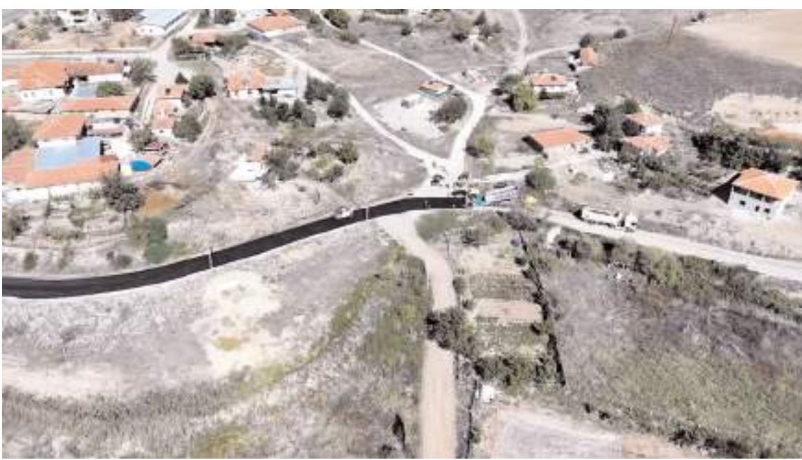
Verilen destekle Sungurlu'da 1200 metrelik yolun asfalt çalışmaları tamamlandı.