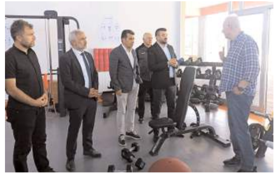
İsmail Dilber Çorum FK tesislerinde kondisyon salonunu inceledi

TÜFAD Genel Başkanı İsmail Dilber daha sonra Ulucami Meydanını ardından da Dünyanın en dar arastasını gezdi ve Velipaşa Konağında yöresel yemekleri tattıktan sonra Çorum'dan ayrıldı. Dilber, Çorum'un tesisleşme konusunda önemli gelişme gösterdiğini takip ettiğini ayrıca alt yapıda güzel işler yapıldığını bildiğini belirterek tüm futbol ailesine bu çalışmalarını nedeni ile tebrik etti ve TÜFAD olarak da ellerinden gelen desteği vermeye devam edeceklerini söyledi.