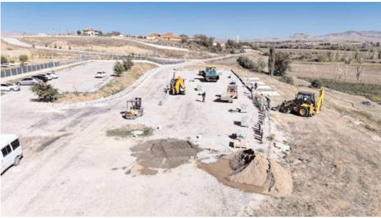
Sungurlu'da Çiftlik Mahallesi'nde devam eden sıcak asfalt çalışmaları tamamlandı.