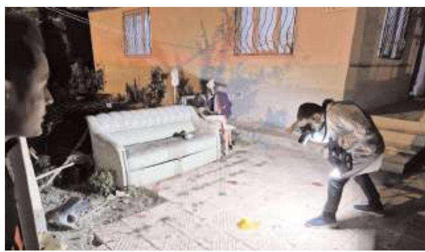
Olay Günhan Mahallesi'nde meydana geldi.