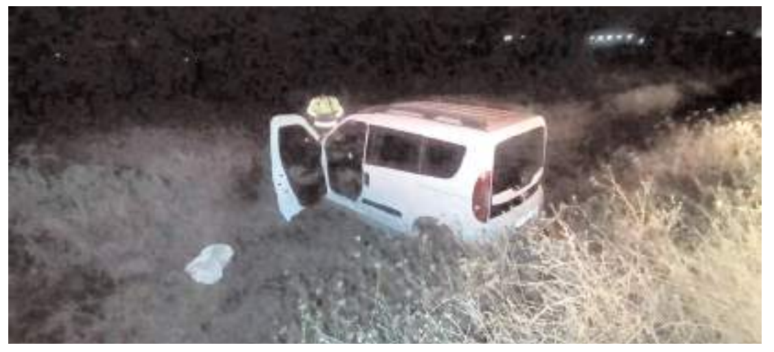
Kaza, Çorum-Laçın karayolunda meydana geldi.