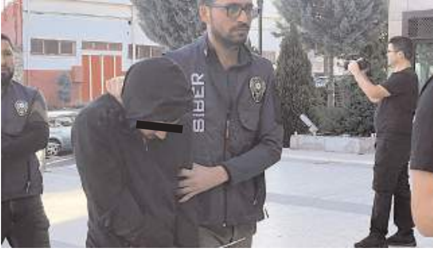
Operasyonlarda 76 şüpheli gözaltına alındı.

Nevşehir Emniyet Müdürlüğü Siber Suçlarla Mücadele Şube Müdürlüğü ekipleri, kentteki bir müşterinin şikayeti üzerine geçtiğimiz günlerde çalışma başlatmıştı. Yurt dışına kayıtlı numara üzerinden mesaj göndererek müşterilere Google haritalar uygulamasında belirtilen şirketlere hesapları, paranın son olarak hiçbir kripto borsasına veya kişiye ait olmayan soğuk cüzdanlara toplenerek nakde dönüştürüldüğü tespit edildi. Çete liderinin Diyarbakır'da berberlik yaptığını belirleyen ekipler, operasyon için düğmeye bastı. Siber Suçlarla Mücadele Şube Müdürlüğü ekipleri, aynı yöntemle il