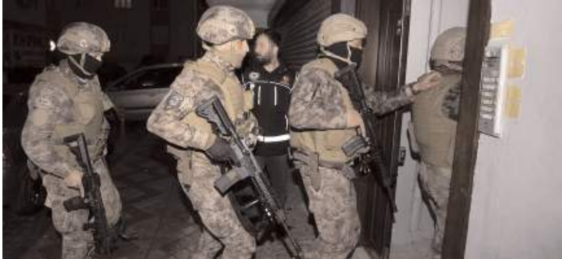
Narkoçelik-43” operasyonlarında 1 ton 392 kilogram uyuşturucu madde ele geçirildi.

sun, Diyarbakır, Mersin, Şanlıurfa, İzmir, Bursa, Ordu, Bitlis, Konya, Manisa, Antalya, Balıkesir, Denizli, Malatya, Sakarya, Tekirdağ, Erzurum, Kahramanmaraş, Afyonkarahisar, Batman, Osmaniye, Siirt, Uşak, Zonguldak, Artvin, Giresun, Sıno, Çorum, Hatay, Kayseri, Muğla, Van, Ağrı, Erzincan, Iğdır, Kırşehir, Muş, Yozgat, Kütahya, Kocaeli, Trabzon, Aksaray, Çankırı, Düzce, Edime, Hakkari, Kırıkkale, Kilis ve Sivas'ta düzenlenen operasyonlar sonucu 1 ton 392 kilogram uyuşturucu madde ile 752 bin 261 uyuşturucu hap ele geçirildi. Ayrıca operasyon sonucu 335 şüpheli yakalandı. (İHA)