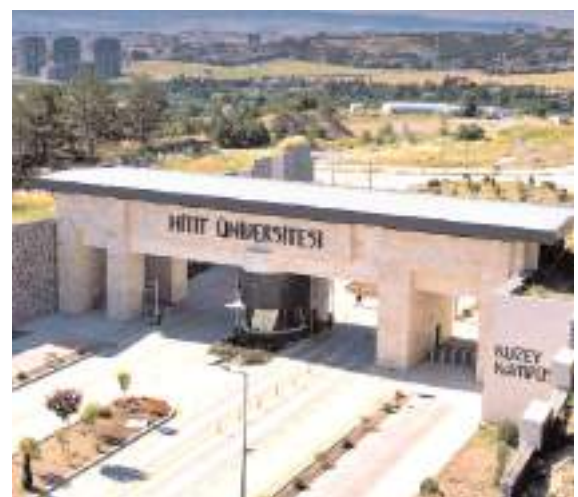
HİTÜ'nün Times Higher Education (THE) 2025 Uluslararası Görünüm Kategorisinde 117 basamak yükseldiği bildirildi.