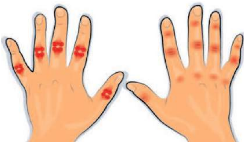
İl Sağlık Müdürlüğü 'Dünya Artrit Günü' nedeniyle açıklama yaptı.

yapın. Sağlıklı vücut ağırlığınızı koruyun. Eklemelerinize aşırı yük binmesini engelleyin. Büyük ve geniş eklemlerinizi kaldıraç olarak kullanın. (örneğin, ağır bir kapıyı açarken basıncı elinize değil omzunuza yönlendirin) Herhangi bir objeyi taşırken ağırlığını birden fazla eklemle yayın (örneğin, alışveriş poşetlerini tek elde değil her iki elinizde hatta buna ilaveten sırtınızda taşıyın). Elinizdekileri çok sıkı kavramayın mümkün olduğunca gevşek tutun. Uzun süre aynı pozisyonda oturmaktan kaçının, belirli aralıklarla mola verin ve hareket edin. Aile hekiminizden ve en yakınınızdaki sağlıklı hayat merkezlerinden danışmanlık alın ve yapılan önerilere uyun. Doktorunuz tarafından reçete edilen ilaçları, belirtilen şekilde ve düzenli olarak kullanın." (Haber Merkezi)