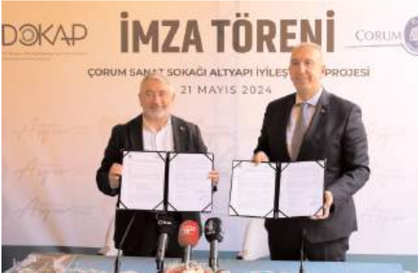
İyileştirme projesinin ihalesi geçtiğimiz günlerde yapılmıştı.