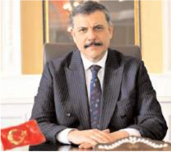
Eski Çorum Valisi Mustafa Çiftçi

Vali Mustafa Çiftçi, "Bir kargo teslimi alakalı adresi güncellemem gerektiğini söylediler. Adresi güncelledim. Ondan sonra da bir ek ödeme talep ettiler. Yalnız ek ödemeyi yaparken sanal kart kullandım. Sanal kartın da limiti çok düşüktü. Oradan çekemediler. Eğer normal kartımı kullanmış olsaydım muhtemelen ki en az 150 bin lira civarında belki para çekebilecektirdi. Yani o sanal kart uygulamasıyla bu işten kurtuldum. En güzeli hiç açmamak. Yani bu olaylara karşı dikkatli ve temkinli olmak" şeklinde konuştu.