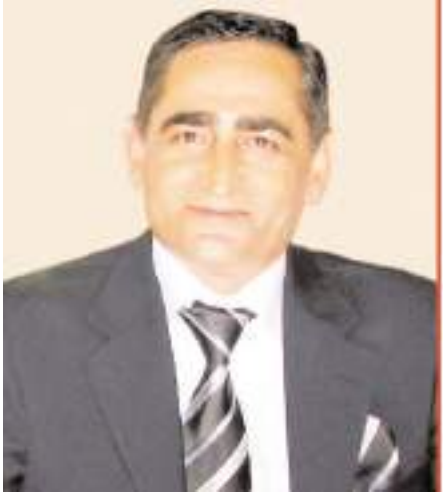
Merhum gazeteci Mustafa Yolyapar bugün kabri başında anılacak.