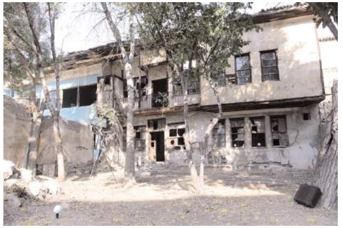
Çorum Belediyesi tarihi İkiz Konak'ı turizme kazandırıyor.

Pazar günü ise sağanak yağış bekleniyor.