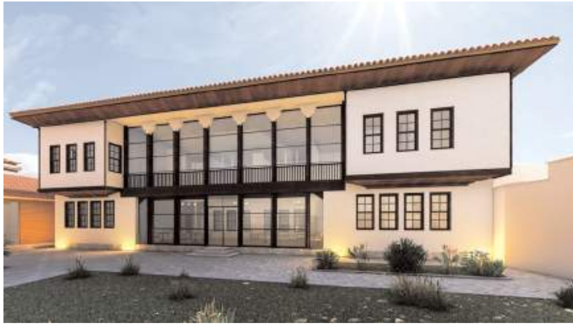
Belediyeye ait olan İkiz Konak'ın restorasyon ihalesi gerçekleştirildi.