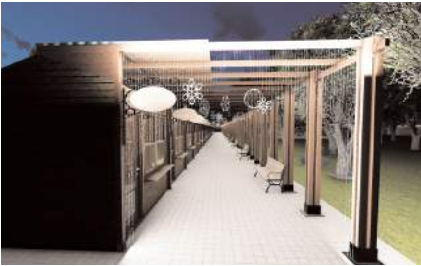
Sanatçılar Sokağı DOKAP desteğiyle yenileniyor.