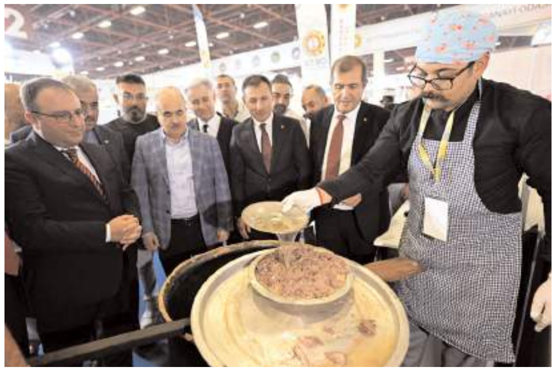
Çorum'un coğrafi işaret tescilli İskilip dolması YÖREX'te katılımcıların beğenisine sunuldu.

Yıllar önce çift sürdük, buğday satarak fabrikalar kurduk. 80 yıl sonra fabrikaları sattık, savaştağı ülkeden buğday almaya başladık, saman almaya başladık. Dışa bağımlı olarak yaşatmaya başladılar bizi. Önce bundan kurtulalım. Ey iktidar, başka ülkeleri düşüne kadar, milletin içtiği içkiyi sigarayı dert ettiğiniz kadar, milletin içemediği çorbayı, yiyemediği eti, yaşayamadığı sosyal hayatı kendinize dert etseydiniz ülkemiz bambaşka bir durumda olurdu." (Haber Merkezi)