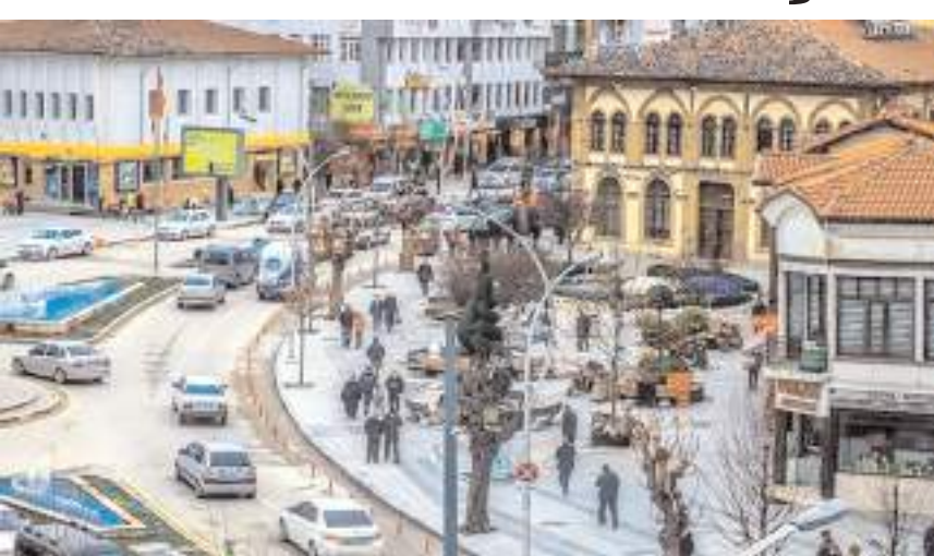
Çorum'da yeni haftada hava sıcaklığı 7 derece birden düşecek.