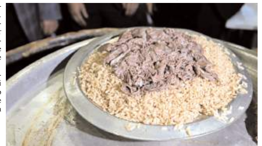
Çorum'da düğünlerin özel yemeği olarak bilinen İskilip dolması, YÖREX'te katılımcılara ikram edildi.