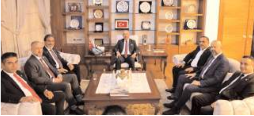
Yeniden Refah Partisi heyeti, Çorum Valisi olarak atanan Ali Çalgan'a hayırlı olsun ziyaretinde bulundu.