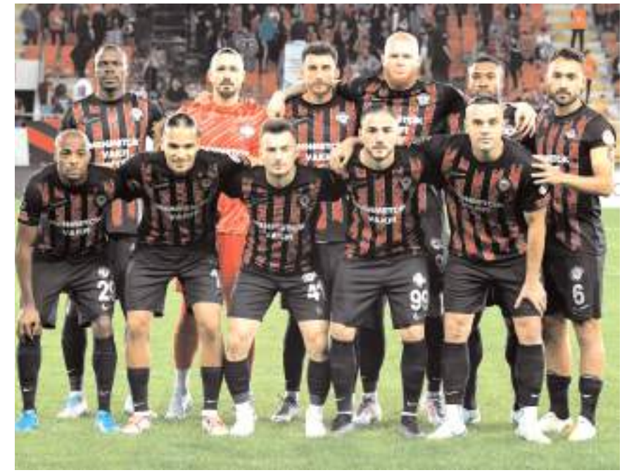
Çorum FK milli ara nedeni ile yarın Tümosan Konyaspor ile hazırlık maçı yapacak