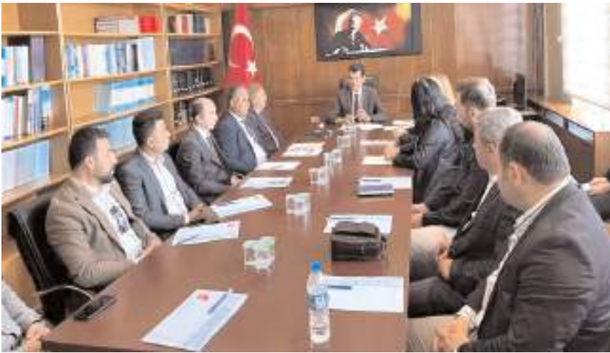
Toplantıda ilçedeki coğrafi işaret potansiyeline sahip ürünler ele alındı.

Projenin detayları ve potansiyel ürünler üzerinde çalışmaların devam ettiği kaydedildi. (İHA)