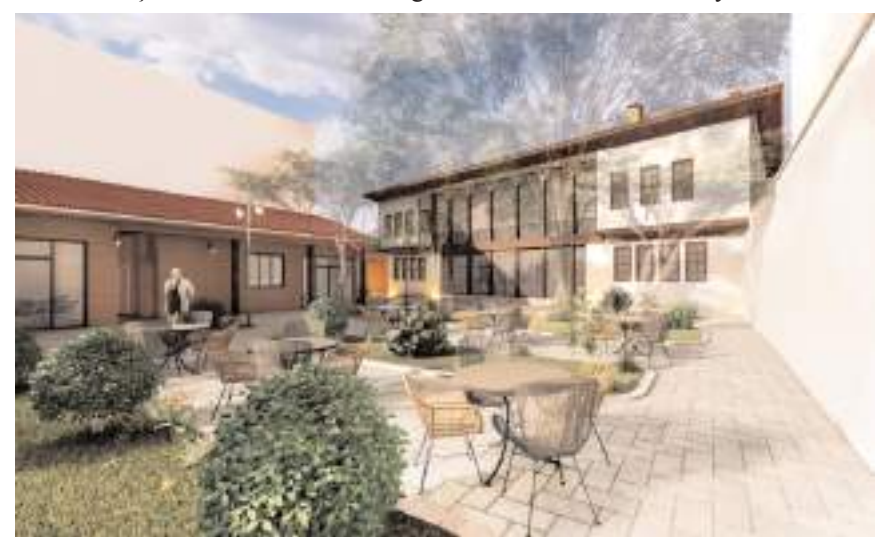
İkiz Konak, butik otel olarak kullanılacak.

Konak'ı şehrimizin geleneksel yapı mimarisine uygun olarak restorasyonunu yaparak butik otel olarak hizmete açacağız. Bu tarihi yapı ile şehrimizin turizmüne ve tanıtımına önemli katkılar sağlamış olacağız." dedi. (Haber Merkezi)