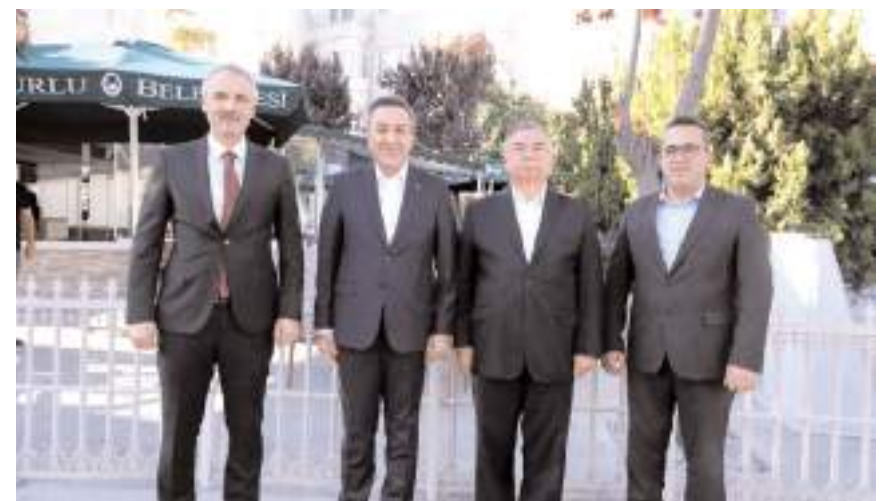
İsmet Yılmaz'a ziyaretinde çeşitli hediyeler takdim edildi.