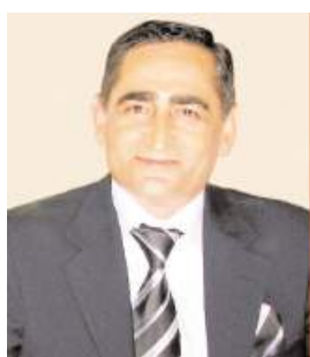
Merhum gazeteci Mustafa Yolyapar bugün kabri başında anılacak.