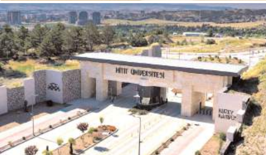
HİTÜ'nün Times Higher Education (THE) 2025 Uluslararası Görünüm Kategorisinde 117 basamak yükseldiği bildirildi.