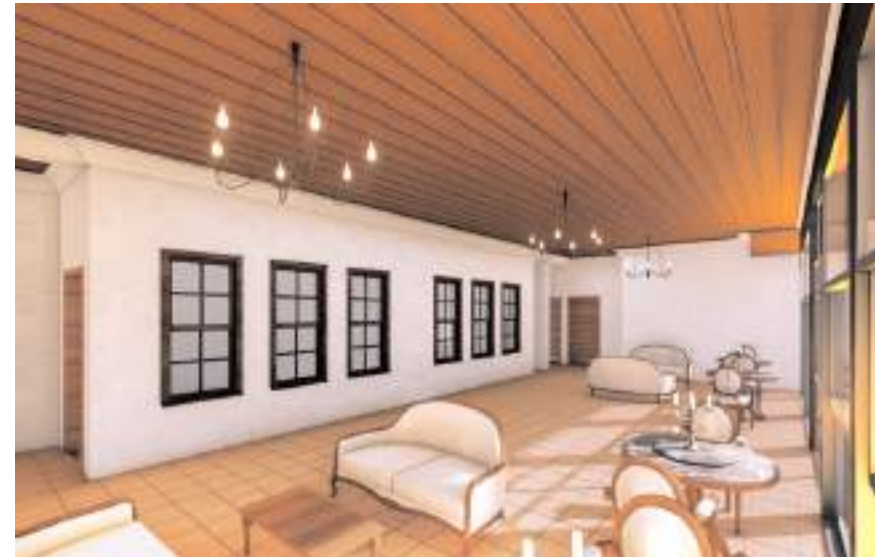
İş tesliminden itibaren 450 günde tamamlanması bekleniyor.