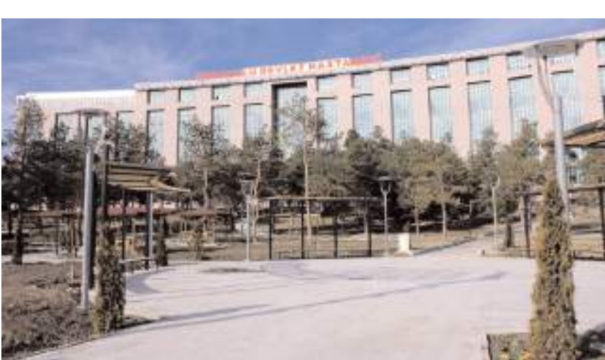
Sungurlu Devlet Hastanesi kantinin çay ocağı 1 yıl süreyle kiraya verilecek.

Çorum İl Sağlık Müdürlüğüne bağlı Sungurlu Devlet Hastanesine tahsisli bulunan taşınmaz üzerindeki 63,00 m 2 'lik kantin-çay ocağı 1 yıl süreli olarak 2886 sayılı Devlet İhale Kanununun 45. Maddesi gereğince açık teklif usulü ile 21.10.2024 Pazartesi günü saat 10.00 da ihale edilecek.