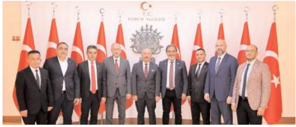
Yeniden Refah Partisi heyeti, Çorum Valisi olarak atanan Ali Çalgan'a hayırlı olsun ziyaretinde bulundu.