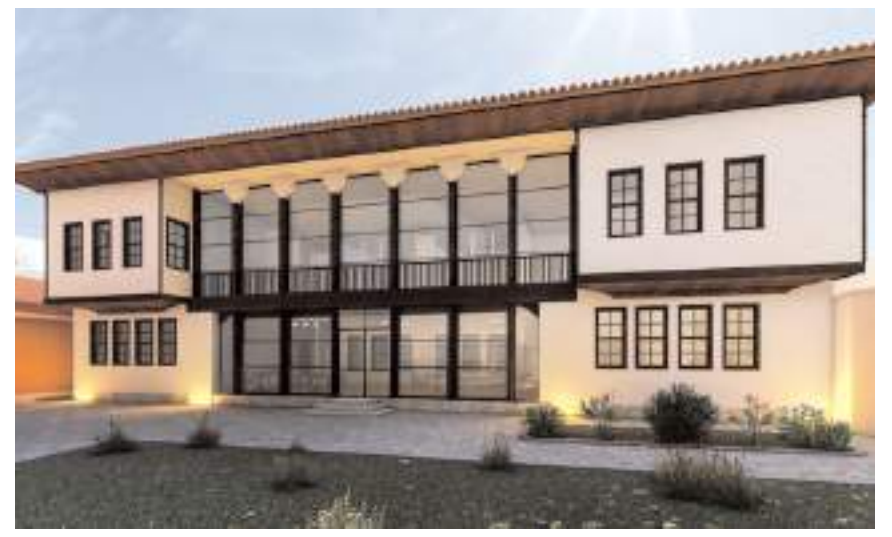
Belediyeye ait olan İkiz Konak'ın restorasyon ihalesi gerçekleştirildi.