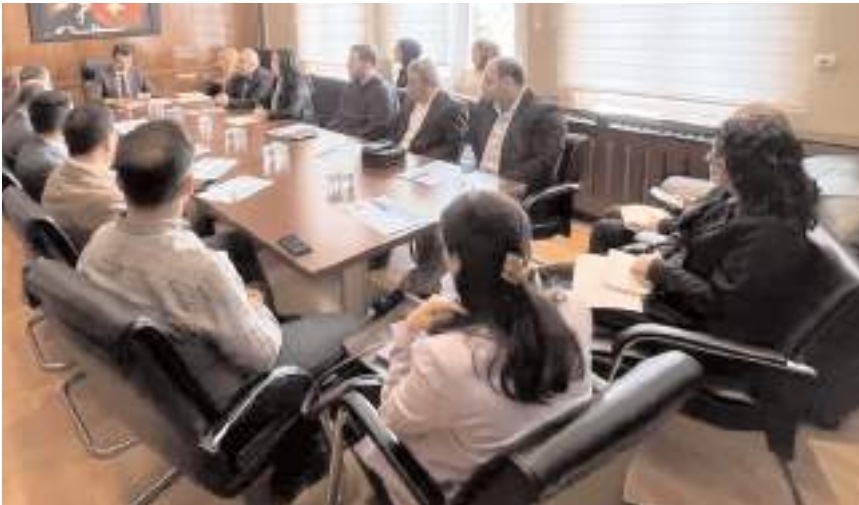
Yerel ürünlerinin coğrafi işaret ile korunması ilçenin gelişmesine katkı sağlayacak.