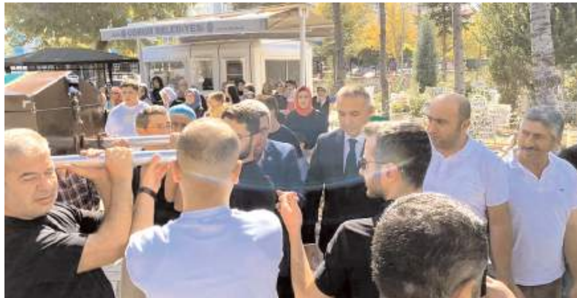
Arda'nın cenazesine yakınları ve CHP Çorum Milletvekili Mehmet Tahtasız katıldı.

rum Milletvekili Mehmet Tahtasız da omuz verirken, ayrıca ailenin acısını paylaştı.