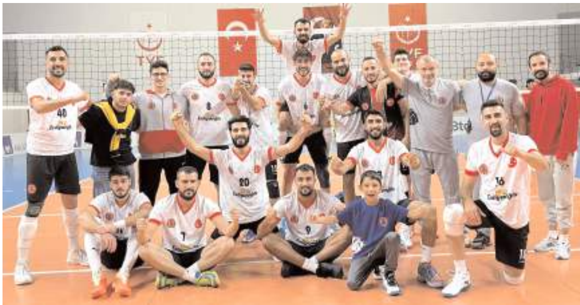
Sungurlu Belediyespor sezonun evindeki ilk maçında Anadolu Şahinspor önünde galibiyeti sürdürmek istiyor