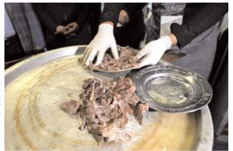
Fuarda 72 kentin yöresel lezzetleri, ürünlerini tanıtıyor.

Çorum'un sınırlarını aşması için dolmayı YÖREX'te tanıttıklarını anlatan Pütün, şunları söyledi: "Çorum'un yöresel yemeği, geçmişi Osmanlı dönemine dayanıyor. Dolma için buhara dayanıklı