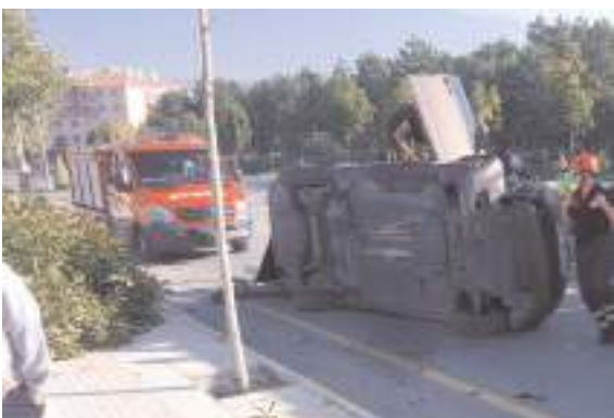
Çorum'da direksiyon hakimiyetini kaybeden sürücü, kaldırımda bulunan ağaca çarparak yan yattı.