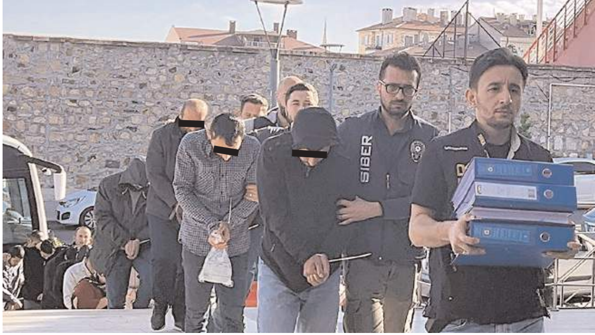
Operasyonda toplam 95 adrese eş zamanlı operasyon düzenlendi.

Antalya, Muğla, Çorum, Ankara, Yalova, Kocaeli, Şırnak, Kırklareli, Batman, Samsun, Mersin, Hatay, Ordu, İzmir ve Van illerinde toplam 95 adrese eş zamanlı operasyon düzenleyen polis, 92 şüpheliden 76'sını yakalayarak gözaltına aldı. Nevşehir Emniyet Müdürlüğü'ndeki işlemleri tamamlanan şüpheliler Nevşehir Adliyesi'ne getirildi. (İHA)