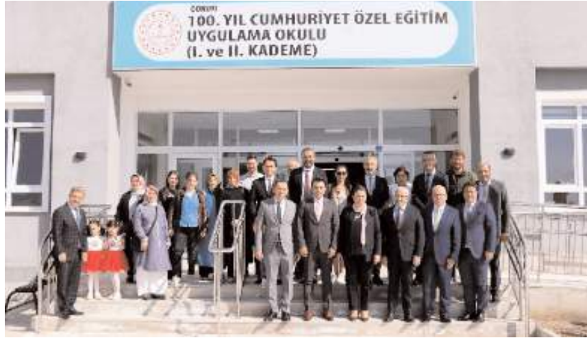
MÜSİAD Çorum Şubesi, 100. Yıl Cumhuriyet Özel Eğitim Uygulama Okuluna dinlenme ve kitap okuma odası yaptırdı.

MÜSİAD Çorum Şubesi tarafından 100. Yıl Cumhuriyet Özel Eğitim Uygulama Okuluna yaptırılan Veli Görüşme ve Kitap Okuma Odasının açılışı gerçekleştirildi.