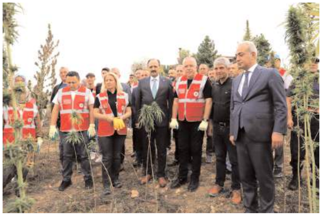
Mecitözü'ne bağlı Pınarbaşı köyünde yaklaşık 30 dönüm alanda ekimi yapılan kenevirlerin hasadı yapıldı.