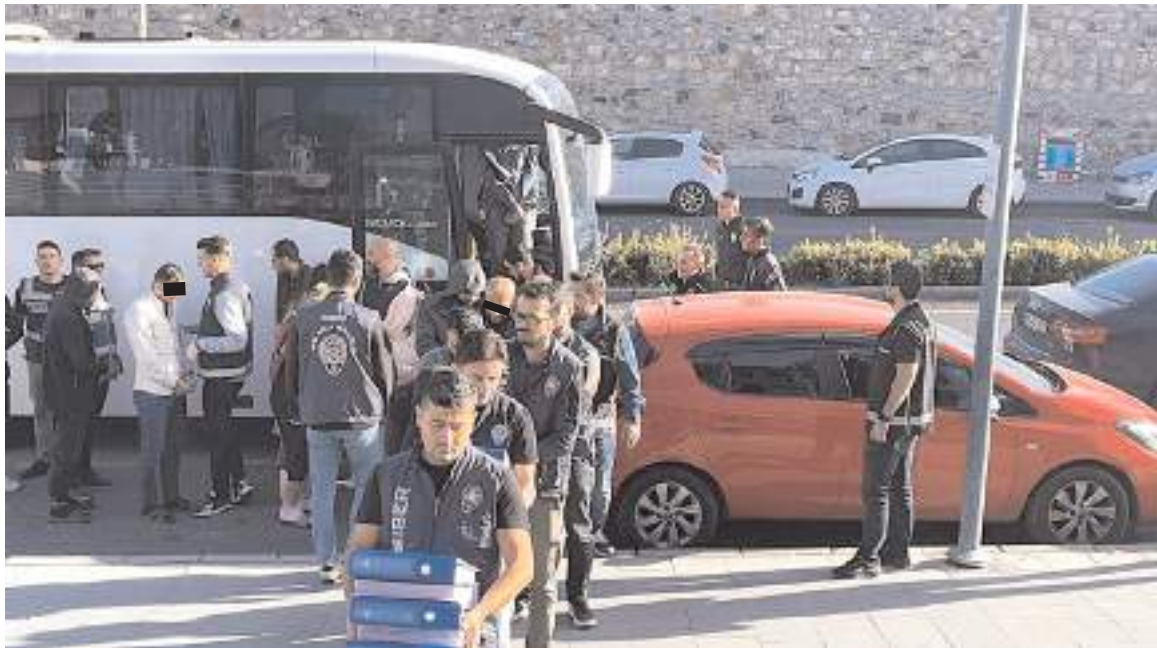
Çorum'un da aralarında bulunduğu 19 ilde operasyon düzenlendi.