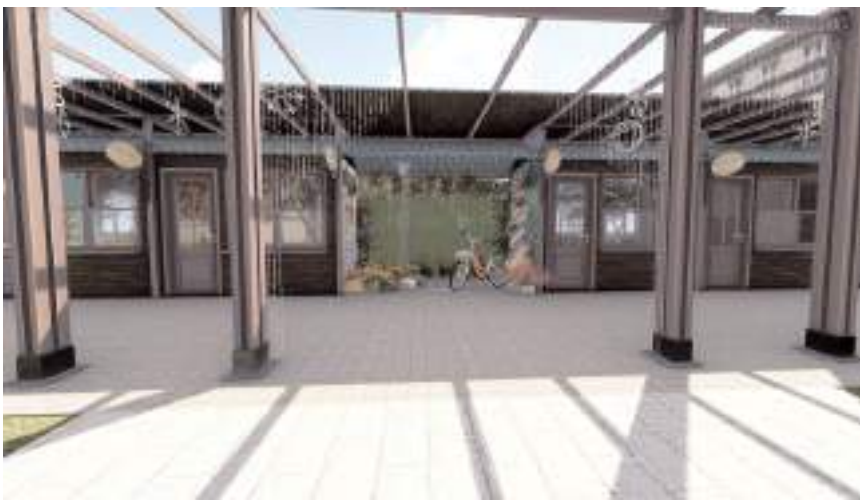
Çalışmalarının ardından sokak daha estetik ve işlevsel bir görünüme kavuşmuş olacak.

Çorum Belediyesi, şehrin el sanatları ürünlerini barındıran Sanatçılar Sokağı'nı DOKAP desteğiyle yeniliyor.