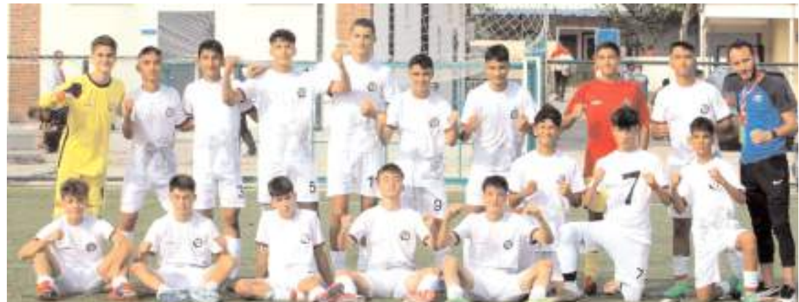
U 15 takımı ilk hafta Boluspor deplasmanında kazandığı maçın ardından yarın sahasında bunu sürdürmek istiyor

Ligde ilk maçında Boluspor deplasmanından 2-1'lik galibiyet ile dönen Çorum FK sezonun evindeki ilk maçında yarın saat 15'de Nazmi Avluca sahasında Etimesgut Belediyespor ile karşılaşacak. Çorum FK evindeki bu maçı kazanarak grupta iddiasını ortaya koymak istiyor. İlk maçında evinde Ankaragücü'ne 5-2 mağlup olan Etimesgut Belediyespor ise ilk puanlarını almak için mücadele edecek. Maçı Atahan Demir yönetecek yardımcılıklarını ise Bahar Çakıcı ve Sultan Sol yapacaklar.