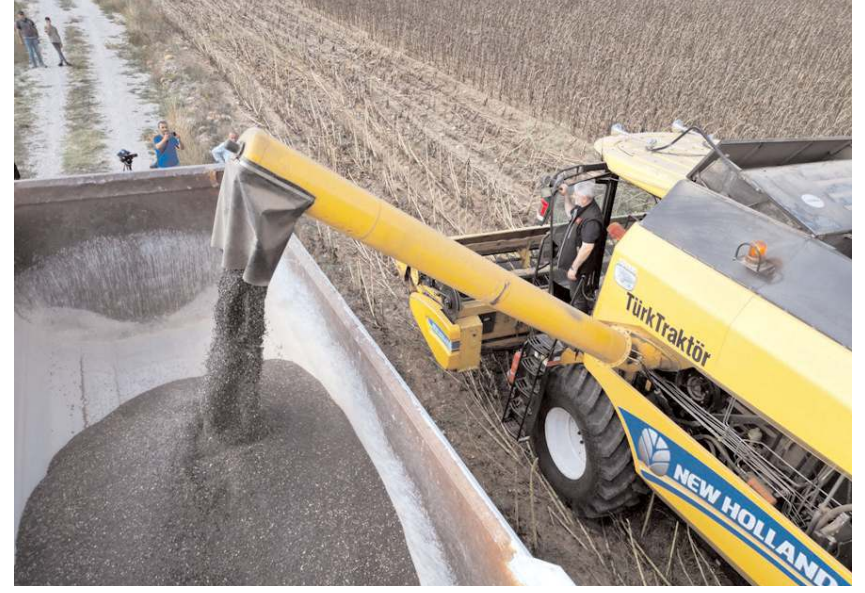
Çorum Belediyesi bu yıl 80 dönümlük arazisine ayçiçeği ekti.

Cumhurbaşkanı Recep Tayyip Erdoğan'ın ekilmemiş bir karış toprak bırakılmaması yönündeki talimatı üzerine harekete geçtiklerini dile getiren Belediye Başkanı Dr. Halil İbrahim Aşgın, "Bundan 3-4 yıl önce Ukrayna krizi çıktığında Sayın Cumhurbaşkanımızın "hiç boş arazi bırakmayacağız, ekilebilir tüm arazileri ekeceğiz" şeklinde talimatları olmuştur. Bizde bundan yola çıkarak 80 dönümlük belediyemiz arazisine ayçiçeği ektik. Hasadın ardından ayçiçeğinden 3 bin litre yağ elde etmiş olduk. Bu yağlarımızda belirlenen ailelerin sofralarına ulaşacak. Bundan sonraki süreçte de belediyemize ait arazilerde ekme ve buradan elde edilen ürünleri de ihtiyaç sahipleriyle paylaşmaya devam edeceğiz" ifadelerine yer verdi. (Haber Merkezi)