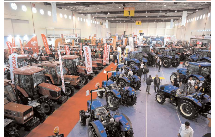
Fuarda 71 firma stant açtı.