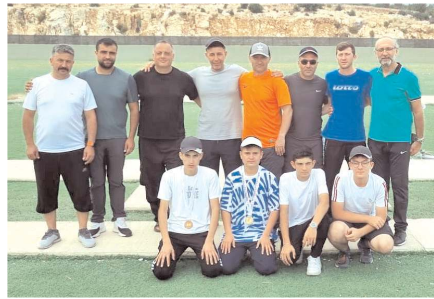
Cumhuriyet turnuvasında mücadele eden Çorum takımı sporcuları toplu halde