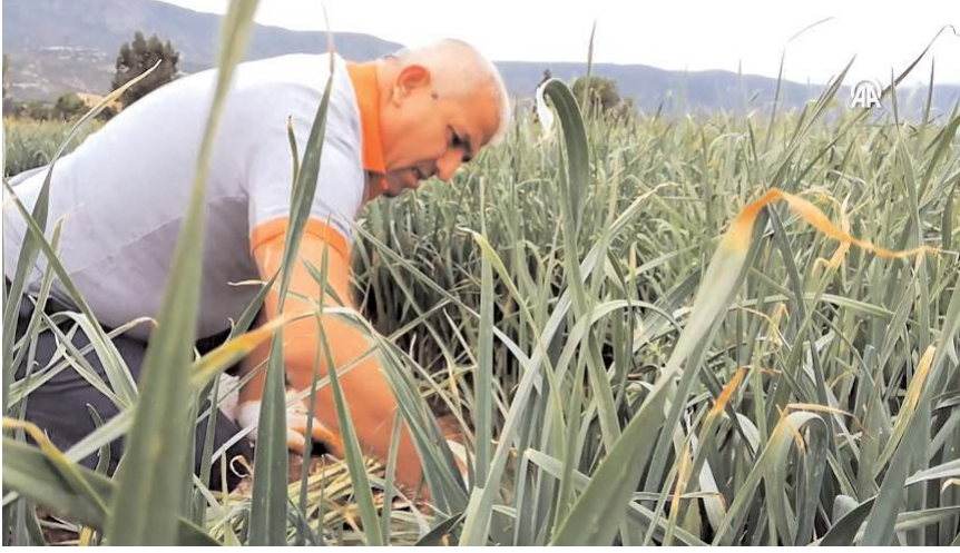
Kışlacık pırasası, TÜRKPATENT tarafından tescillendi.