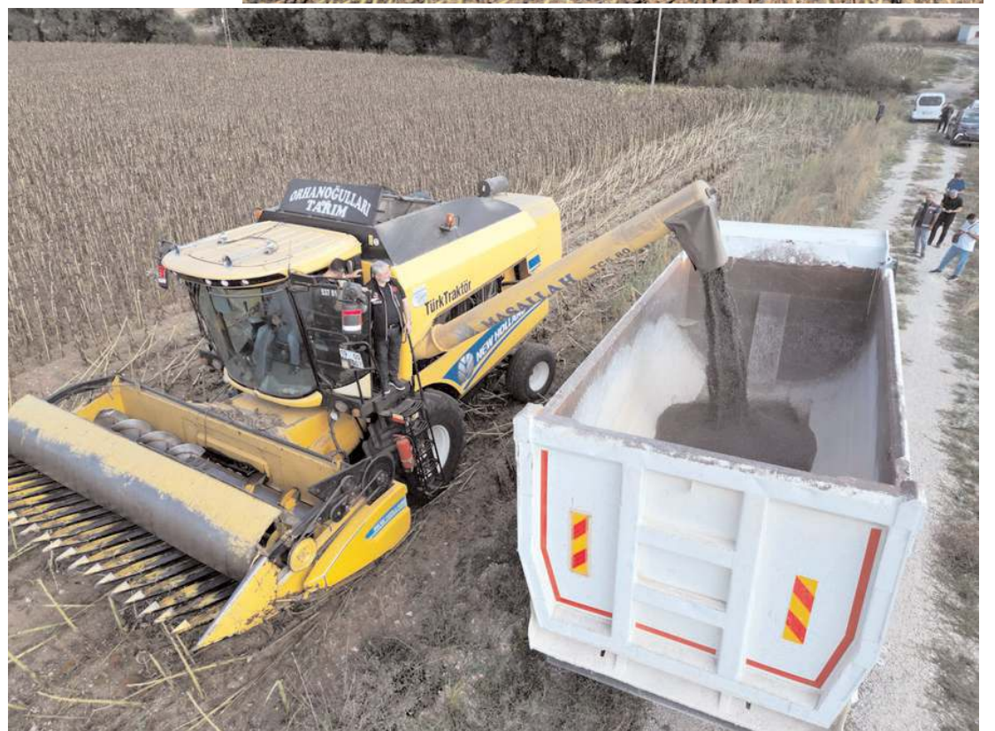
80 dönüm araziden hasat edilen ayçiçekten 3 bin litre ayçiçek yağı üretilti.