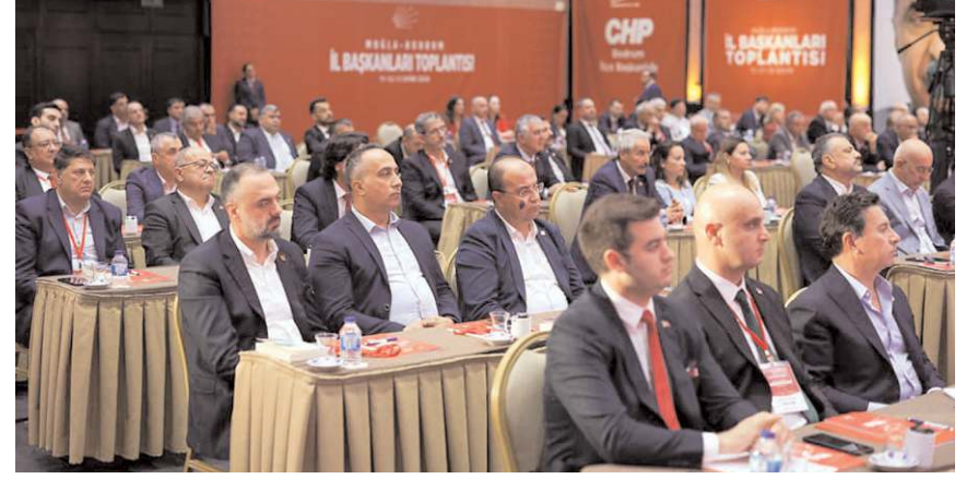
Toplantı Muğla'nın Bodrum ilçesinde yapıldı.

CHP Genel Başkanı Özgür Özel, yaptığı konuşmada partinin Türkiye'nin sorunlarını çözmek için hazır olduğunu vurgularken, il başkanları da Özel'e desteklerini ifade ettiler. (Haber Merkezi)