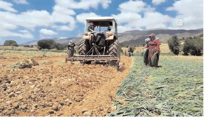
Kışlacık pırasasının ekimi Şubat - Mart aylarında yapılıyor.