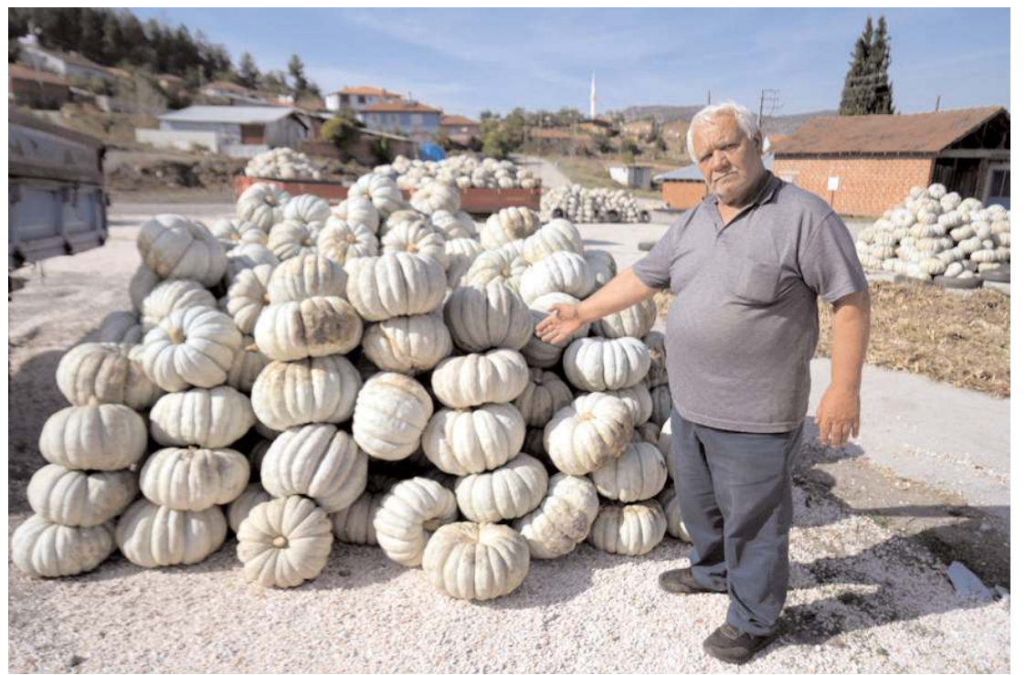
Kestane kabağı 40 şehre satılıyor.

Başkan Arslan, "İlçemizin 4 ana caddesinde yer alan yeni elektrik direklerinin elektrik maliyeti aylık 80 bin TL olarak daha önce belediyemiz tarafından karşılanıyordu. YEDAŞ ile yapılan görüşmeler neticesinde devrini tamamlayarak belediyemizin bütçesinden giden aylık 80 bin TL'yi kasamıza kazandırmış olduk" sözleriyle konuşmasını tamamladı. (İHA)