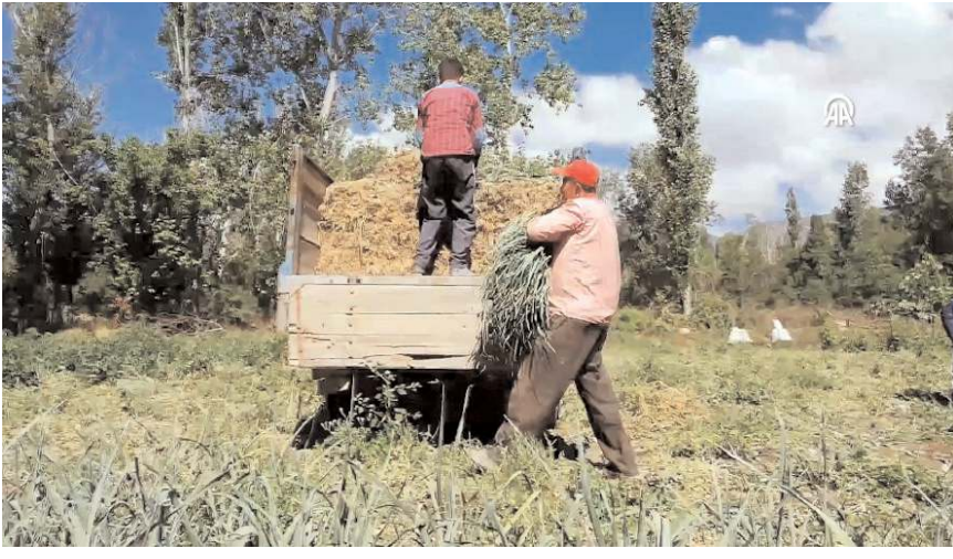
Pırasanın hasadı ise Ekim ayında başlıyor.

■ Çorum'un Mecitözü ilçesine bağlı Kışlacık köyü, lezzeti ve yumuşaklığı ile ün yapmış pırasası için coğrafi tescil aldı.