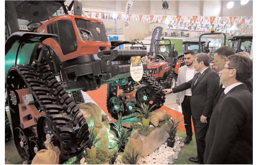
Samsun Valisi Orhan Tavlı ve beraberindekiler fuarı gezerek ürünleri incelediler.

Tarım Fuarı 20 Ekim'e kadar açık kalacak. (İHA)