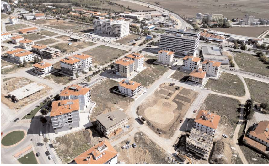
Park Fen Lisesi 14. Cadde'de yapılıyor.