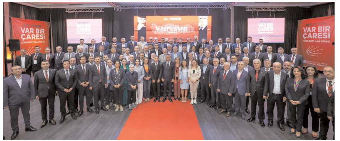
Toplantının ardından toplu hatıra fotoğrafı çekildi.

Pırasa A, E, B1, B2 ve C vitaminleri, sodyum, potasyum, kalsiyum, fosfor, demir ve magnezyum gibi mineralleri bolca içermektedir. Sağlıklı beslemede ön plana çıkan pırasa bitkisi çeşitli hastalıklara iyi gelmektedir.