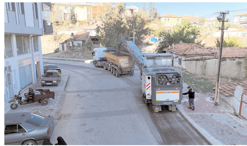
Altyapı çalışmaları nedeniyle bozulan yolları asfaltlanıyor.