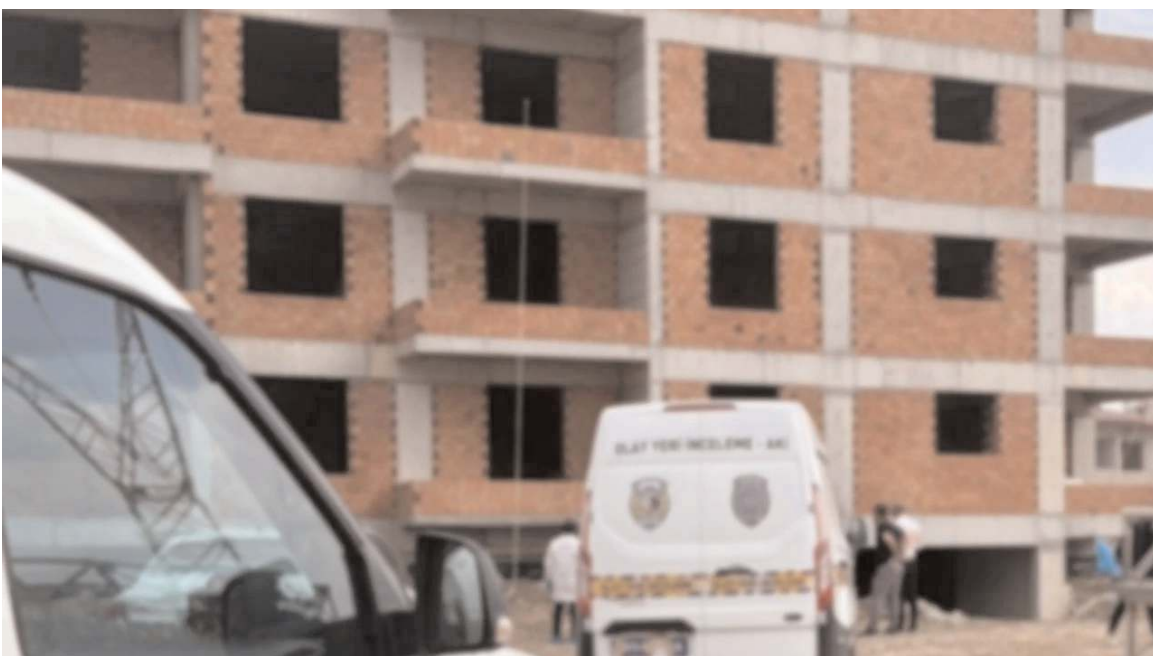
Olay Dr. İlhan Gürel Caddesi'nde bir inşaat medyanı geldi.

"Eskiköy'de 4 yıl önce ciddi paralar harcanarak yapılan mebran sulama havuzu yıllardır atıl vaziyette çürüyor çiftçinin diktiği meyve ağaçları kuruyor. Yine Eskiköy'de 4 yıldır söz verilen 8 kilometrelik içme suyu boru hattı bir türlü yenilenmiyor halk günlerce susuz kalıyor. Birçok köyümüzde okul yok, sağlık ocağı yok, yol yok, su yok, internet yok. Dolayısıyla iktidarın Çorum'a hayrı yok. Kızılırmak akıyor Çorum çiftçisi bakıyor. Milletten efendisi olan köylümüze hak ettiği hizmeti Cumhuriyet Halk Partimiz iktidarında alacaktır." (Haber Merkezi)