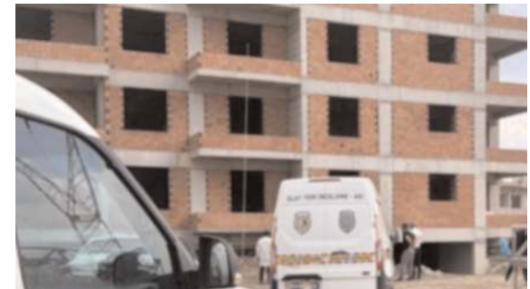
Olay Dr. İlhan Gürel Caddesi'nde bir inşaat medyanı geldi.