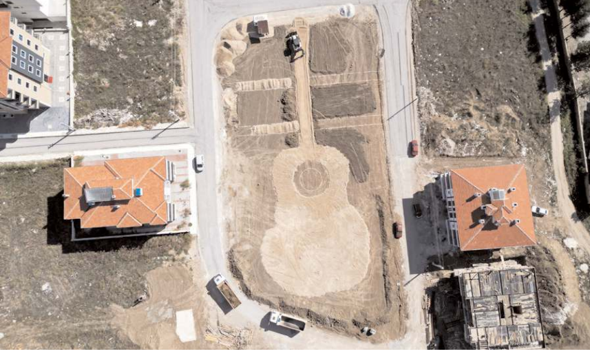
Park gitar formunda inşa ediliyor.