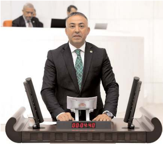
CHP Çorum Milletvekili Mehmet Tahtasız

"AKP iktidarında köylünün çilesi bitmiyor" diyen Mehmet Tahtasız, "Çorum'da 759 köyümüz var. Bir çok köyümüzde hizmet yetersiz tüm imkansızlıklara rağmen ekmeğini taştan çıkaran Çorum'un Eşençay, Eskiköy, Arslan Köy, Öksüzler, Erdek, Acıpınar, Çalyayla, Kızılpınar,