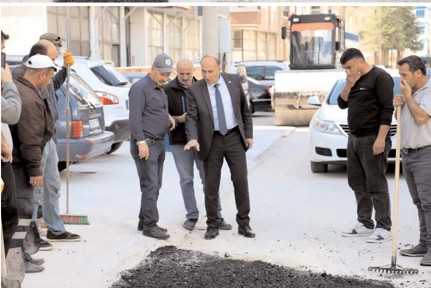
Belediye ekipleri bozuk olan yollara asfalt verdi.