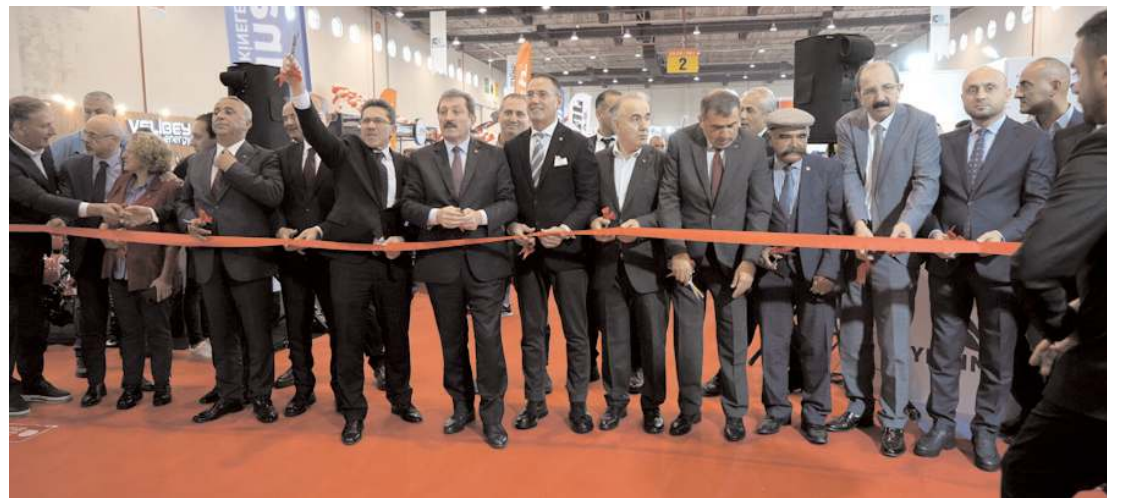
9. Tarım, Hayvancılık ve Teknolojileri Fuarının açılış kurdelesini protokol üyeleri tarafından kesildi.

ve Jandarma Genel Komutanlığı bünyesinde cansiperane görev yapmış ve yapmakta olan emekli ve muvazzaf astsubaylarız. Vatan sevgisinin, fedakârlığın ve kahramanlığın timsali olan Türk Silahlı Kuvvetleri'nde fedakârca ve özveri ile çalışarak emekli olmuş astsubaylarımızın ve şu anda da asil milletimizin huzuru ve güvenliği için yurt içi ve yurt dışında canı pahasına fedakârca görev yapan tüm muvazzaf astsubay meslektaşlarımızın 17 Ekim Astsubaylar Günü kutlu olsun. Muvazzaf astsubaylarımıza kazasız-belasız hayırlı görevler diliyorum. Ebediyete intikal eden şehit ve gazilerimizi ve tüm meslektaşlarımızı rahmet ve minnetle anıyorum" dedi. (Haber Merkezi)