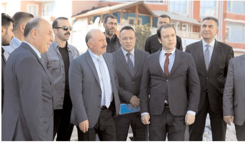
Vali Çalgan, ilçedeki yatırımları inceledi.

■ Çorum Valisi Ali Çalgan, Alaca ilçesinde bir dizi ziyaret gerçekleştirdi. Kaymakam Engin Tok ve Belediye Başkanı Şerif Arslan Vali Ali Çalgan'a İlçe ziyaretinde eşlik ederek ilçenin taleplerini ilettiler. * HABERİ 2'DE