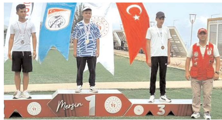
Genç erkeklerde ödül töreninde kürsüye Çorum'dan iki sporcu çıktı