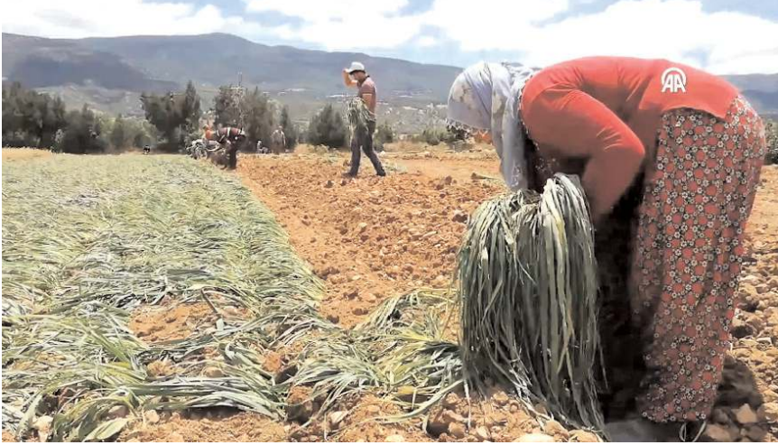
Pırasanın hasadı ise Ekim ayında başlıyor.