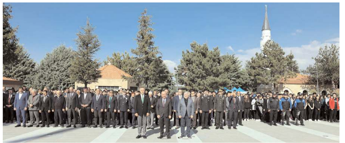
29 Ekim Cumhuriyet Bayramı etkinlikleri kapsamında Şehitlikte program yapıldı.