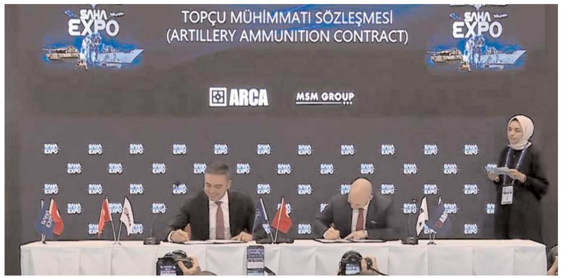
ARCA Savunma Sanayi ile MSM Group arasında topçu mühimmatı sözleşmesi imzalandı.