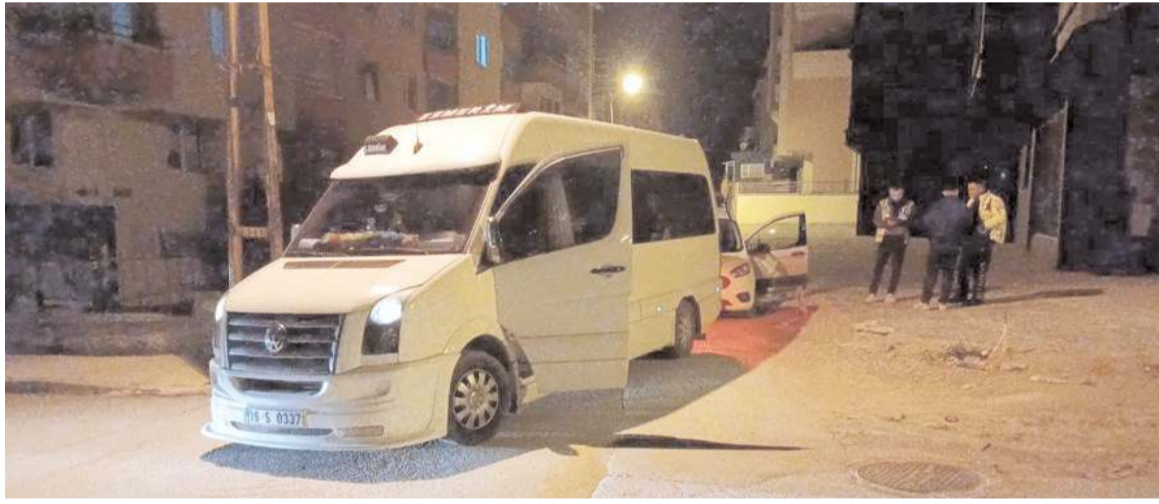
Olay Şenyurt Caddesi üzerinde yaşandı.

Milletvekili Kaya, uzun süredir doktor açığı bulunan Erol Olçok Eğitim ve Araştırma Hastanesine de 9'u Uzman, 1'i