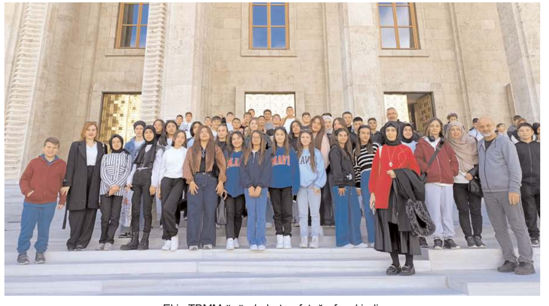
Ekip TBMM önünde hatıra fotoğrafı çekindi.