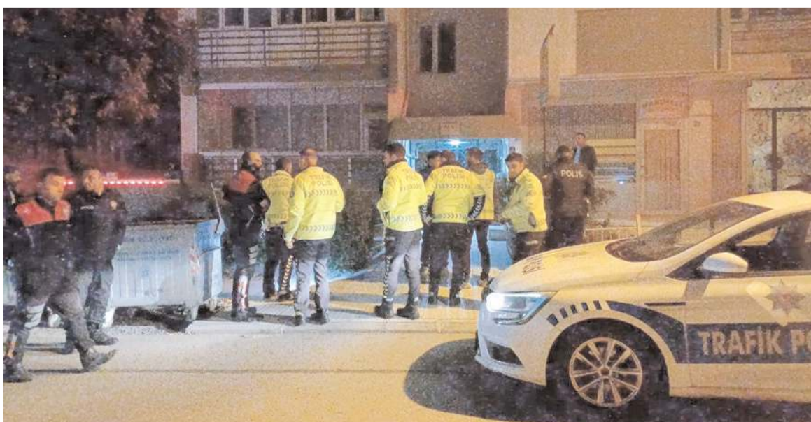
Polis çevrede kaçan sürücüyü aradı.