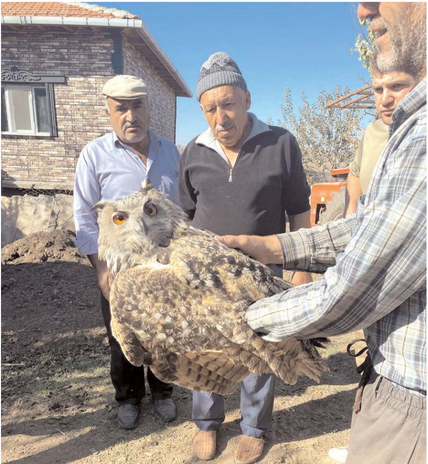
Durumu yetkililere bildirilen kuş koruma altına alındı.

Çorum'un Sungurlu ilçesine bağlı Yörüklü köyünde nesli tehlike altında olan bir puhu kuşu, yaralı ve bitkin bir halde bulundu.