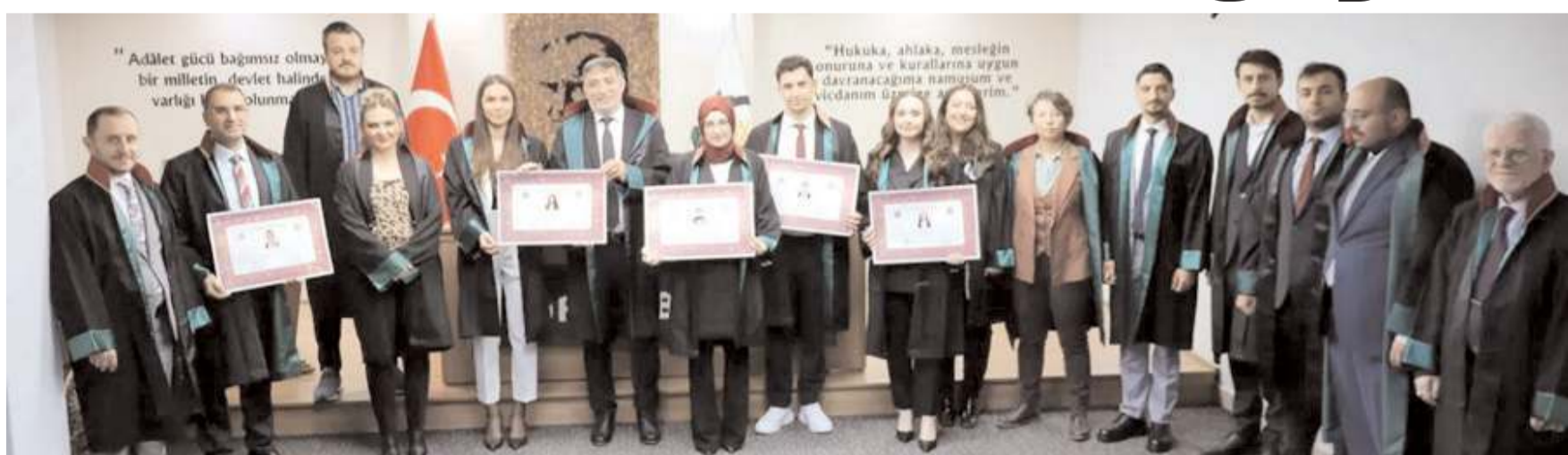
Stajını tamamlayan avukatlar için Çorum Barosu konferans salonunda yemin ve ruhsat töreni yapıldı.