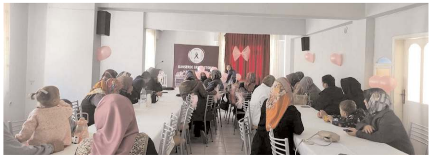
Kadınlara meme kanserinin erken teşhisinin önemi anlatıldı.

Çorum'un Oğuzlar ilçesinde, kadınlara meme kanseri farkındalık eğitimi verildi.