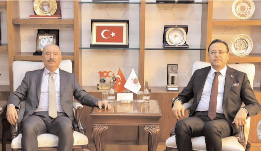
Bakan Yardımcısı Ebubekir Gizligider, Çorum Valisi Ali Çalgan'ı ziyaret etti.