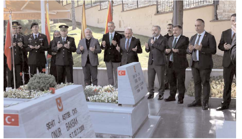
Programda şehitler için dua edildi.