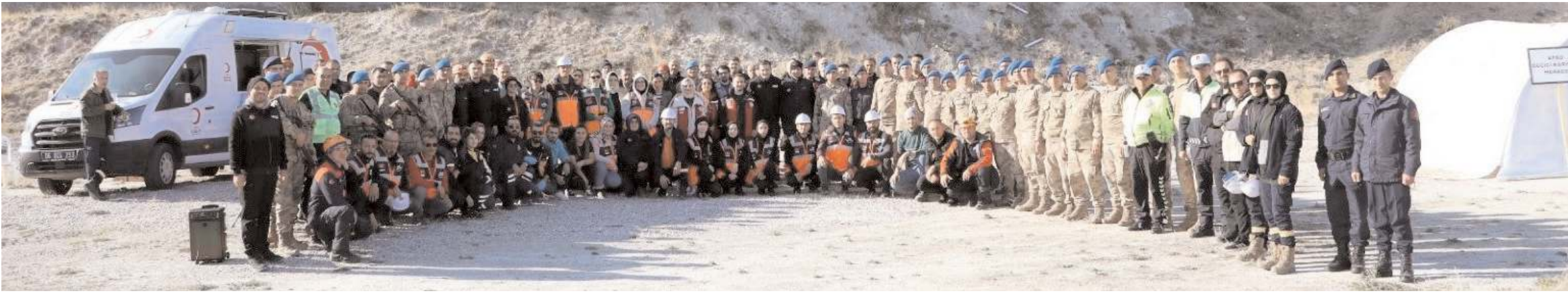
Çorum Organize Sanayi Bölgesi'nde inşaat alanında yapılan tatbikata yaklaşık 150 kişi katıldı.