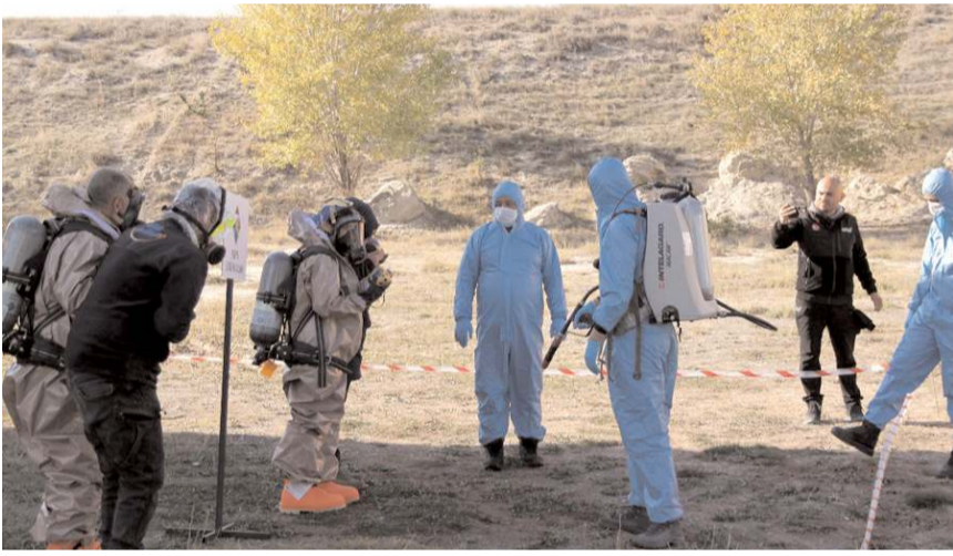
AFAD Kimyasal Biyolojik Radyolojik Nükleer Tehditler (KBRN) ekipleri bir binadaki klor gazı sızıntısına müdahale etti.