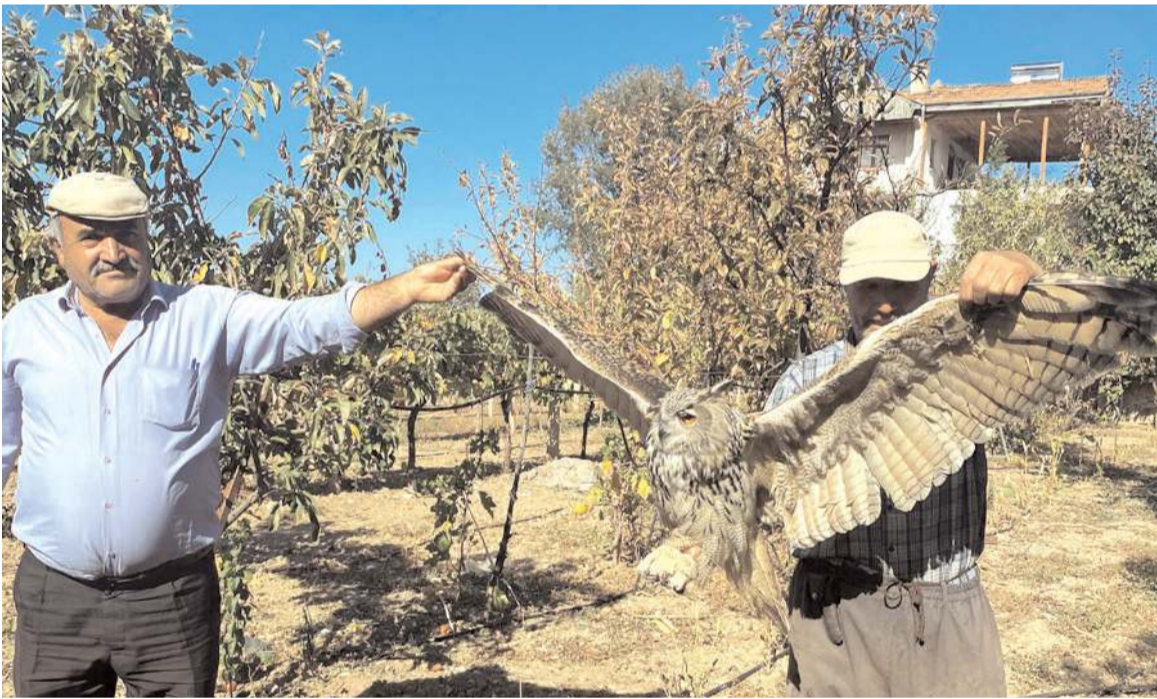
Yörüklü köyü muhtarı, nesli tehlike altında olan bir puhu kuşunu, yaralı ve bitkin bir halde buldu.