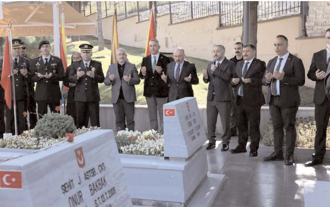
Programda şehitler için dua edildi.

29 Ekim Cumhuriyet Bayramı etkinlikleri kapsamında gerçekleştirilen programda şehitlerimiz için dua edildi. * HABERİ 2'DE