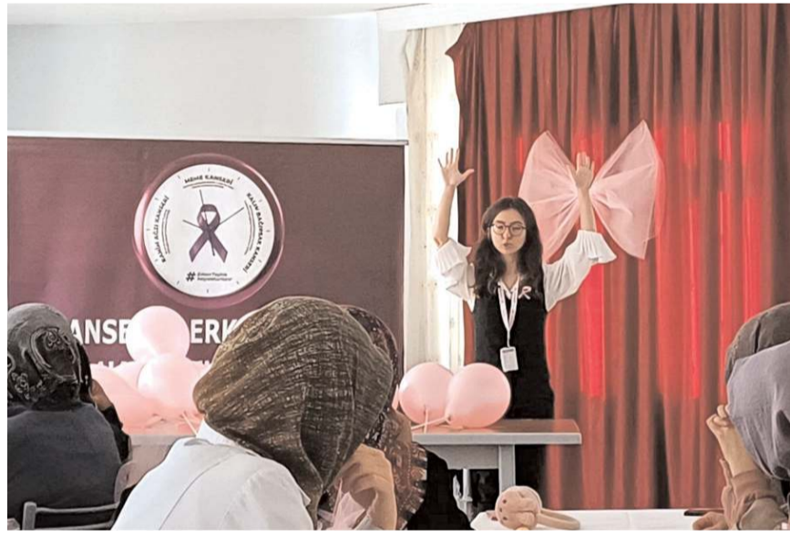
Eğitim Oğuzlar Toplum Sağlığı Merkezi tarafından düzenlendi.