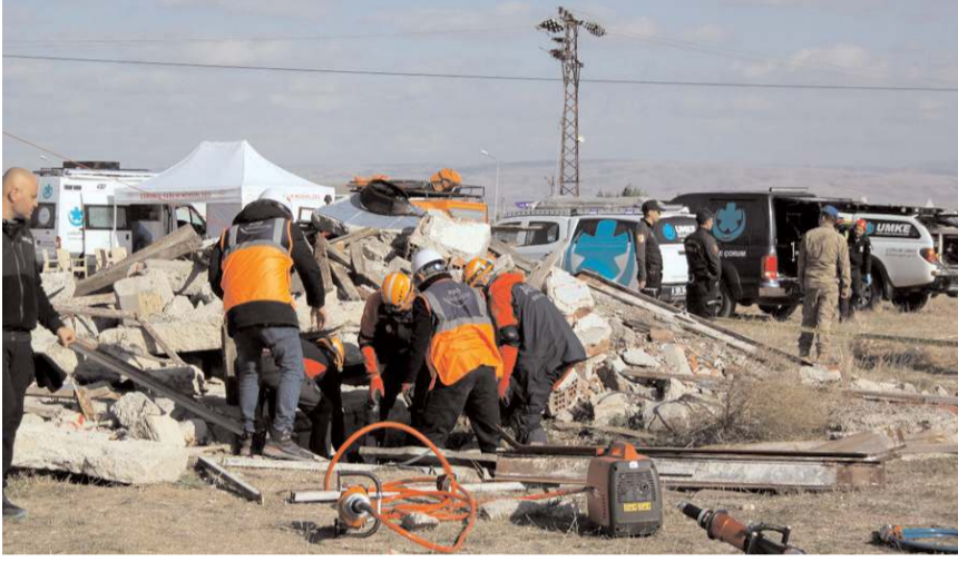
AFAD ekipleri göçük altında kalanları kurtardı.