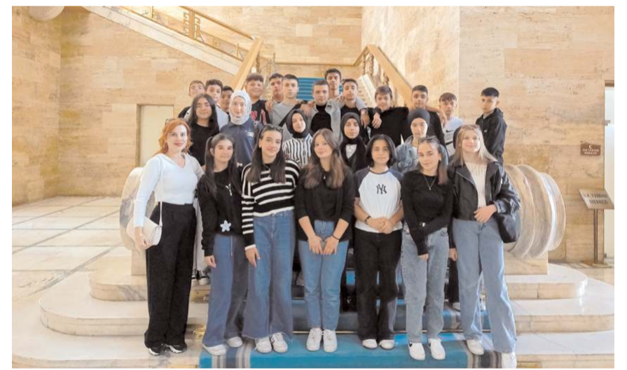
Öğrenci ve öğretmenleri TBMM'yi gezdiler.