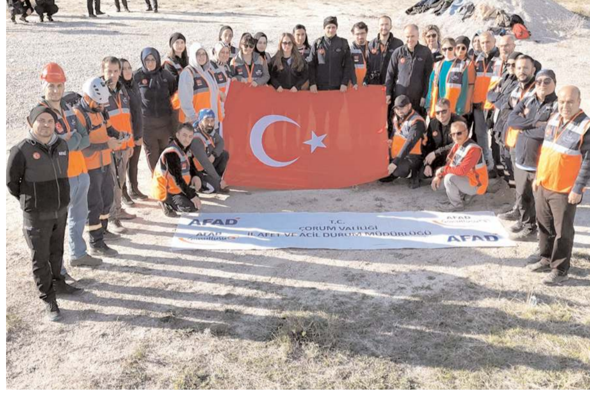
Tatbikatin ardından hatıra fotoğrafı çekildi.

Aile ve Sosyal Hizmetler İl Müdürlüğü ekipleri ise afetten etkilenen vatandaşlara kendi çadırında psikososyal destek sağladı. (AA)