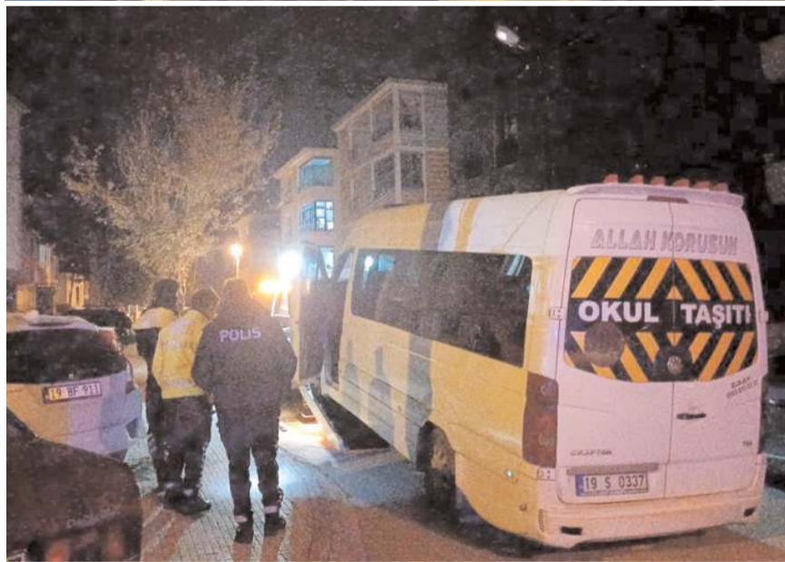
Minibüs Şenyurt 6. Sokak'ta park halinde bulundu.