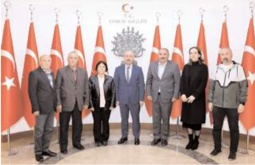
Ziyaretin sonunda hatıra fotoğrafı çekinildi.