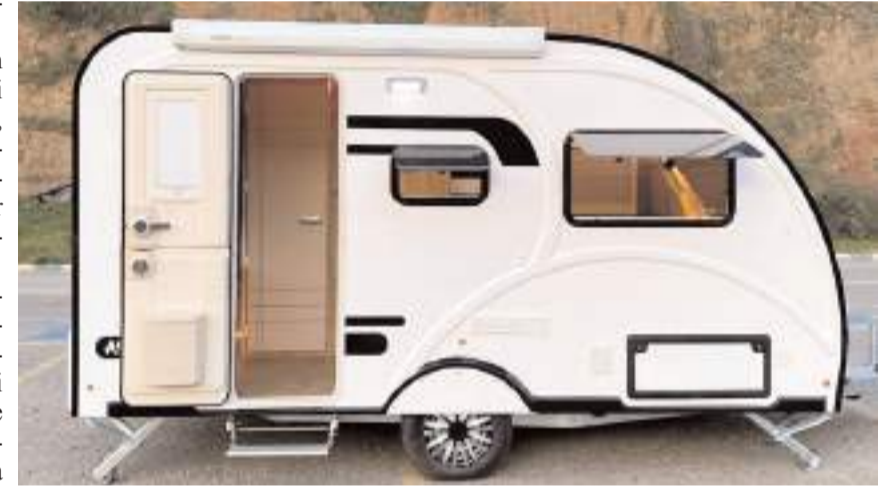
Fuar 7-10 Kasım tarihleri arasında açık olacak.

delleri bölge halkının beğenisine sunacaklarını dile getiren Fahri Yandık, fuarın karavan almak isteyenler için bulunmaz bir fırsat olacağını belirterek, tüm Çorumlulara fuara davet etti. (Haber Merkezi)