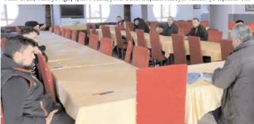
Adaylar daha önce Çorum Esnaf ve Sanatkarlar Odası'nda yazılı sınava tabii tutuldular.