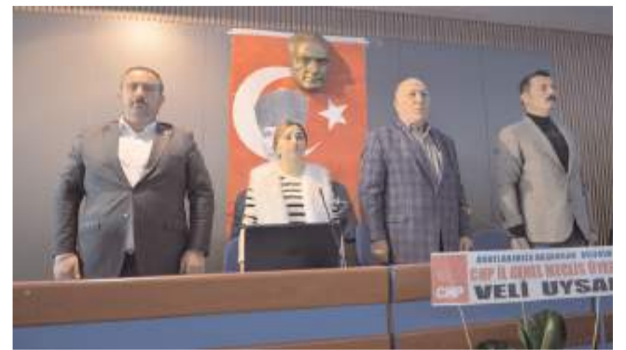
Genel kurulda ilk olarak divan heyeti belirlendi.