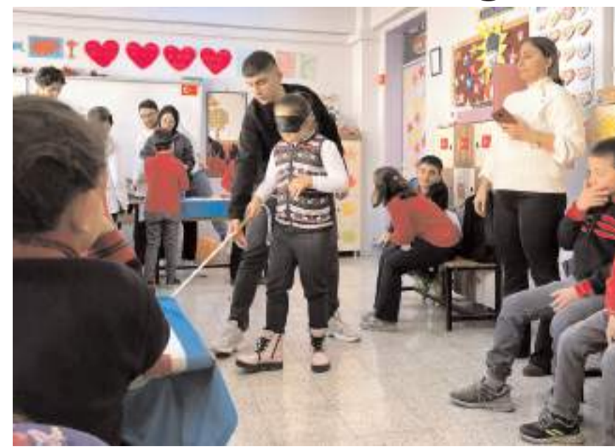
Görme engellilerin günlük yaşamları, günlük yaşamlarında karşılaştıkları zorluklar, kullandığı araç-gereçler gibi konularda bilgi verildi.

Etkinlikte ayrıca görme engelli bir bireye davranırken neler dikkat edilmeli, görme engellilerin günlük yaşamları, günlük yaşamlarında karşılaştıkları zorluklar, kullandığı araç-gereçler gibi konularda da bilgi verildi.