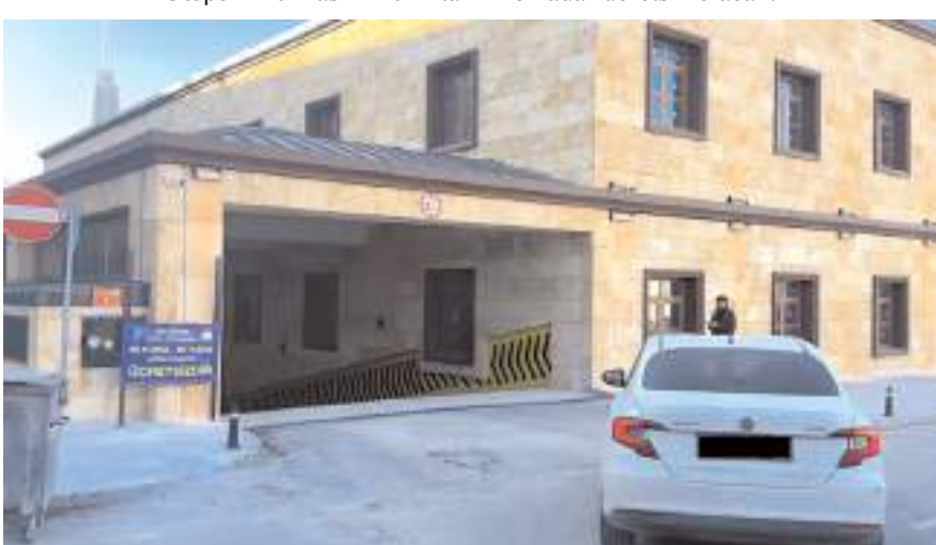
Otopark 211 araç kapasiteye sahip.