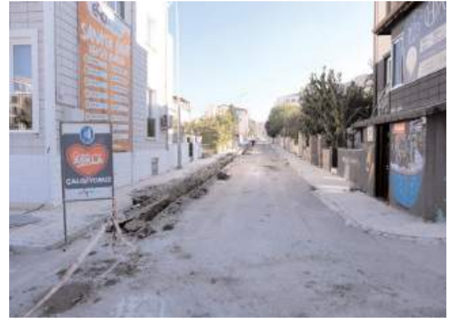
Bölgede 9 bin metre içme suyu hattı yenilenecek.

Binevler'de su hatlarının kullanım ömrünü tamamla- mış olması nedeniyle zamanla tıkanıklık oluşturduğunu tespit ettiklerini belirten Başkan Aşgın, "Binevler semtimizde geçmişte kullanılan asbest su hattı vardı. Bu hatlarda zamanla oluşan kireçlenme gibi sorunlardan dolayı hat basınçlarında sıkıntılar yaşıyorduk. Başlatmış olduğumuz çalışma ile birlikte toplamda 9 bin metrelik su borusunu polietilen borularla değiştireceğiz ve su basıncında yaşanan sıkıntının önüne geçmiş olacağız. Çalışma kapsamında şu anada kadar 6 bin metrelik boru hattında değişiklik gerçekleştirildi. Aralık ayında çalışma tamamlanacak ve Binevler'in %95'lik kısmında su hattını değiştirmiş olacağız" dedi. (Haber Merkezi)