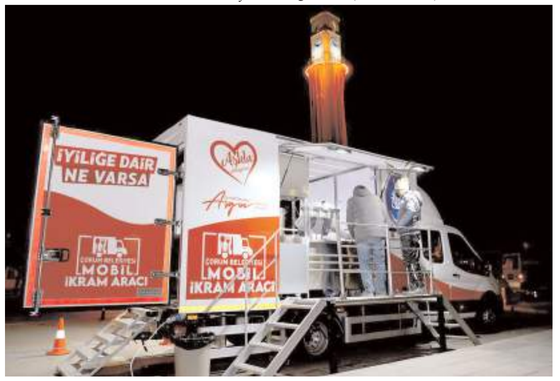
Cuma günleri cami çıkışlarında mevsimine göre çay, çorba, limonata ve salep ikram ediliyor.