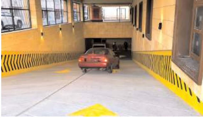
Otopark 20 Kasım 2024 tarihine kadar ücretsiz olacak.

Çorum Belediyesi'nin yapımını tamamladığı Bedesten'den sonra yeraltı otoparkı da hizmete açıldı.