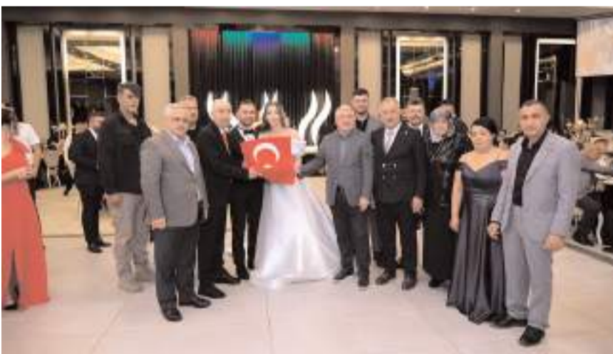
Düğüne çok sayıda davetli katıldı.