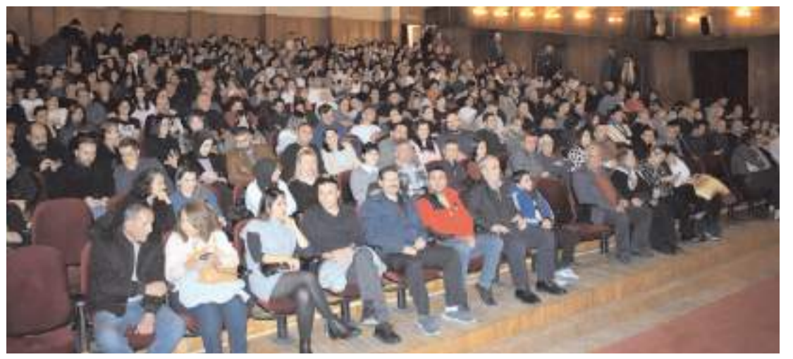
Devlet Tiyatro Salonunda yapılan konsere ilgi yüksek oldu.