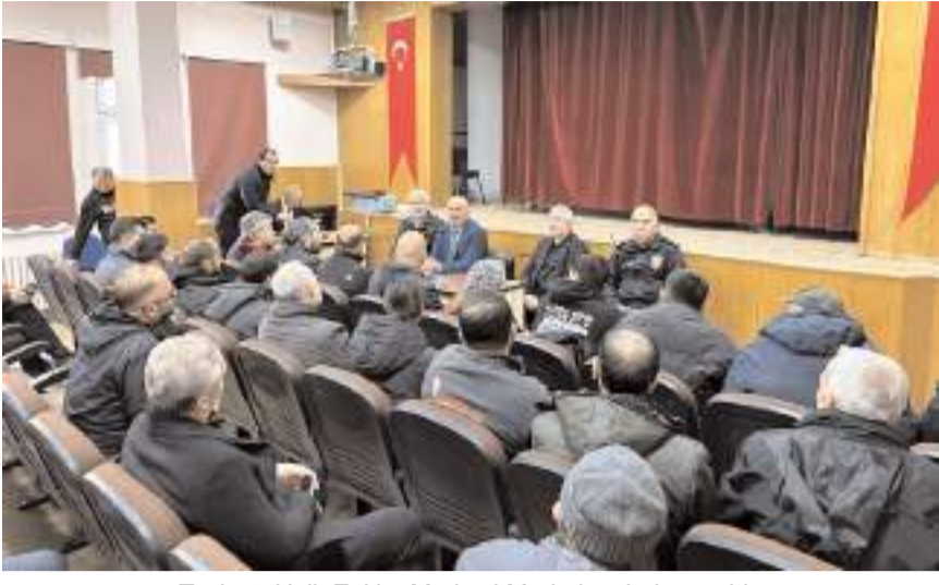
Toplantı Halk Eğitim Merkezi Müdürlüğü'nde yapıldı.