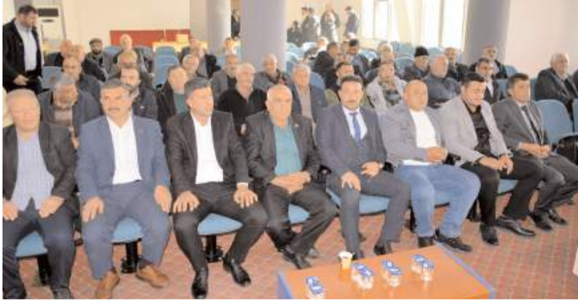
Merkez Köy Muhtarları Derneğinin 11. Olağan Genel Kurulu ÇESOB'ta yapıldı.