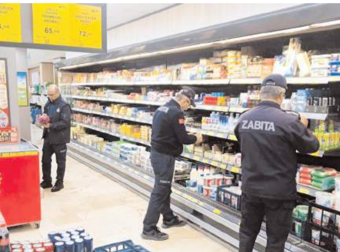
Zabita ekipleri denetimde, raflardaki ürünlerin son kullanma tarihlerini inceledi.

Hakimiyet, merhumeye Allah'tan rahmet, ailesine ve yakınlarına başsağlığı diler.