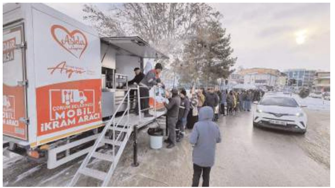
Mobil ikram aracı 2021 yılında faaliyete başladı.

12 bin 500 metrekare inşaat alanına sahip Bedesten'de 211 araçlık iki katlı yeraltı otoparkı yer alıyor. Yapı içinde 25 adet işyeri inşa edildi.