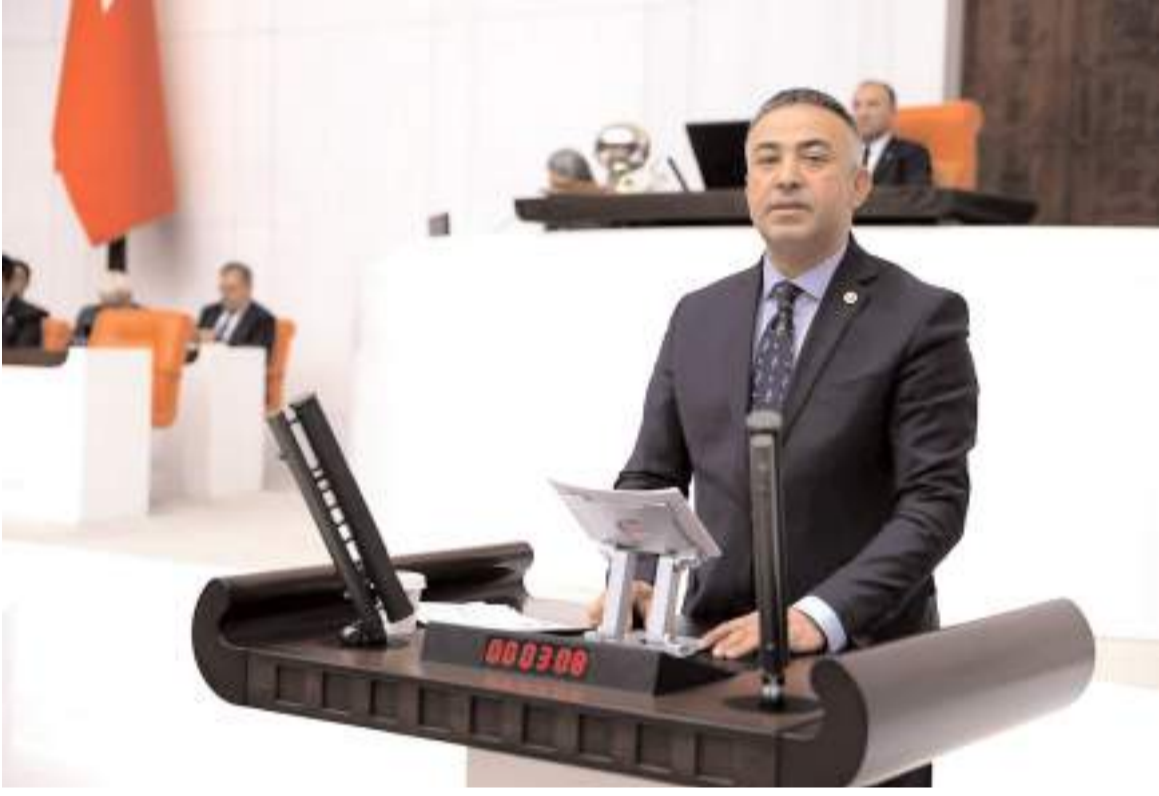
CHP Çorum Milletvekili Mehmet Tahtasız

başsağlığı, yaralılarımıza da acil şifalar diliyorum. Gün birlikte yaraları sarma günüdür. Patlamanın yaşandığı Hilal Apartmanı ve karşısındaki Arıncı Apartmanı tamamen kullanılmaz hâle gelirken çok sayıda binada, dükkânında ve araçta hasar meydana geldi. Kullanılmaz hâle gelen binalardaki esnaf ve vatandaşımız tamamen mağdurdur. Havalar soğudu, önümüz kış. Başta Çevre, Şehircilik ve İklim Değişikliği Bakanlığı ile Aile ve Sosyal Hizmetler Bakanlığı olmak üzere Çorum Valiliği ve belediyelerimizi acilen yaralarımızı el birliğiyle sarmaya davet ediyorum. Evsiz kalan vatandaşlarımıza geçici barınma sağlansa da iktidardan talebimiz, kış gelmeden bu vatandaşlarımızın sıcak yuvalarına kavuşması, hasarlı binalarda ve dükkânlarda kontrollerin hızlı bir şekilde yapılması, gerekli önlemlerin alınması ve vatandaşlarımızın tüm zararlarının karşılanmasıdır. Bu üzücü olay nedeniyle tüm mağdurlarımız devletin şefkatli elini uzatmasını bekliyoruz. Halkımız ile birlikte bizlerde dayanışmaya hazırız." (Haber Merkezi)