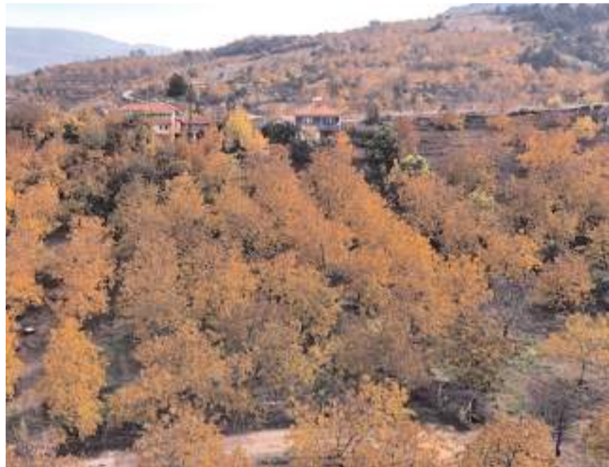
Ceviz hasadı yapılan ilçe, sonbaharın gelişle rengarenk manzaralar sunuyor.