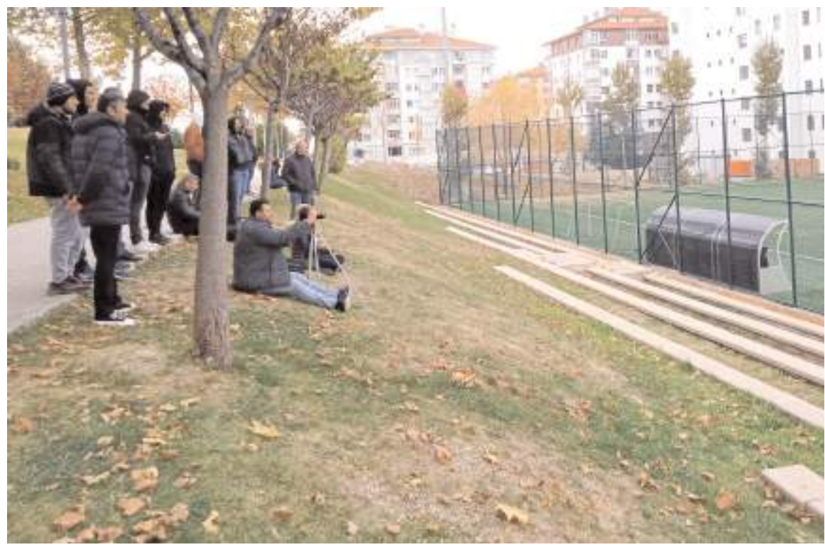
Tribünden maç izleyemeyenler her zaman olduğu gibi yine sahanın ortasındaki park alanda ayakta maç izliyor