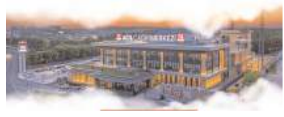
Tesis 1347 metrekare kapalı alana sahip olacak.