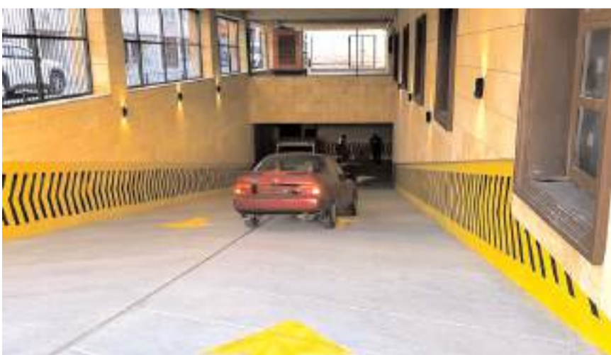
Otopark 20 Kasım 2024 tarihine kadar ücretsiz olacak.