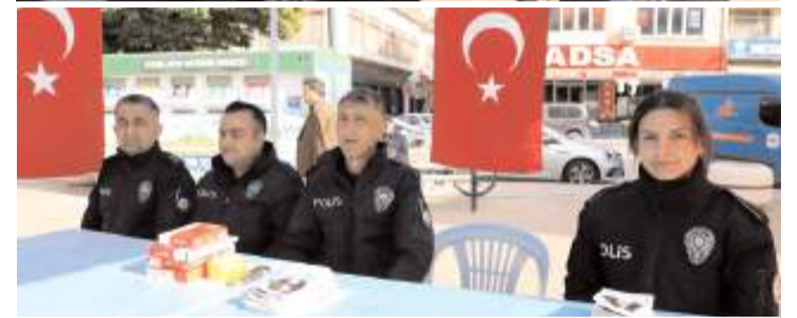
Polisler uyuşturucu satıcılarına karşı dikkatli olunması konusunda uyarıda bulundu.