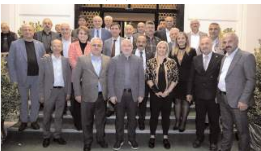
Düğün töreni Yıldızpark Düğün Salonu'nda yapıldı.