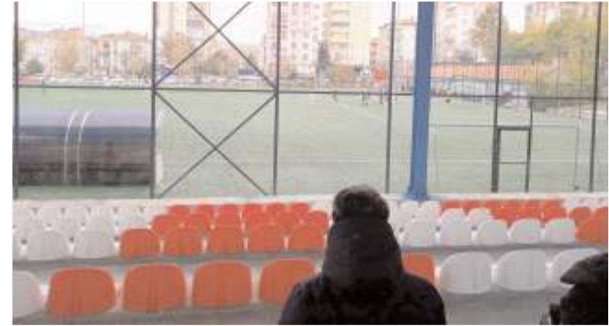
Tribünün üst sıralarından bile sahaya tam olarak görme şansız bulunmuyor

müsabakaları izliyorlar. Özlü sözlerimiz her zaman doğru çıkıyor. Yıkmak çok kolay ama yapmak bir o kadar zor. 1 ve 2 nolu sahalarda iki günde yıkılırken yeni yapılan sahalarda durumu tüm spor kamunu biliyor. Ne diyelim mühendislik harikası sentetik zeminli çim sahalalarımız hayırlı olsun.