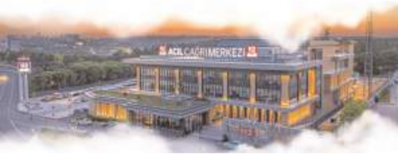
Tesis 1347 metrekare kapalı alana sahip olacak.

AK Parti Çorum Milletvekili ve TBMM Adalet Komisyonu Üyesi Ođuzhan Kaya, Bayat ilçesine yeni Aile Sađlık ile Toplum Sađlığı Merkezi ve 112 Acil Sađlık İstasyonu yapılacağını açıkladı.