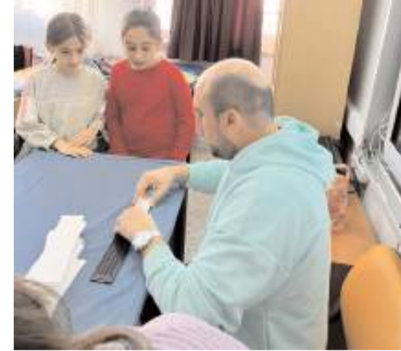
Etkinlik İsmail Kakaç İlkokulu'nda düzenlendi.