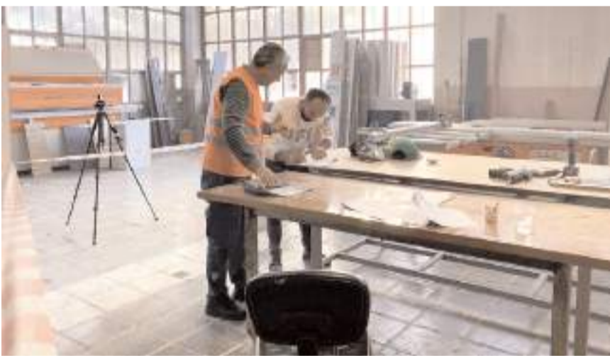
Sınav sonunda başarılı olan adaylara mesleki yeterlilik belgeleri verilecek.