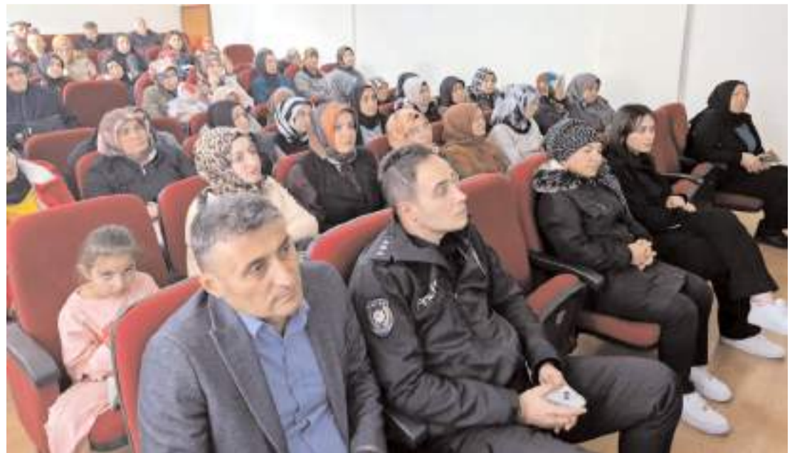
'En İyi Narkotik Polisi Anne' projesi hakkında da annelere eğitim verildi.