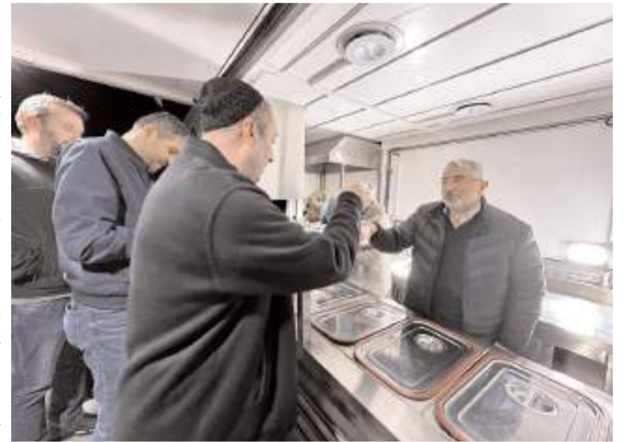
Mobil ikram aracı 3 yılda 400 bin kişiye ulaştı.

vam edeceğiz. Hemşehrilerimizin yardımseverliğini, iyiliğini, şehrimizin muhabbetini sıcak bir çayla, sıcak bir çorbayla oraya taşıyacağız. İkrāmda bulunduğumuz hemşehrilerimizin yüzündeki gülümseme, ettikleri dua bizlere moral veriyor. Görev ve geldiğimiz günden bu yana vatandaşlarımızın mutluluğu, huzuru için aşkla çalışmaya devam edeceğiz" dedi. (Haber Merkezi)