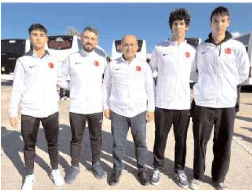
Çorum Belediyespor'un milli sporcu ve antrenörü Federasyon Başkanı Ercüment Taşdemir ile birlikte Balkan Şampiyonasına hareketlerinden önce birlikte görüldü

YÜKSEL BASAR Çorum Belediyespor'un bir antrenör ve üç sporcusunu bulduğu Karate Milli Takımı Balkan Şampiyonası için Bosna Hersek'e gitti. 8-10 Kasım tarihle-