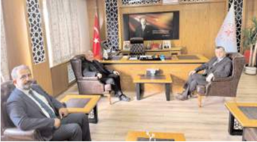
Ziyarette, birlikte yürütülecek projeler istişare edildi.