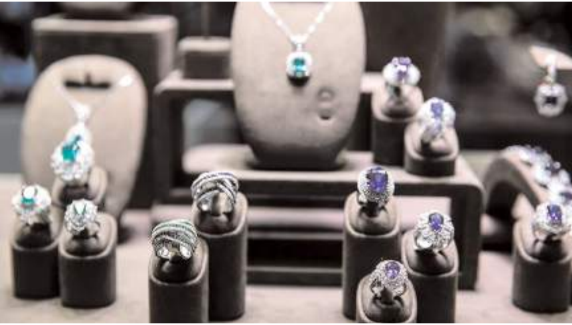
Türkiye'nin mücevher ihracatının yüzde 98'i Çorum ve İstanbul'dan yapılıyor.

Söz konusu dönemde, Çorum'dan 1,8 milyar dolarlık, Kastamonu'dan 61,2 milyon dolarlık, Ankara'dan 23,6 milyon dolarlık, İzmir'den 4,9 milyon dolarlık, Gaziantep'ten 4,1 milyon dolarlık mücevher ihracatı yapıldı. (A.A)