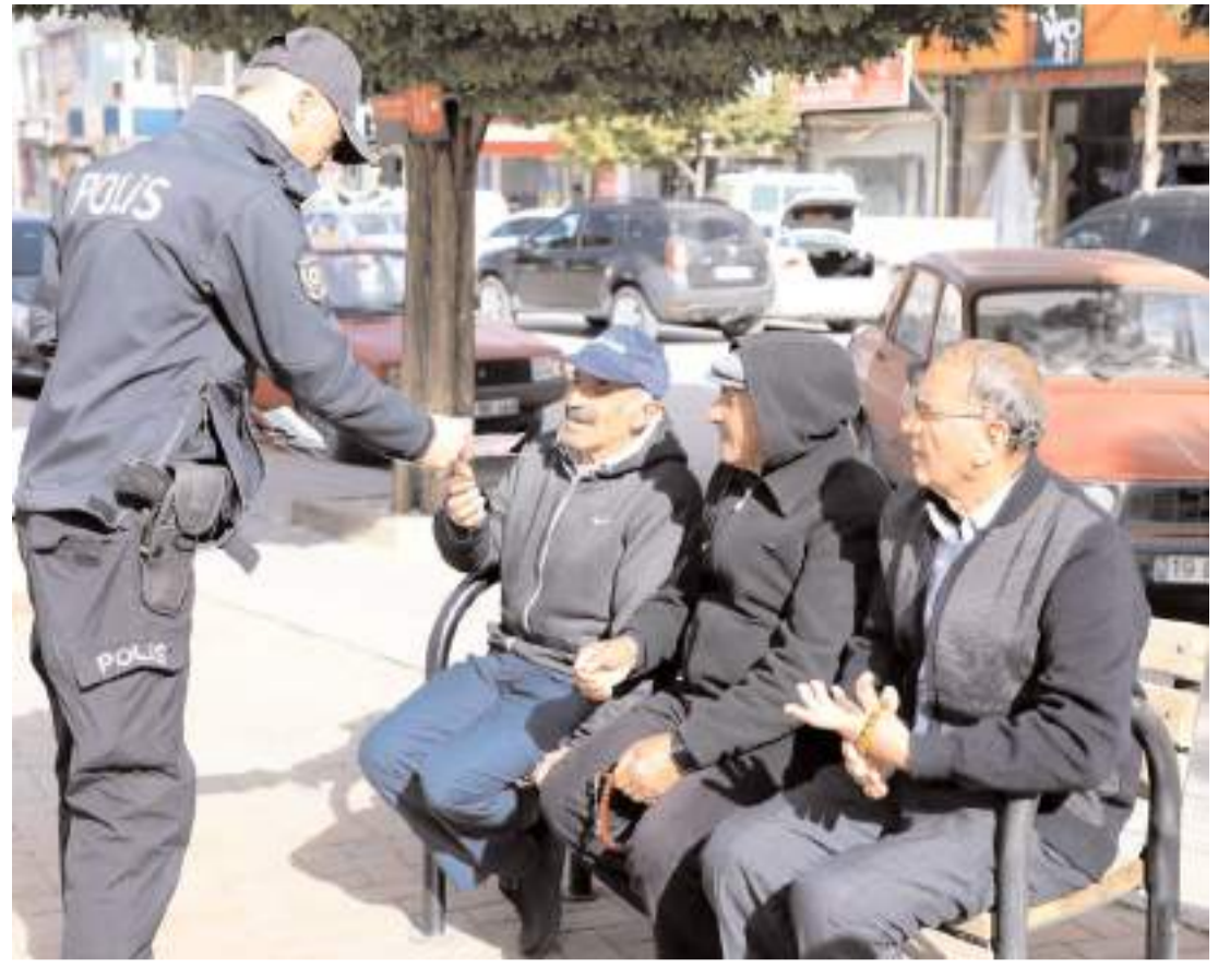
Polis ekipleri uyuşturucu maddelerin zararlarını anlatan broşürler dağıttı.

Halk Eğitim Merkezi Müdürlüğü'nde gerçekleştirilen toplantıda Vali Çalgan, esnaf ve vatandaşların istek ve taleplerini dinleyerek, yapılan çalışmalar, bundan sonraki süreçte izlenecek yol haritası hakkında bilgi verdi.