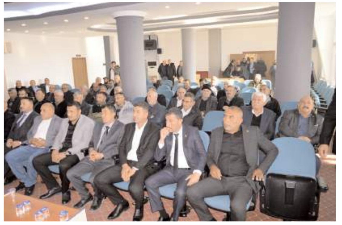
Merkez Köy Muhtarları Derneğinin 11. Olağan Genel Kurulu ÇESOB'ta yapıldı.

Marketlerin mevzuata uygun hareket etmelerini sağlamak amacıyla denetimlerin devam edeceği bildirildi. (AA)