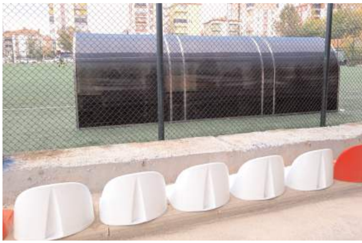
Tribünün ilk üç sırasında oturan taraftarların sahaya görmek gibi bir şansı bulunmuyor ve tribün çok köşede