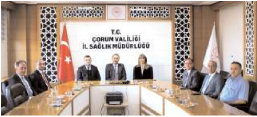
Toplantıda sağlık hizmetlerinin kalitesinin artırılması için neler yapılabileceği konuşuldu.

Toplantıda hastanedeki hizmet sunumunun mev-