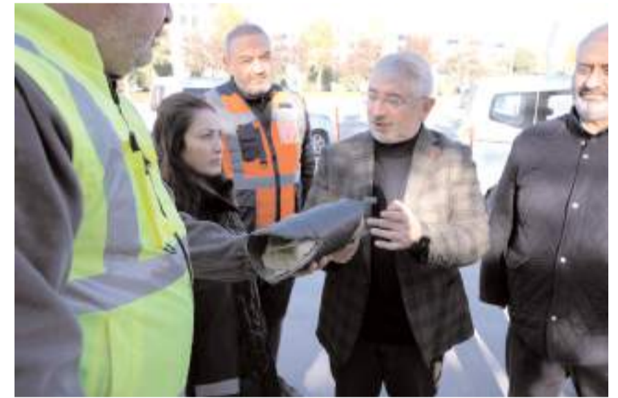
Başkan Aşgın, çalışmaların son durumu hakkında bilgi aldı.