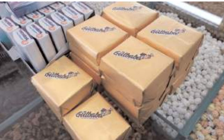
Market ve pastanelerde bu çikolatalar, raflara konduğu anda tükeniyor.