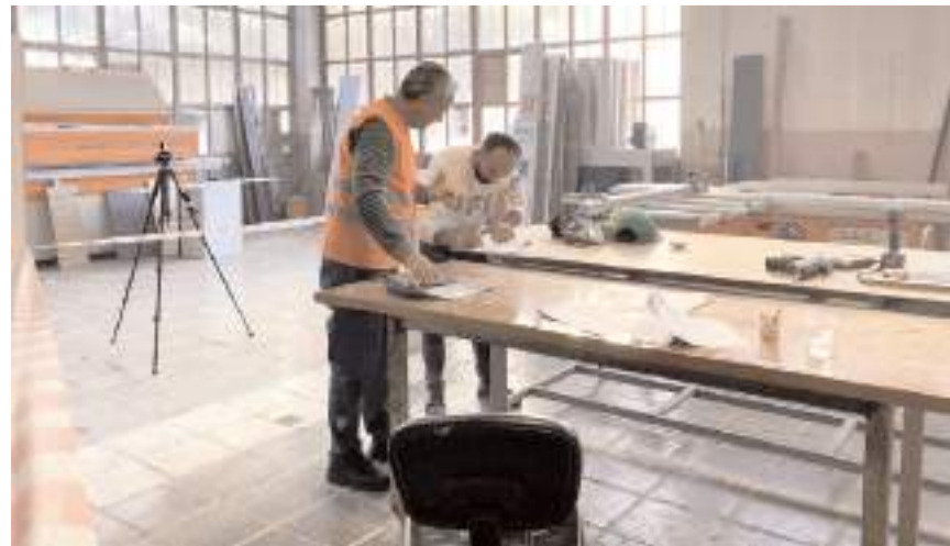
Sınav sonunda başarılı olan adaylara mesleki yeterlilik belgeleri verilecek.