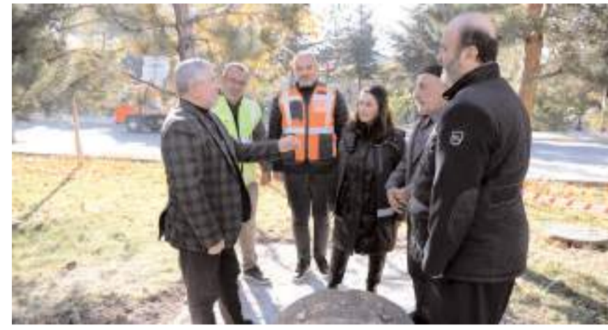
Başkan Aşgın, çalışmalar hakkında bilgi aldı.