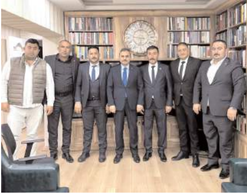
Ziyaretin sonunda toplu hatıra fotoğrafı çekildi.