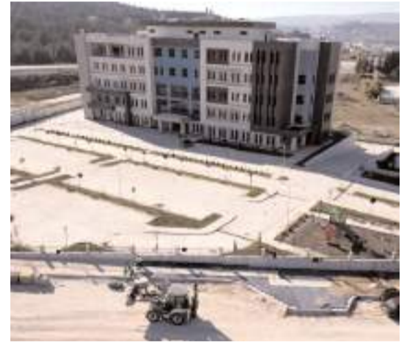
Çorum Belediyesi hastaneye ulaşımı sağlayan yolları yapıyor.