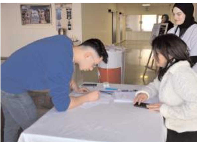
Programın sonunda organ bağışı talepleri alındı.