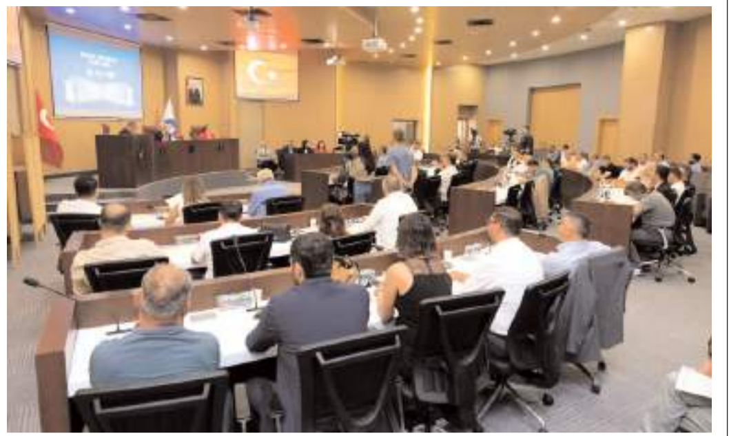
Toplantıda gündem maddeleri görüşülerek karara bağlanacak.

Samsun İl Kültür ve Turizm Müdürlüğü tarafından, Bafra ilçesinin 24 kilometre güneyinde, Asar Mahallesi'nin 3 km batısında Helenistik döneme ait önemli bir yerleşim merkezi olan Asarkale'de geçen aylarda kazı çalışmaları başlatıldı. Kazının ilk gününden itibaren, buranın çok önemli bir medeniyet merkezi olduğu anlaşıldı. (İHA)