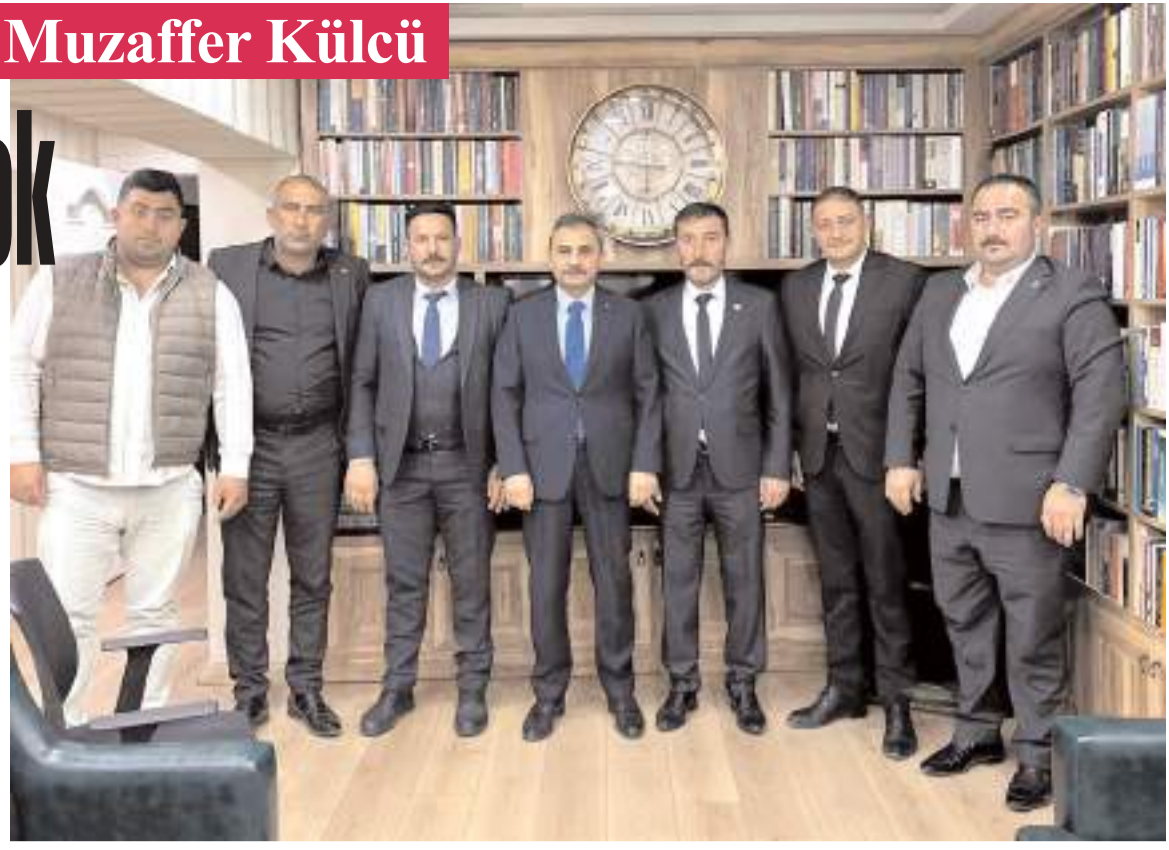
Ziyaretin sonunda toplu hatıra fotoğrafı çekildi.