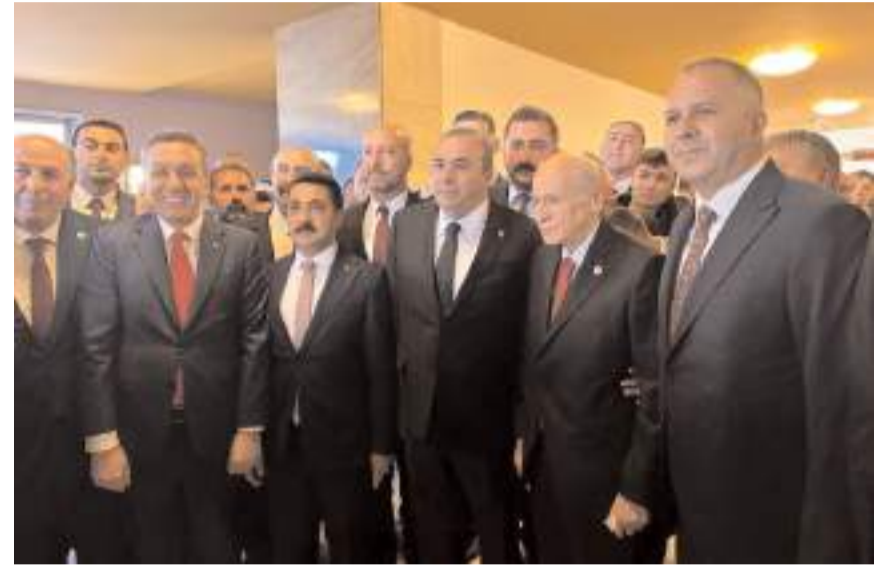
MHP heyeti Genel Başkan Devlet Bahçeli ile hatıra fotoğrafı çekindi.