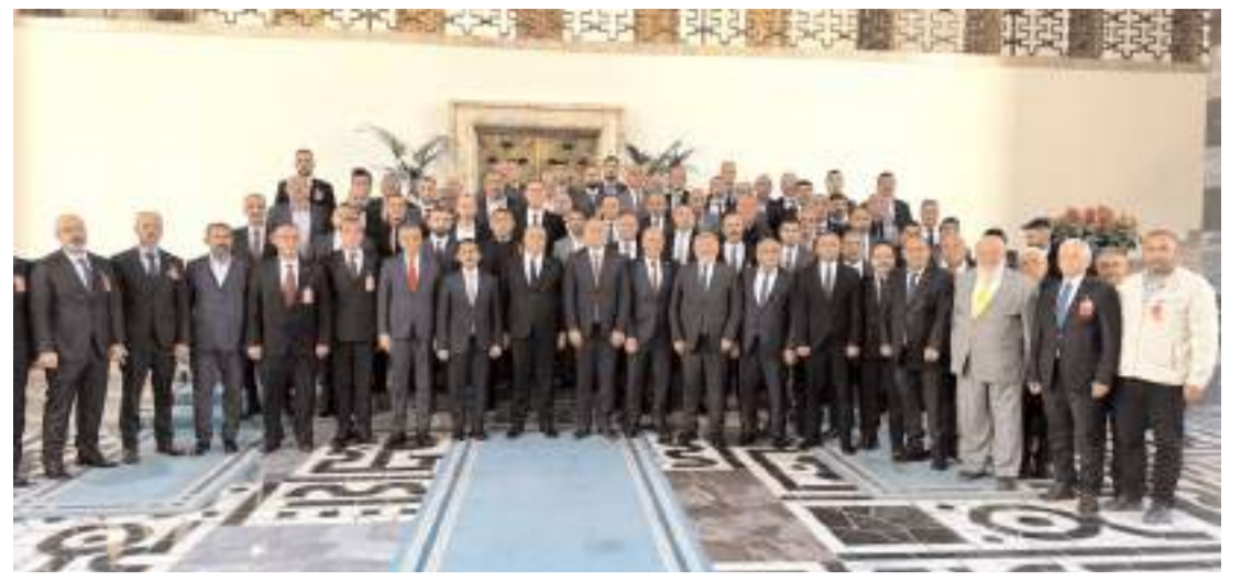
MHP Sungurlu İlçe Teşkilatı Türkiye Büyük Millet Meclisine çıkarma yaptı.