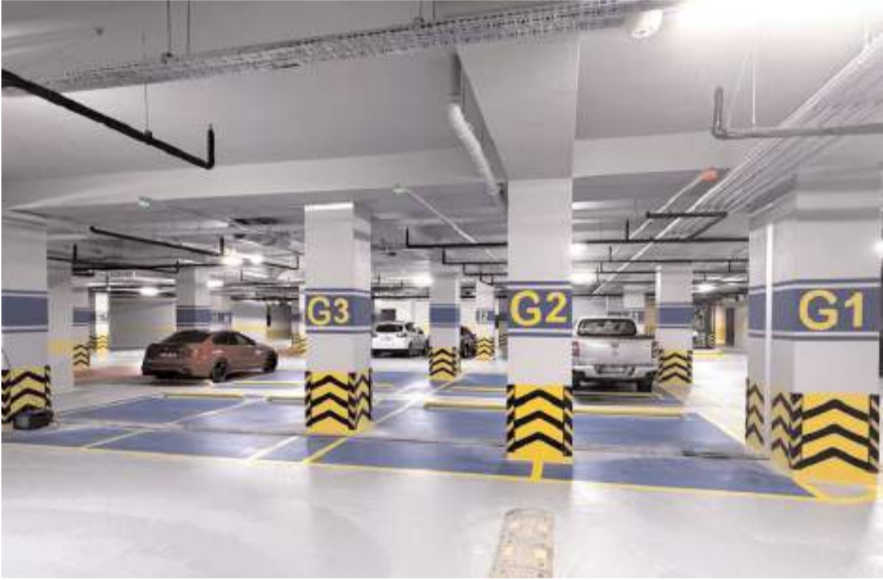
2 katlı olan otopark 221 araç kapasitesine sahip.

20 Kasım'a kadar ücretsiz olarak hizmet verecek olan otoparka gelen araç sahipleri memnuniyetlerini dile getirdiler. Otoparkta, elektrikli otomobiller için şarj istasyonları, engelli araç park alanları ve motosikletler için park alanları da bulunuyor. (Haber Merkezi)