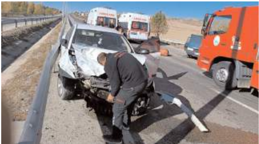
Kaza, Sungurlu-Çorum karayolu 4. kilometresinde meydana geldi.

Kazayla ilgili inceleme başlatıldı. (İHA)