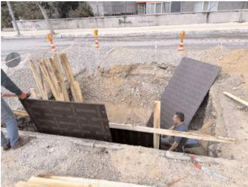
Çorum Belediyesi şehrin farklı yerlerine Depo, Ölçüm ve İzole Savaş Bölgesi (DMA) kuruyor.

İzole alt bölge oluşturulması şehrimizde bulunan içme suyu depolarımızı su dağıtımında daha küçük, yönetilebilir bölgelere ayırarak her bir bölgenin su tüketimini ve basıncını izlemeye olanak tanıyan bir yöntemdir. Oluşturulacak izole alt bölgelere suyun akış hızı ve miktarını ölçen debimetre sistemleri entegre edilecek. Gece saatlerinde 02.00 ile 04.00 arası yapılan debi ve ba-