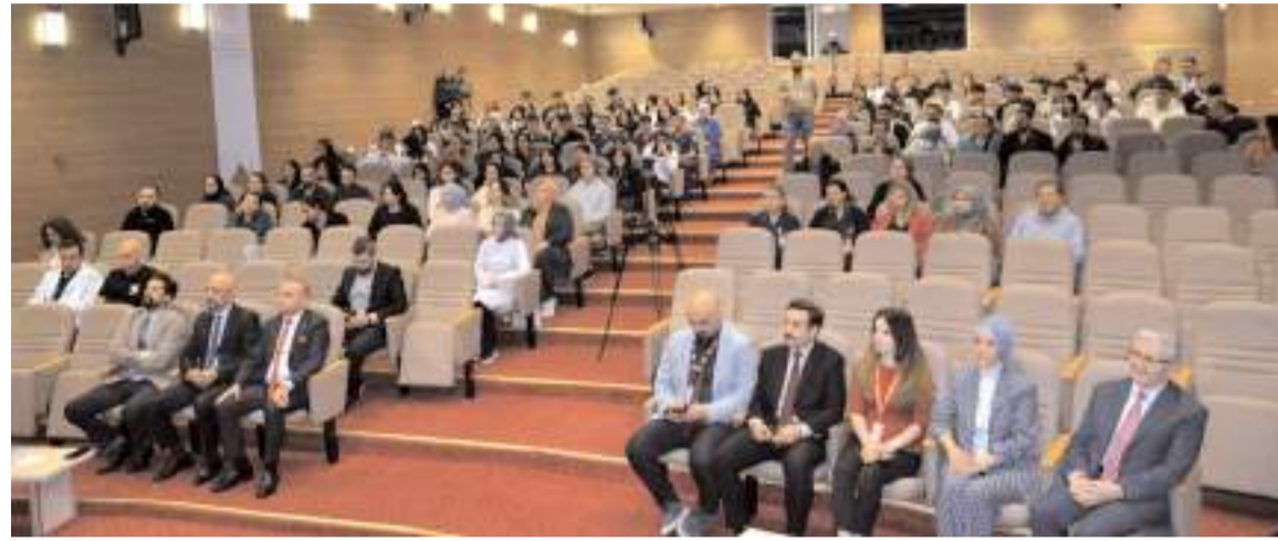
Programda organ bağışının önemine ve dini/manevi yönlerine değinildi.