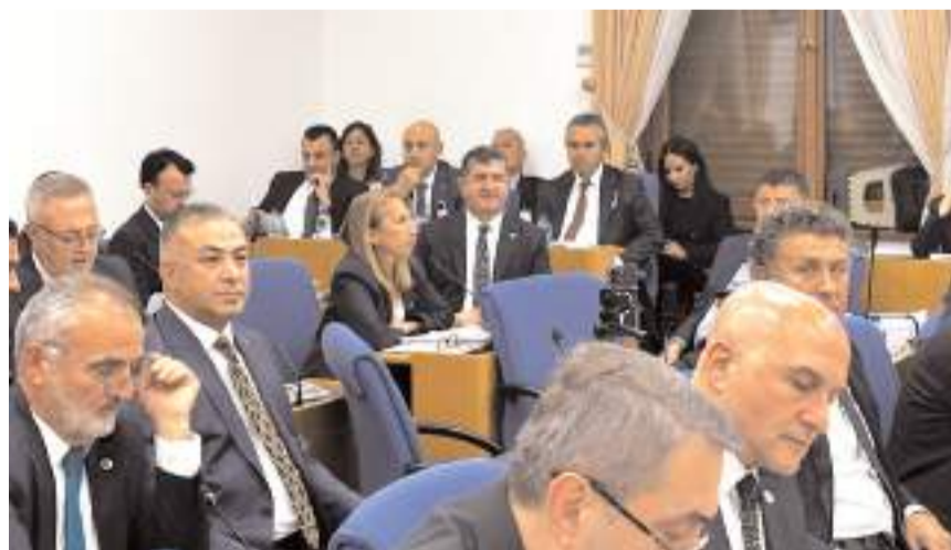
CHP Çorum Milletvekili Mehmet Tahtasız, TBMM Plan ve Bütçe Komisyonu'nda Tarım ve Orman Bakanlığının bütçe görüşmelerine katıldı.

■ TBMM Plan ve Bütçe Komisyonu'nda Tarım ve Orman Bakanlığının 2025 yılı bütçe görüşmelerinde konuşan CHP Çorum Milletvekili Mehmet Tahtasız, iktidara rağmen Çorumlu çiftçi ve sanayicinin ürettiğini ama hak ettiği yatırımları alamadığını belirtti. * HABERİ'4'DE