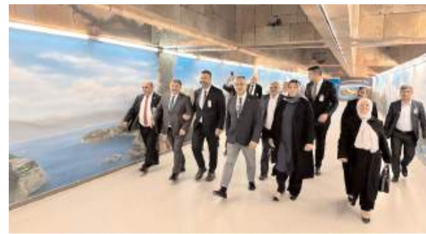
Milletvekili Yusuf Ahlatcı, heyetle birlikte Meclisi gezdi.