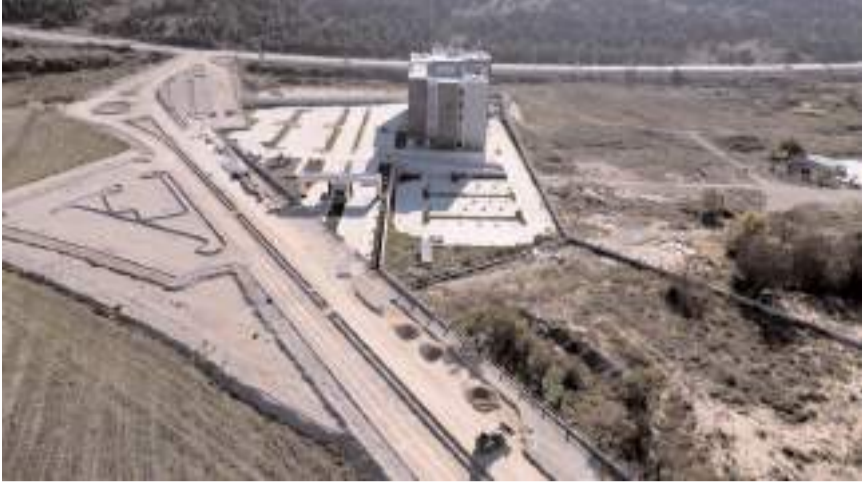
Diş Hastanesi Güney Kampüse yapıldı.