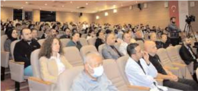
Programa katılım yüksek oldu.