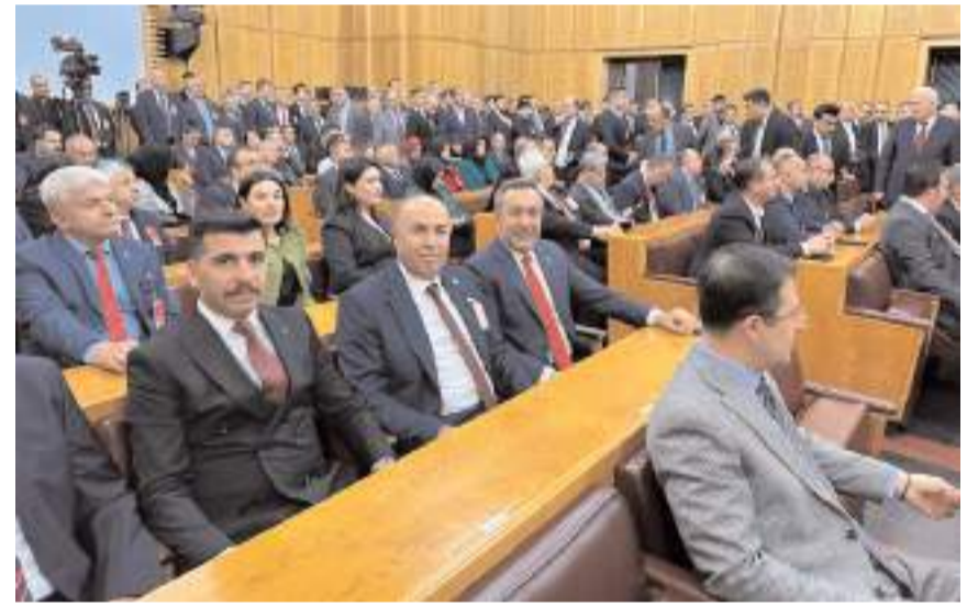
Heyet, MHP grup toplantısına katıldı.