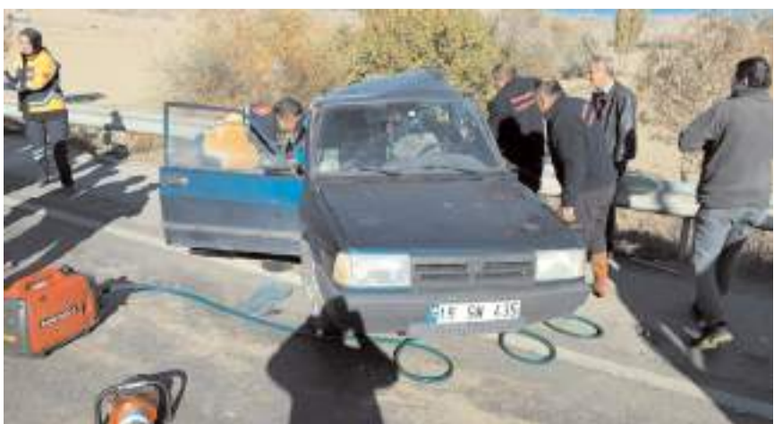
Olay yerine gelen itfaiye ekipleri tarafından araçtan çıkartılan yaralıları, sağlık ekiplerine teslim edildi.