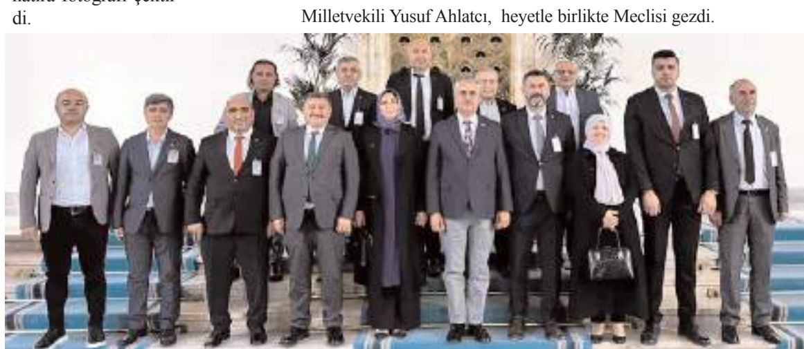
Heyet, TBMM'de hatıra fotoğrafı çekindi.