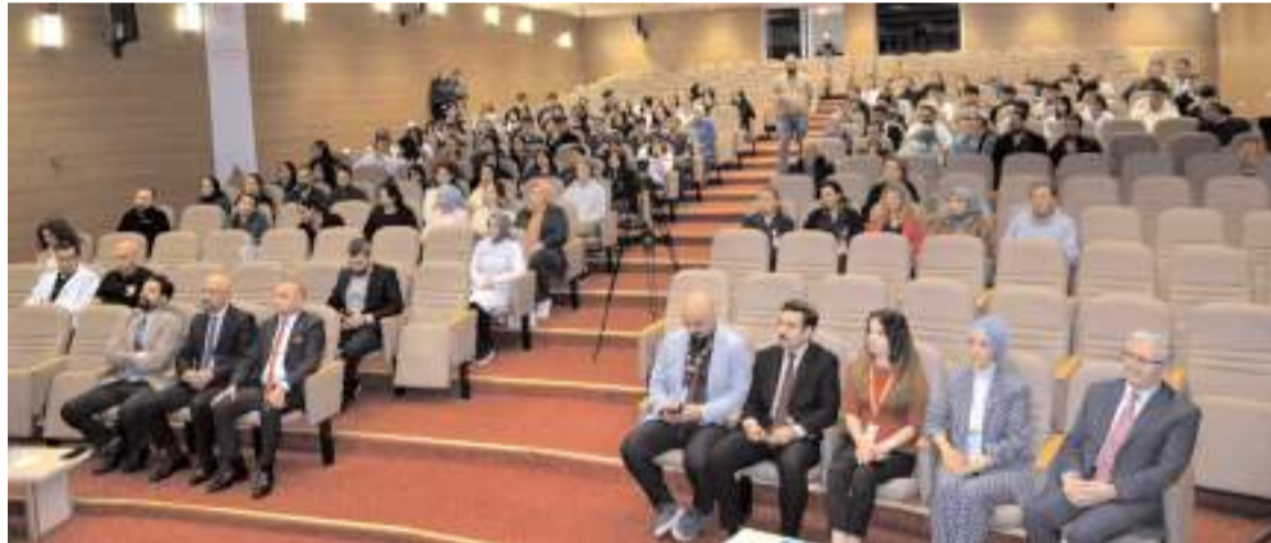
Programda organ bağışının önemine ve dini/manevi yönlerine değinildi.