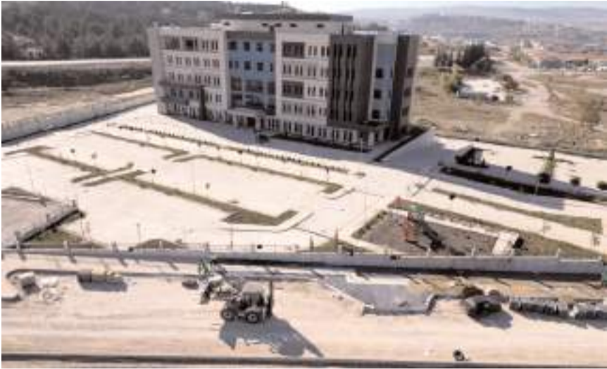
Çorum Belediyesi hastaneye ulaşımı sağlayan yolları yapıyor.