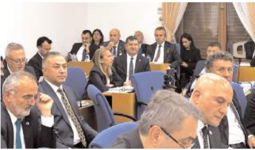
CHP Çorum Milletvekili Mehmet Tahtasız, TBMM Plan ve Bütçe Komisyonu'nda Tarım ve Orman Bakanlığının bütçe görüşmelerine katıldı.