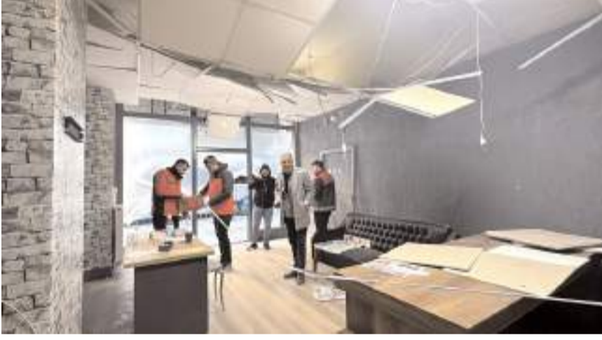
Çorum Belediyesi ekipleri hasar tespit çalışmalarını sürdürüyor.

Osmancık Caddesi üzerinde yer alan bir dairede geçtiğimiz hafta sonu yaşanan patlamanın ardından birçok ev ve iş yeri zarar gördü. Çorum Belediyesi Afet İşleri Müdürlüğü ekipleri daire ve iş yerlerini tek tek gezerek hasar tespit çalışmalarını sürdürüyor. Gelen tüm müracaatları dikkate alan ekipler patlamanın meydana geldiği bina çevresindeki işyeri ve meskenlerde incelemelerde bulunurken hazırlanan rapor komisyon tarafından değerlendirilecek.