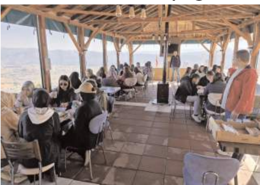
KADEM ile Genç Kültür ve Demokrasi Kulübü gençleri ile bir araya geldi.

İsbir, Ortaköy'de sivil toplum kuruluşları ile genç arkadaşları Ortaköy'de görmekten duyduğu mutlu dile getirerek, ilçeye ilginin arttığını söyledi. (Haber Merkezi)