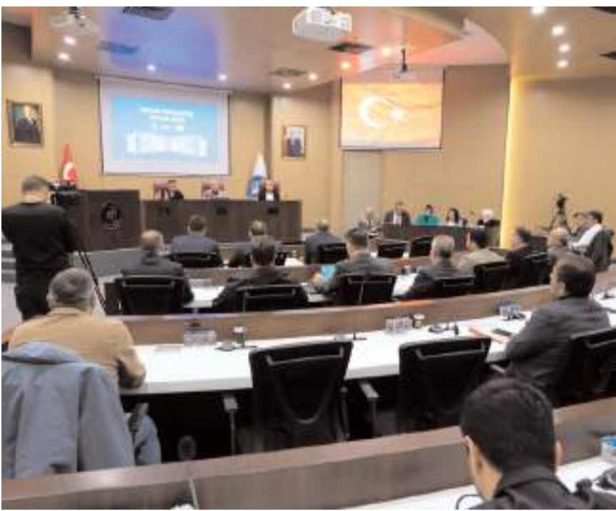
Çorum Belediye Meclisinin Kasım ayı toplantısı yapıldı.

■ Çorum Belediye Meclisinin Kasım ayı toplantısı yapıldı. Meclis Salonunda gerçekleştirilen toplantıda kayyum tartışması yaşandı. Gündem dışı yapılan konuşmalarda CHP Grubu ile AK Parti ve MHP Grubu arasında zaman zaman tansiyon yükseldi.