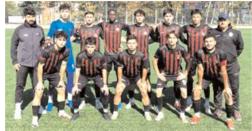
Çorum FK U 19 takımı bugün Karabük'te üç puan mücadelesi verecek