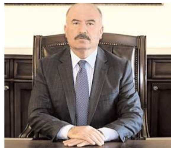
Çorum Valisi Ali Çalgan