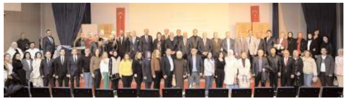
Öğretmen Akademileri Buhara Kültür Merkezi'nde yapılan açılış programı ile başladı.