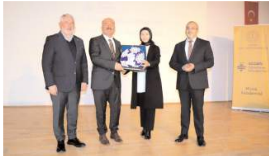
Öğretmen Akademisine katkılarından dolayı Vali Çalgan'a plaket takdim edildi.