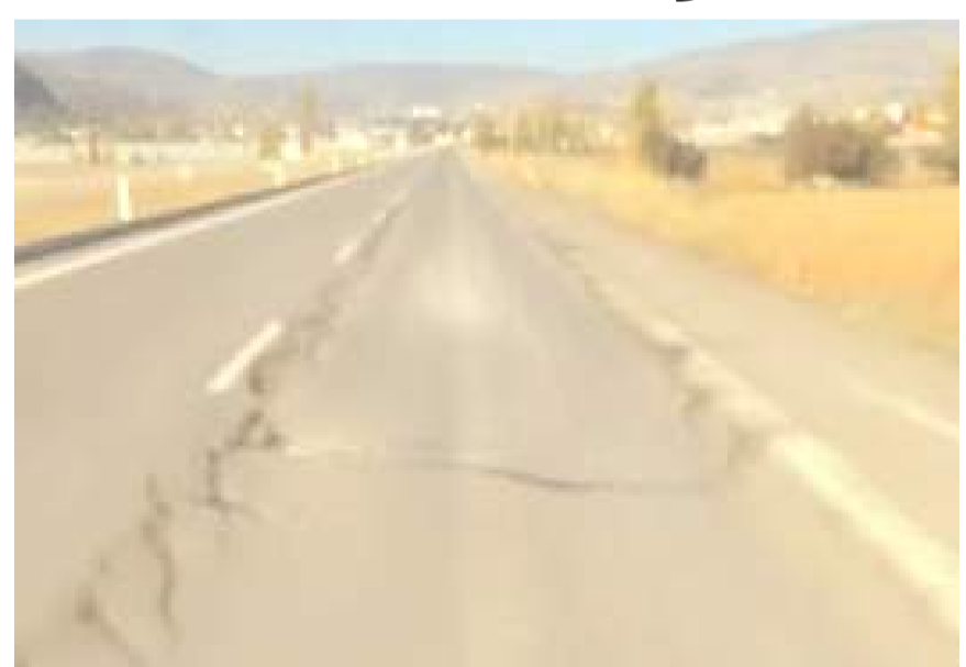
Çorum-İskilip yolu yeni yapılmasına rağmen şimdiden çökmeler meydana geldi.

Vatandaşlar yolun neden çöktüğünün araştırılarak ilgili firma hakkında gereğinin yapılmasını istedikler. (Haber Merkezi)