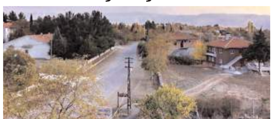
Arsaların muhammen bedelleri 20 bin ile 250 bin arasında değişiyor.

Arsaların satış ihalesi Malmüdürlüğü Hizmet Binasında Laçın Milli Emlak Şefliğinde ayrı sırasıyla ihalesi yapılacaktır.