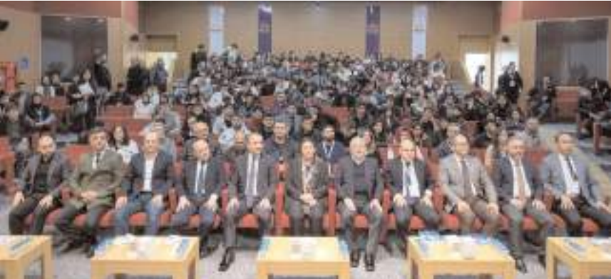
Program Meslek Yüksekokulları Kampüsü Ethem Erkoç Konferans Salonunda yapıldı.