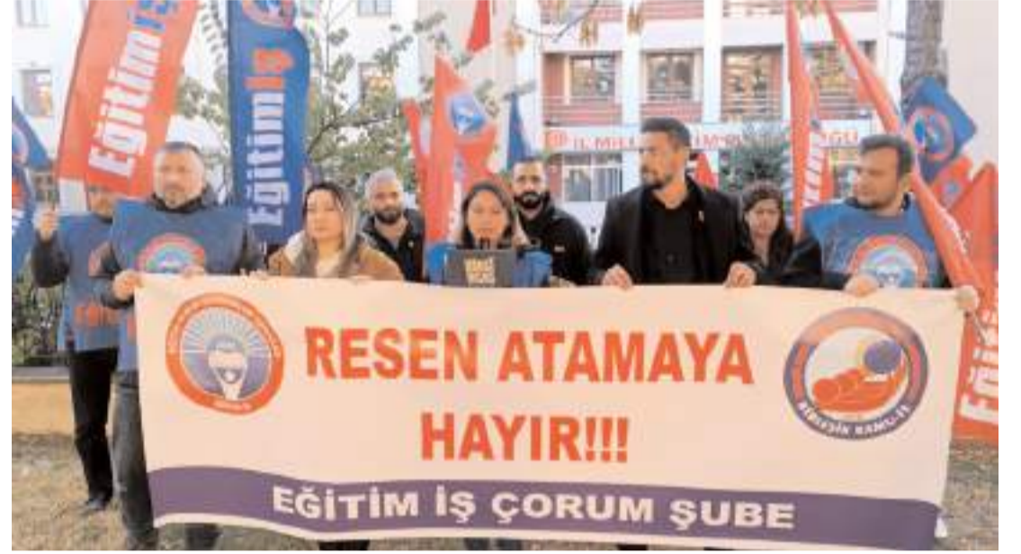
Eğitim-İş Çorum Şubesi Milli Eğitim Müdürlüğü önünde eylem yaptı.

Merhumun cenazesi dün Akşemseddin Camii'nde Cuma namazından sonra kılınan cenaze namazının ardından Ulumezarlık'ta toprağa verildi.