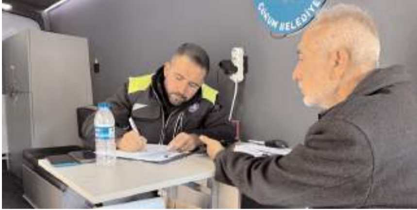
Hazırlanan rapor komisyon tarafından değerlendirilecek.