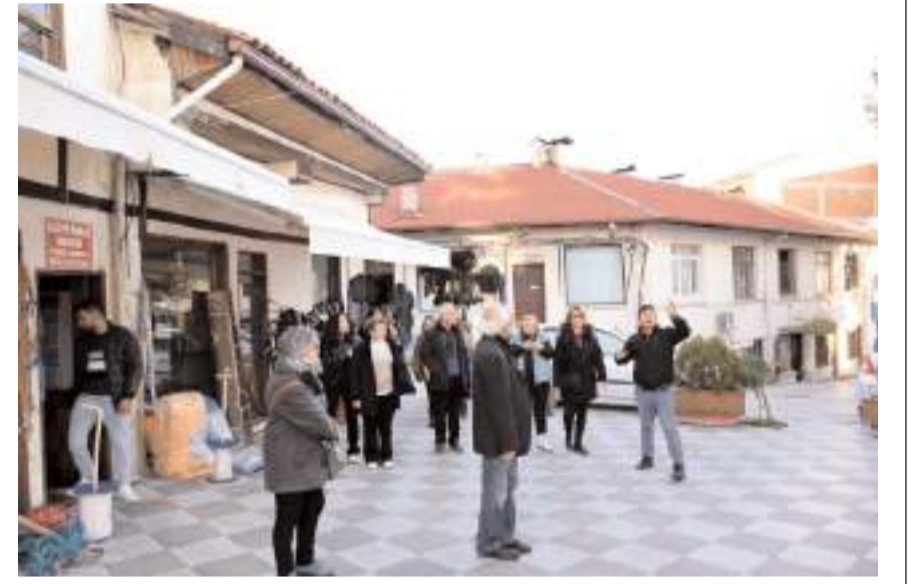
Sanatçılar İskilip'i gezerek ilçe hakkında bilgi aldılar.