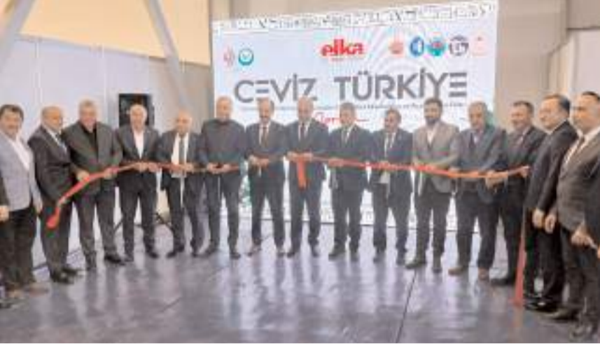
Fuarın açılış kurdelesini kesilirken...

Açılış konuşmalarının ardından protokol üyeleri fuarı gezerek, fuarda yer alan tarım makineleri ve ekipmanları ile ilgili bilgi aldı. Fuarda çiftçiler için birçok yeni teknoloji ve uygulama tanıtılıyor. Traktörlerden, hasat makinelerine ve tarımda kullanılan el aletlerine kadar birçok ekipmanın yer aldığı fuar, 10 Kasım'a kadar ziyaretçilere açık olacak.