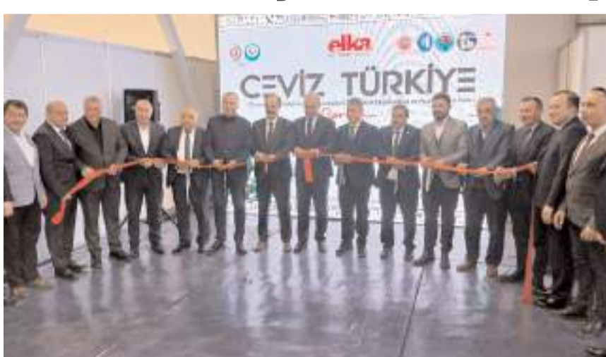
Fuarın açılış kurdelesini kesilirken...

■ Çorum'da bu yıl ilk defa düzenlenen 1. Çorum Ceviz Yetiştiriciliği Teknolojileri Tarım Alet Ekipmanları ve Pazarlama Fuarı kapılarını ziyaretçilerine açtı.