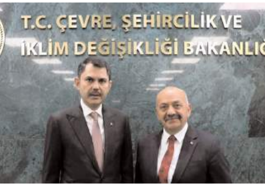
Ortaköy Belediye Başkanı Taner İsbir, Bakan Kurum ile birlikte...