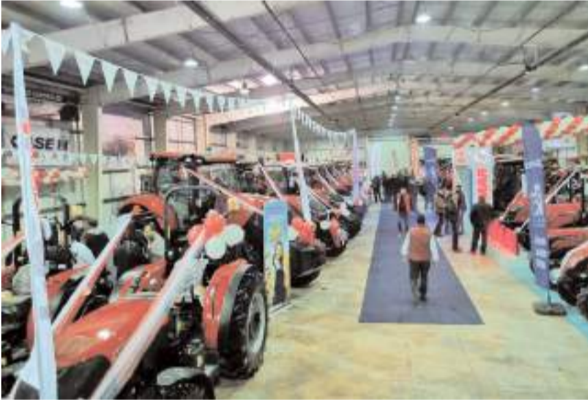
Fuara Çorum ve şehir dışından çok sayıda firma katıldı.