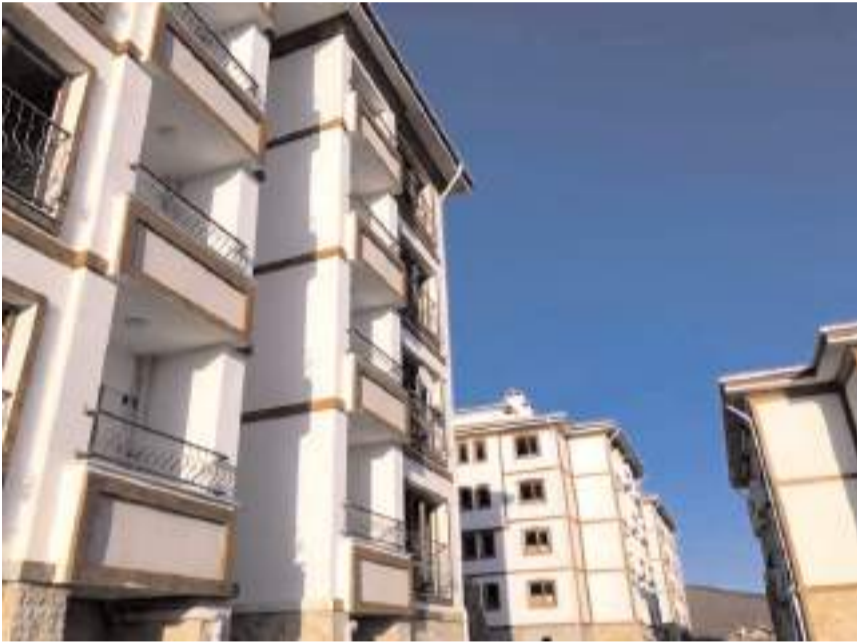
Ortaköy 67 konutlu proje 15 Ocak 2025 tarihinde ihale edilecek.

Ortaköy İlçesinde gerçekleştirilecek olan TOKİ konut projesi 4. kez ihaleye çıkıyor.