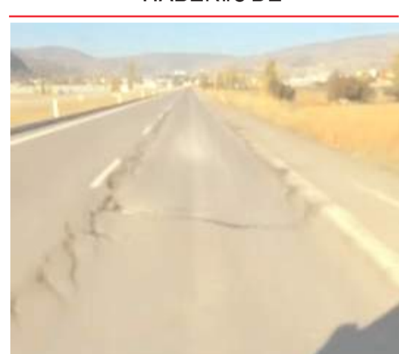
Çorum-İskilip yolu yeni yapılmasına rağmen şimdiden çökmeler meydana geldi.