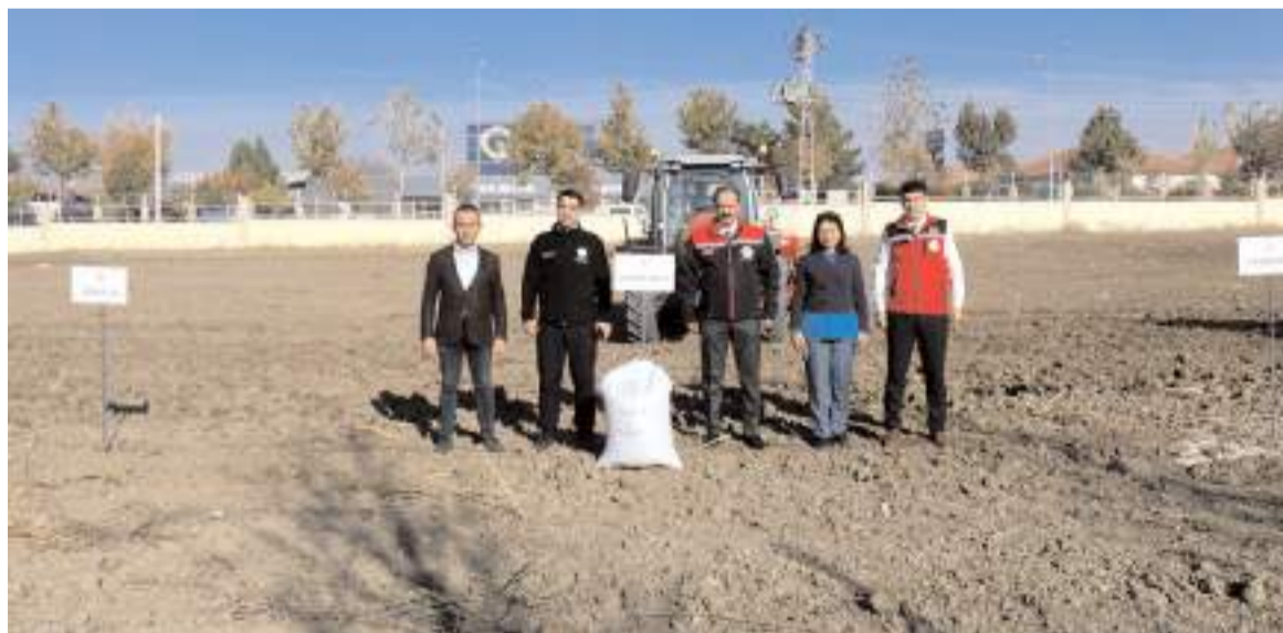
4 farklı bölgede arpa ve buğday çeşitleri ekildi.

ATAMIZI SAYGIYLA, MİNNETLE ve ÖZLEMLE ANIYORUZ