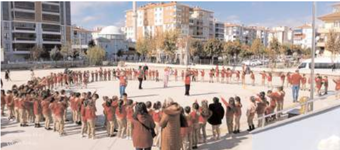
Programda oyunlar oynayan öğrenciler, boyama yaptı, şiirler okudu.