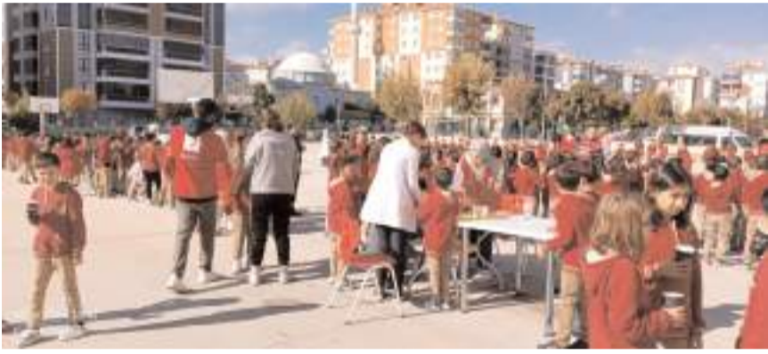
Etkinlikte Kızılay tarafından öğrenciler ve velilere çorba ikram edildi.