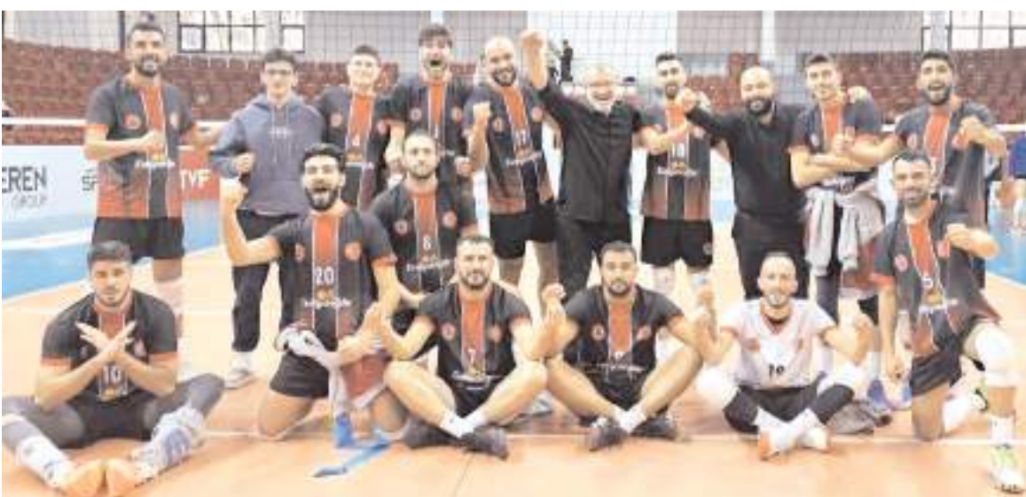
Sungurlu Belediyespor yarın Trabzon'da galibiyet arayacak