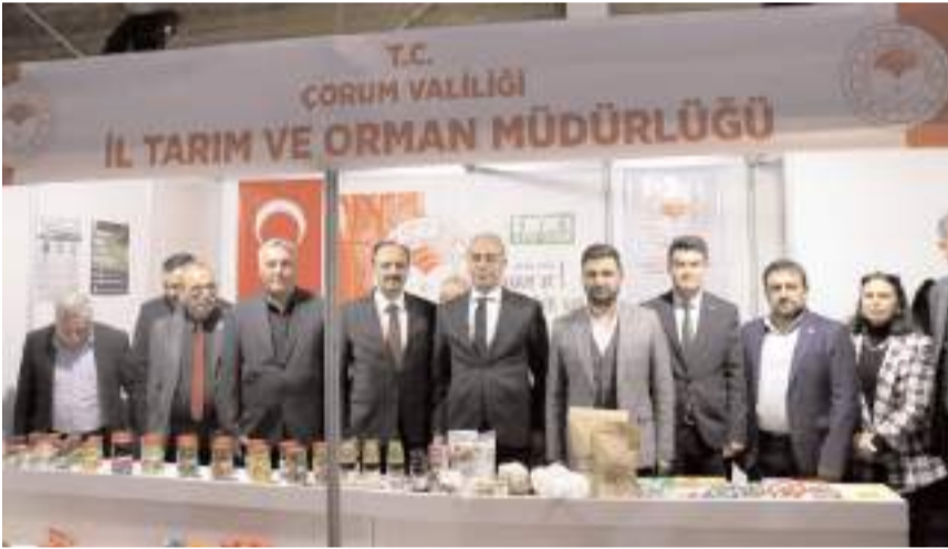
Protokol üyeleri fuarı gezdi.