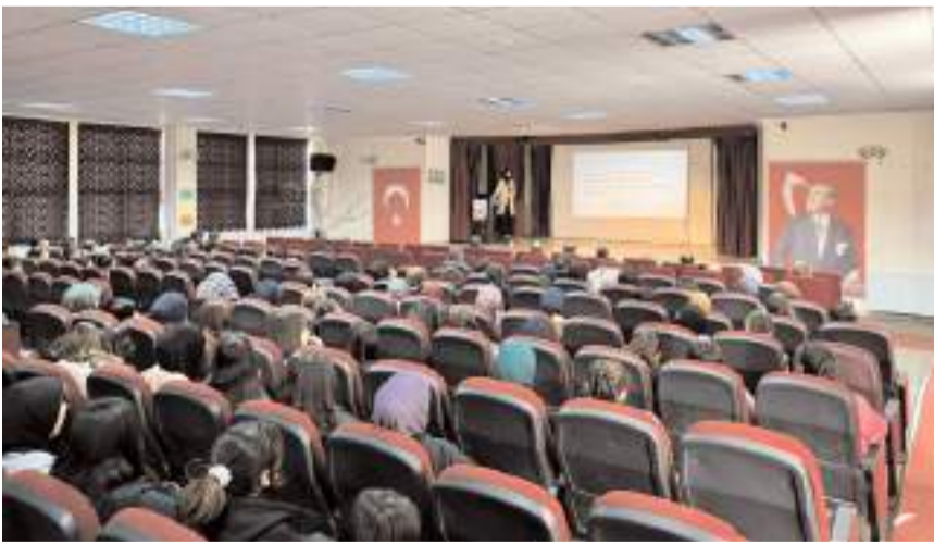
Program Şehit Yakup Kozan Anadolu İmam Hatip Lisesi'nde gerçekleştirildi.