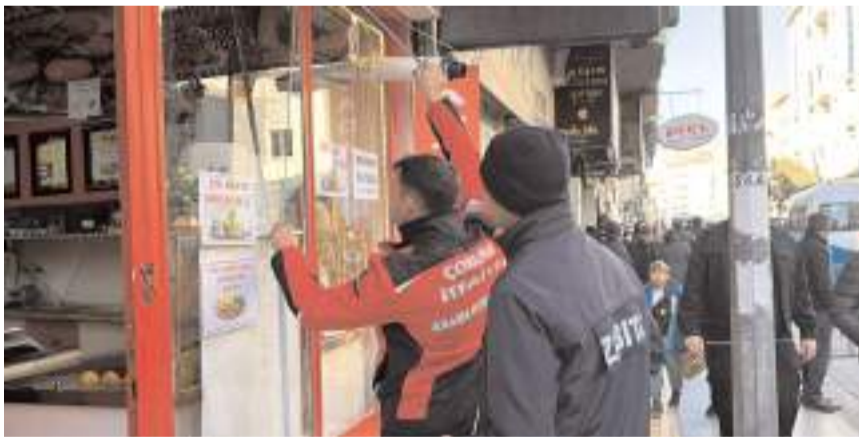
Gelen tüm müracaatları dikkate alan ekipler patlamanın meydana geldiği bina çevresindeki işyeri ve meskenlerde incelemelerde bulundu.

'55 ev ve işyerinde hasar tespit çalışması yapıldı'