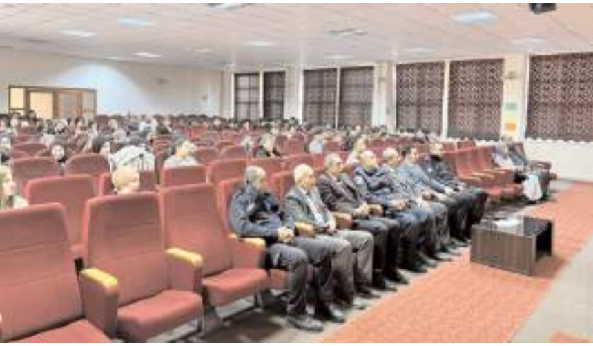
Öğrencilere organ bağışının önemi anlatıldı.