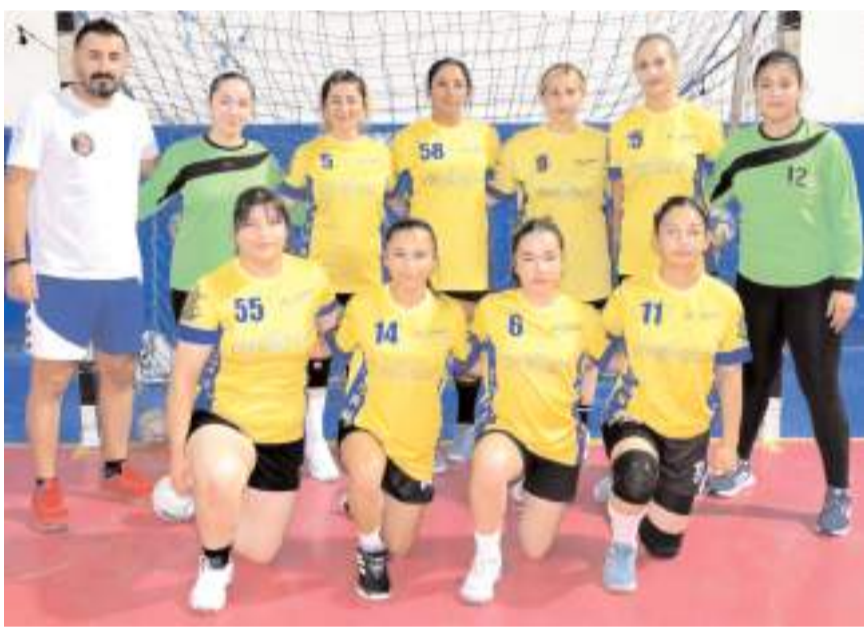
Çorum Gençlikspor Hentbol takımı ligdeki ilk maçında yarın DSİspor ile karşılaşacak