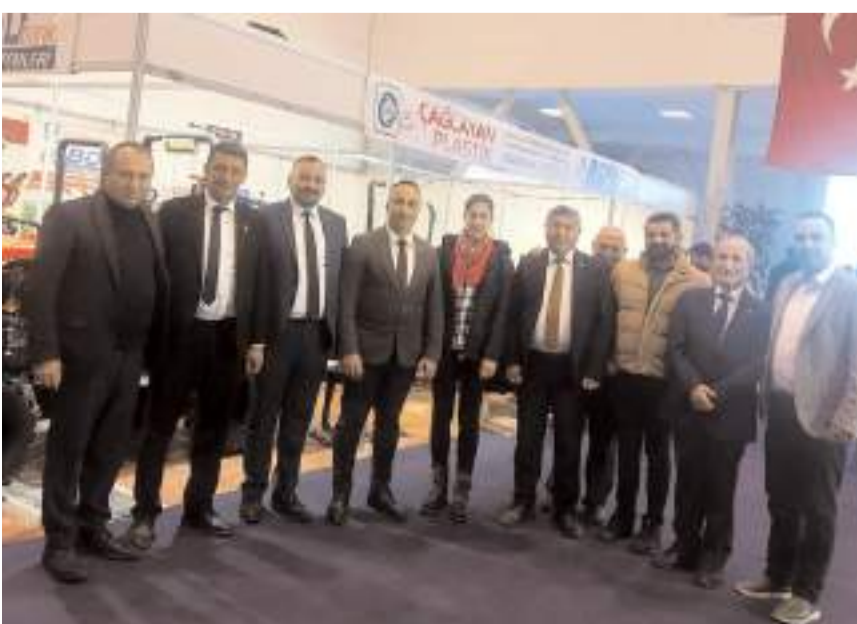
CHP'liler ceviz üreticilerinin sorun ve taleplerini dinledi.

Ceviz yetiştiriciliği alanında her türlü ürün, hizmet ve teknolojinin yanı sıra, tarımın her alanından traktör, tarım alet ve ekipmanların sergilenmesi fuar süresince, çeşitli eğitim ve toplantıları gerçekleştirilerek, sektördeki son gelişmeler, haberler ve teknolojilerin, profesyonel akademisyen ve önde gelen sektör yetkilileri tarafından ilgililere aktarılması sağlanacak. (Haber Merkezi)