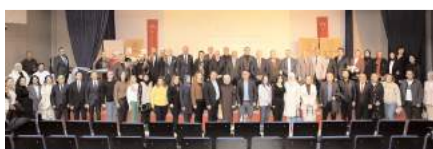
Öğretmen Akademileri Buhara Kültür Merkezi'nde yapılan açılış programı ile başladı.