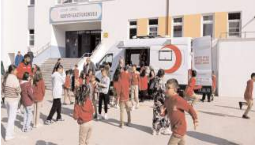
Ubeydi Gazi İlkokulu'nda Kızılay Haftası nedeniyle program düzenlendi.