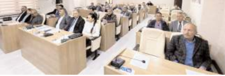
Toplantıda gündem maddeleri görüşülerek karara bağlandı.

zi hızlandıracak ve sürekli arızalardan kaynaklı olarak idaremize doğan külfetleri en aza indireceğiz.