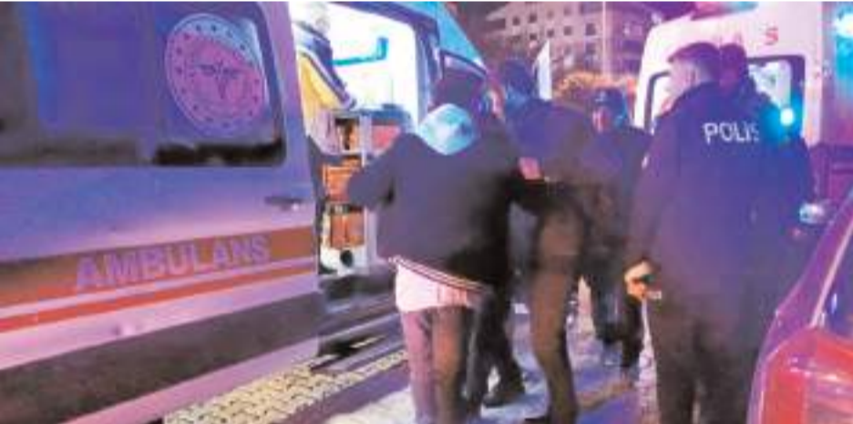
Olay, İlhan Gürel Caddesi üzerinde bir kafede meydana geldi.

Çorum'da bir kafede çıkan kavgada 2 kişi yaralandı.