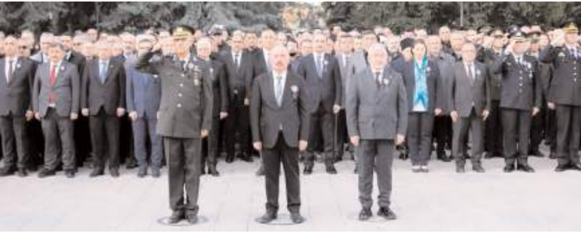
10 Kasım Atatürk'ü Anma Gününde ilk tören Atatürk Anıtında yapıldı.