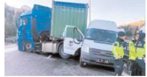
Kaza TEM Otoyolu'nun Kocaeli geçişinde meydana geldi.

■ OSMANCIK'ta ağaca çarptıktan sonra devrilen minibüsteki 1 kişi öldü, 5 kişi yaralandı. * HABERİ 7'DE