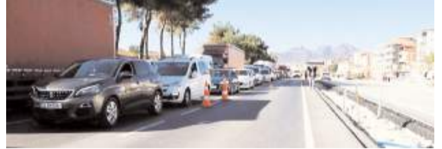
Karayolunun her iki yönünde de uzun araç kuyrukları oluştu.

sajınızı verdiniz, biz sizleri anlıyoruz. Sizlerin söylediklerinizin doğru olduğu kanaatindeyiz. Belediye Başkanımızla birlikte Bölge Müdürlüğüne gidip, mutlaka bir geçiş çalışmasının yapılması gerektiğini söyledik. Kendileri de bunu değerlendireceklerini beyan ettiler. Valimizin de bilgisi ve selamı var, kendisi ilgilenilecek. Demokratik hakkınızı kullanarak mesajını verdiniz. Bundan sonrası artık bizde. Bizlerde elimizden gelen görüşmeler yaparak konuyu en güzel şekilde neticelendirilmesini sağlayacağız" dedi.