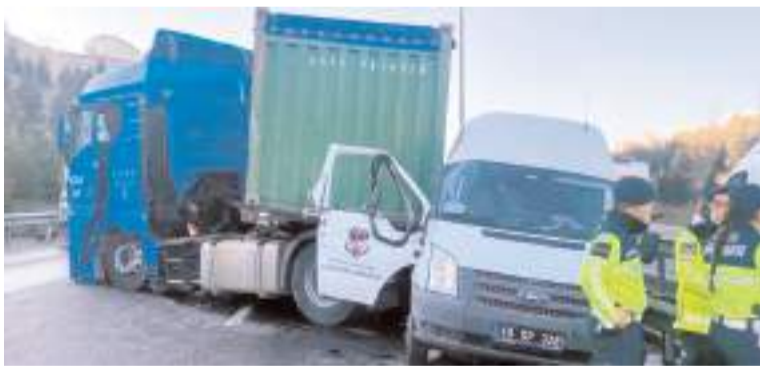
Kaza TEM Otoyolu'nun Kocaeli geçişinde meydana geldi.

Kaza ile ilgili inceleme başlatıldı. (İHA)