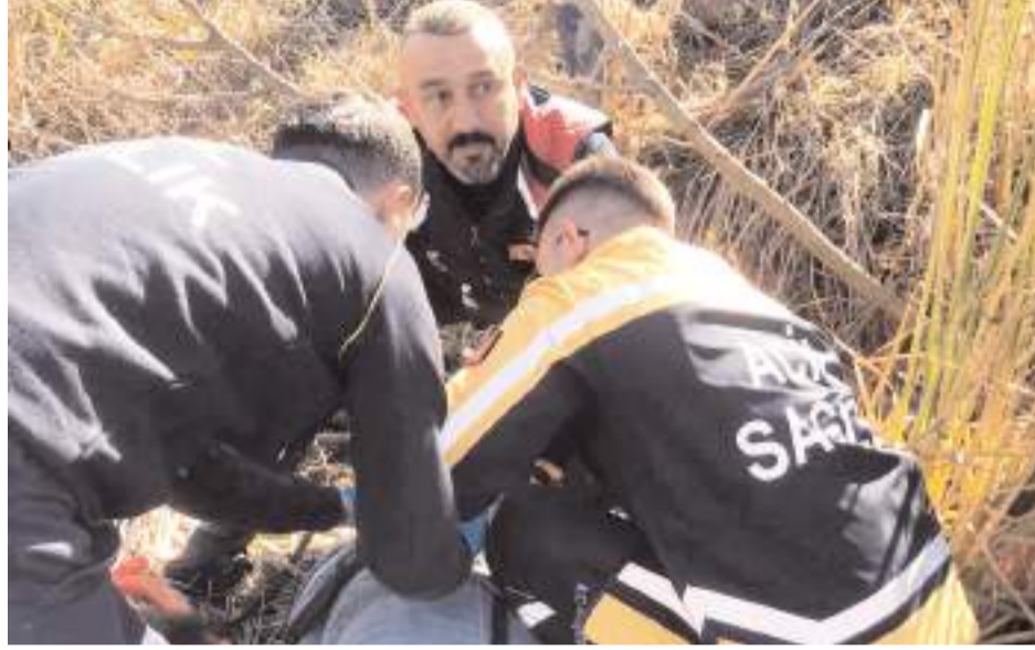
Yaralılara ilk müdahaleyi olay yerinde 112 acil sağlık ekipleri yaptı.