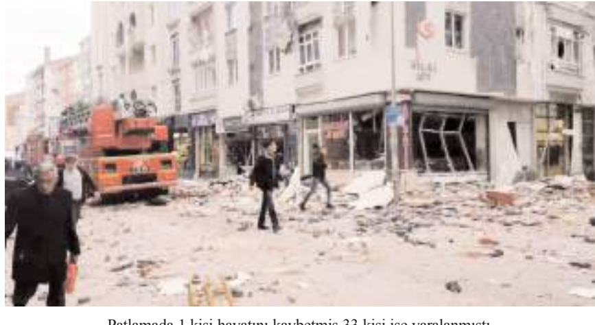
Patlamada 1 kişi hayatını kaybetmiş 33 kişi ise yaralanmıştı.

■ ÇORUMGAZ AŞ'den yapılan yazılı açıklamada, Osmancık Caddesinde bir binada meydana gelen patlamada hasar gören konut ve iş yerlerinden, 2 ay doğal gaz bedelinin alınmayacağı bildirildi. * HABERİ 2'DE