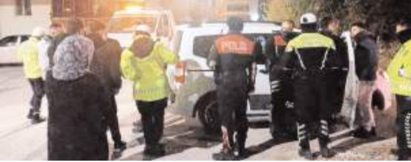
Araç Bayat Geddiği 26. Sokak'ta park halinde bulundu.