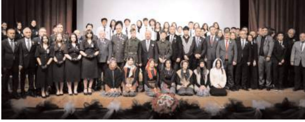
Devlet Tiyatro Salonunda yapılan programın sonunda hatıra fotoğrafı çekildi.

■ TÜRKİYE Cumhuriyeti'nin kurucusu Büyük Önder Gazi Mustafa Kemal Atatürk, ebediyete irtihalinin 86. yılında Çorum'da rahmet, minnet ve özlemlerle anıldı. * HABERİ 4'DE