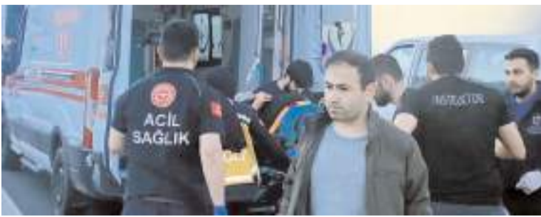
Yaralılar hastanede tedavi altına alındı.