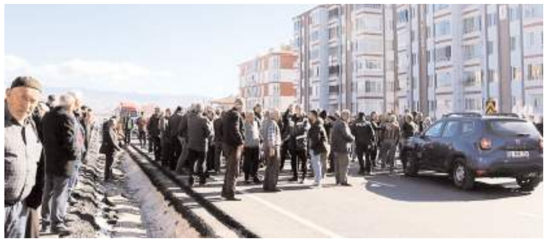
Yaklaşık 1 saat süren eylem olaysız şekilde sona erdi.

Araç polis ekiplerince çekici ile otoparka çekildi.