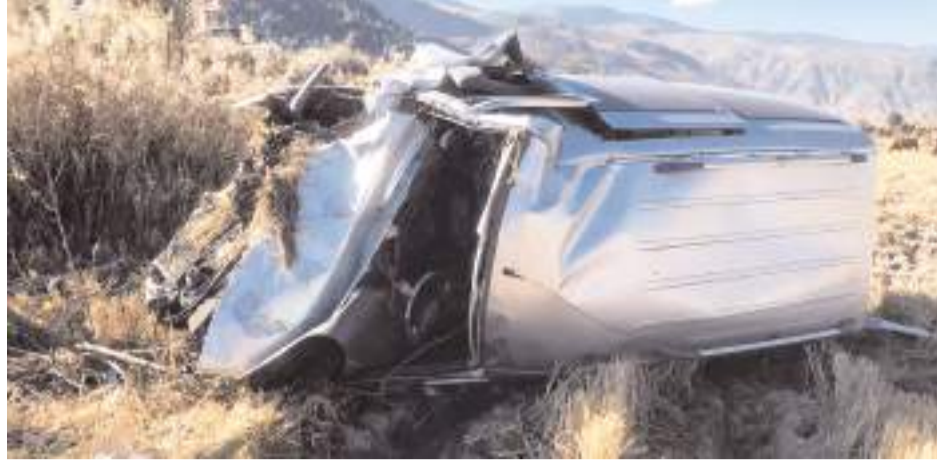
Kaza D100 kara yolu Karaköy mevkinde meydana geldi.