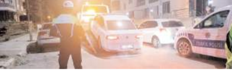
Araç polis ekiplerince çekici ile otoparka çekildi.

Çorum'da 16 yaşındaki ehliyetsiz sürücüye 62 bin 604 lira para cezası kesildi.