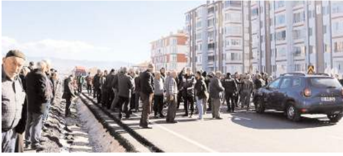
Yaklaşık 1 saat süren eylem olaysız şekilde sona erdi.

■ OSMANCIK'ta vatandaşlar D100-E80 Uluslararası kara yolunu trafiğe kapatıp eylem yaptı. D100-E80 Uluslararası kara yolunun da ölümlü kazaların yaşandığını belirten mahalle sakinleri yola yaya geçidi veya üst geçit yapılmasını istedi. * HABERİ 6'DA