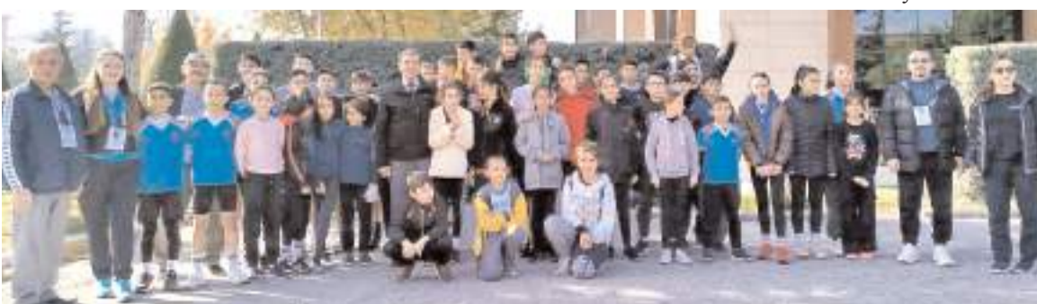
Atatürk Koşusunda kategorilerinde dereceye giren sporcular ödül töreni sonunda toplu halde kürsüde görüldü