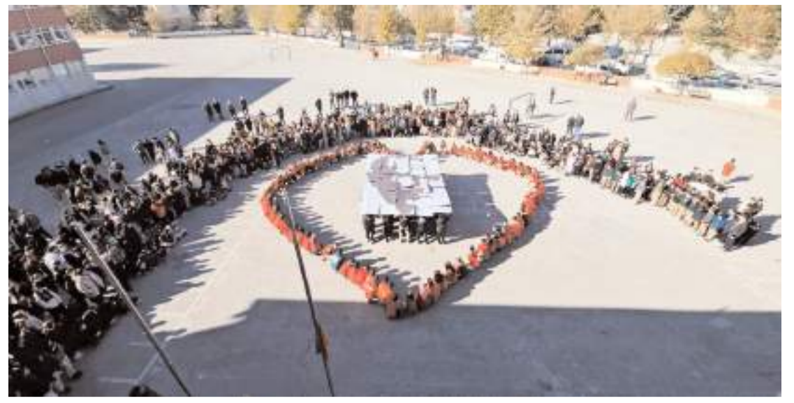
Mimar Sinan Ortaokulu öğrencileri okul bahçesinde "Atatürk" koreografisi oluşturdular.

tekrar musallat olmalarına asla izin vermememizi, O'nu anlamamızı istediğini yaşarken defalarca söylediğini biliyoruz. Bu bilinçle görevimizin; muasır medeniyet seviyesini aşmak ve Türk İstiklal ve Cumhuriyeti'ni her koşulda kurtarmak, ilelebet payidar kılmak olduğunu da biliyoruz. Atatürk'ün, gidişiyile yarattığı boşluk 86 yıldır doldurulamadı maalesef. Bunun nedeni süreçte kimilerinin içlerindeki devrim ateşinin sönməsi, kimilerinin izinde olduklarını söyleyerek yan gelip yatmaları, kimilerinin halk düşmanı politikalarını Atatürkçülük maskesi ile uygulamaları, kimilerinin Cumhuriyet Devrimini hiç anlamamış olmaları, kimilerinin de emperyalizm güdümünde ilkelerine, devrimlerine, eserlerine, kişiliğine, anısına pervasızca saldırıp karşı devrim değerlerine su taşımalarıdır. Atatürk'ü anlamayı, ilke, devrim ve eserlerini koruyup yaşatmayı varlık nedeni ve temel görevi sayan Atatürkçü Düşünce Derneği olarak, Büyük Atatürk'ü ebedi yaşama geçişinin 86. yılında da özelem ve minnetle anıyor, bir kez daha siyaset kurumunu "Yeniden Atatürk Cumhuriyeti" hedefine yönelmeye, aziz milletimizi de bu hedefe sahip çıkması çağırıyoruz. Ruhunuz şad, ışıklar yoldaşınız olsun Atatürk." (Haber Merkezi)