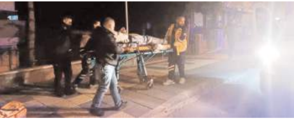
Yaralılar hastanede tedavi altına alındı.