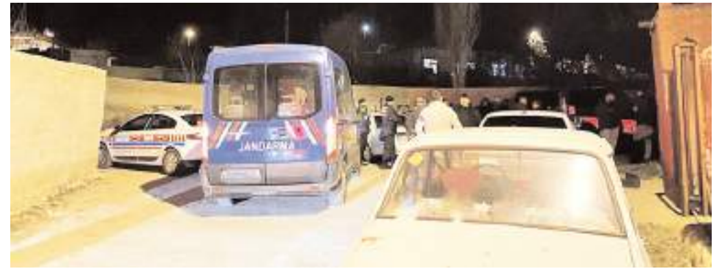
Olay Çıkrık Köyü'nde meydana geldi.