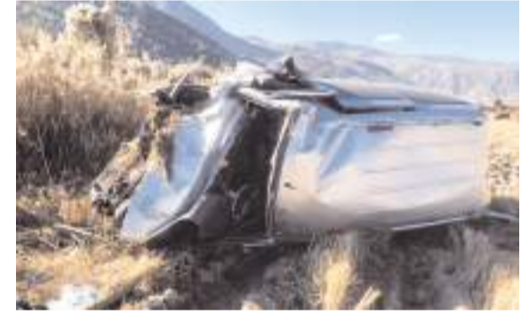
Kaza D100 kara yolu Karaköy mevkinde meydana geldi.

■ ÇORUM'da 16 yaşındaki ehliyetsiz sürücüyeye 62 bin 604 lira para cezası kesildi. * HABERİ 6'DA