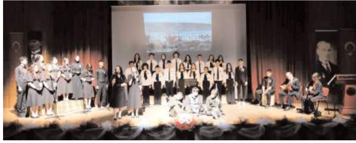
Devlet Tiyatro Salonunda Atatürk Oratoryosu sahnelendi.