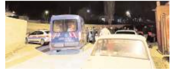
Olay Çıkrık Köyü'nde meydana geldi.

■ ÇORUM'dan yola çıkan cezaevi aracının tir ile bariyer arasında sıkıştığı kazada 1 mahkum ve 4 jandarma personeli yaralandı. * HABERİ 7'DE