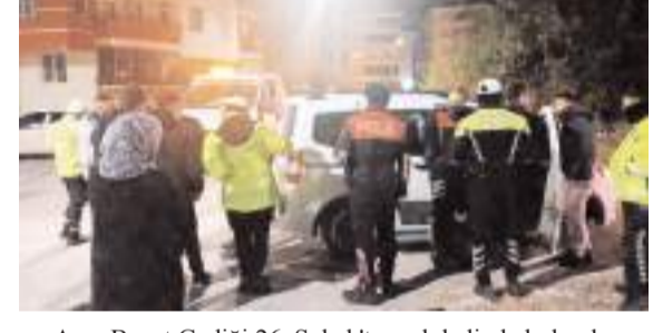
Araç Bayat Gedigi 26. Sokak'ta park halinde bulundu.