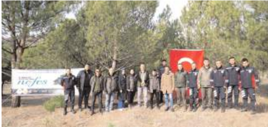
Fidan dikimine katılan ekipler Türk bayrağı ile böyle poz verdi.