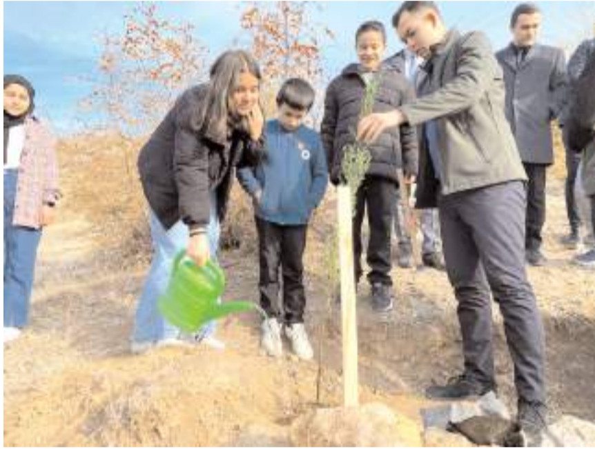
Öğrenciler diktikleri fidanları suladı.