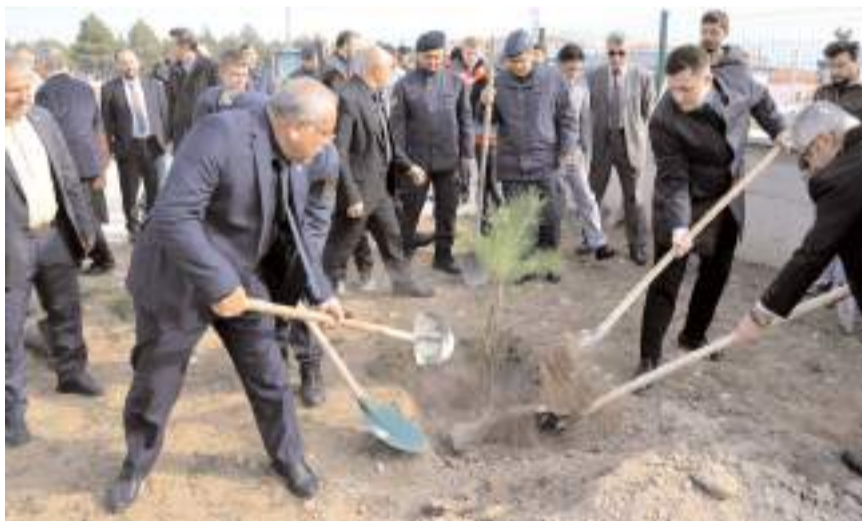
İlçe protokolü etkinliklere yoğun ilgi gösterdi.