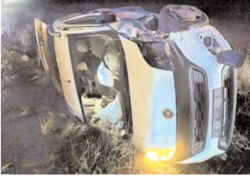
Otomobil ile hafif ticari aracın çarpışması neticesinde 7 kişi yaralandı.

Çorum'da meydana gelen trafik kazasında otomobil ile hafif ticari aracın çarpışması neticesinde 7 kişi yaralandı.