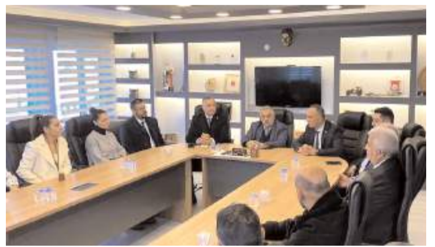
Ziyarete Çorum esnafının sorunları ve talepleri görüşüldü.