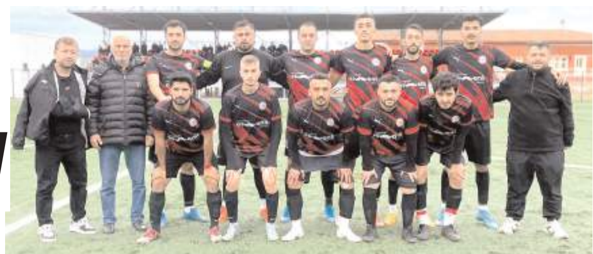
Buharaspör Mecitözü deplasmanında gol düellosunu kazanarak ilk iki yarışına devam ettirmeyi başardı