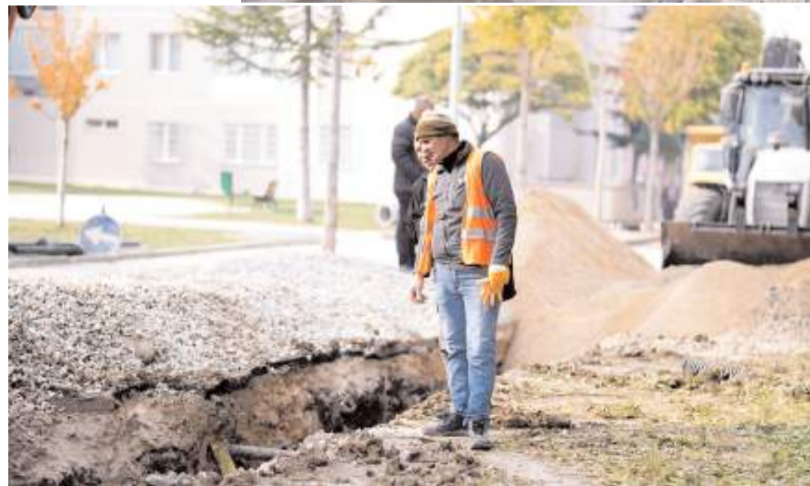
Çalışma Mimar Sinan Mahallesi 4. Cadde'de yapılıyor.