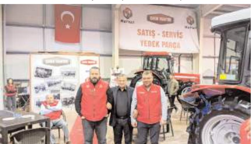
Uzun, fuara katılan üyelerle fotoğraf çekti.

Çorum'da bu yıl ilk düzenlenen, Türkiye'de dördüncüsü olma özelliği taşıyan Ceviz Türkiye Fuarı yoğun ilgi gördü.