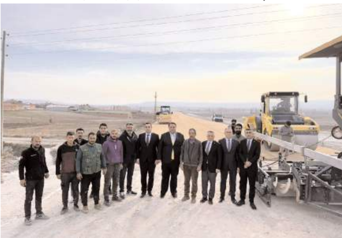
4.2 kilometre uzunluğundaki çevre yolunda çalışmalar devam ediyor.