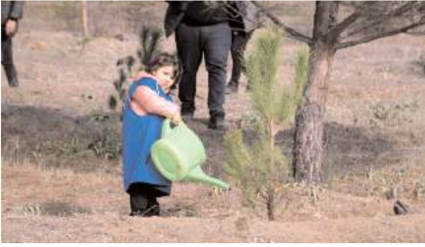
Minik bir ağaçsever diktği fidanı sularken...