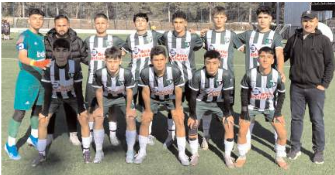
Anadolu FK grubunda sekizinci maçında kazanarak bu kategorideki iddiasını final grubu öncesinde ortaya koydu