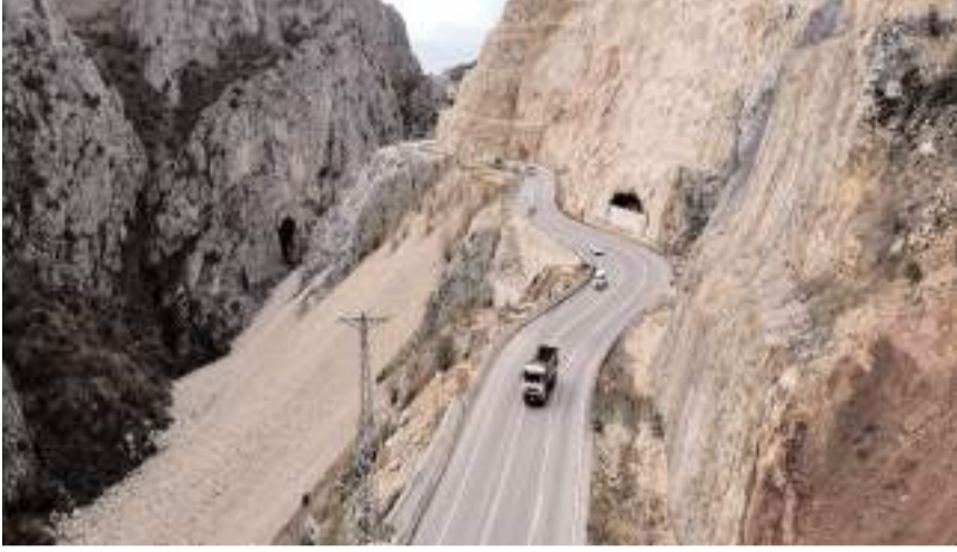
Kırkdilim'de çalışmalar devam ediyor.