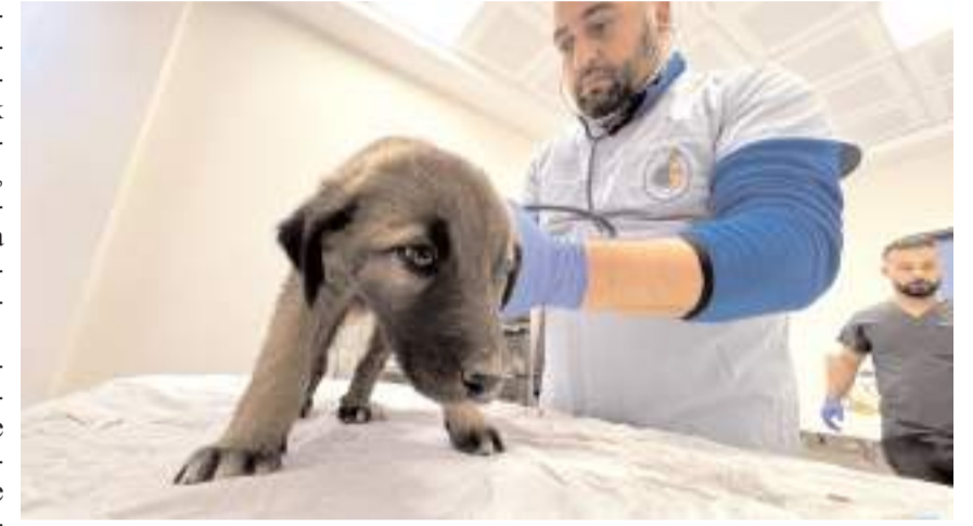
Hastalanan sokak köpeğine veteriner hekimler müdahale ederken..

Merkezde hayvanların kan tahlillerini yapabildiklerini, röntgenlerini çekebildiklerini aktaran Günhan, "Gelen hastanın durumuna göre tedavi uygulanıyor. Hayvan yaralıysa yararının tedavisini yapıyoruz. Daha sonra farklı bulgular varsa laboratuvarında kan tahlillerini yapıyoruz. Kırık, çıkık durumları için röntgenlerini çekiyoruz ve buna göre bir tedavi protokolü uyguluyoruz. Ameliyathane-