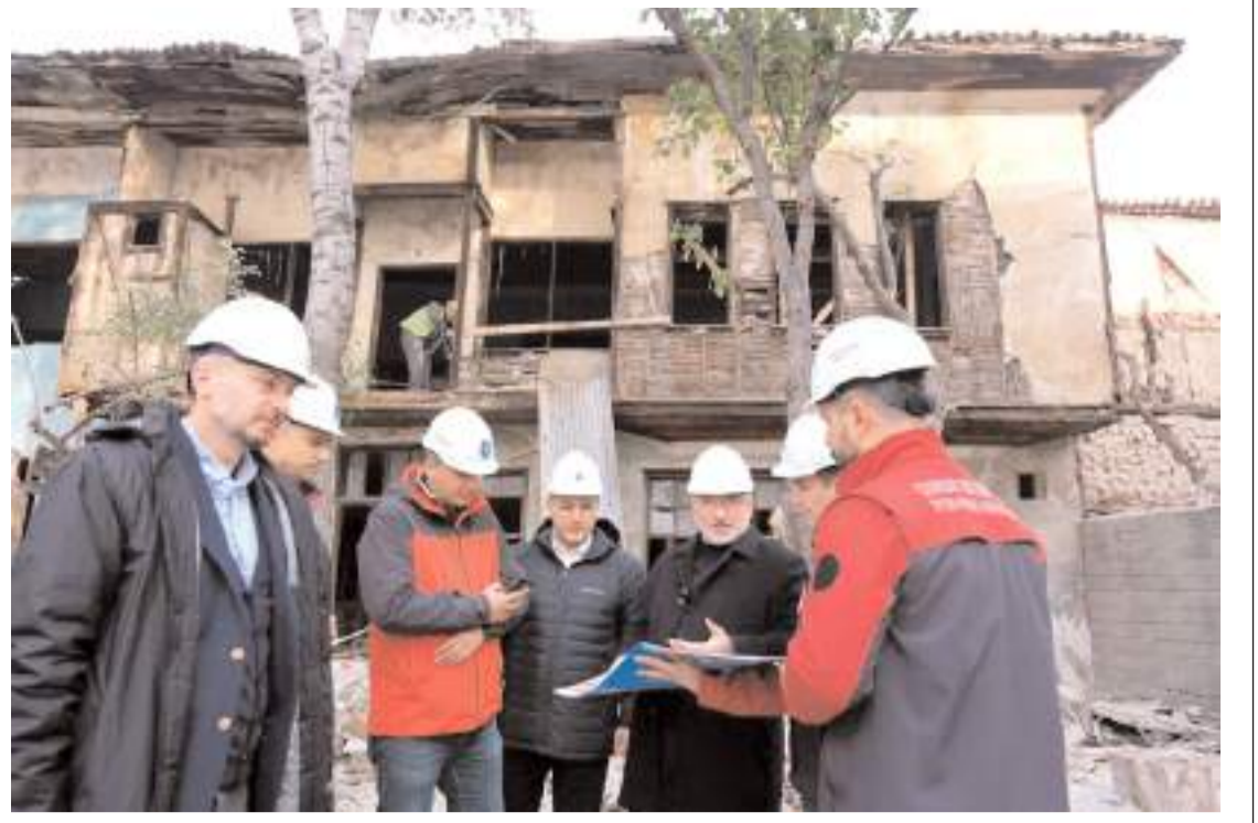
Tarihi İkiz Konak turizme kazandırılacak.