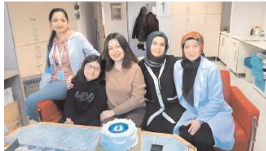
Radyoloji çalışanları günlerini böyle kutladı.