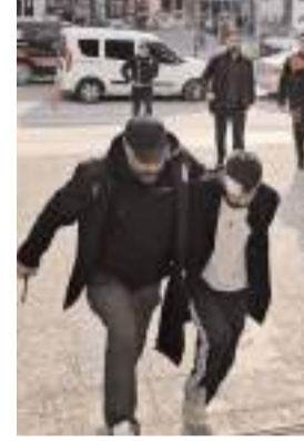
Cinayet zanlısı adliyeye böyle getirildi...