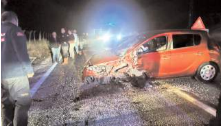
Kazaya ilişkin inceleme başlatıldı.