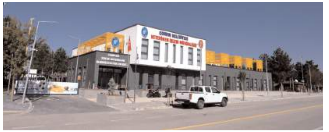
Sahipsiz Sokak Hayvanları Rehabilitasyon Merkezi, kentteki sokak hayvanlarının yanı sıra vahşi hayvanlara yönelik de sağlık hizmeti sunuyor.