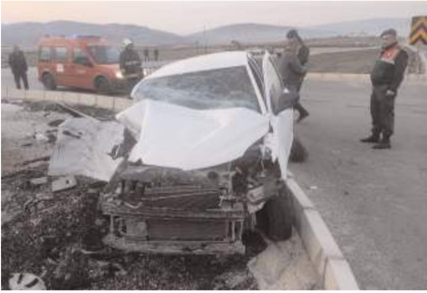
Evlik köyü yakınlarında traktörle ile otomobil çarpıştı.

Yaralıları, sağlık ekiplerince yapılan ilk müdahalenin ardından ambulanslarla Osmaniye Devlet Hastanesine kaldırıldı.(AA)