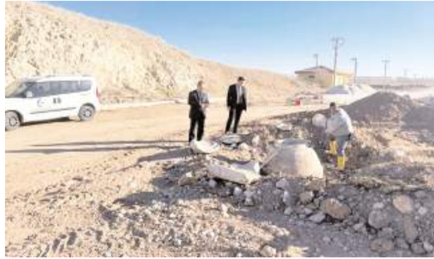
Kaymakam Köksal, OSB'de yapılan çalışmalarını yerinde inceledi.