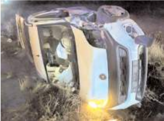
Otomobil ile hafif ticari aracın çarpışması neticesinde 7 kişi yaralandı.