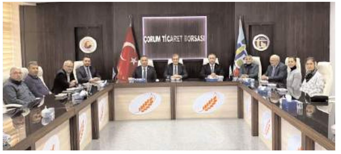
CHP heyeti Ticaret Borsasını ziyaret ederek sorunları dinledi.

■ Çorum Belediyesi'nin 2025 yılı bütçesi dün yapılan Belediye Meclisi Toplantısında görüşülerek kabul edildi. Belediyenin 2025 yılı gelir bütçesi 5 milyar 117 milyon lira gider bütçesi ise 5 milyar 617 milyon lira olarak belirlendi. * HABERİ'8'DE