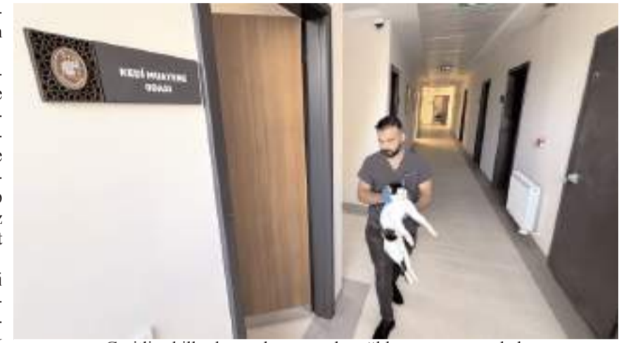
Çeşitli şekillerde yaralanan ya da sağlıksız görünen sokak hayvanlarının ekiplerce teslim alınıp merkeze getiriliyor.