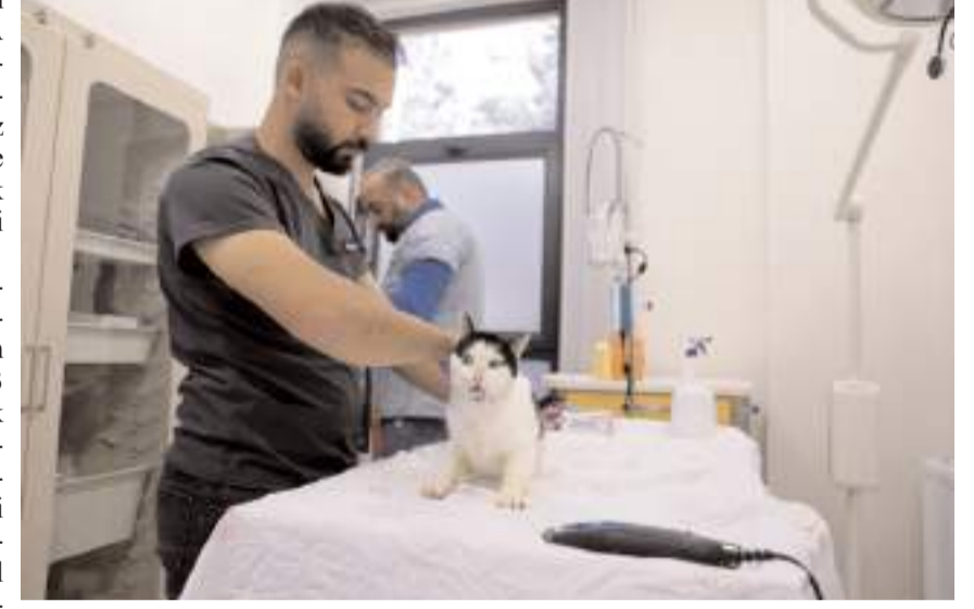
Kısırlaştırma işlemi ve tedavileri yapılan hayvanlar, yerden ısıtmalı kulübelere gözlem sürecini tamamlıyor.