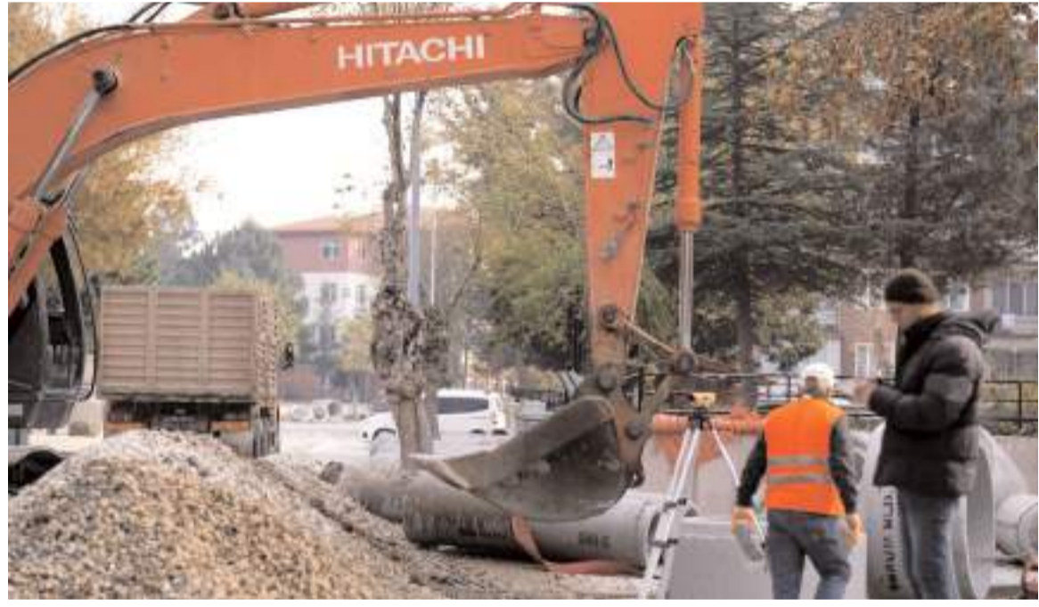
Ekonomik ömrünü tamamlayan 200 mm çapındaki borular 400 mm çaptaki borularla değiştiriliyor.

ederek, Yıldırım Külcü'ye günün anısına hediye verdi. (Haber Merkezi)