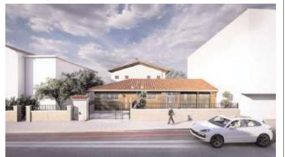
Projenin 450 günde tamamlanması planlanıyor.