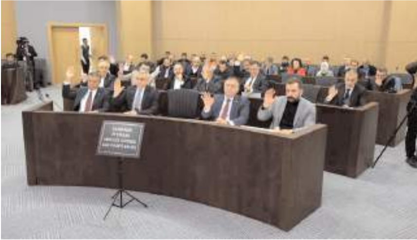
Toplantıda müdürlüklerin bütçeleri görüşülerek oylandı.