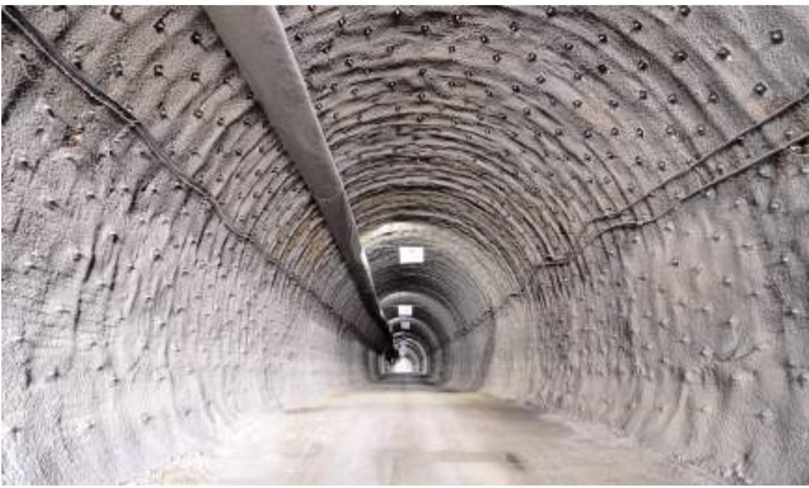
Tünellerin asfaltlaması Aralık ayında tamamlanacak.