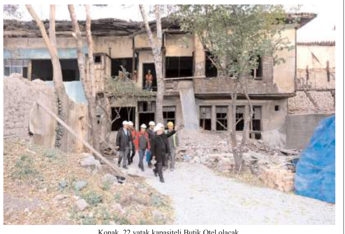
Konak, 22 yatak kapasiteli Butik Otel olacak.