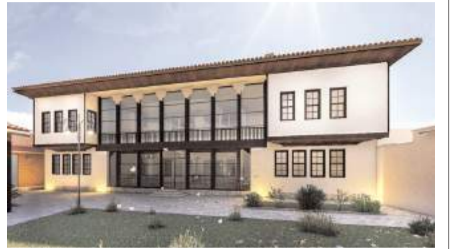
İkiz Konak projesinden bir fotoğraf...

Çorum'un tarihi değerlerini gün yüzüne çıkararak şehrin turizm potansiyelini artırmaya yönelik adımlar atmaya devam ettiklerini belirten Başkan Aşgın, "Tarihi Kültür Yolumuzun önemli yapılarından "İkiz Konaklar"ı restore ederek şehrimize kazandırıyoruz." dedi