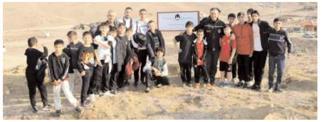
Sungurlu'da Hatıra Ormanı oluşturuldu.

İlçede ayrıca 250 mavi servi ve 250 kara servi fidanı da vatandaşlara ücretsiz dağıtıldı. (AA)