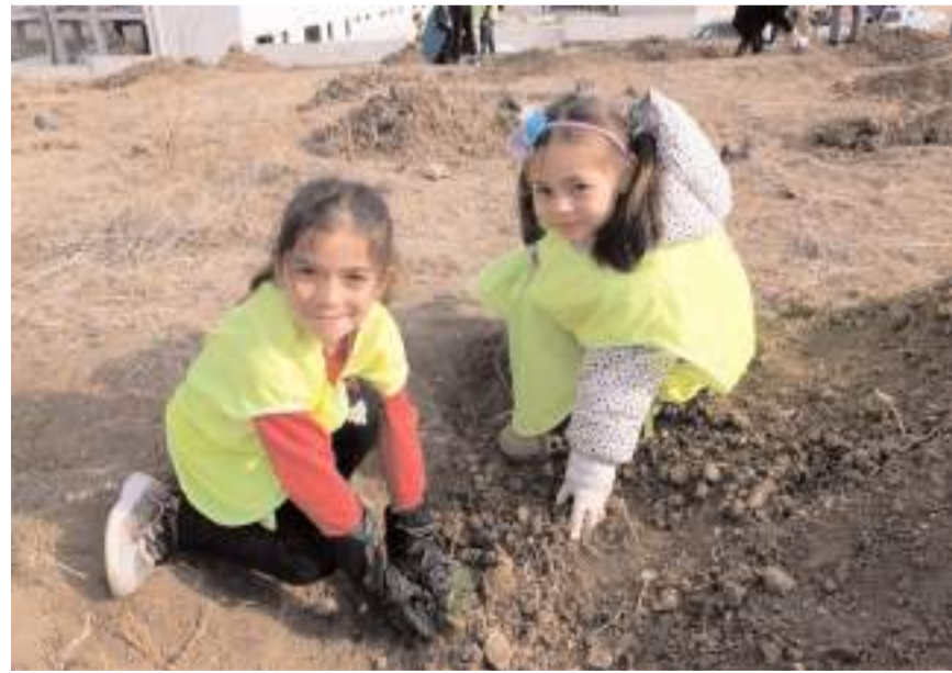
Minik öğrenciler fidan dikerken...