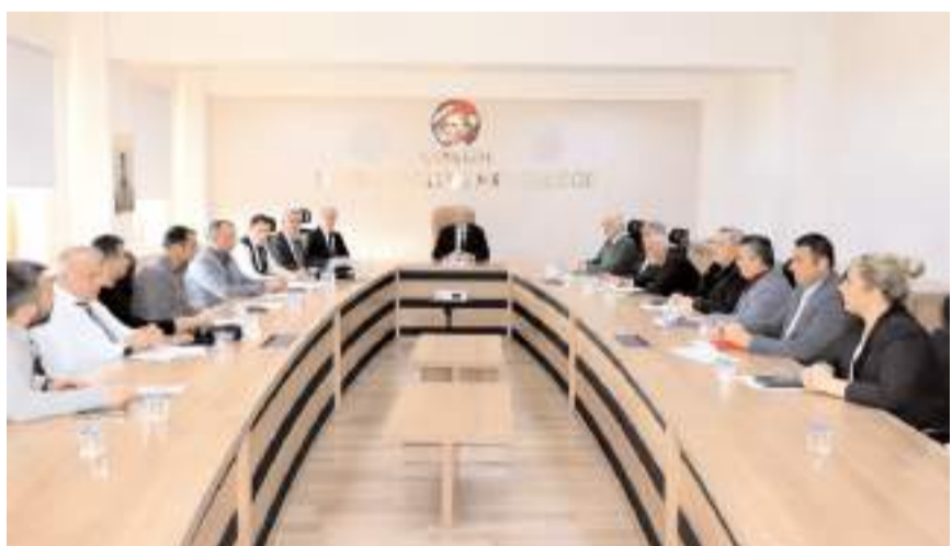
Toplantıya Halk Eğitim Merkezleri Müdürleri katıldı.