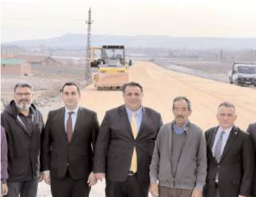
Milletvekili Oğuzhan Kaya, çalışmaları yerinde inceledi.