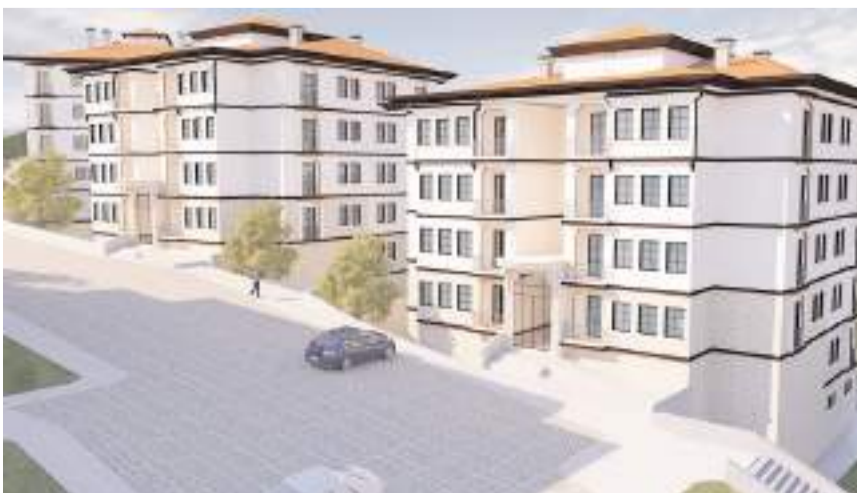
Sungurlu'ya yapılacak olan 364 adet konutun inşaatı yakında başlayacak.

Proje ile Manastır Mahallesi'ne 364 adet konut, 1 adet ticaret merkezi (4 dükkanlı) ve 1 adet cami inşaatı ile altyapı ve çevre düzenlemesi işi yapılacak. Projenin 1 yılda tamamlanması planlanıyor.