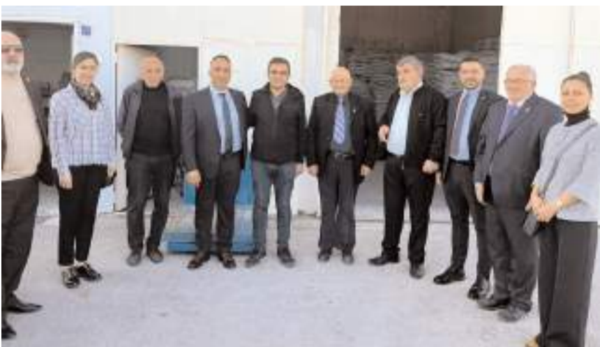
CHP heyeti Ticaret Borsasında bulunan işletmeleri ziyaret etti.