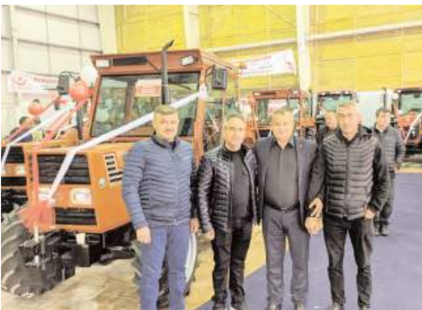
Uzun, fuardaki Çorumlu üyelerin stantlarını ziyaret etti.