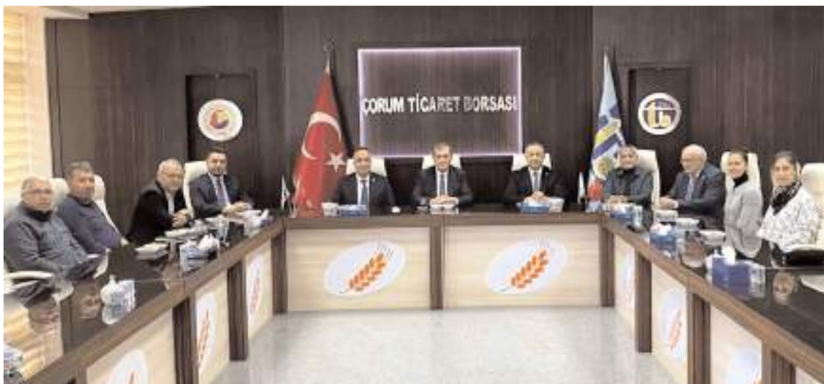
CHP heyeti Ticaret Borsasını ziyaret ederek sorunları dinledi.