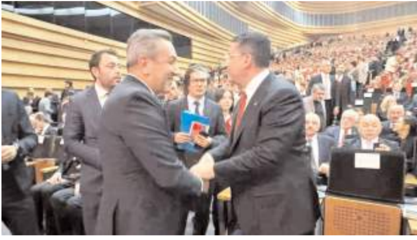
Sungurlu Belediye Başkanı Muhsin Dere, Azerbaycan'da etkinliğe katıldı.

Bu tür etkinlikler, Azerbaycan ile Türkiye arasındaki tarihi bağları pekiştiriyor. "Selam Türk'ün Bayrağına" konseri, Zafer Günü'nün anlam ve önemini sanatla birleştirerek yansıttı. Türk ve Azerbaycan halklarının kültürel ve tarihi ortaklığına vurgu yapan bu konser, iki ülkenin dayanışmasını daha da güçlendirdi.