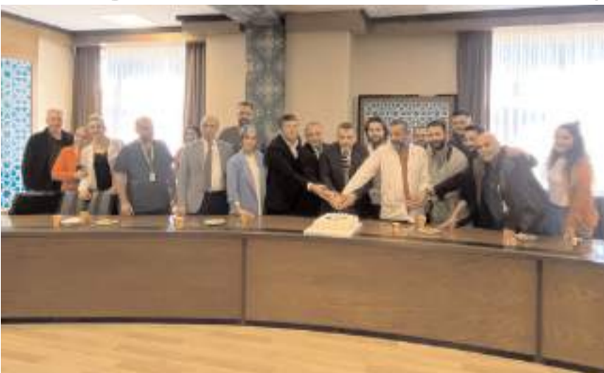
8 Kasım Dünya Radyoloji Günü dolayısıyla pasta kesildi.