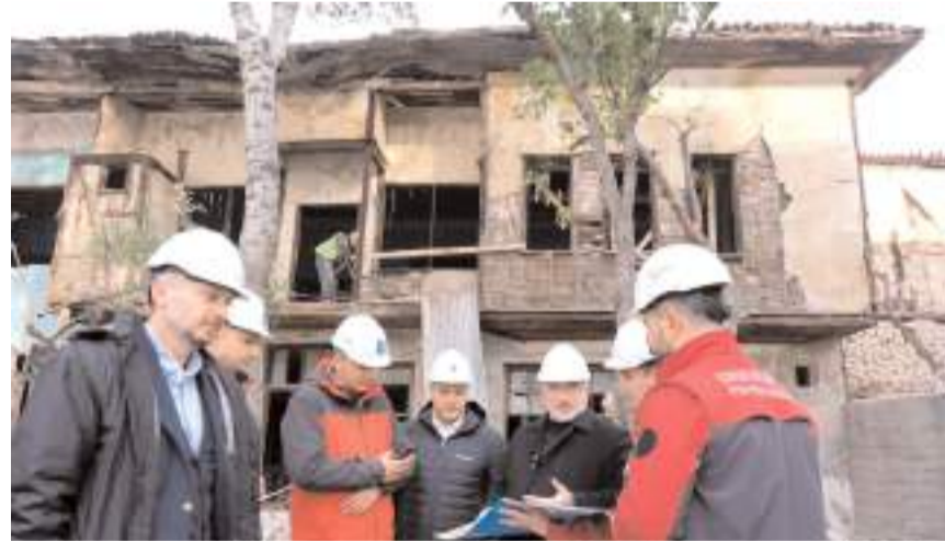
Tarihi İkiz Konak turizme kazandırılacak.