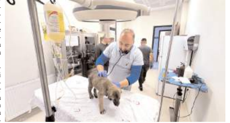
Veteriner İşleri Müdürlüğü ekiplerince merkeze getirilen hayvanlar sağlık kontrolünden geçiriliyor.