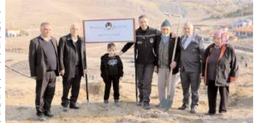
Dere vatandaşlarla birlikte fidan dikti.