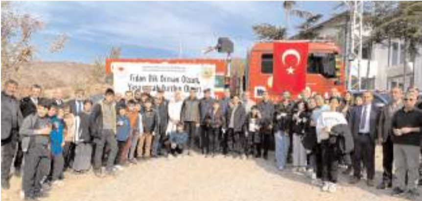
Fidan dikiminin ardından hatıra fotoğrafı çekildi.