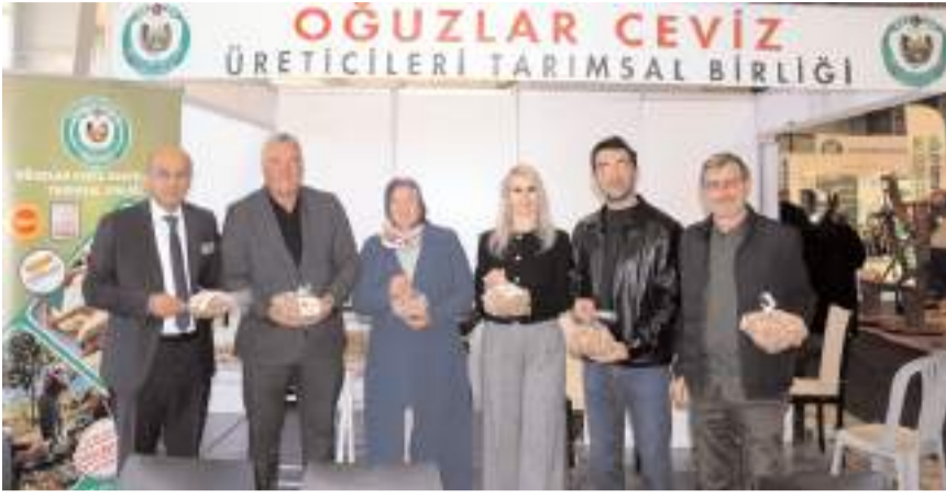
Çorum'da bu yıl ilk düzenlenen Ceviz Fuarı yoğun ilgi gördü.