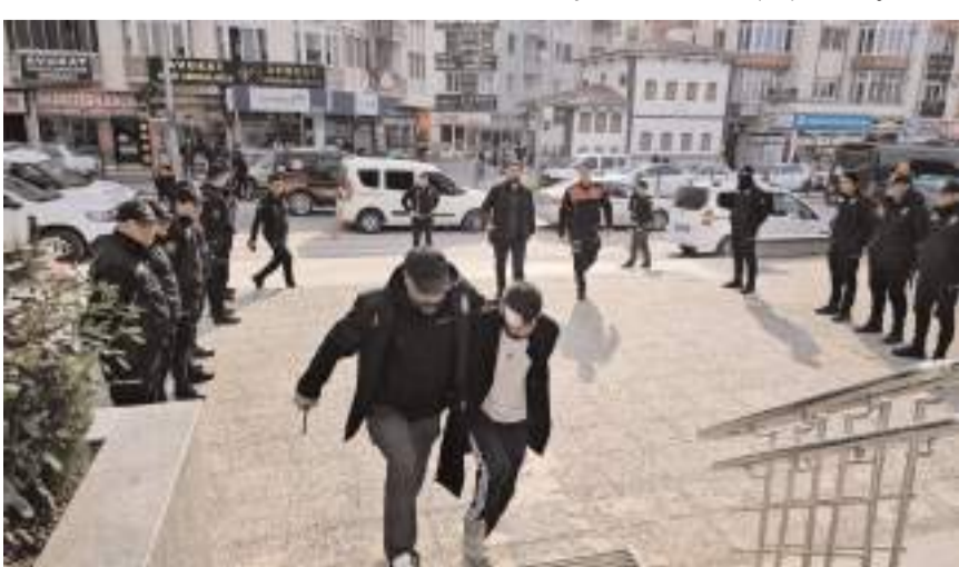
Cinayet zanlısı adliye böyle getirildi...