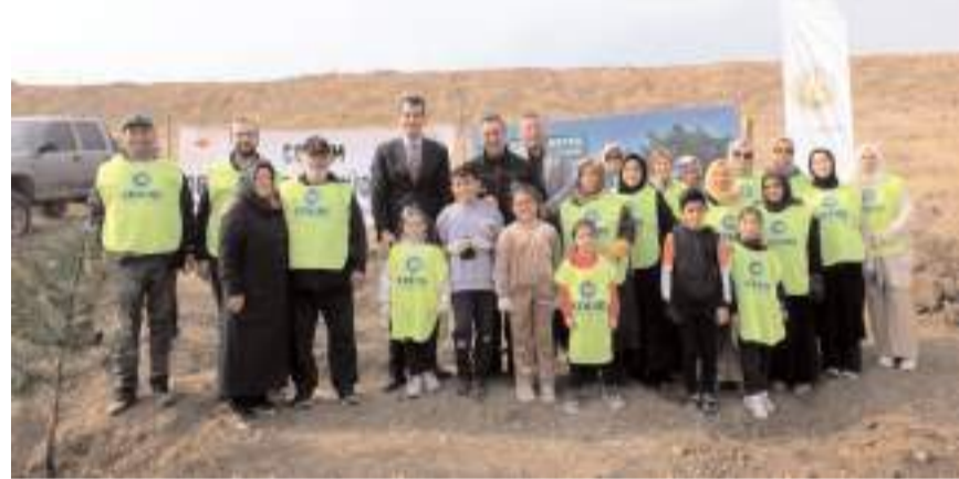
Sungurlu Organize Sanayi Bölgesi'nde fidan dikim etkinliği gerçekleştirildi.