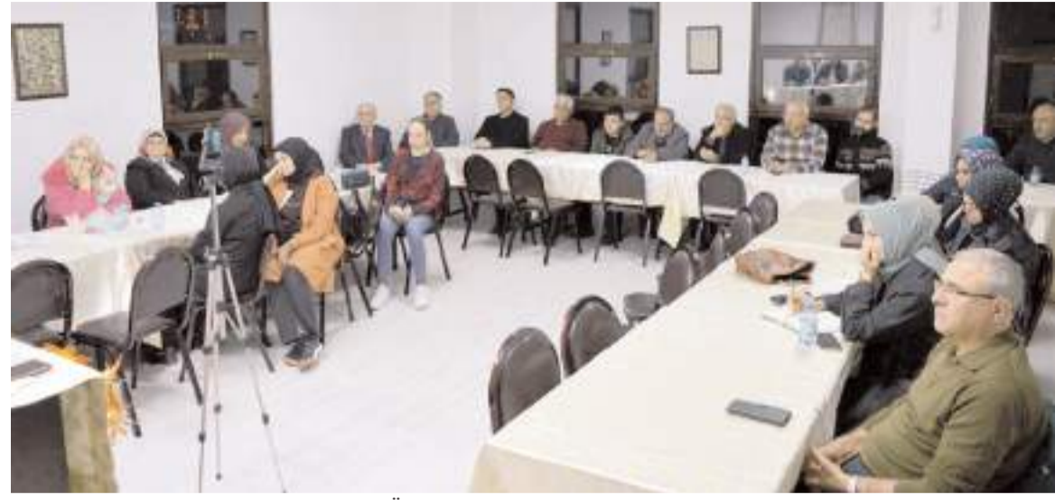
Kaleli Vakfı ile Hitit Üniversitesi işbirliğinde, “Dijital Çağın Bağımlılığı: Ailede Ebeveyn-Çocuk İlişkisi ve İnternetin Etkileri” konulu panel düzenlendi.

Modern aileler, çocuklarının dijital medya ve