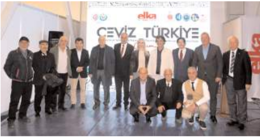
Fuara Çorum başta olmak üzere Bursa, Denizli, Manisa, Mersin, İzmir, İstanbul ve Ankara'dan 60 firma katıldı.