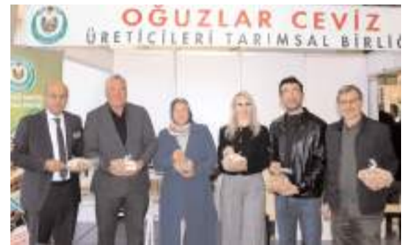
Çorum'da bu yıl ilki düzenlenen Ceviz Fuarı yoğun ilgi gördü.