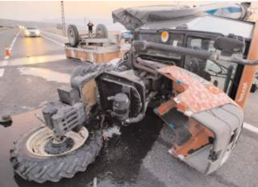
Kaza sonrası traktör bu hale geldi.