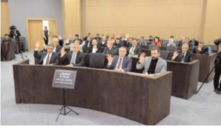
Toplantıda müdürlüklerin bütçeleri görüşülerek oylandı.

■ Çorum Belediyesi'nin 2025 yılı bütçesi dün yapılan Belediye Meclisi Toplantısında görüşülerek kabul edildi. Belediyenin 2025 yılı gelir bütçesi 5 milyar 117 milyon lira gider bütçesi ise 5 milyar 617 milyon lira olarak belirlendi. * HABERİ'8'DE