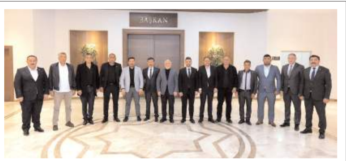
Ziyaretin sonunda hatıra fotoğrafı çekildi.