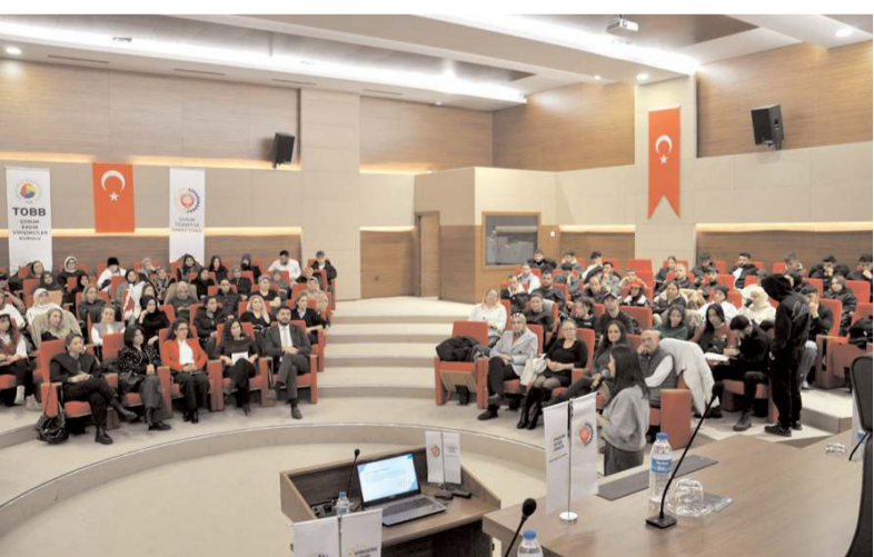
Eğitime ilgi yüksek oldu.