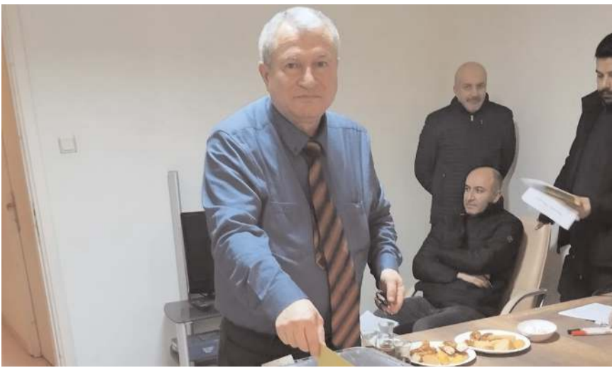
Bedii Onan yeniden başkanlığa seçilerek güven tazeledi.