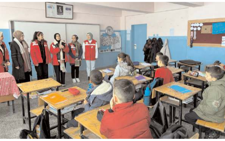
Gençler öğrencilerle biraraya geldiler.