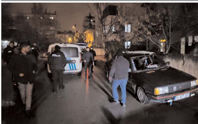
Kaçan araç Vatan Sokak'ta terk edilmiş halde buldu.

Çorum'da "dur" ihtarına uymayan araç trafikten men edildi.