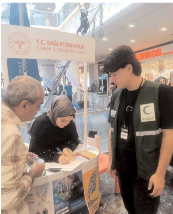
Stanтта karbonmonoksit ölçümleri gerçekleştirildi.