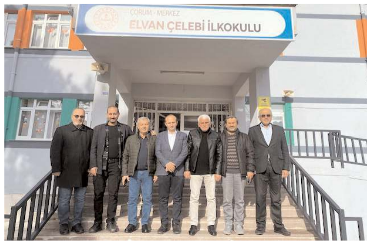
Ziyaretin anısına fotoğraf çekinildi.

Çorum Toprak Sanayi İlkokulunun ismi Elvan Çelebi İlkokulu olarak değiştirildi.