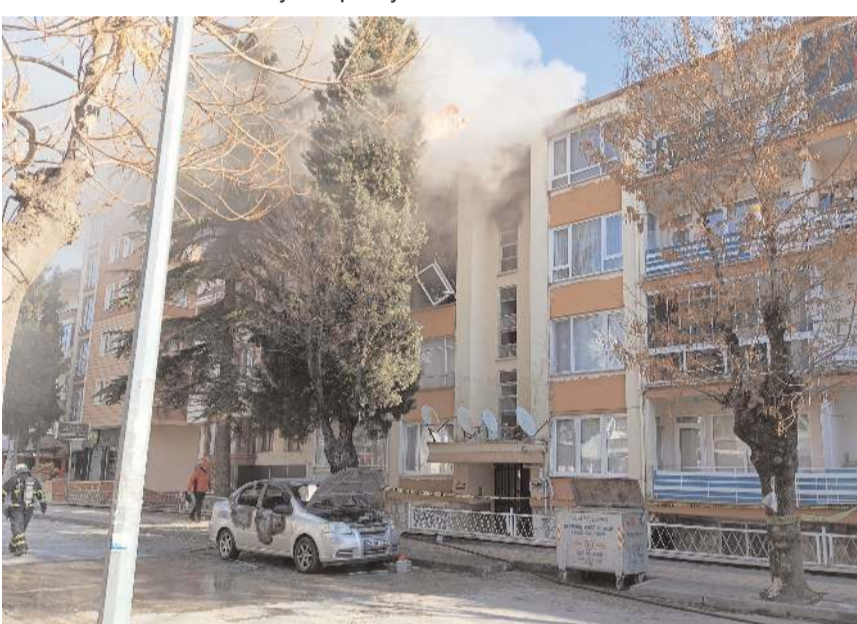
Olay Ilıca Caddesi'nde meydana geldi.