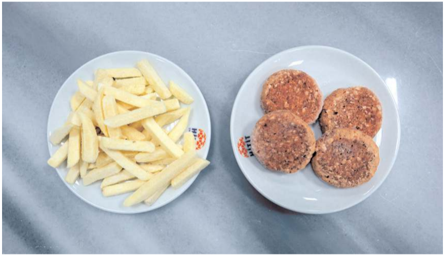
Proje ile patates kızartması, köfte ve pişi için en sağlıklı pişirme yöntemleri ve yağ seçenekleri belirlenecek.