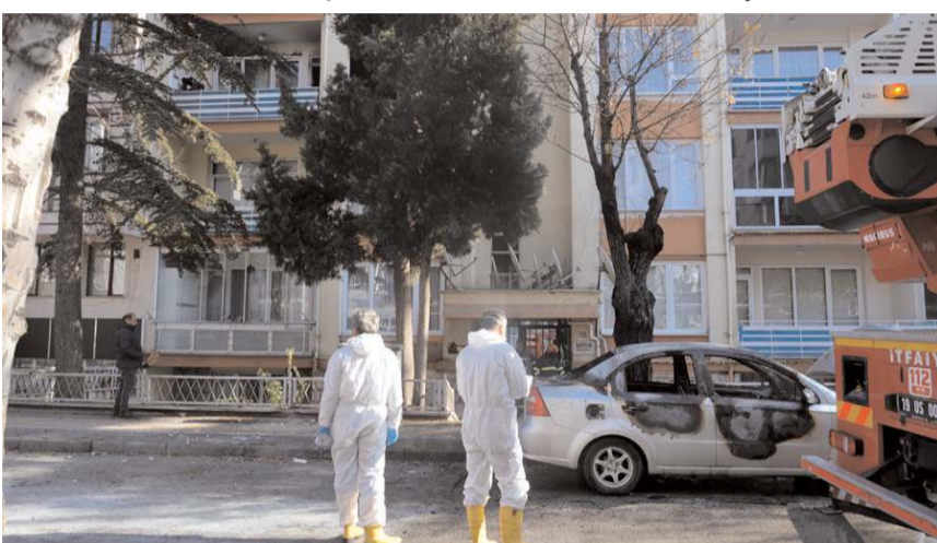
İtfaiye ekipleri yanan aracı söndürdü.