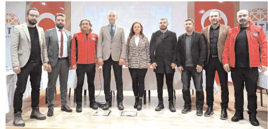
Çalışmaya katılan davetliler ve organize yapanlar toplu halde görülüyor

Belediyespor- Yıldızlar Topluluğu All Star maçında Hüseyin Kamber'in yardımcılığını ise Hasan Olgun yapacak. Maçta gözlemci olarak ise Turgut Yıldırım görevli.