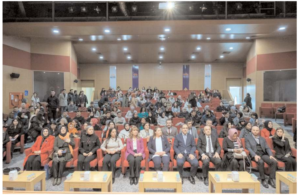
Program Hitit Üniversitesi Meslek Yüksekokulları Kampüsü Ethem Erkoç Konferans Salonu'nda yapıldı.

ve dolayısıyla bu ihlale karşı da kendini savunabilir ve korunmasını almış olmak en önemli hedeflerimizden olmalı" dedi.