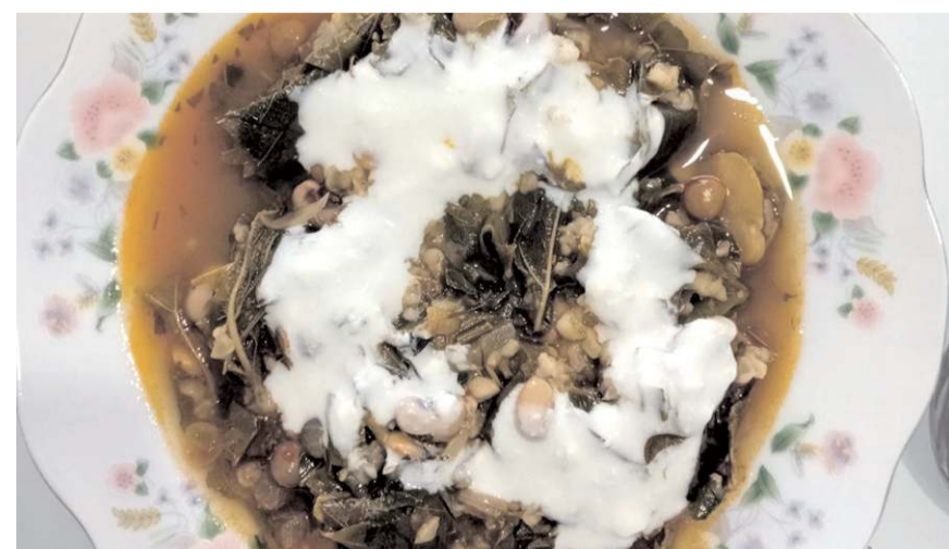
'Osmancık yırtmaç yemeği' için Türk Patent ve Marka Kurumu'na başvuruda bulunulmuştu.

Asma yaprakları kullanılarak yapılan Osmancık yırtmaç yemeği, lezzeti ile ilçeyi ziyaret eden vatandaşlardan büyük ilgi görüyor.