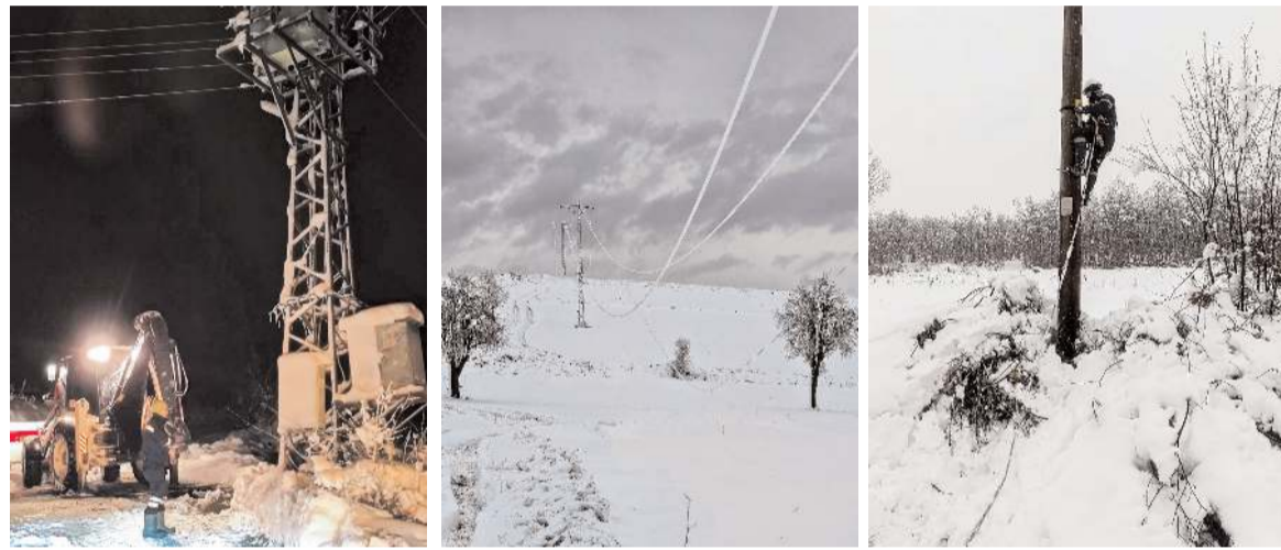
YEDAŞ ekipleri kar ve fırtına nedeniyle oluşan kesintileri gidermek için yoğun çaba harcadı.

dan gelen talimatlar ile ilimiz ve çevre illerimizde kar yağışından etkilenen vatandaşlarımıza ve ulaşımında yaşanan mahsur kalmalara İl Müdürlüğümüz Arama Kurtarma Ekipleri, İl Jandarma Komutanlığı ve İl Sağlık Müdürlüğü UMKE ekipleri ile birlikte müdahale edilmiştir" denildi. (Haber Merkezi)