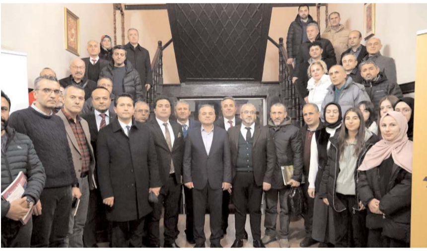
Etkinliğin sonunda hatıra fotoğrafı çekildi.