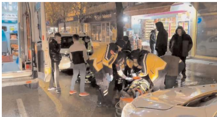
Yaralı sürücüyü ilk müdahaleyi 112 acil sağlık ekipleri yaptı.

Çorum'da otomobile çarpışan motosikletin sürücüsü yaralandı.