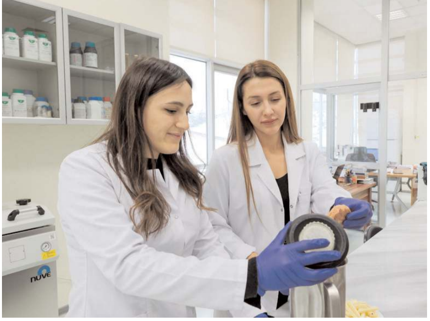
Proje kapsamında laboratuvar ortamında çalışmalara başlandı.

"Projemizde belirlediğimiz pişirme teknikleri ve yağ çeşitleriyle gıdalarda oluşabilen toksik maddeler üzerinde analiz yapmayı planlıyoruz. Bu maddeler arasında sağlık için risk oluşturabilecek unsurlar bulunuyor. Çocukların ve ergenlerin bu maddelere olan maruziyetini en aza indirmek için en uygun pişirme yöntemlerini ve yağ seçeneklerini belirleyeceğiz." Kabak, çalışmada evde hazırlanmış gıdalardan dondurulmuş gıdalara kadar geniş yelpazede inceleme yapacaklarını, güvenilir pişirme yöntemini bilimsel verilerle belirleyeceklerini ifade etti.(AA)