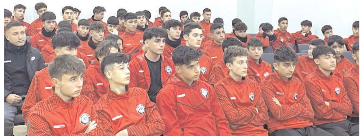
Çorum FK Gelişim Ligi takımları futbolcuları hakem eğitiminden geçtiler