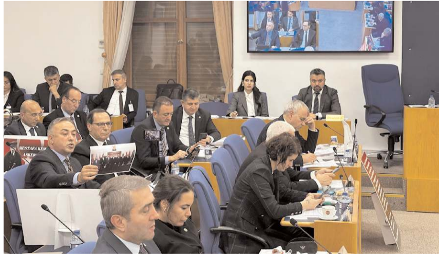
CHP Çorum Milletvekili Mehmet Tahtasız, Milli Savunma Bakanlığı'nın 2025 yılı bütçesinin görüşüldüğü Plan ve Bütçe Komisyonu toplantısına katıldı.

■ CHP Çorum Milletvekili Mehmet Tahtasız, Milli Savunma Bakanlığı'nın 2025 yılı bütçesinin görüşüldüğü Plan ve Bütçe Komisyonu'nda yaptığı konuşmada Çorum'a söz verilen acemi birliğini hatırlattı.