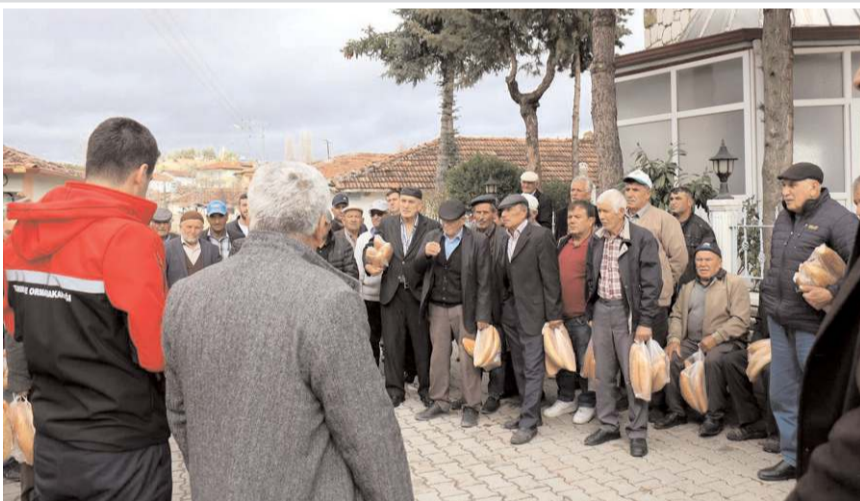
Tarım ve Orman İl Müdürlüğü ekipleri köyleri ziyaret ederek yeni tarım modeli hakkında bilgiler veriyorlar.

Çorum ve bölgesinde aspir, kanola, kuru fasulye, dane mısır, pamuk ve soya eken çiftçiler ise destek verilmeyecek.