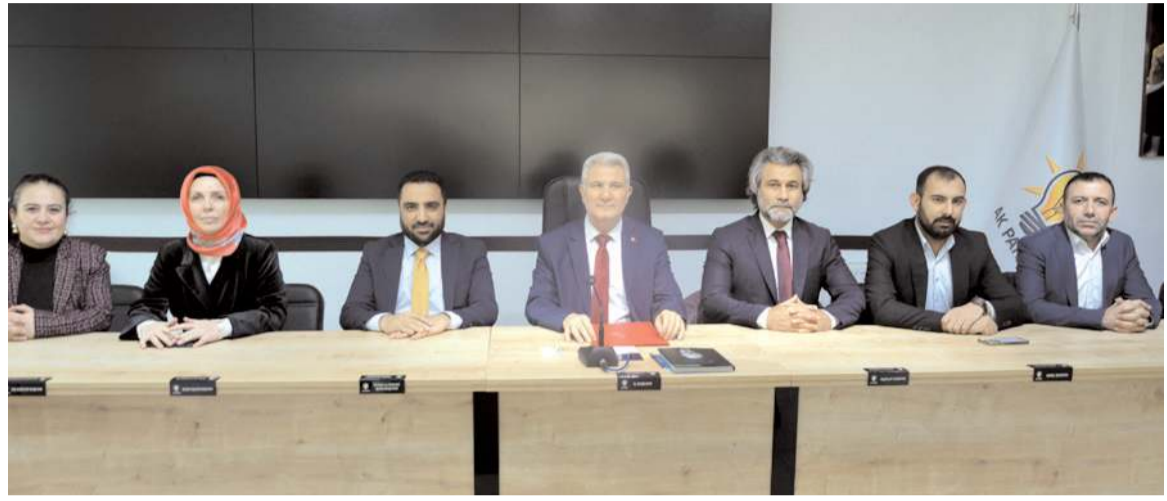
AK Parti'de devir teslim töreni yapıldı.

Temel değerleri olan adalet, özgürlük, demokrasi ve milli birlik ruhu olan AK Parti'nin Türkiye'nin güçlü bir şekilde ilerlemesi için temel bir direksiyon görevi üstlendiğini aktaran Alagöz; "Toplumumuzun her kesimine kucak açarak, farklılıkları ve zenginlikleriyle partimiz, ülkenin her bir köşesinde birlik, beraberlik ve dayanışma duygusunu güçlendirmiştir. Bizim için esas olan, Hak'ın ve halkın rızasıdır. Bizim için esas olan, aziz milletin hayır duasıdır. Bizim için esas olan, Türkiye'nin aydınlık geleceğidir, Çorumumuzun geleceğidir. Bizim için esas olan, davamızın sekteye uğra-