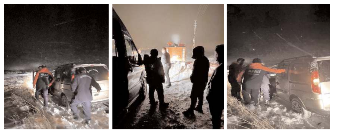
AFAD ekipleri karda mahsur kalan sürücülere yardım etti.

va koşulları ve yüksek kesimlerde buzlanma kaynaklı oluşabilecek tehlikeler nedeniyle taşımali eğitim kapsamında olan öğrencilerimize tedbir amaçlı 27 Kasım Çarşamba günü eğitime bir gün ara verilmiştir." ifadelerine yer verildi.(AA)