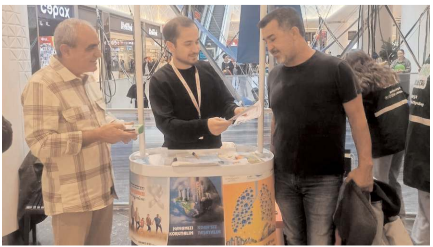
Stanтта KOAH ve akciğer kanseri hakkında bilgiler verdi.

İl Sağlık Müdürlüğü, KOAH ve akciğer kanseri bilgilendirme faaliyetlerine devam ediyor.