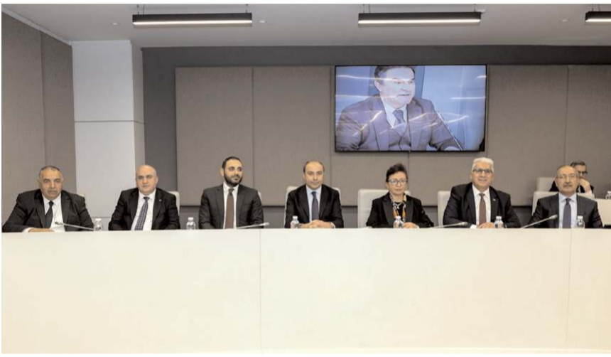
Basın İlan Kurumu 32. Dönem 8. Genel Kurul Toplantısı yapıldı.