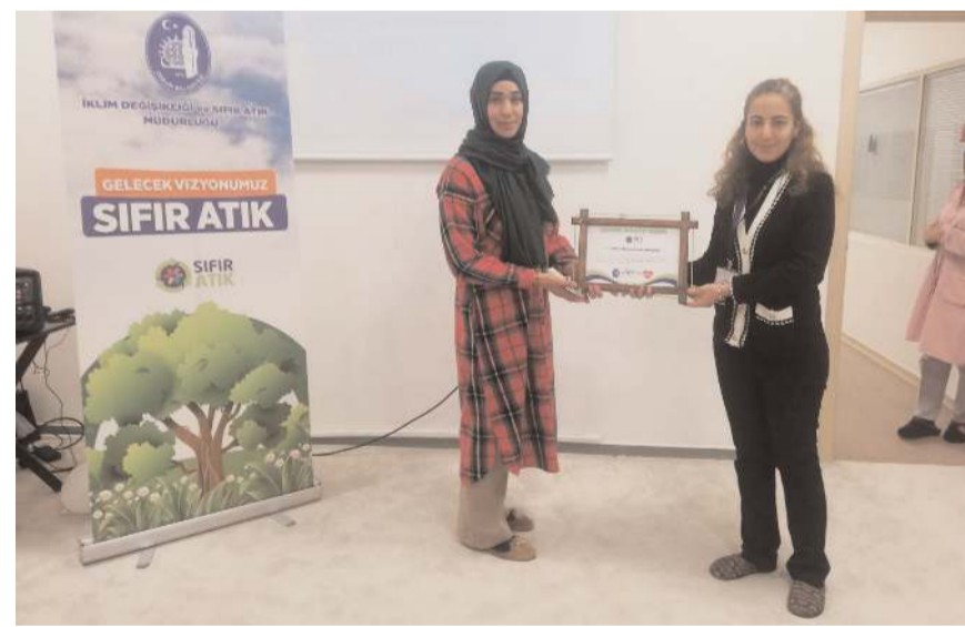
Program sonunda kurs yetkililerine, "Çevre Dostu Kurs" belgesi takdim edildi.