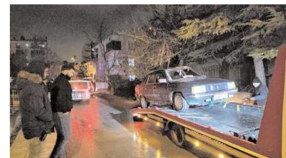
Trafikten men edilen araç çekici ile otoparka kaldırıldı.

■ Çorum'da park halindeki 10 aracın aynaları kimliği henüz belirlenemeyen kişinin saldırısı sonucu kırıldı. * HABERİ 2'DE