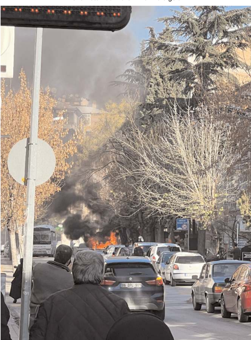
Vatandaşlar yanan aracı meraklı gözlerle izledi.