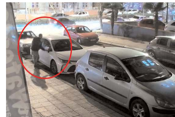
Saldırı anı güvenlik kamerasına yansdı.