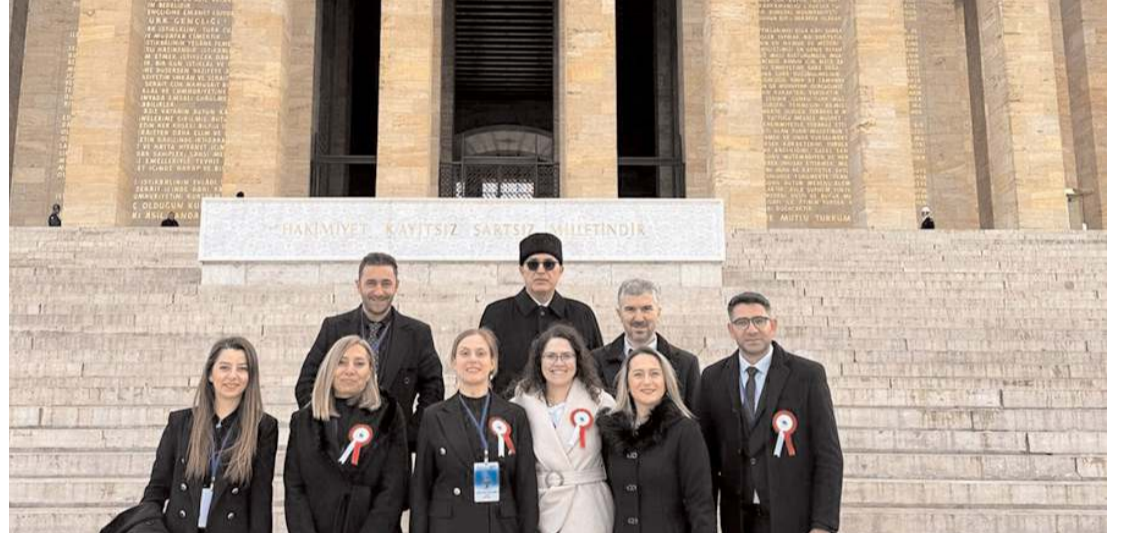
Öğretmenler Anıt Kabiri ziyaret etti.