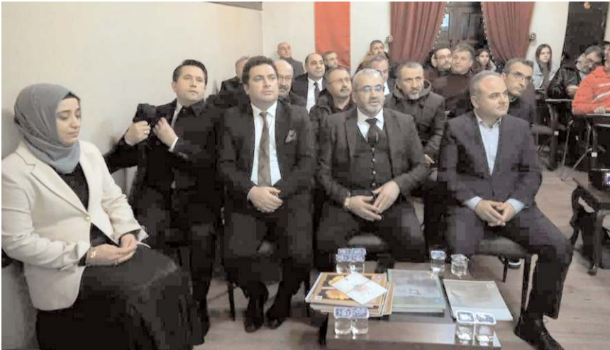
Program "Öğretmen Akademileri Projesi" programı kapsamında yapıldı.