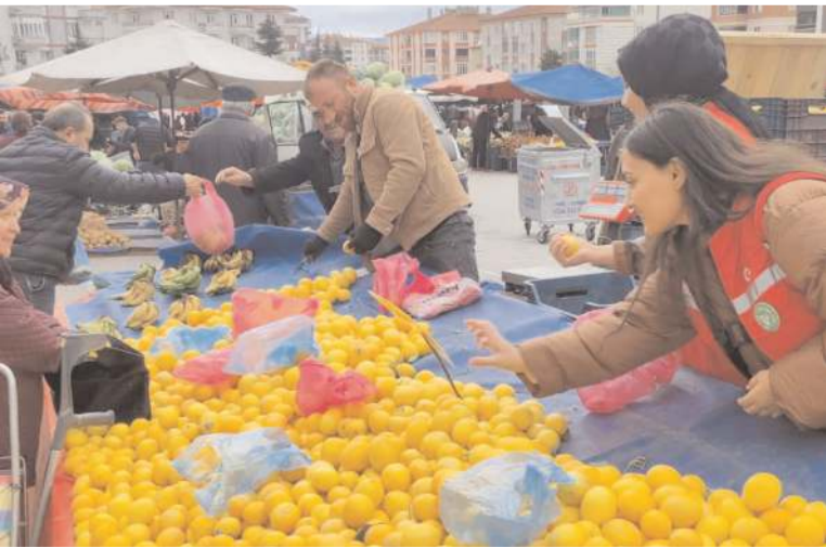
Gençler pazarıcı esnafına yardım ettiler.