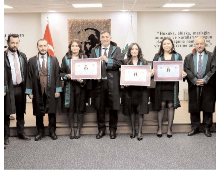
Avukatlar törende ruhsatlarını aldılar.