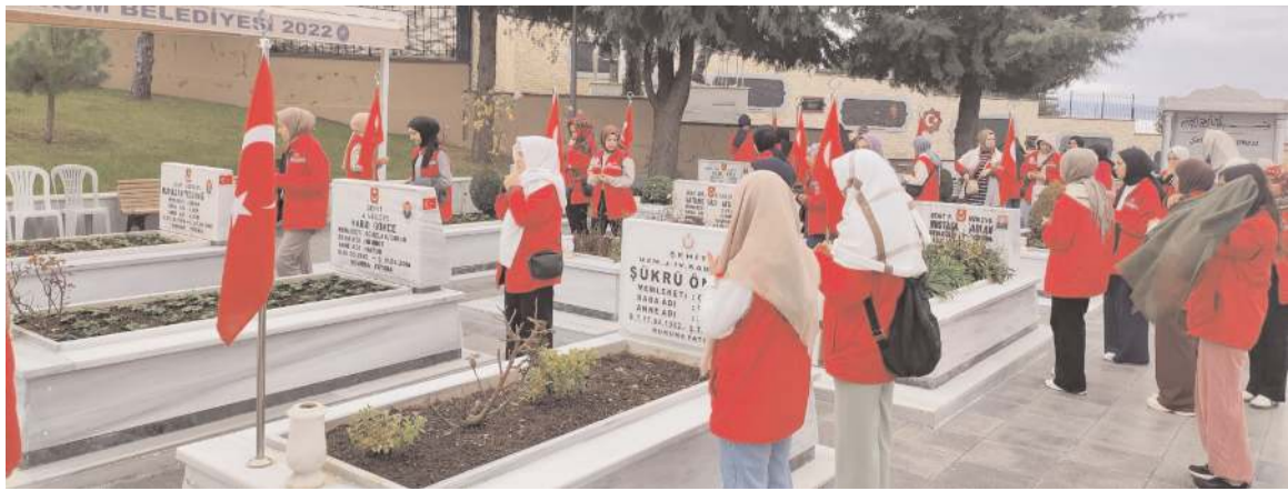
Öğrenciler Şehitliği ziyaret ederek dua ettiler.

Gençlik ve Spor Bakanlığı tarafından hayata geçirilen "Damla Gönüllülük Projesi"