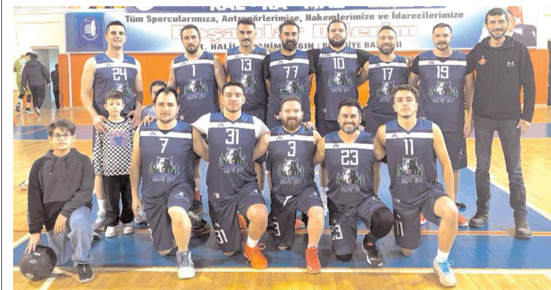
Basketbol Akademi büyük çekişmeye sahne olan maçı son periyottaki etkili oyunu ile kazanarak finale yükseldi

Maçta ilk dakikadan itibaren üstün bir futbol ortaya koyan Çorum Belediyespor ilk periyodu 11-6 önde amamladı. İkinci periyotta ta üstünlüğünü sürdüren Çorum takımı devreyi 32-16 önde tamamladı. Üstün oyununu üçüncü periyotta da sürdüren Çorum Belediyespor bu periyodu 22-10 kazandı ve son periyotta 55-26 önde girdi. Son periyotta da 24-12 alan Çorum Belediyespor maçtan 78-38 galip ayrılarak finale yükselen takım oldu.