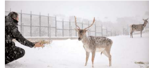
Fauna alanı kızıl geyik, karaca, alageyik, yaban keçisi gibi hayvanların yakından görülmesine olanak sağlıyor.

Sıklık Tabiat Parkı'nda yer alan fauna alanındaki yaban hayvanlarını da ihmal etmediklerini belirten Günhan, "Burada geyik, karaca, yaban keçisi gibi hayvanlar var. Zorlu kış günlerinde onların beslenmelerine yardımcı oluyoruz." dedi.(AA)