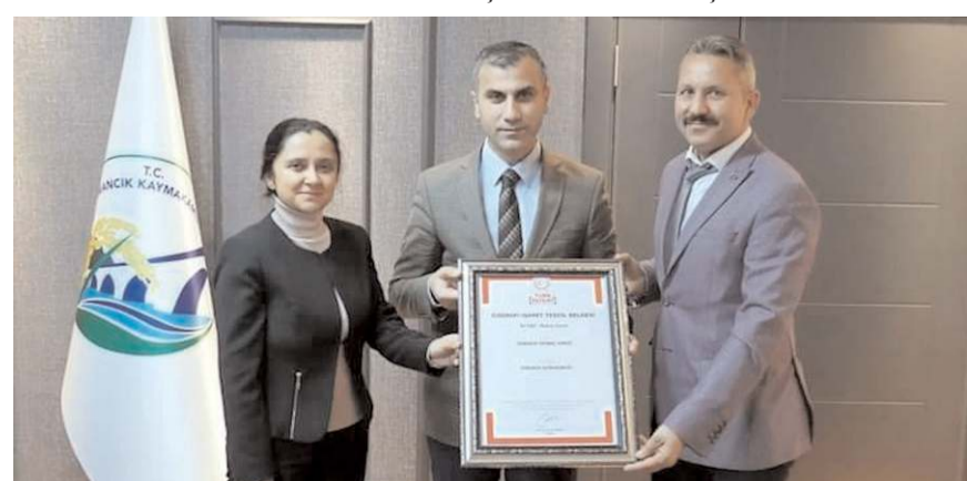
Türk Patent ve Marka Kurumunun coğrafi işaret tescil belgesi teslim edildi.