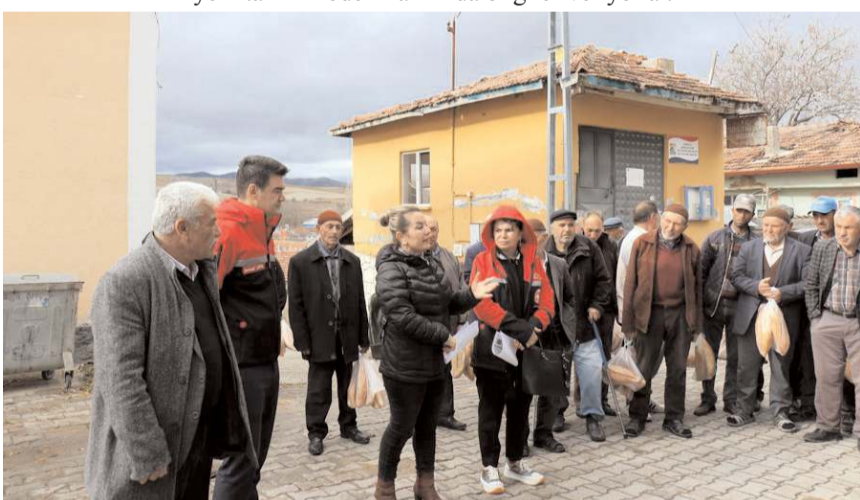
Uzmanlar çiftçilerin sorularını cevaplıyor.