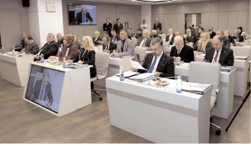
Toplantıda gündem maddeleri görüşüldü.