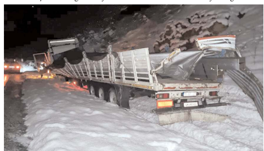
Demir yüklü tır devrilen kamyonete çarptı.