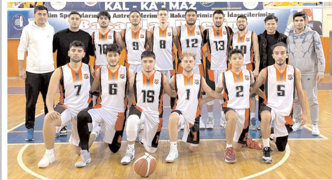
Çorum Belediyespor Merzifon önünde zorlanmadan galip gelerek finale yükselen takım olmayı başardı

Kulüplü Büyük erkekler basketbolda kupalar bugün sahibini bulacak. Atatürk Spor Salonu'nda saat 18'30de yarı final maçlarını kaybeden Merzifon Belediyesi ve Gelişim Basketbol üçüncülük dördüncülük maçı oynayacak. Saat 20.00'de ise Çorum Belediyesi ve Basketbol Akademi şampiyonluk maçında karşılaşacaklar.