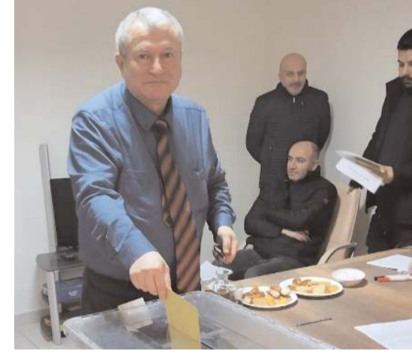
Bedii Onan yeniden başkanlığa seçilerek güven tazeledi.