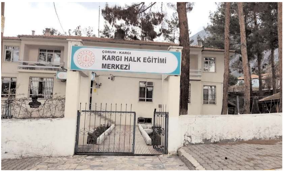
Binanın, depreme dayanıksız olduğu belirlendi.

Proje kapsamında gençler Çorum Merkez, Alaca, İskilip, Laçın Osmaniye, Oğuzlar Boğazkale'de tarihi ve kültürel mekânlarını görmeyi yanında çeşitli faaliyetlerde yapacaklar. (Haber Merkezi)