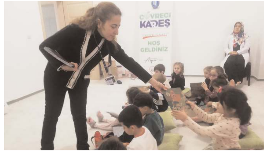
Öğrencilere hediyeler verildi.

Program sonunda kurs yetkililerine, "Çevre Dostu Kurs" belgesi takdim edilirken, çevre kahramanı olan öğrencilere atık kağıtlardan yapılmış sıfır atık boyama kitabı hediye edildi. Eğitimler yılsonuna kadar Çorum İl Müftülüğüne bağlı şehir merkezinde bulunan 18 adet 4-6 yaş Kur'an Kurslarında devam edecek.(Haber Merkezi)