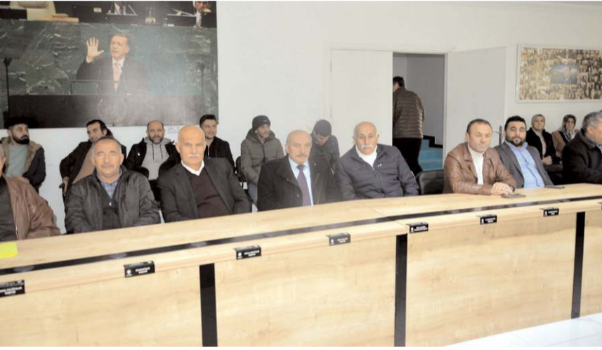
Devir teslim törenine partililerde katıldı.

Akar; "24 Kasım'da kongre yapıp görevimizi devredecektik ama kongremizin ertelenmesi sebebiyle genel merkezimizin daha rahat çalışabilmesi adına genel merkez gittim ve istifamı verdim. Bundan sonra genel merkezimizin emrinde olduğumu söyleyerek Çorum'a geldik. Bazı bilgi kirlilikleri ortada dolaştı. 'Görevden alındı, atıldı, gitti' şeklinde. Bütün ilçelerde önden atamalar yapıp istifalar alındı. Türkiye'nin her yerinde sistem aynıydı. Bu süreci baltalamak isteyen yada başka şeylere mal etmek isteyen arkadaşlar var. Onları anlıyorum. Bizim için önce dava gelir, sonra makam mevki gelir. Hiçbir zaman makam mevki peşinde koşmayacağız. Ülkemizin gündemi zaten yoğun. Bizlerin burada farklı düşüncelerle hareket etmesi tabii ki yanlış olur. Her zaman bu davaya hizmet etmekten vazgeçmeyeceğiz." şeklinde konuştu