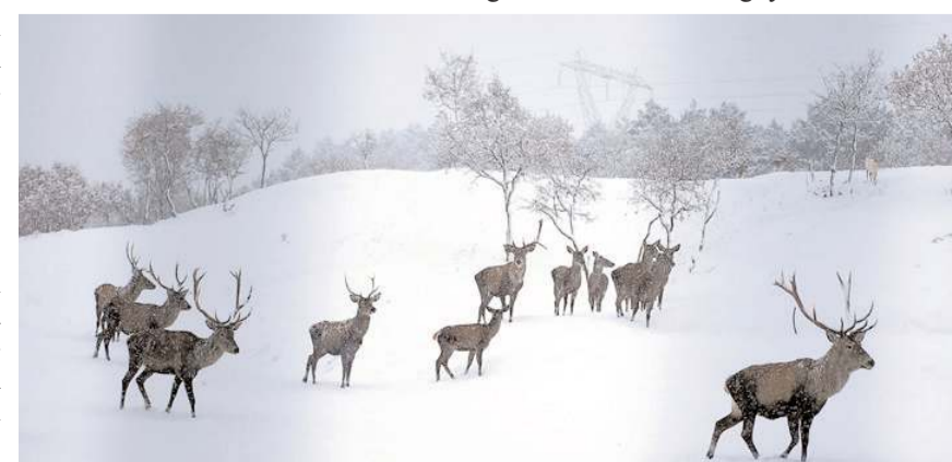
Fauna alanında bulunan geyikler karın keyfini çıkarıyor.