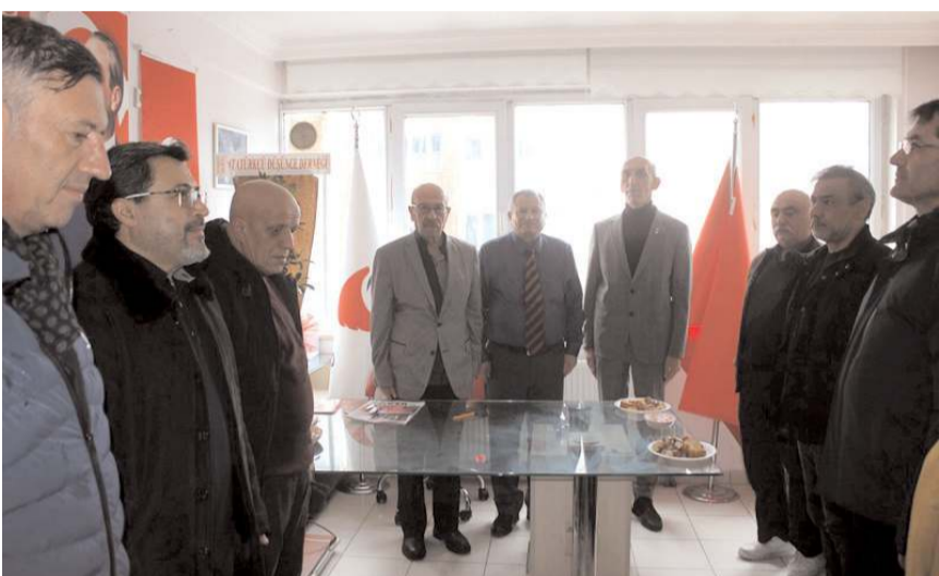
Kongre saygı duruşunda bulunulması ve İstiklal Marşı'nın okunmasıyla başladı.