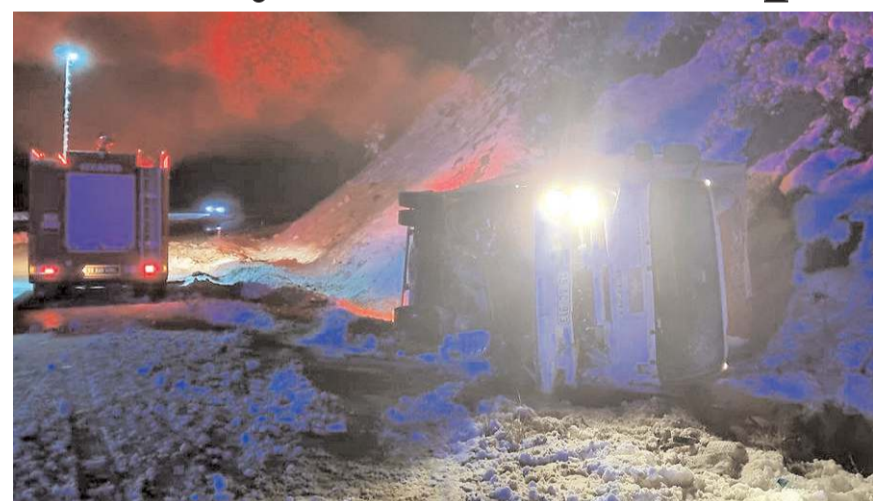
Kaza Çorum-Yozgat kara yolu Eliceç Deresi mevkinde meydana geldi.

Yaralıları, sağlık ekiplerince ambulanslarla Alaca Devlet Hastanesine kaldırıldı.(AA)