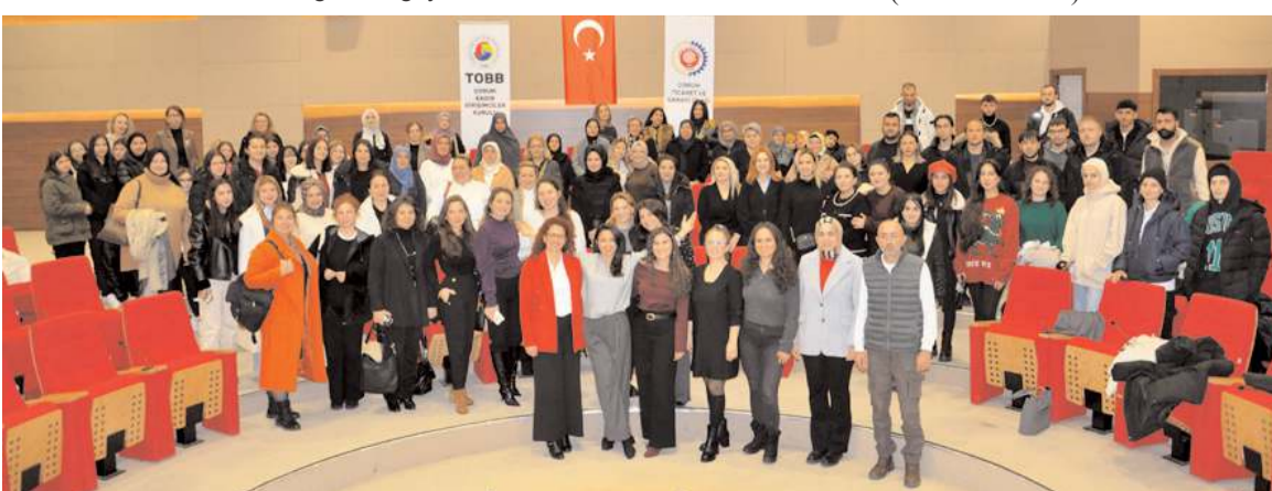
Eğitimin sonunda toplu hatıra fotoğrafı çekildi.

Çorum Ticaret ve Sanayi Odası TOBB Çorum Kadın Girişimciler İl Kurulu, Avrupa İşletmeler Ağı Projesi ve İhracatçı Kadınlar Derneği işbirliği ile, e-ihracat ve e-ticaret eğitim programı gerçekleştirildi.