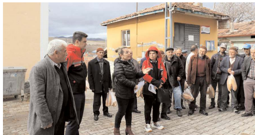
Uzmanlar çiftçilerin sorularını cevaplıyor.