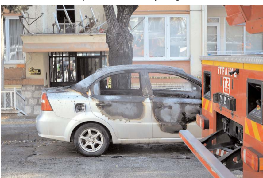
Yanan otomobil kullanılmaz hale geldi.