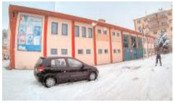
Mahmut Atalay Gençlik Merkezi için yıkım kararı alındı.