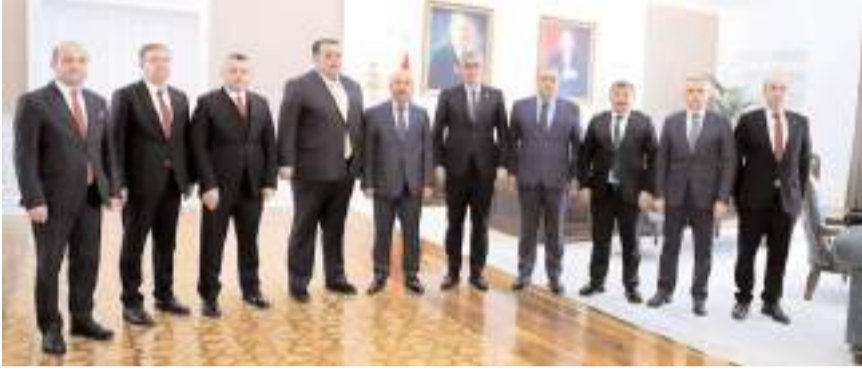
Çorum heyeti Sağlık Bakanı Prof. Dr. Kemal Memişoğlu'nu ziyaret etti.