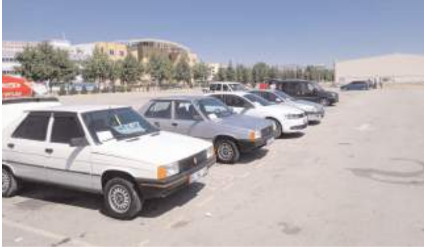
Meclis'e sunulan kanun teklifiyle birlikte sıfır otomobil fiyatların yüzde 37 düşeceği ifade edildi.

1 milyon TL'lik bir otomobil için hesaplama şu şekilde yapıyor: