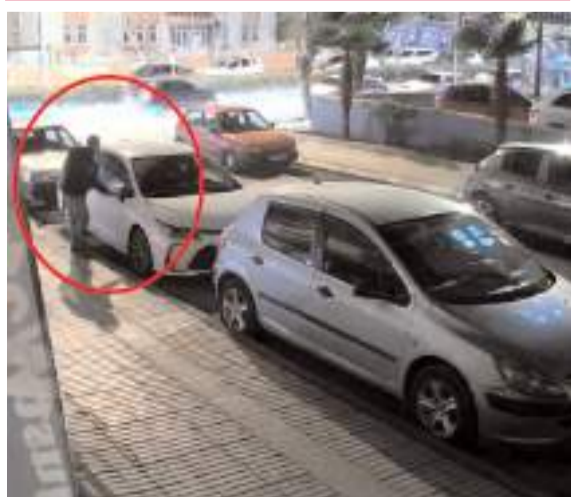
Şüpheli park halindeki 13 aracın aynaları kırılmıştı.

■ Çorum'da uzun yıllardır Olimpik Yüzme Havuzu yanında hizmet veren Mahmut Atalay Gençlik Merkezi yıkılıyor. * HABERİ2'DE