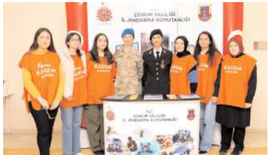
İl Jandarma Komutanlığı görevlileri stantlar açarak kadına yönelik şiddetle mücadele ve Kadın Destek Uygulaması (KADES) hakkında bilgilendirmeler yapıp broşürler dağıttılar.