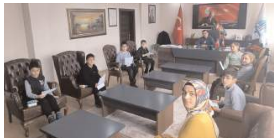
Öğrenciler ziyaretlerinde proje hakkında bilgi verdiler.