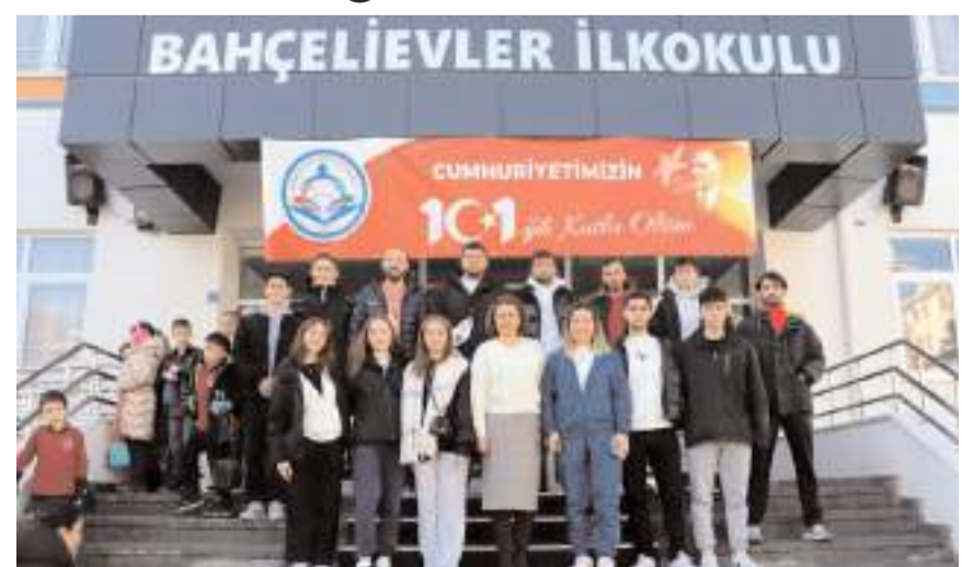
Proje kapsamında Atatürk İlkokulu ve Bahçelievler İlkokulu'nda etkinlikler düzenlendi.

Açıklamada, "Çocukların müzik ve hareketle iç içe olması, eğlenceli vakit geçirmelerini sağladı. Çocukların etkinliklere katılmaları hem yüzlerini güldürdü hem de doyusya eğlen-