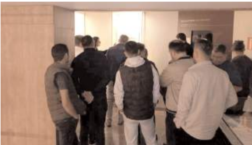
Müze uzmanları eserler hakkında bilgi verdiler.