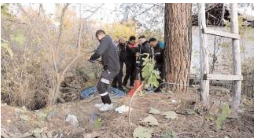
Olay Osmançık'ta meydana geldi.

MAHALLE SAKİNLERİNDEN TEŞEKKÜR Kurtarma operasyonu sırasında çevrede toplanan mahalle sakinleri, ekiplerin hızlı müdahalesinden dolayı memnuniyetlerini dile getirdi. Vatandaşlardan biri, "Kediyi o halde duyunca çok üzüldük. İtfaiye ekiplerine haber verdik ve kısa sürede gelip kurtardılar. Onlara minnettarız" dedi.