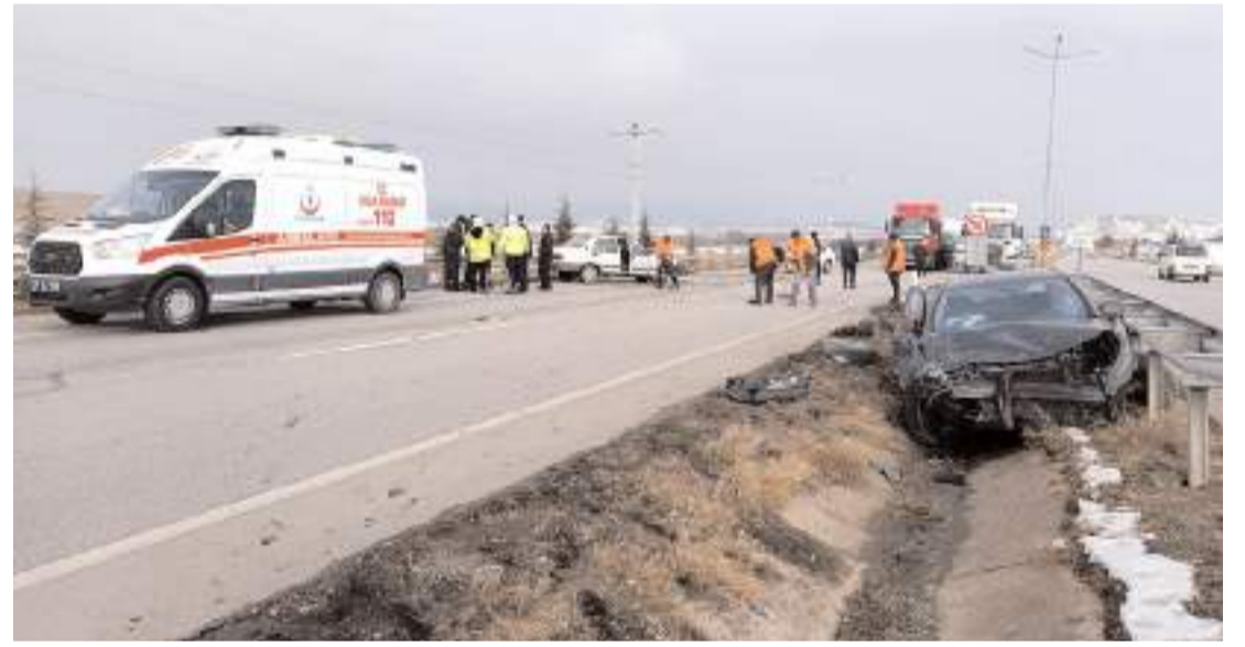
Kaza Sungurlu-Ankara kara yolu 10. kilometresinde meydana geldi.

Kazada motosikletin çarptığı araçlarda da hasar meydana geldi.(AA)