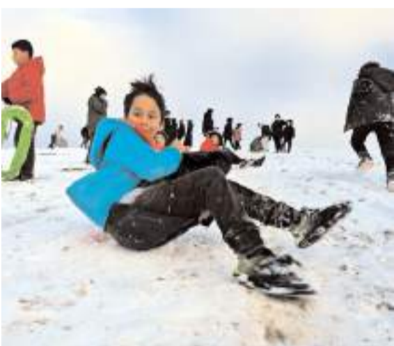
Çocuklar Kale Mahallesi Ekin Caddesi'nde bulunan tepede toplandılar.