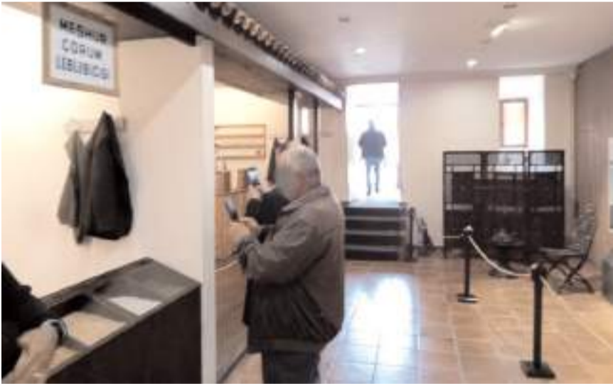
Yükümlüler Çorum Müzesini gezdiler.