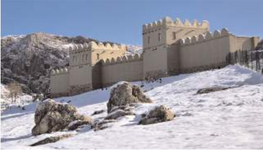
Hattuşa, kar yağışıyla birlikte beyaz örtüyle kaplandı.