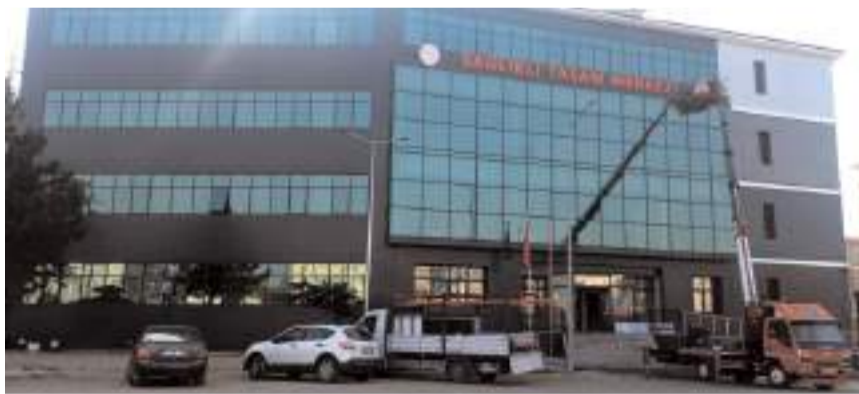
Sağlıklı Yaşam Merkezinin inşaatı tamamlandı.