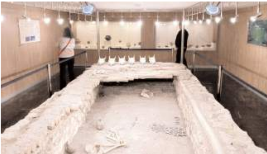
Yükümlüler müze sergilenen eserleri incelediler.

Çorum'da Denetimli Serbestlik Şube Müdürlüğüne denetim ve takibi yapılan yükümlülerin Çorum Müzesi'ni gezdiği bildirildi.