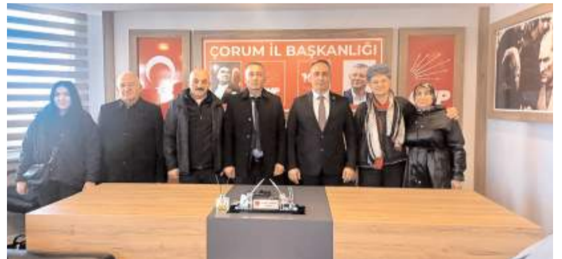
Sendika yönetimi CHP İl Başkanı Av. Dinçer Solmaz'a çalışmalarını hakkında bilgi verdi.

CHP İl Başkanı Dinçer Solmaz, Birleşik Emekliler Sendikası yöneticilerini tebrik ederek başarılar ve kolaylıklar diledi. (Haber Merkezi)