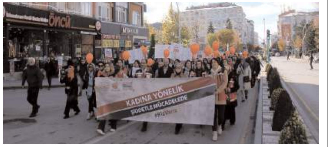
Aile ve Sosyal Hizmetler İl Müdürlüğü, Kadına Yönelik Şiddete Karşı Uluslararası Mücadele Günü nedeniyle etkinlikler gerçekleştirdi.