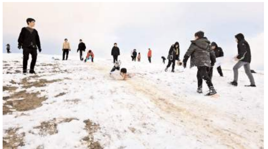
Çocuklar tepeyi kayak pistine çevirdiler.

Çorum'da etkili olan kar yağışı sonrası tepeyi kayak pistine çeviren çocuklar doyusya eğlendi.