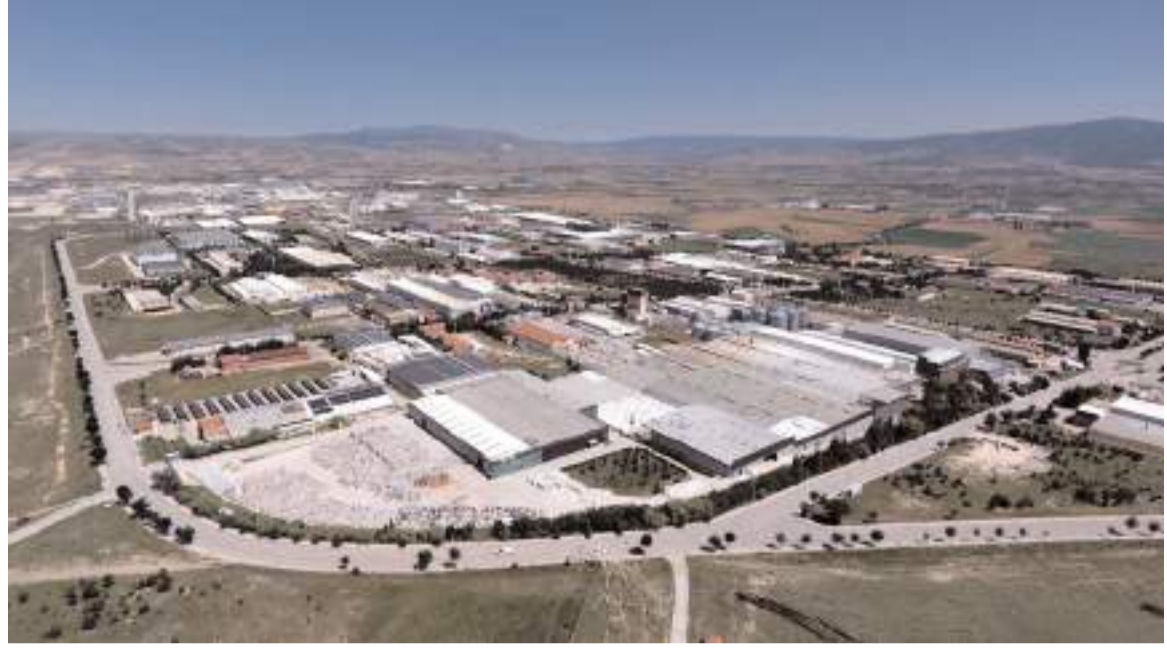
Çorum'da Ekim'de ihracat yüzde 35,12, ithalat ise yüzde 23,24 artış gösterdi.

Tokat'ta ihracat 4,4 milyon dolar, ithalat 1,9 milyon dolar, Amasya'da ise ihracat 13,6 milyon dolar, ithalat 3,9 milyon dolar olarak gerçekleşti.