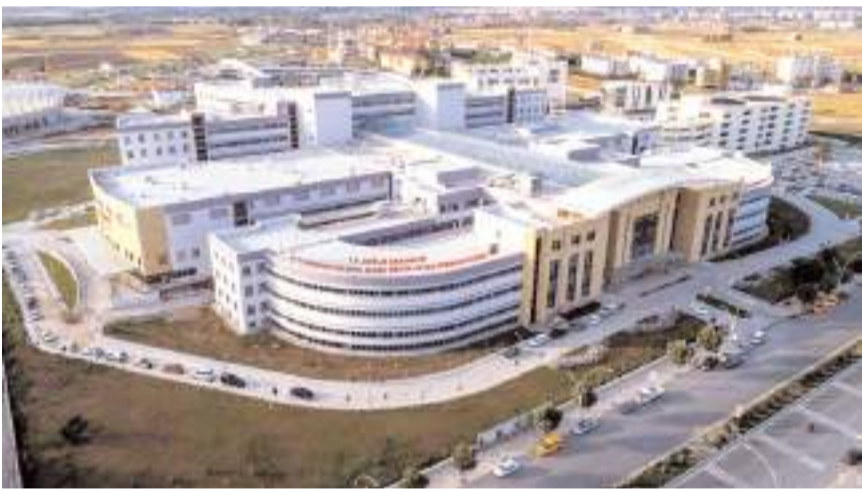
Ziyarete hastaneye, 100 Yataklı Fizik Tedavi ve Rehabilitasyon (FTR) servisi ek binası ve 100 yataklı psikiyatri/kapalı Psikiyatri Servisi Ek Hizmet binası talep edildi.