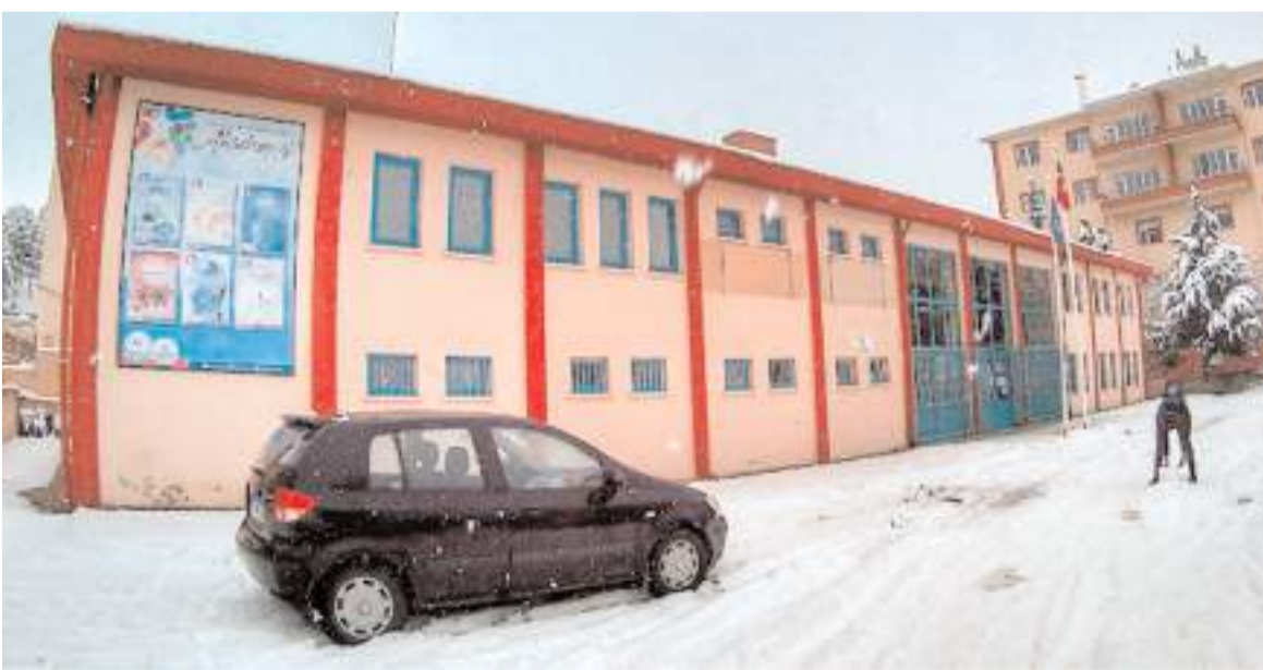
Mahmut Atalay Gençlik Merkezi için yıkım kararı alındı.

Bıraktırma Odası'ndan, gebelik takibine kadar, mamografi cihazından dış sağlığı ile ilgili ünitelere kadar bir çok üniteyi bünyesinde barındırıyor.