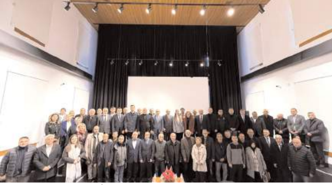
Çorum İskilip Kaymakamlığına "Kuvayı Milliye Müftüsü İskilipli İsmail Hakkı Efendi Konferansı" düzenlendi.