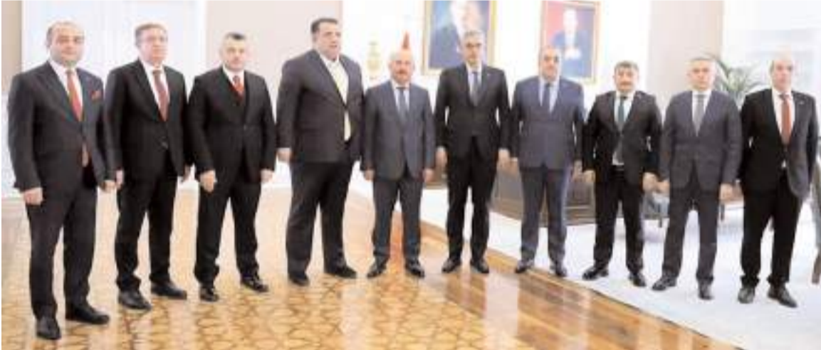
Çorum heyeti Sağlık Bakanı Prof. Dr. Kemal Memişoğlu'nu ziyaret etti.