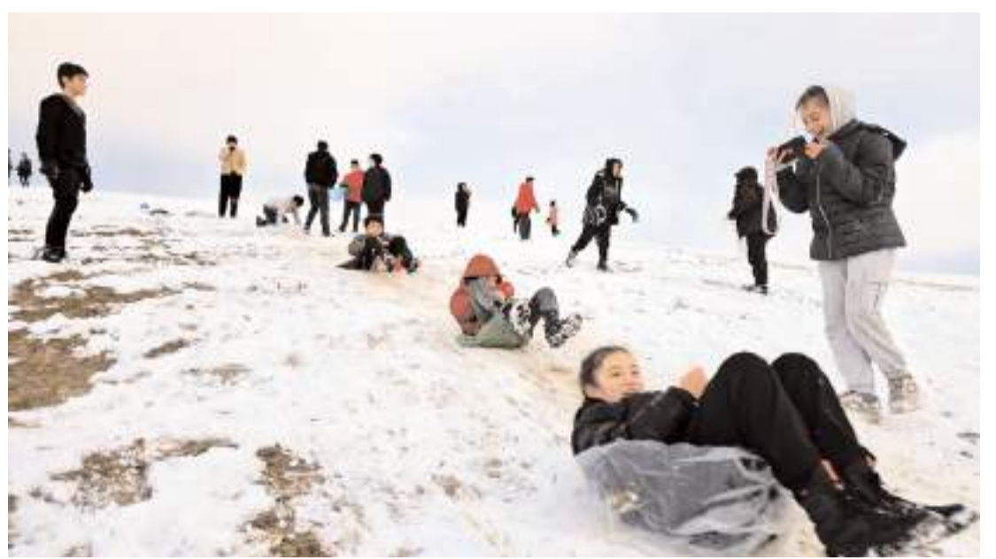
Yağan karın ardından çocuklara gönüllerince eğlendiler.

"Bu çerçevede denetimli serbestlik müdürlüklerince yükümlülerin iyileştirilmesine yönelik birçok eğitim iyileştirme çalışmaları gerçekleştirilmektedir. Bu etkinliklerle daha önce belki hiç müze ya da kütüphaneye gitmemiş yükümlülerin farkındalıklarının oluşumu ve toplum içerisinde sosyalleşmeleri hedeflenmektedir. Sahadaki benzeri çalışmaların yükümlüler üzerindeki olumlu etkisinin gözlenmesi nedeniyle, bu tür çalışmalar artırılarak devam ettirilmesi hedeflenmektedir."(AA)