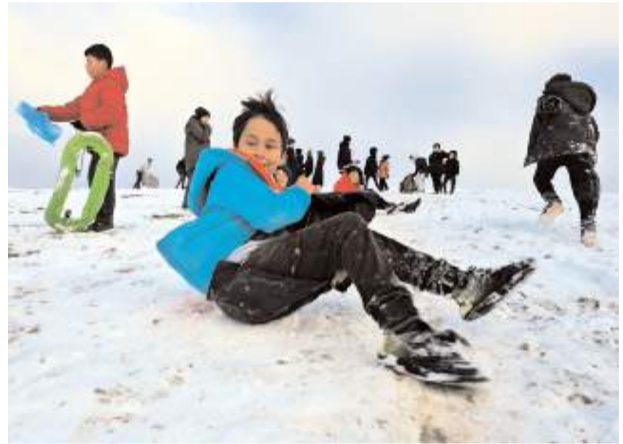
Çocuklar Kale Mahallesi Ekin Caddesi'nde bulunan tepede toplandılar.