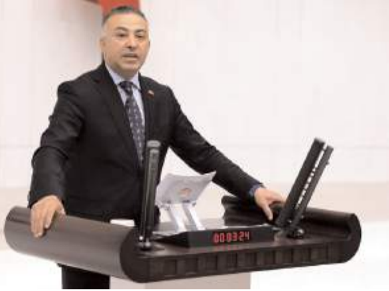
CHP Çorum Milletvekili Mehmet Tahtasız

Boğazkale, İskilip, Uğurludağ ilçelerimiz olmak üzere toplam 120 köyümüzde dolu ve selden etkili, ekili araziler zarar gördü. Hasat edilmemiş hububat alanlarında soğan, pancar, ayçiçeği, mısır, nohut gibi ürünler, sebze ve meyve bahçelerinde ve seralarda büyük ölçüde zarar geldi. Köylerimizin sorununu Türkiye Büyük Millet Meclisinde gündeme getirdik, araştırma önergesi verdik ve tarım sigortası olmayan ekili araziler için de destek çıktı ve 13 Eylül tarihinde AKP Çorum Milletvekilleri dolu ve selden zarar gören çiftçilere 20 milyon TL ödenek ayrıldığı müjdesini verdi. Üzerinden iki buçuk ay geçti ve bu para dağıtılmadı, çiftçilerimizin zararı karşılanmadı. İktidara güvenen çiftçi bir kez daha aldatıldı; parayı alamadı, borç harç yeniden ekim yaptı. Müjde olarak duyurulan bu 20 milyon TL çiftçilerimize neden ekim dikim zamanında dağıtılmıyor. Bu iktidar faizi çok seviyor?" (Haber Merkezi)