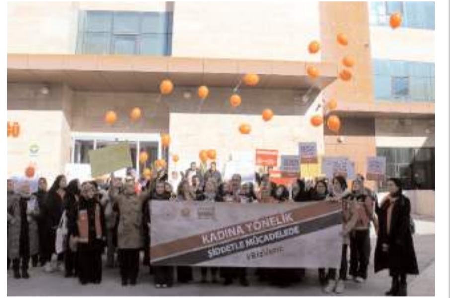
Etkinliklerde kadına yönelik şiddetle mücadelenin önemi vurgulandı.

Aile ve Sosyal Hizmetler İl Müdürlüğü tarafından Hitit Üniversitesi işbirliğinde "Kadının Güçlendirilmesi" konulu panel gerçekleştirildi. Panelde yapılan sunumlarda kadının toplumsal konumu ve kadının güçlendirilmesi, kadına yönelik şiddet ve başvuru mekanizmaları, Şiddet Önleme ve İzleme Merkezi tarafından yürütülen çalışmalar, elektronik kelepçe ve KADES uygulaması konusunda bilgi verildi.