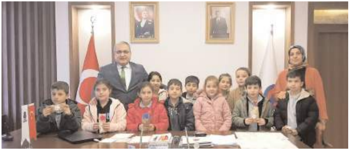
Öğrenciler Bayat Belediye Başkanı Ahmet Bahadır Ünlü'yü ziyaret etti.

Akabinde jüri değerlendirmesine göre dereceye giren öğrencilere ödülleri takdim edilecektir. Program çıkışından Çorum Belediyesi'nin çorba ikramı olacaktır" dedi. (Haber Merkezi)