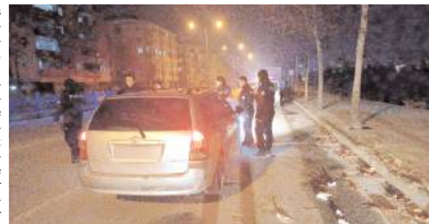
Olay Fevzi Çakmak Caddesi'nde meydana geldi.