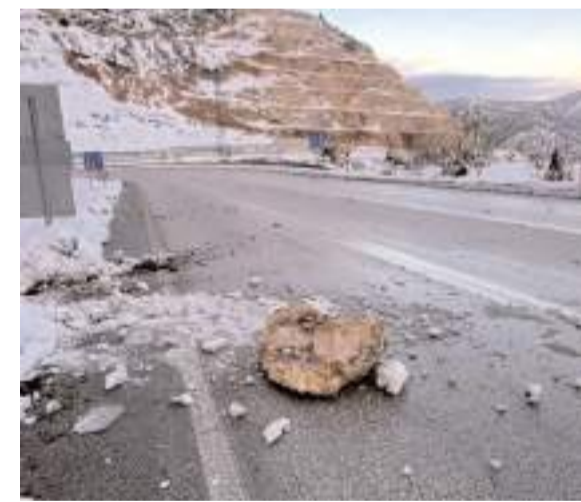
Çorum-Osmancık yolu Kırkdilim geçişinde yola kayalar düştü.