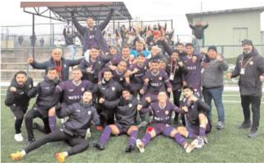
BAL 5. grupta on maçını kazanarak açık ara lider durumda bulunan Karadeniz Ereğlispor son maçında Çilimli deplasmanında kazandıktan sonra toplu halde