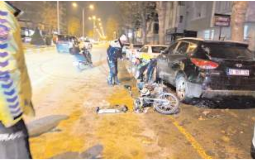
Olay Eşref Hoca Caddesi'nde meydana geldi.

Çorum'da park halindeki araçlara çarpan motosikletin sürücüsü yaralandı.