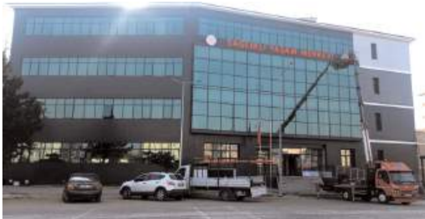
Sağlıklı Yaşam Merkezinin inşaatı tamamlandı.

Zehir, 2 yıl önce çürük raporu bulunan hem tehlike arz etmesi, hem de mahallenin ihtiyaçlarına cevap veremediği için yenilenmesine karar verilen Ulukavak Sağlıklı Yaşam Merkezi'nin iç tefrişatındaki eksikliklerin giderildiğini, bir aksilik olmaması halinde önümüzdeki Cuma günü