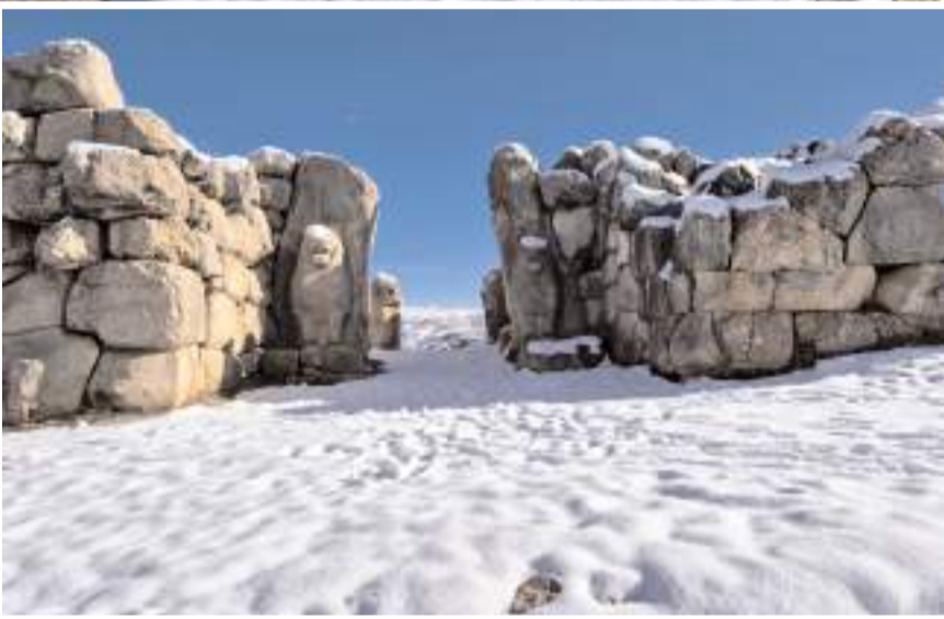
Kar yağışının ardından kartpostallık görüntüler ortaya çıktı.

Çorum'un Boğazkale ilçesinde yer alan Hititlerin başkenti Hattuşa, kar yağışıyla birlikte beyaz örtüyle kaplandı.