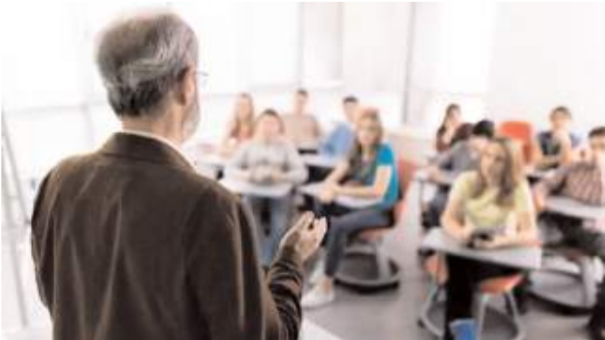
Başvurular 10 Aralık'ta sona erecek.

Bu durumda, aracın toplam satış fiyatı bu kalemlerin birleşimi olarak yaklaşık 1 milyon TL olur. ÖTV, toplam fiyatın önemli bir kısmını oluşturmaktadır (%37,6). Yani vatandaş sıfır otomobili yüzde 37'ye varan indirim avantajıyla satın alabilecek. Sıfır otomobiller ucuzlayacağı için ikinci el otomobil fiyatlarının da düşmesi bekleniyor.