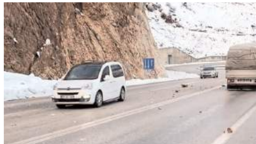
Yola düşen kayalar sürücüler için tehlike saçıyor.

Özellikle akşam saatlerinde, görüş mesafe-