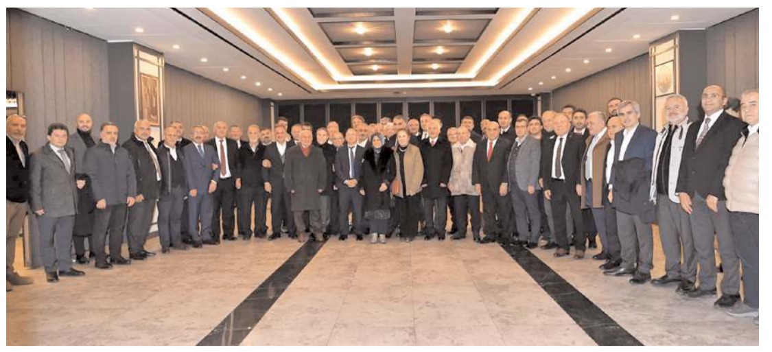
ÇEKVA Ankara Şubesi'nin mütevelli heyet toplantısı İlbank Sosyal Tesisleri'nde yapıldı.