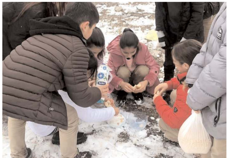
Öğrenciler kar yağışı sebebiyle yaban ve sokak hayvanları için harekete geçti.