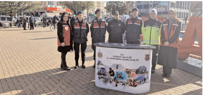
Çalışmayı İl Jandarma Komutanlığı Aile İçi Şiddetle Mücadele ve Çocuk kısmı, Alaca İlçe Jandarma Komutanlığı, Alaca Sosyal Hizmetler Müdürlüğü ve Alaca İlçe Emniyet Müdürlüğü ekipleri gerçekleştirdi.