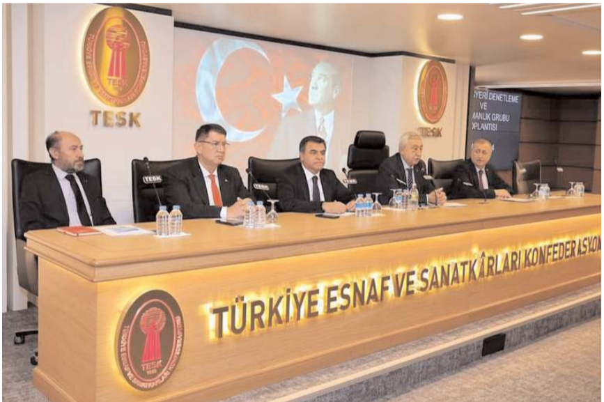
TESK'te yapılan toplantıda esnafın sorun ve talepleri ele alındı.