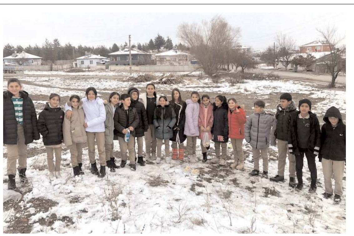
Ortaokul öğrencileri, soğuk hava ve kar yağışı sebebiyle yiyecek bulunamayan hayvanlar için doğaya yiyecek ve su bıraktı.

Etkinlik, öğrencilerin iş fikirlerini hayata geçirmeleri ve sürdürülebilir işletmeler kurmaları için önemli katkı sağladı. (Haber Merkezi)