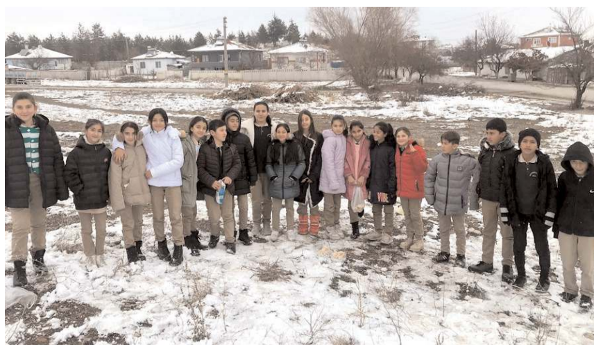
Ortaokul öğrencileri, soğuk hava ve kar yağışı sebebiyle yiyecek bulunamayan hayvanlar için doğaya yiyecek ve su bıraktı.