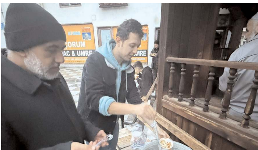
Namazın ardından cemaate çorba ikram ediliyor.