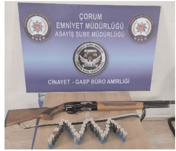
Uygulamalarda 4 ruhsatsız tabanca, 2 kurusıkı tabanca, 8 tüfek ele geçirildi.

Gencin cenazesinin ikametinden çıkarıldığı esnada fenalık geçiren yakınları olay yerine çağrılan sağlık ekiplerince hastaneye kaldırılırken, polis olayla ilgili geniş çaplı soruşturma başlatıldı.