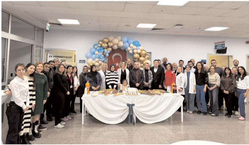
Erol Olçok Eğitim ve Araştırma Hastanesi Ev Hemodiyaliz Ünitesi, 2. yılını düzenlenen programla kutladı.

■ Erol Olçok Eğitim ve Araştırma Hastanesinde faaliyet gösteren Ev Hemodiyaliz Ünitesi, 2. yılını düzenlenen programla kutladı.