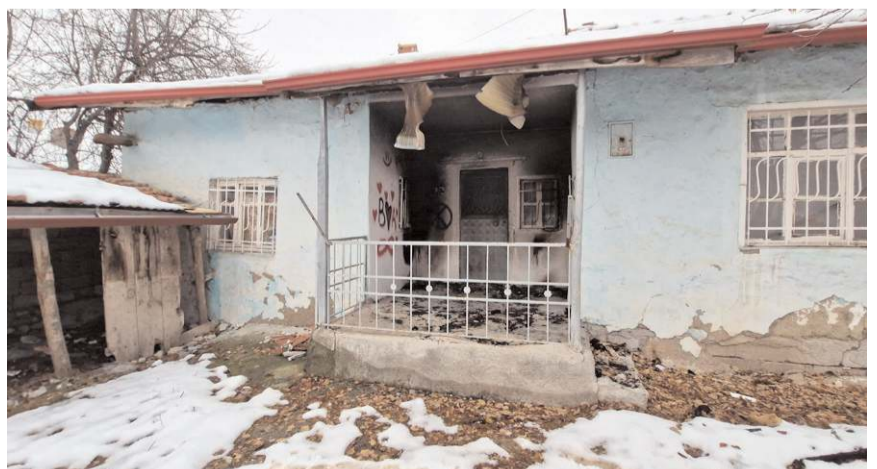
Olay Yıldızhan Mahallesi Papağan Sokak'ta bir evde meydana geldi.