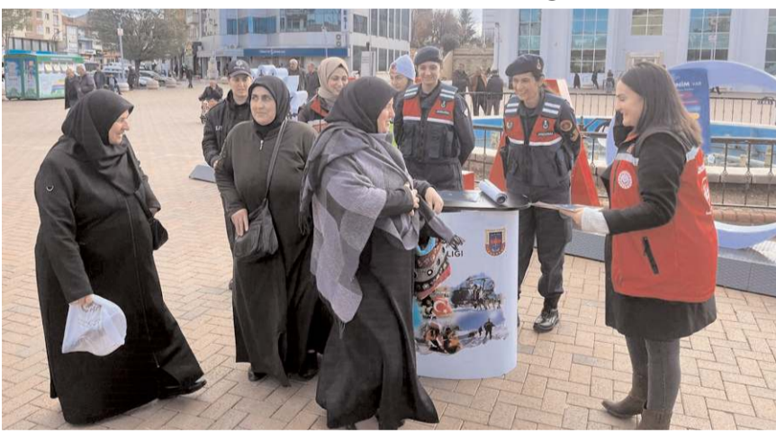
KADES ile uyuşturucuyla mücadele ve aile içi şiddetin önlenmesi ile ilgili önemli bilgiler verildi.