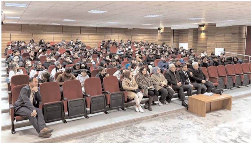
Eğitimler, Osmancık Anadolu İmam Hatip Lisesi ve Sungurlu Sunguroğlu Mesleki ve Teknik Anadolu Lisesinde yapıldı.