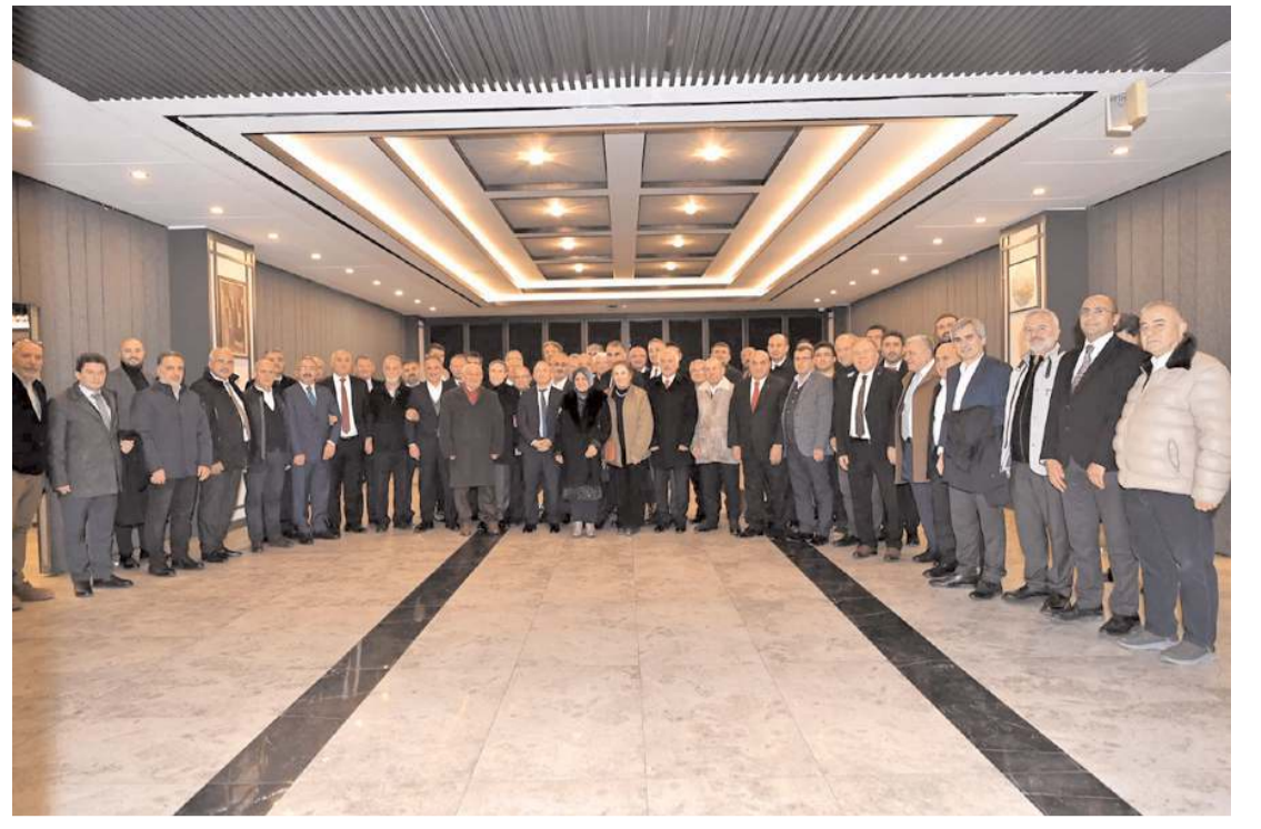
ÇEKVA Ankara Şubesi'nin mütevelli heyet toplantısı İlbank Sosyal Tesisleri'nde yapıldı.

kez müdürü ve kursiyerlere gösterdikleri özverili çalışmalarından dolayı teşekkür etti. (Haber Merkezi)