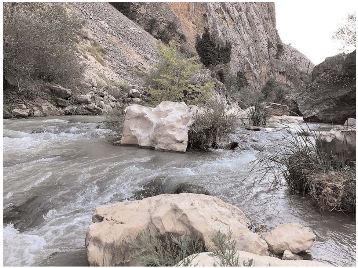
Yozgat'ın Kazankaya köyünde başlayan kanyon, Çorum'un İncesu köyünde son buluyor.

Kanyonda doğa yürüyüşü yapmak isteyenler, kanyonun içindeki yaklaşık 2 kilometre uzunluğundaki yürüyüş yolunu takip edebilirler. Tarih ve doğanın bir araya geldiği bu eşsiz kanyonda ayrıca kampçılık ve fotoğrafçılık da yapabilirsiniz. Doğa ve kuş fotoğrafçılığı yapabileceğiniz kanyona gelirken yürüyüş ayakkabılarını kullanmayı tercih edin. (Haber Merkezi)