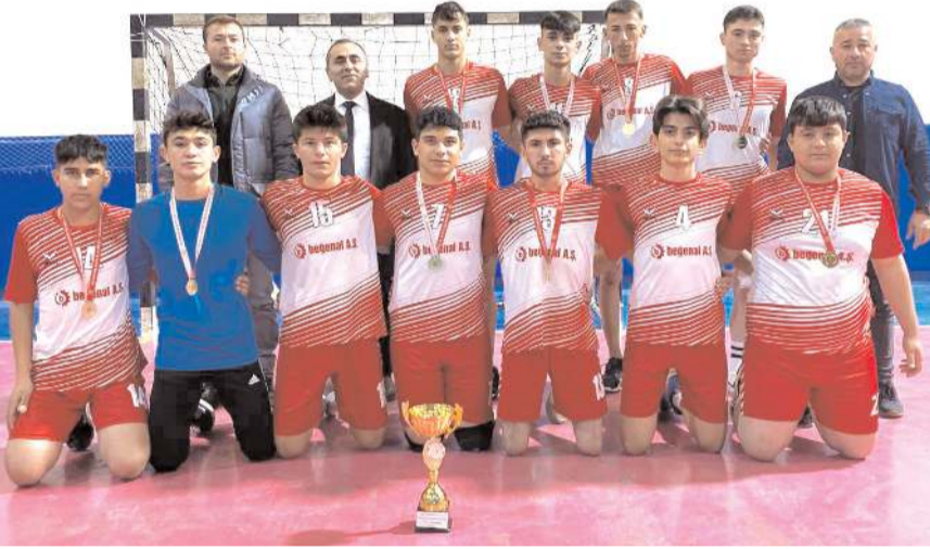
Beş yıldır şampiyonluğu kazanan Şehit Mustafa Solak Anadolu İHL

Bu maçın ardından düzenlenen törenle dereceye giren okullara kupaları verildi. İl birinciliğinde Eti Anadolu Lisesi üçüncü Bahçelievler Anadolu Lisesi ise dördüncülük kupasının sahibi oldular.