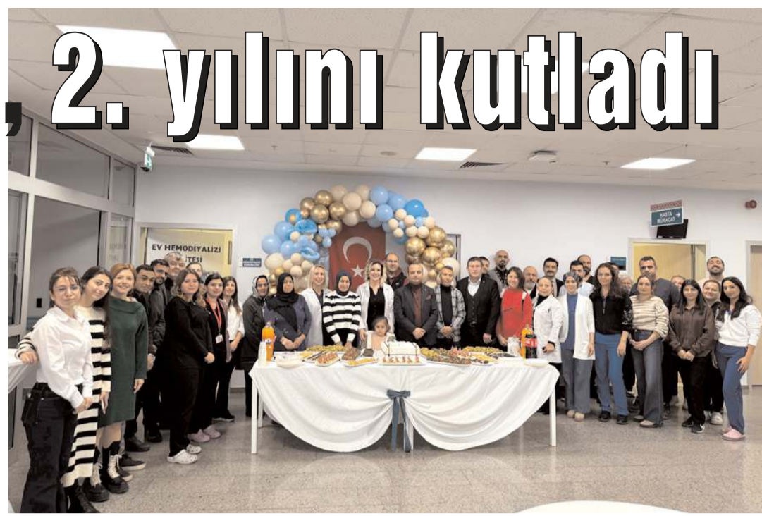
Erol Olçok Eğitim ve Araştırma Hastanesi Ev Hemodiyaliz Ünitesi, 2. yılını düzenlenen programla kutladı.

Hüseyin DELLER (Zeynal oğlu 1967 Çorum doğumlu)