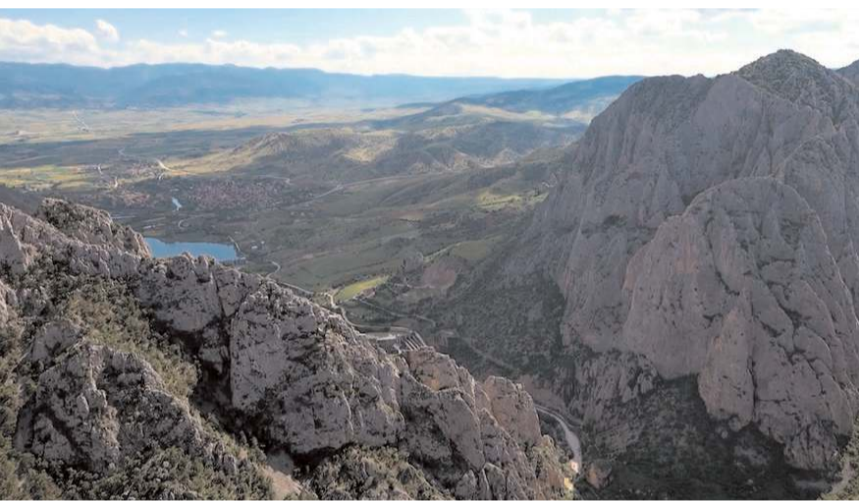
Kanyon doğal güzellikleri ile dikkat çekiyor.