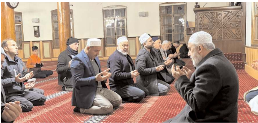
İskilip Müftülüğü "Her Cuma ailece sabah namazında buluşuyoruz" programını başlattı.