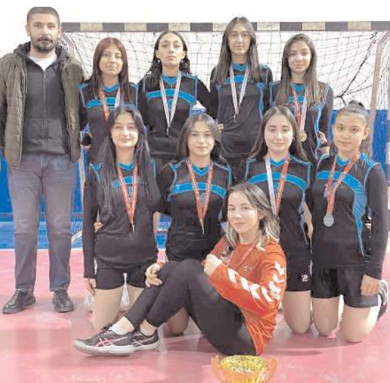
Genç kızlarda şampiyon olan Eti Anadolu Lisesi