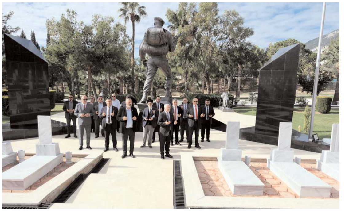
Çorum heyeti Boğazköy Şehitliği'ni ziyaret ederek dua etti.