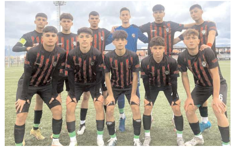
Çorum FK U 16 takımı bugün grup lideri Konyaspor deplasmanında mücadele edecek

Yarın saat 12'de Devane sahasında oynanacak ilk maçta Çorum FK ve Keçiöregücü U 14 takımları karşılaşacak. Ligde sekizinci