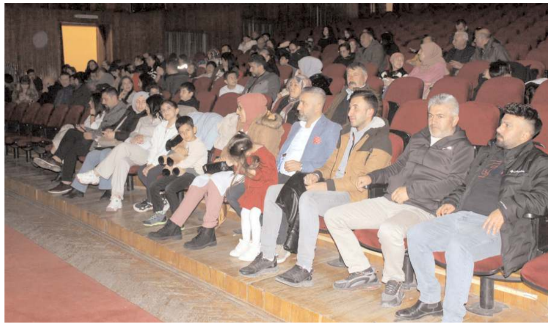
Konferans Devlet Tiyatro Salonu'nda yapıldı.