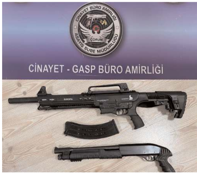
Uygulamalarda 4 ruhsatsız tabanca, 2 kurusıkı tabanca, 8 tüfek ele geçirildi.