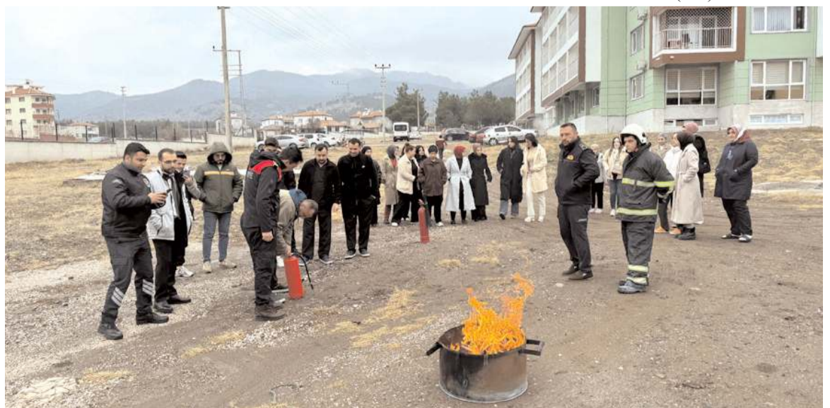
Eğitimi Osmancık Belediyesi Afet İşleri Müdürlüğü ekipleri verdi.