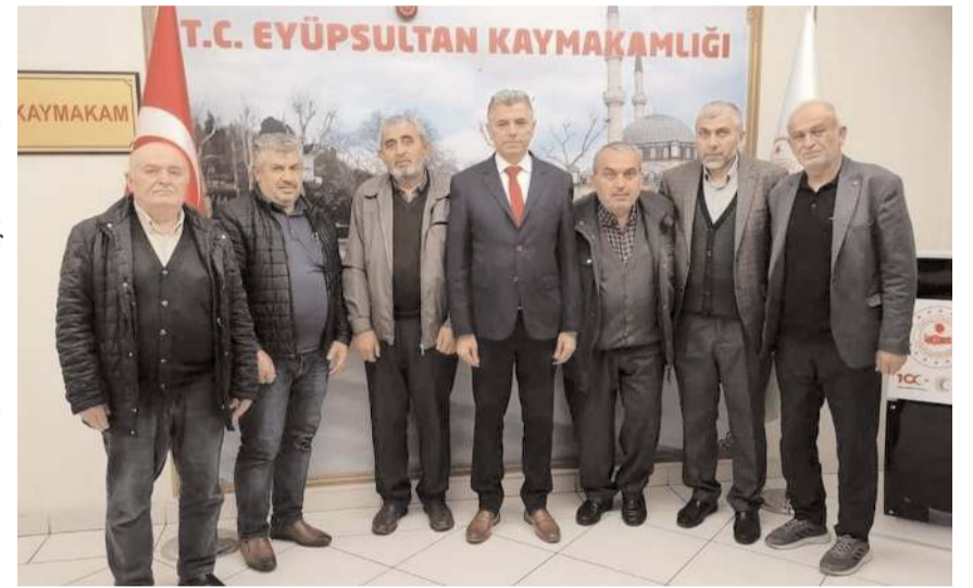
Ziyaretin sonunda hatıra fotoğrafı çekildi.