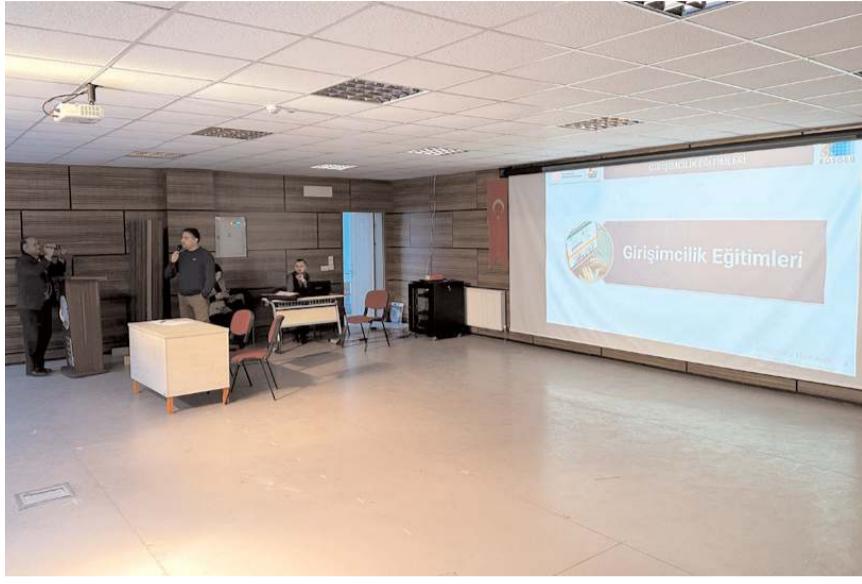
Eğitimler KOSGEB Çorum Müdürlüğü tarafından verildi.