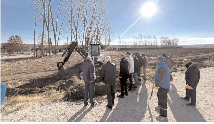
Alaca Belediye Başkanı Şerif Arslan, çalışmaları yerinde inceledi.