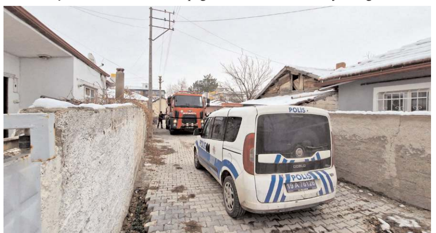
Yangın itfaiye ekiplerinin hızlı müdahalesi ile büyümeden söndürüldü.

Çorum'un Alaca ilçesinde bir evde çıkan yangın itfaiye ekiplerinin hızlı müdahalesi ile büyümeden söndürüldü.