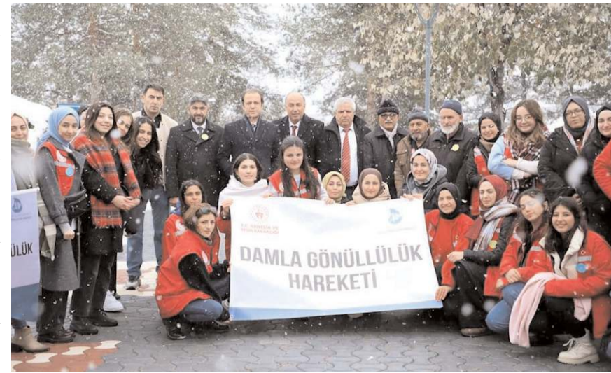
Gençler Alaca'da çeşitli faaliyetler gerçekleştirdiler.