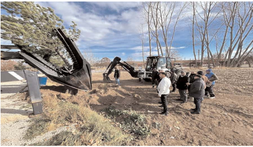
Yeni otoparkın çevresinde başlatılan ağaçlandırma çalışmaları tüm hızıyla devam ediyor.