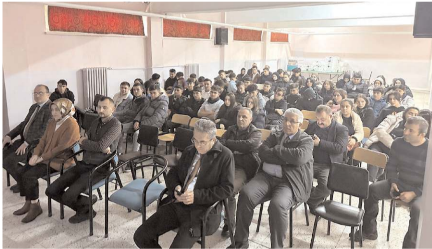
Öğrencilere KOSGEB desteklerinden nasıl faydalanabilecekleri konularında ve ticaret hayatı ile ilgili temel bilgiler verildi.

KOSGEB Çorum Müdürlüğü, Ticaret İl Müdürlüğü, SGK İl Müdürlüğü ve Vergi Dairesi Müdürlüğü iş birliği ile Osmancık Anadolu İmam Hatip Lisesi ve Sungurlu Sunguroğlu Mesleki ve Teknik Anadolu Lisesi öğrencilerine öğrencilerin "ticaret hayatına daha donanımlı ve farkındalıkları daha yüksek şekilde hazırlanmaları" konulu bilgilendirme toplantısı yapıldı.