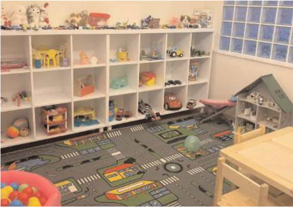
Oyun terapi Odası

Panik Bozukluk ve Agorafobi, Sosyal Kaygı Bozukluğu, Travma Sonrası Stres Bozukluğu, Obsesif-Kompulsif Bozukluk, Yaygın Kaygı Bozukluğu, Majör Depresyon, Yeme Bozuklukları, Kişilik Bozuklukları ve Oyun Terapisi alanlarında hizmet vermeye başlayan merkez ayrıca gelişimsel tarama testide yapıyor.