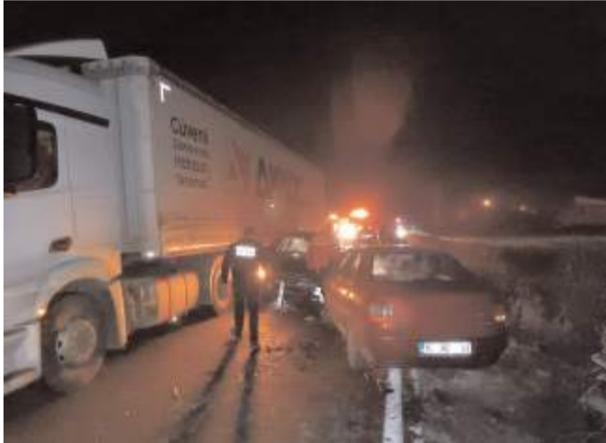
Kazaya 4 araç karıştı.