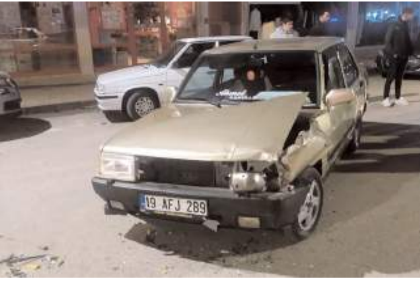
Kaza, Alaca ilçesi Zile Caddesi'nde meydana geldi.