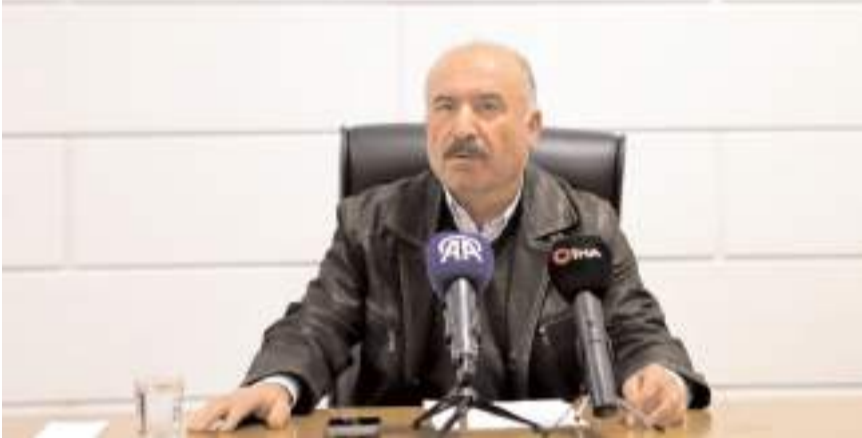
Çorum Valisi Ali Çalgan