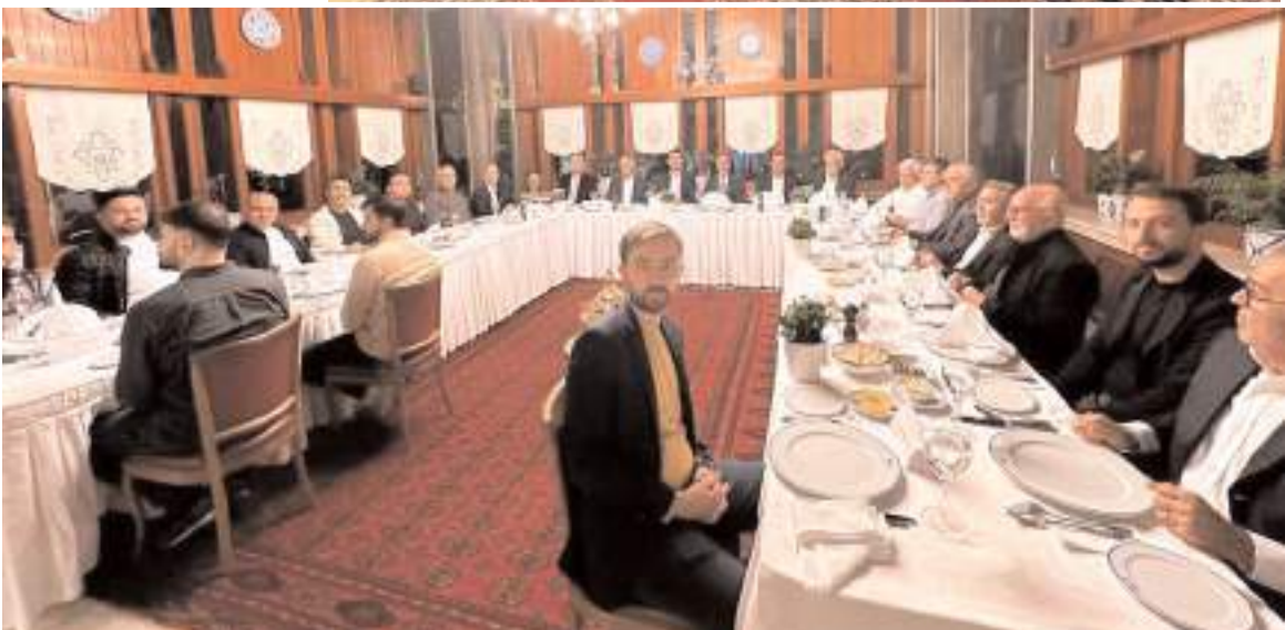
Toplantıda, Organize Sanayi Bölgesinin son durumu hakkında iş insanlarına bilgi verildi.