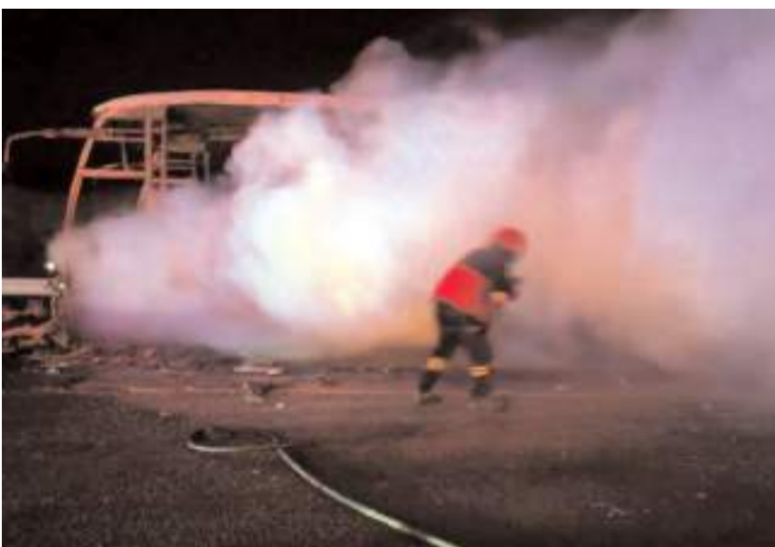
Olay Kırıkkale-Çorum karayolu Hacıobası köyü mevkiinde meydana geldi.

3 personel ve 14 yolcunun bulunduğu otobüste can kaybı ya da yaralanan olmazken, yangınla ilgili inceleme başlatıldı. (İHA)