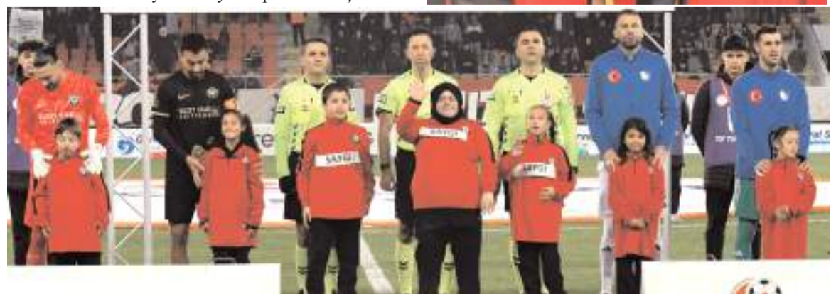
Özel Öğrenciler maçın seronomisinde hakemler ve iki takım oyuncularını birlikte çıktılar