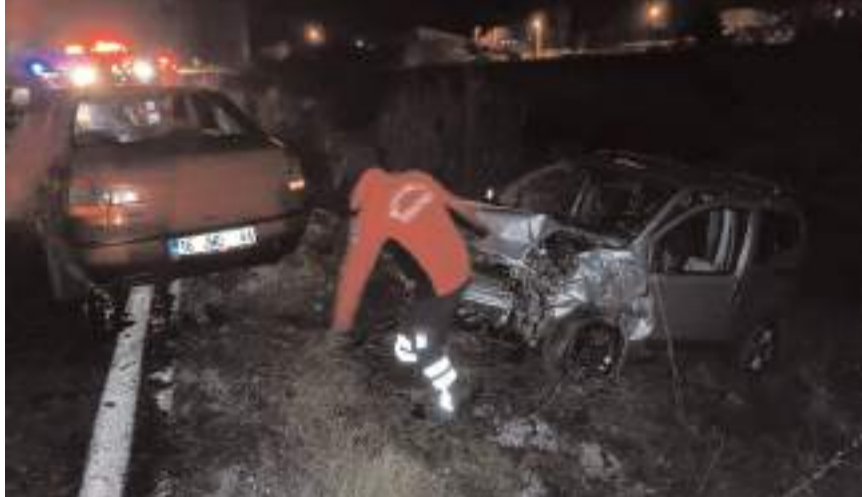
Kazada araçlarda maddi hasar meydana geldi.