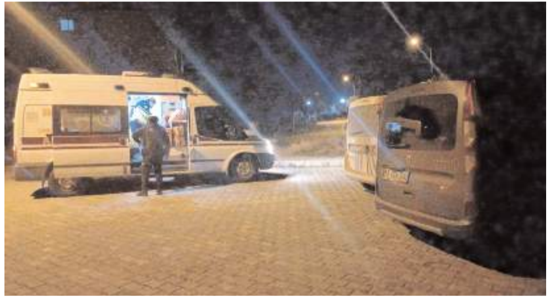
Ekipler olay yerinde inceleme yaptı.

Olayla ilgili inceleme başlatıldı. (İHA)