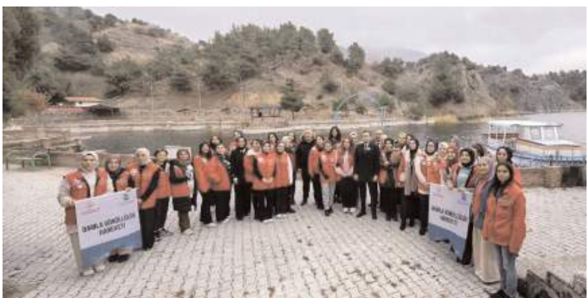
Gençler Obruk Baraj gölü kenarında hatıra fotoğrafı çekindiler.