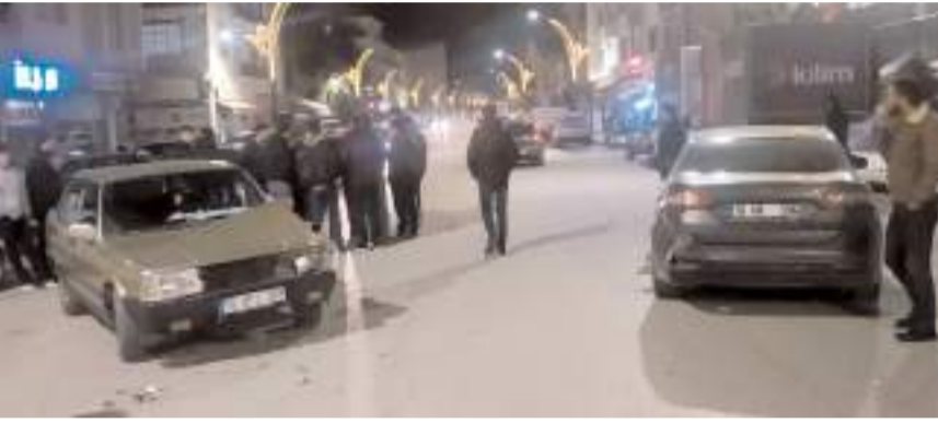
Kazada her iki araçta da maddi hasar meydana geldi.

Çorum'un Alaca ilçesinde iki otomobilin çarpışması neticesinde meydana gelen kazada 1 kişi yaralandı.