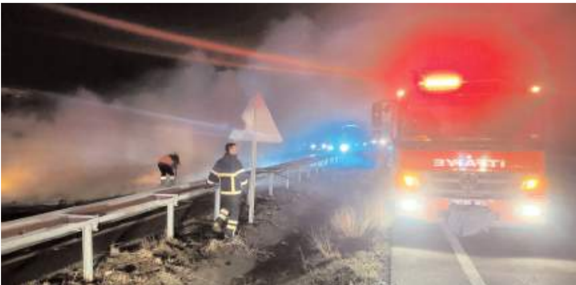
İtfaiye ekipleri yangını söndürdü.

Yaşama sevinci ile hayata tutunan bütün engelli kardeşlerimizin sadece bir gün değil her gün yanındayız.