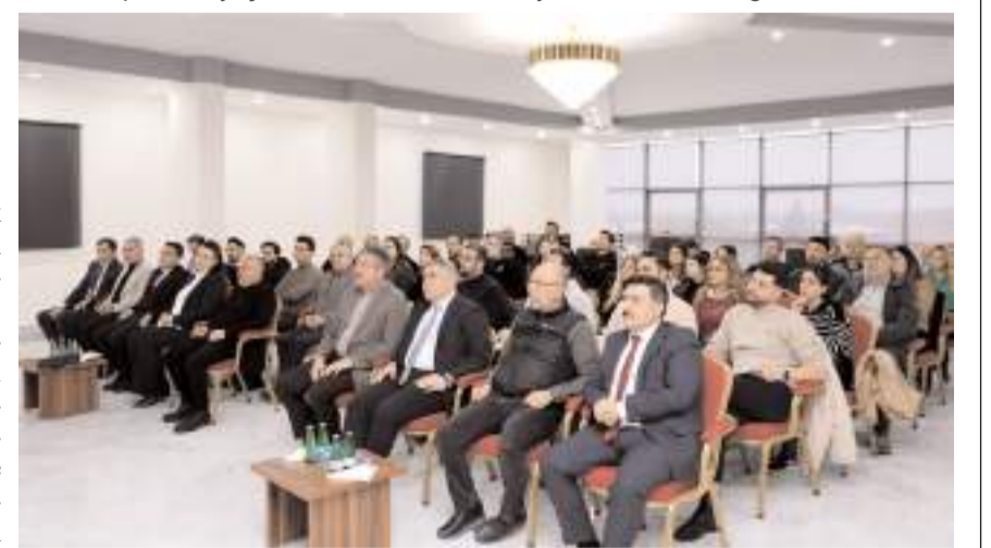
Program Merzifon OSB'nin ev sahipliğinde yapıldı.

deki işletmelerin küresel pazarda daha rekabetçi hale gelmelerine katkı sağlamak yönündeki hedefleri vurgulandı.