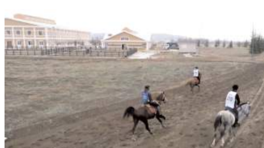
Binicilik tesisinde ilk uluslararası yarışmalarda üç kategoride mücadele yapıldı

mına ve binicilik sporunun daha geniş kitlelere ulaşmasına katkı sağlarken, şehrin spor tarihinde unutulmaz bir sayfa olarak yerini aldı.