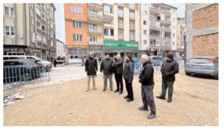
Başkan Aşgın, çevre binalarda yapılan çalışmalar hakkında bilgi aldı.