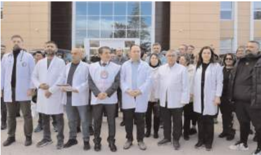
Aile hekimleri geçtiğimiz günlerde açıklama yaparak yeni düzenlemeye tepki göstermişlerdi.

Söz konusu alınan karar doğrultusunda ülke genelinde olduğu gibi Sakarya'daki aile hekimleri de bugün itibarıyla 5 gün süreyle iş bıraktı. Muayene olmak için aile sağlığı merkezlerine giden ve kapıdan geri dönmek zorunda kalan vatandaşlar duruma tepki gösterdi.