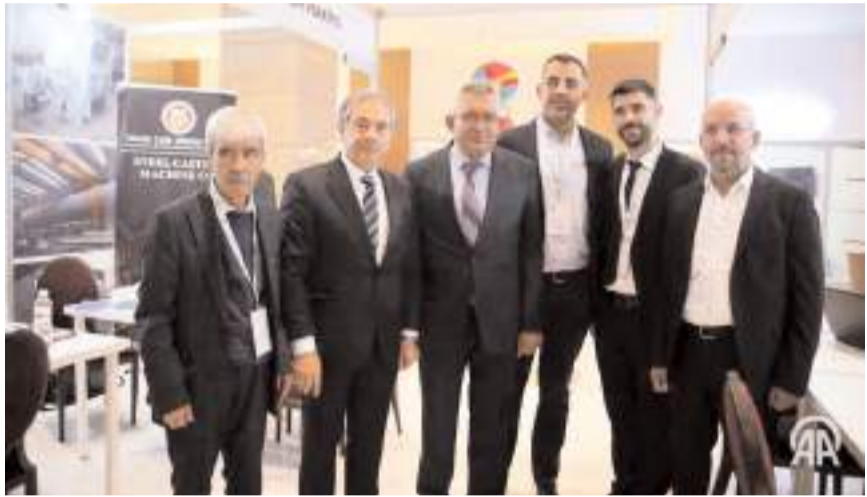
Türkiye'nin Tunus Büyükelçisi Ahmet Misbah Demircan fuarı Teknik Çelik Döküm sahibi Veli Hoşgör ile gezdi.

Cumhurbaşkanımızın taşıdığı "Yeni Türkiye Yüzyılı" vizyonu kapsamında üretici ve tüccarlarımızla birlikte bu başarıları yakalayaarak ihracat hedeflerimize yürüyoruz. Bu başarıda inşaat sektörünün tüm oyuncularını (müteahhitler, üreticiler, makine imalatçıları ve sanayiciler) kilit rol oynuyor. Kendilerine şükranlarımızı sunuyor, başarılarının devamını diliyoruz."