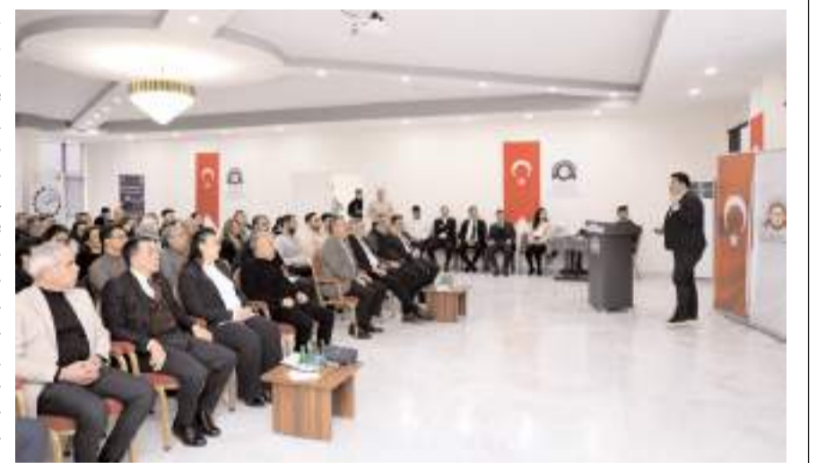
Toplantıda yeşil mutabakat ve karbon ayak izi hakkında bilgiler verildi.