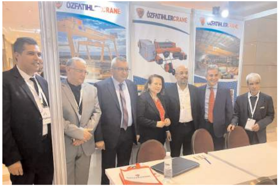
Fuarda Türkiye'yi temsilen katılan global ölçekli 6 firma arasında Çorum Teknik Çelik Döküm de yer aldı.