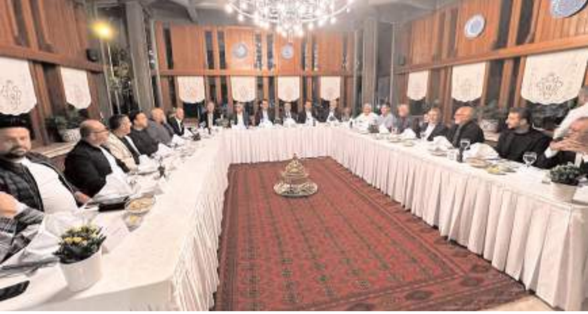
İstanbul'da yapılan toplantıda Sungurlulu iş adamları buluştu.

Toplantı sırasında 50 yıl önceki yaşadıkları anıları tazeleyen sınıf arkadaşları, günün anısına bir de hatıra fotoğrafı çekti. (Haber Merkezi)