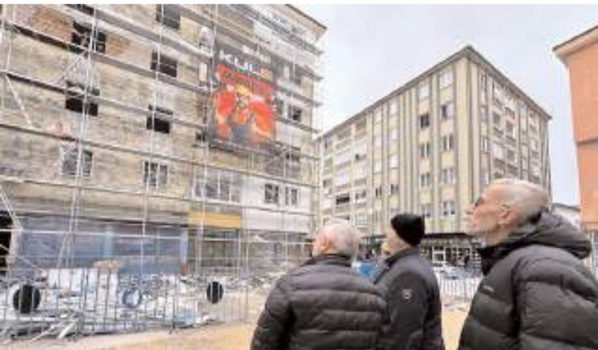
Başkan Aşgın, çalışmalarını yerinde inceledi.

■ Geçen ay Osmancık Caddesi'nde meydana gelen doğal gaz patlamasında zarar gören Arıncı Apartmanı'nda tadilat çalışması yapılıyor.