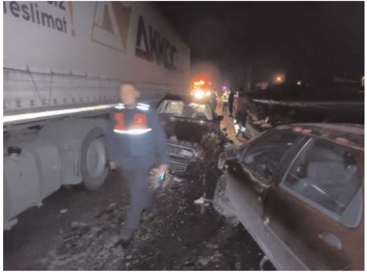
Kaza Sungurlu-Alaca kara yolu Şekerhacılı köyü yakınlarında meydana geldi.