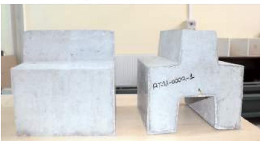
Firma askeri amaçlı beton bloklar üretecek.