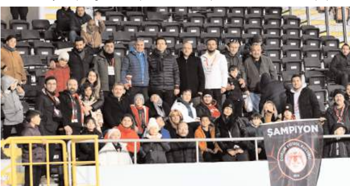
Çorum 100. Yıl Özel Eğitim Uygulama Okulu öğrenci, öğretmen ve idarecilere ile sporcu velileri Çorum FK'nın misafiri olarak seronomisinin ardından özel tribünde maçı birlikte izlediler

Serenomiyeye Çorum FK özel öğrenciler ile birlikte 'Aynı bahçenin farklı çiçekleriyiz' pankartı ile çıkarken Erzurumspor ise 'Şiddete seyirci kalma' KADEM' yazılı pankart ile çıktılar.