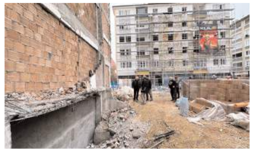
Patlamada ağır hasar gören Hilal Apartmanı yıkılmıştı.