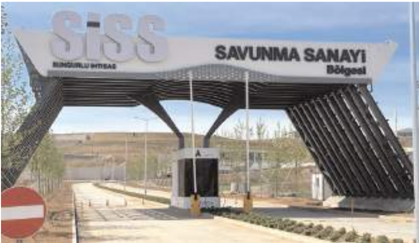
SNG Defence için toplam 15.268,83 m2 alanlı iki parsel tahsis edildi.