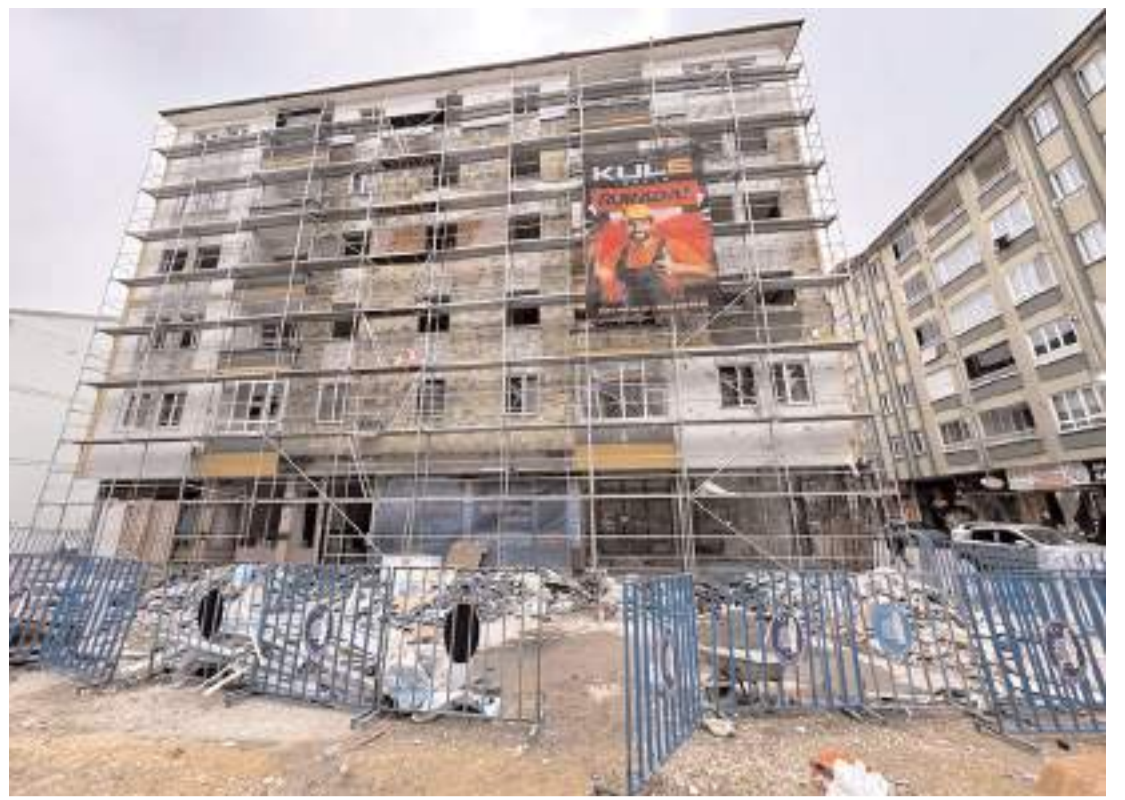
Patlamada dış cephesi zarar gören Arıncı Apartmanı'nda tadilat çalışması gerçekleştiriliyor.