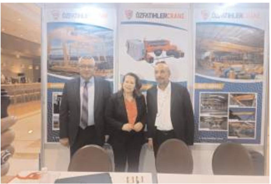
Tunus Sanayi, Maden ve Enerji Bakanı Fatma Thabet Chiboub