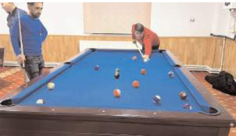
Gençler merkezde çeşitli oyunlar oynayabiliyor.