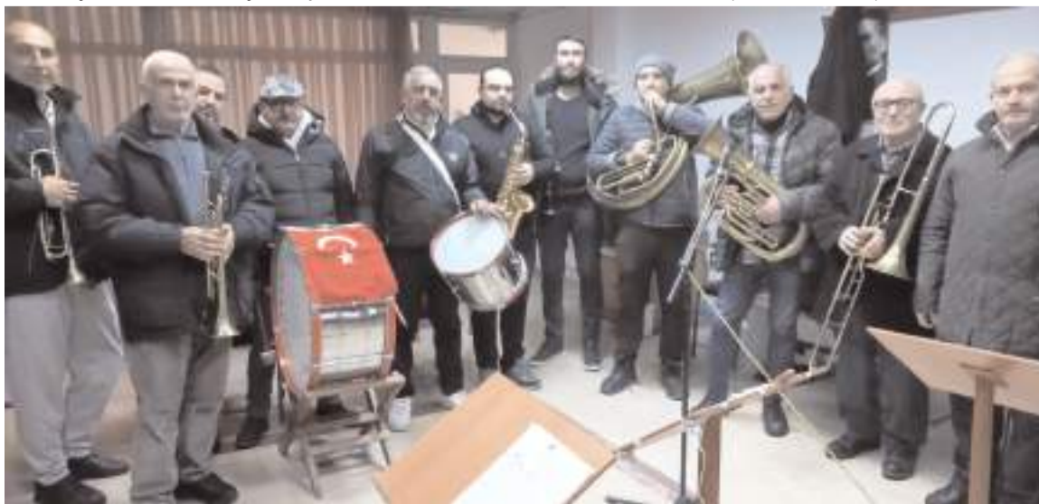
Çorum Belediyesi Bando Takımı, çalışmalarını Yunus Emre İş Merkezinde yürütüyor.

Bando Takımı elemanlarından bazıları emekli iken, bazılarının sosyal güvenlik primlerini kendilerinin yatırdığı, çoğunun ikinci bir iş yapmak zorunda olduğu belirtilerek, Belediye yetkililerinden ilgi beklendikleri ifade edildi. (Haber Merkezi)