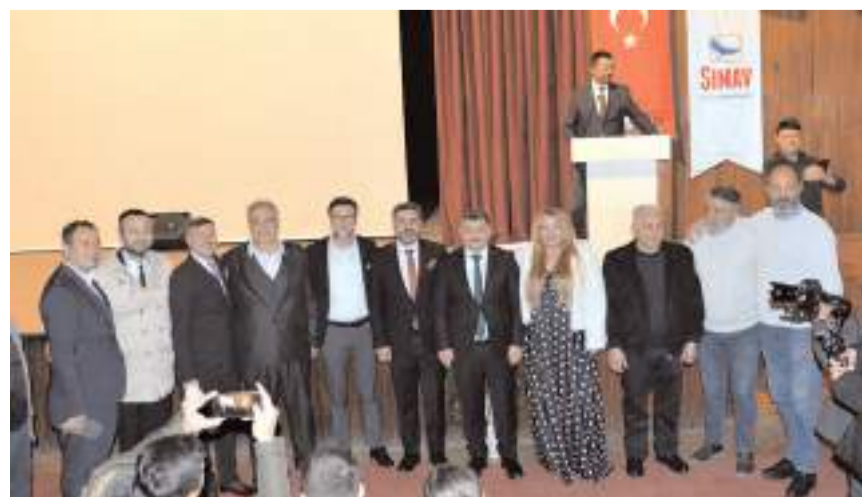
Çam Yarması 2 filminin galası, Devlet Tiyatrosu Salonu'nda yapıldı.