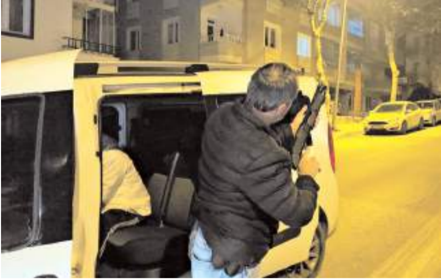
Olay Kale Mahallesi Hamit Duran Caddesi'nde yaşandı.

Şüphelilerin, iş yeri sahibi ile alacak meselesi nedeniyle husumetli olduğu öğrenildi.(AA)