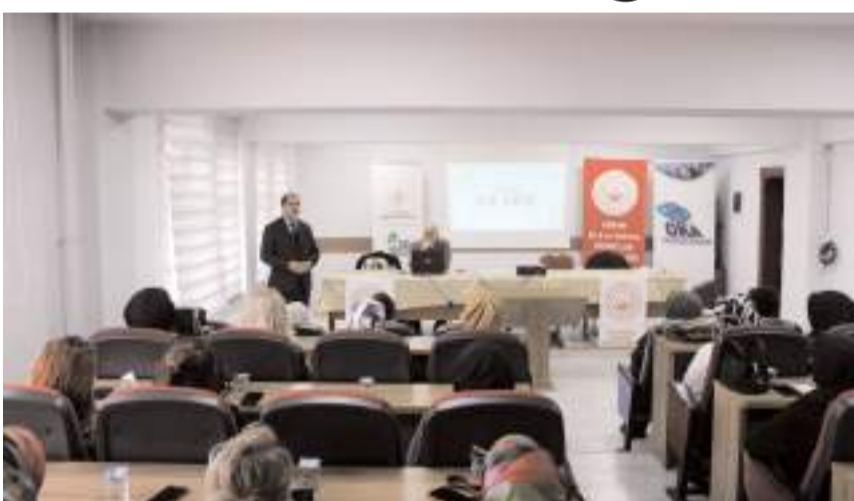
Eğitim OKA ve Çorum Aile ve Sosyal Hizmetler İl Müdürlüğü iş birliğiyle yapıldı.

Programda; İnternet Üzerinden Satışın Avantajları, E-Ticarete Konu Ürünlerin Belirlenmesi, Web Sitesi ve Çevrim İçi Pazar Yerlerinin Kurulması, E-Ticaret İçin Sosyal Medya Araçlarının Kullanılması konularında eğitim verildi, sürdürülebilir girişimler