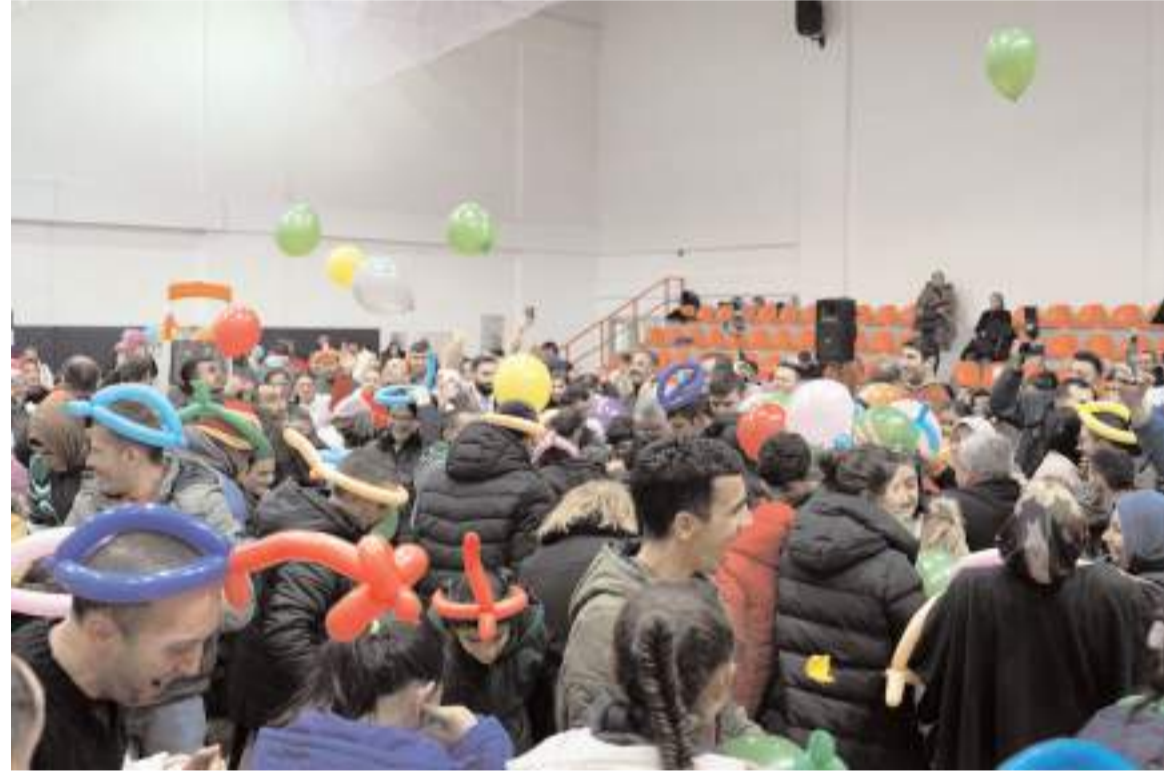
Öğrenciler programda gönüllerince vakit geçirdiler.