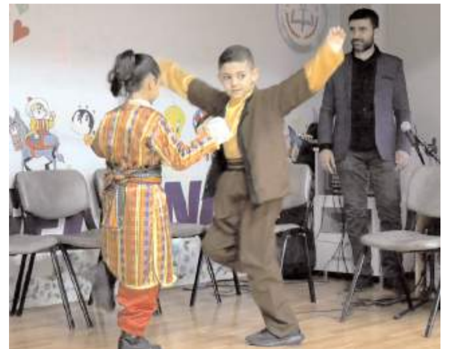
Zeybek gösterisi ilgi çaktı.