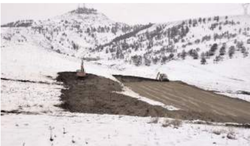
Proje kapsamında 364 adet konut ve 1 adet ticaret merkezi inşa edilecek.