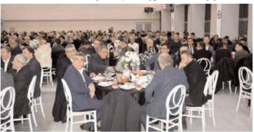
Toplantıya katılım yüksek oldu.