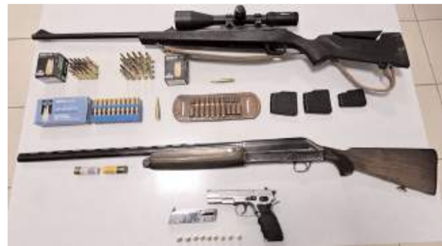
4 adet ruhsatsız tüfek ve 1 adet tabanca ele geçirildi.

İnönü Caddesi'nde şüphe üzerine durdurulan C.S. isimli bir şahsın GBT sorgulaması yapıldı. Yapılan kontrollerde şahsın 'mala zarar verme' suçundan arandığı tespit edildi. (İHA)