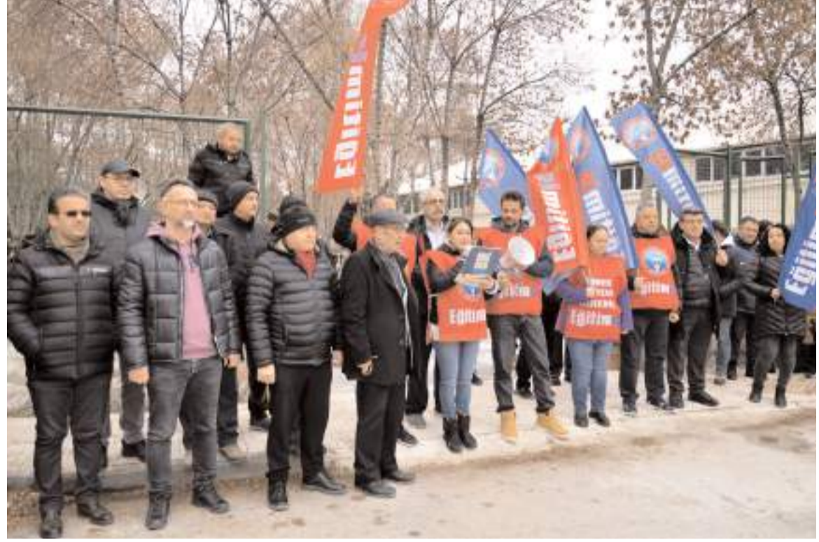
Okul bahçesinde yapılan basın açıklamasına sendika üyeleri de katıldı.

ama buna rağmen belediyenin ısrarla park yaptığını dile getiren Üreyen, konuşmasının devamında şu ifadelerle yer verdi; "Belediye başkanına soruyoruz; Okul bahçesini işgal edip, "park yaptık" diye site-nizden ilan ettiğiniz gibi, bahçeye getirmiş olduğunuz "üç kamelya/ çardak ile, birkaç malzemeyi" adeta talan eder gibi sökülüp götürüşünüzü ve nedenlerini de sitenizden ilan edecek misiniz? İlan etmeniz gerekmez mi? Bahçenin bölünüp, park yapılma kararınıza ilk günden, okulda çalışanlar, "uygun olmayacağını", "okul bahçesi içerisinde parkın sorunlara sebep olacağını" söylediler ama siz ve dönemin Milli Eğitim müdürü ısrar ettiniz. Yaşanılan bu sorunları, öğretmenlerimiz öngörüp sizlere anlatmaya çalıştı ancak siz dinlemediniz. Bu ısrarda amacınız ne idi? Okul çalışanlarını tedirgin ettiniz. Halkın parasını, onca emeği rastgele savurdunuz. Buna hakkınız var mı? Koskoca bir ili, böyle deneme yanılma ile mi yönetiyorsunuz? Böylesine bir öngörü yoksunluğunu nasıl açıklıyorsunuz?