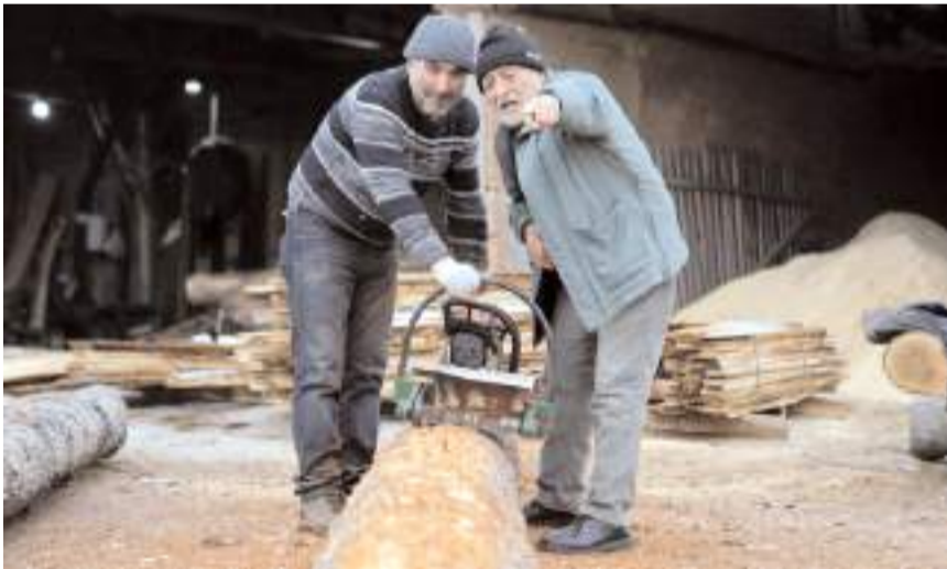
Makine TÜRKPATENT'ten tescil belgesi aldı.