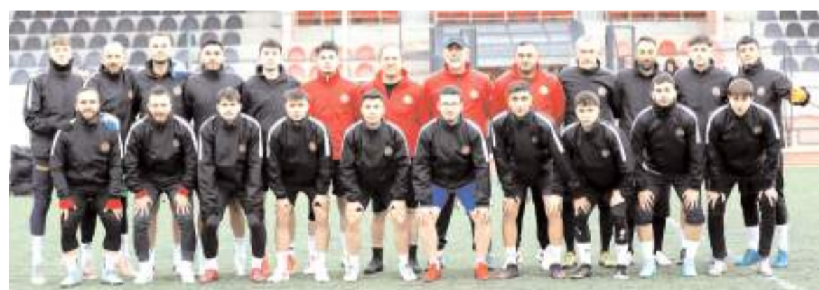
Yeni sezonda 1. Amatör Küme'de mücadele edecek Alaca Belediyespor takımı sezonunu ilk antrenmanı öncesi toplu halde