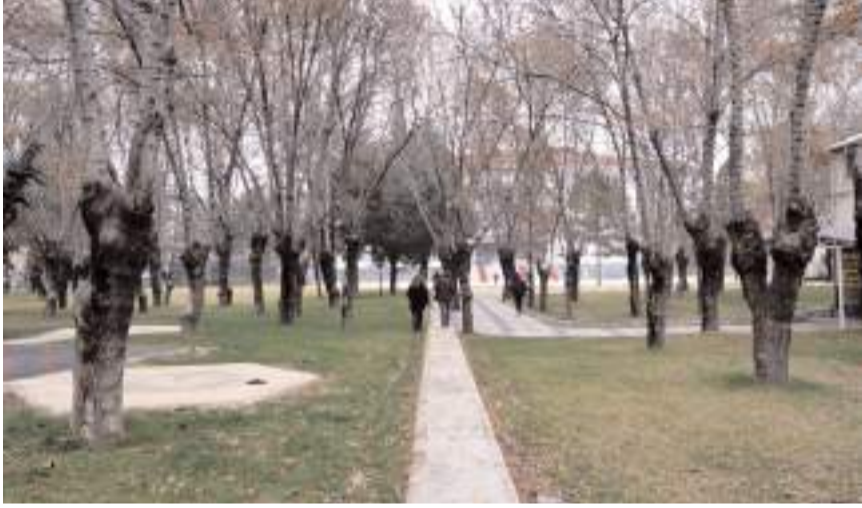
Belediye ekipleri parkta bulunan malzemeleri sökülüp götürmüştü.