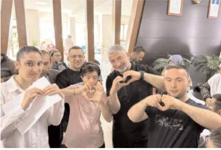
Öğrencilerin oyunlarına Başkan Aşgın da eşlik etti.