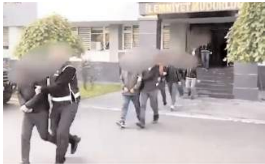
3 haftada yapılan operasyonlarda 2 bin 248 şüpheli yakalandı.

"Uyuşturucu satıcılarına ve uyuşturucuya yönelik son 3 haftada düzenlenen Narkoçelik operasyonlarında; 2 ton 12 kilogram uyuşturucu madde, 890 bin 35 adet uyuşturucu hap ele geçirildi. Zehir taciri ile sokak satıcısı 2 bin 248 şüpheli yakalandı. Cumhurbaşkanlığı Başsavcılıklarımız ile Emniyet Genel