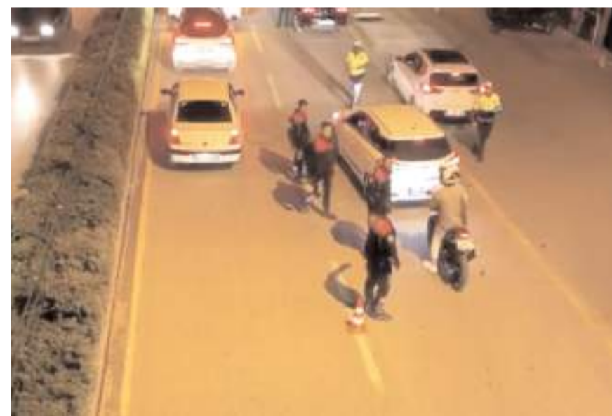
İl merkezi ve ilçelerde 40 ekip ve 84 personelle eş zamanlı şok denetim yapıldı.

Hükümlüler, işlemleri için polis merkezine götürüldü.(AA)