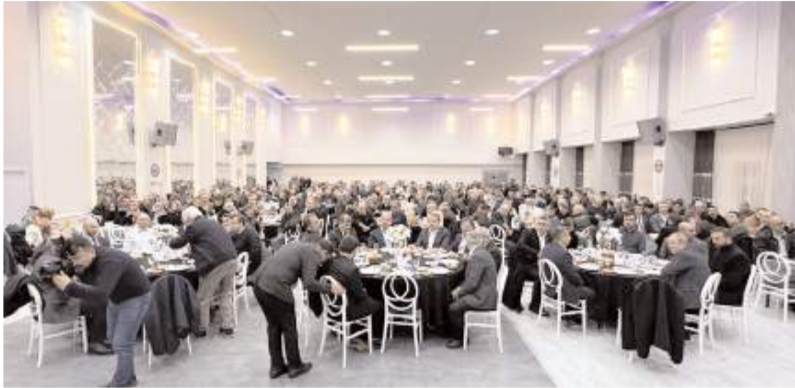
Toplantıya katılım yüksek oldu.