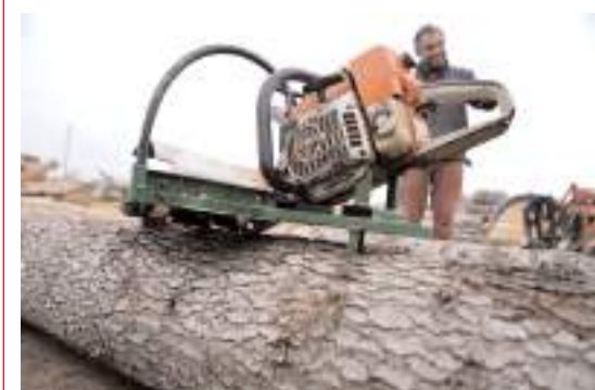
Makine TÜRKPATENT'ten tescil belgesi aldı.