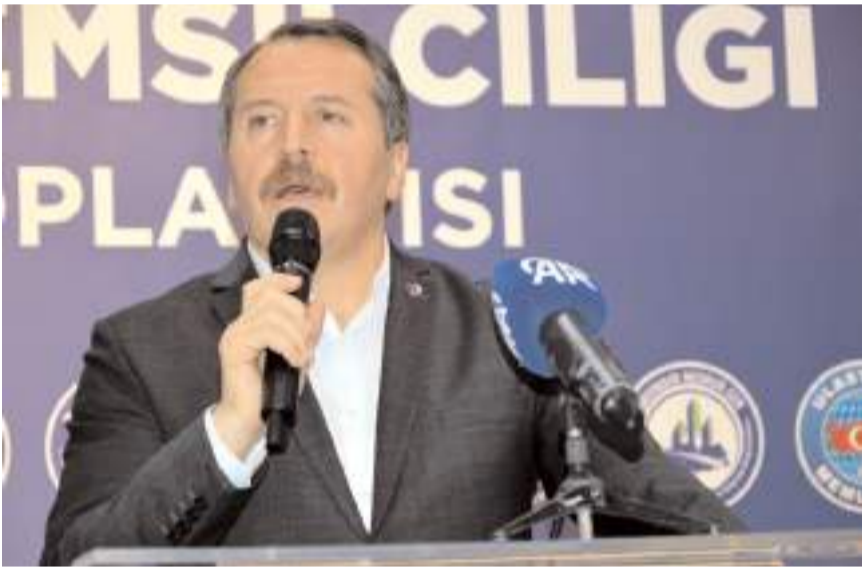
Memur Sen Genel Başkanı Ali Yalçın