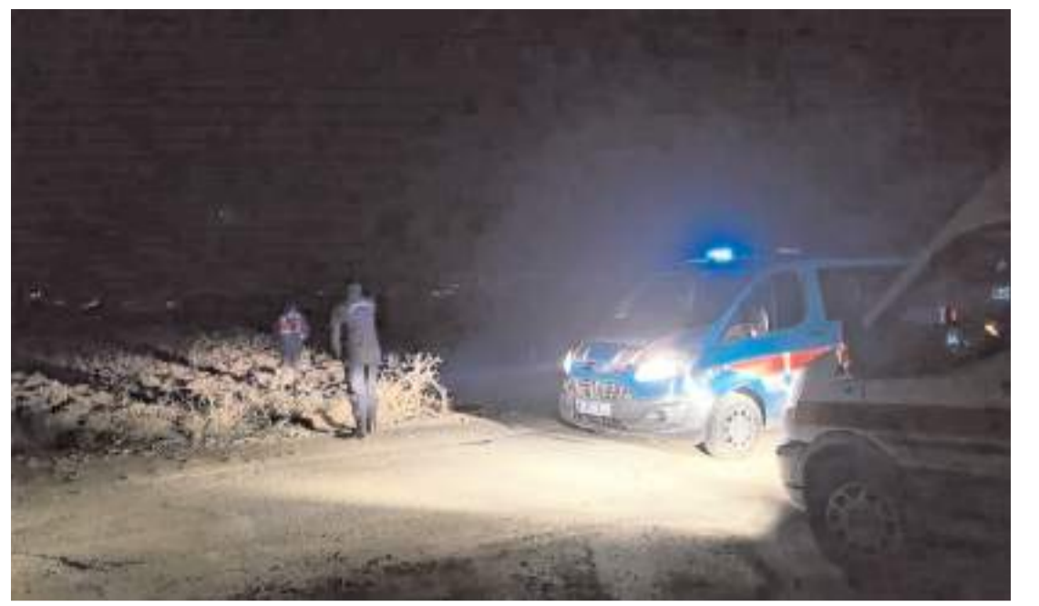
Olay Cemilbey köyü yakınlarında meydana geldi.