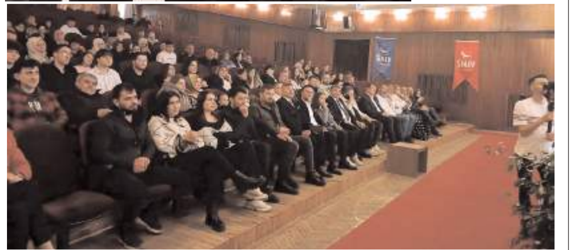
Film 6 Aralık'ta vizyona girecek.

Filmin ise 6 Aralık'ta vizyona gireceği belirtildi.