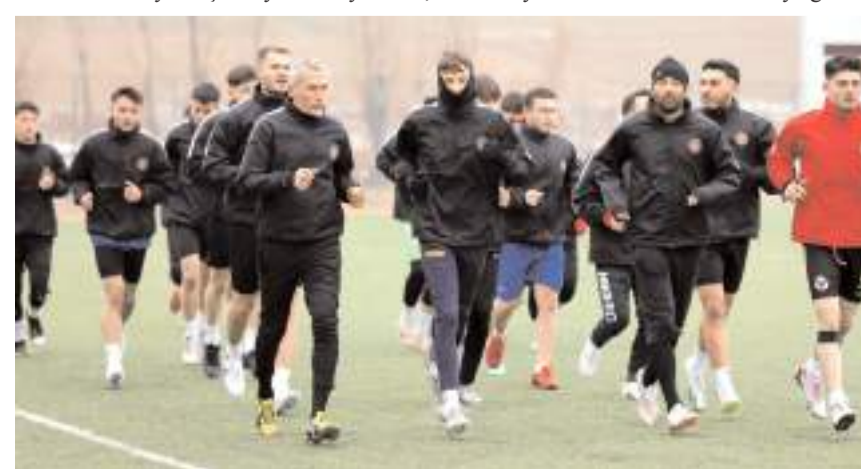
Alaca Belediyespor yeni sezon hazırlıklarına ilçe sahasında yaptığı antrenmanla başladı