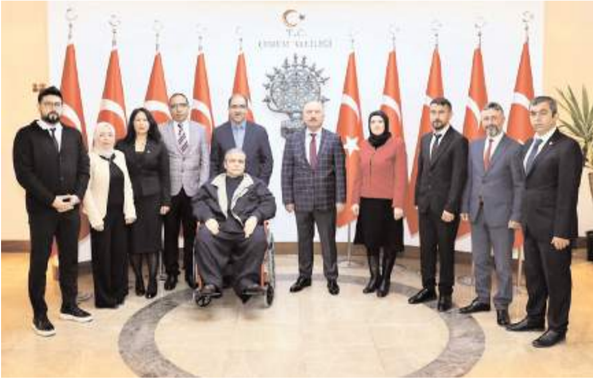
Ziyarete toplu hatıra fotoğrafı çekildi.

Ziyaretten duyduğu memnuniyeti dile getiren Vali Çalgan, 3 Aralık Dünya Engelliler Günü'nün toplumda engellilere yönelik farkındalığın artmasına vesile olması temennisinde bulunarak, tüm özel gereksinimli bireylere sevgi, saygı ve muhabbetlerini ilettili. (Haber Merkezi)