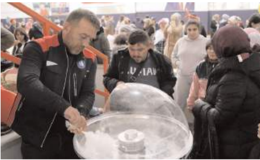
Öğrencilere ikramlarda bulunuldu.