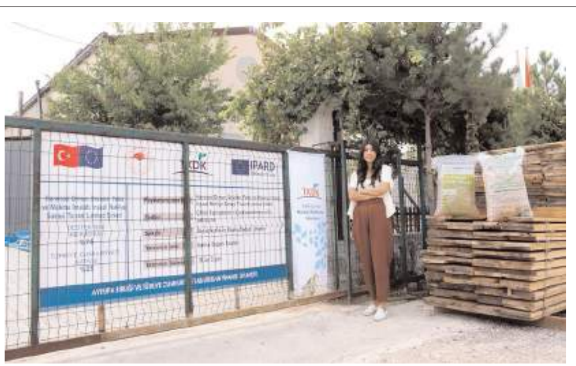
Proje TKDK 3,9 milyon lira destek verdi.