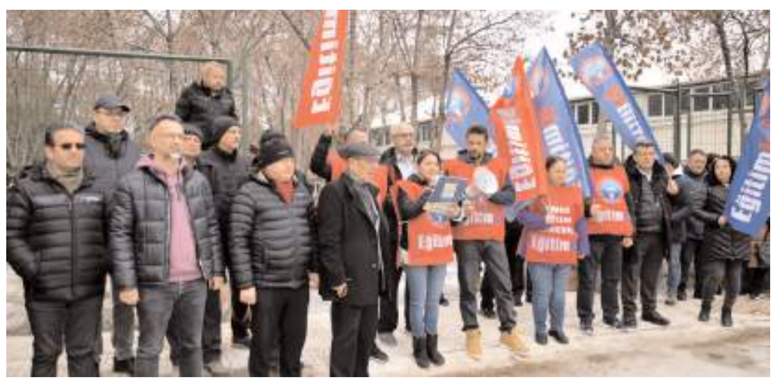
Okul bahçesinde yapılan basın açıklamasına sendika üyeleri de katıldı.