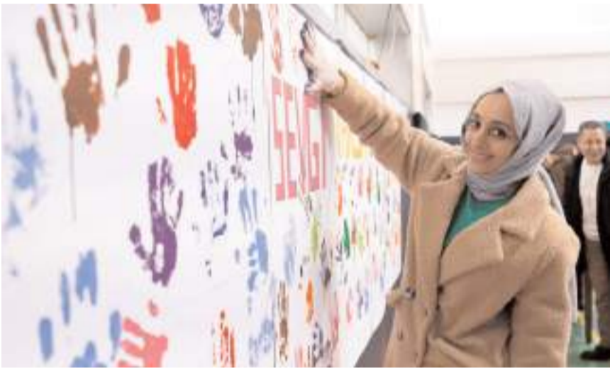
Program renkli görüntülere sahne oldu.