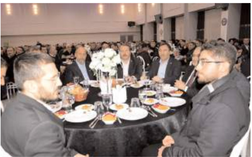
Memur Sen İl Divan Toplantısı Çorum Uygulama Otelinde yapıldı.