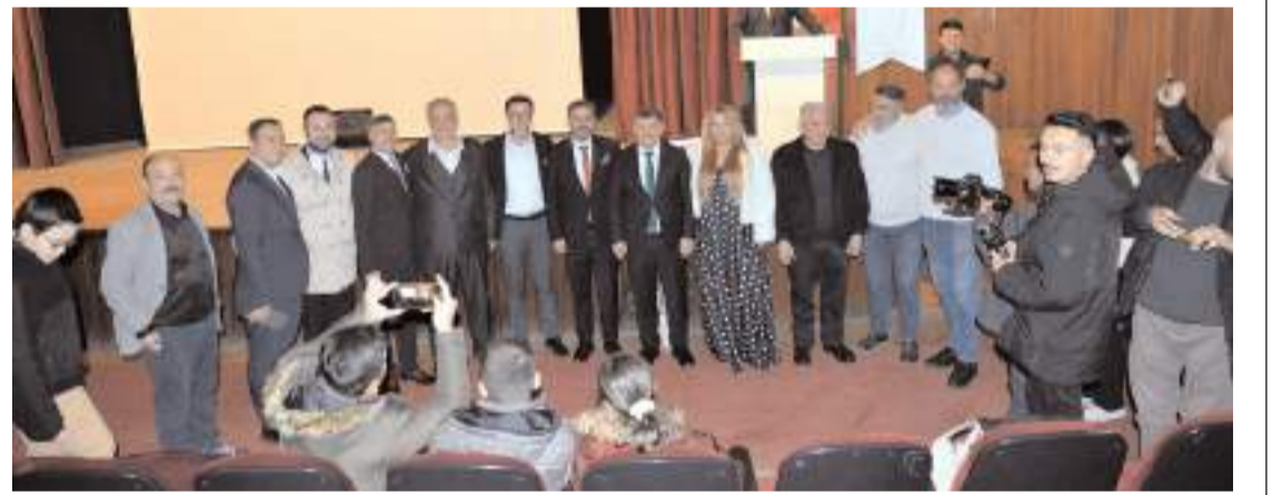
Çam Yarması 2 filminin galası, Devlet Tiyatrosu Salonu'nda yapıldı.

Dört basamaklı hayat kurtarma zincirinin aşamalarının detaylı olarak anlatıldığı eğitimde özellikle kalp krizi, boğulma, yaralanmalar gibi acil durumlarda ilk yardımın hızlı, bilinçli ve doğru yapılmasının, kazazedenin hayatta kalma şansını büyük ölçüde artıracakları vurgulandı.(AA)