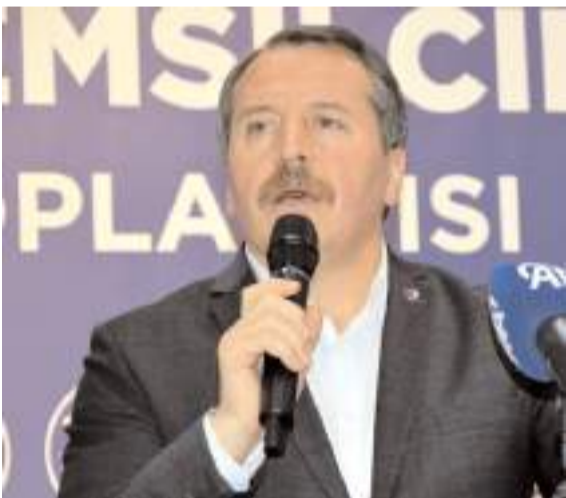
Memur Sen Genel Başkanı Ali Yalçın