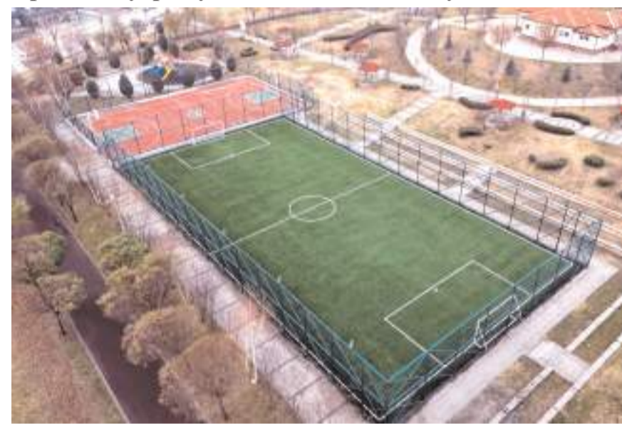
Kale Mahallesi Şehitler Parkı içindeki sentetik saha tadilatı yapılarak yenilendi

Geçtiğimiz aylarda yapımına başlanan Bayat Gediği Semt Sahası'nda çalışmalar tamamlanarak hizmete açıldı. Gençlerin kötü alışkanlıklardan uzak kalması adına mahallelerde yapılan semt sahalarının önemine de-