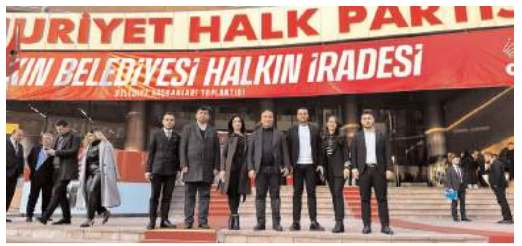
Kurultaya Çorum'dan da katılım oldu.