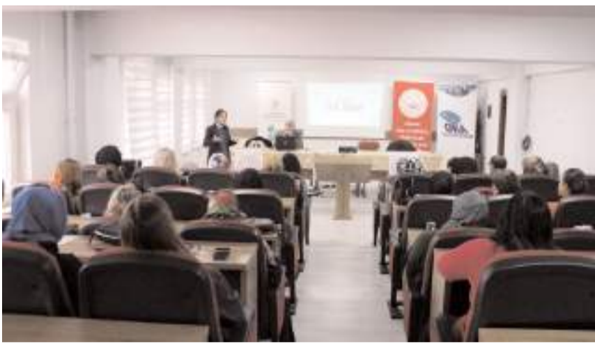
Eğitime 34 kadın katıldı.

çin Finansal Okuryazarlık, Bütçe Yönetimi, Harca Disiplini ve Birikim ile Yatırım kavramları ele alındı.