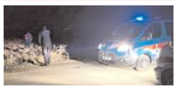
Olay Cemilbey köyü yakınlarında meydana geldi.

Çorum'da bir iş yerine silahla ateş ettikten sonra hafif ticari araçla kaçmaya çalışan 3 zanlı, polis kovalamacasıyla gözaltına alındı. * HABERİ 5'DE