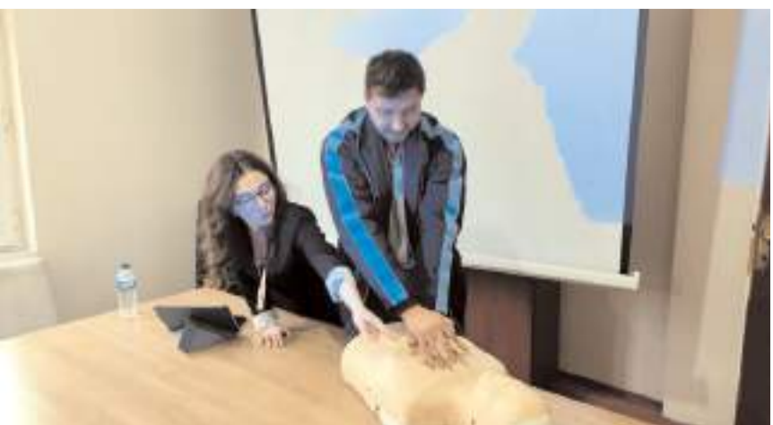
Eğitimde kalp krizi, boğulma, yaralanmalar gibi acil durumlarda ilk yardımın hızlı, bilinçli ve doğru nasıl yapılacağı anlatıldı.

Oğuzlar Belediyesi personeline ilk yardım farkındalık eğitimi verildi.