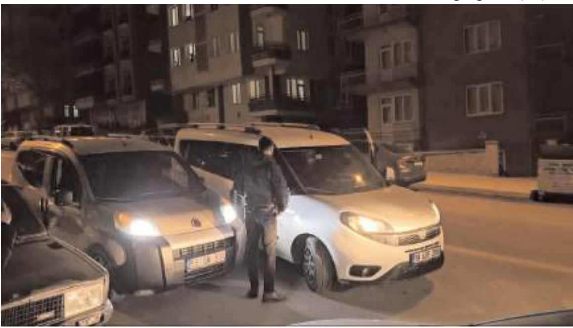
Kaçan aracı polis ekipleri yakaladı.