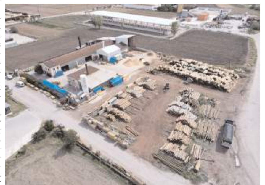
Tesis Karaca Köyde faaliyete başladı.

yapıyoruz. Müşteri kitlemiz çoğaldıkça iki vardiya ile çalıştığımızda üretim kapasitemiz yıllık 12 bin tona çıkacak.