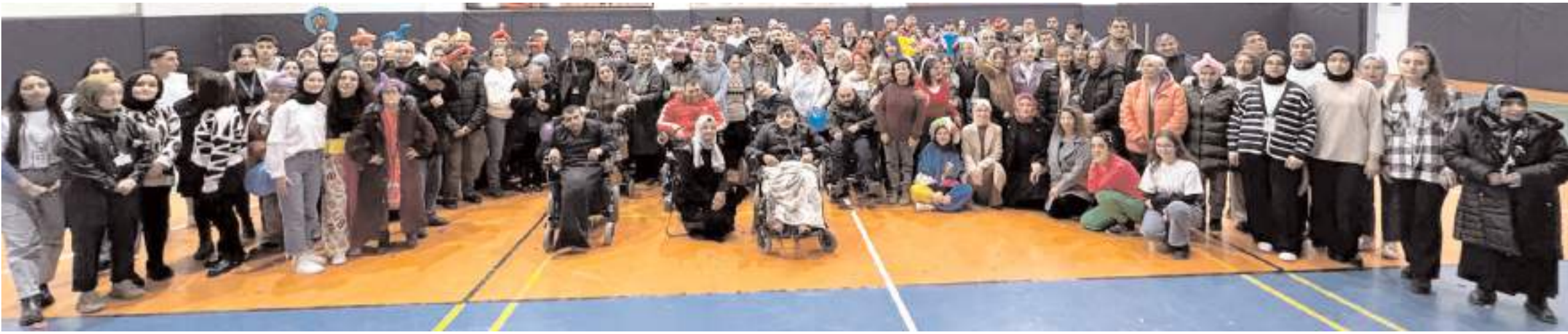
Çorum Belediyesi Engelli Eğitim Merkezi'nde 3 Aralık Dünya Engelliler Günü nedeniyle kutlama programı yapıldı.