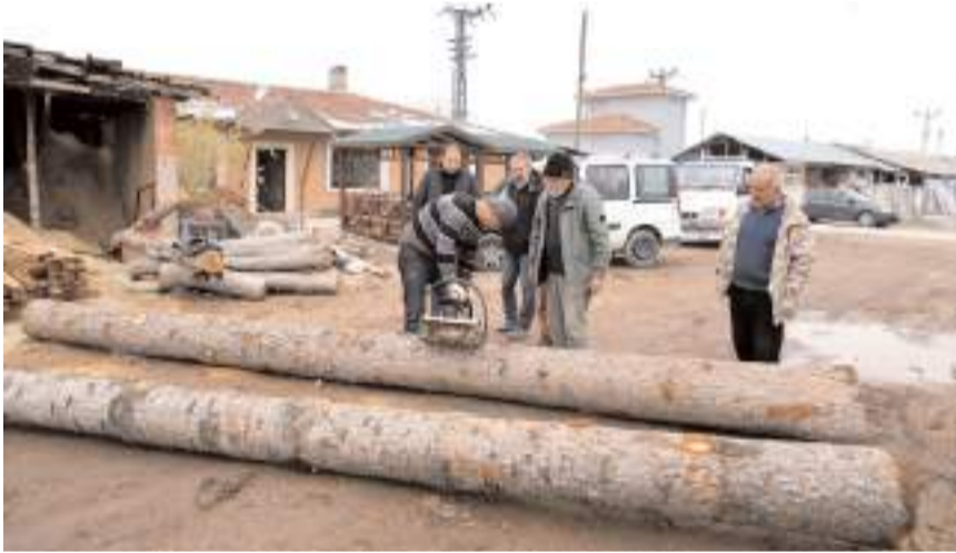
Çam soyma makinesi Çorum'da tarım sektörüne yönelik üretim yapan fabrikada seri üretime hazırlanıyor.