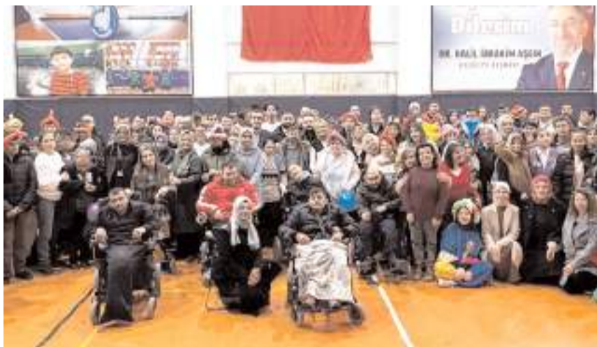
Çorum Belediyesi Engelli Eğitim Merkezi'nde 3 Aralık Dünya Engelliler Günü nedeniyle kutlama programı yapıldı.

Çorum Belediyesi Engelli Eğitim Merkezi'nde eğitim gören engelliler 3 Aralık Dünya Engelliler Günü'nü doyasıyla kutladı. Etkinlik alanında kurulan özel parkurlar, yüz boyama köşeleri, Nasrettin Hoca kostümü ve renkli şişe balonlarla çocuklar unutulmaz bir gün geçirdi. * HABERİ 4'DE