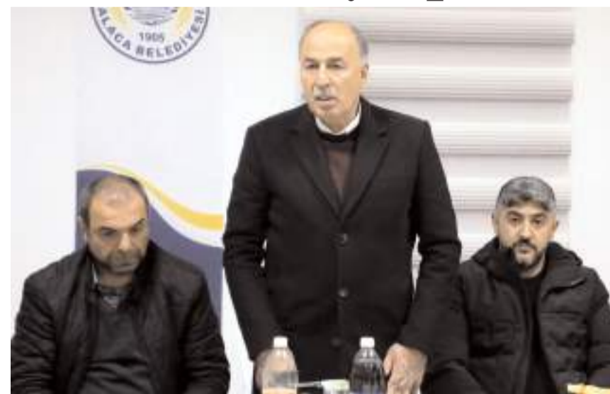
Alaca Belediye Başkanı yemekte yönetim, teknik heyet ve futbolcular ile bir araya geldi