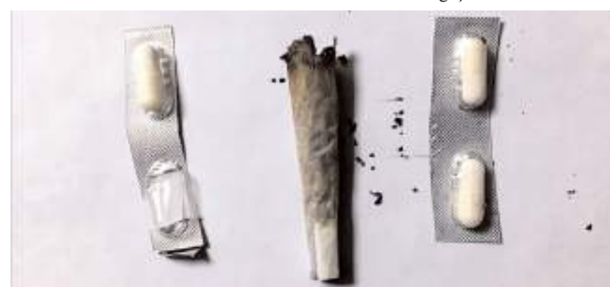
Bir miktar yasaklı madde ele geçirildi.