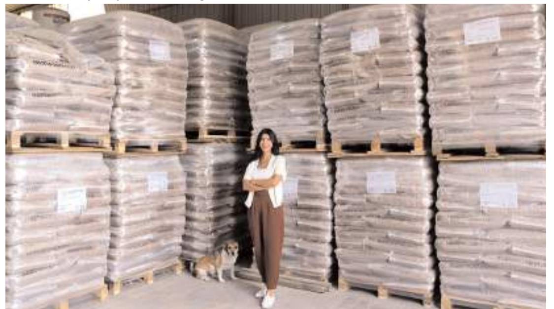
Tesisde yılda 6 bin ton pelet üretimi yapılıyor.

Kömüre göre neredeyse tamamı yanan, geride imha edilebilecek oranda kül bırakan, kalitesi yüksek, karbonmonoksit (CO) salınımı kabul edilebilir değerin altında, depolanması kolay, çevre dostu olan değerli bir ürünü yeniden ekonomiye kazandırıyoruz. Çevre dostu bu yatırımımızla, 2017 yılında devletimizin başlattığı ve bugün dünya gündeminde yer bulan "Sıfır Atık" projesine de katkı sağladığımızı düşünüyoruz. 7,2 milyon yatırım tutarlı projeme 3,9 milyon lira destek sağlayan devlete ve bu yatırımın hayat bulmasında katkı sağlayan herkese çok teşekkür ediyorum." (Haber Merkezi)