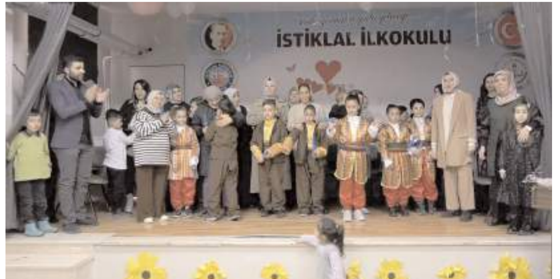
Programın sonunda hatıra fotoğrafı çekildi.