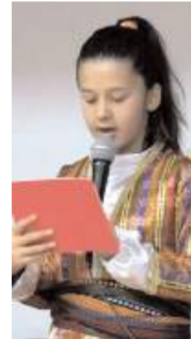
Öğrenciler şiirler seslendirdiler.