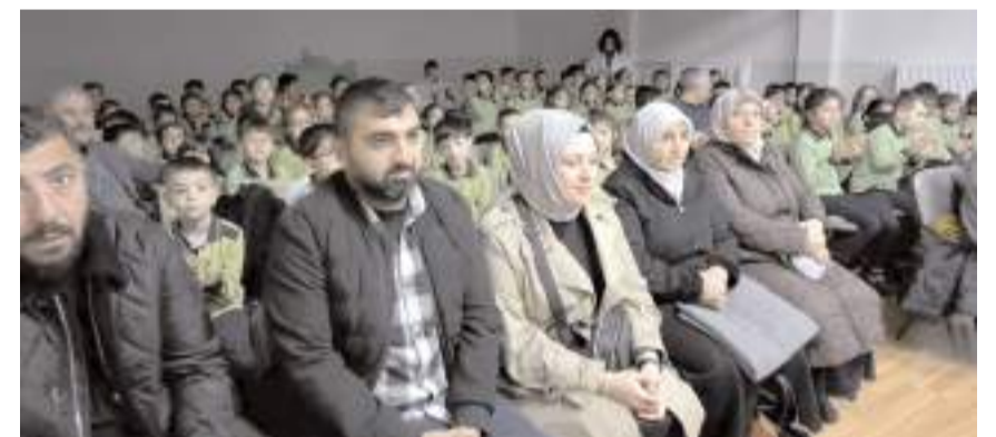
Etkinliği aileler ve öğrenciler izledi.