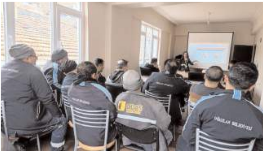
Eğitime belediye personeli katıldı.