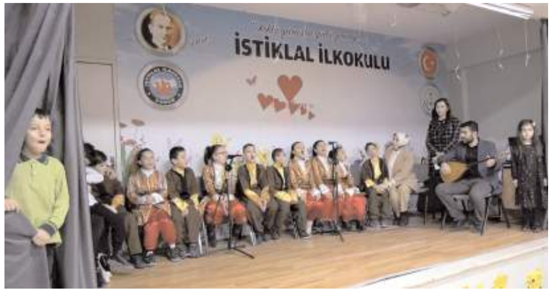
Öğrenciler türküler söylediler.

Hepsiburada'nın verilerine göre, kasım ayında temel tüketim ürünlerinden gıda ve züccaciye ürünlerine kadar birçok kategoride rekor satışlar gerçekleştirildi.(AA)